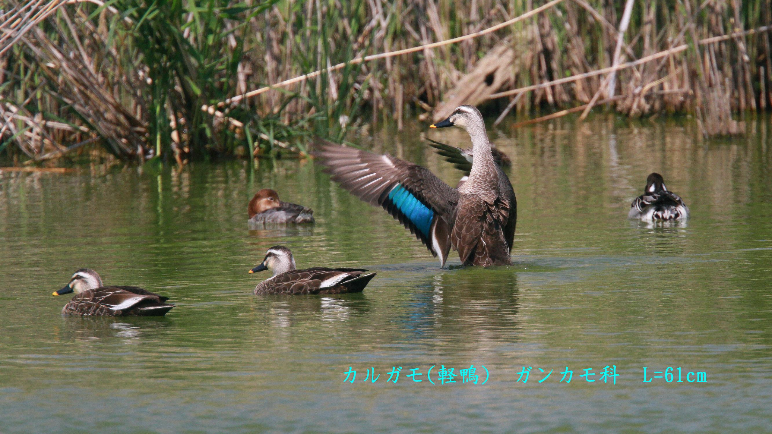
カルガモ(軽鴨) ガンカモ科 L=61cm