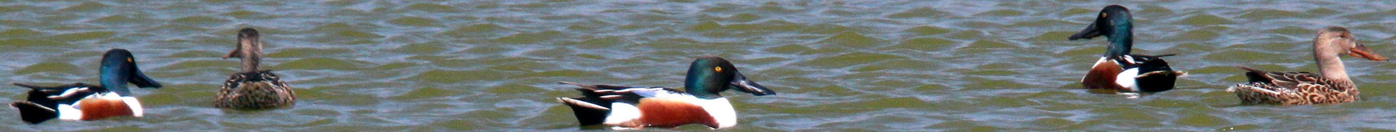
ハシビロガモ（嘴広鴨） ガンカモ科 L=50cm