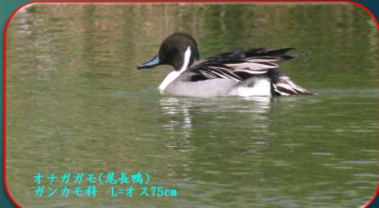
オナガガモ(尾長鴨) ガンカモ科 L=オス75cm