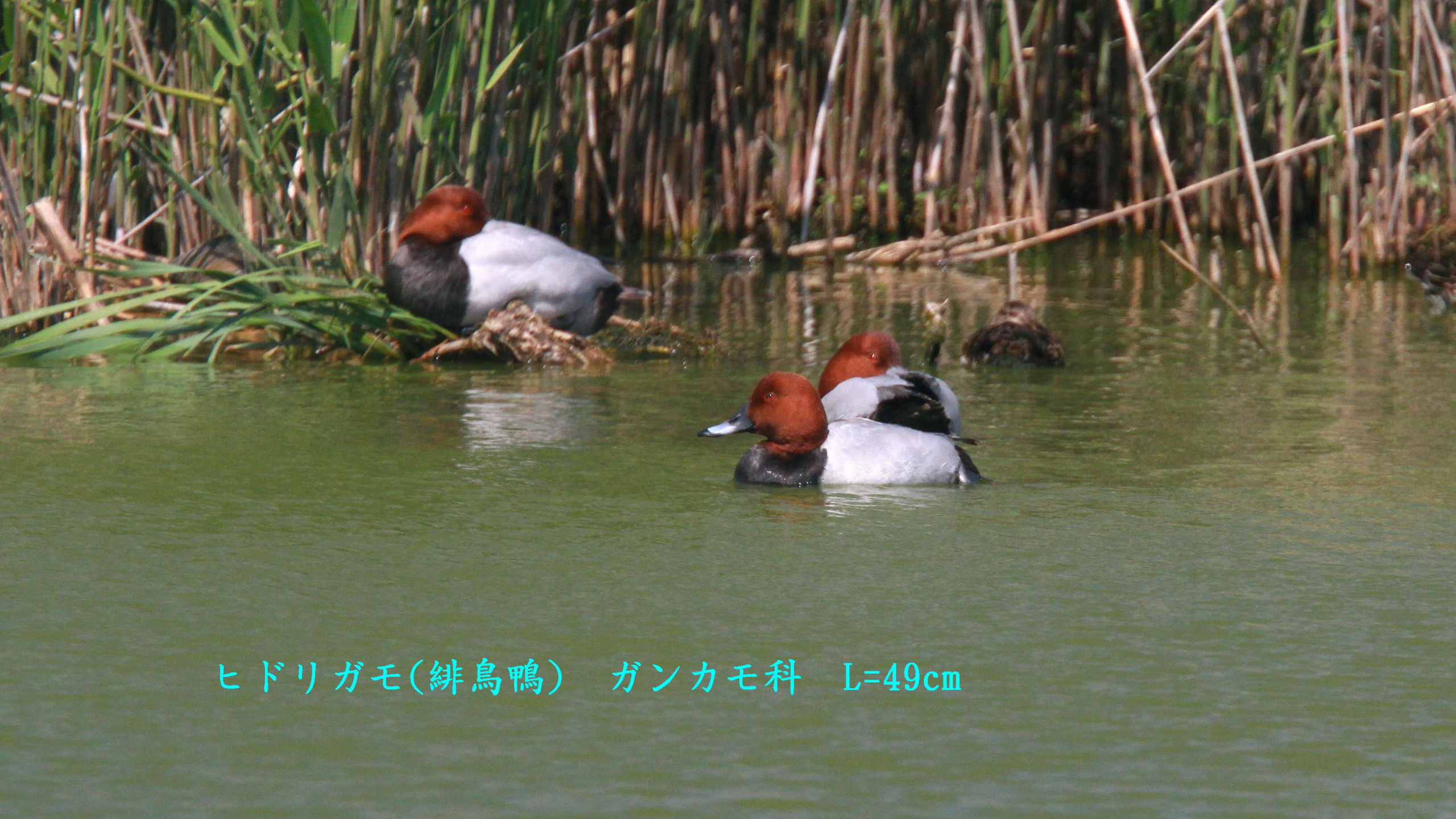
ヒドリガモ(緋鳥鴨) ガンカモ科 L=49cm