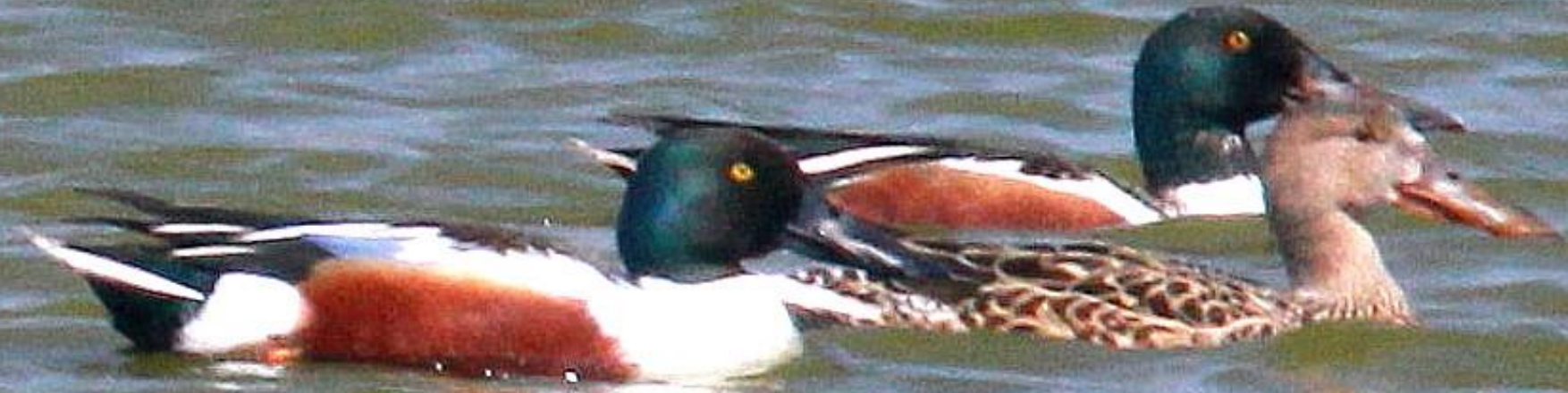
ハシビロガモ (嘴広鴨) ガンカモ科 L=50cm