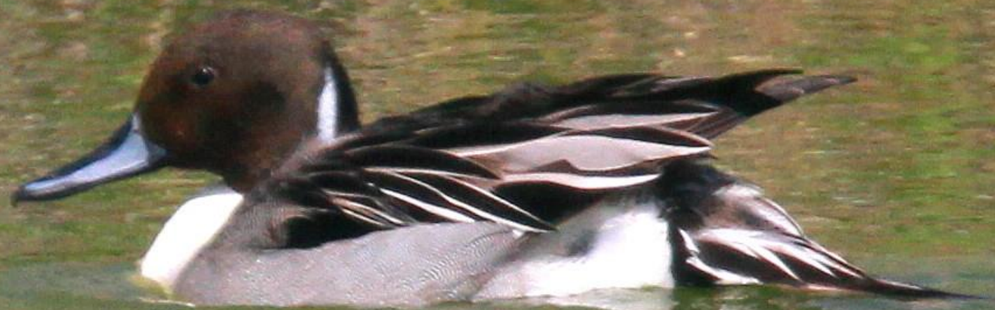
オナガガモ(尾長鴨) ガンカモ科 L=オス75cm