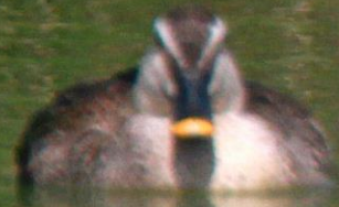
カルガモ(軽鴨) ガンカモ科 L=61cm