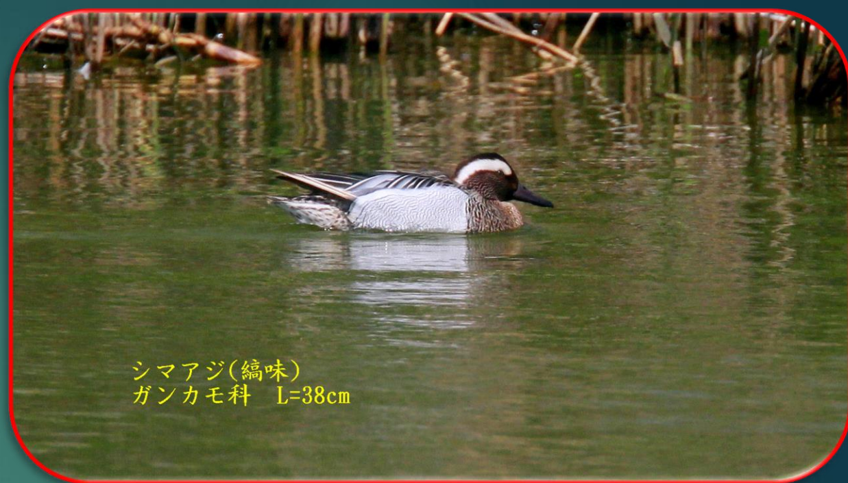
シマアジ(縞味) ガンカモ科 L=38cm