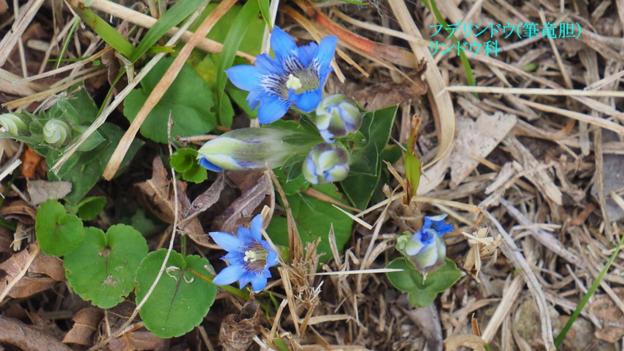
フデリンドウ(筆竜胆) リンドウ科