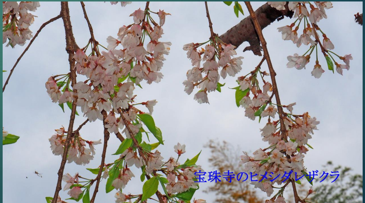
宝珠寺のヒメシダレザクラ