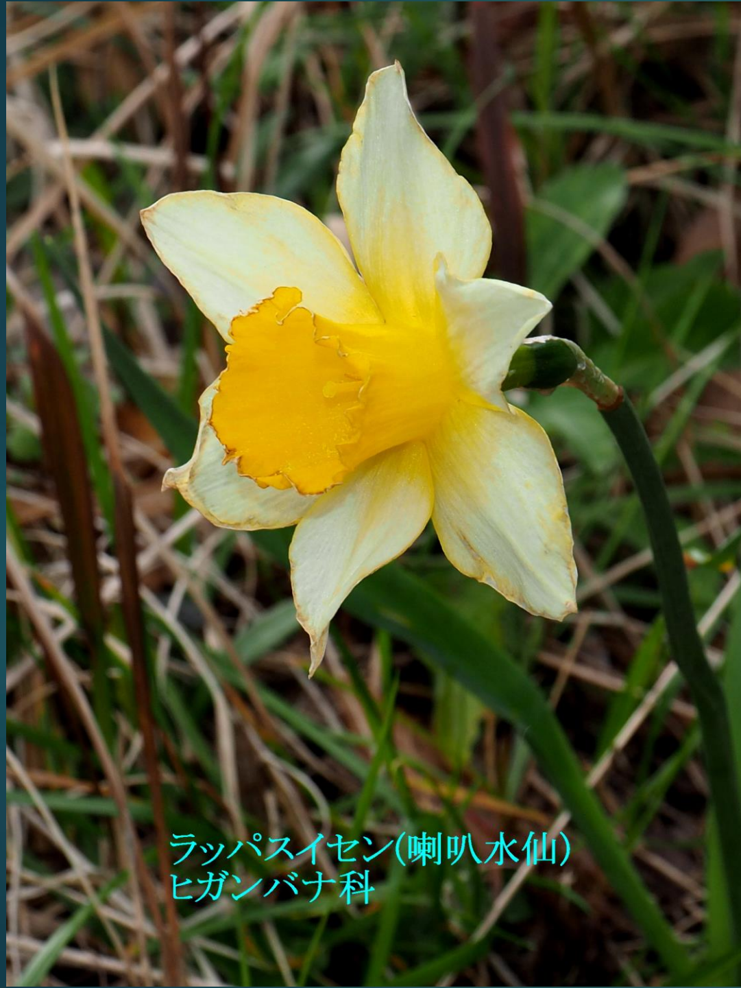
ラッパスイセン(喇叭水仙) ヒガンバナ科