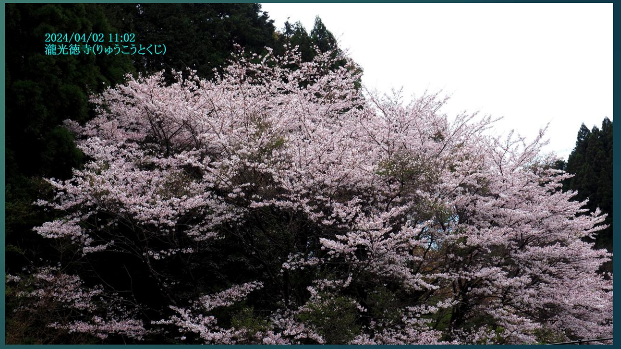
2024/04/02 11:02 瀧光徳寺(りゅうこうとくじ)