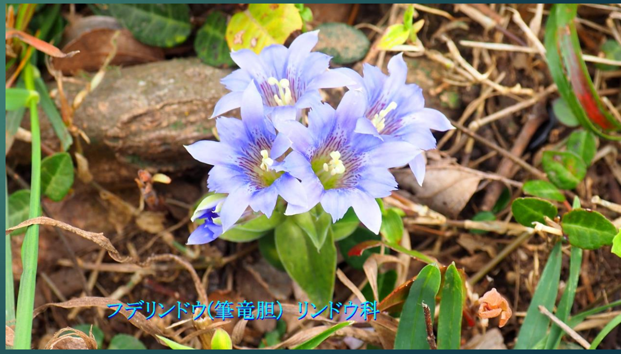
フデリンドウ(筆竜胆) リンドウ科