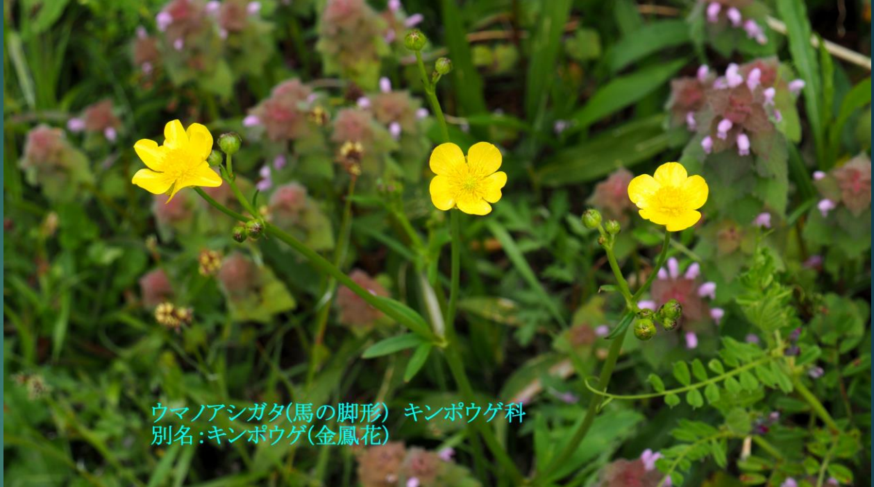
ウマノアシガタ(馬の脚形) キンポウゲ科 別名:キンポウゲ(金鳳花)