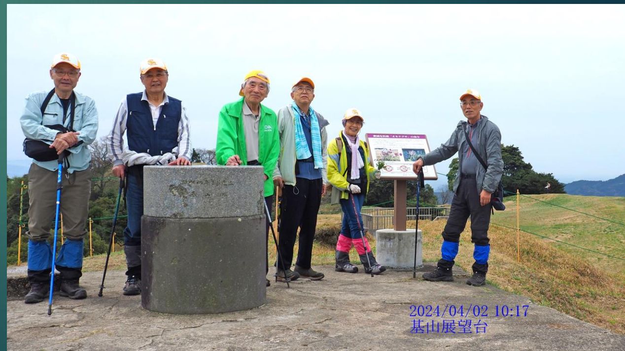
2024/04/02 10:17 基山展望台