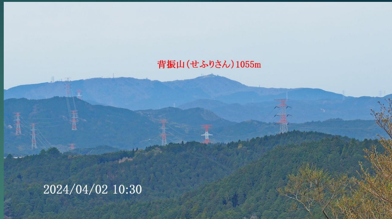
背振山(せぶりさん)1055m