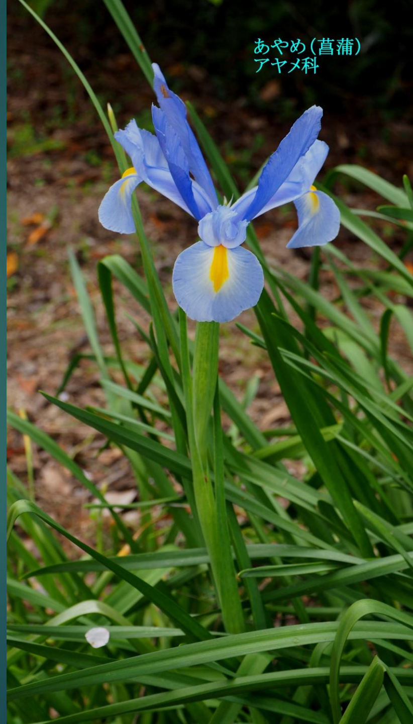
あやめ(菖蒲) アヤメ科