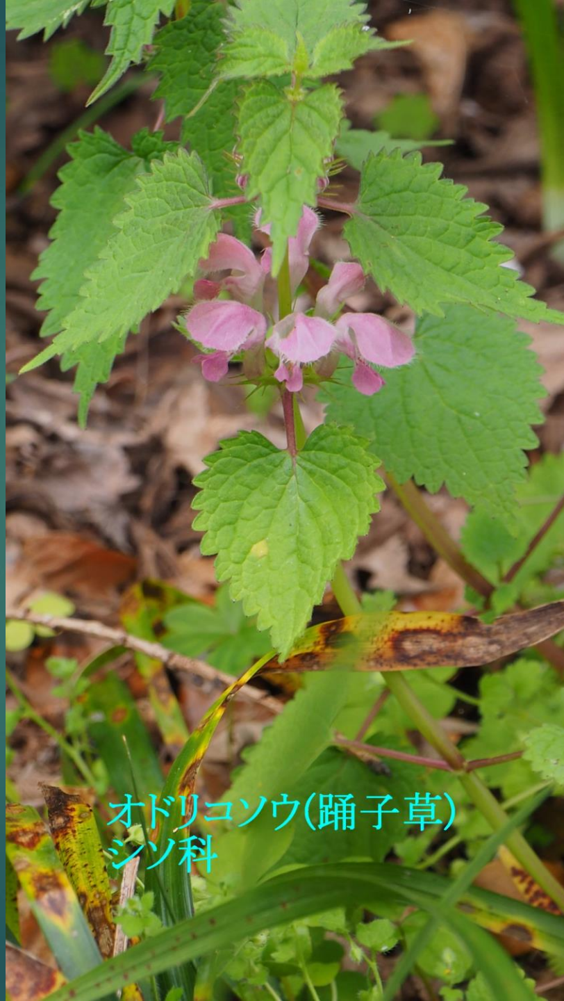
オドリコソウ(踊子草) シソ科