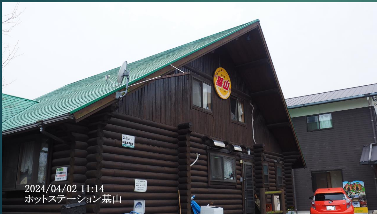
2024/04/02 11:14 ホットステーション基山