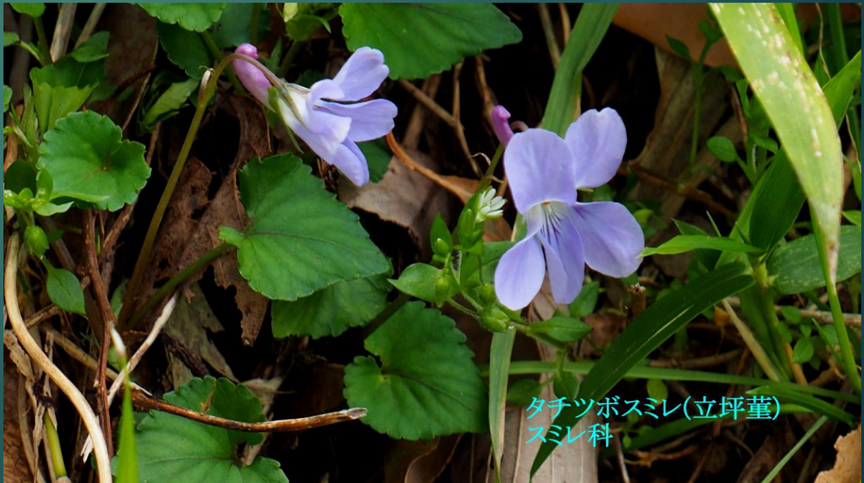
タチツボスミレ(立坪菫) スミレ科