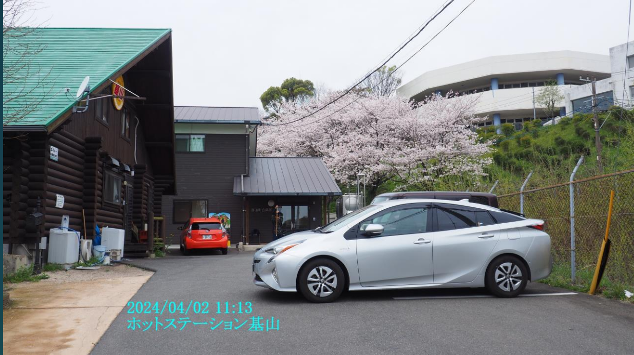
2024/04/02 11:13 ホットステーション基山