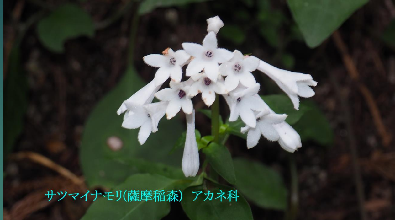
サツマイナモリ(薩摩稲森) アカネ科