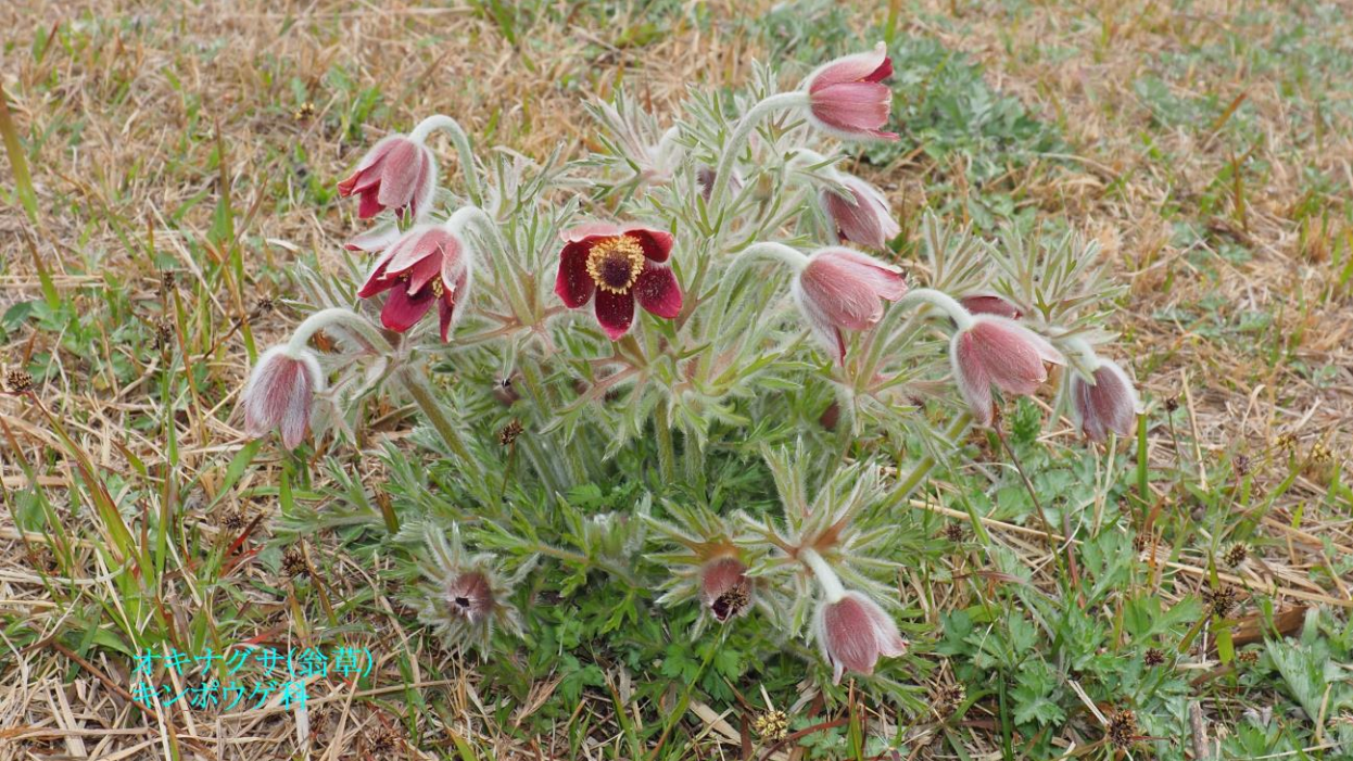
オキナグサ(翁草) キンポウゲ科