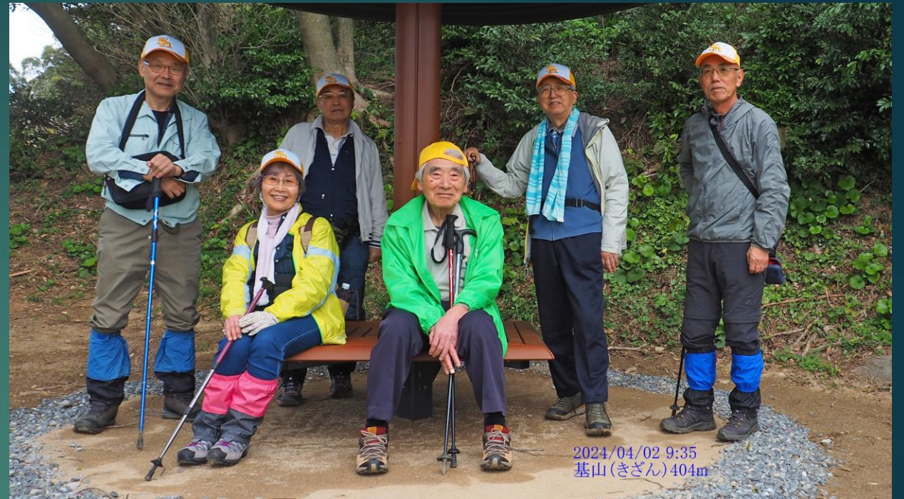
2024/04/02 9:35 基山(きざん) 404m