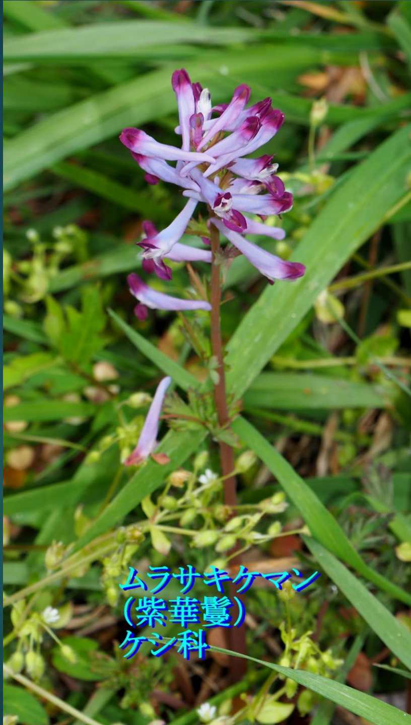
ムラサキケマン (紫華鬘) ケシ科