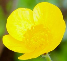
ウマノアシガタ(馬の脚形) キンポウゲ科 別名:キンポウゲ(金鳳花)