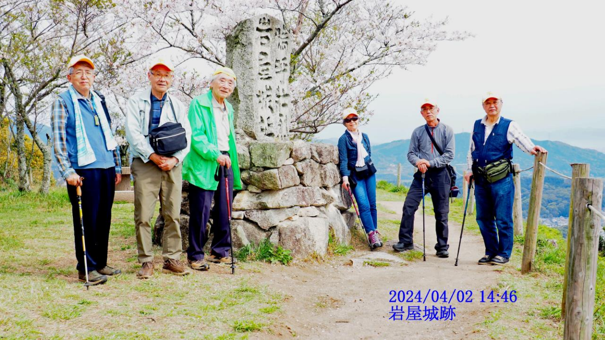
2024/04/02 14:46 岩屋城跡