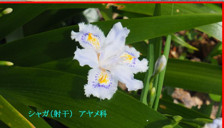
シャガ(射干) アヤメ科