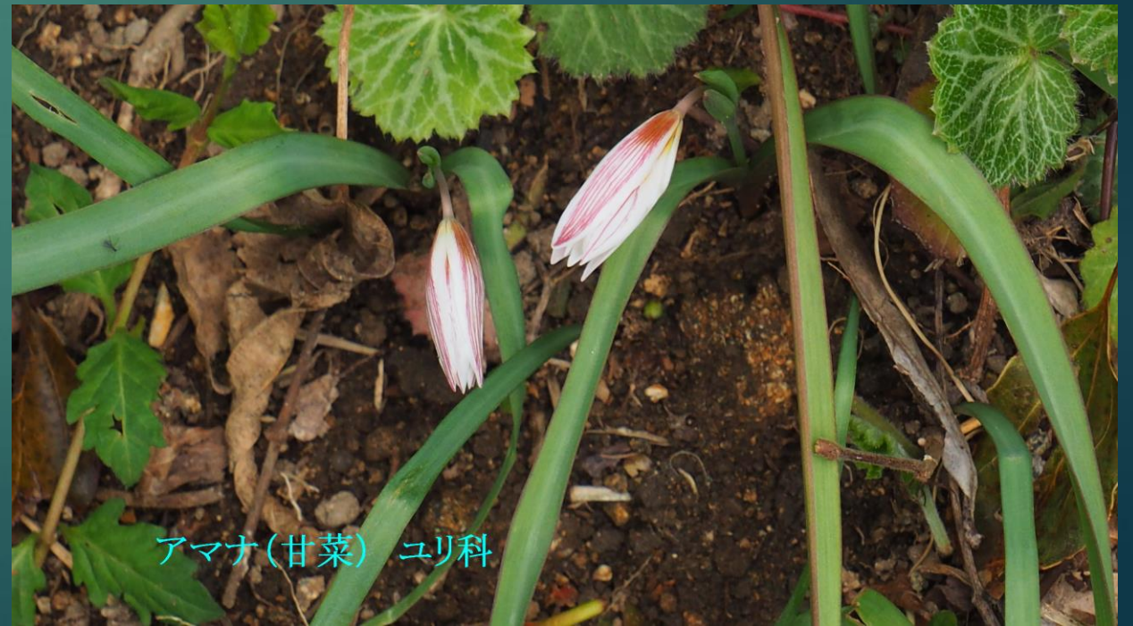
アマナ(甘菜) ユリ科