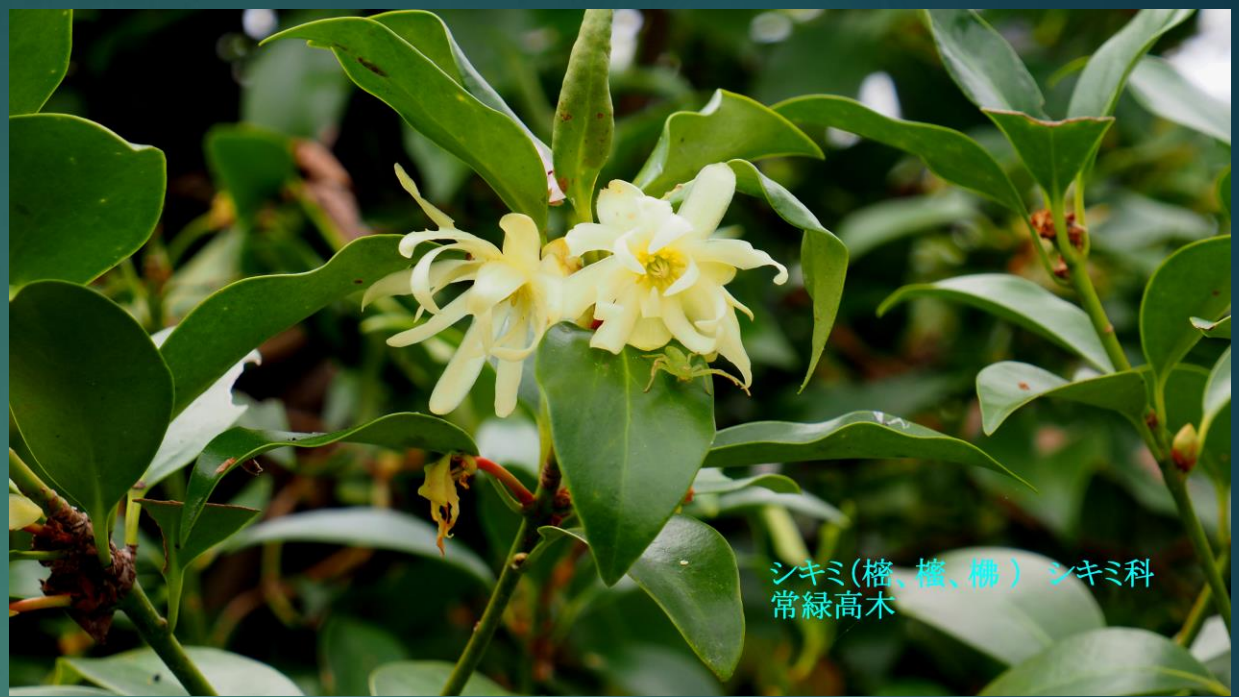
シキミ(檜、檜、榊) シキミ科 常緑高木