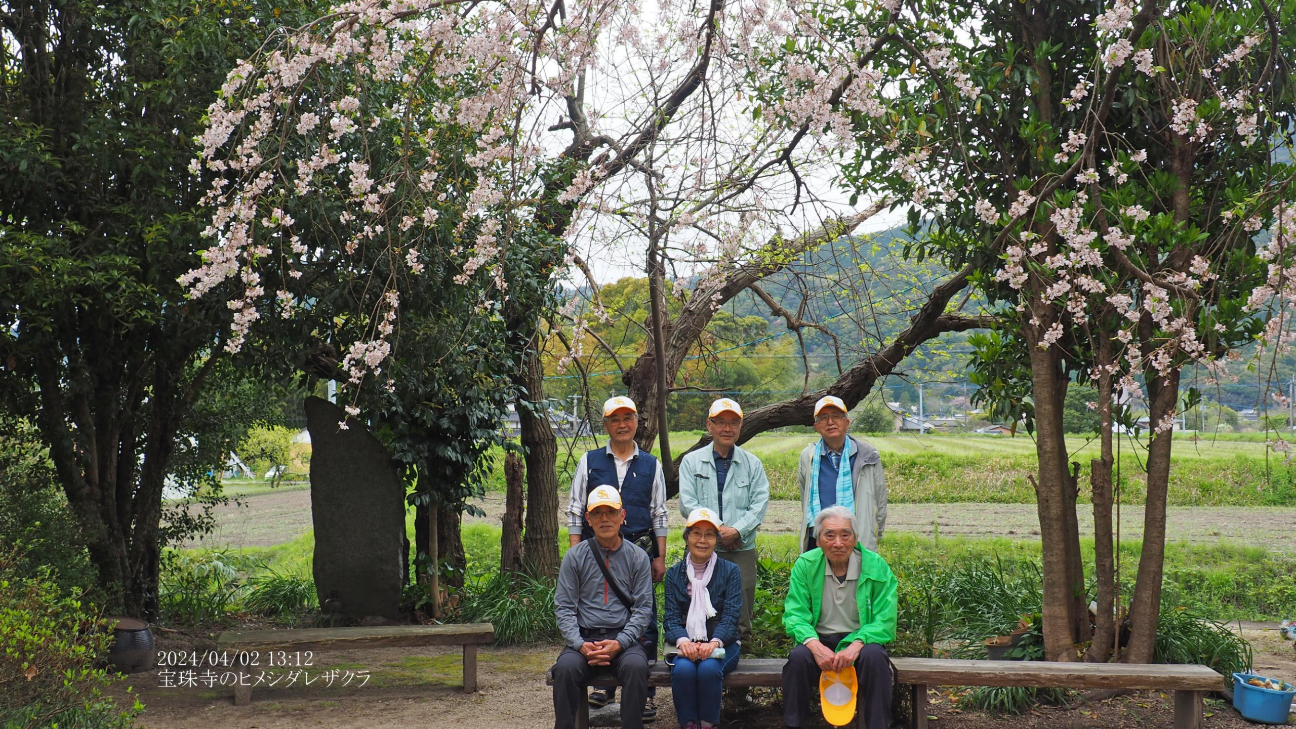
2024/04/02 13:12 宝珠寺のヒメシダレザクラ