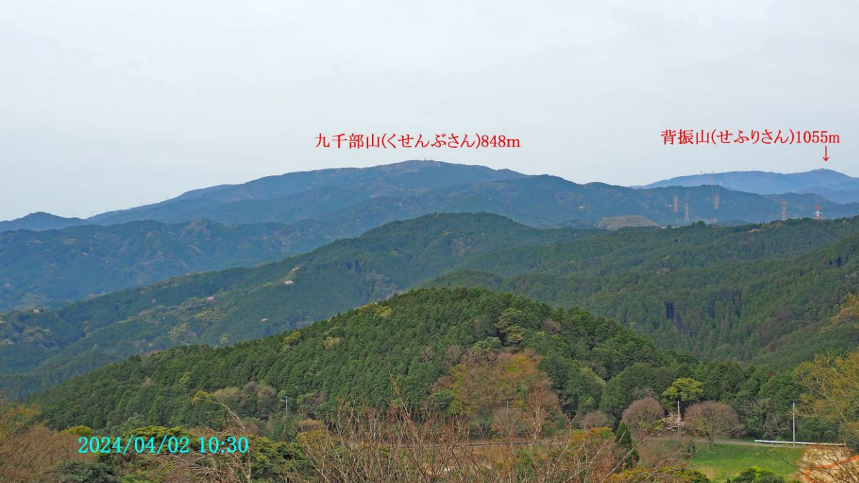
九千部山(くせんぶさん)848m