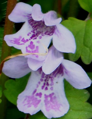
カキドオシ (垣通し) シソ科