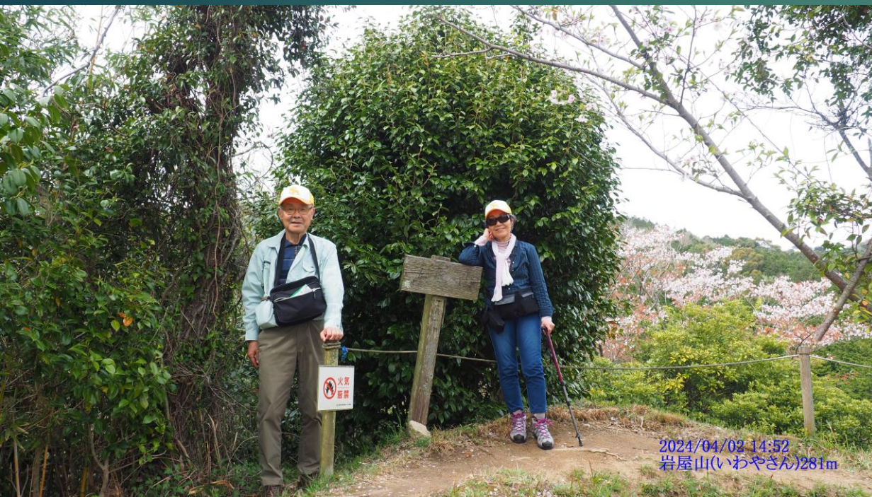
2024/04/02 14:52 岩屋山(いわやさん)281m