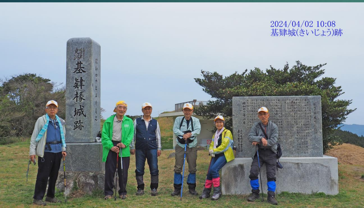
2024/04/02 10:08 基肆城(きいじょう)跡