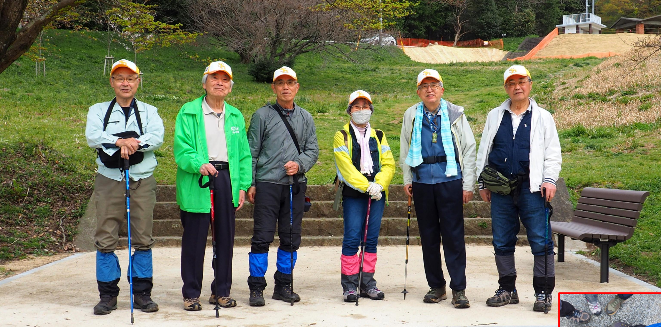
2024/04/02 9:09 基山草スキー場登山口