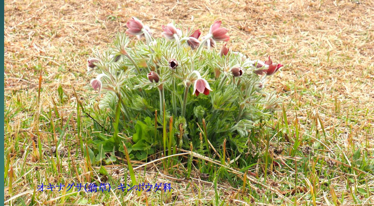
オキナグサ(翁草) キンポウゲ科