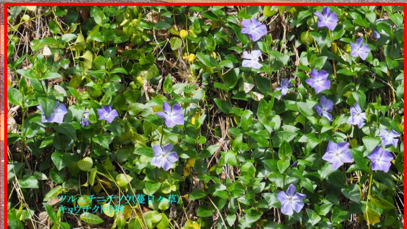
ツルネチニチソウ(蔓日々草) キョウチクトウ科