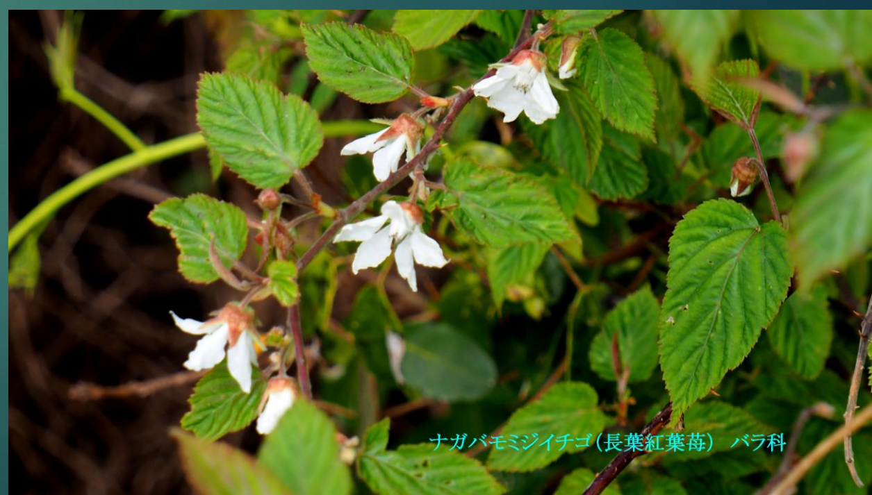
ナガバモミジイチゴ(長葉紅葉莓)バラ科