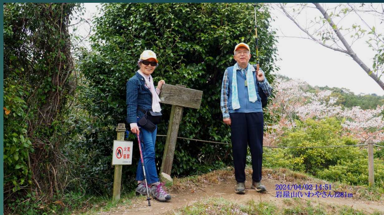
2024/04/02 14:51 岩屋山(いわやさん)281m