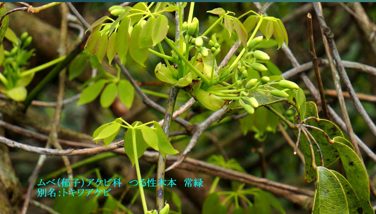
ムベ(郁子)アケビ科 つる性木本 常緑 別名:トキワアケビ