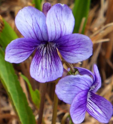
スミレ(堇) スミレ科