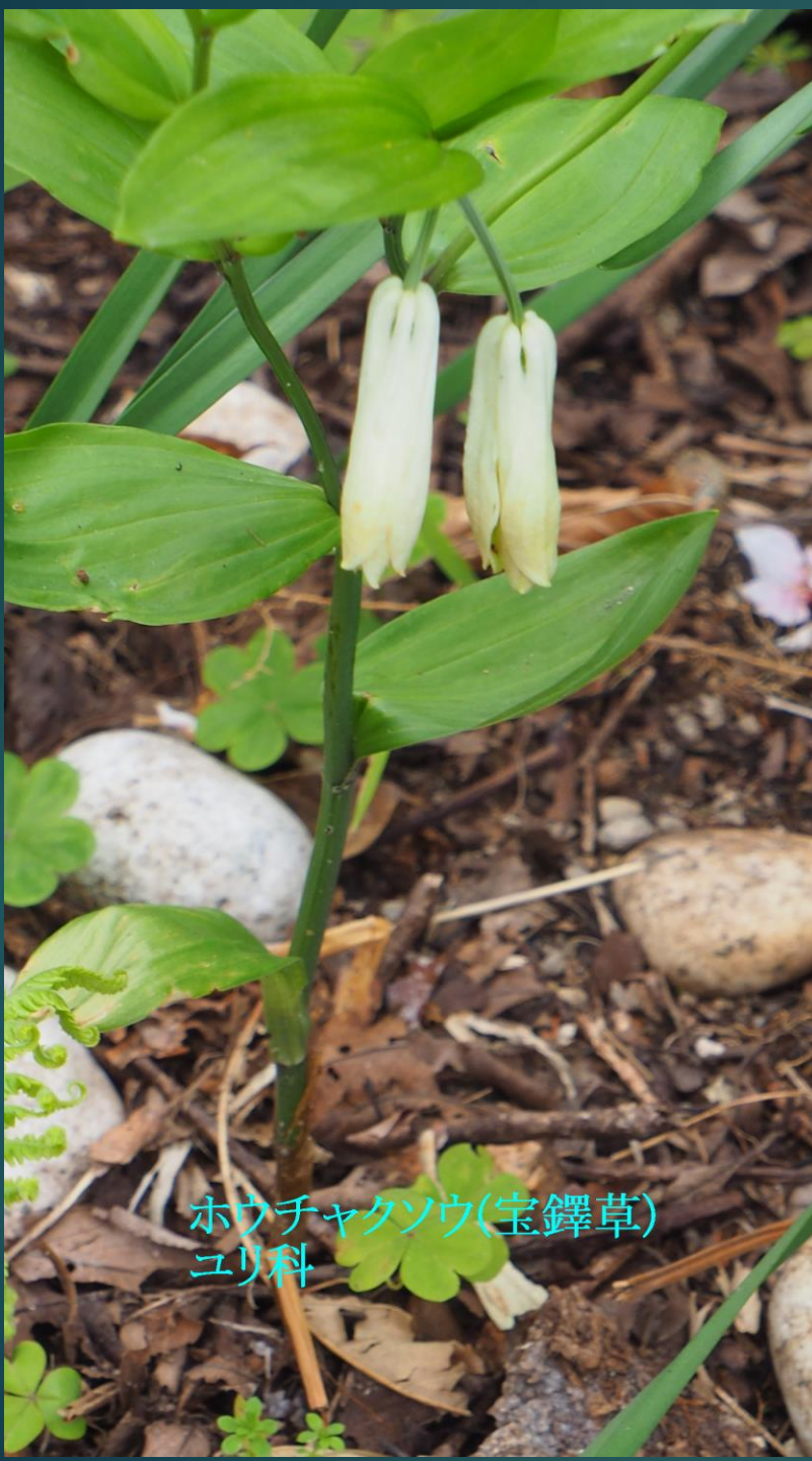
ホウチャクソウ(宝鐸草) ユリ科