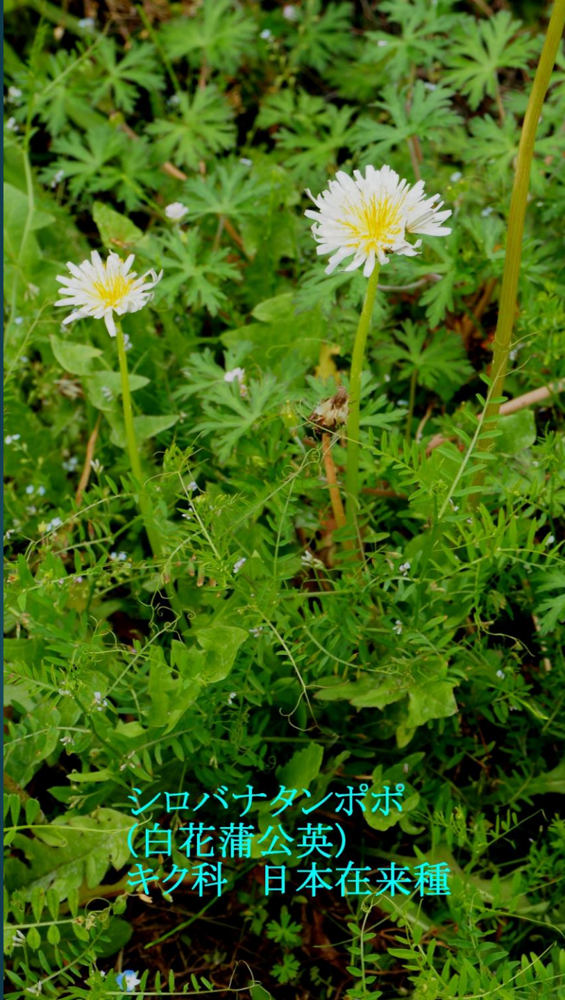
シロバナタンポポ (白花蒲公英) キク科 日本在来種