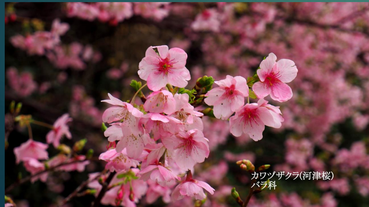
カワヅザクラ(河津桜) バラ科