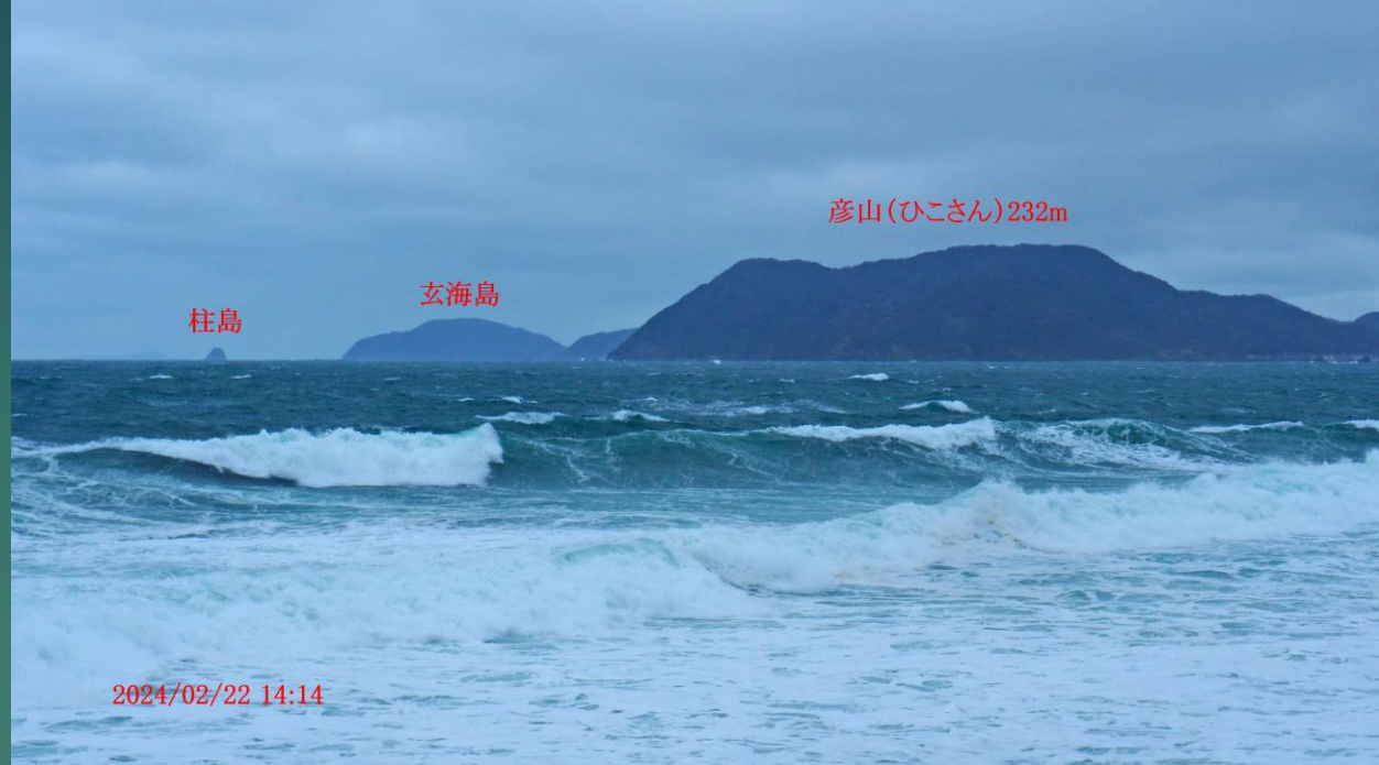
柱島 玄海島 彦山(ひこさん)232m