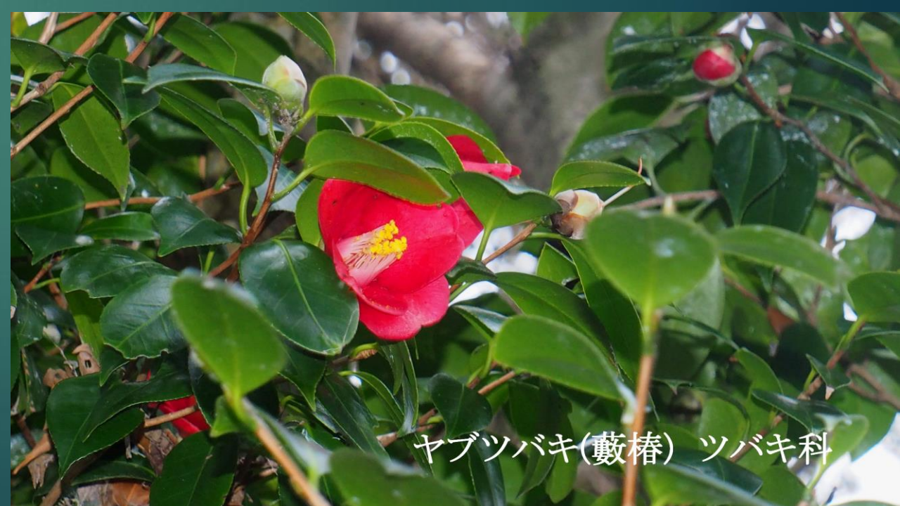
ヤブツバキ(藪椿) ツバキ科