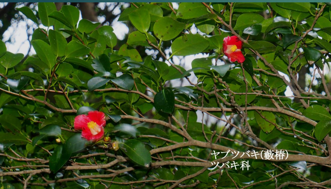
ヤブツバキ(藪椿) ツバキ科