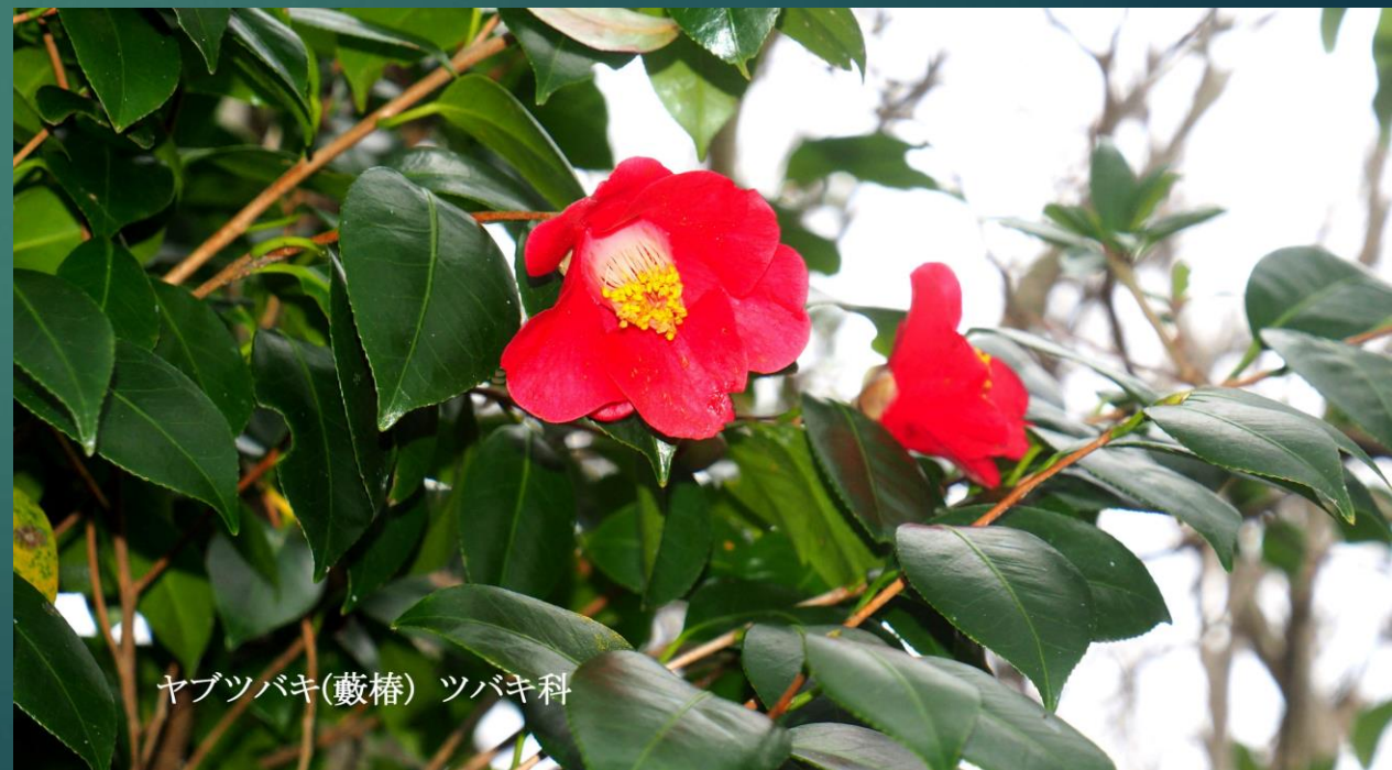
ヤブツバキ(藪椿) ツバキ科