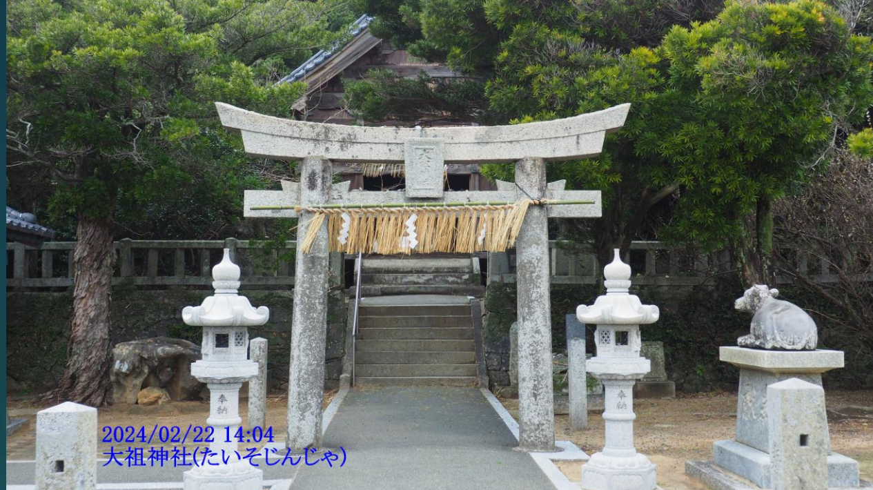
2024/02/22 14:04 大祖神社(たいそじんじゃ)