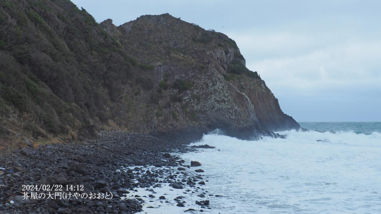
2024/02/22 14:12 芥屋の大門(けやのおおと)