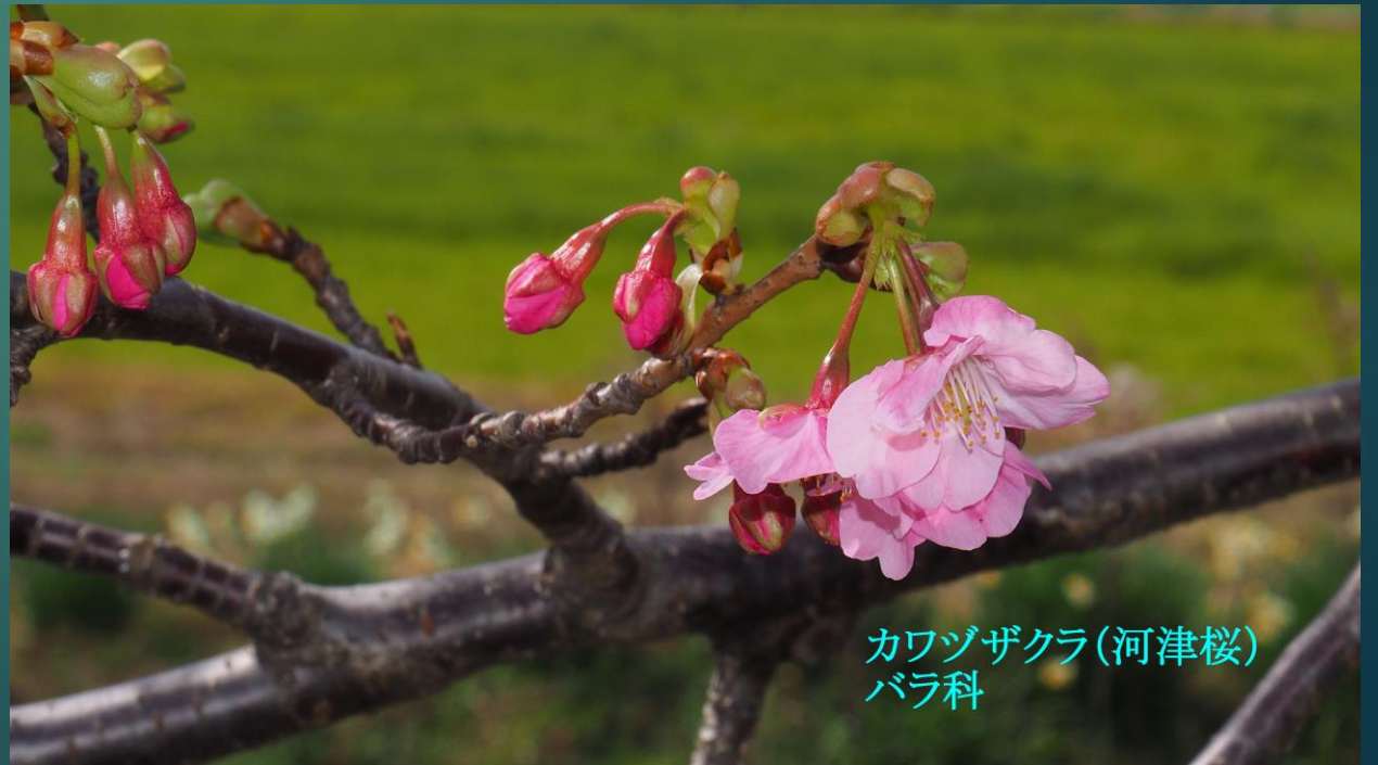
カワヅザクラ(河津桜) バラ科