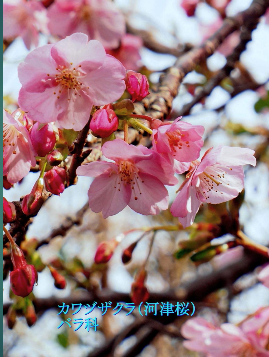
カワヅザクラ(河津桜) バラ科