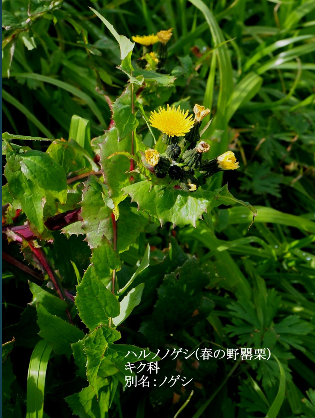
ハルノノゲシ(春の野罌粟) キク科 別名:ノゲシ