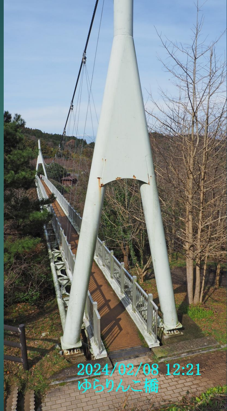
2024/02/08 12:21 ゆらりんこ橋