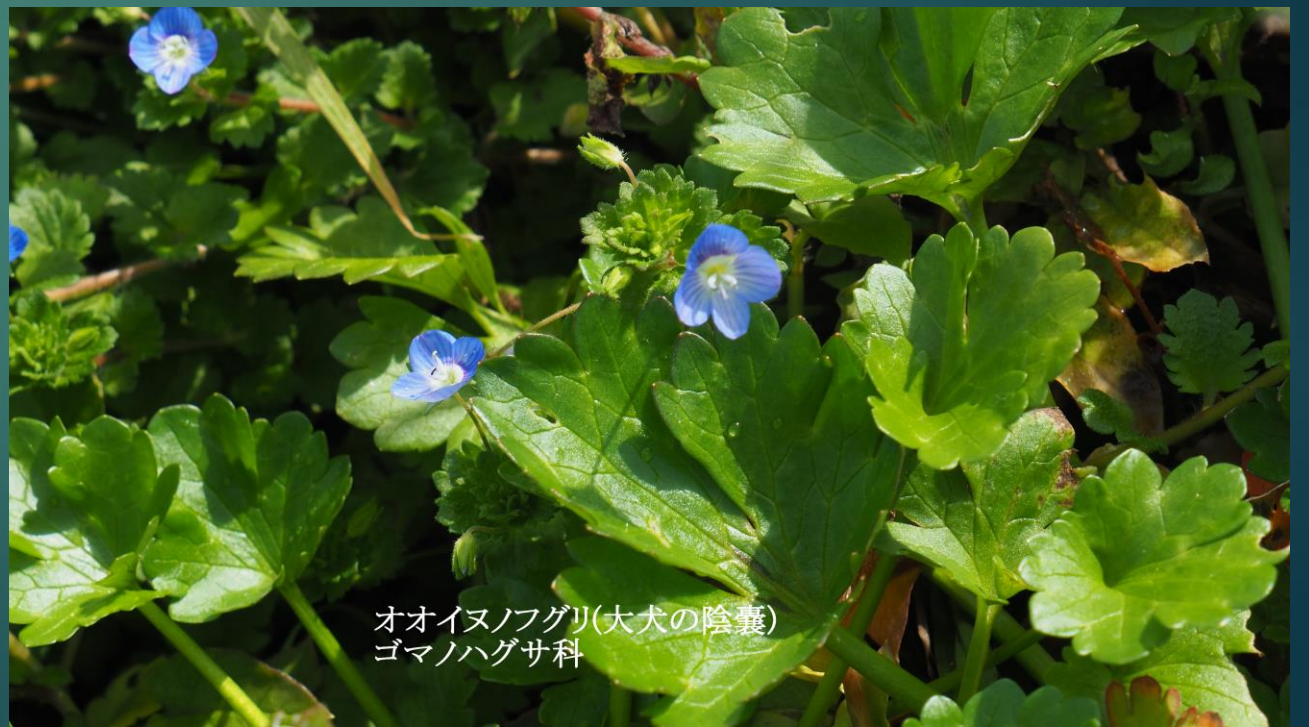
オオイヌノフグリ(大犬の陰囊) ゴマノハグサ科