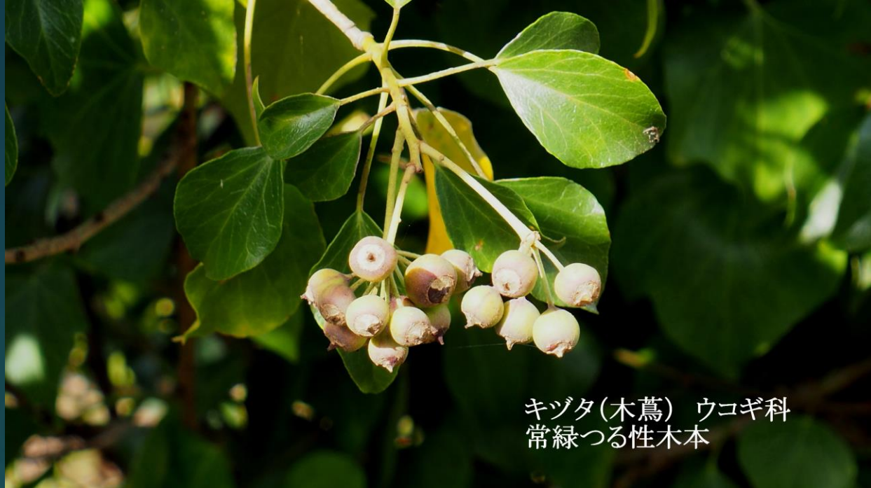
キヅタ(木蔦) ウコギ科 常緑つる性木本