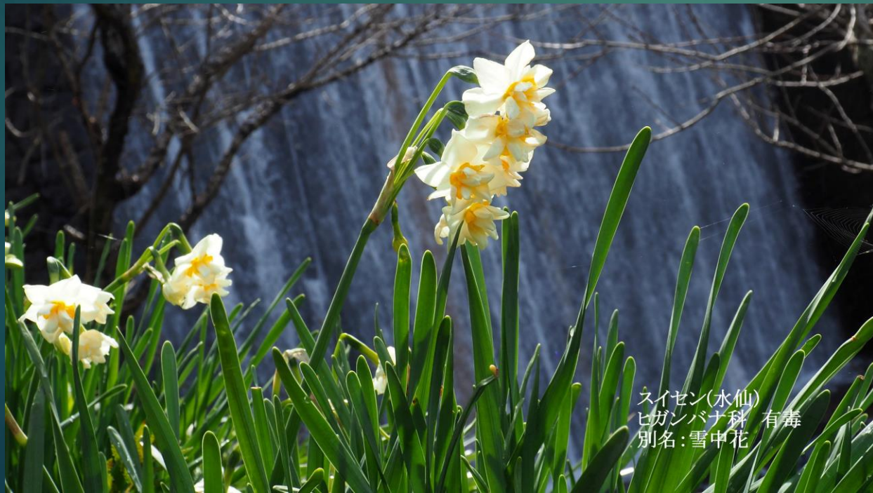
スイセン(水仙) ヒガンバナ科 有毒 別名: 雪中花