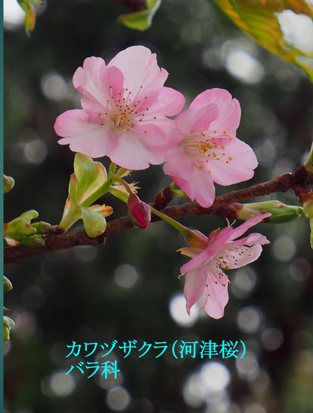
カワヅザクラ(河津桜) バラ科