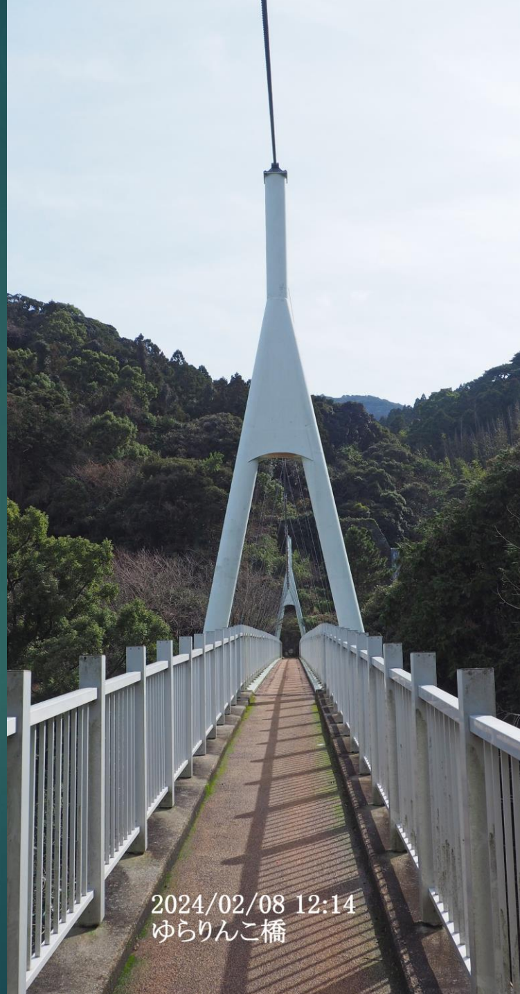
2024/02/08 12:14 ゆらりんこ橋