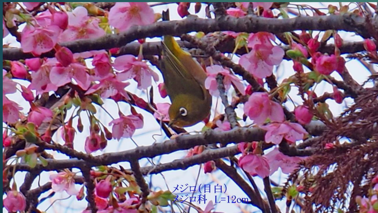
メジロ(目白) メジロ科 L=12cm