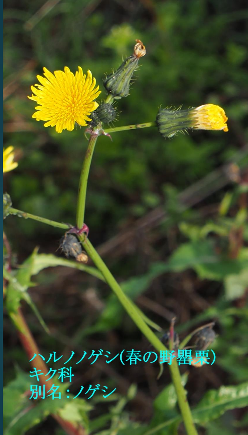
ハルノゲシ(春の野罌粟) キク科 別名:ノゲシ