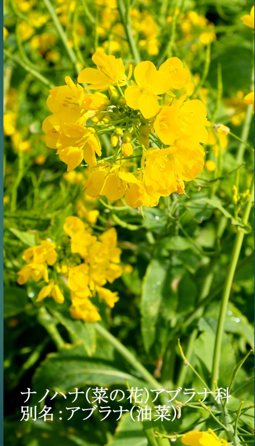
ナノハナ(菜の花)アブラナ科 別名:アブラナ(油菜)