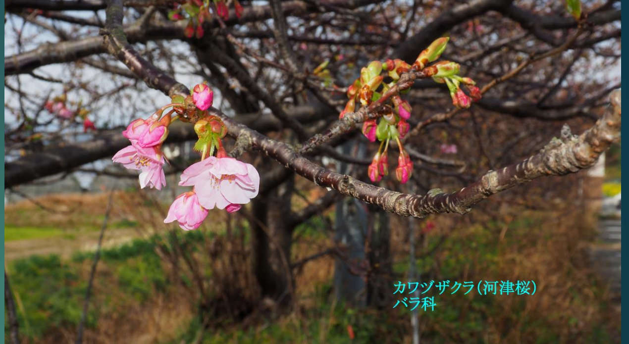
カワヅザクラ(河津桜) バラ科