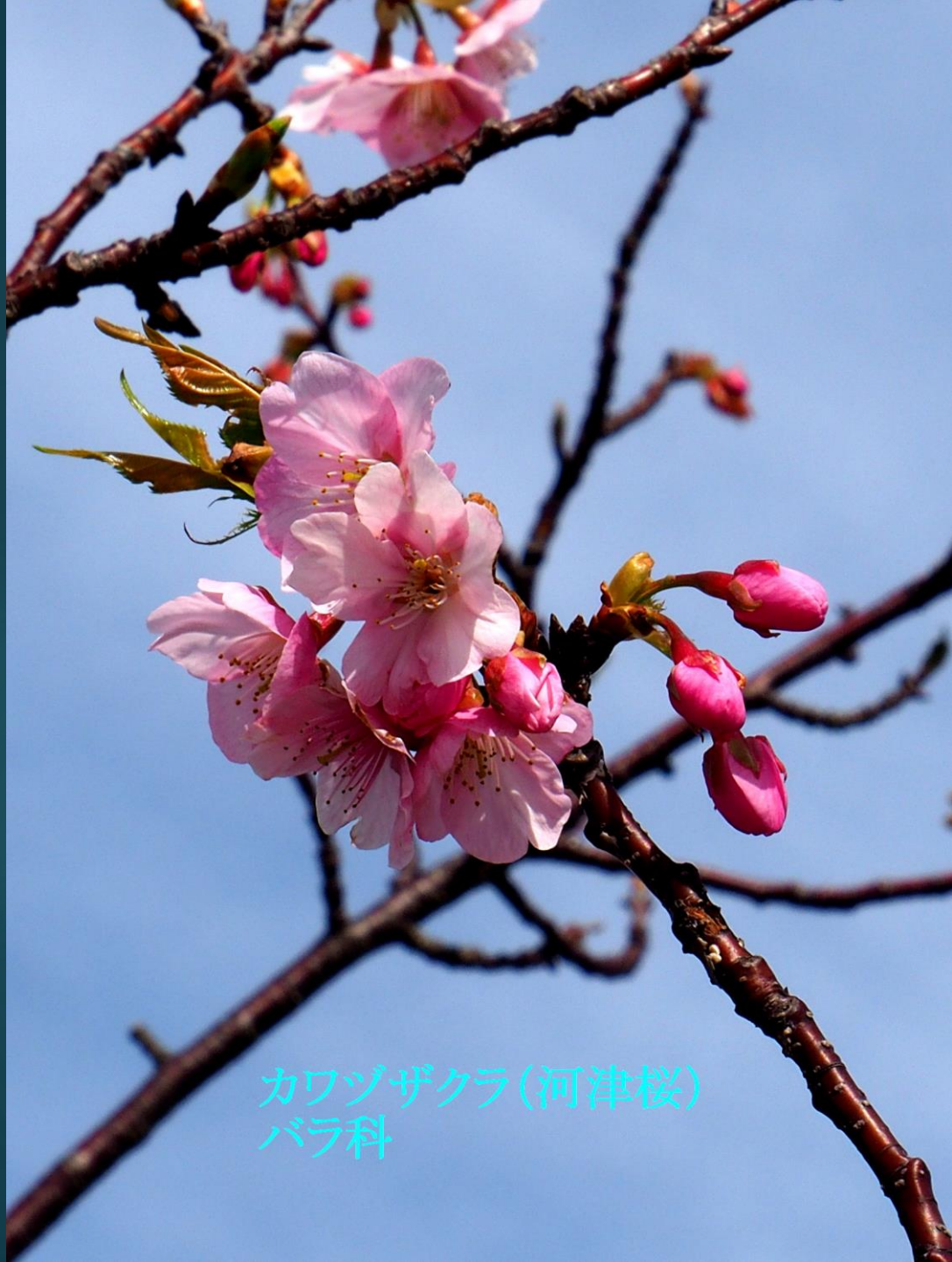
カワヅザクラ(河津桜) バラ科