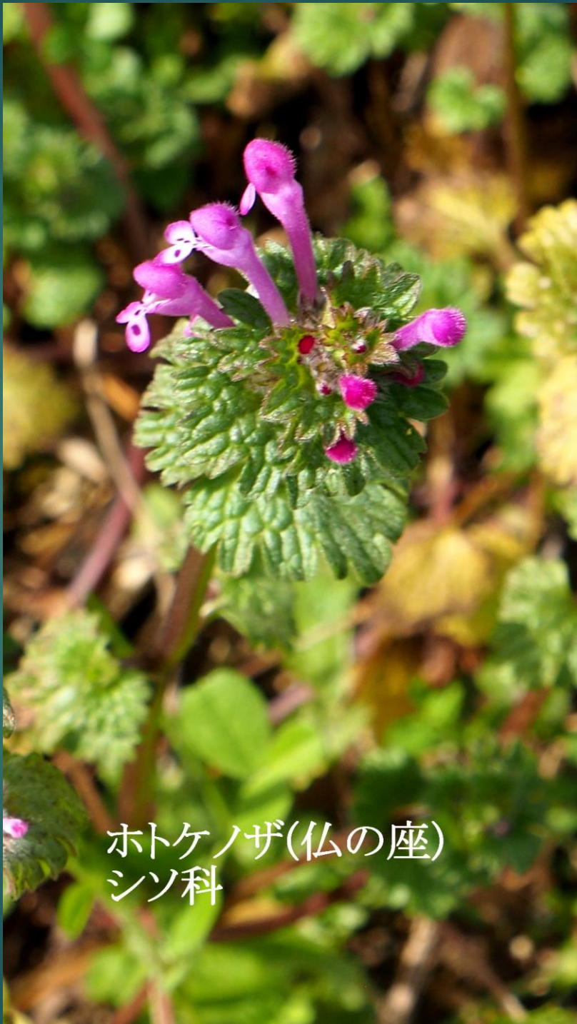
ホトケノザ(仏の座) シソ科