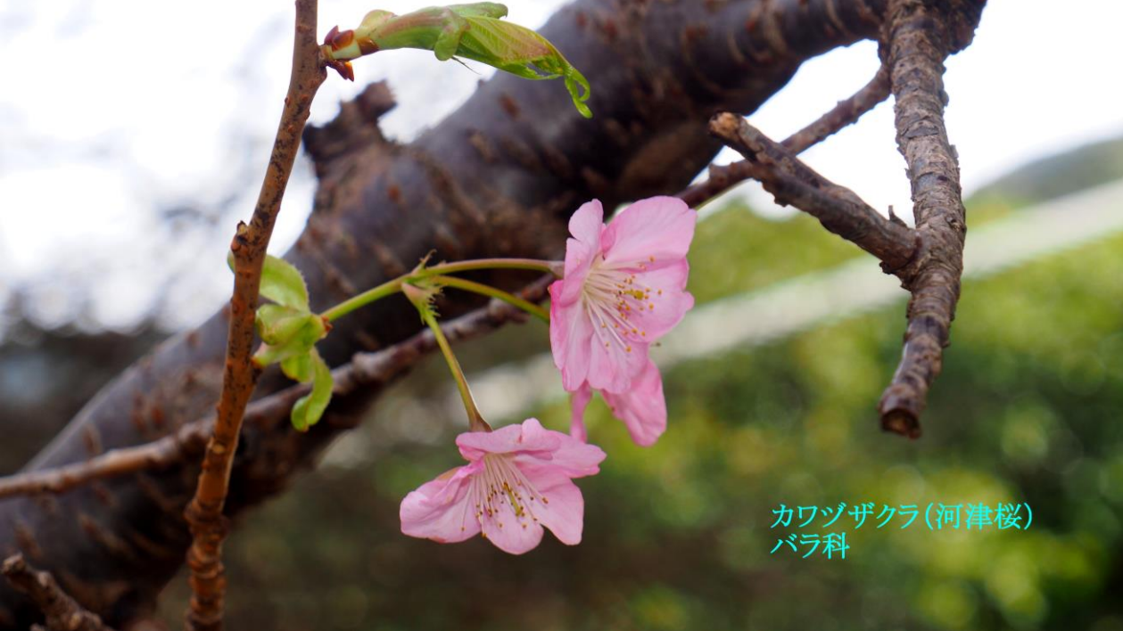
カワヅザクラ(河津桜) バラ科