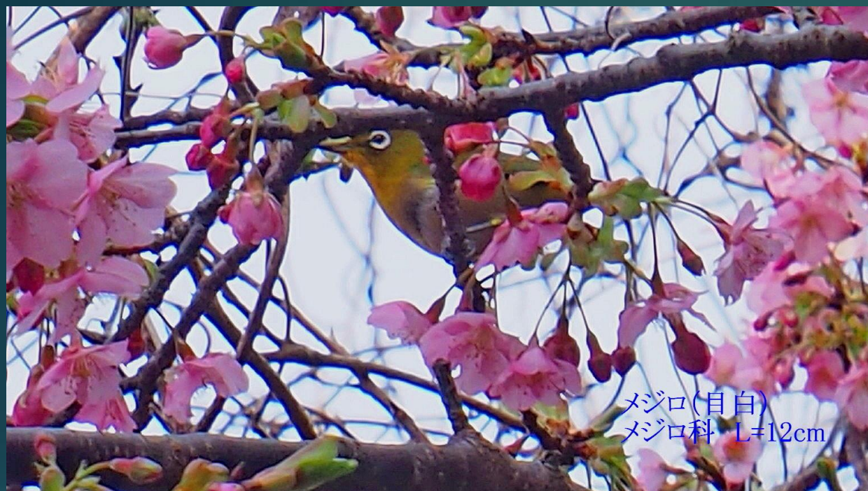
メジロ(目白) メジロ科 L=12cm