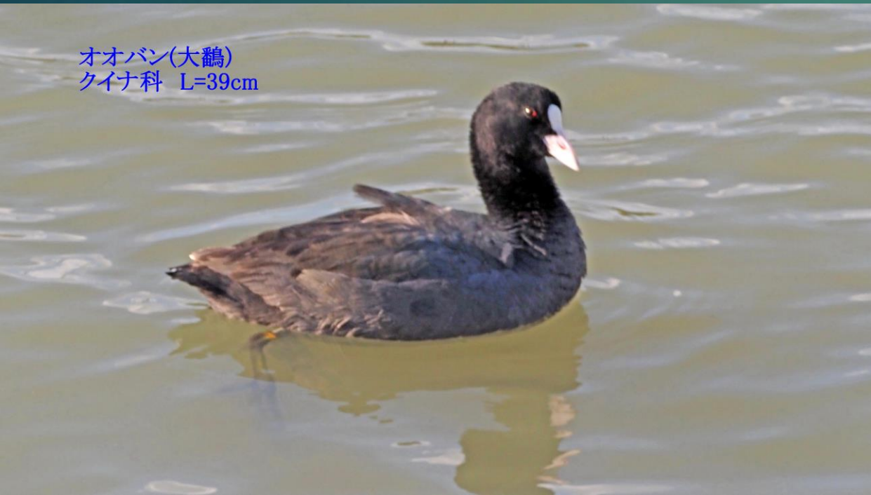
オオバン(大鵞) クイナ科 L=39cm