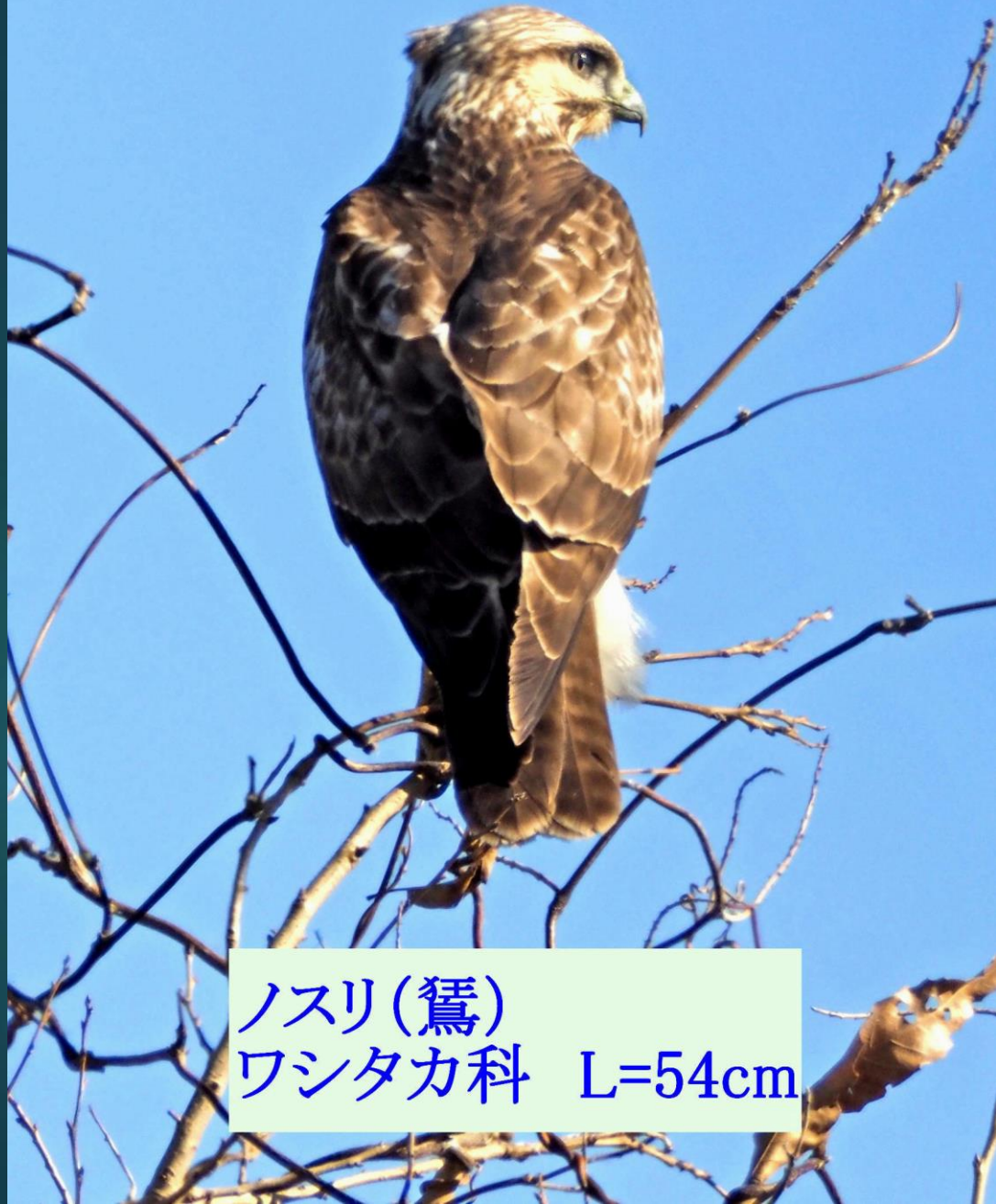
ノスリ(鴞) ワシタカ科 L=54cm