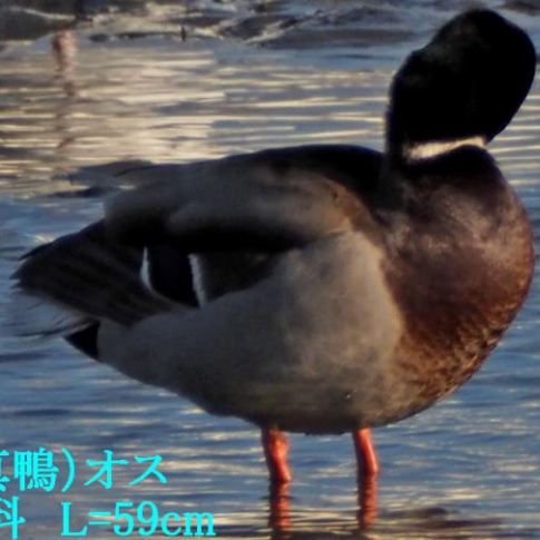
マガモ(真鴨)オス ガンカモ科 L=59cm