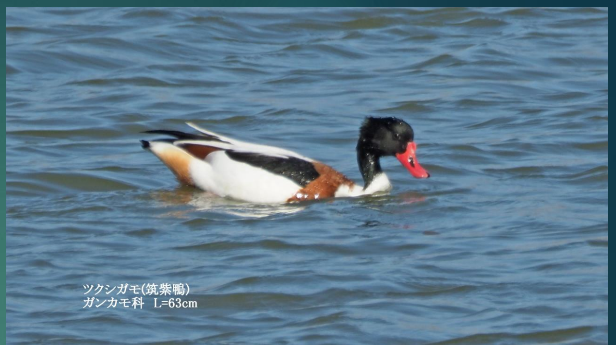
ツクシガモ(筑紫鴨) ガンカモ科 L=63cm