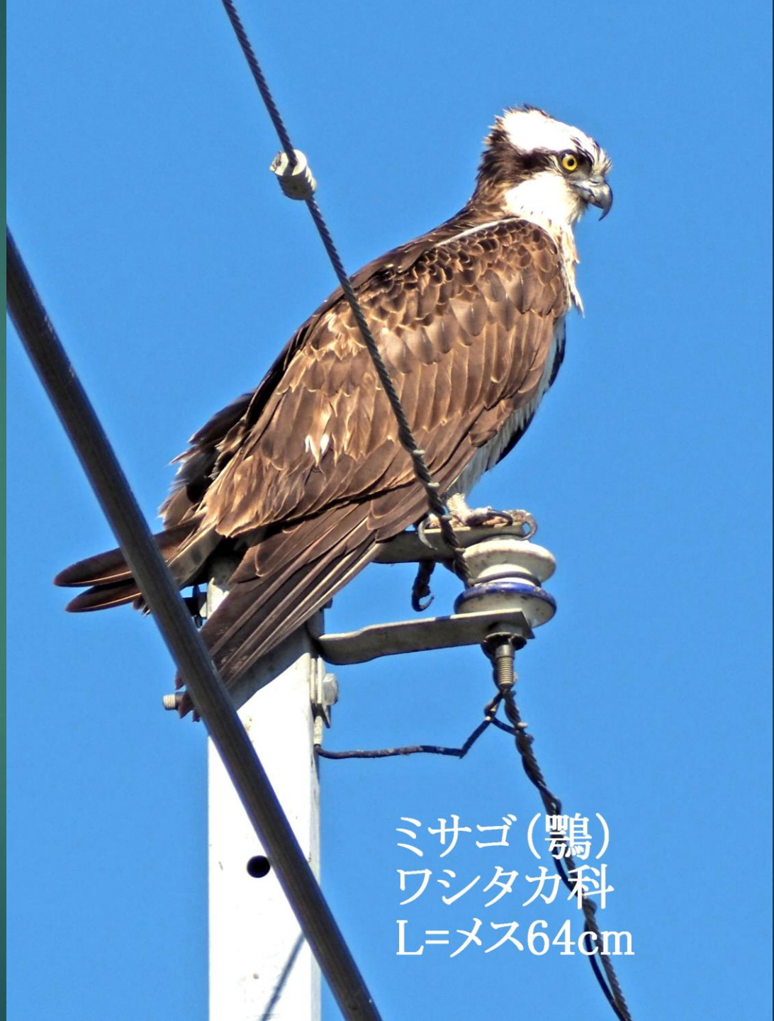
ミサゴ(鵟) ワシタカ科 L=メス64cm