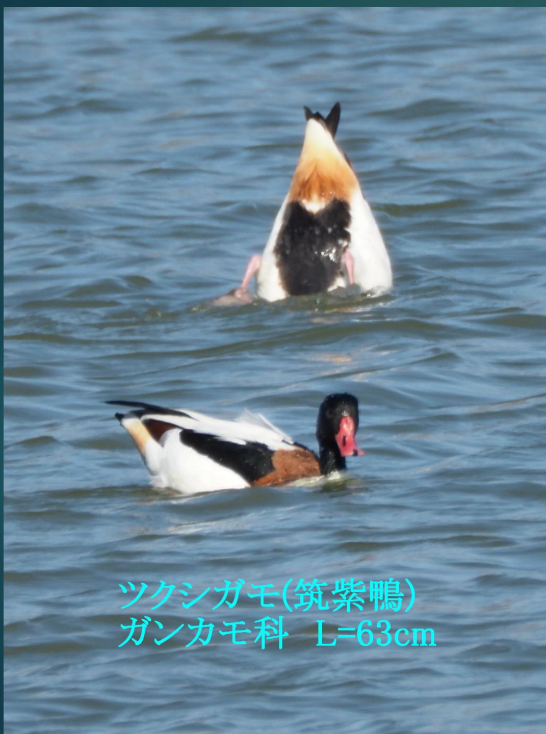
ツクシガモ(筑紫鴨) ガンカモ科 L=63cm