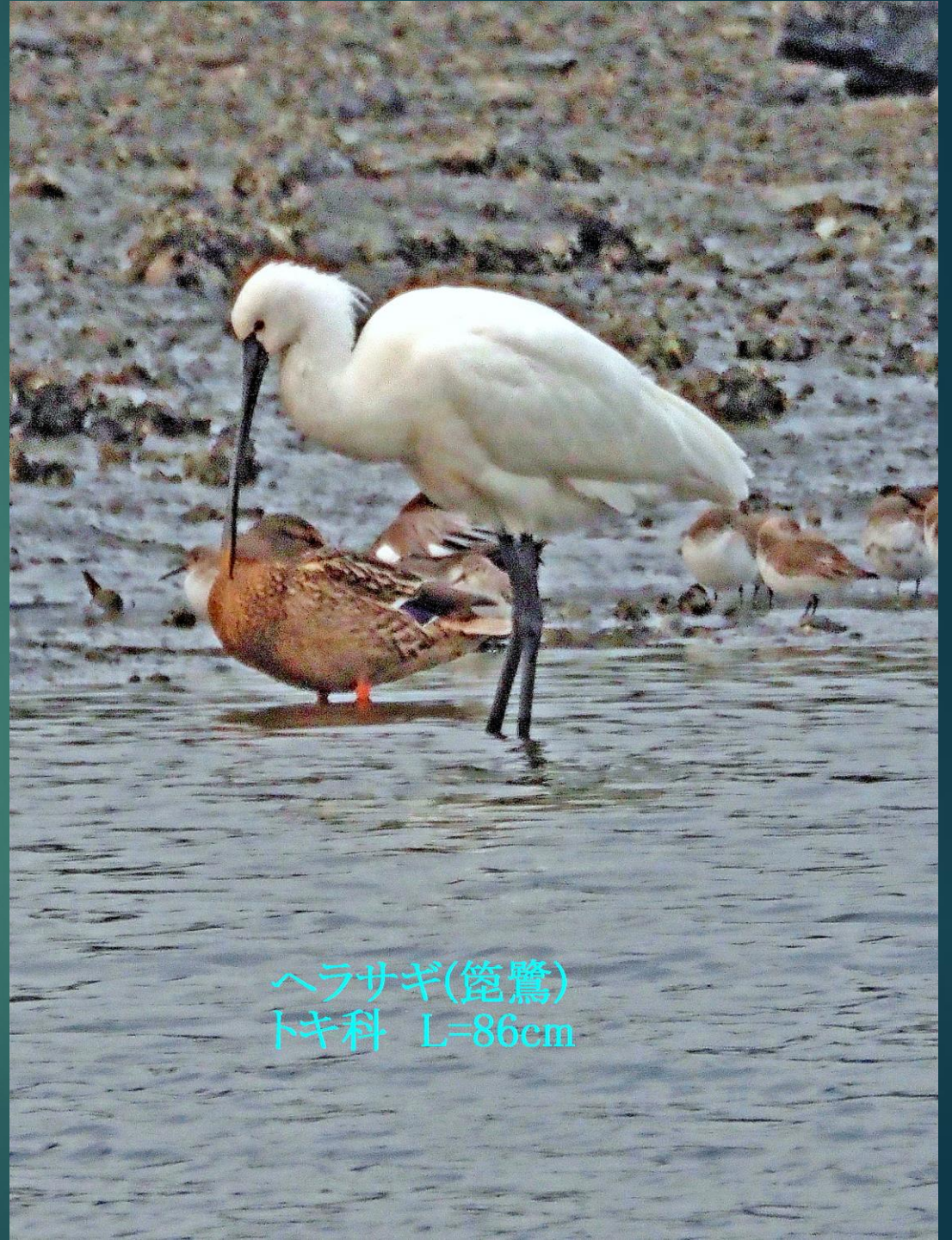
ヘラサギ(篋鷺) トキ科 L=86cm