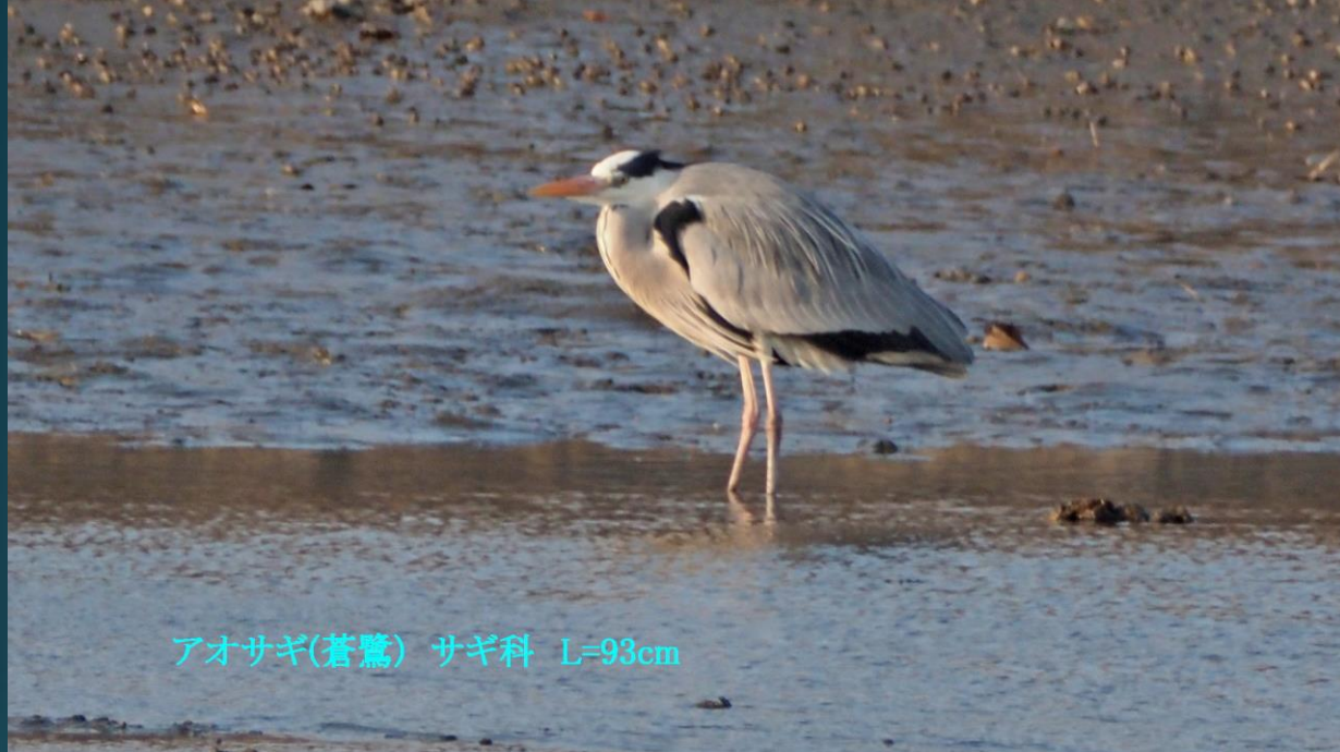
アオサギ(蒼鷺) サギ科 L=93cm