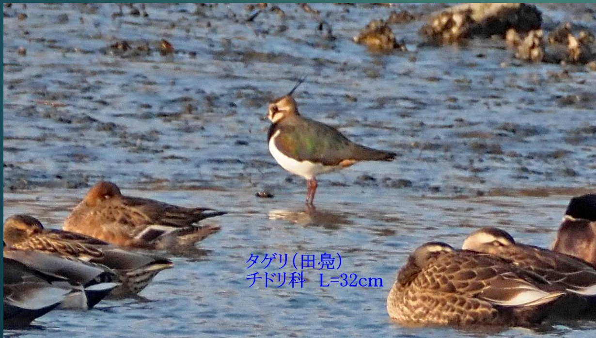
タゲリ(田鳧) チドリ科 L=32cm