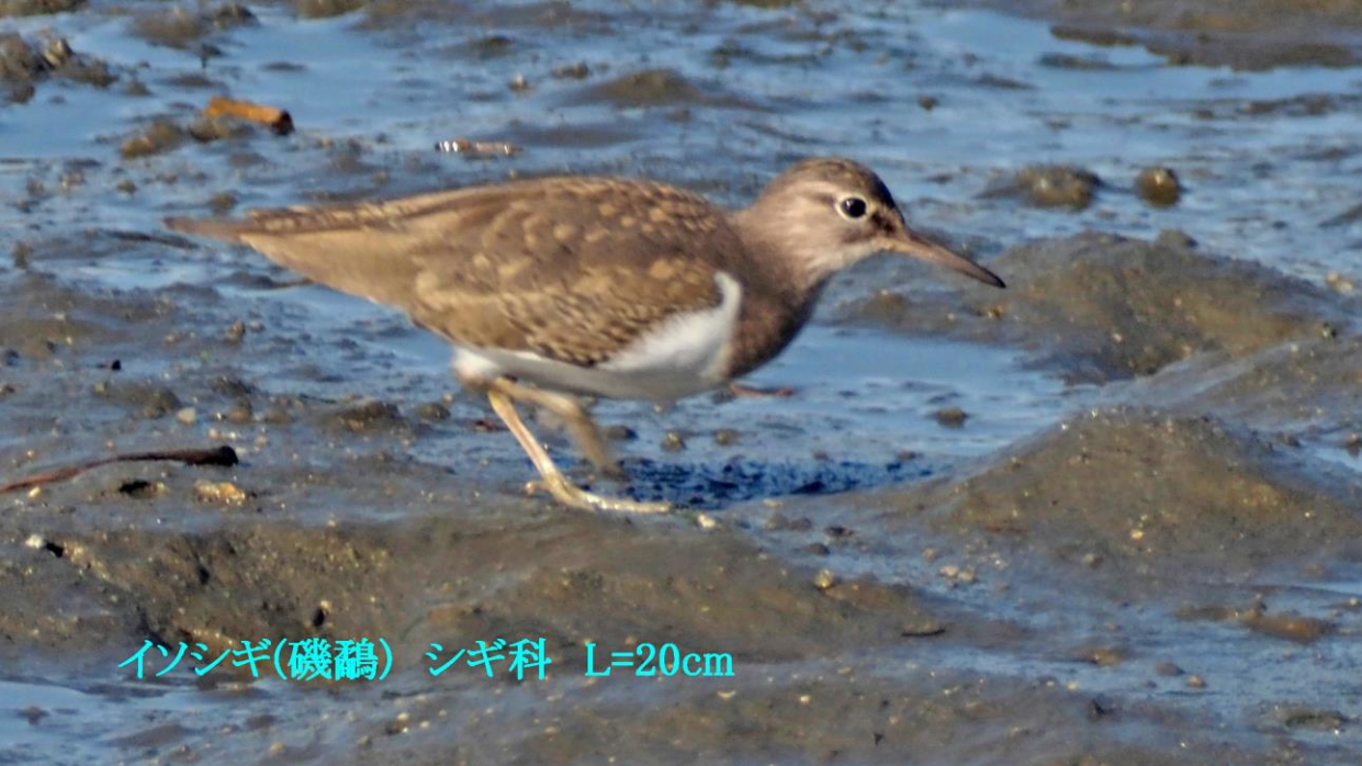
イソシギ(磯鷗) シギ科 L=20cm