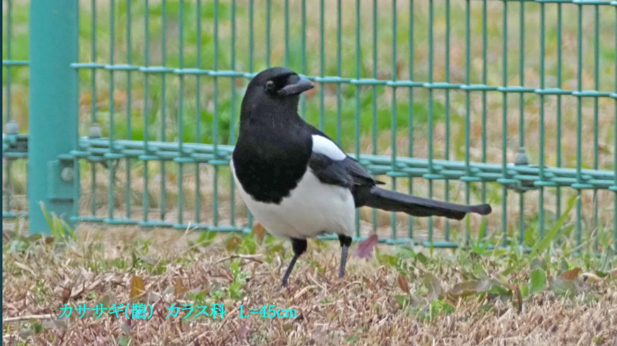
カササギ(鶺鴒) カラス科 L=45cm