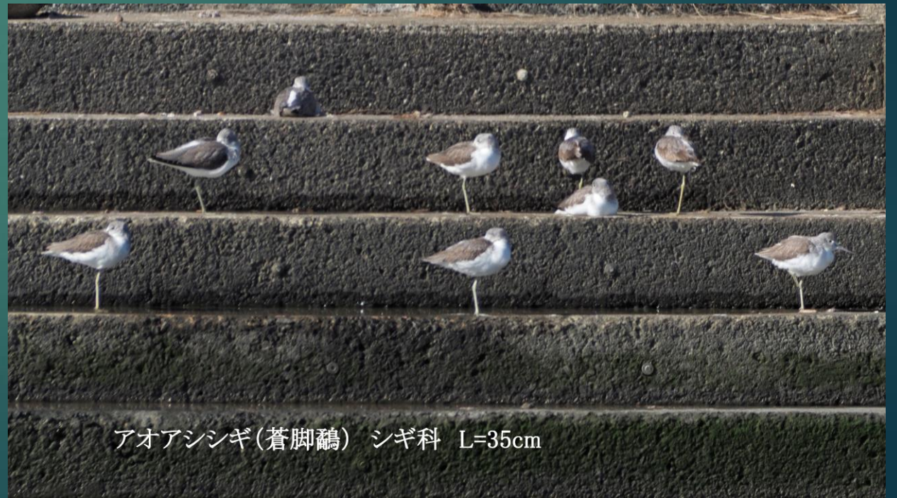
アオアシシギ(蒼脚鶺) シギ科 L=35cm