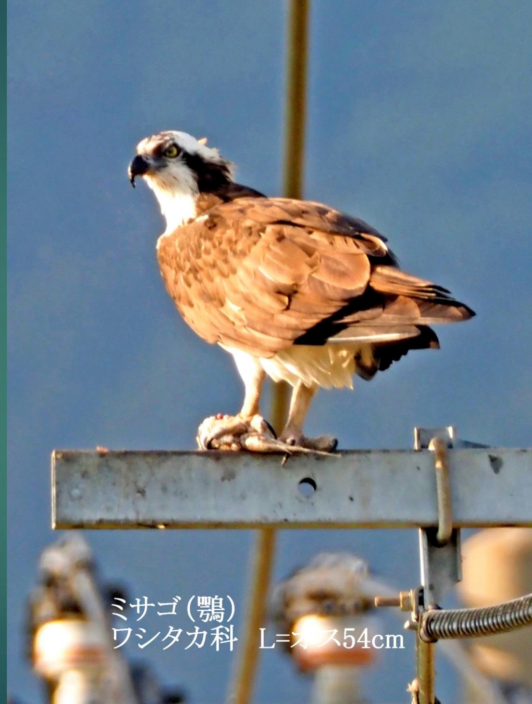
ミサゴ(鵟) ワシタカ科 L=オス54cm