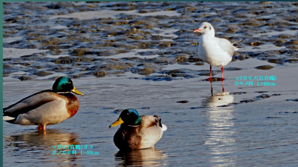
マガモ(真鴨)オス ガンカモ科 L=59cm