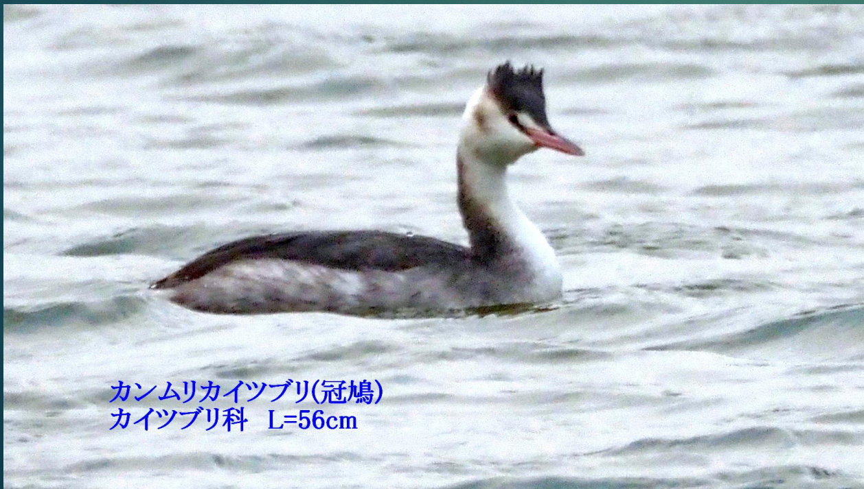
カンムリカイツブリ(冠鳩) カイツブリ科 L=56cm