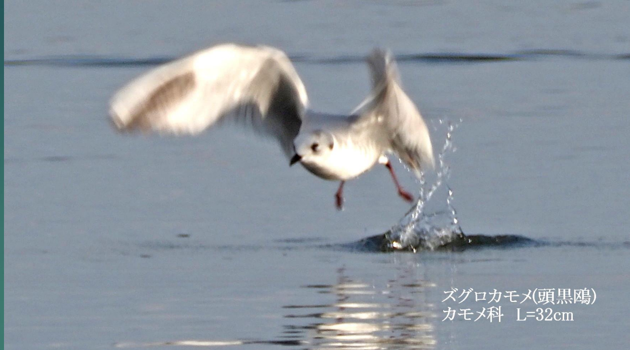
ズグロカモメ(頭黒鷗) カモメ科 L=32cm