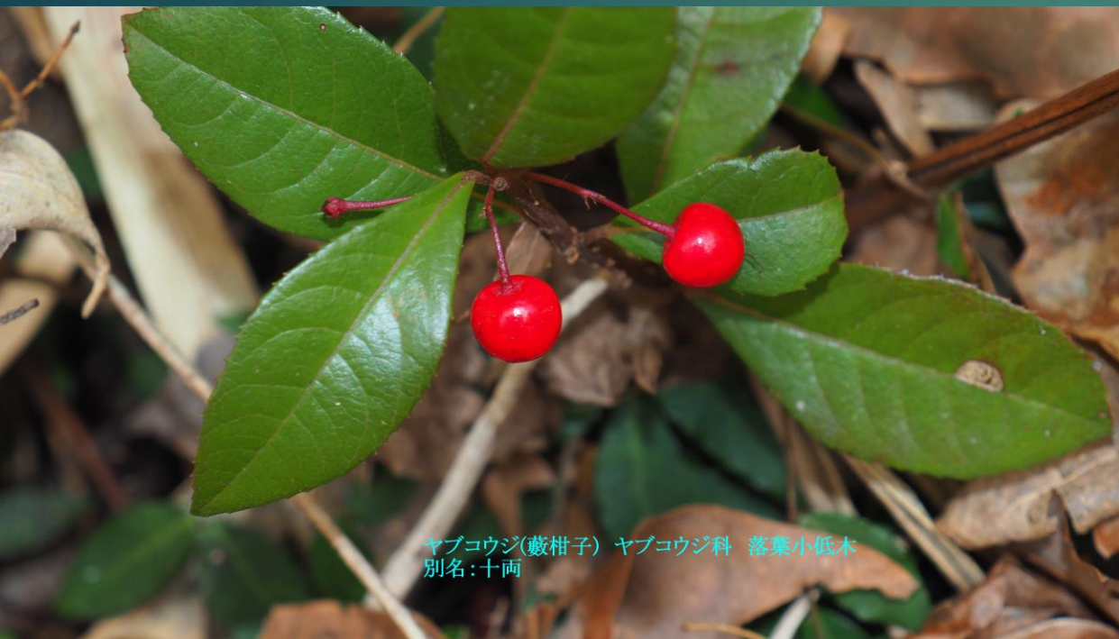
ヤブコウジ(藪柑子) ヤブコウジ科 落葉小低木 別名:十両