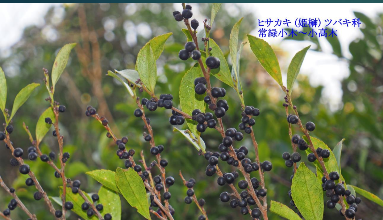
ヒサカキ (姫榊) ツバキ科 常緑小木～小高木