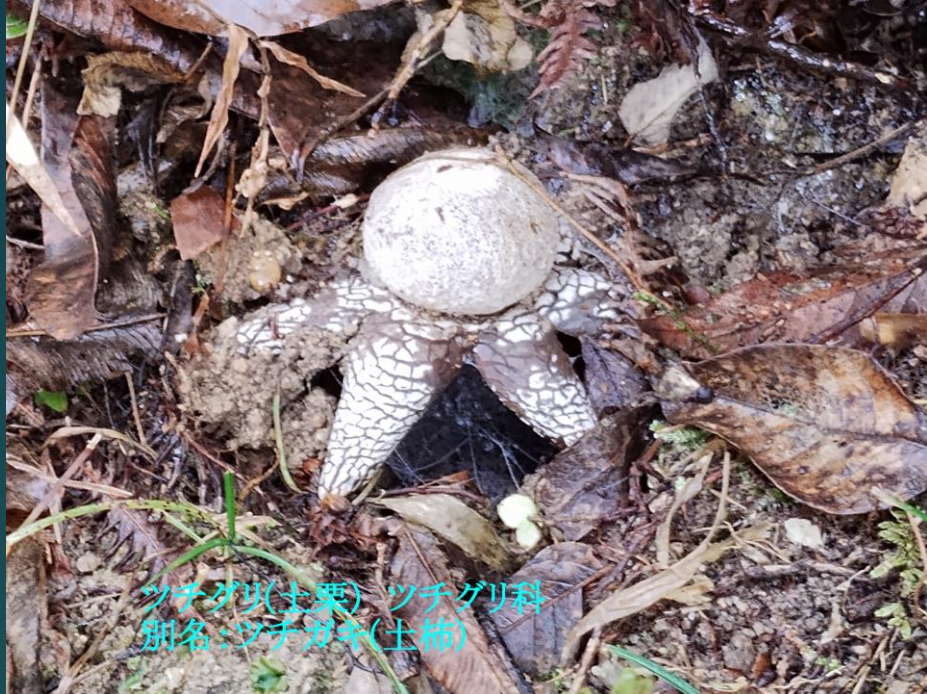
ツチガリ(土栗) ツチガリ科 別名:ツチガキ(土柿)