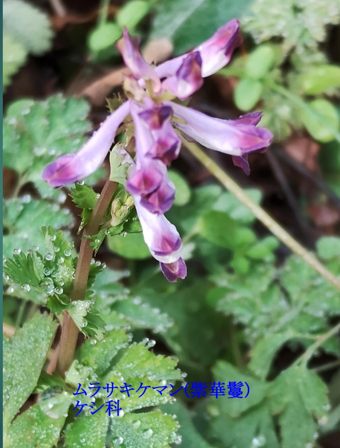
ムラサキケマン(紫華鬘) ケシ科