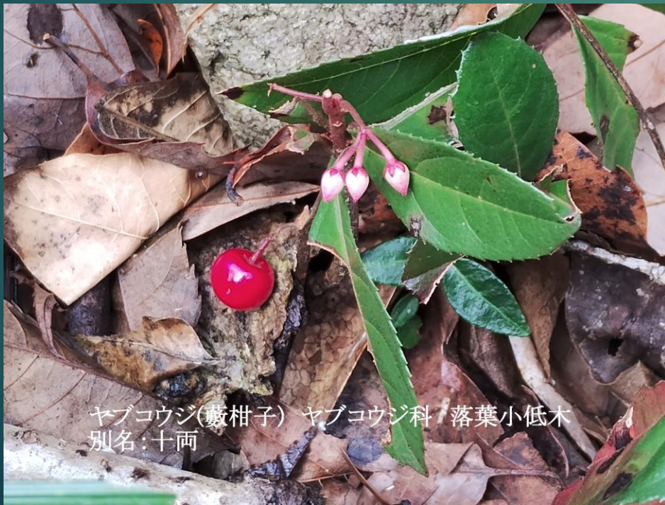
ヤブコウジ(藪柑子) ヤブコウジ科 落葉小低木 別名:十両