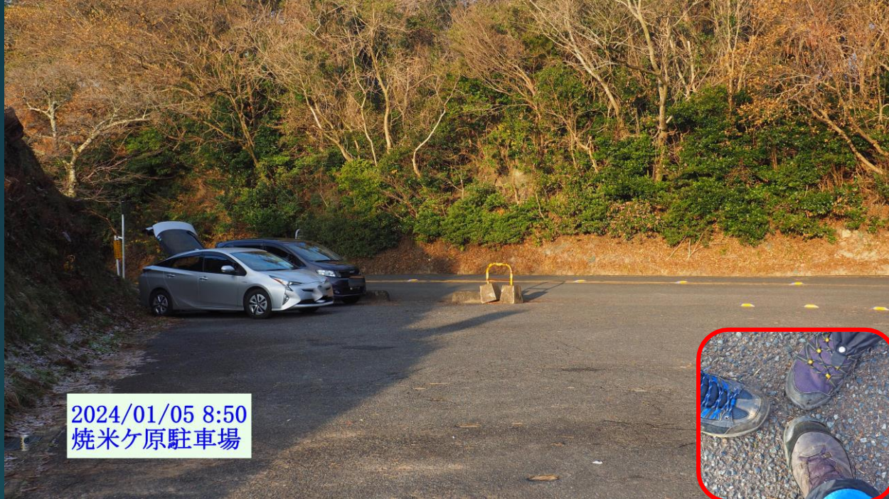
2024/01/05 8:50 焼米ヶ原駐車場