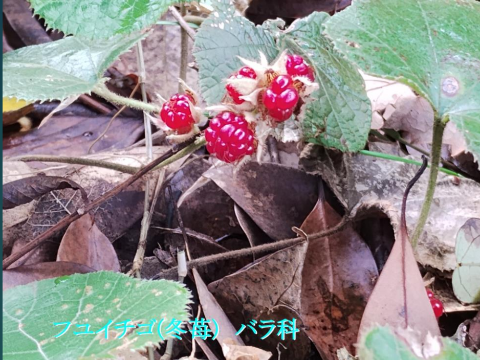
フユイチゴ(冬苺) バラ科