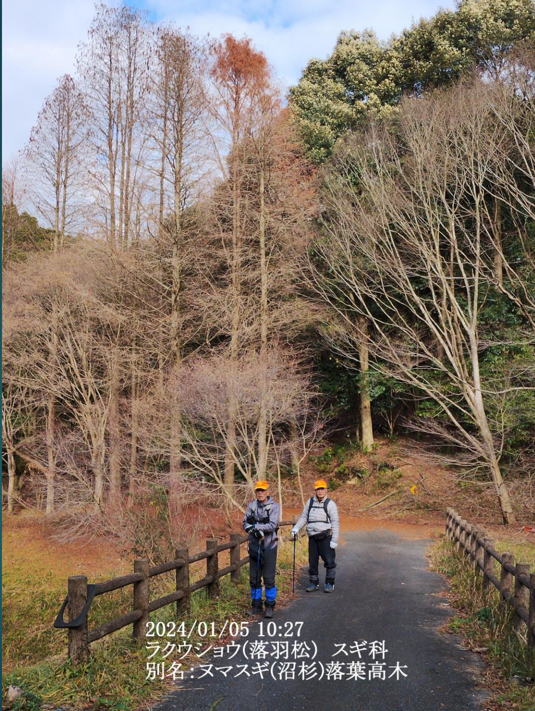
2024/01/05 10:27 ラクウショウ(落羽松) スギ科 別名:ヌマスギ(沼杉)落葉高木