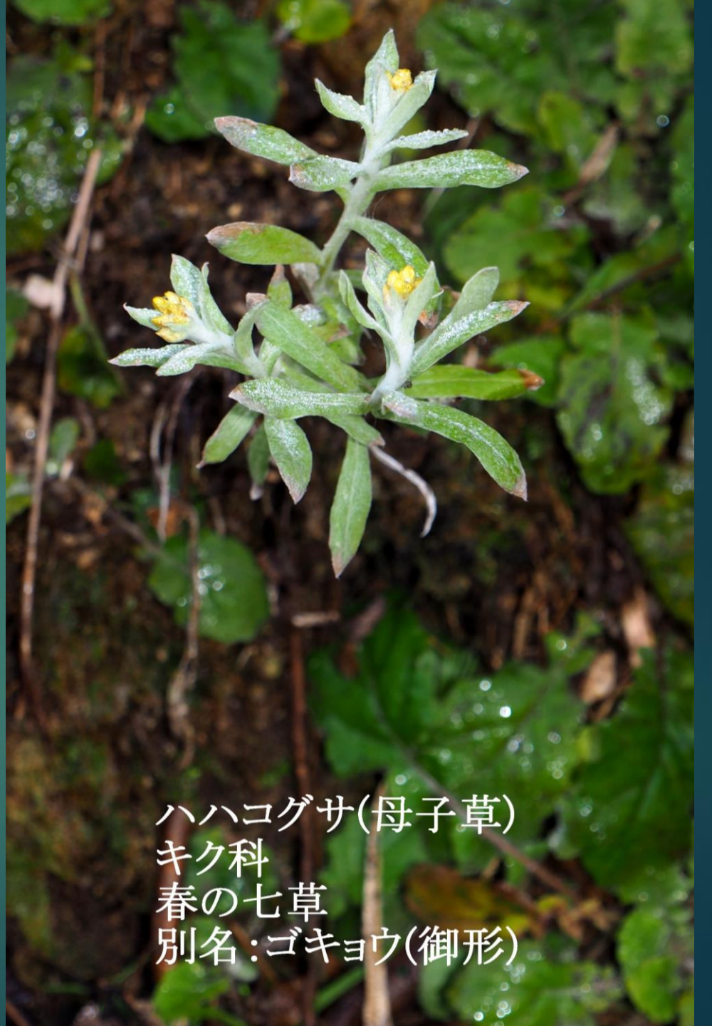
ハハコグサ(母子草) キク科 春の七草 別名:ゴキョウ(御形)