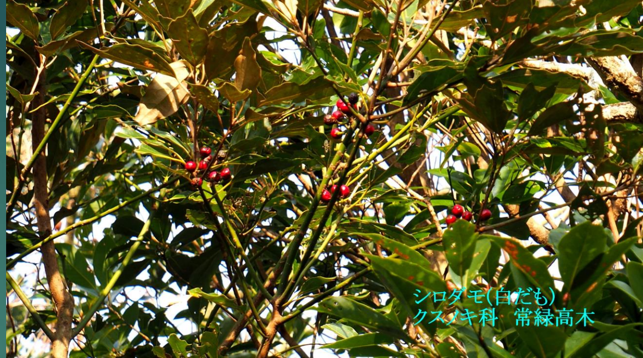
シロダモ(白だも) クスノキ科 常緑高木