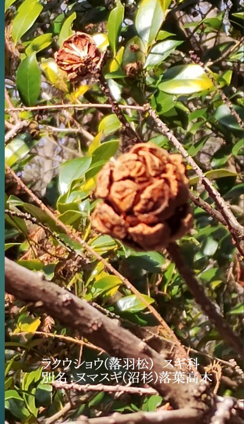
ラクウショウ(落羽松) スギ科 別名:ヌマスギ(沼杉)落葉高木