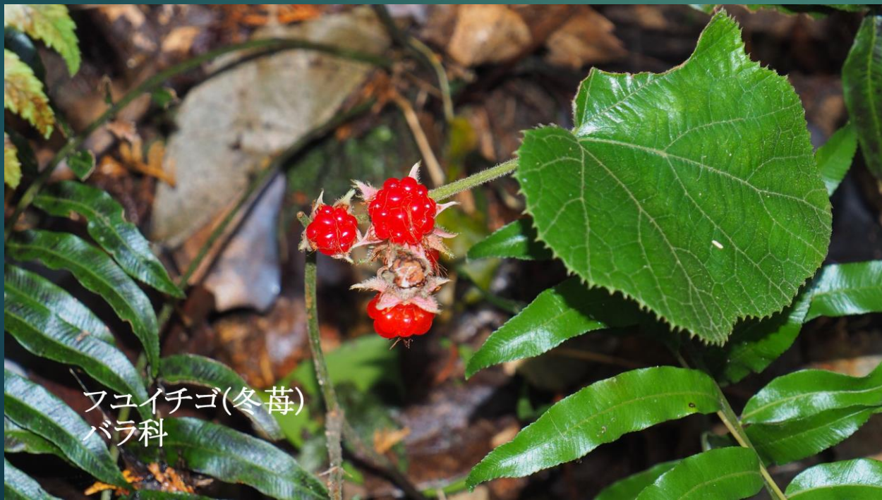
フユイチゴ(冬苺) バラ科