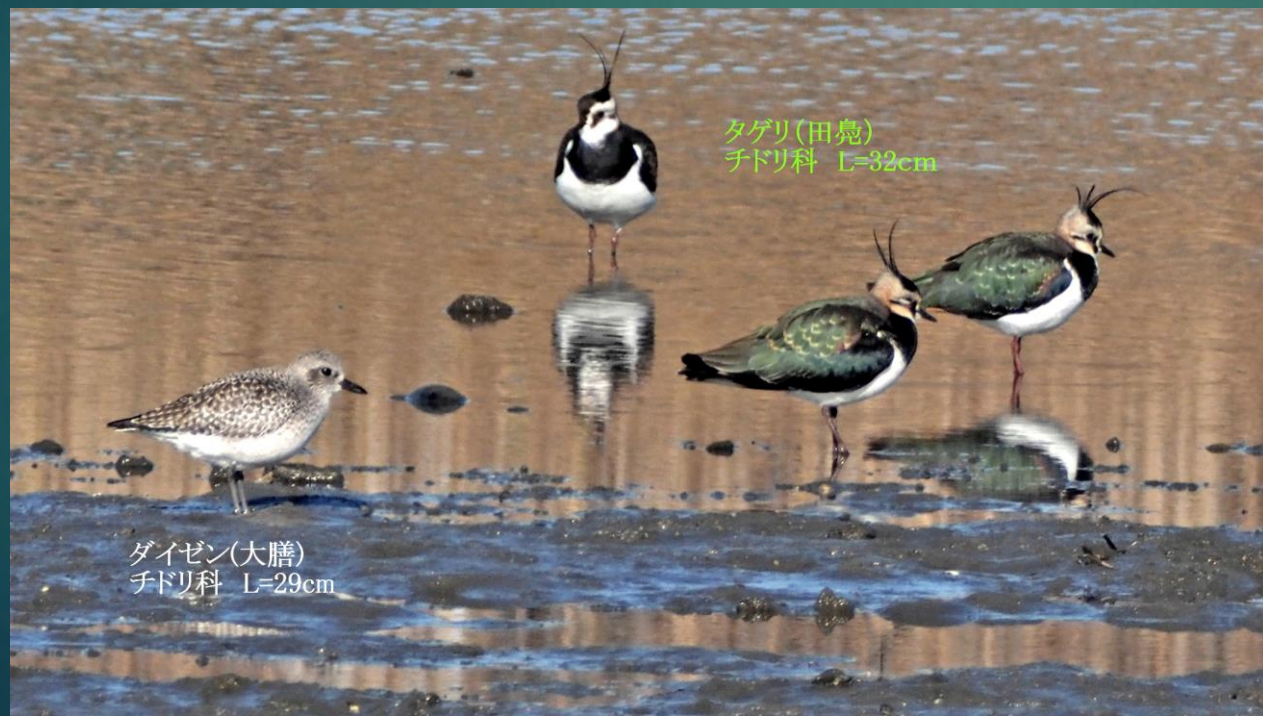
タゲリ(田鳧) チドリ科 L=32cm