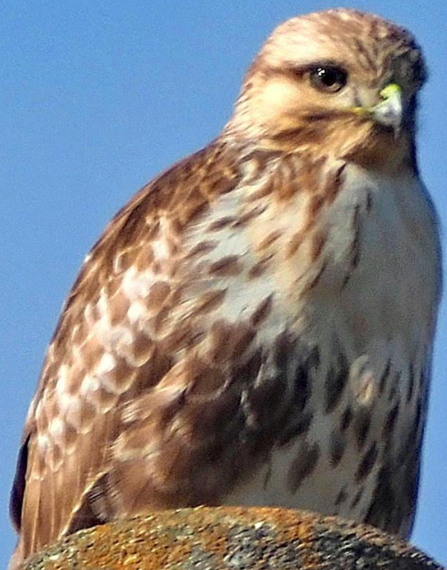
ノスリ(鶯) ワシタカ科 L=54cm