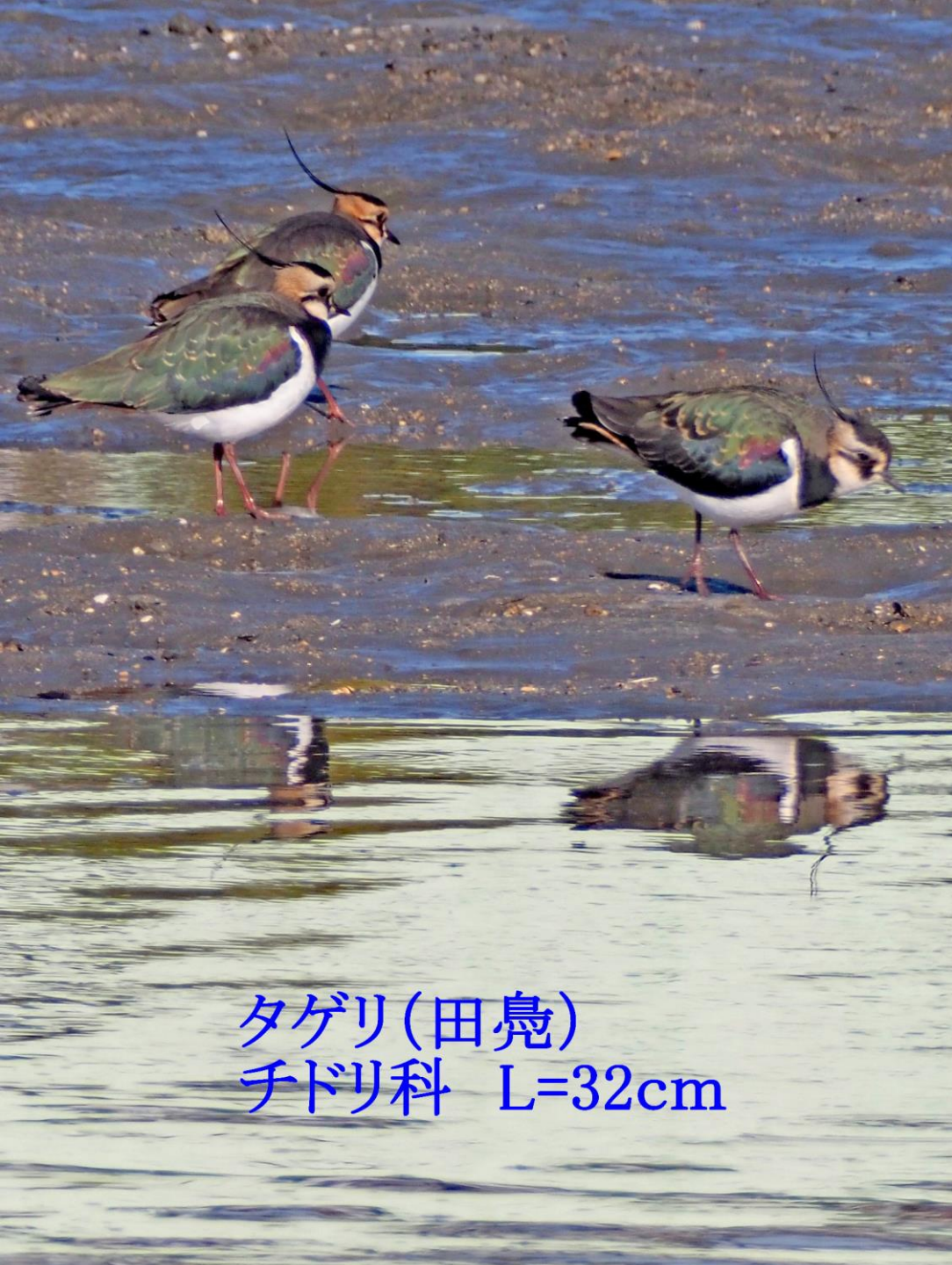
タゲリ(田鳧) チドリ科 L=32cm