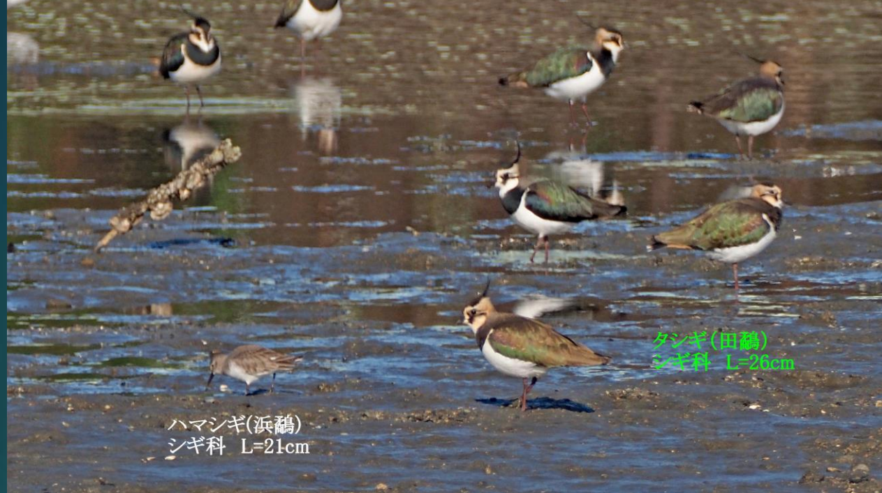
ハマシギ(浜鶺鴒) シギ科 L=21cm