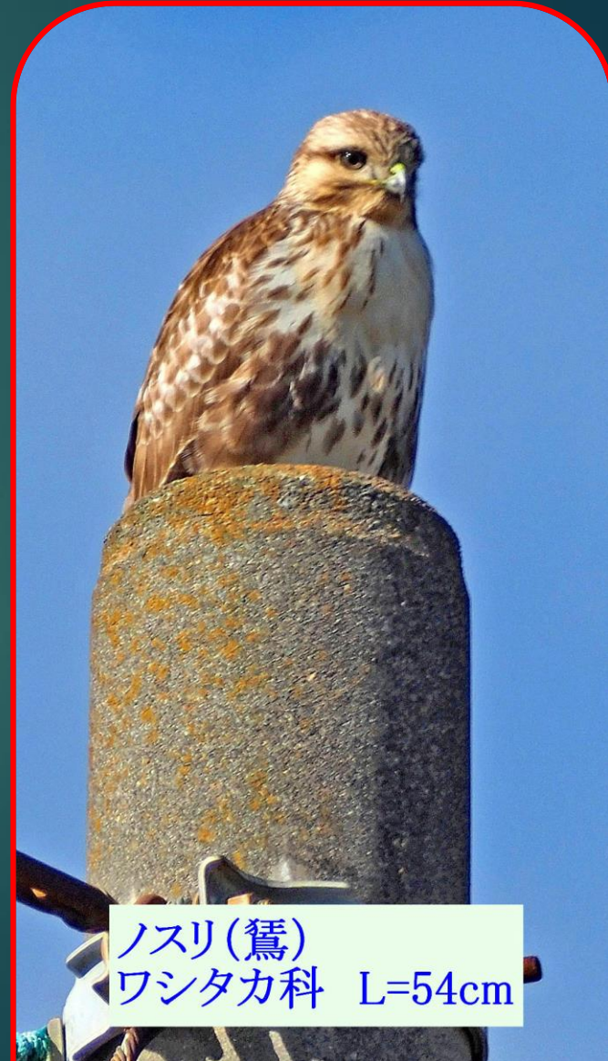
ノスリ(鷹) ワシタカ科 L=54cm