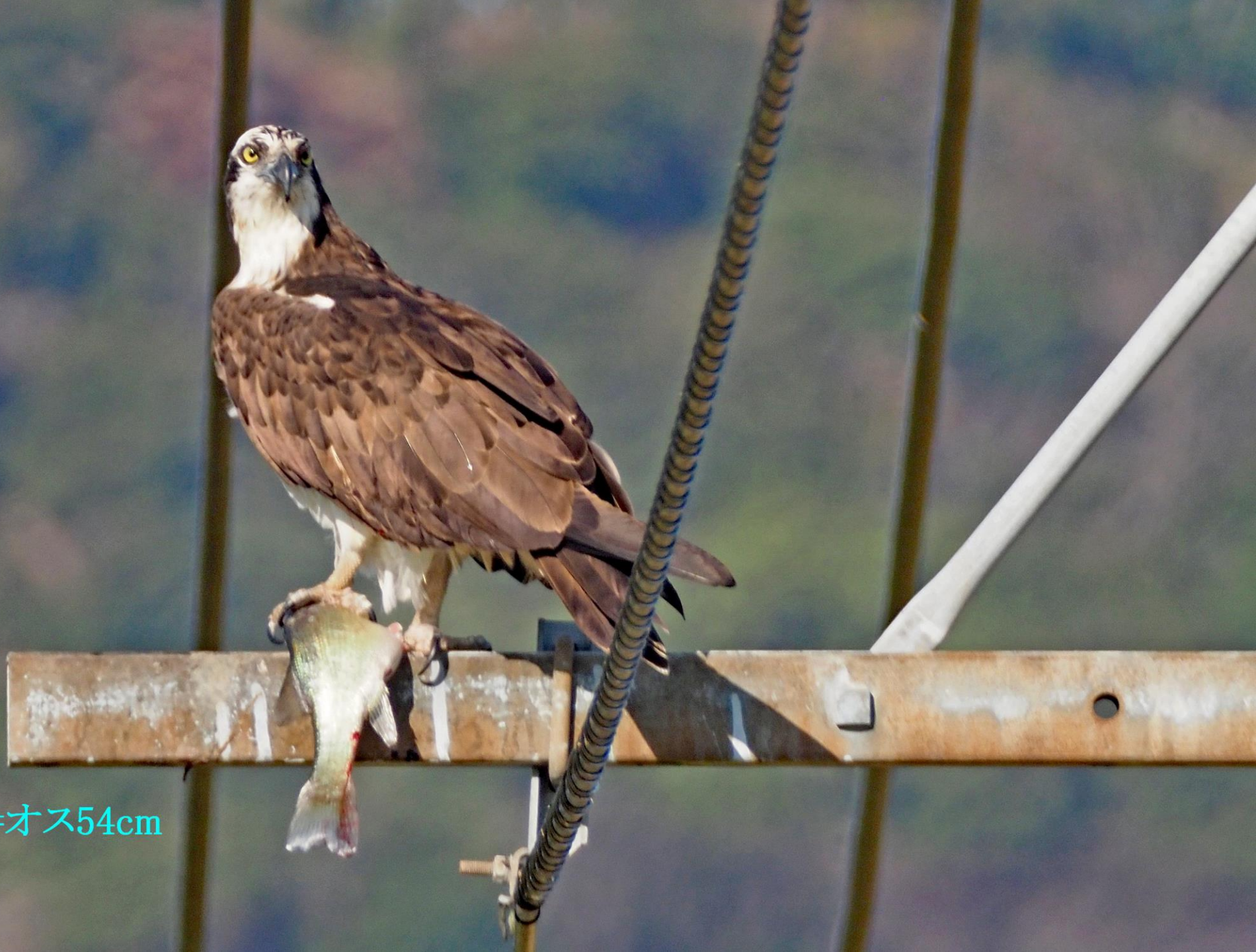
ミサゴ(鵟) ワシタカ科 L=オス54cm