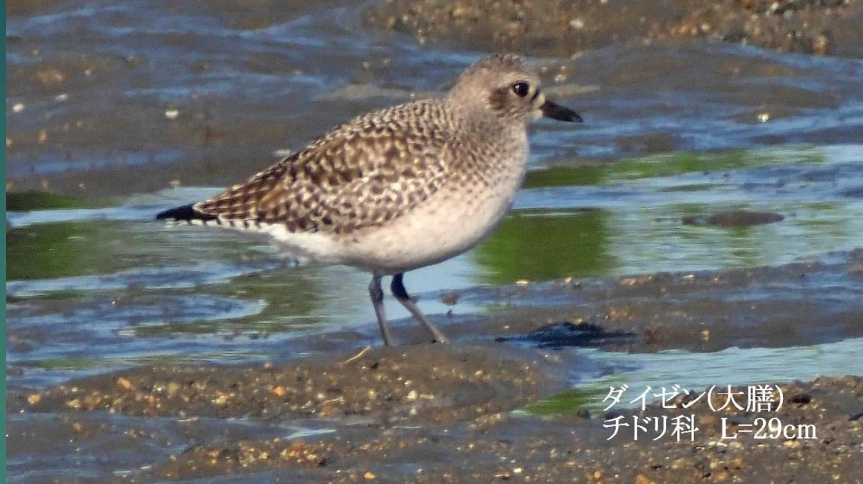
ダイゼン(大膳) チドリ科 L=29cm