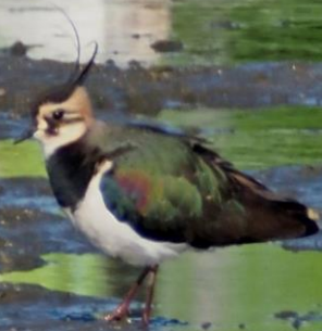
タゲリ(田鳧) チドリ科 L=32cm