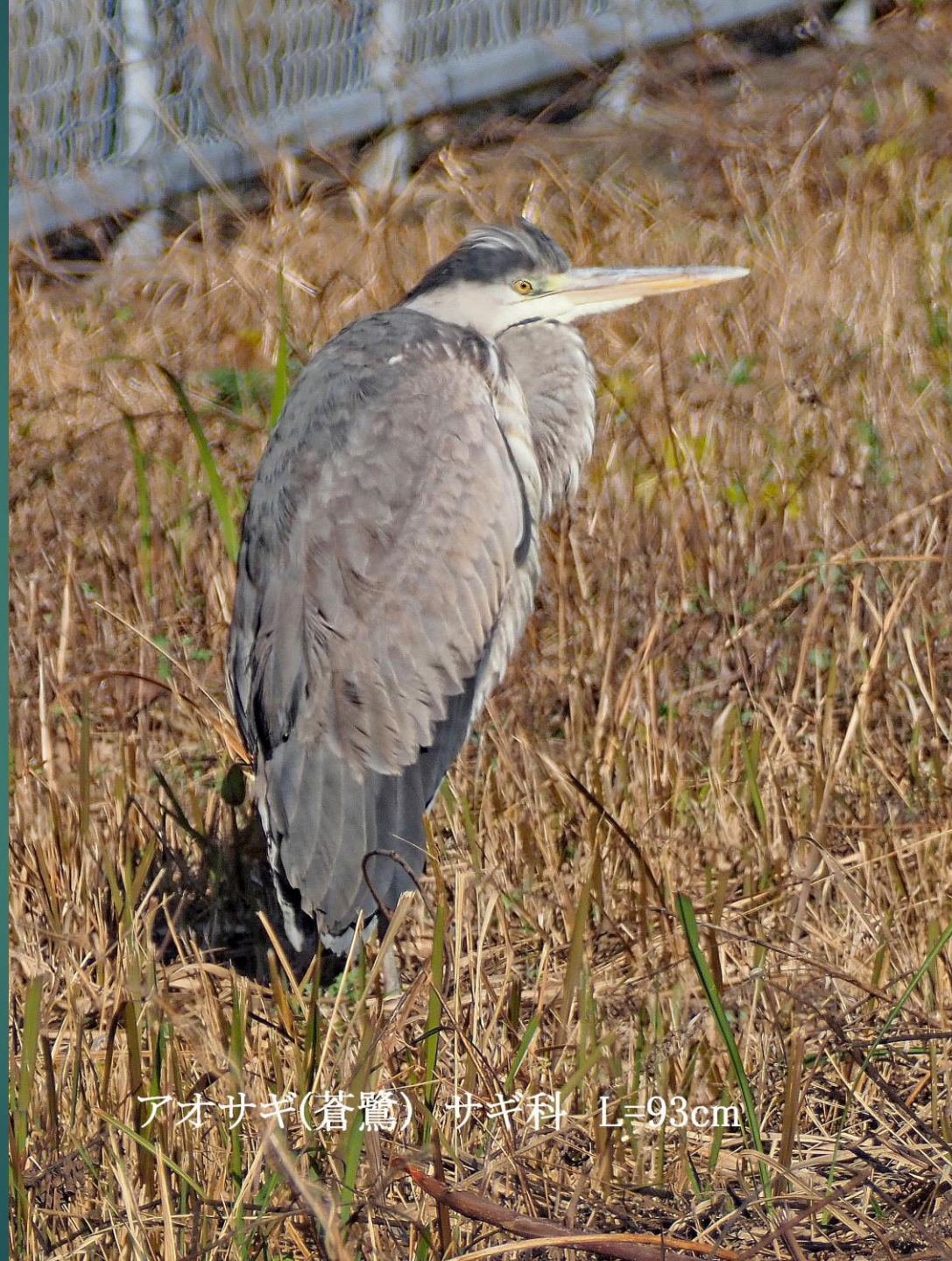
アオサギ(蒼鷺) サギ科 L=93cm