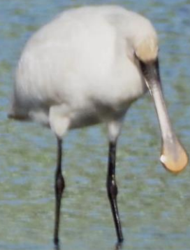
ヘラサギ(篋鷺) トキ科 L=86cm