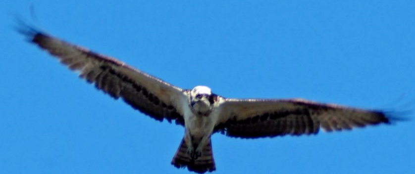
ミサゴ(鵟) ワシタカ科 L=メス64cm