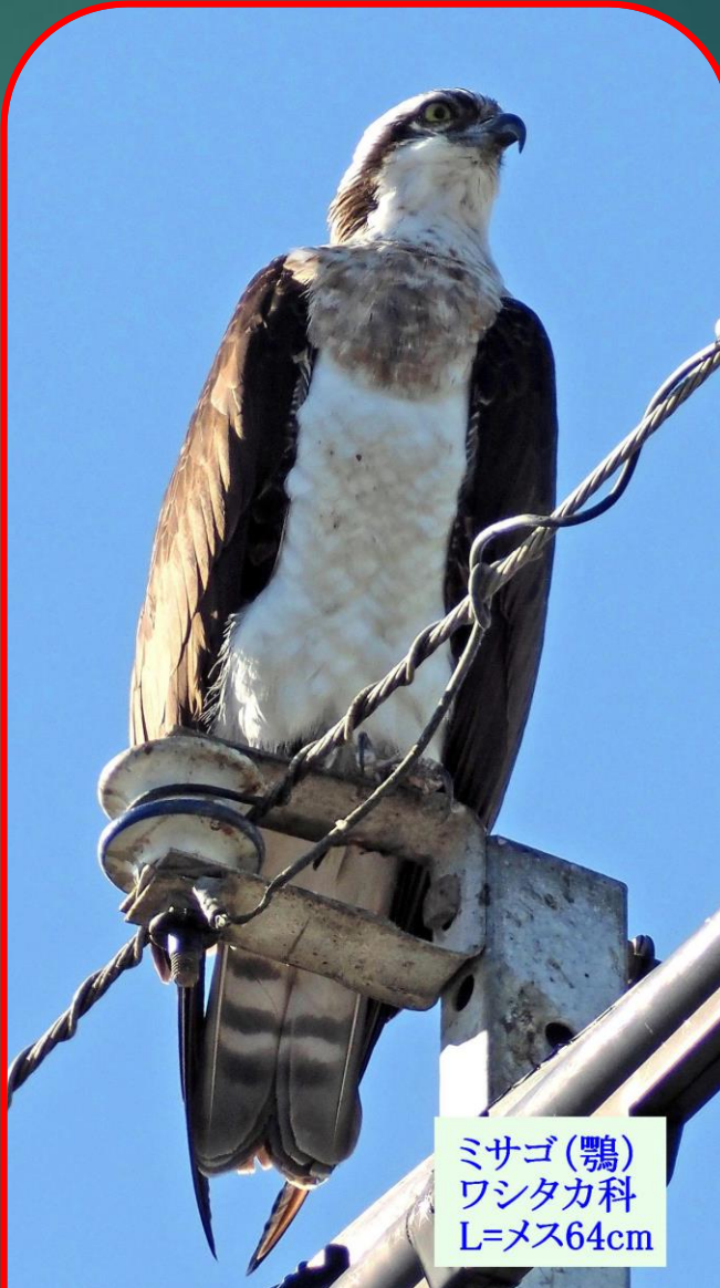
ミサゴ(鵟) ワシタカ科 L=メス64cm