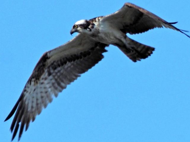
ミサゴ(鵟) ワシタカ科 L=メス64cm