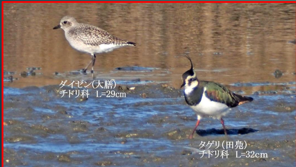
ダイゼン(大膳) チドリ科 L=29cm