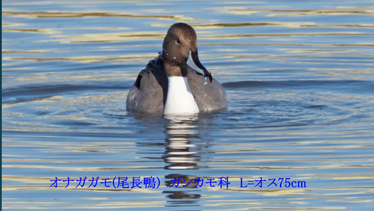
オナガガモ(尾長鴨) ガンカモ科 L=オス75cm