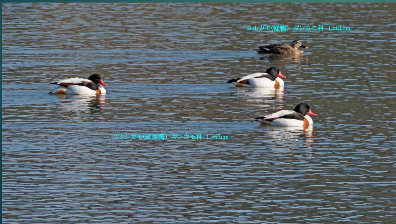
カルガモ(軽鴨) ガンカモ科 L=61cm