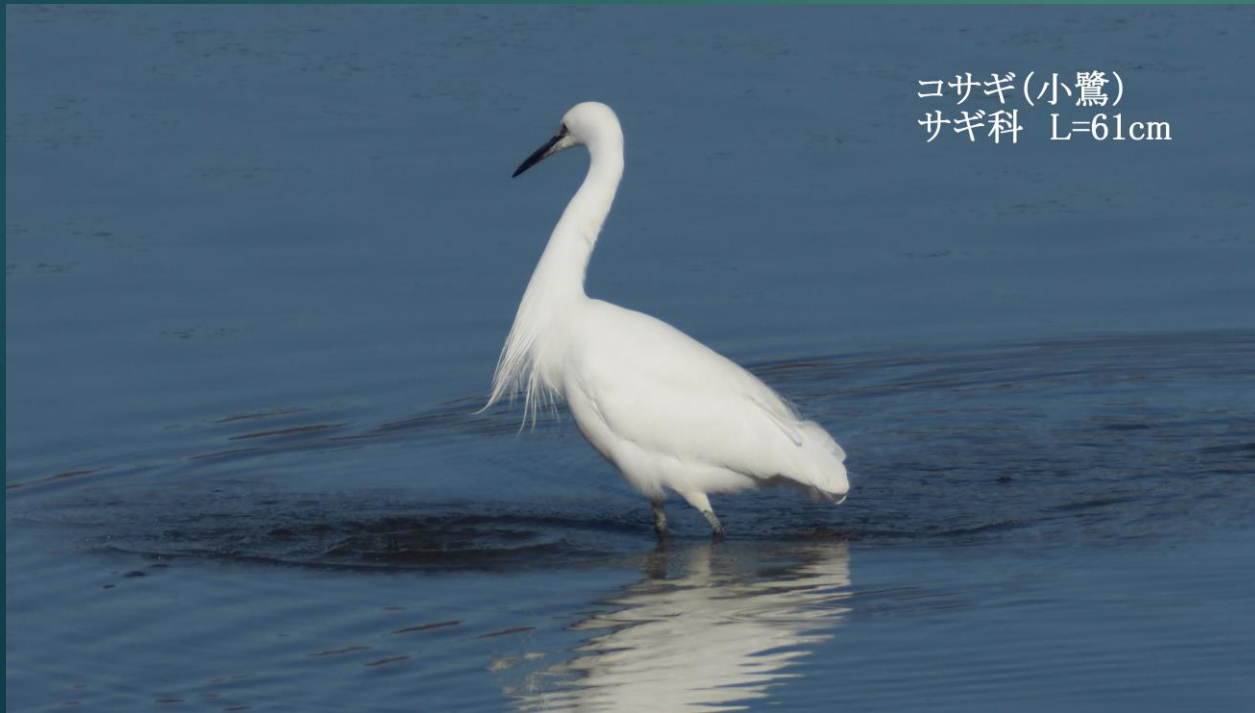
コサギ(小鷺) サギ科 L=61cm