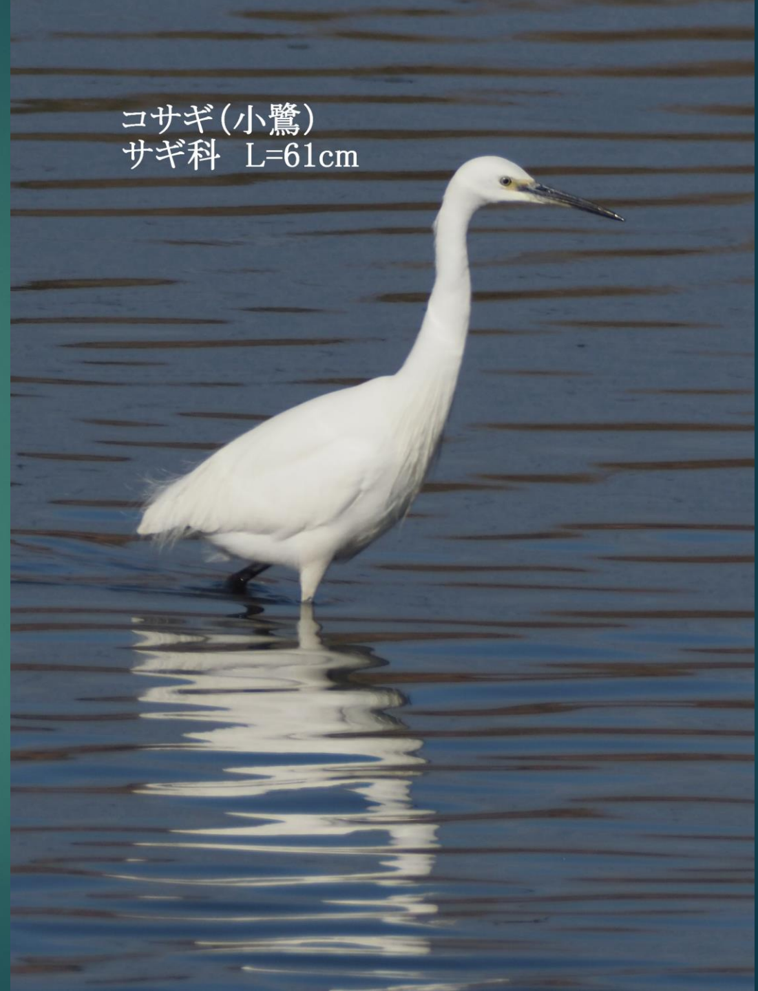
コサギ(小鷺) サギ科 L=61cm