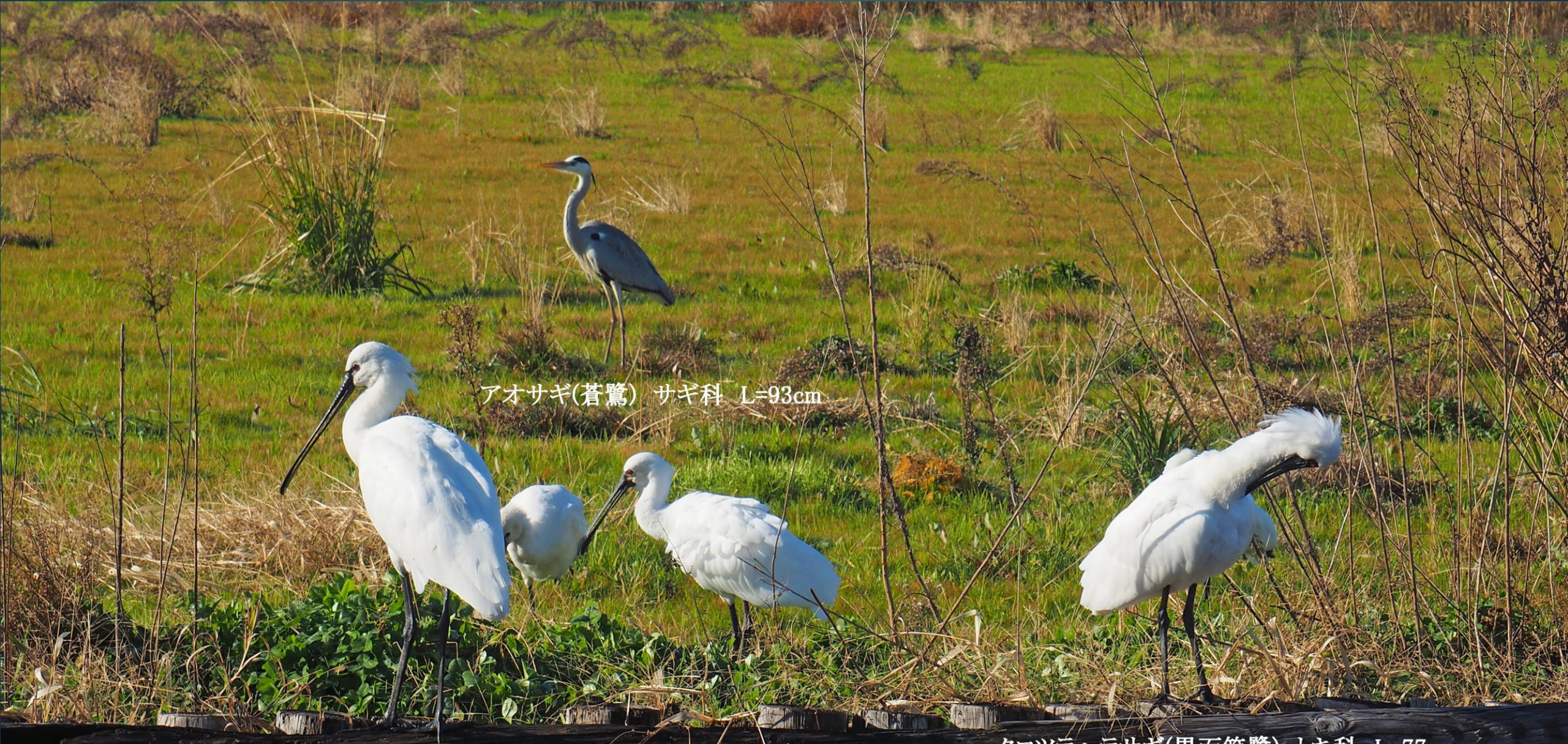
アオサギ(蒼鷺) サギ科 L=93cm