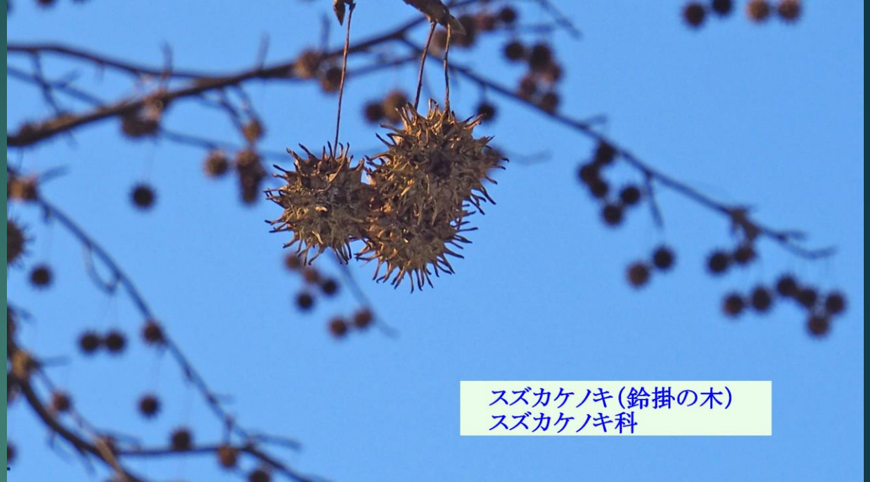
スズカケノキ (鈴掛の木) スズカケノキ科