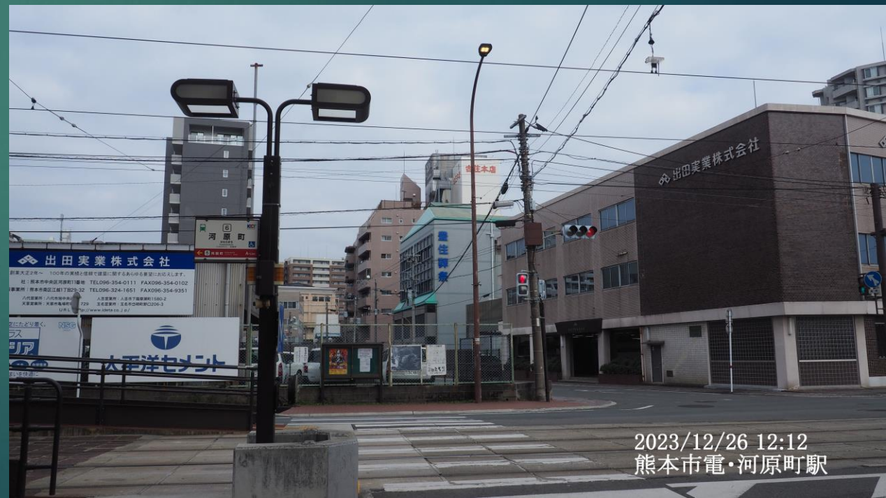
2023/12/26 12:12 熊本市電・河原町駅