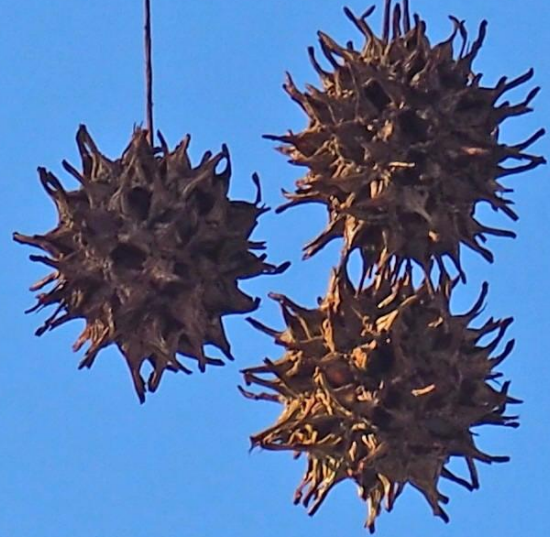
スズカケノキ (鈴掛の木) スズカケノキ科