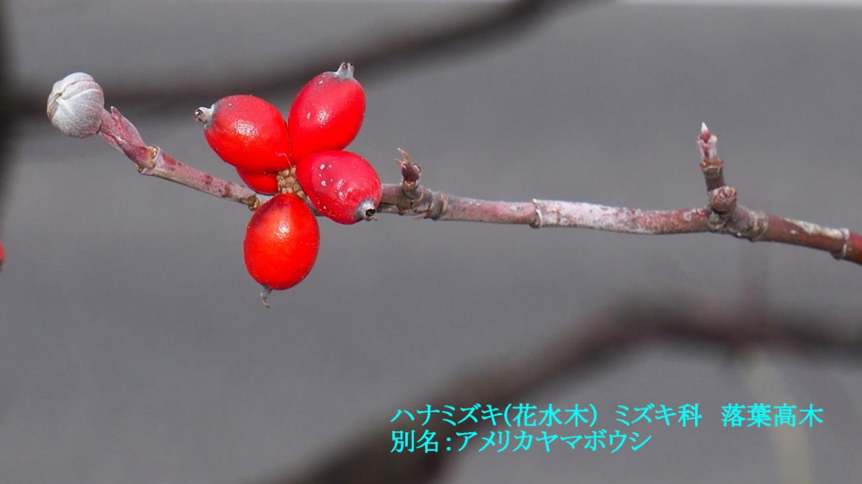
ハナミズキ(花水木) ミズキ科 落葉高木 別名:アメリカヤマボウシ