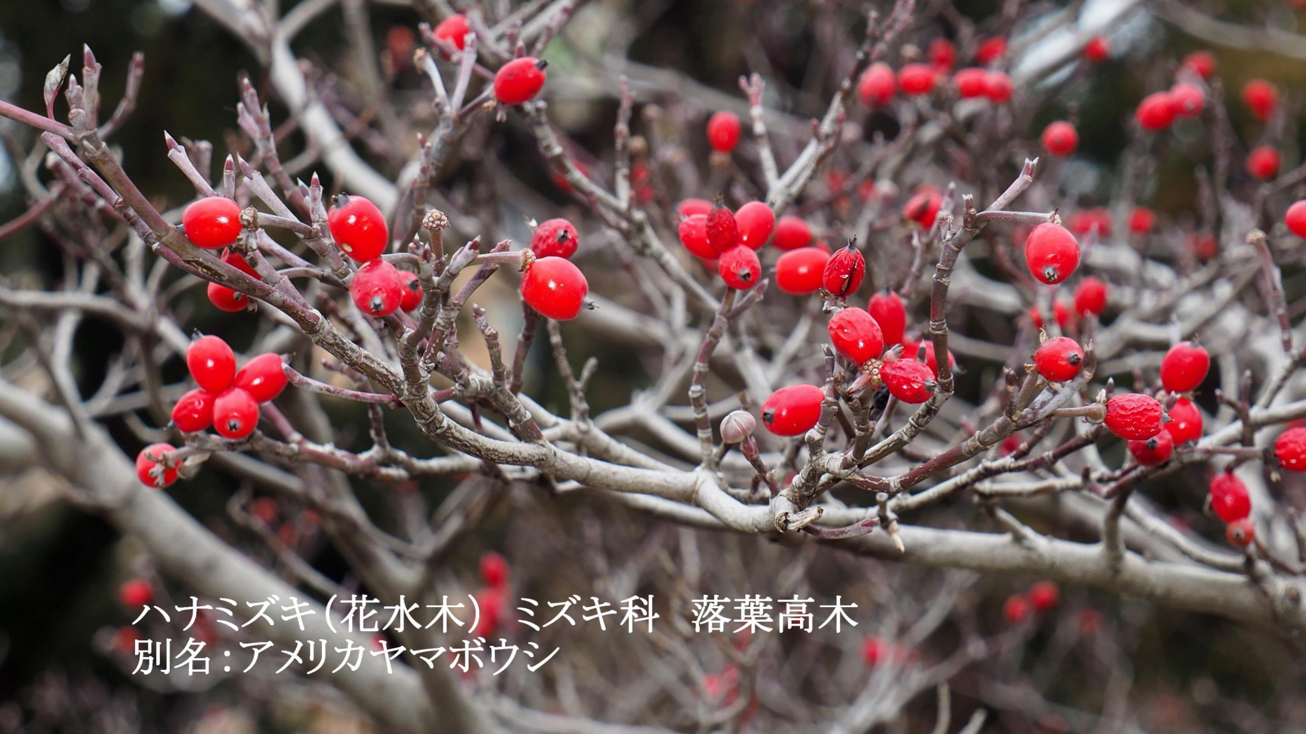
ハナミズキ(花水木) ミズキ科 落葉高木 別名:アメリカヤマボウシ