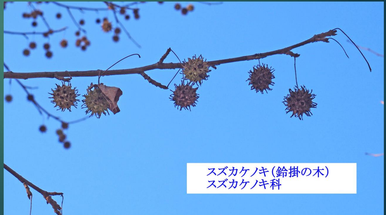
スズカケノキ (鈴掛の木) スズカケノキ科