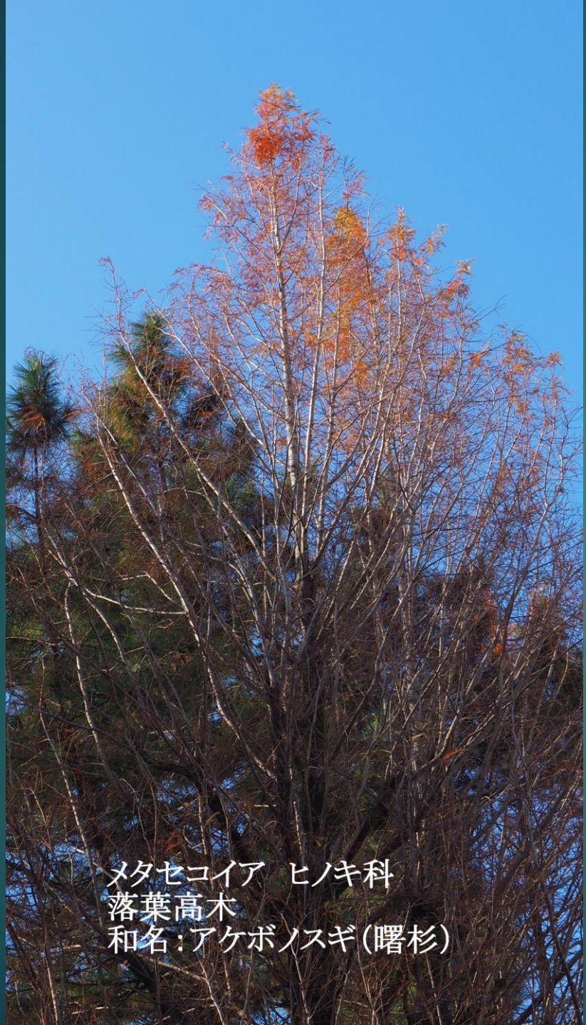
メタセコイア ヒノキ科 落葉高木 和名:アケボノスギ(曙杉)