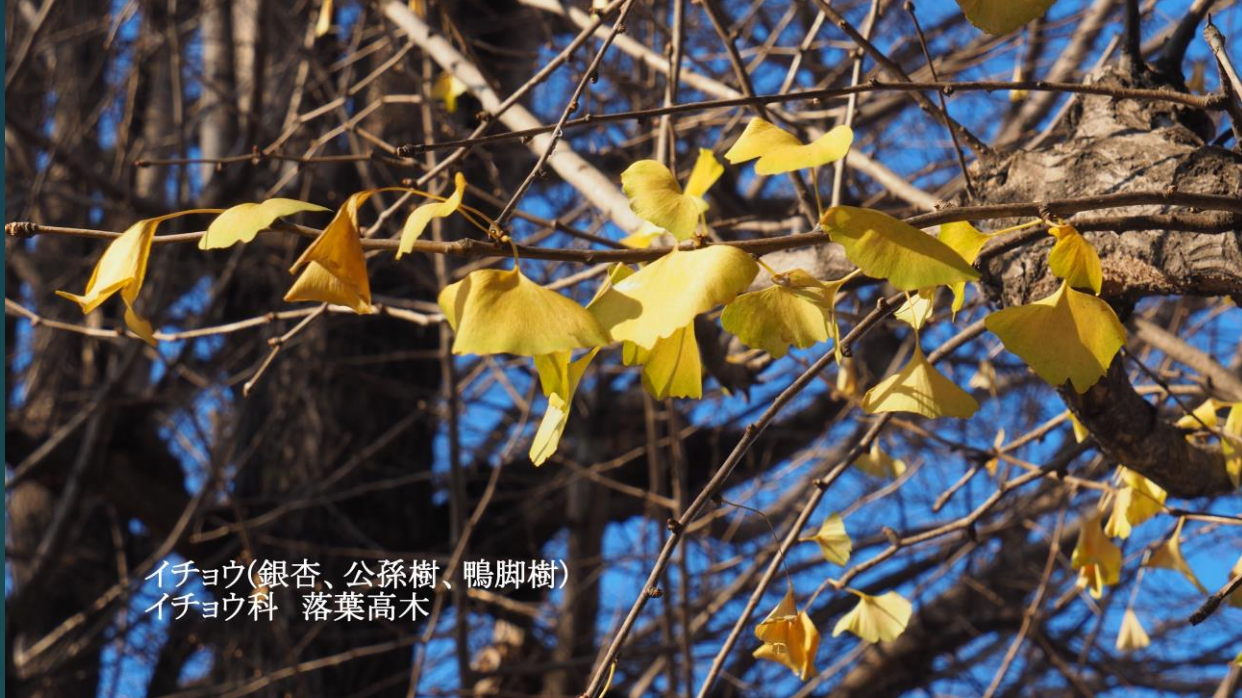
イチョウ(銀杏、公孫樹、鴨脚樹) イチョウ科 落葉高木