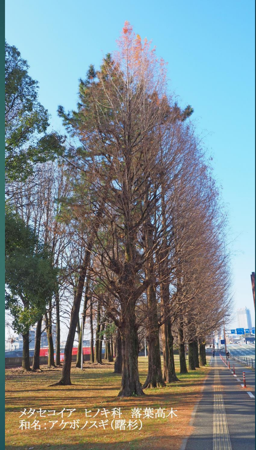
メタセコイア ヒノキ科 落葉高木 和名:アケボノスギ(曙杉)