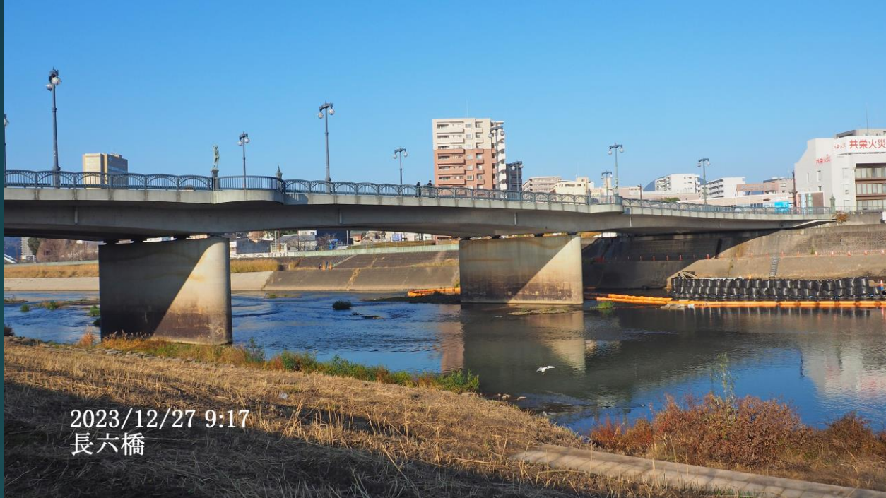
2023/12/27 9:17 長六橋