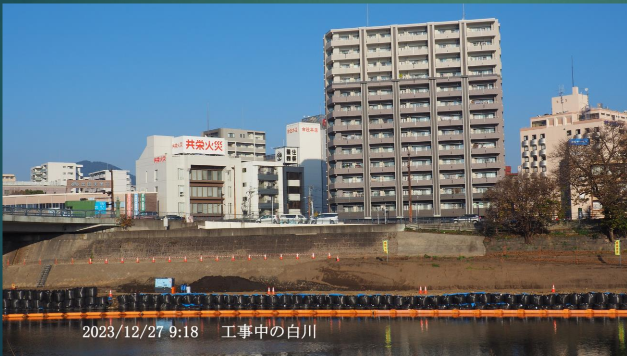
2023/12/27 9:18 工事中の白川