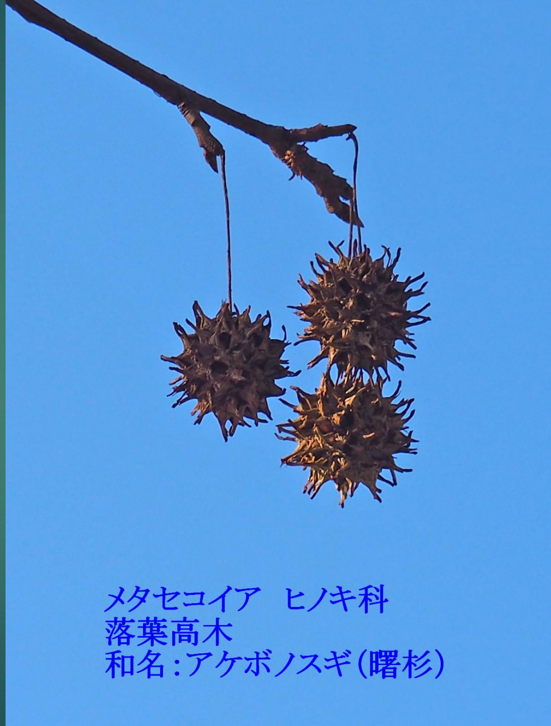
メタセコイア ヒノキ科 落葉高木 和名:アケボノスギ(曙杉)