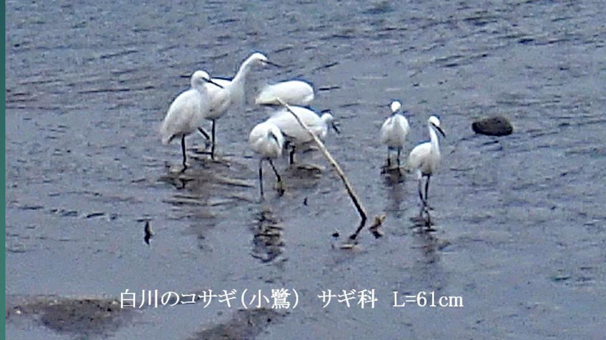
白川のコサギ(小鷺) サギ科 L=61cm