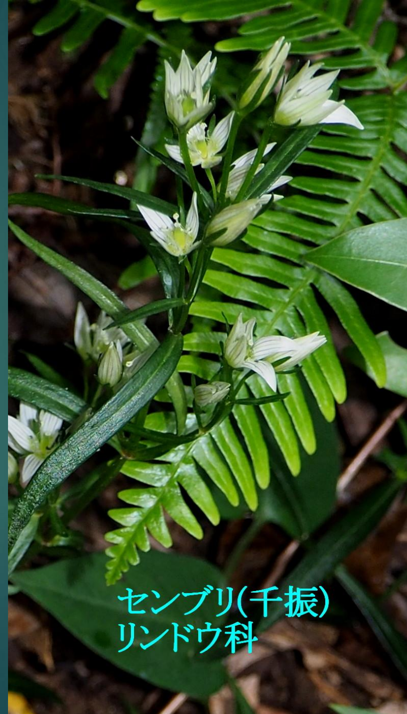
センブリ(千振) リンドウ科