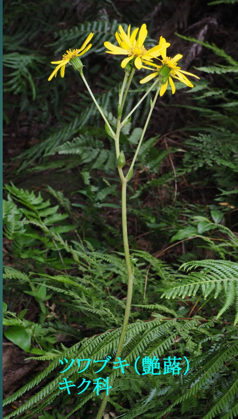
ツワブキ(艶薔) キク科