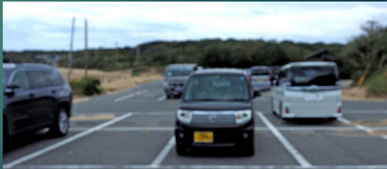
2023/11/12 11:05 芥屋第二駐車場に到着 1時間46分の行動時間