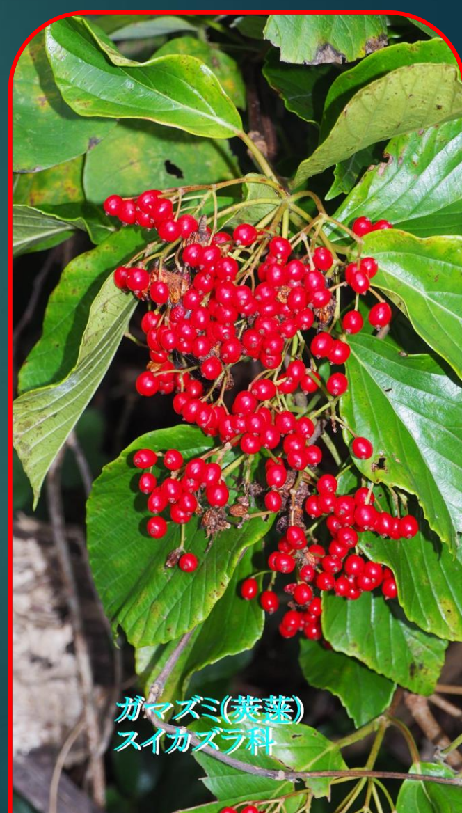
ガマズミ(菘蓐) スイカズラ科