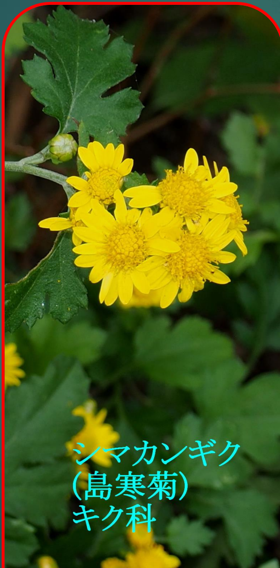
シマカンギク (島寒菊) キク科