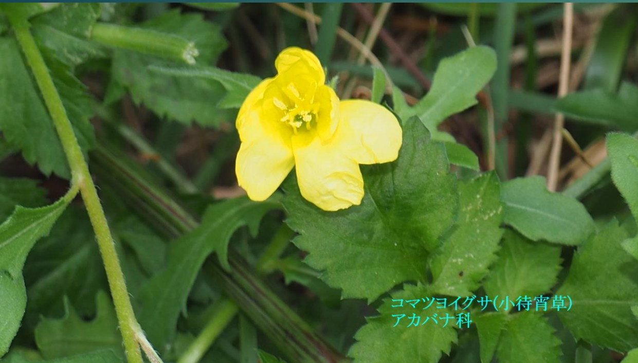
コマツヨイグサ(小待宵草) アカバナ科