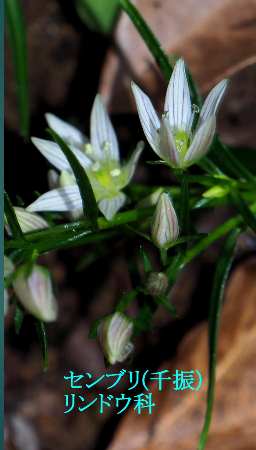
センブリ(千振) リンドウ科