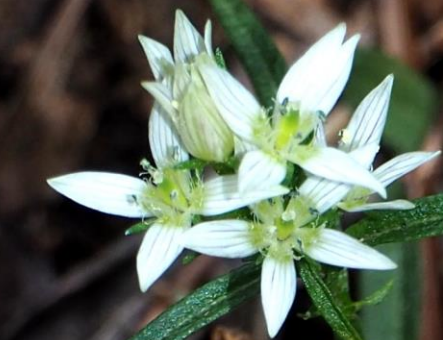
センブリ(千振) リンドウ科