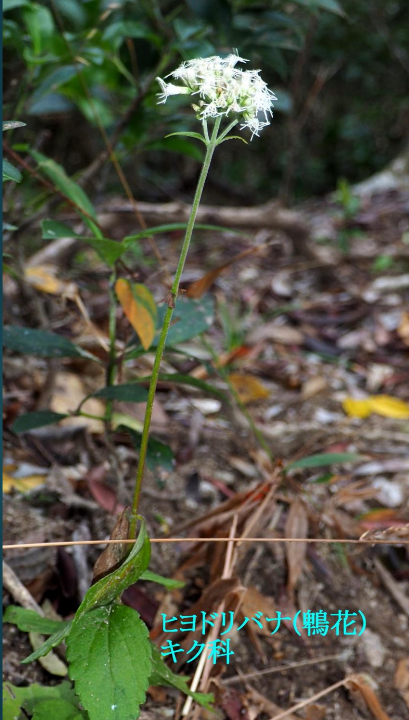
ヒヨドリバナ(鶉花) キク科