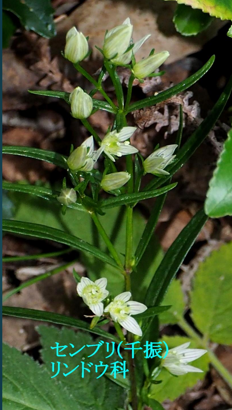
センブリ(千振) リンドウ科