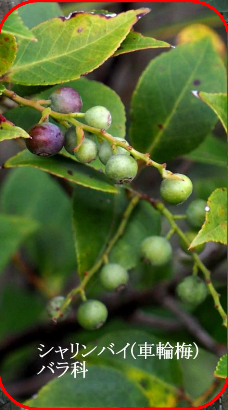
シャリンバイ(車輪梅) バラ科