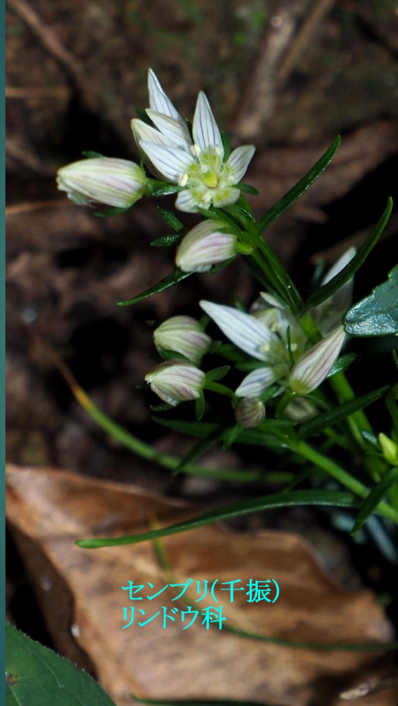
センブリ(千振) リンドウ科