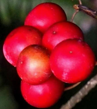
サルトリイバラ (猿捕茨) サルトリイバラ科