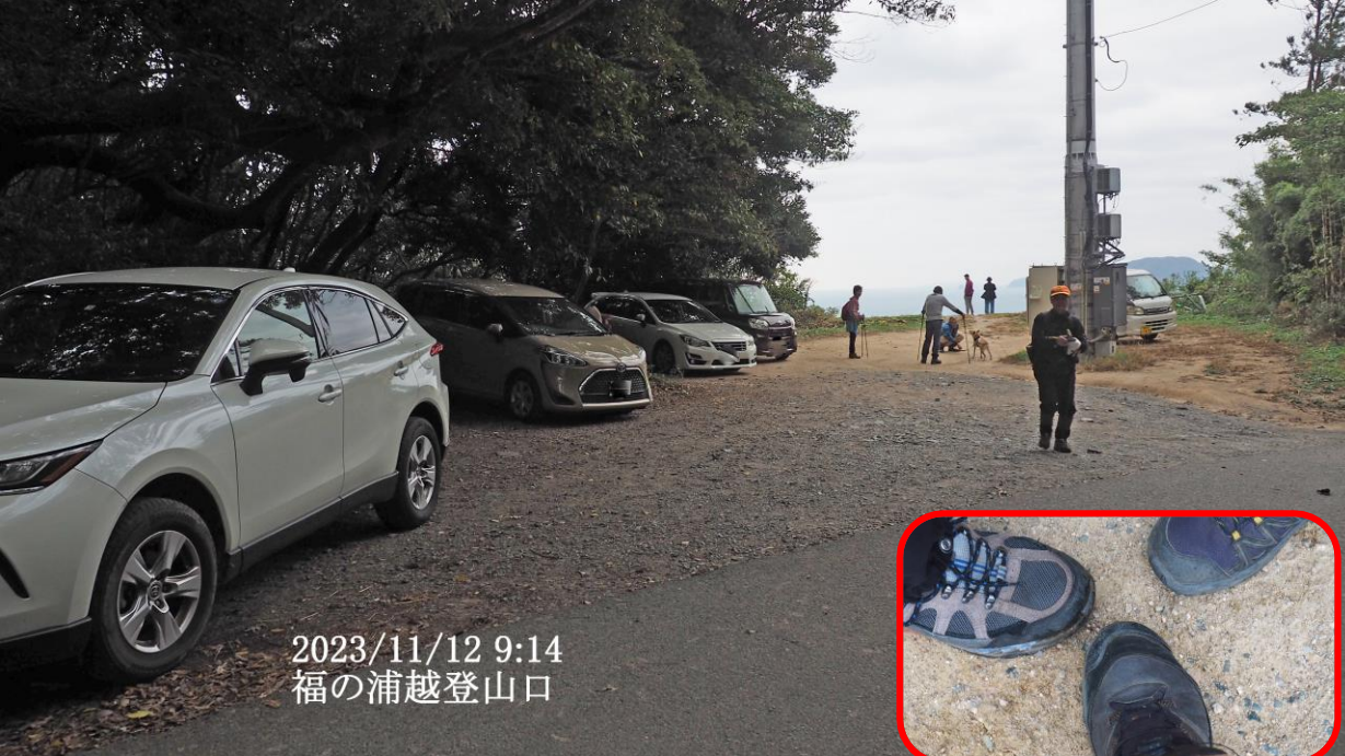
2023/11/12 9:14 福の浦越登山口