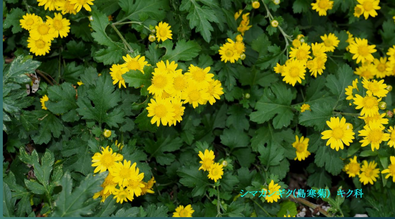
シマカンギク(島寒菊) キク科