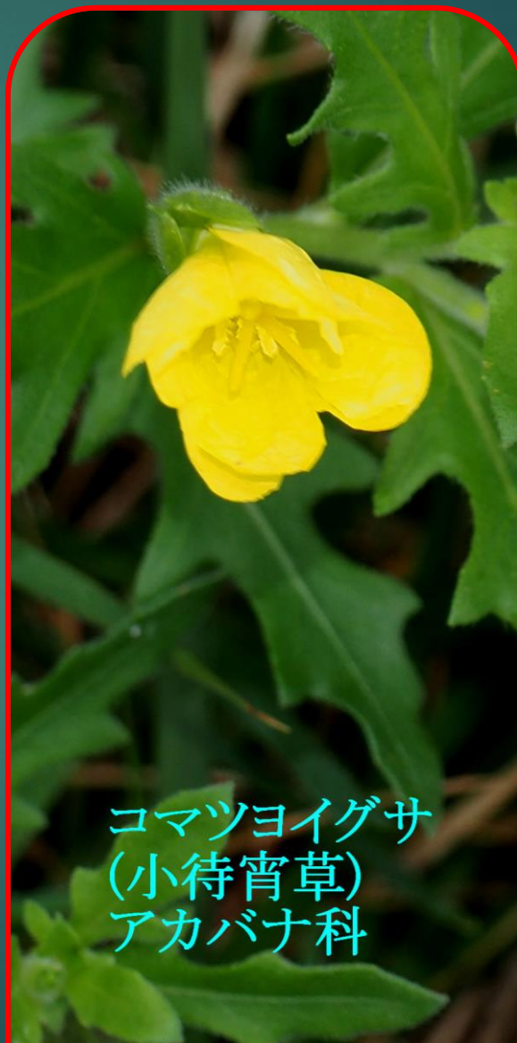
コマツヨイグサ (小待宵草) アカバナ科