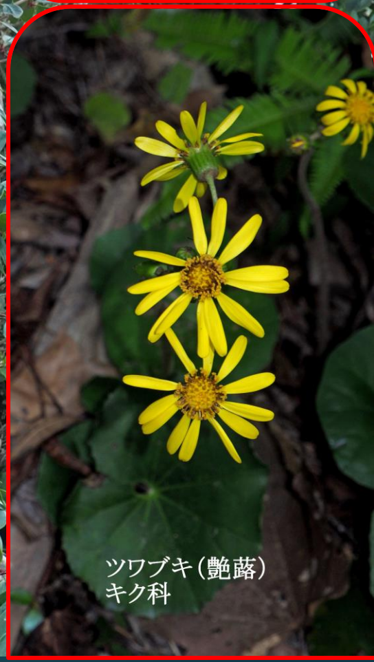
ツワブキ(艶蔭) キク科