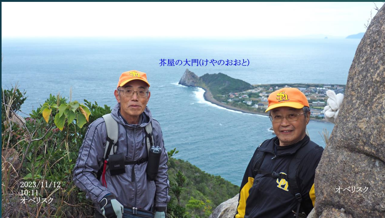
芥屋の大門(けやのおおと)