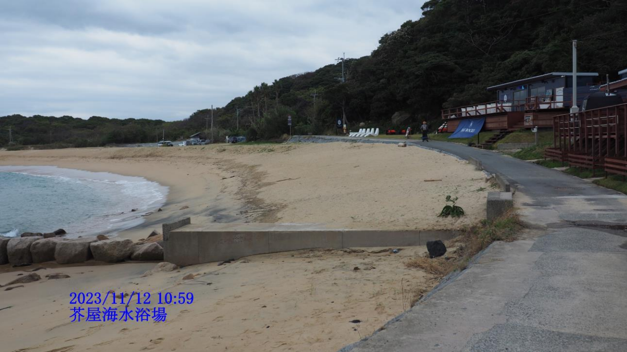
2023/11/12 10:59 芥屋海水浴場