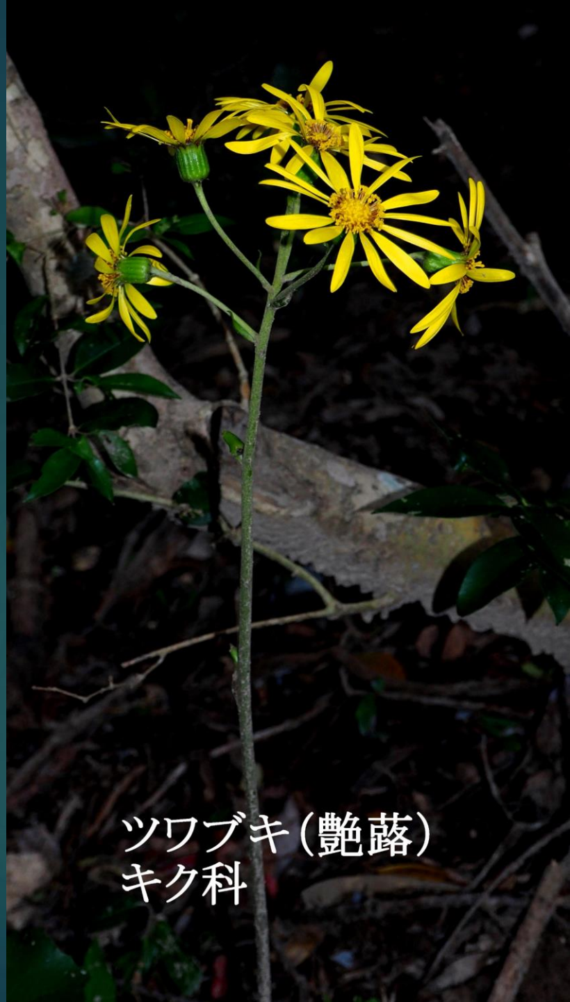
ツワブキ(艶蔭) キク科