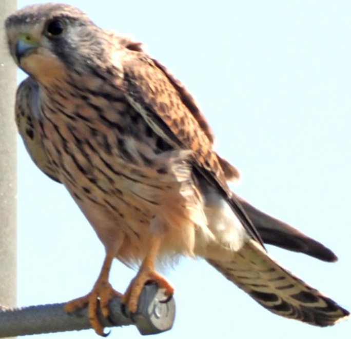
チョウゲンボウ(長元坊) ハヤブサ科 L=メス39cm