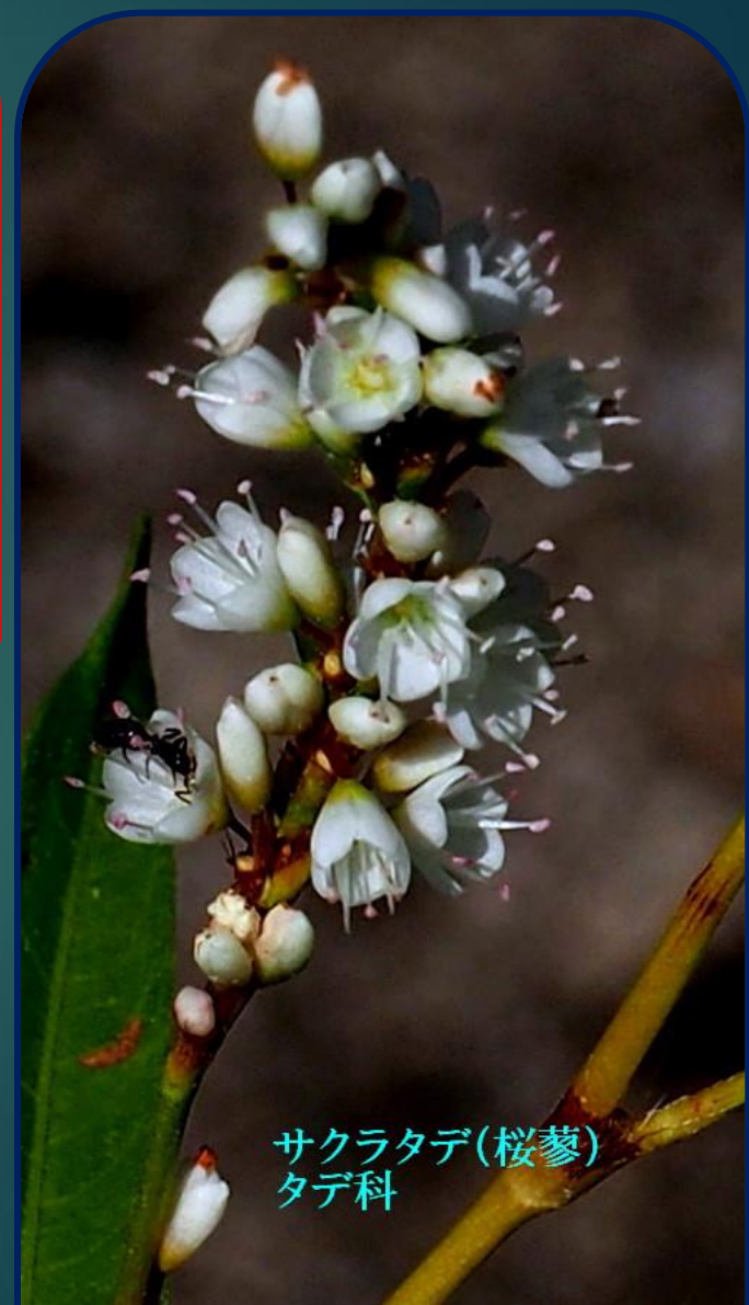
サクラタデ(桜蓼) タデ科