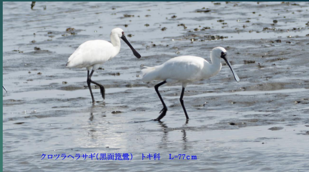
クロツラヘラサギ(黒面篋鷺) トキ科 L=77cm