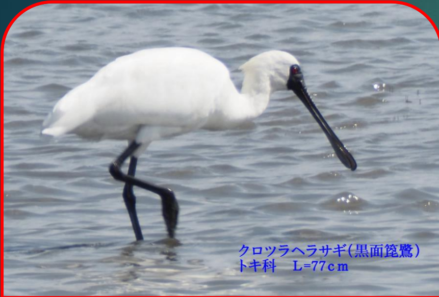
クロツラヘラサギ(黒面篋鷺) トキ科 L=77cm