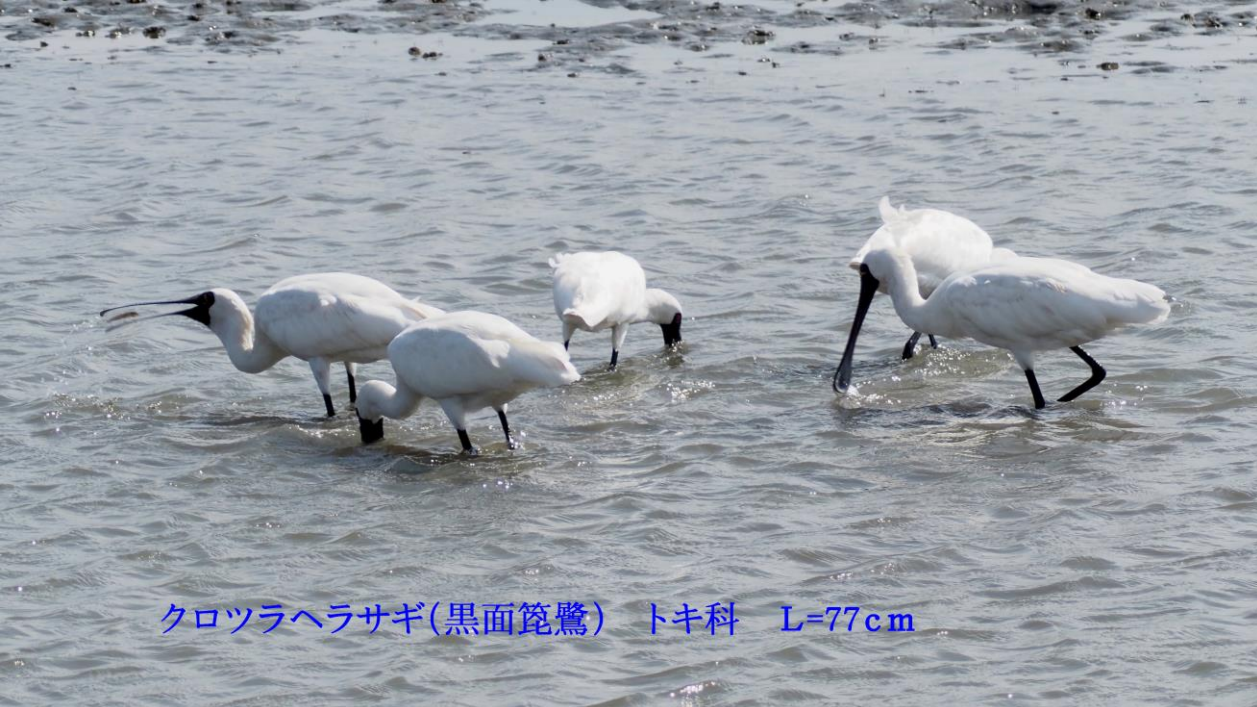
クロツラヘラサギ(黒面篋鷺) トキ科 L=77cm