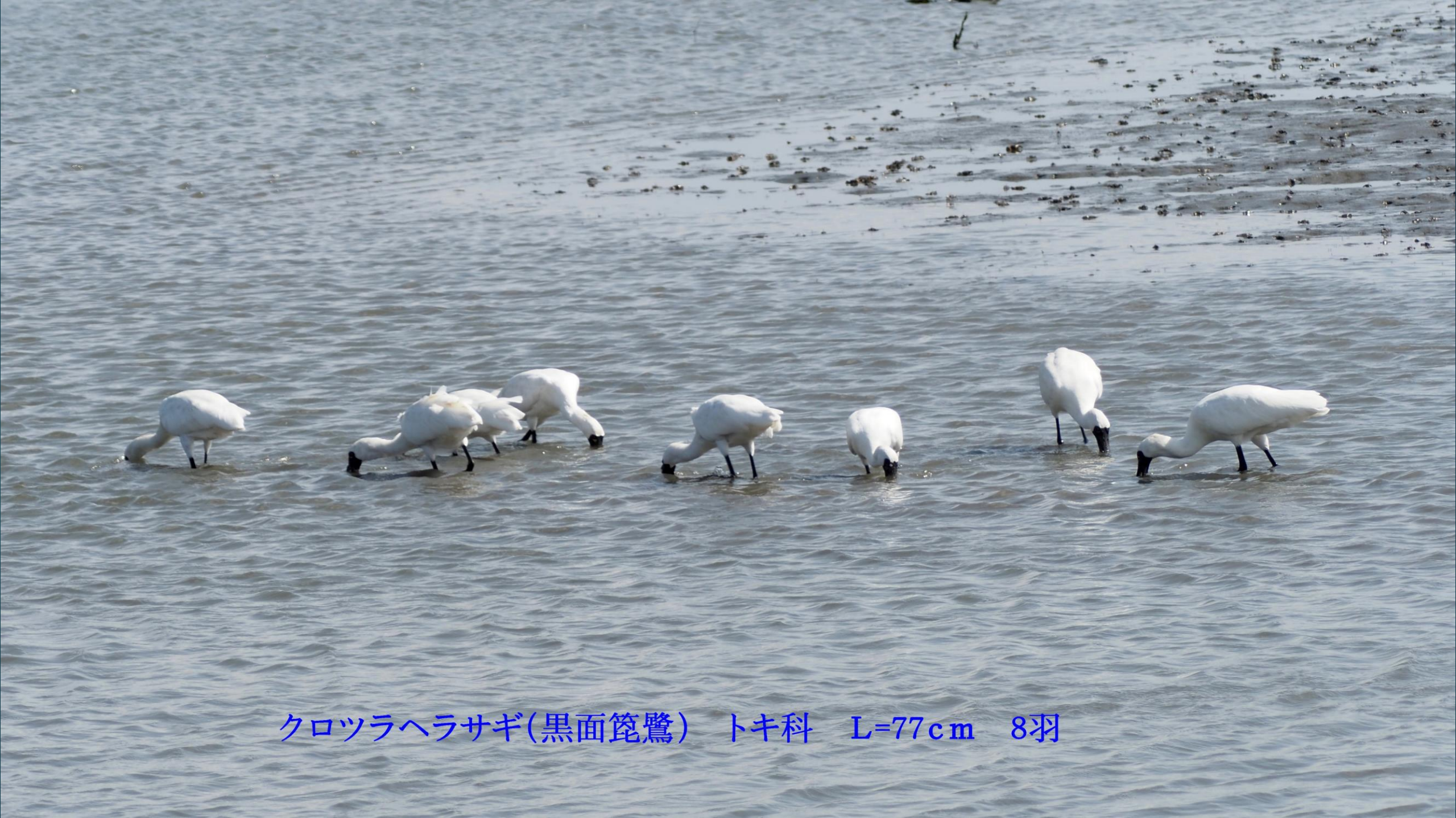
クロツラヘラサギ(黒面篋鷺) トキ科 L=77cm 8羽