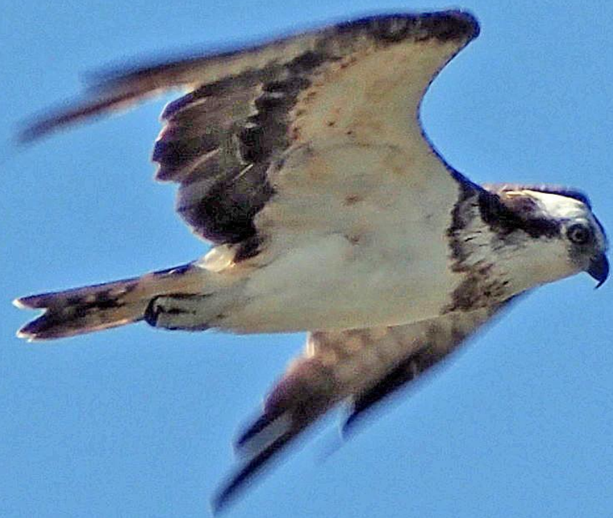
ミサゴ（鵟） ワシタカ科 L=メス64cm