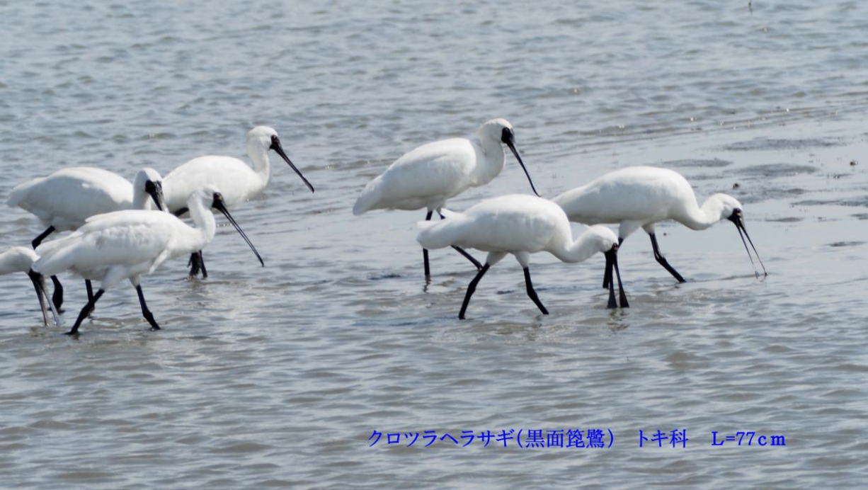
クロツラヘラサギ(黒面篋鷺) トキ科 L=77cm