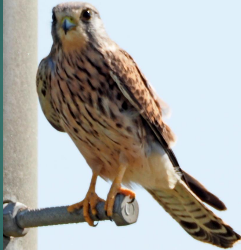
チョウゲンボウ(長元坊) ハヤブサ科 L=メス39cm