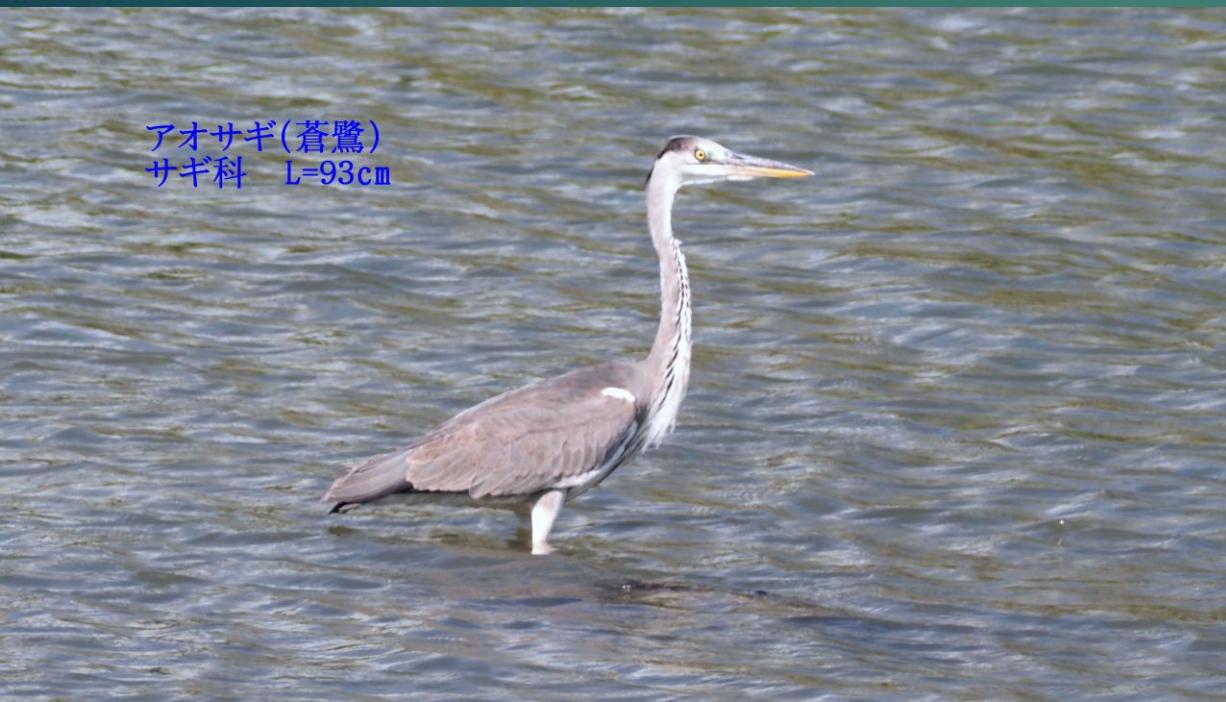
アオサギ(蒼鷺) サギ科 L=93cm