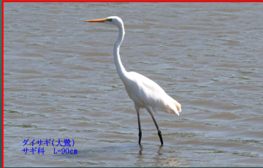
ダイサギ(大鷺) サギ科 L=90cm