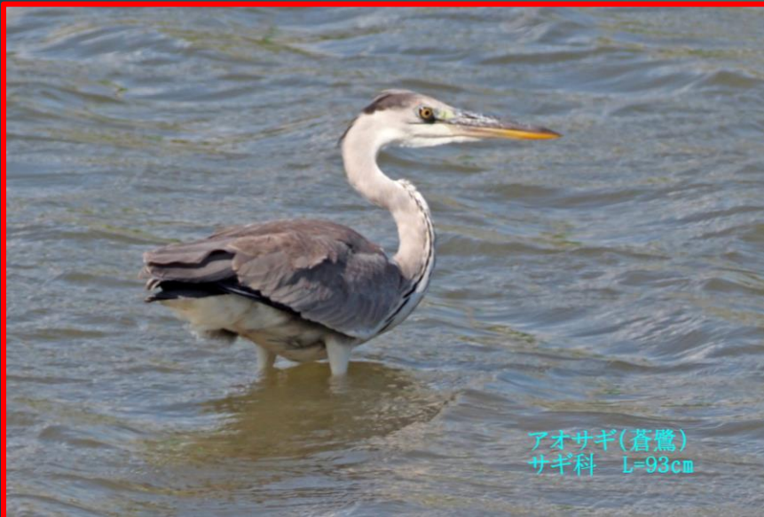
アオサギ(蒼鷺) サギ科 L=93cm