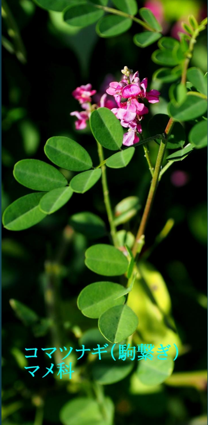
コマツナギ(駒繫ぎ) マメ科