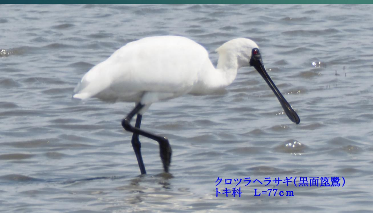
クロツラヘラサギ(黒面篋鷺) トキ科 L=77cm