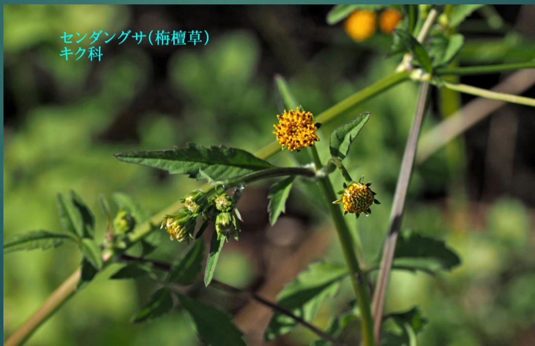
センダングサ(梅檀草) キク科