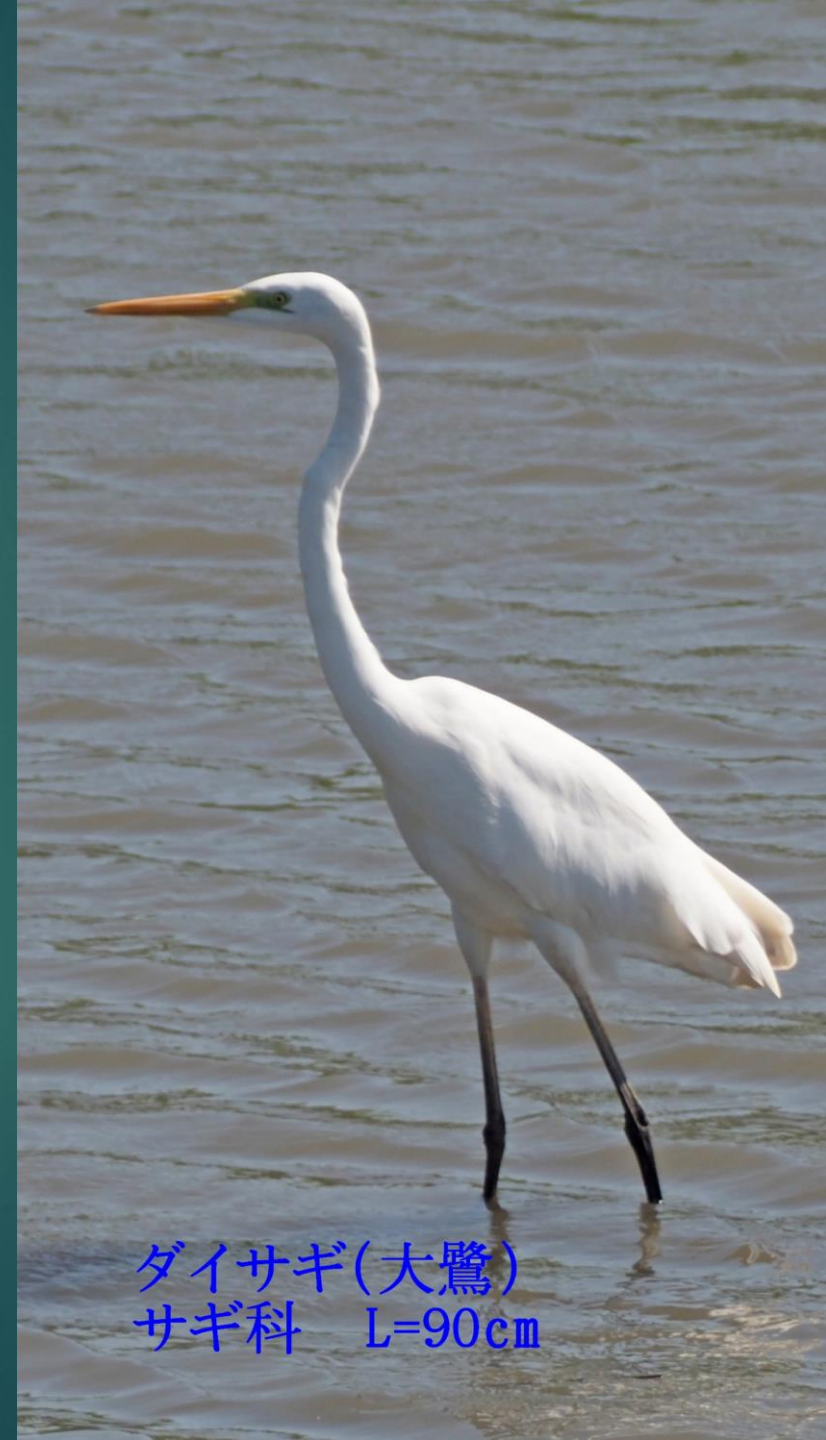
ダイサギ(大鷺) サギ科 L=90cm