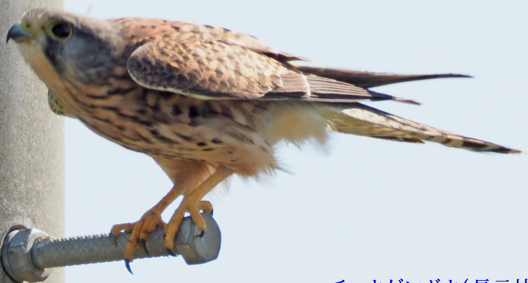
チョウゲンボウ(長元坊) ハヤブサ科 L=メス39cm