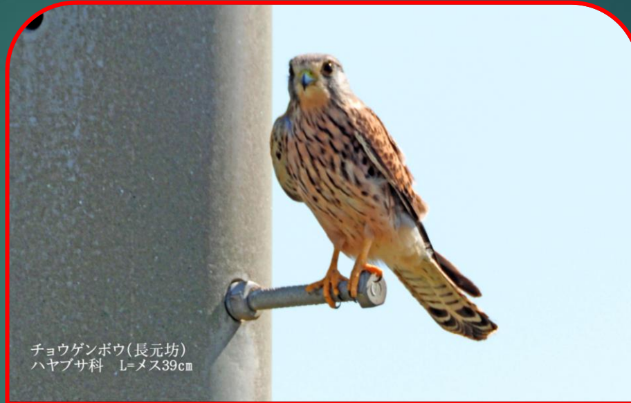
チョウゲンボウ(長元坊) ハヤブサ科 L=メス39cm