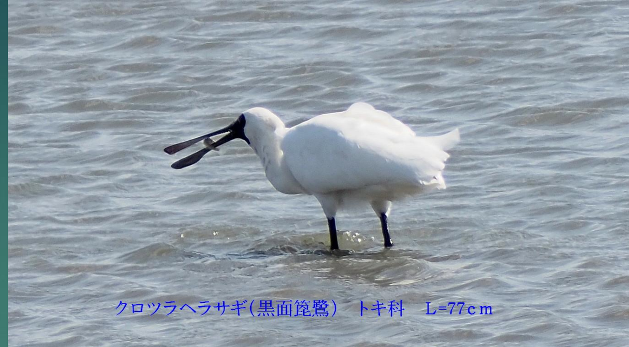
クロツラヘラサギ(黒面篋鷺) トキ科 L=77cm