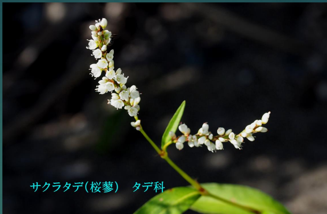
サクラタデ(桜蓼) タデ科