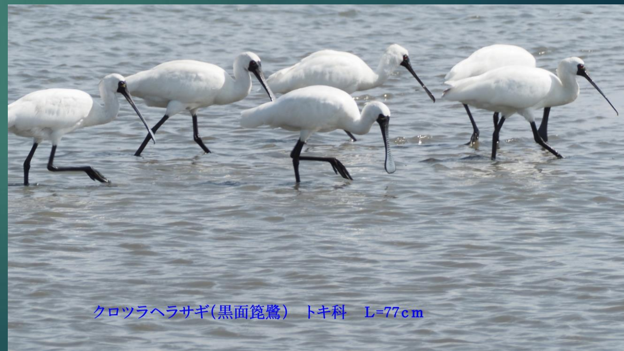
クロツラヘラサギ(黒面篋鷺) トキ科 L=77cm