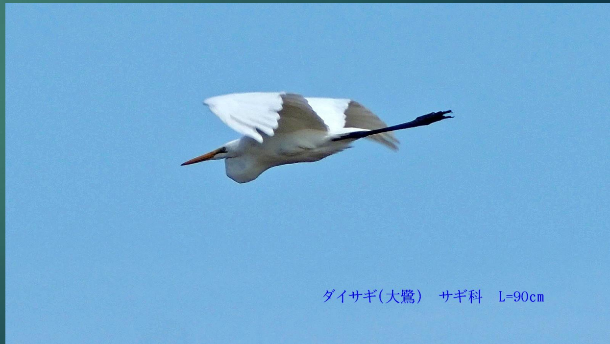
ダイサギ(大鷺) サギ科 L=90cm