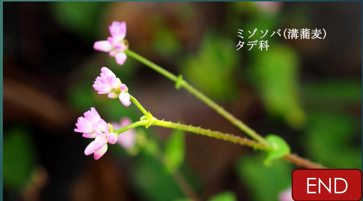
ミゾソバ (溝蕎麦) タデ科