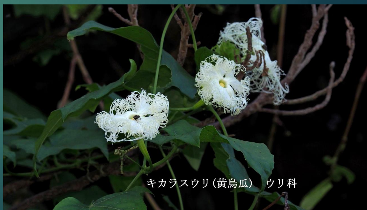
キカラスウリ(黄烏瓜) ウリ科