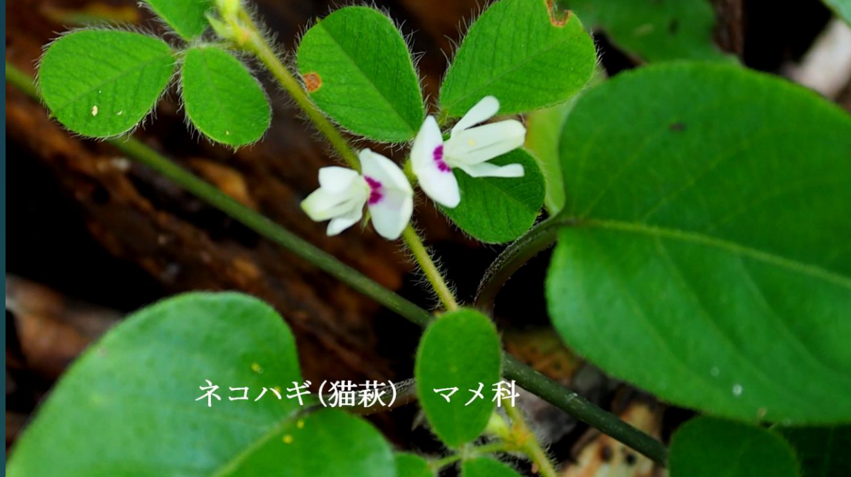
ネコハギ(猫萩) マメ科