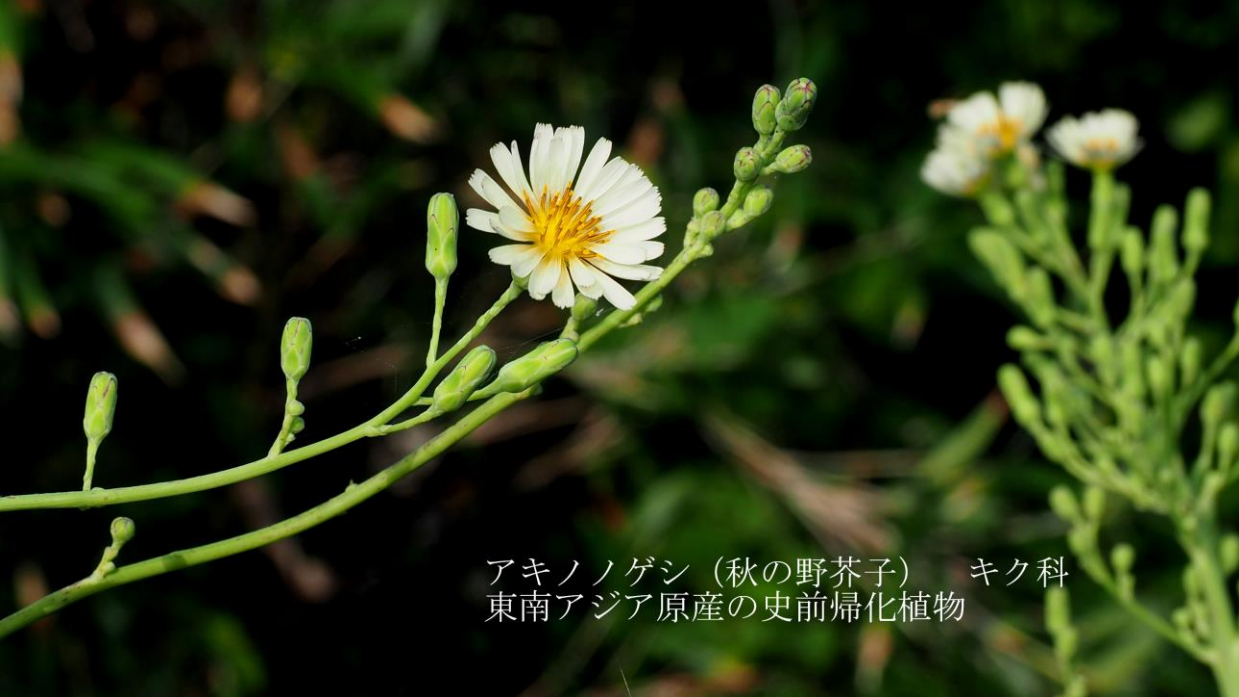
アキノノゲシ (秋の野芥子) キク科 東南アジア原産の史前帰化植物