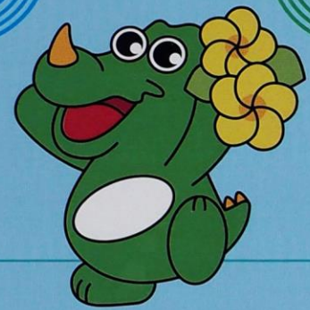
糸島市イメージキャラクター「いとゴン」