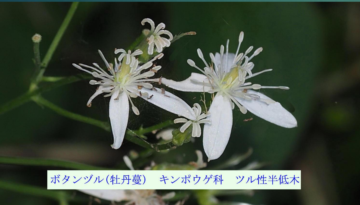
ボタンヅル(牡丹蔓) キンポウゲ科 ツル性半低木