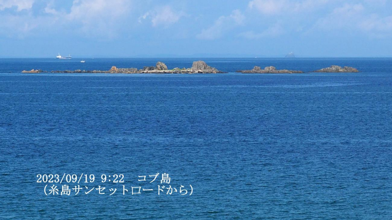
2023/09/19 9:22 コブ島 (糸島サンセットロードから)