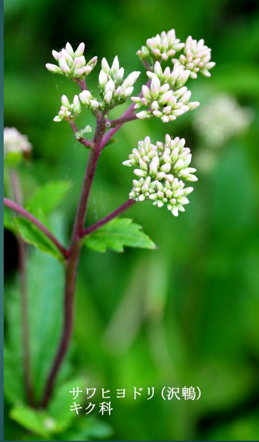
サワヒヨドリ(沢鶴) キク科