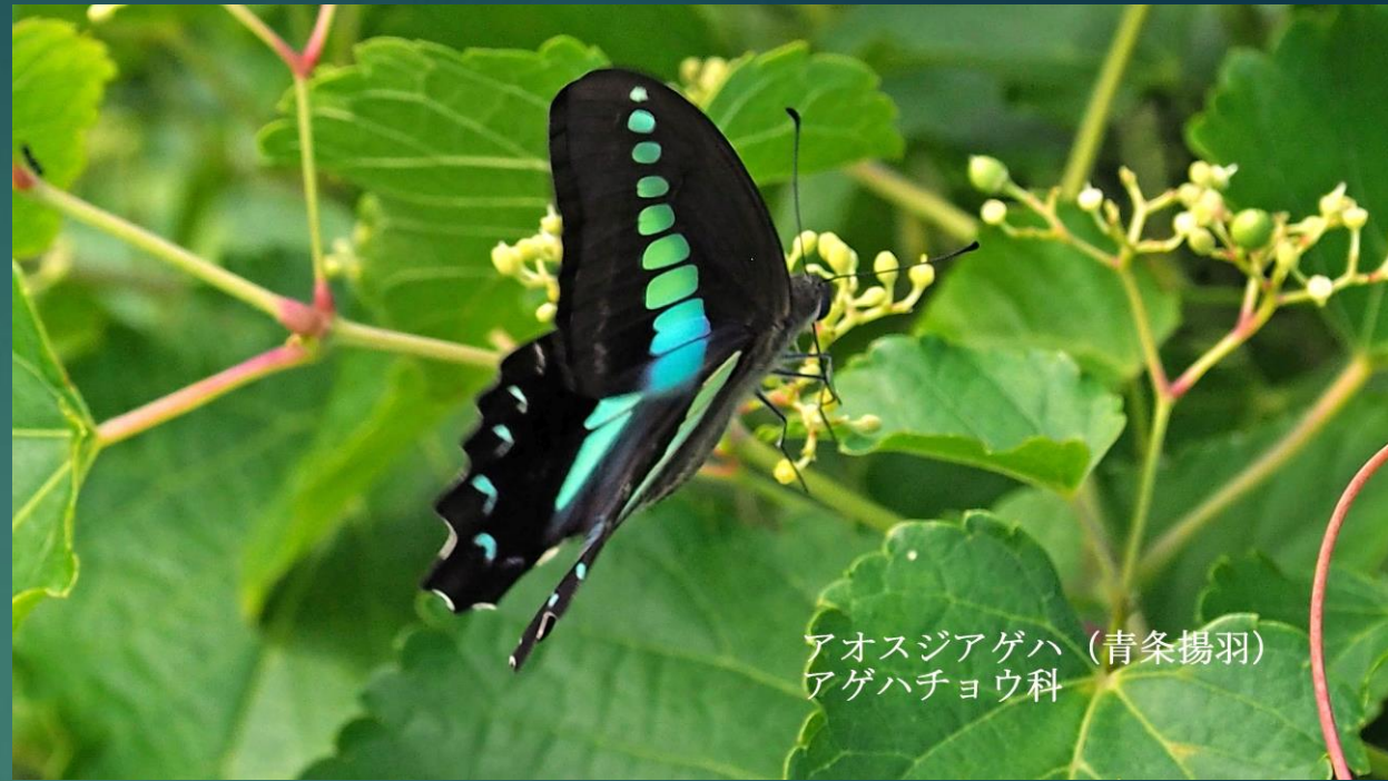
アオスジアゲハ (青条揚羽) アゲハチョウ科