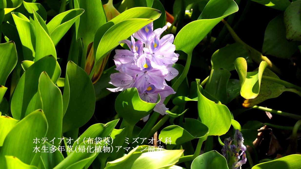
ホテイアオイ(布袋葵) ミズアオイ科 水生多年草(帰化植物)アマゾン原産