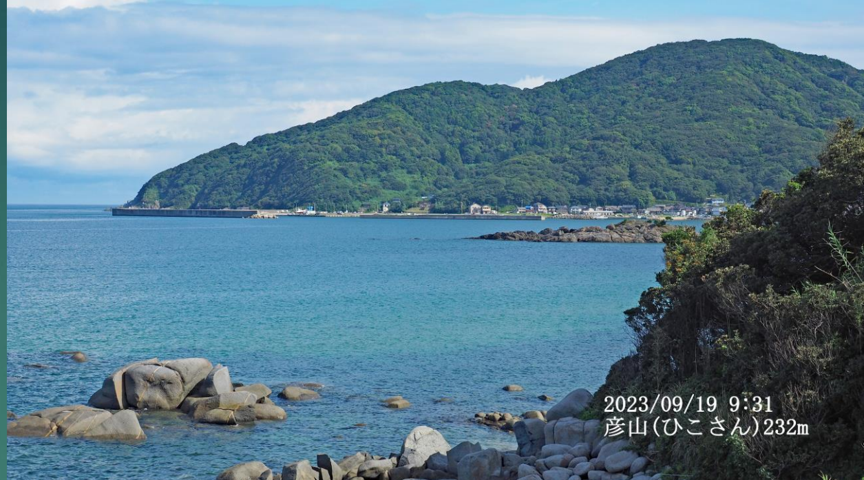
2023/09/19 9:31 彦山(ひこさん)232m