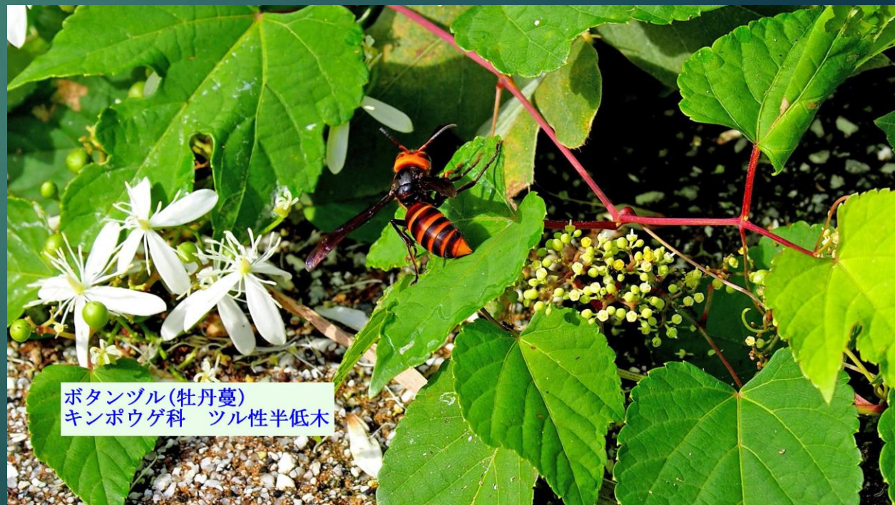
ボタンヅル(牡丹蔓) キンポウゲ科 ツル性半低木