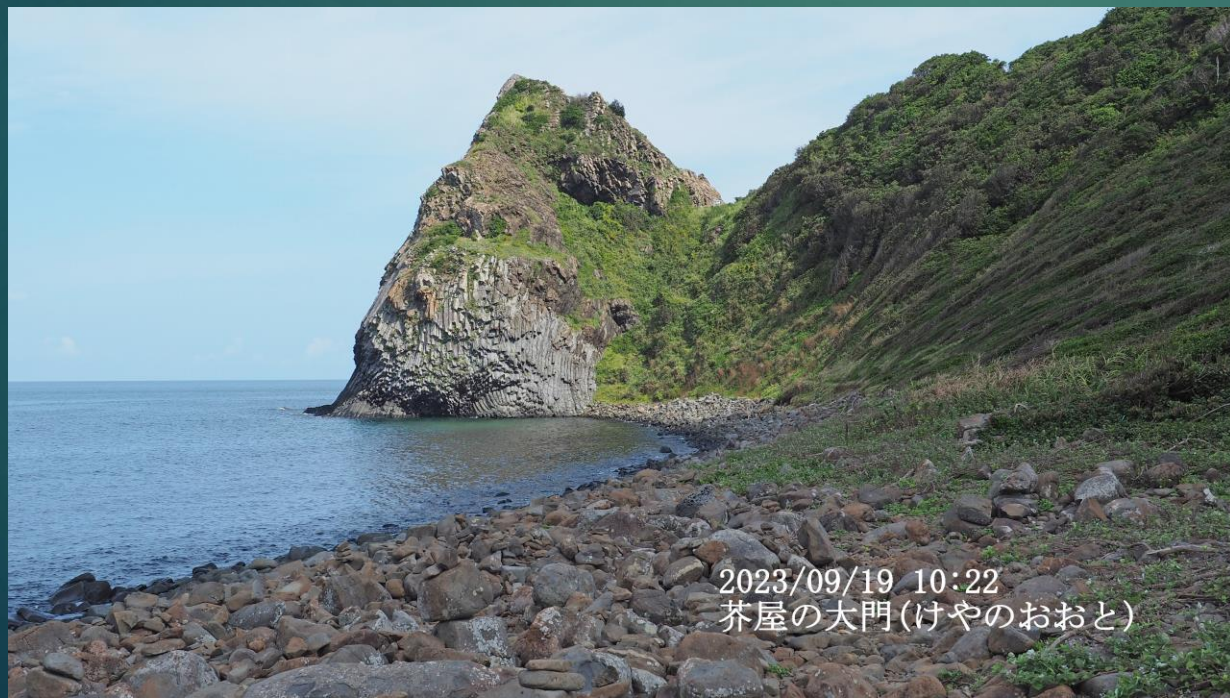
2023/09/19 10:22 茶屋の大門(けやのおと)