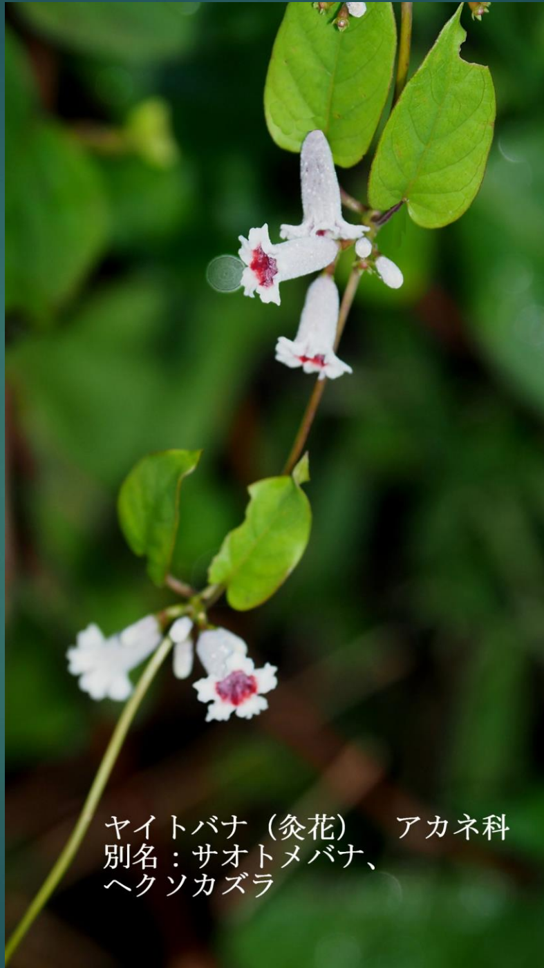
ヤイトバナ (灸花) アカネ科 別名: サオトメバナ、 ヘクソカズラ