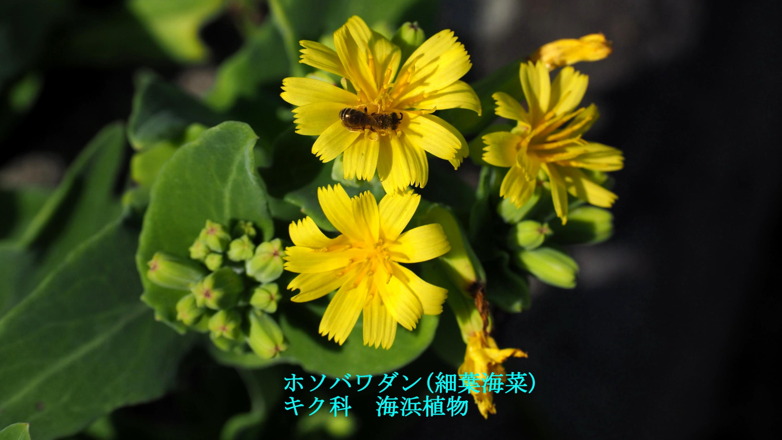
ホソバワダン(細葉海菜) キク科 海浜植物