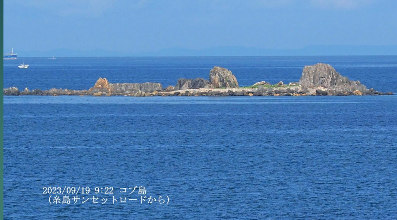
2023/09/19 9:22 コブ島 (糸島サンセットロードから)