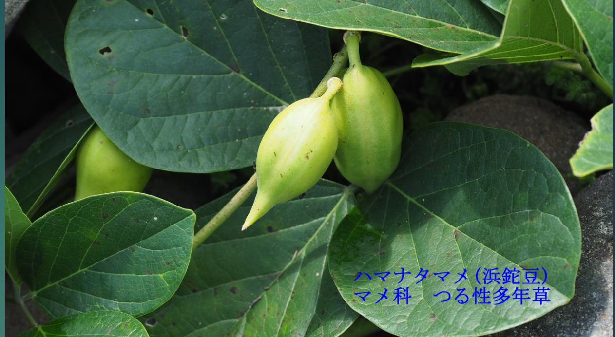
ハマナタマメ (浜鈍豆) マメ科 つる性多年草