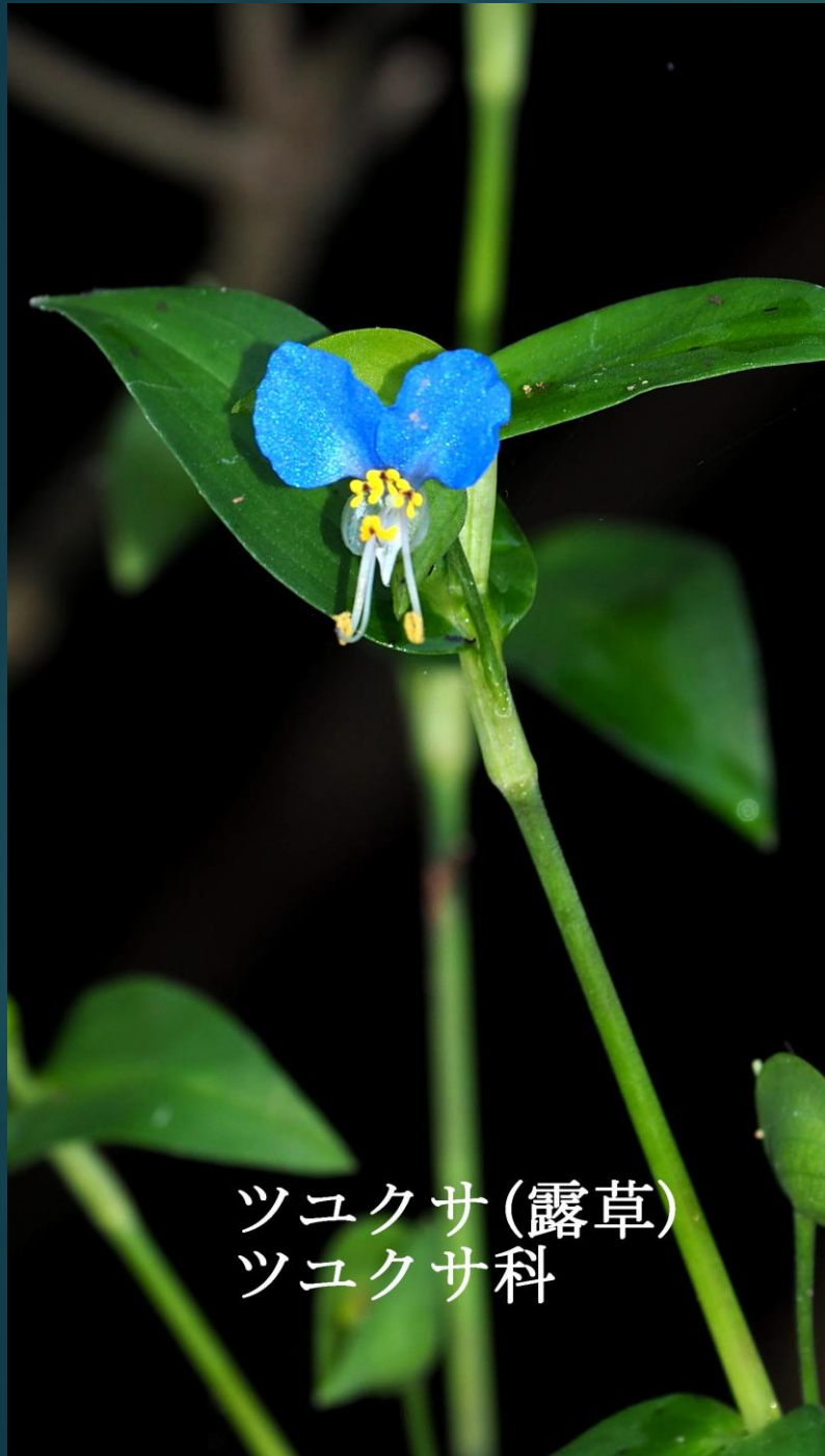
ツユクサ (露草) ツユクサ科