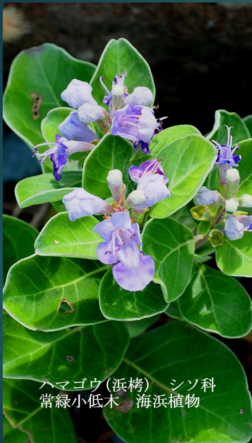
ハマゴウ (浜栲) シソ科 常緑小低木 海浜植物