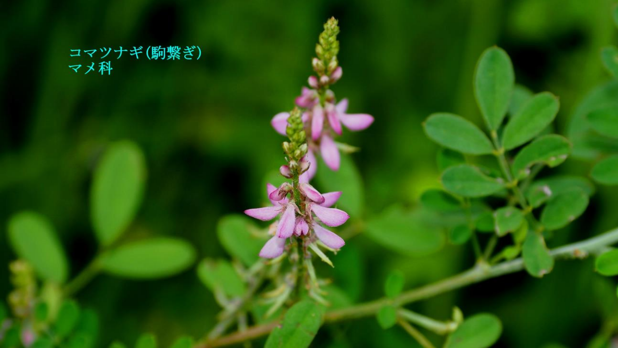
コマツナギ(駒繋ぎ) マメ科