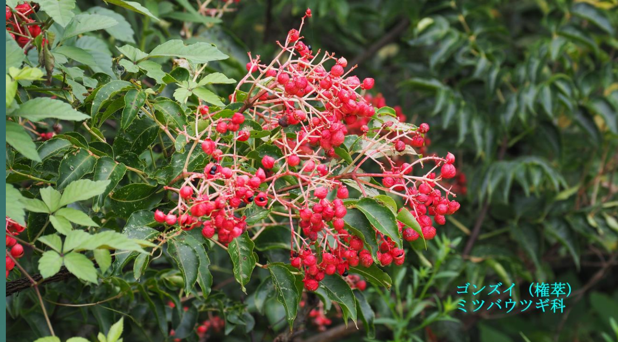
ゴンズイ (権葎) ミツバウツギ科