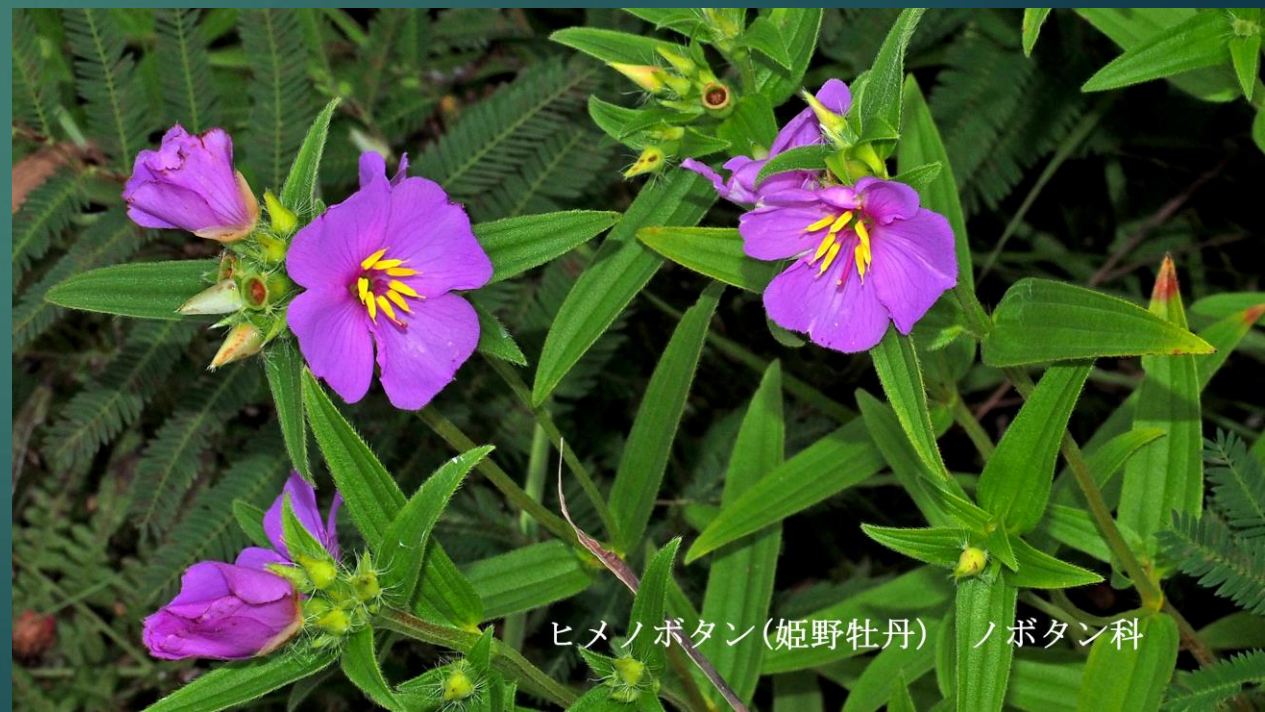
ヒメノボタン(姫野牡丹) ノボタン科