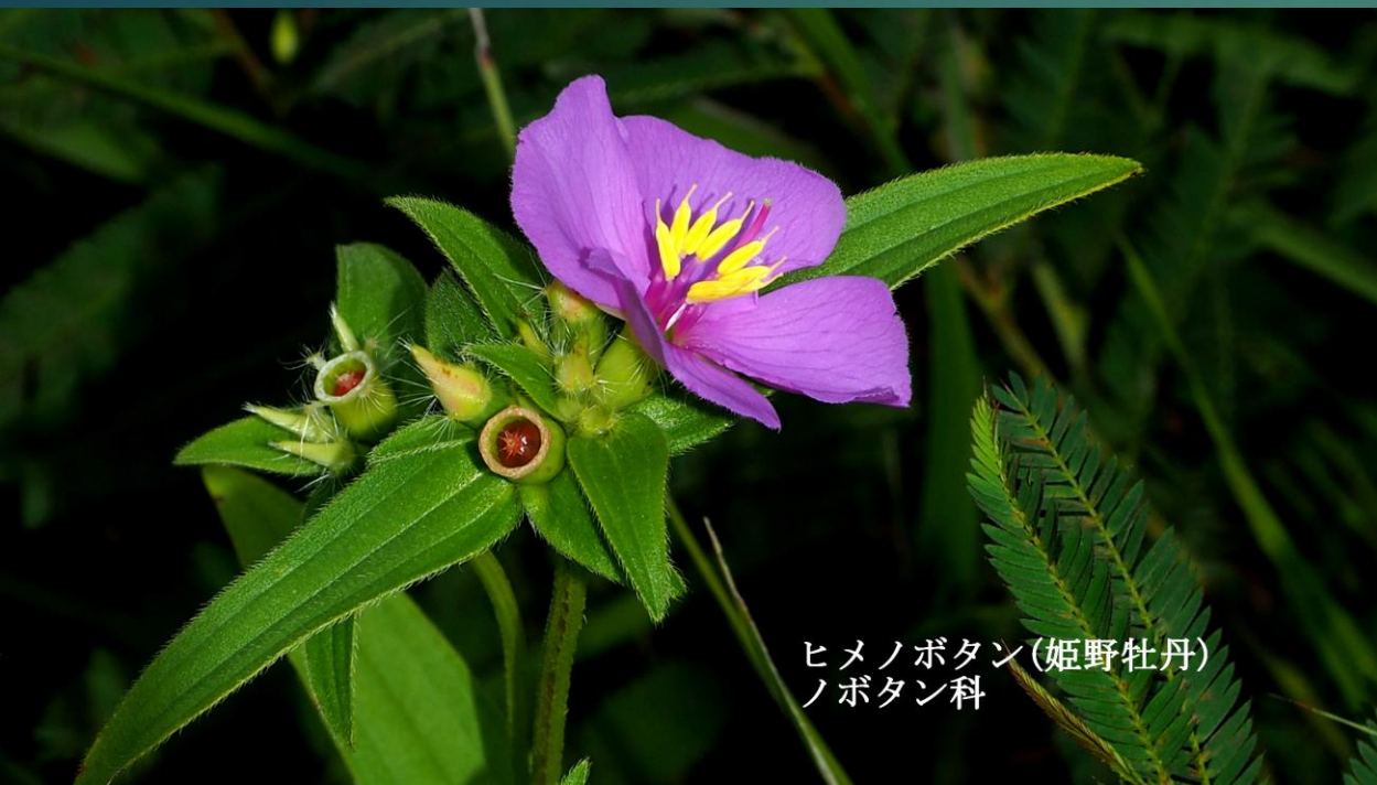
ヒメノボタン(姫野牡丹) ノボタン科