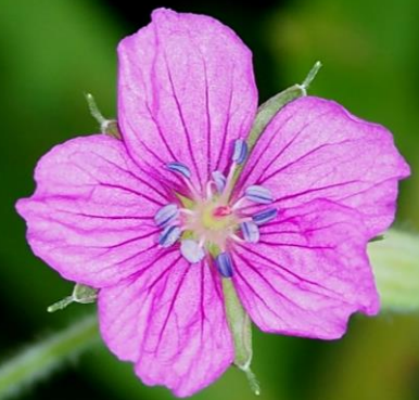
ゲンノショウコ (現証拠) フロソウ科