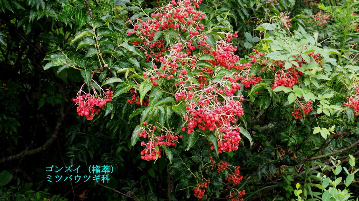
ゴンズイ (権葎) ミツバウツギ科