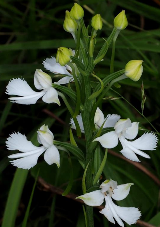
ダイサギソウ(大鷲草) ラン科