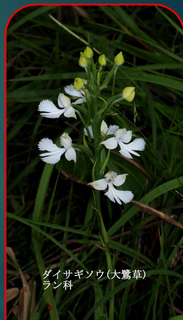
ダイサギソウ (大鷲草) ラン科