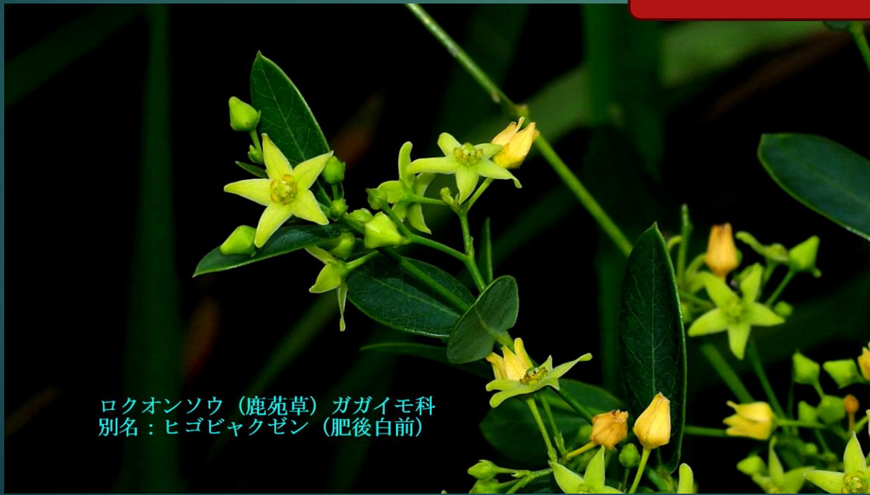
ロクオンソウ (鹿苑草) ガガイモ科 別名：ヒゴビャクゼン (肥後白前)