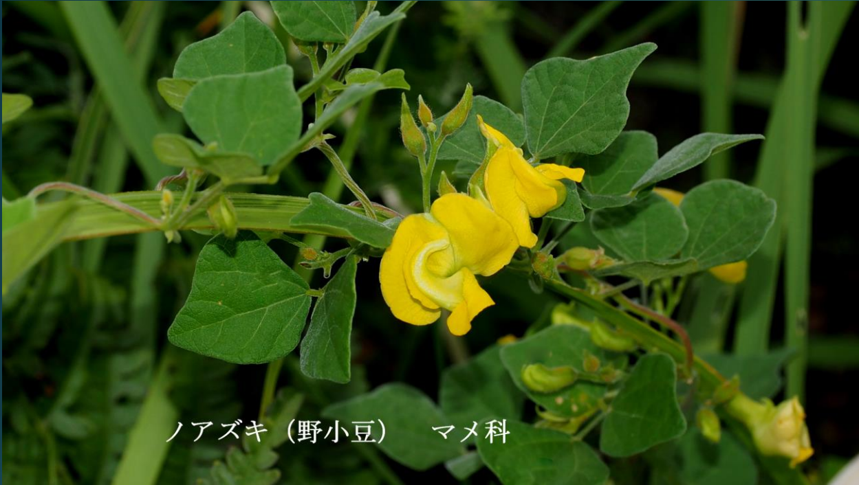
ノアズキ (野小豆) マメ科