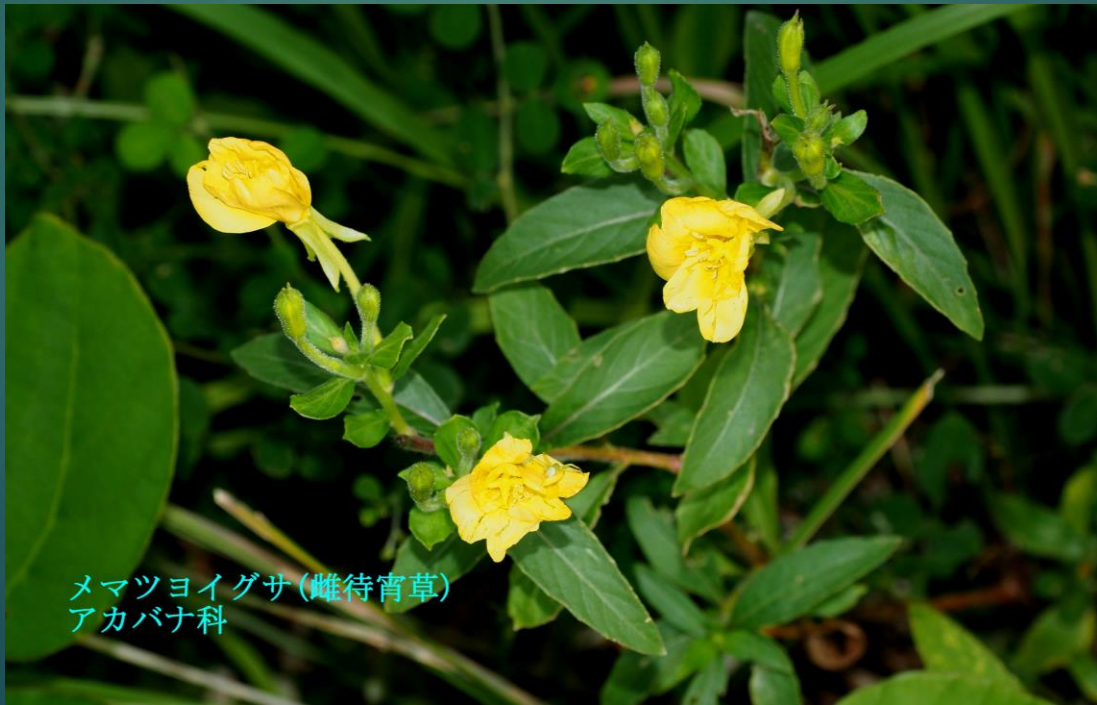
メマツヨイグサ(雌待宵草) アカバナ科