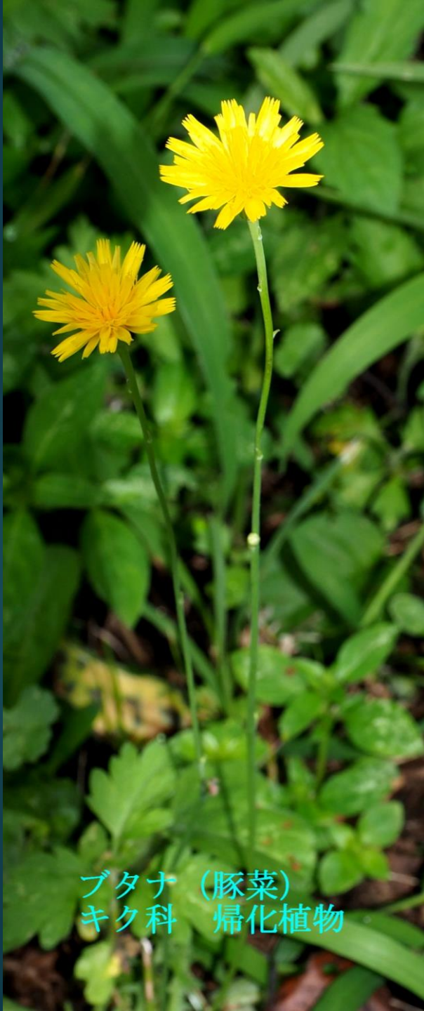
ブタナ (豚菜) キク科 帰化植物