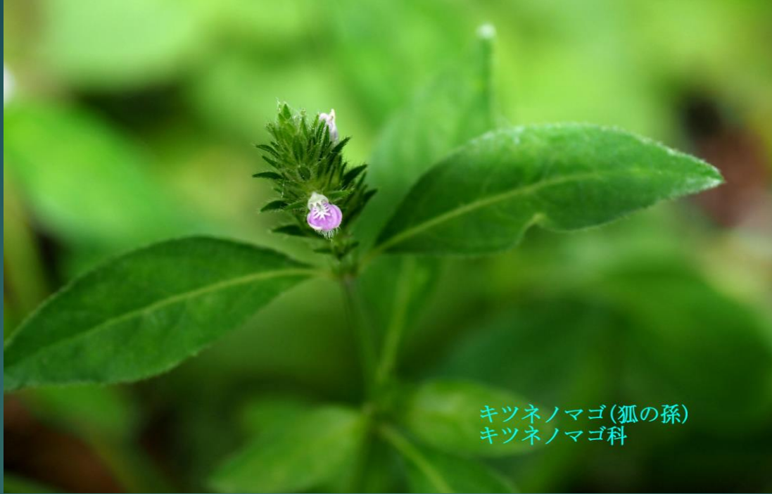
キツネノマゴ(狐の孫) キツネノマゴ科