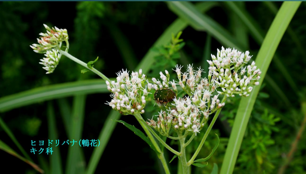
ヒヨドリバナ(鶉花) キク科