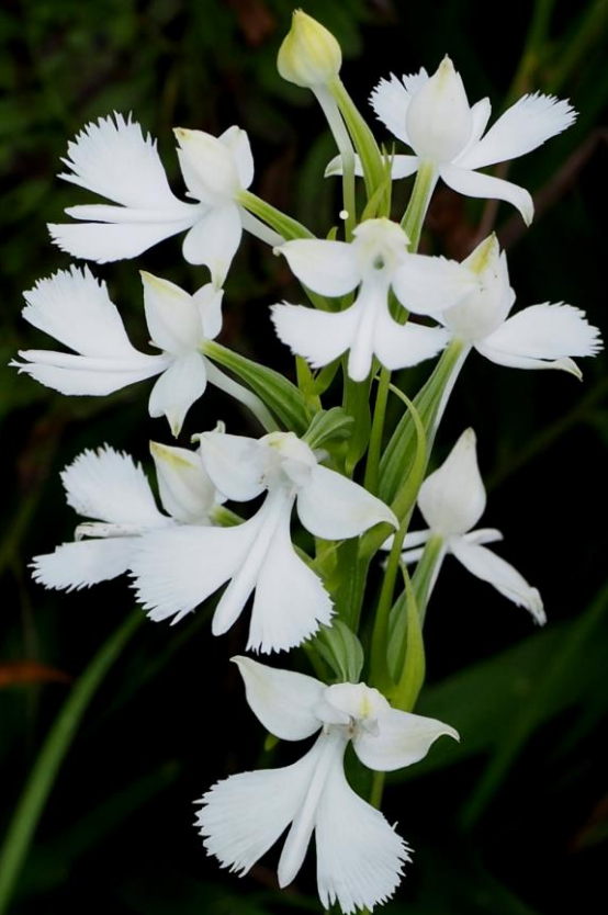
ダイサギソウ(大鷲草) ラン科