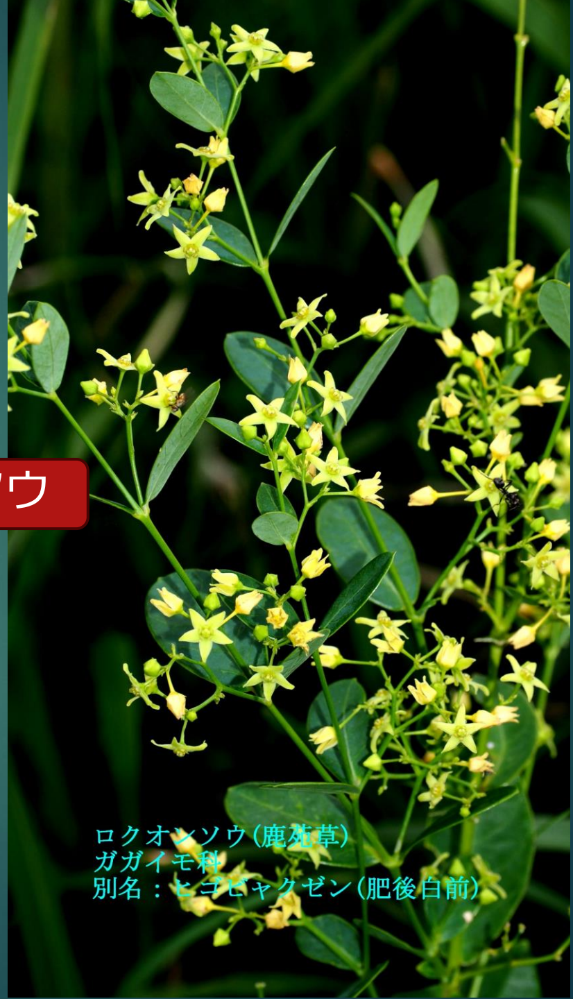
ロクオンソウ (鹿苑草) ガガイモ科 別名：ヒゴビャクゼン (肥後白前)