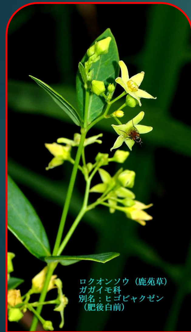
ロクオンソウ (鹿苑草) ガガイモ科 別名: ヒゴビヤクゼン (肥後白前)