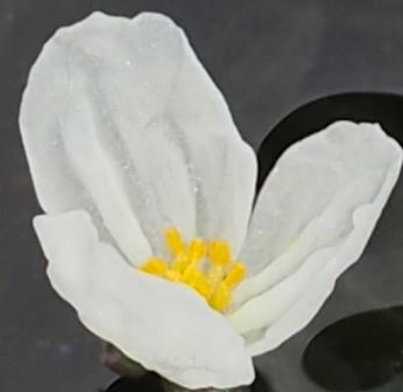
カナダモ (カナダ藻) トチカガミ科 北アメリカ原産の帰化植物