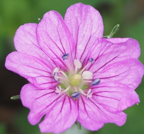
ゲンノショウコ (現証拠) フロソウ科