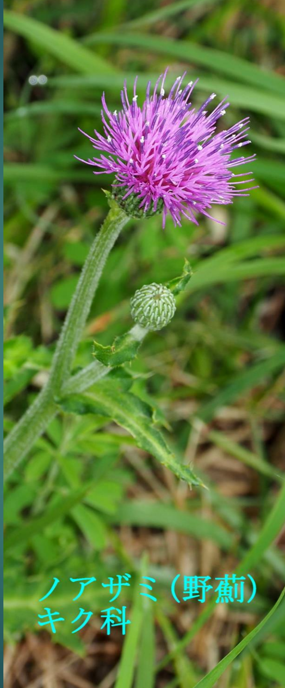
ノアザミ (野薊) キク科