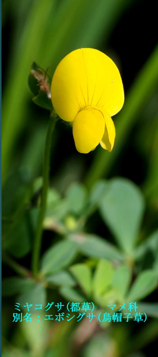
ミヤコグサ (都草) マメ科 別名：エボシグサ (烏帽子草)