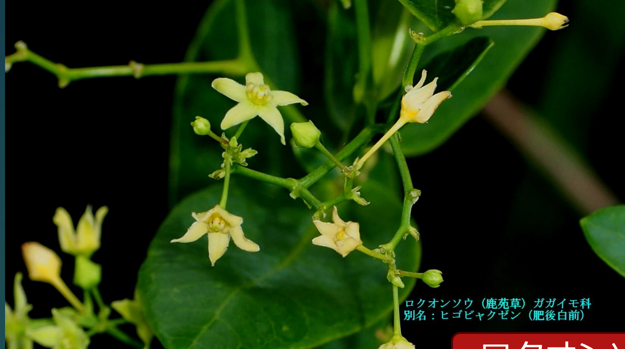
ロクオンソウ (鹿苑草) ガガイモ科 別名：ヒゴビャクゼン (肥後白前)