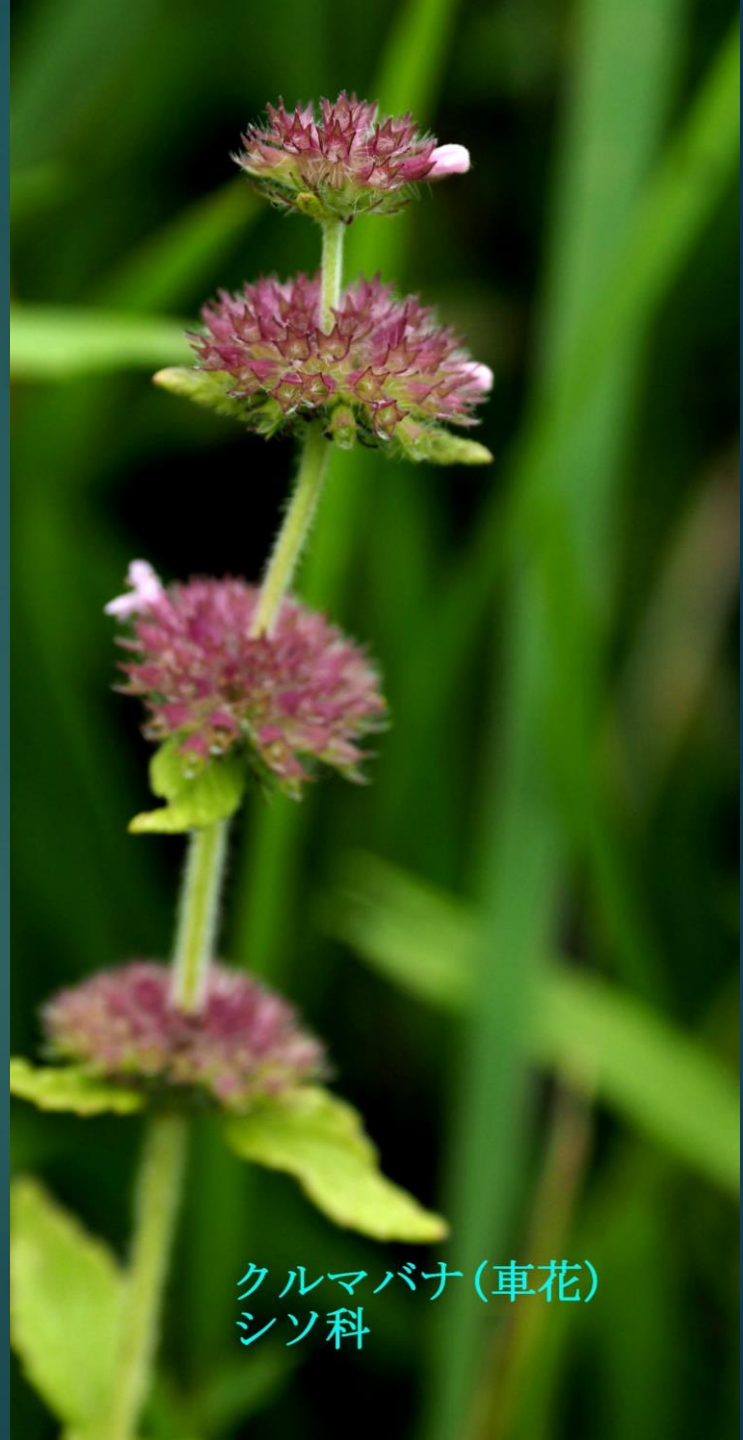
クルマバナ(車花) シソ科