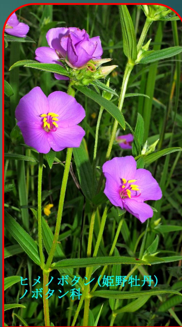
ヒメノボタン (姫野牡丹) ノボタン科