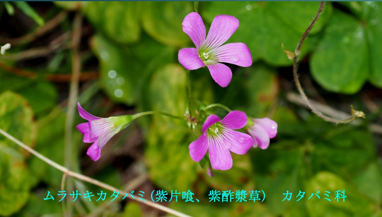
ムラサキカタバミ (紫片喰、紫酢漿草) カタバミ科