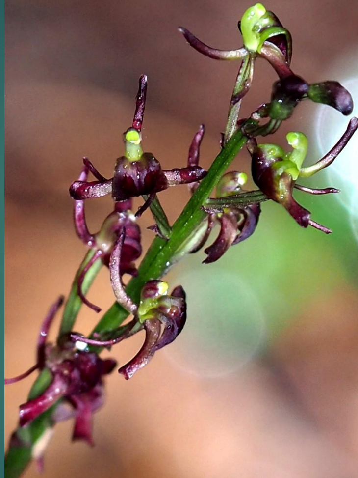
コ克蘭(黒蘭) ラン科