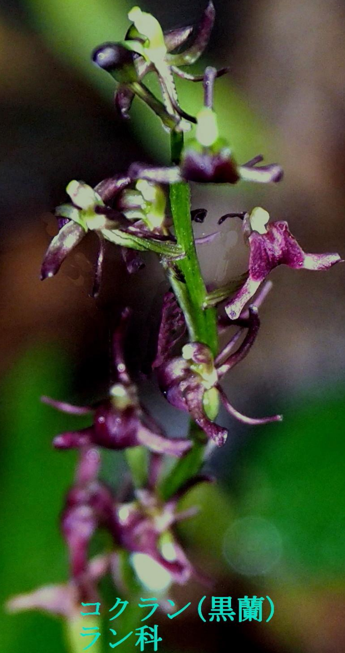
コ克蘭(黒蘭) ラン科