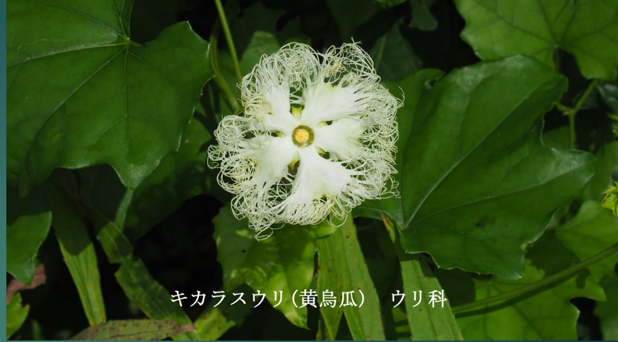
キカラスウリ(黄鳥瓜) ウリ科