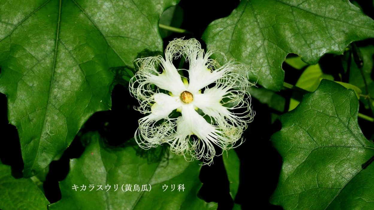
キカラスウリ(黄鳥瓜) ウリ科