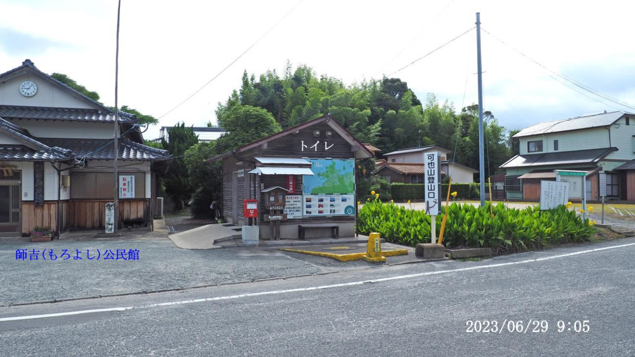
師吉(もろよし)公民館