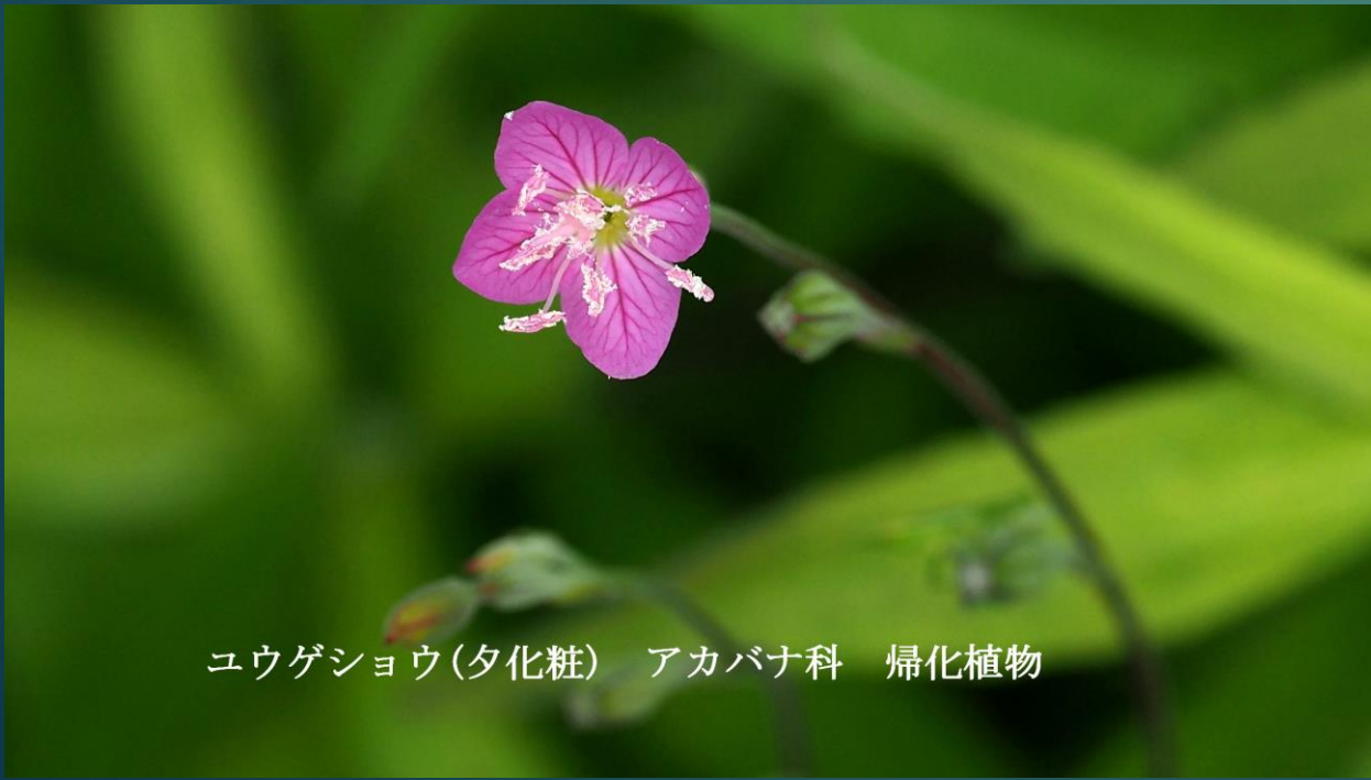
ユウゲショウ(夕化粧) アカバナ科 帰化植物