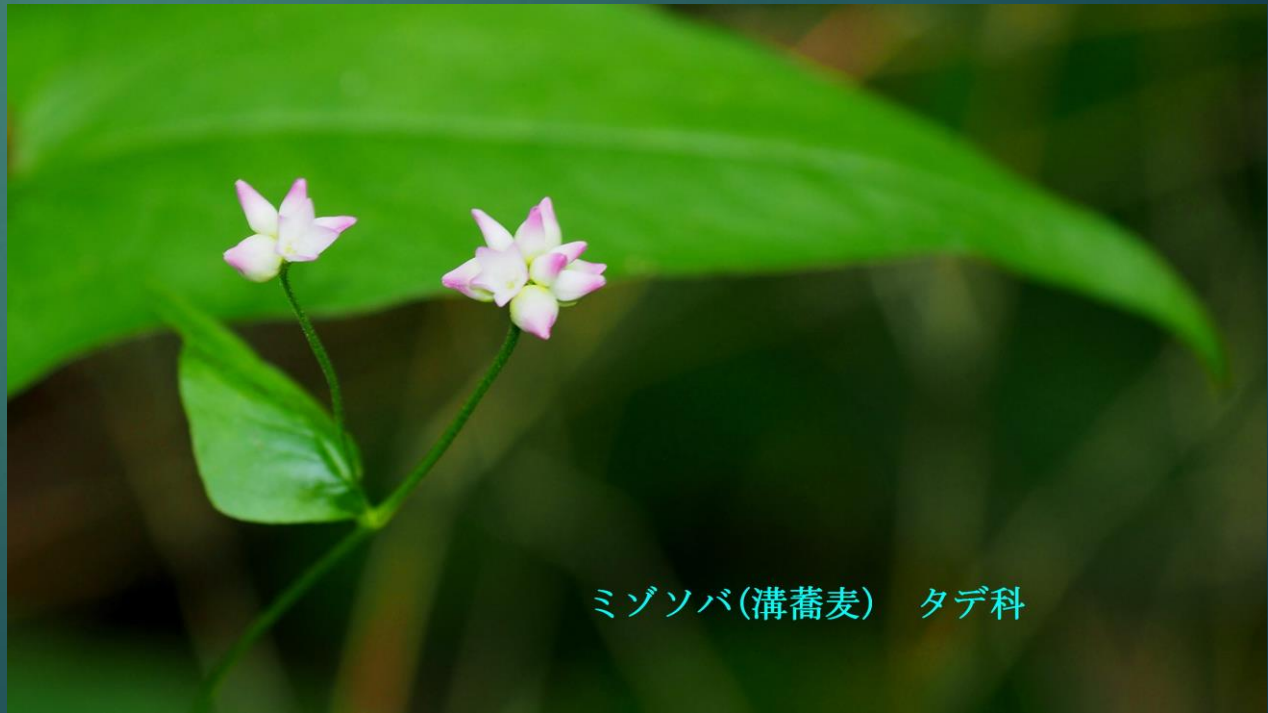
ミゾソバ(溝蕎麦) タデ科