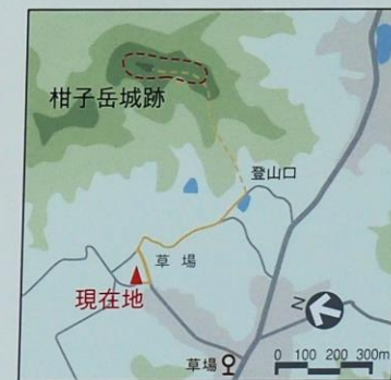
柑子岳城跡への案内図