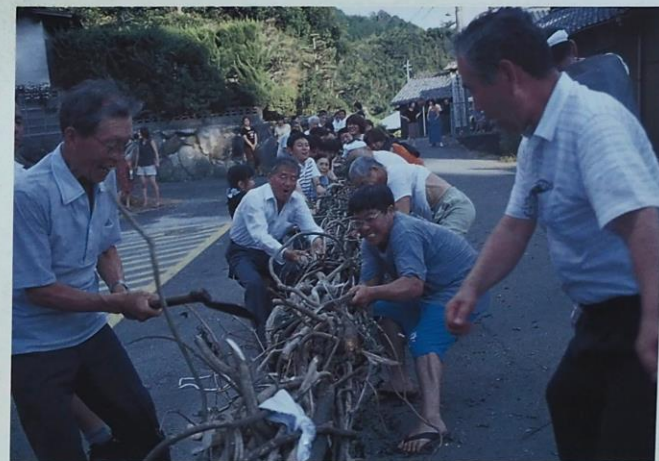
草場の盆綱引き (市指定無形民俗文化財)