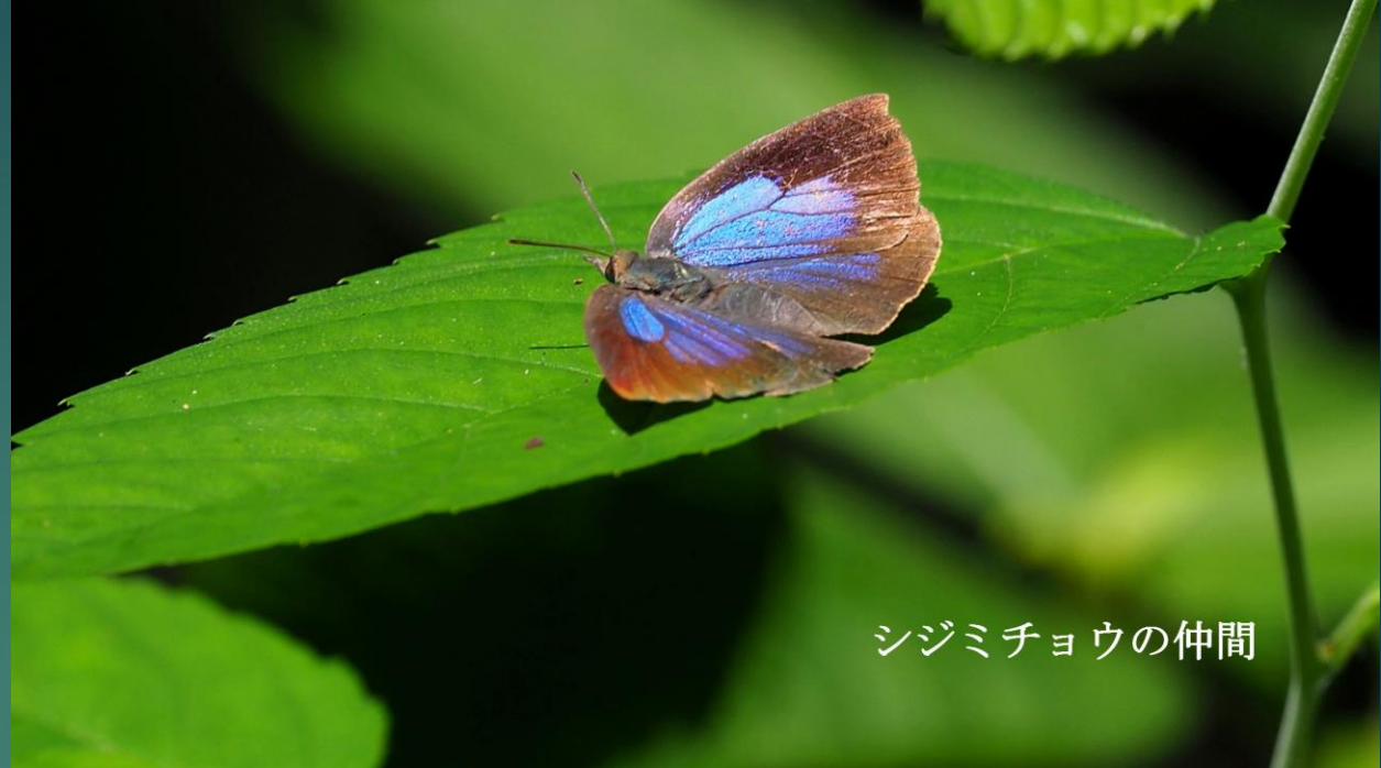
シジミチョウの仲間