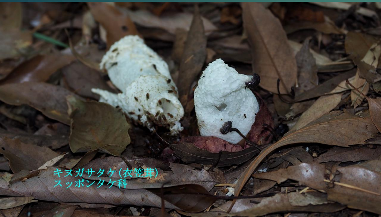
キノガサタケ(衣笠茸) スッポンタケ科