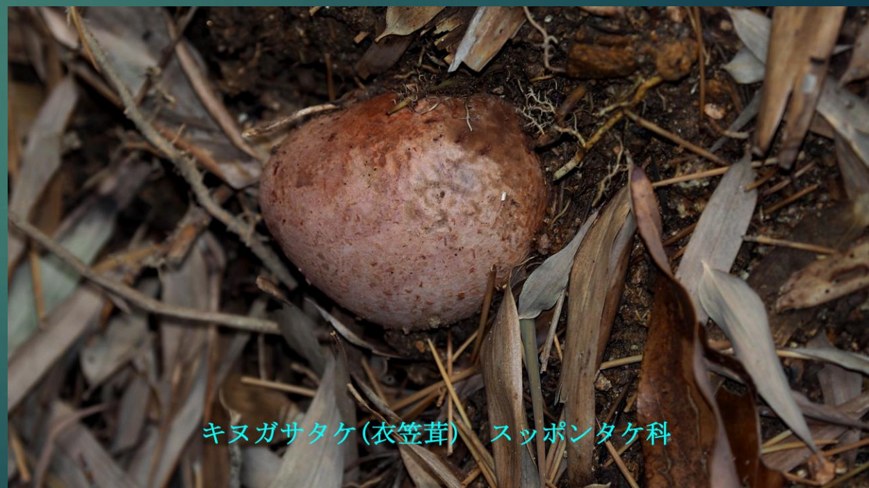
キノガサタケ(衣笠茸) スッポンタケ科