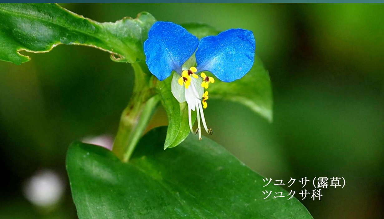
ツユクサ(露草) ツユクサ科