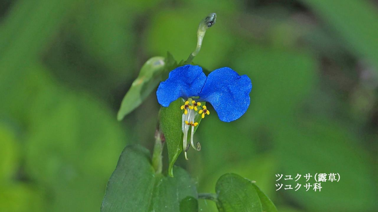
ツユクサ(露草) ツユクサ科