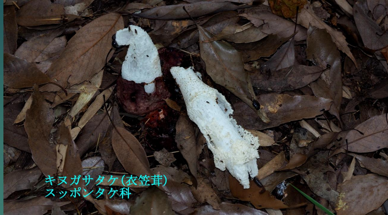
キノガサタケ(衣笠茸) スッポンタケ科