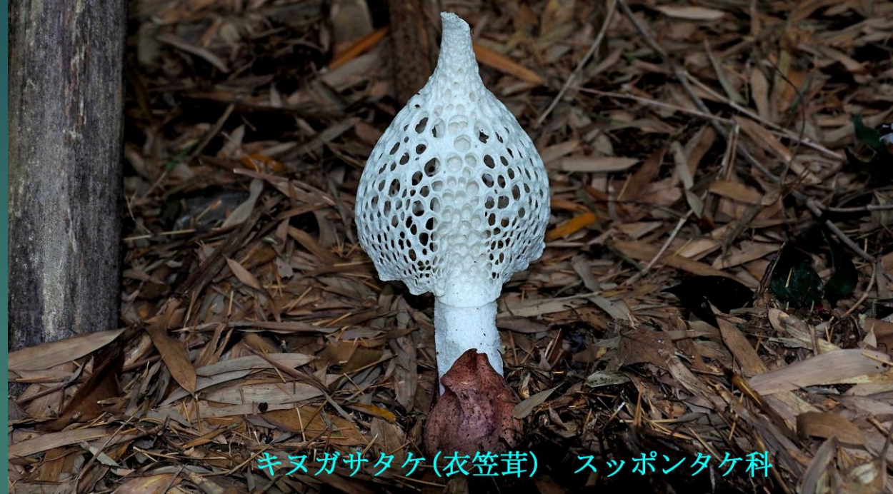
キノガサタケ(衣笠茸) スッポンタケ科