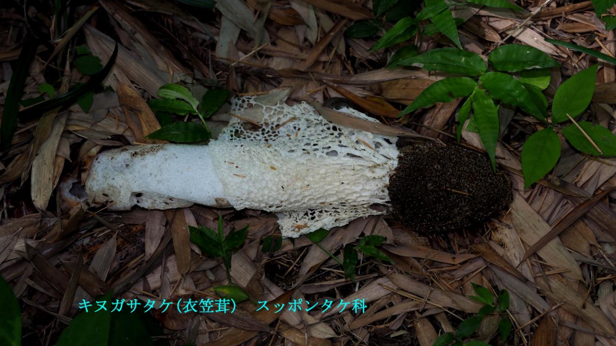
キノガサタケ(衣笠茸) スッポンタケ科