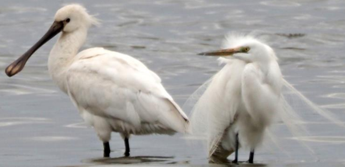
ヘラサギ(篋鷺) トキ科 L=86cm