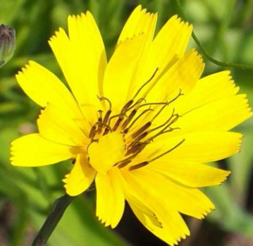
オオジシバリ (大地縛り) キク科 別名：ツルニガナ (蔓苦菜)