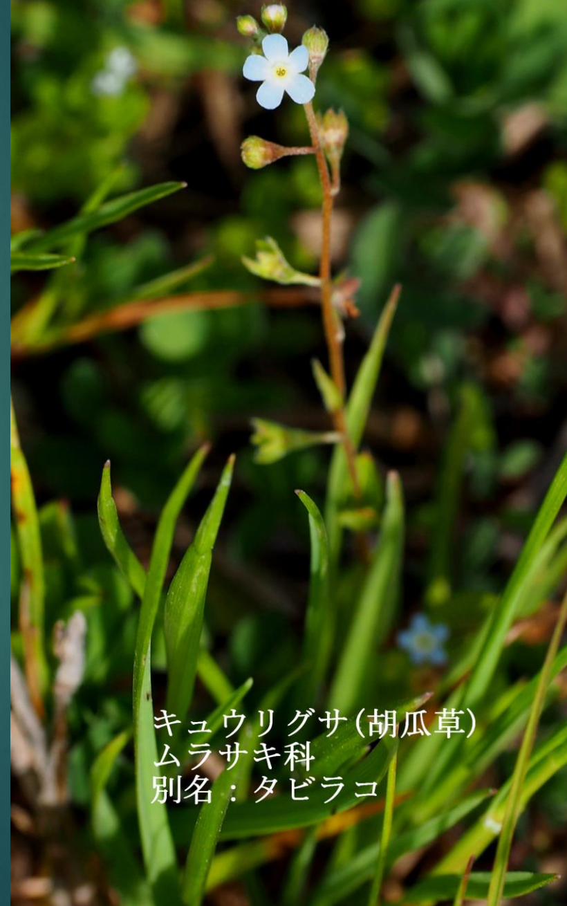
キュウリグサ(胡瓜草) ムラサキ科 別名：タビラコ