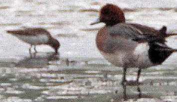
ヒドリガモ(緋鳥鴨) オス ガンカモ科 L=49cm