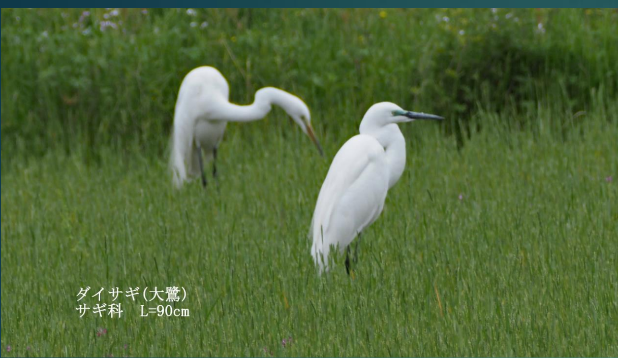
ダイサギ(大鷺) サギ科 L=90cm