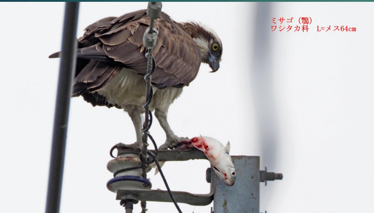
ミサゴ(鴉) ワシタカ科 L=メス64cm