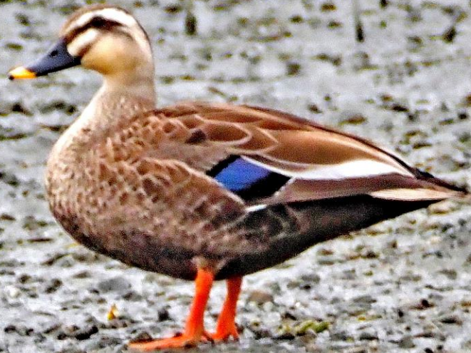
カルガモ(軽鴨) ガンカモ科 L=61cm