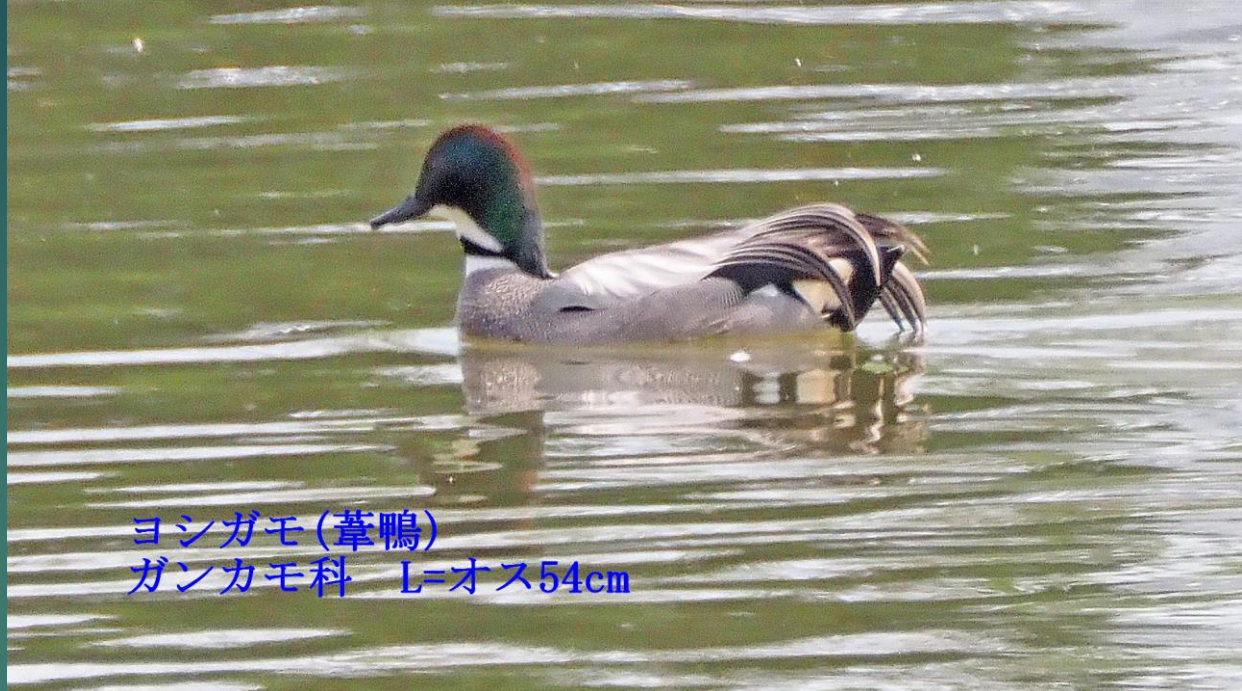
ヨシガモ(葦鴨) ガンカモ科 L=オス54cm