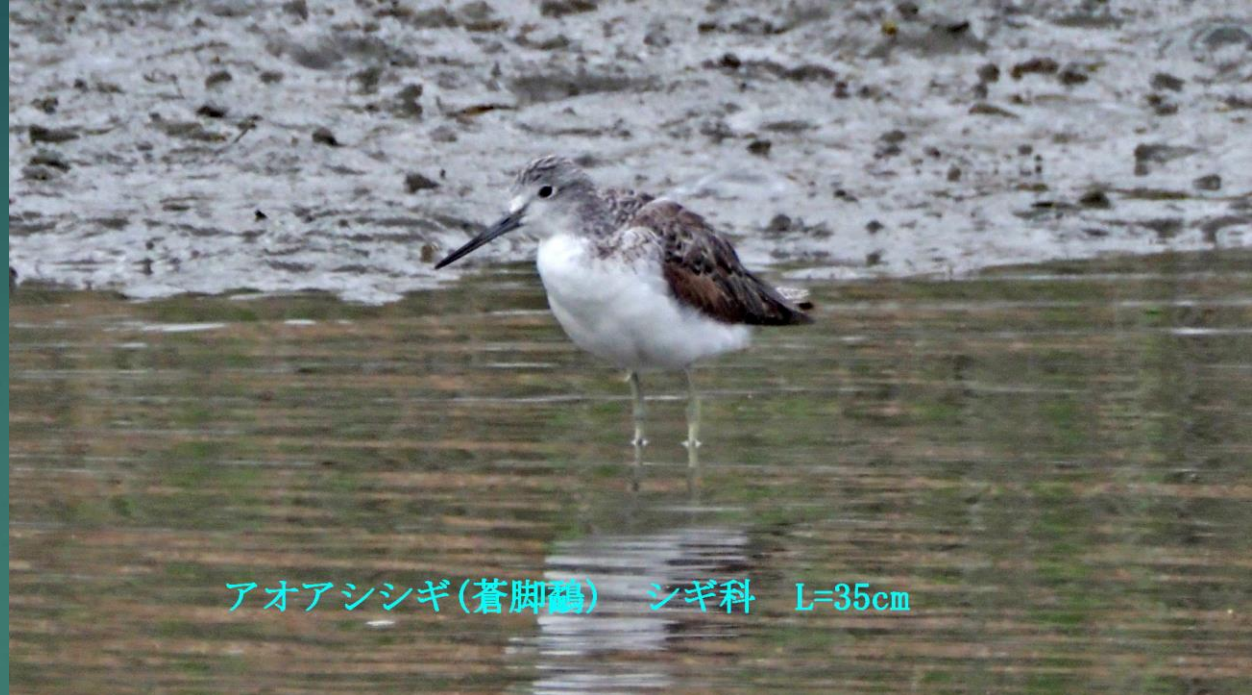
アオアシシギ(蒼脚鴉) シギ科 L=35cm