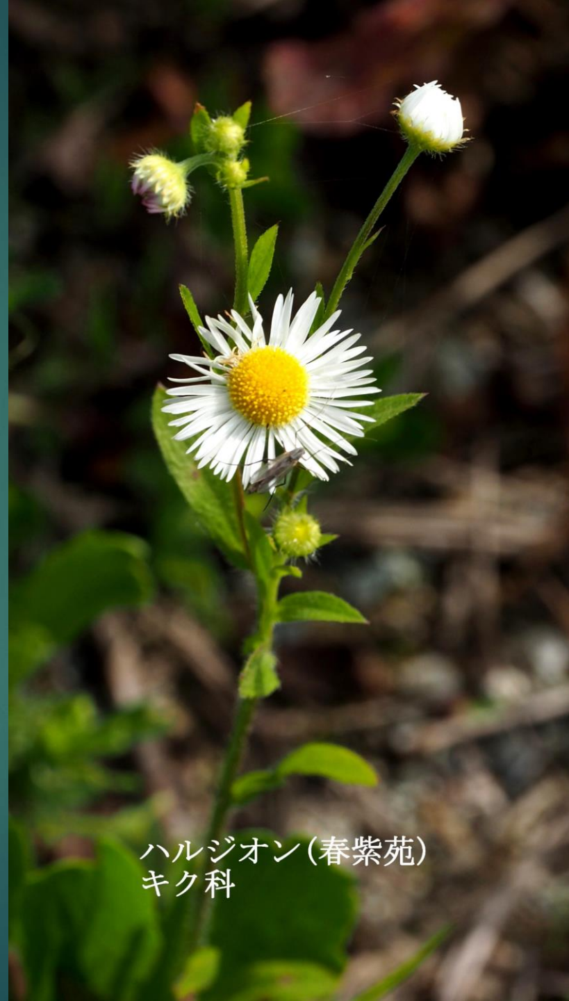
ハルジオン (春紫苑) キク科