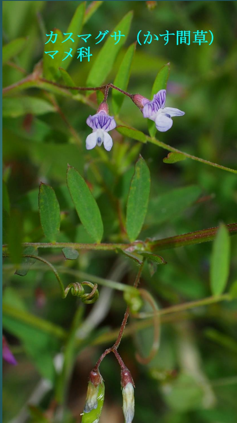
カスマグサ (かす間草) マメ科