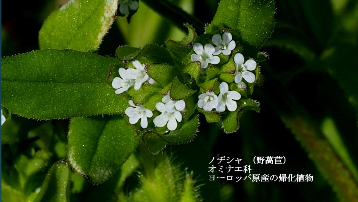
ノヂシャ (野高苳) オミナエ科 ヨーロッパ原産の帰化植物