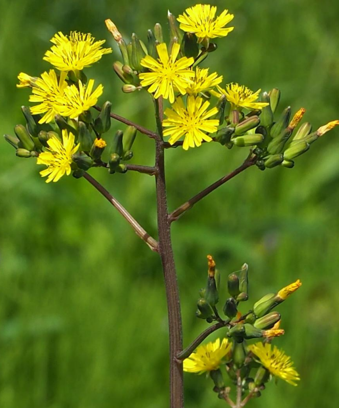
オニタビラコ (鬼田平子) キク科