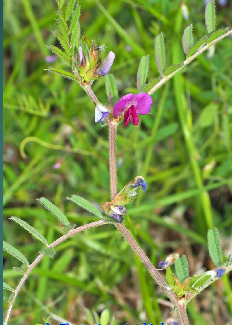
カラスノエンドウ (烏野豌豆) マメ科