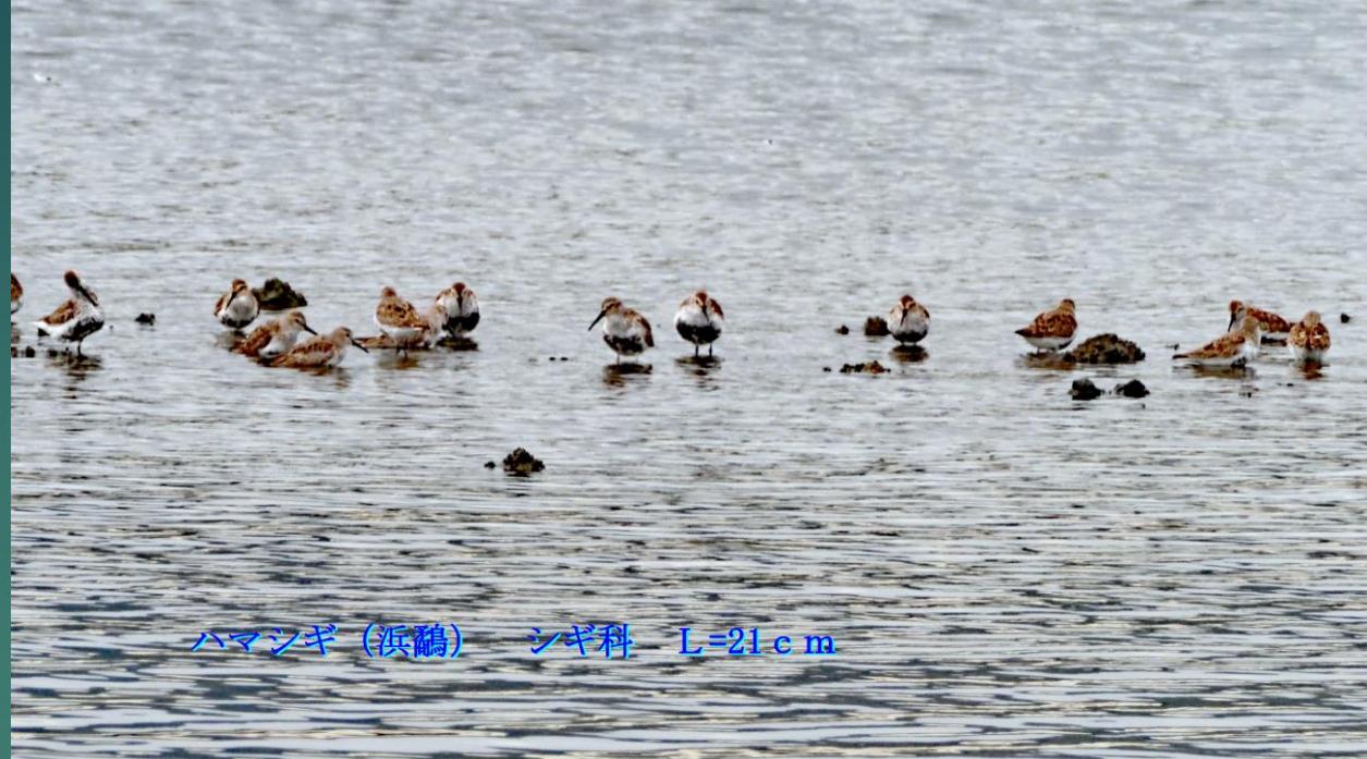
ハマシギ(浜鷸) シギ科 L=21cm