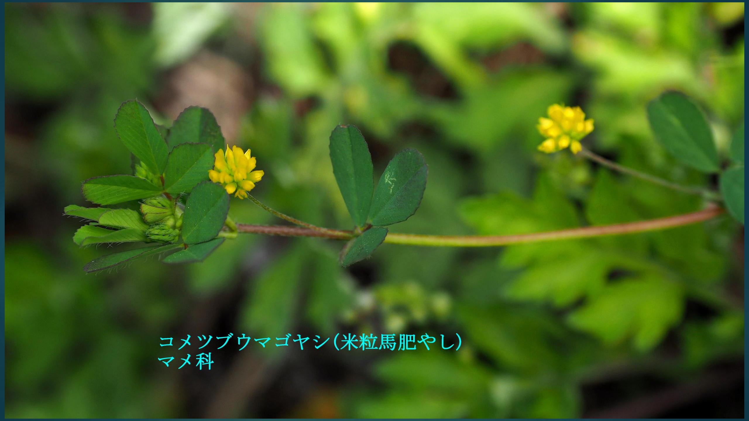
コメツブウマゴヤシ(米粒馬肥やし) マメ科