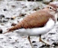
イツシギ(磯鶺) シギ科 L=20cm