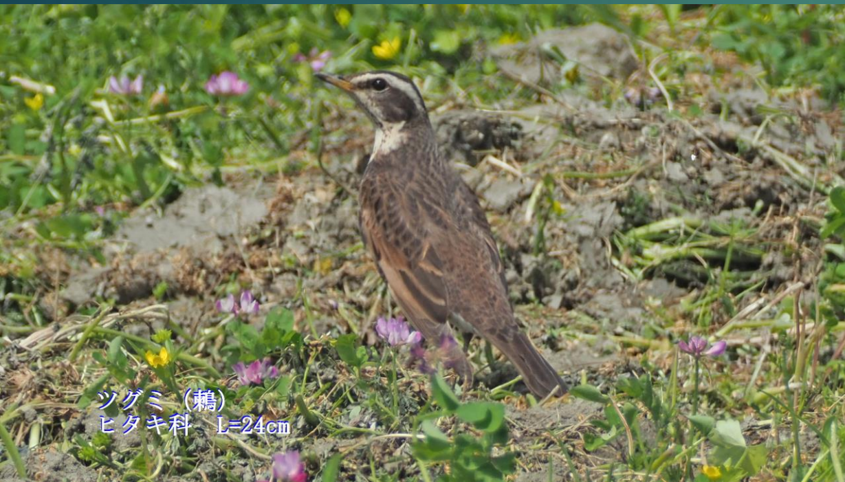
ツグミ(鶉) ヒタキ科 L=24cm