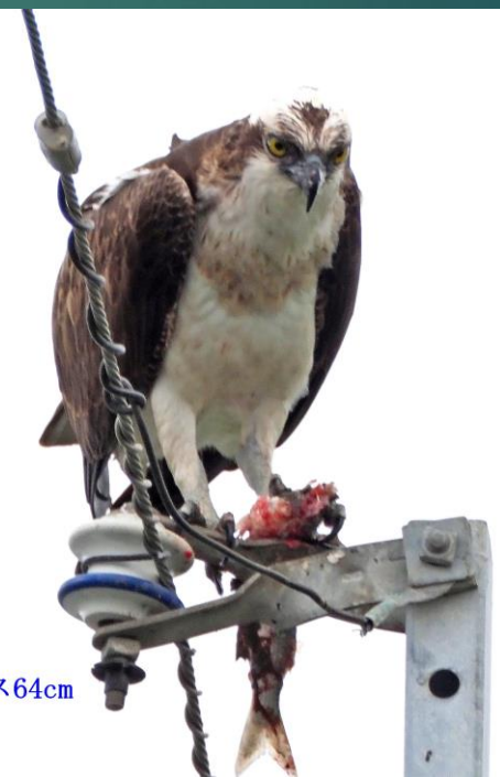
ミサゴ (鶚) ワシタカ科 L=メス64cm