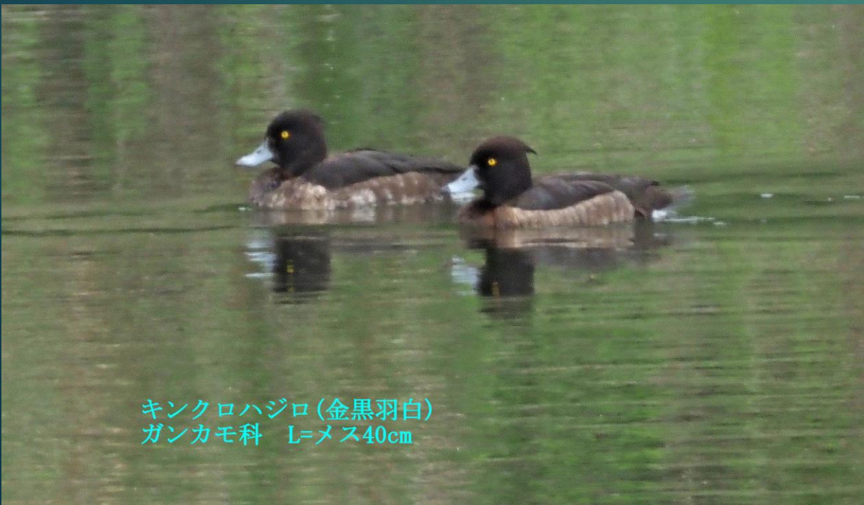
キンクロハジロ(金黒羽白) ガンカモ科 L=メス40cm