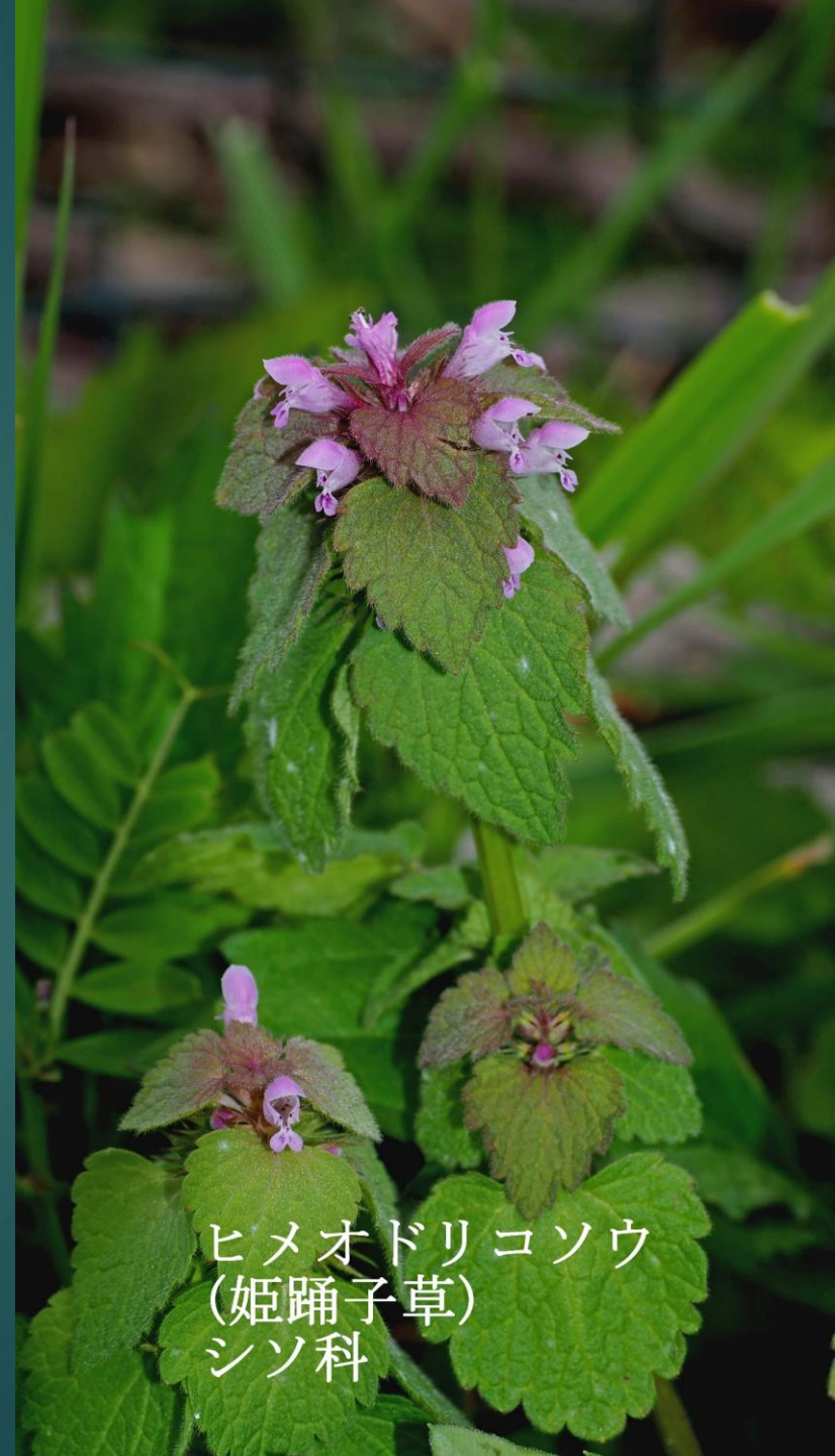
ヒメオドリコソウ (姫踊子草) シソ科