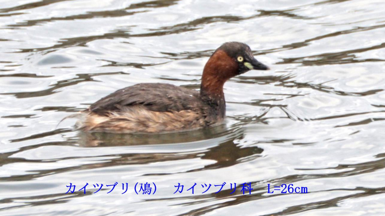
カイツブリ(鴉) カイツブリ科 L=26cm