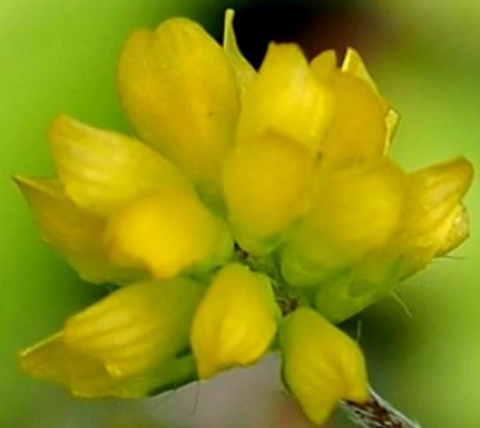
コメツブウマゴヤシ (米粒馬肥やし) マメ科