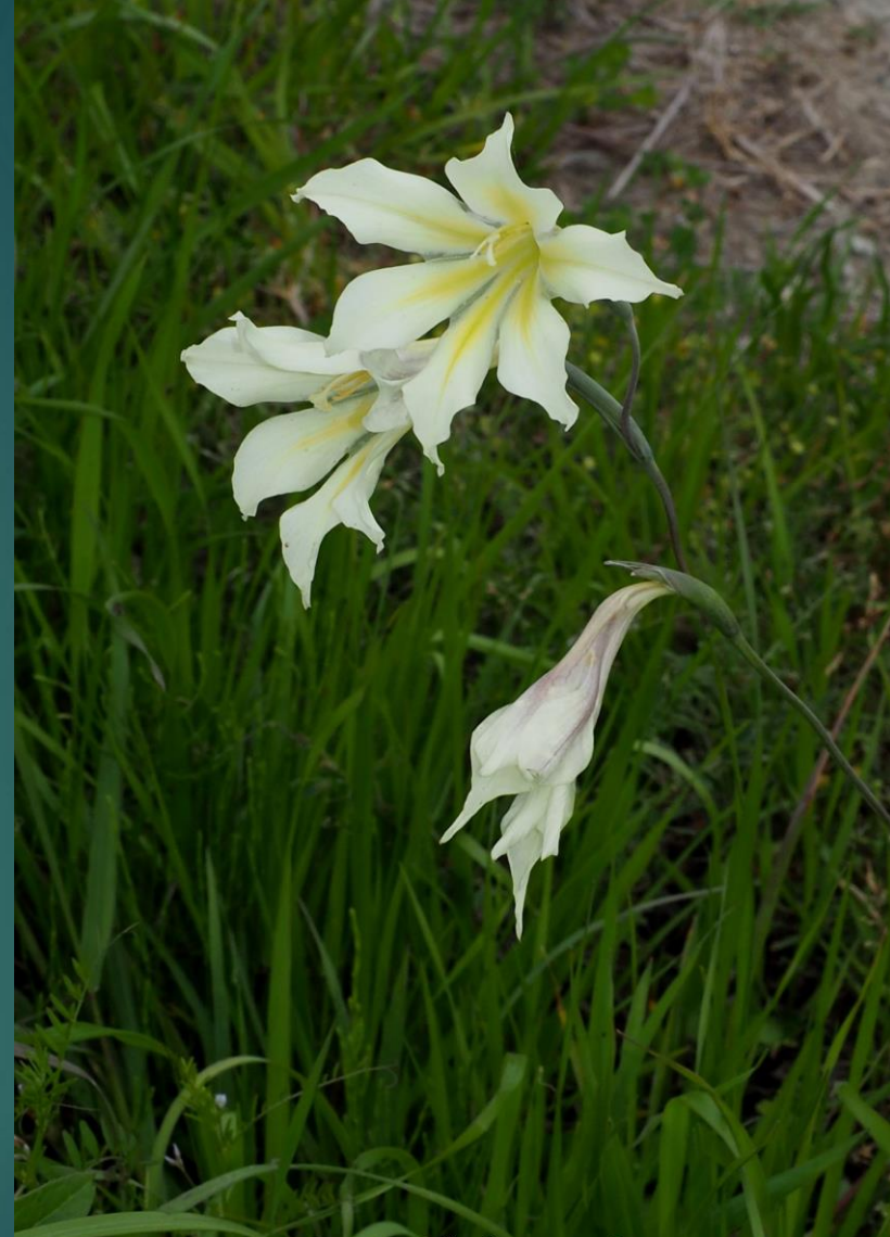
テッポウユリ (鉄砲百合) ユリ科