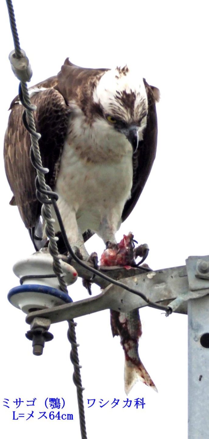
ミサゴ (鶚) ワシタカ科 L=メス64cm