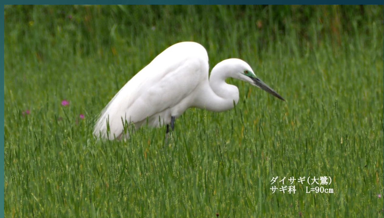
ダイサギ(大鷺) サギ科 L=90cm