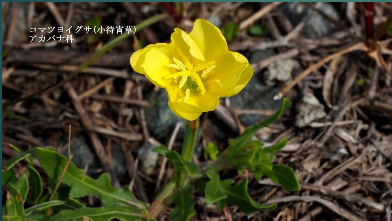
コマツヨイグサ (小待宵草) アカバナ科