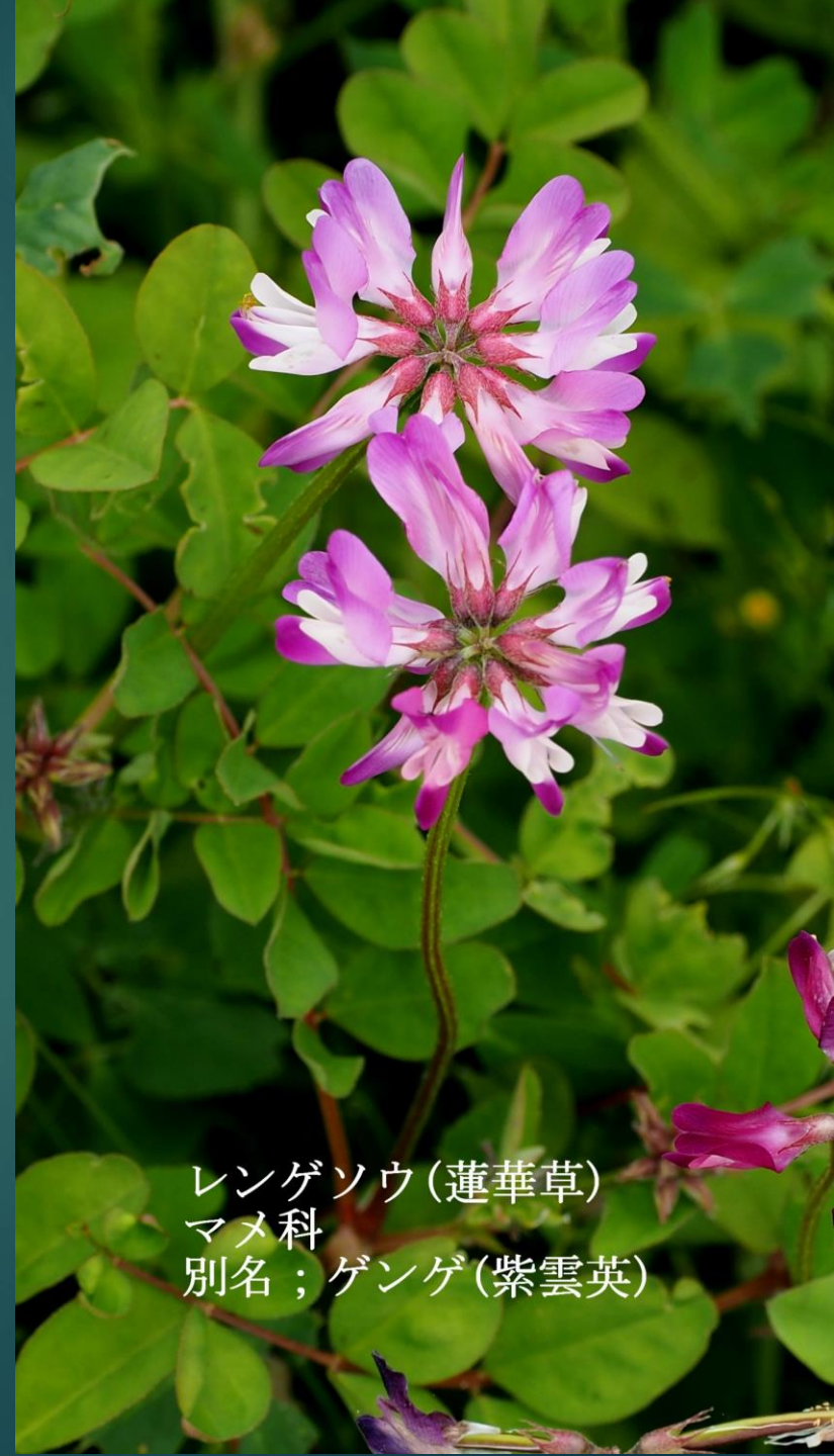
レンゲソウ (蓮華草) マメ科 別名；ゲンゲ (紫雲英)