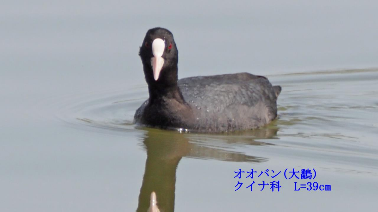
オオバン(大鵞) クイナ科 L=39cm