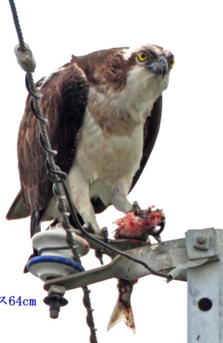
ミサゴ (鶚) ワシタカ科 L=メス64cm