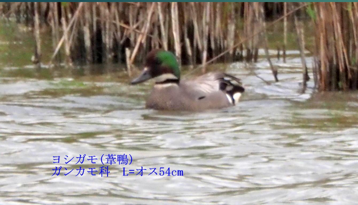
ヨシガモ(葦鴨) ガンカモ科 L=オス54cm