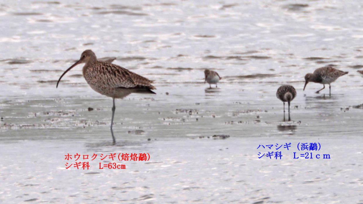
ホウロクシギ(焙烙鷸) シギ科 L=63cm