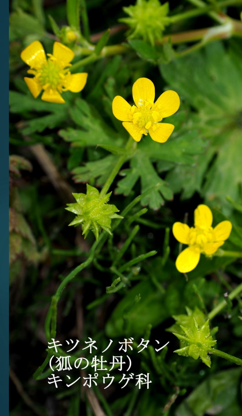
キツネノボタン (狐の牡丹) キンポウゲ科