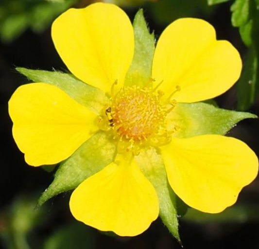
ヘビイチゴ(蛇莓) バラ科