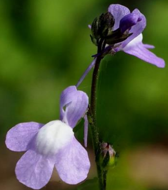
マツバウンラン(松葉海蘭) ラン科 北アメリカ原産の帰化植物