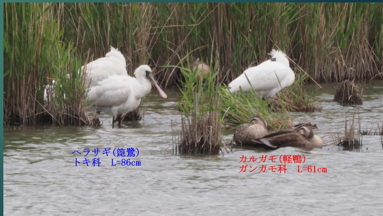
ヘラサギ(篋鷺) トキ科 L=86cm