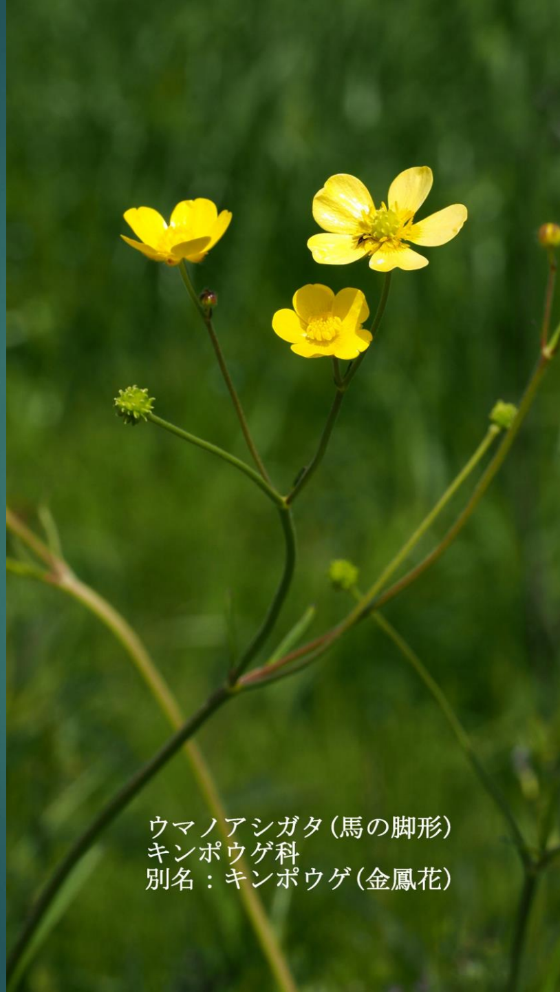
ウマノアシガタ (馬の脚形) キンポウゲ科 別名：キンポウゲ (金鳳花)