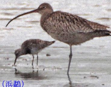
ホウロクシギ(焙烙鷸) シギ科 L=63cm