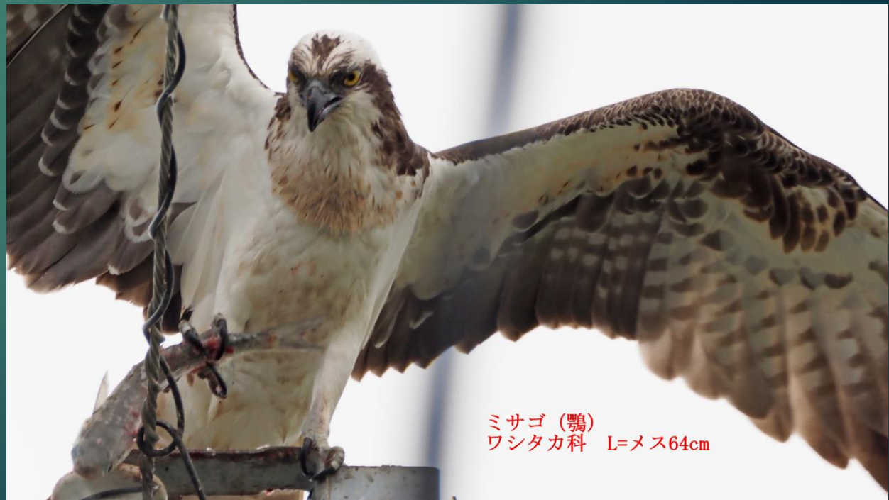
ミサゴ(鴉) ワシタカ科 L=メス64cm