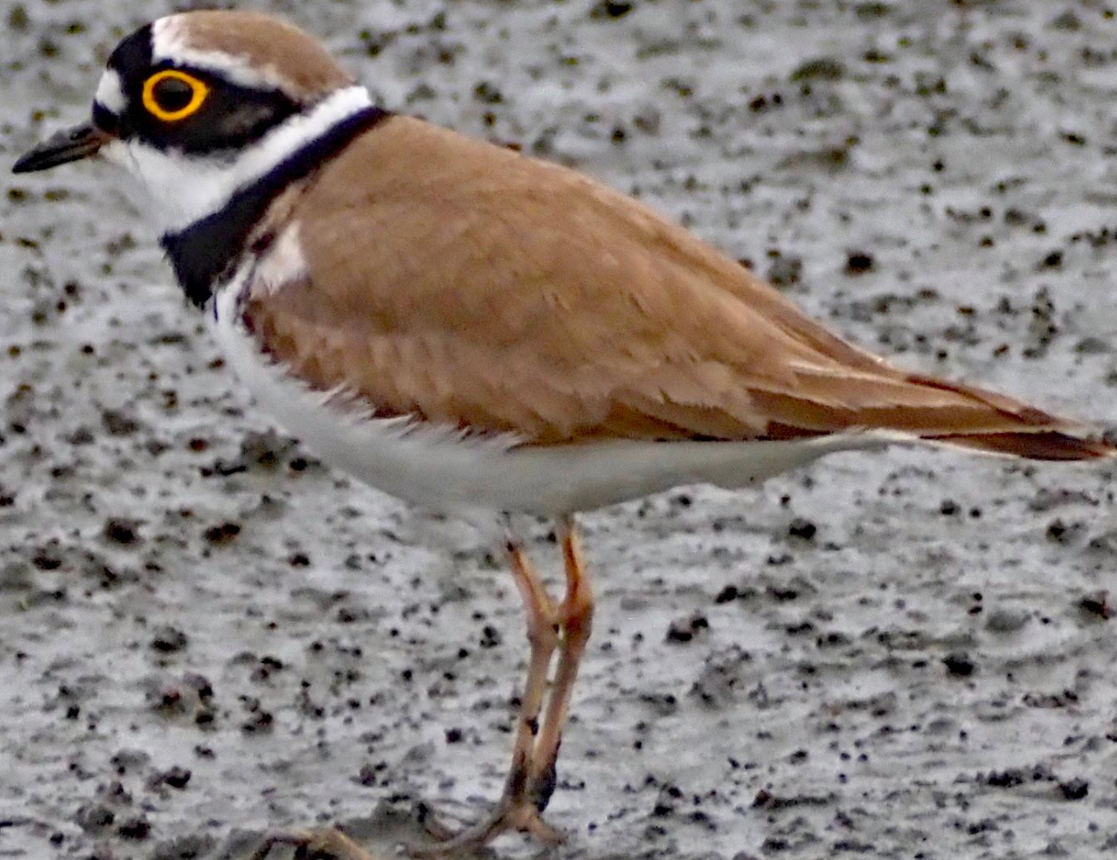
コチドリ(小千鳥) チドリ科 L=16cm