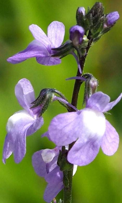
マツバウンラン(松葉海蘭) ラン科 北アメリカ原産の帰化植物