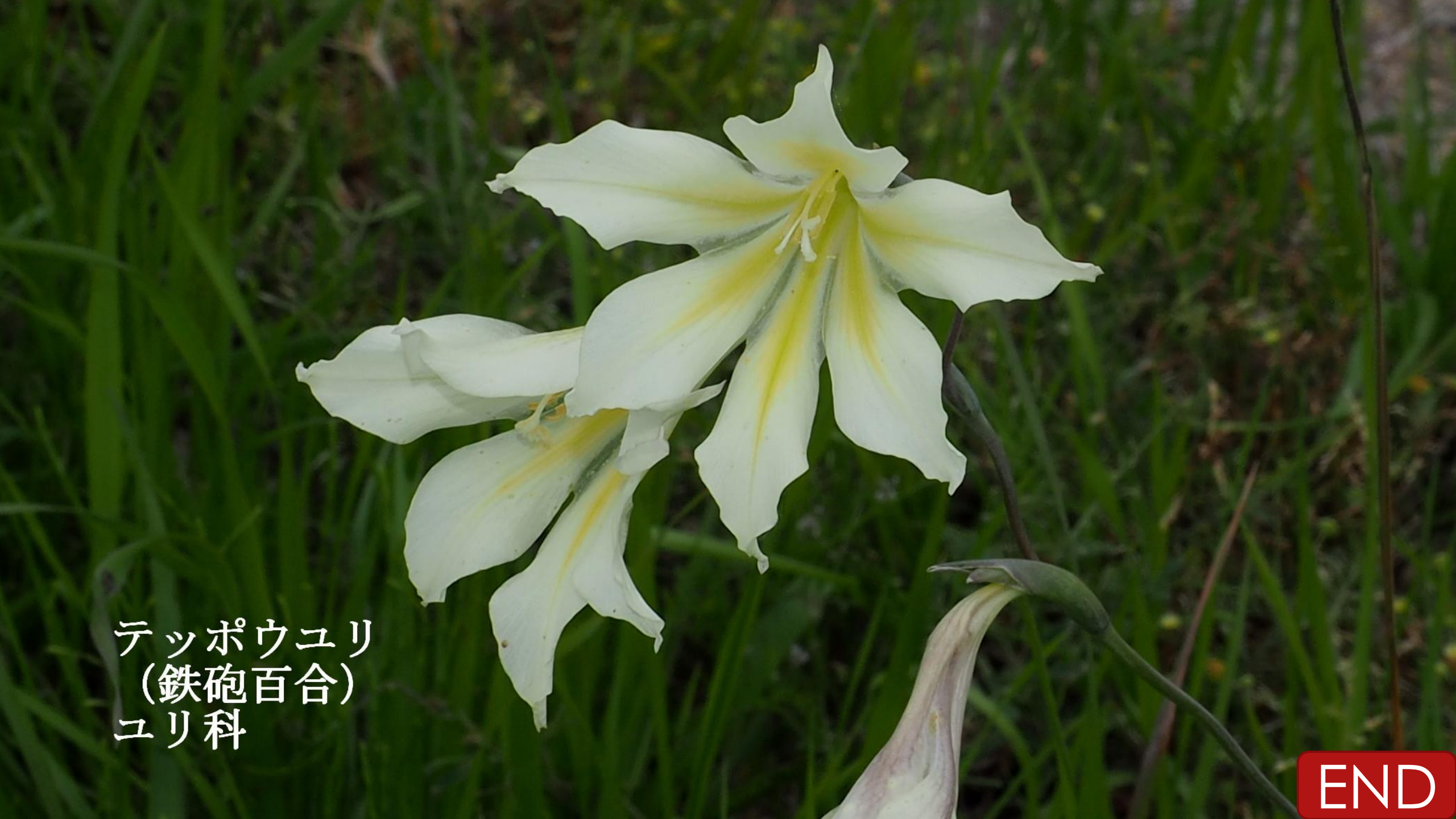
テッポウユリ (鉄砲百合) ユリ科