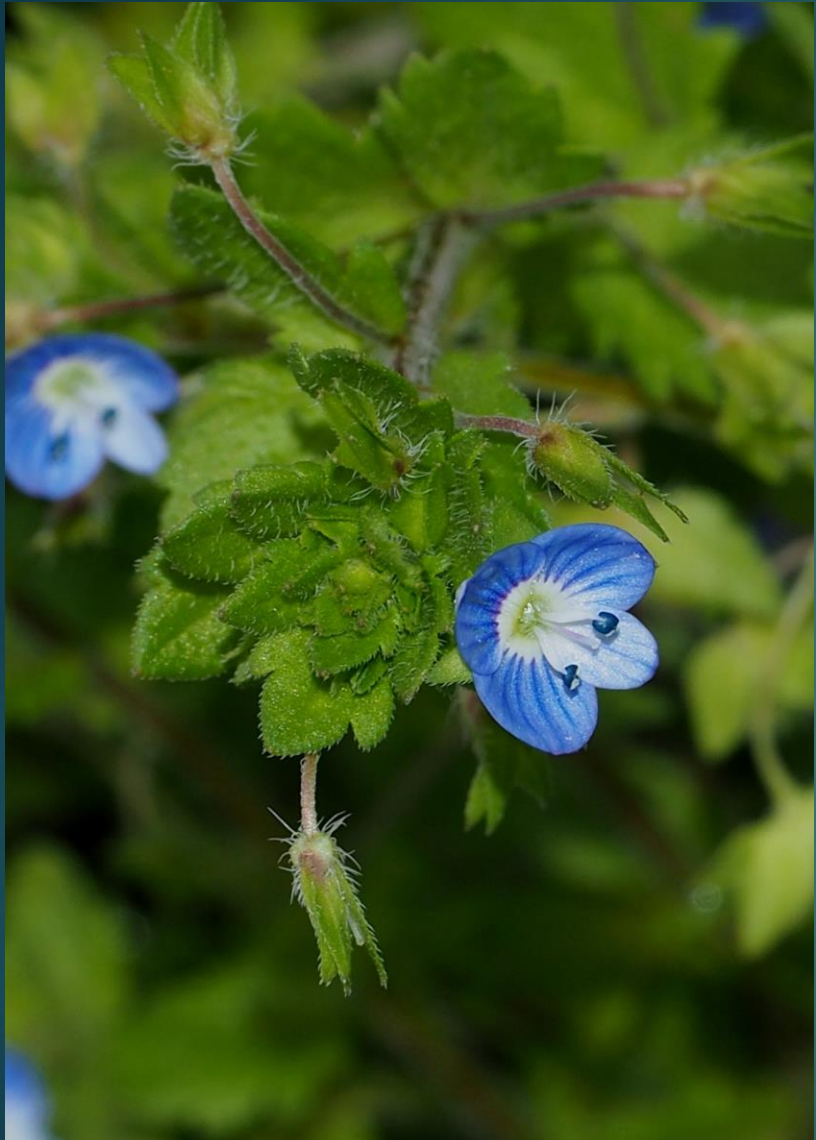
オオイヌノフグリ (大犬の陰囊) ゴマノハグサ科