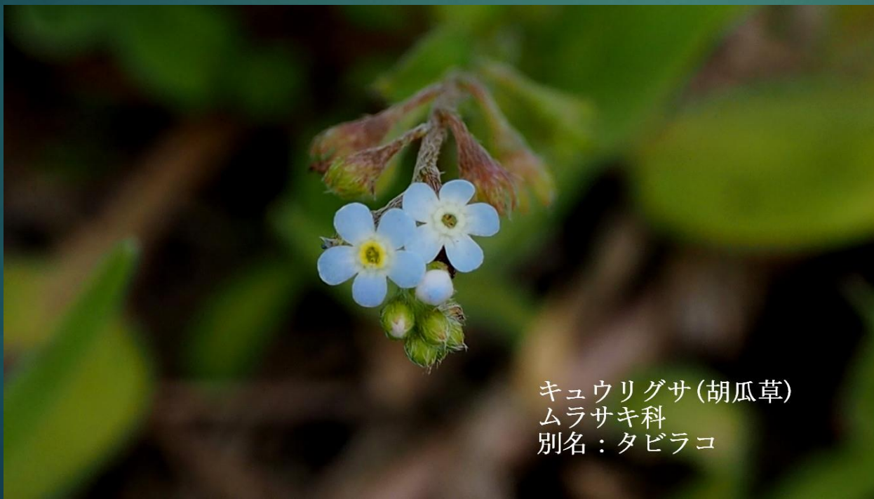
キュウリグサ (胡瓜草) ムラサキ科 別名：タビラコ