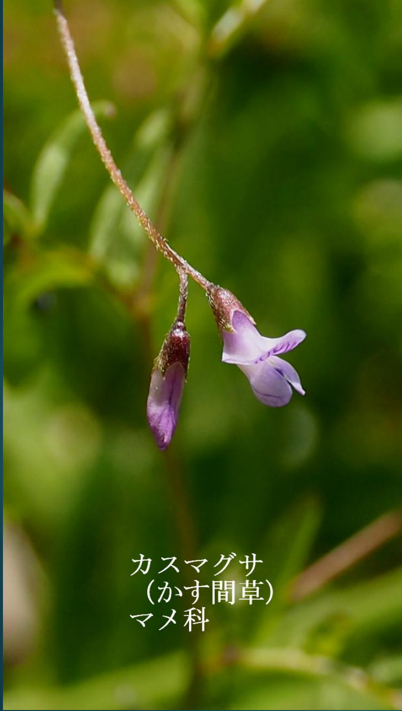
カスマグサ (かす間草) マメ科