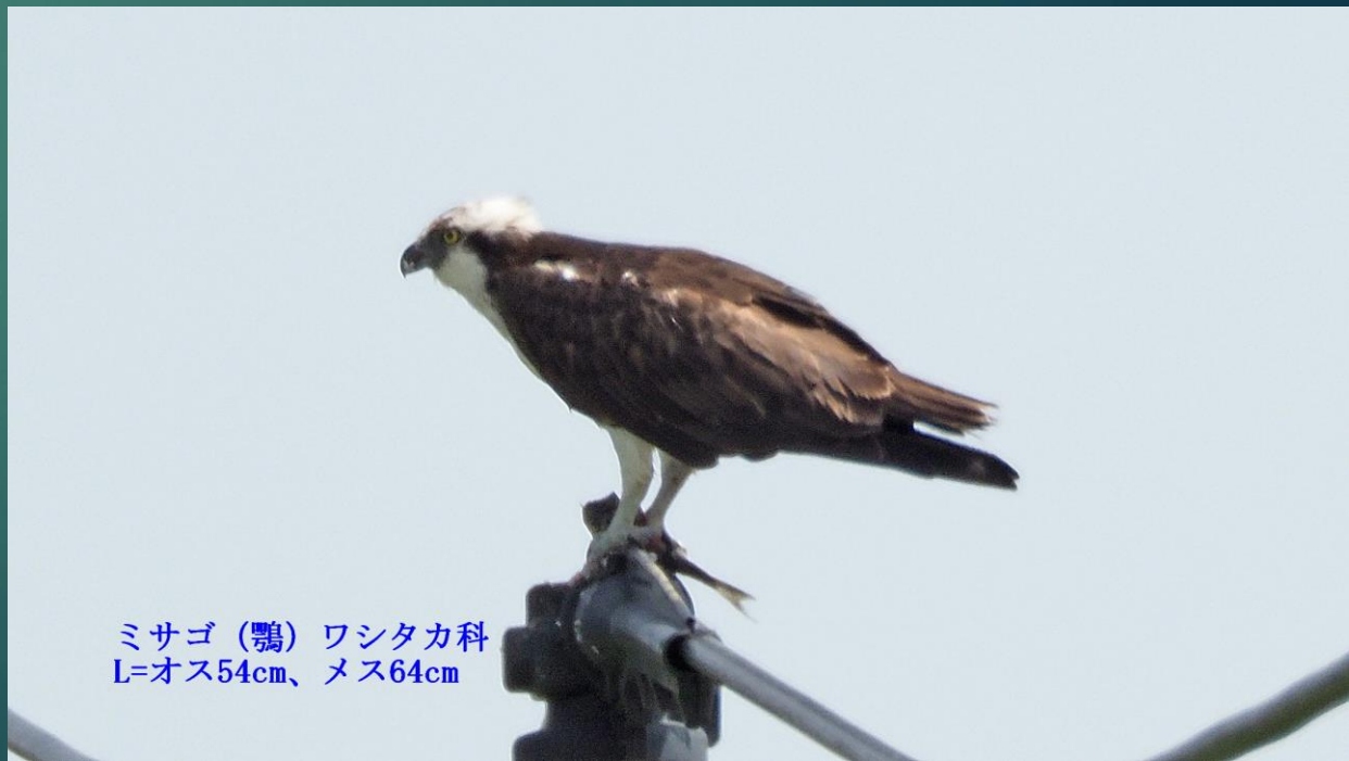
ミサゴ(鵟) ワシタカ科 L=オス54cm、メス64cm