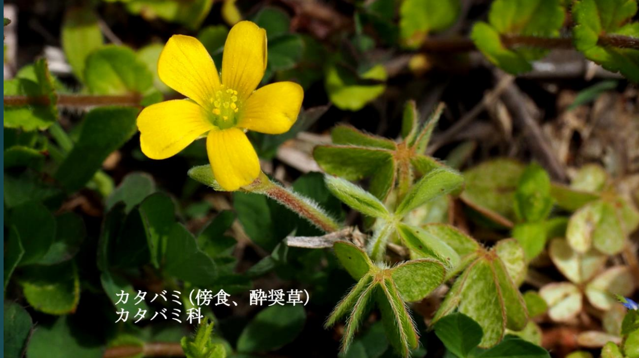
カタバミ (傍食、酔墜草) カタバミ科