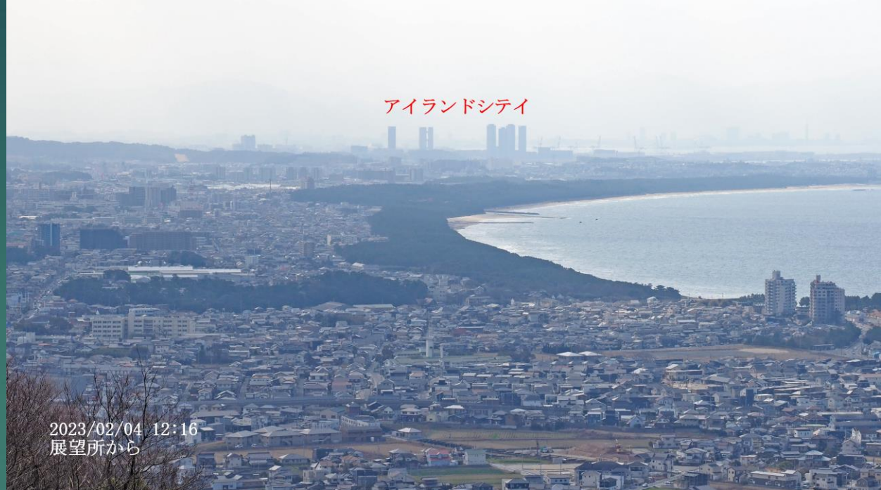
アイランドシティ