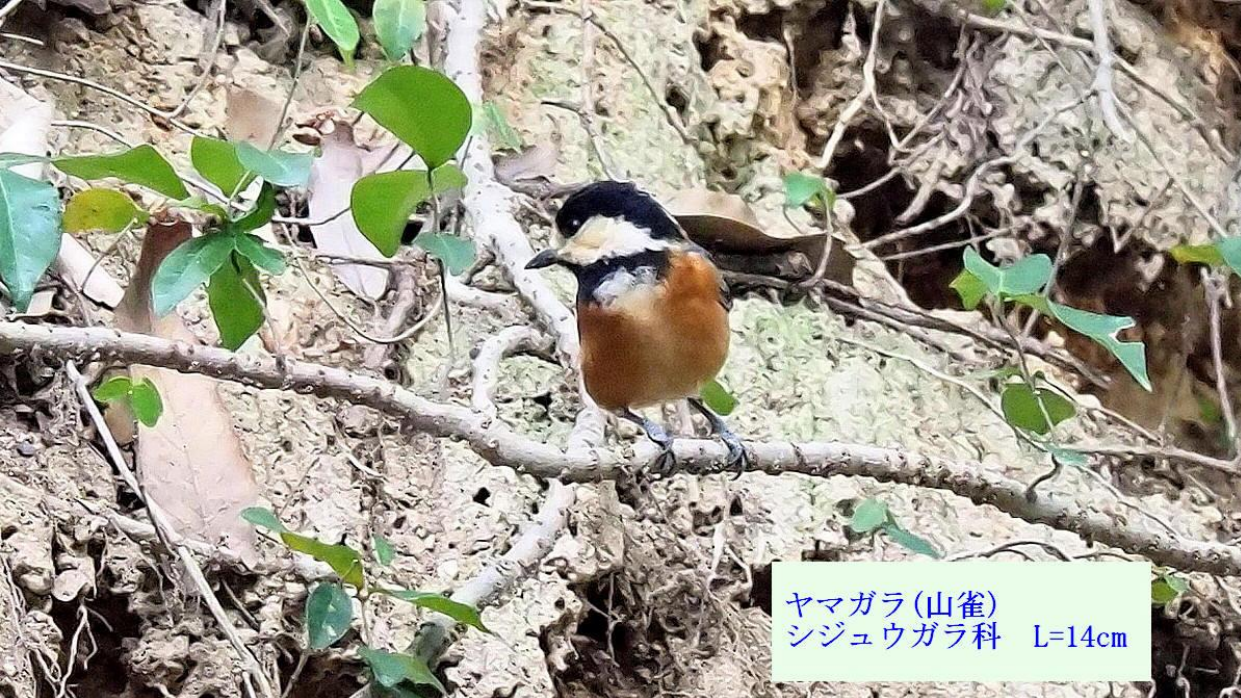
ヤマガラ(山雀) シジュウガラ科 L=14cm