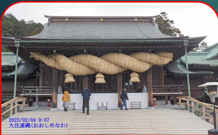
2023/02/04 9:57 大注連縄(おおしめなわ)