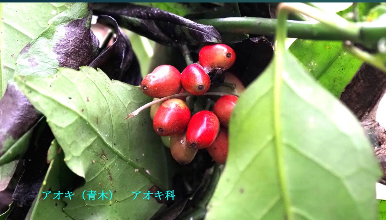
アオキ (青木) アオキ科