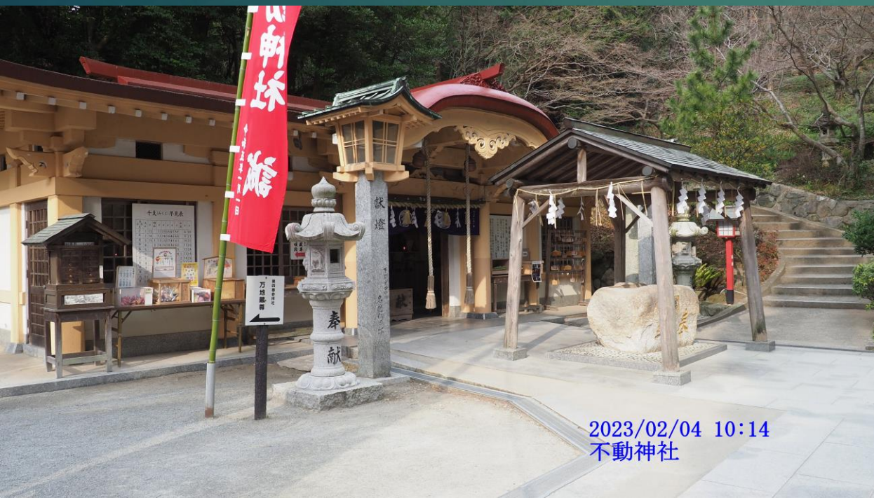
2023/02/04 10:14 不動神社