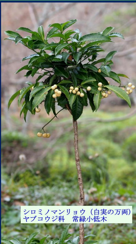
シロミノマンリョウ (白実の万両) ヤブコウジ科 常緑小低木