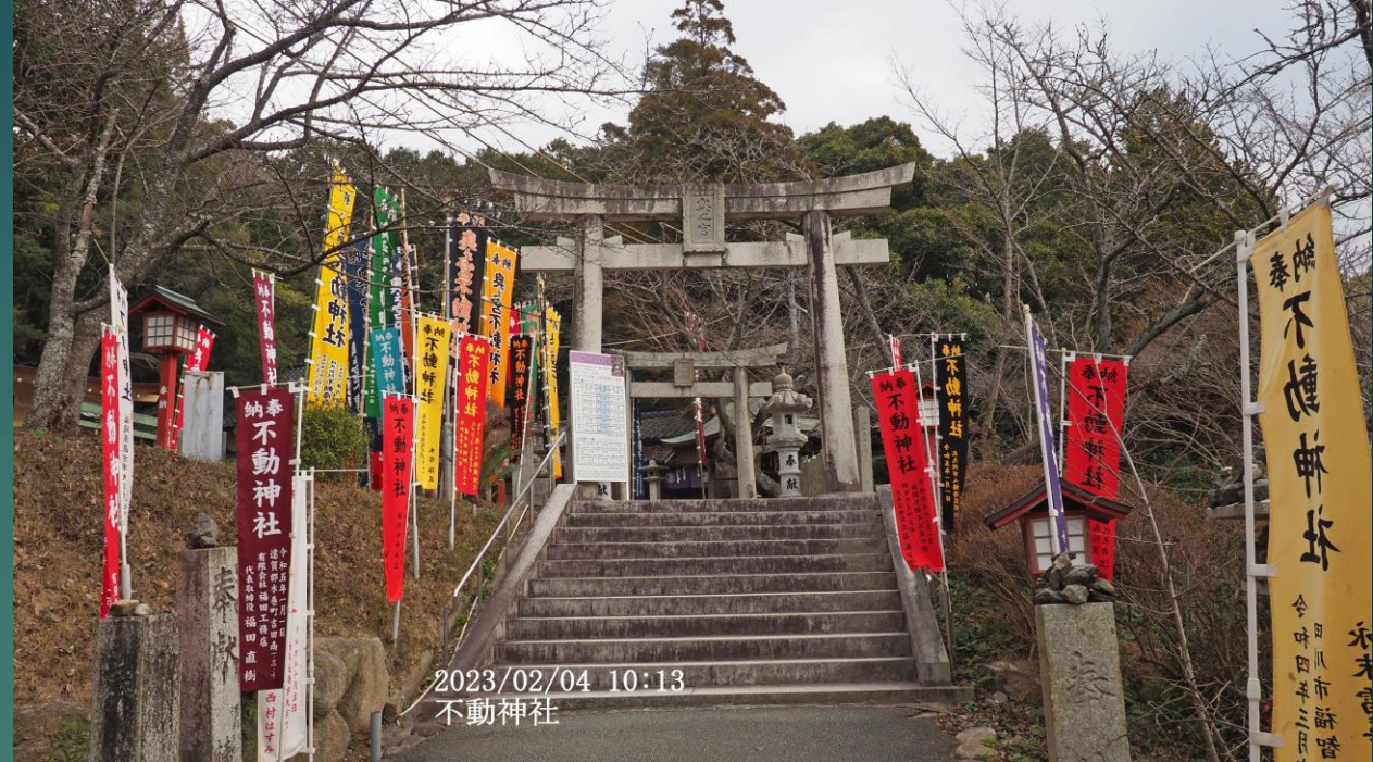
2023/02/04 10:13 不動神社