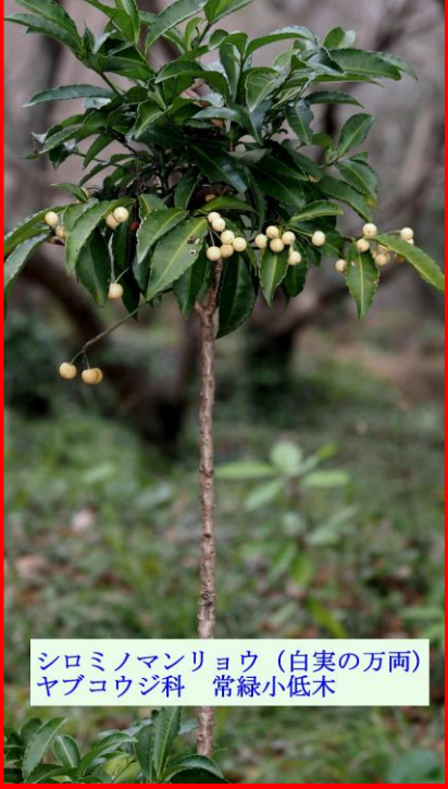
シロミノマンリョウ (白実の万両) ヤブコウジ科 常緑小低木