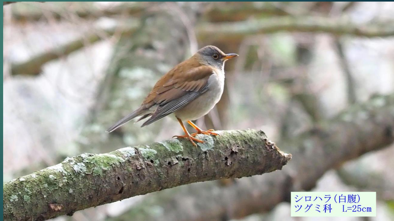
シロハラ(白腹) ツグミ科 L=25cm