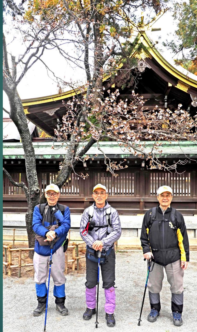
2023/02/04 10:05 宮地嶽神社・開運桜