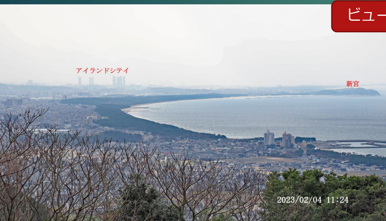
アイランドシティ