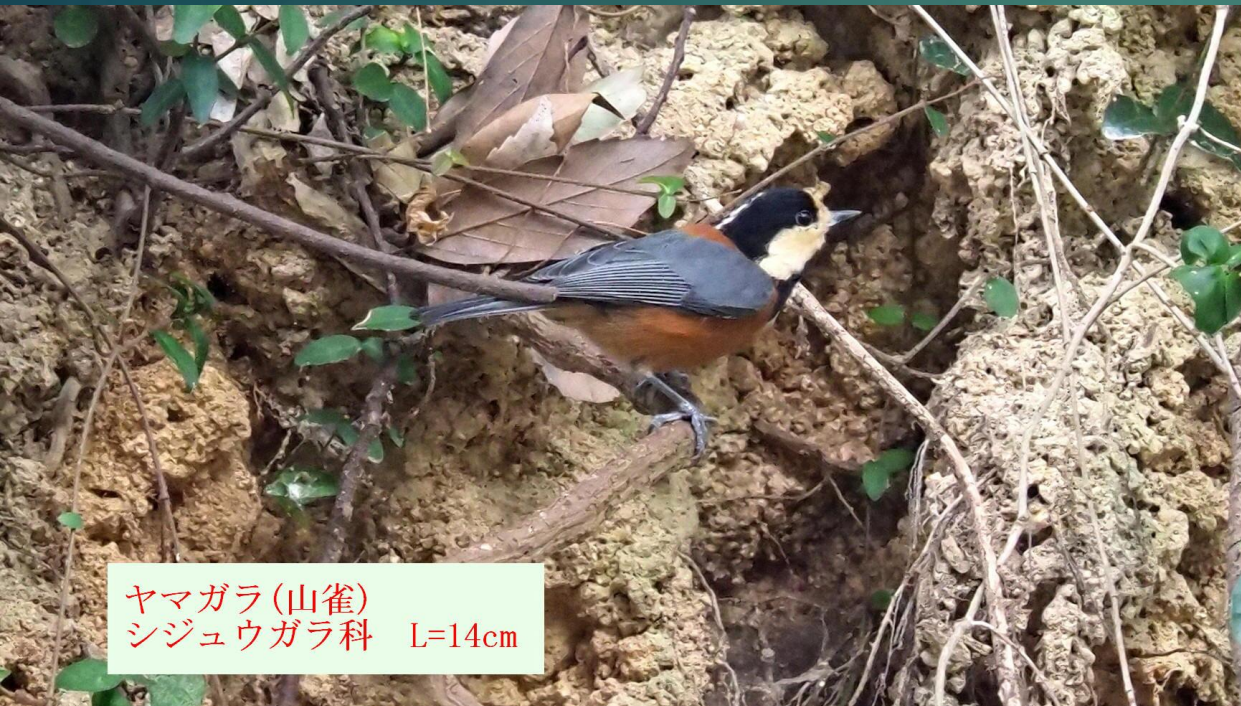
ヤマガラ(山雀) シジュウガラ科 L=14cm