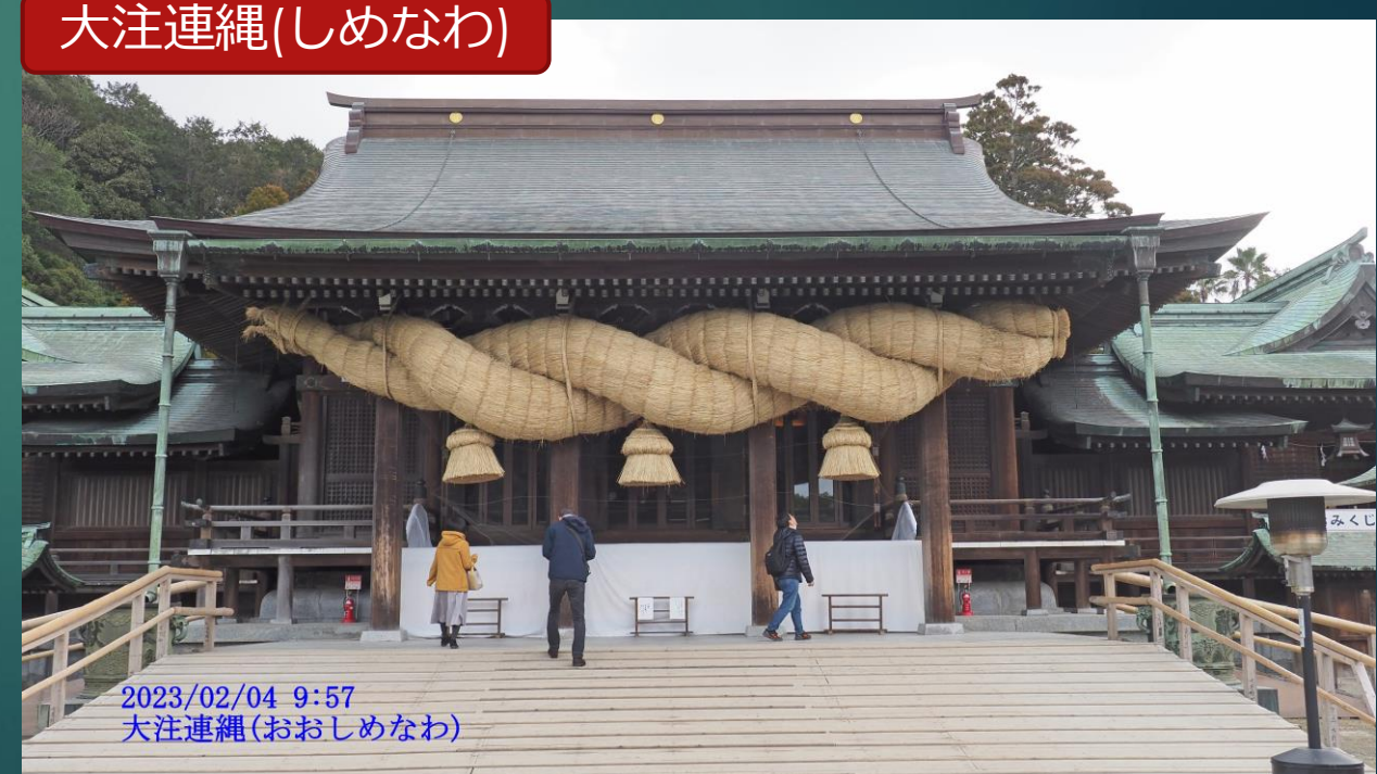
大注連縄(しめなわ)