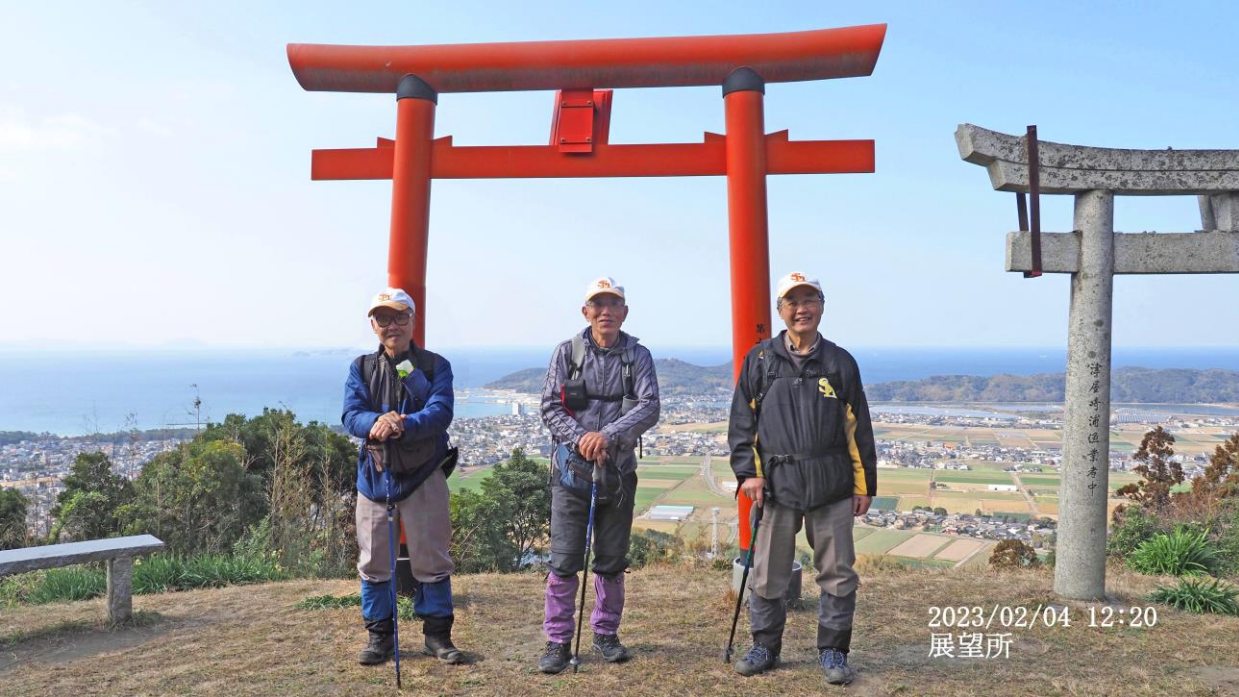
2023/02/04 12:20 展望所