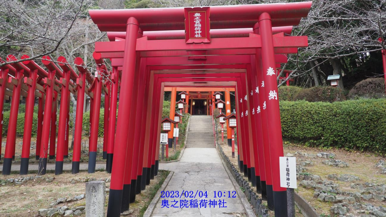
2023/02/04 10:12 奥之院稻荷神社