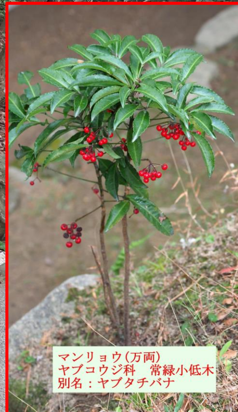
マンリョウ (万両) ヤブコウジ科 常緑小低木 別名：ヤブタチバナ