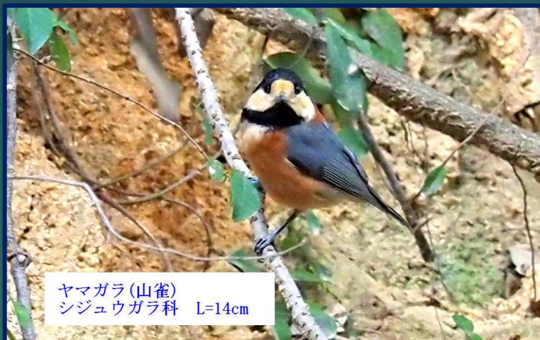
ヤマガラ (山雀) シジュウガラ科 L=14cm