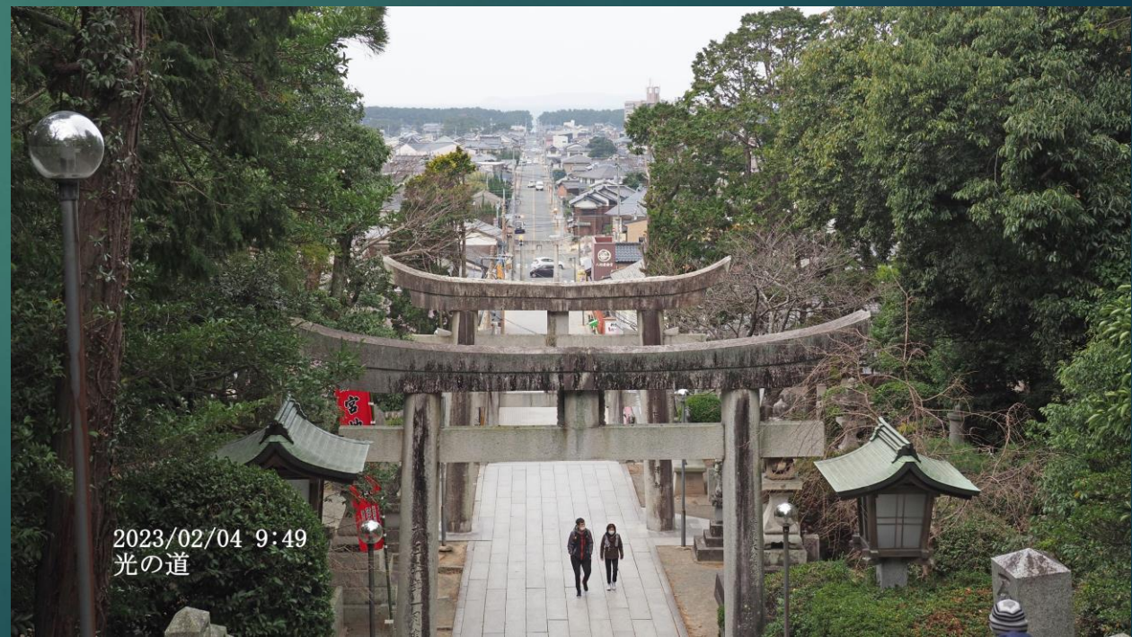
2023/02/04 9:49 光の道