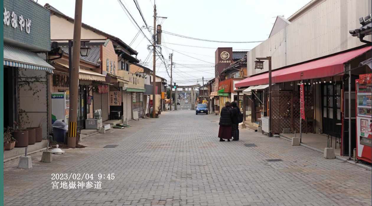
2023/02/04 9:45 宮地嶽神参道