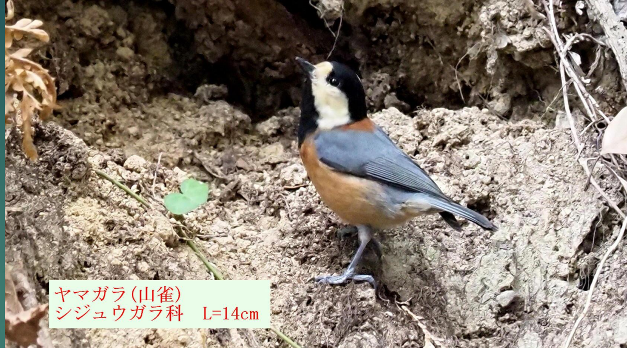
ヤマガラ(山雀) シジュウガラ科 L=14cm