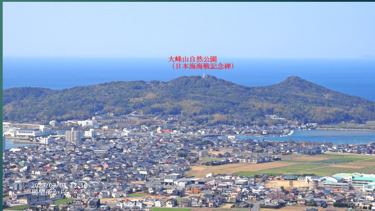
大峰山自然公園 (日本海海戦記念碑)