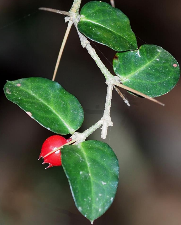
アリドオシ(蟻通し) アカネ科 別名：イチリョウ(一両)