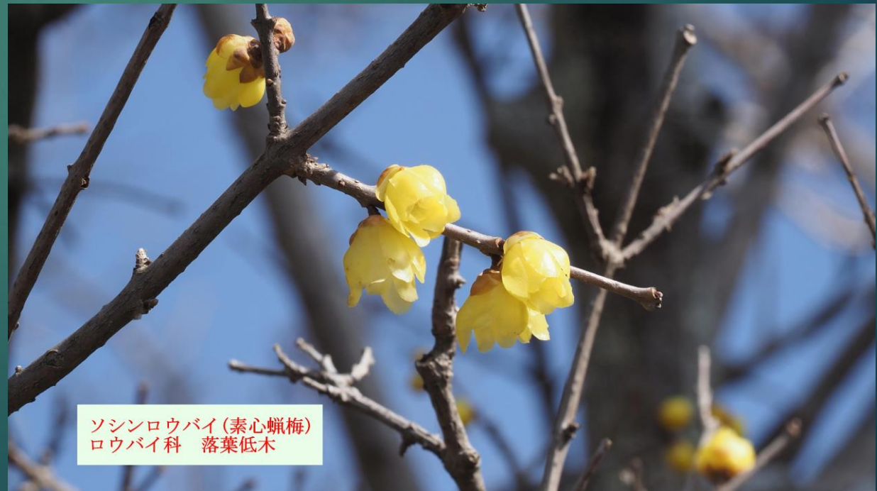
ソシンロウバイ(素心臘梅) ロウバイ科 落葉低木