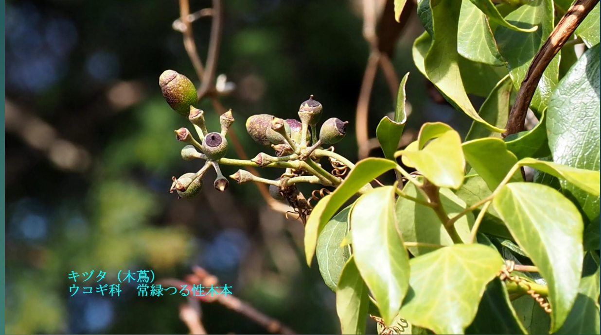
キツタ(木葛) ウコギ科 常緑つる性木本