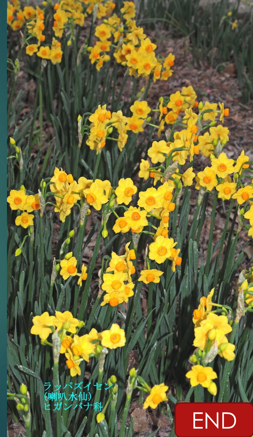
ラッパズイセン (喇叭水仙) ヒガンバナ科