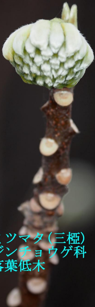
ミツマタ (三極) ジンチョウゲ科 落葉低木