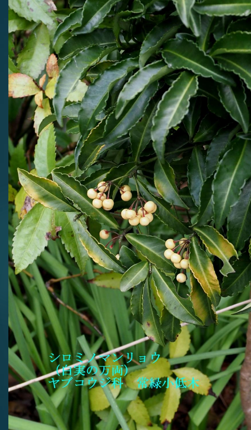
シロミノマンリョウ (白実の万両) ヤブコウジ科 常緑小低木