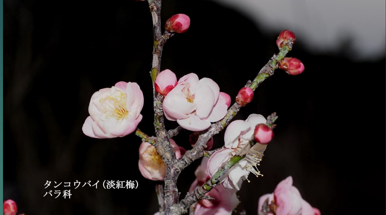
タンコウバイ (淡紅梅) バラ科