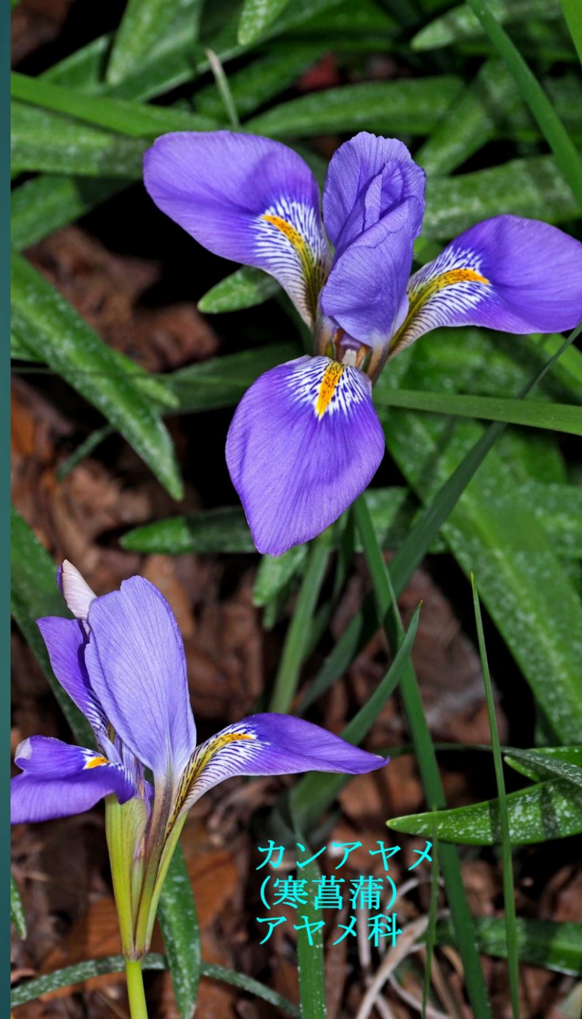
カンアヤメ (寒菖蒲) アヤメ科