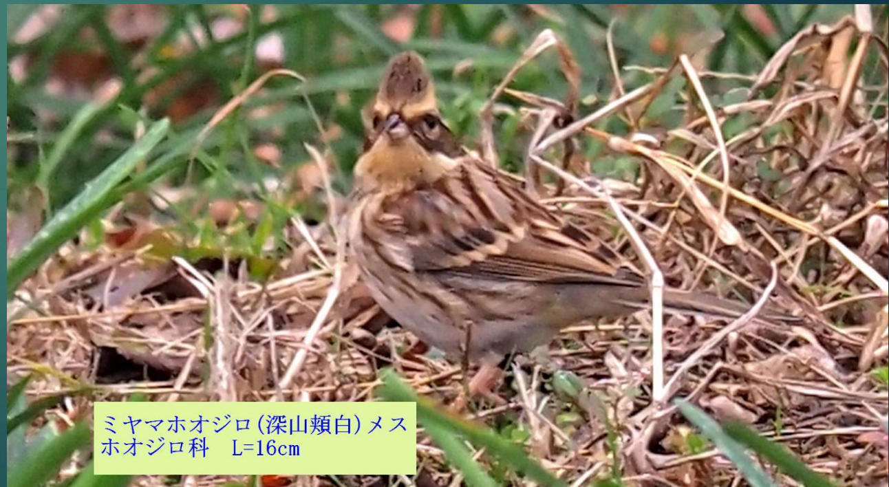
ミヤマホオジロ (深山頬白) メス ホオジロ科 L=16cm