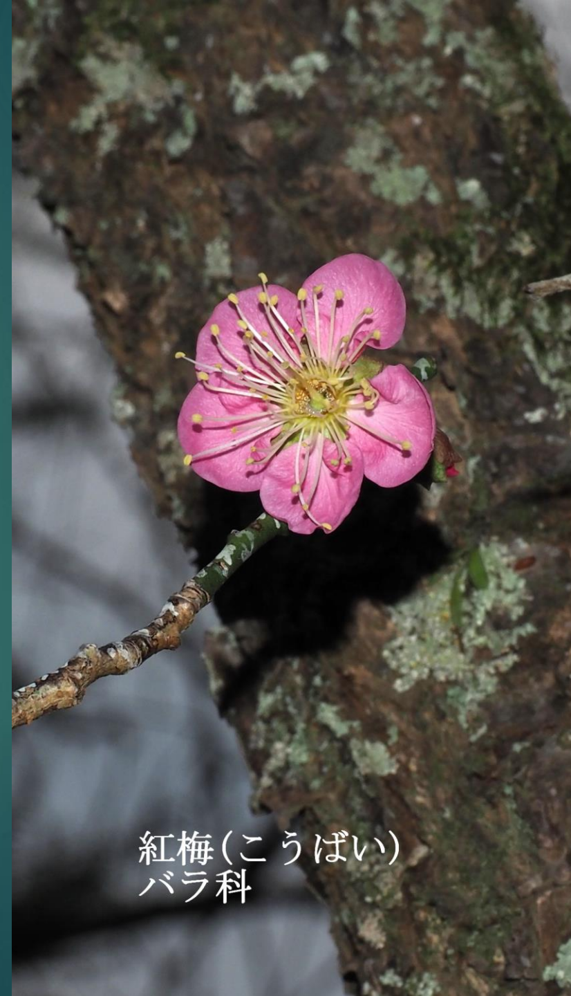
紅梅(こうばい) バラ科