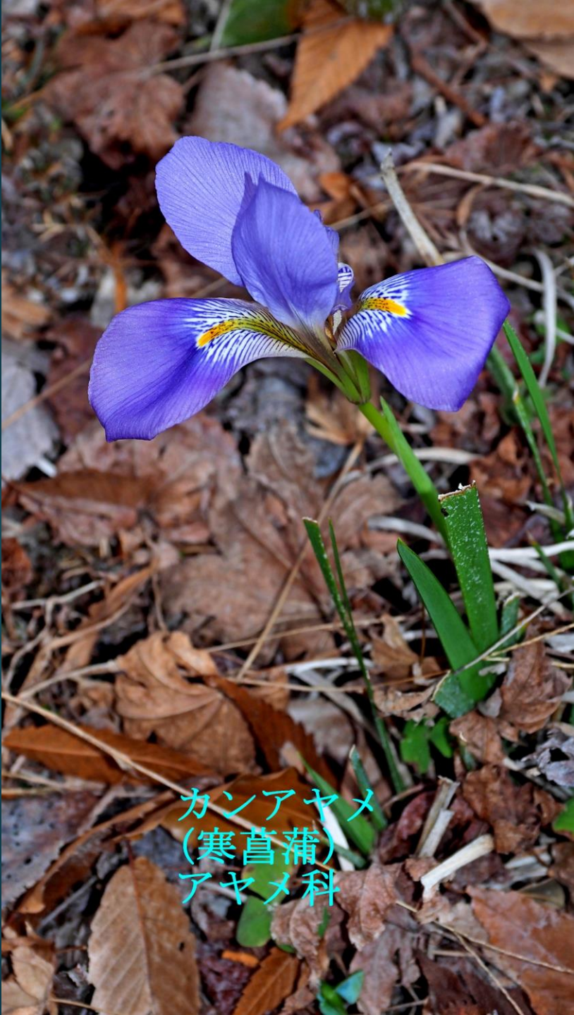
カンアヤメ (寒菖蒲) アヤメ科