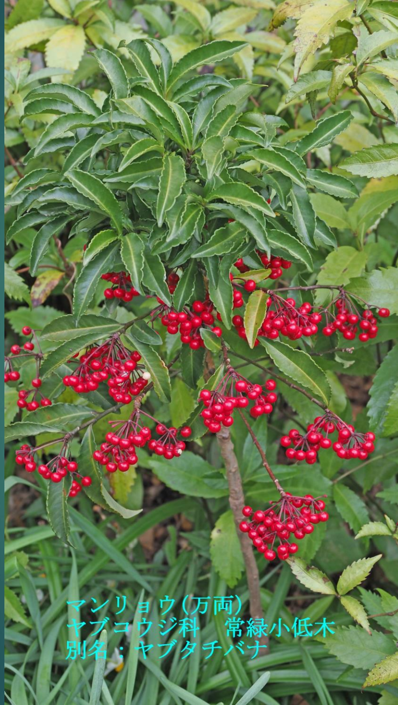
マンリョウ(万両) ヤブコウジ科 常緑小低木 別名：ヤブタチバナ