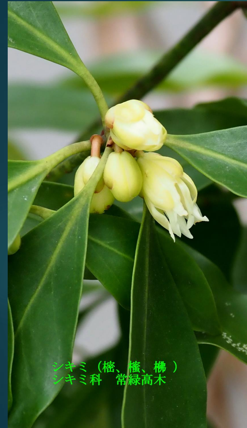
シキミ ( 檜、樅、榎 ) シキミ科 常緑高木