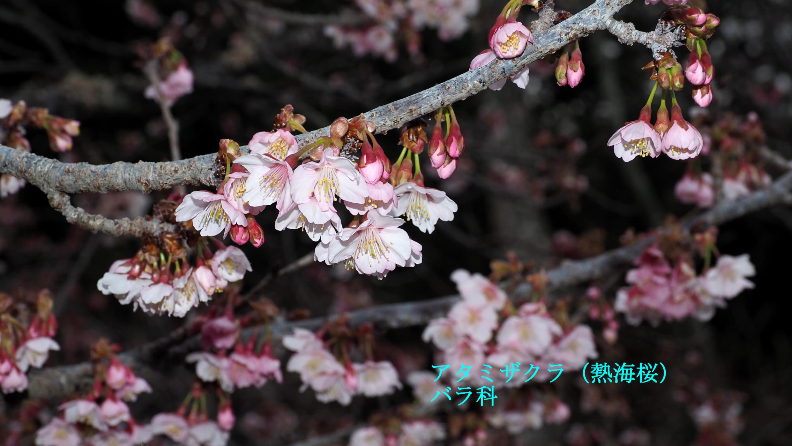
アタミザクラ (熱海桜) バラ科