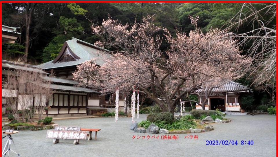
タンコウバイ (淡紅梅) バラ科