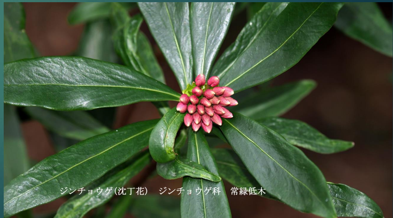
ジンチョウゲ(沈丁花) ジンチョウゲ科 常緑低木