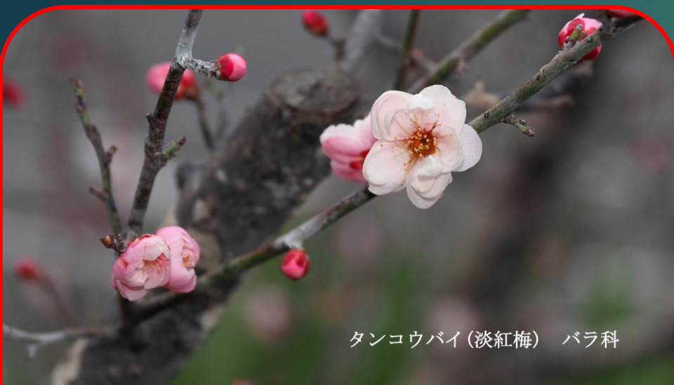
タンコウバイ (淡紅梅) バラ科