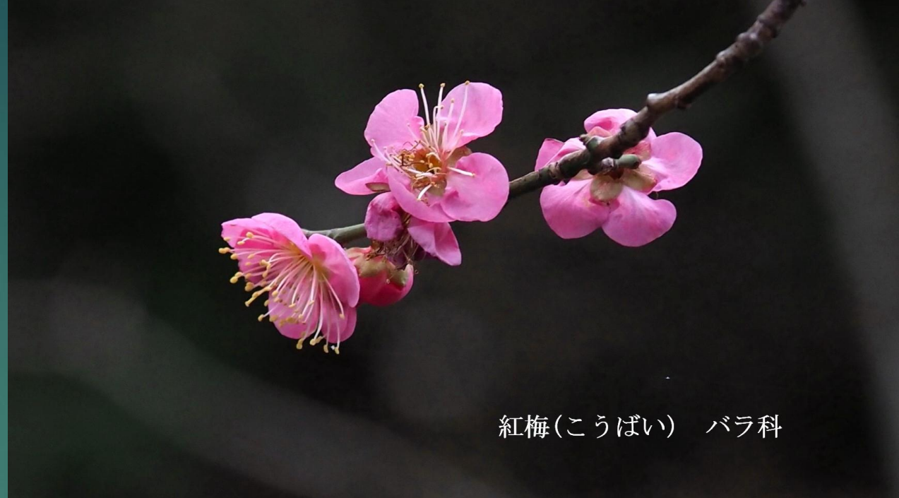
紅梅(こうばい) バラ科