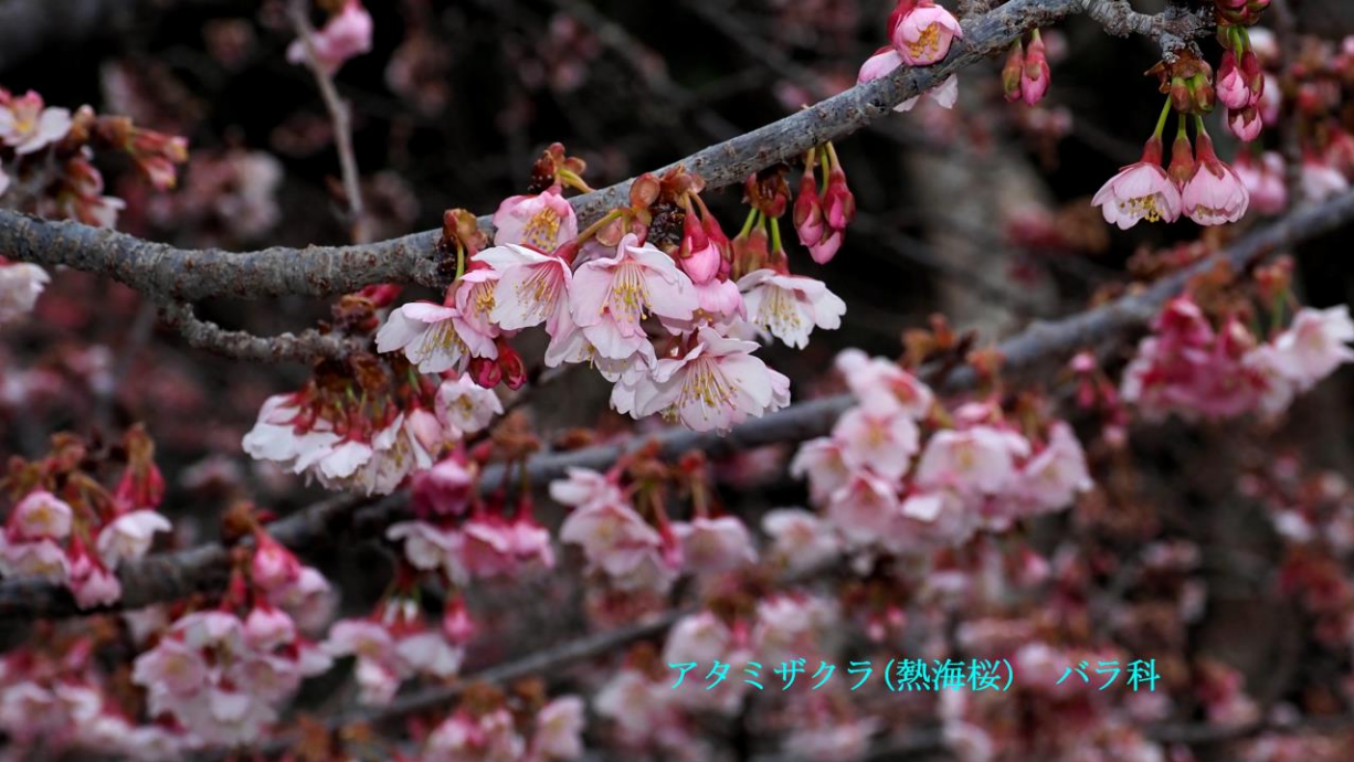
アタミザクラ(熱海桜) バラ科