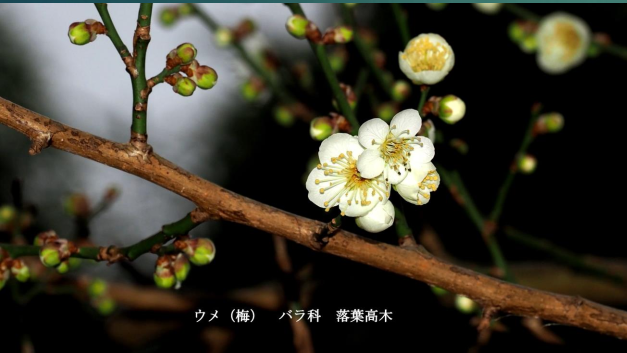
ウメ(梅) バラ科 落葉高木