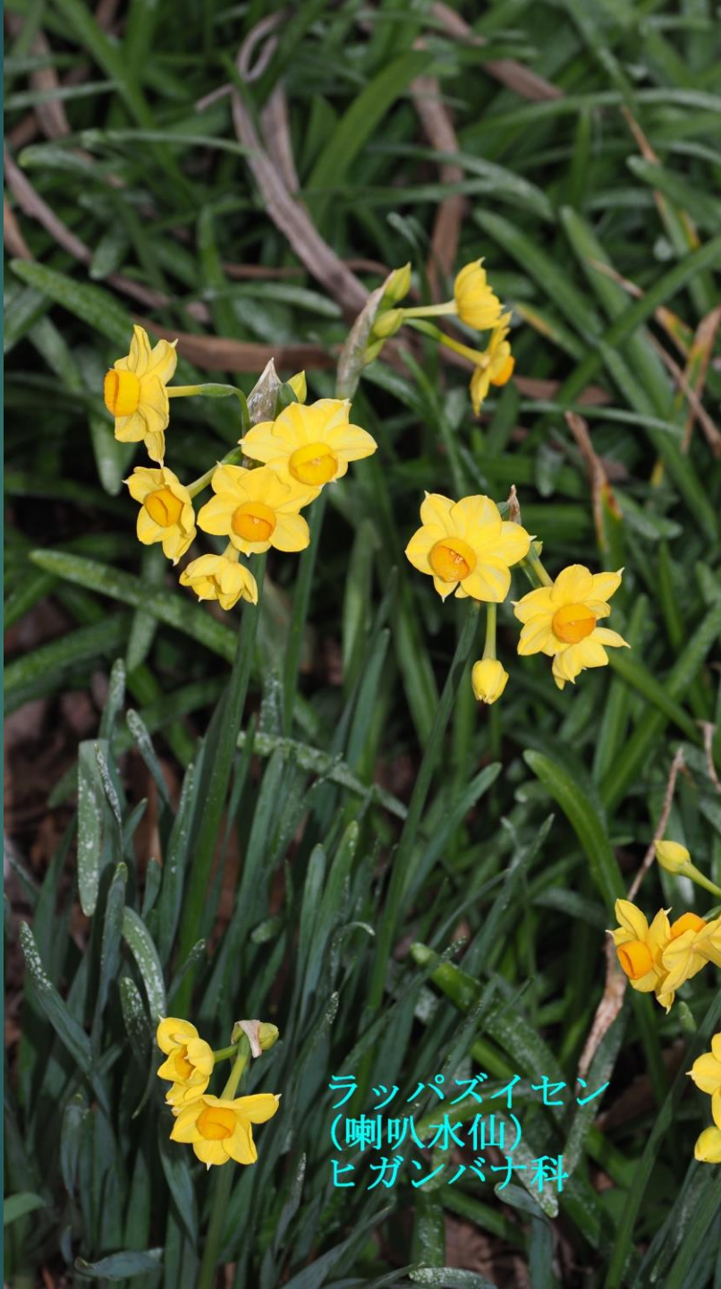
ラッパズイセン (喇叭水仙) ヒガンバナ科