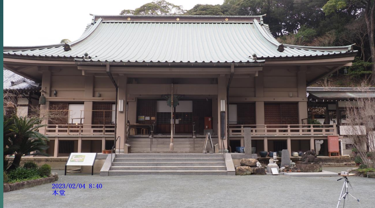
2023/02/04 8:40 本堂