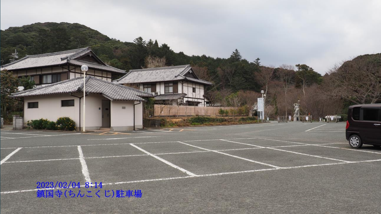
2023/02/04 8:14 鎮国寺(ちんこくじ)駐車場