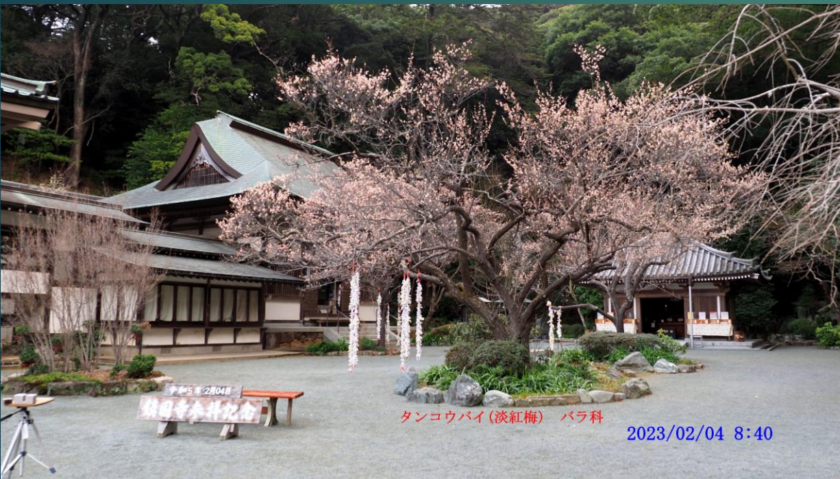
タンコウバイ(淡紅梅) バラ科