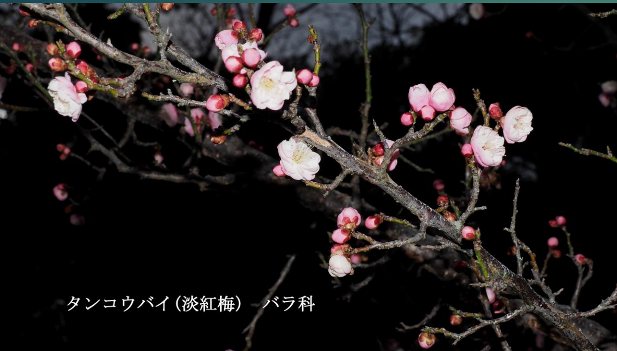
タンコウバイ (淡紅梅) バラ科