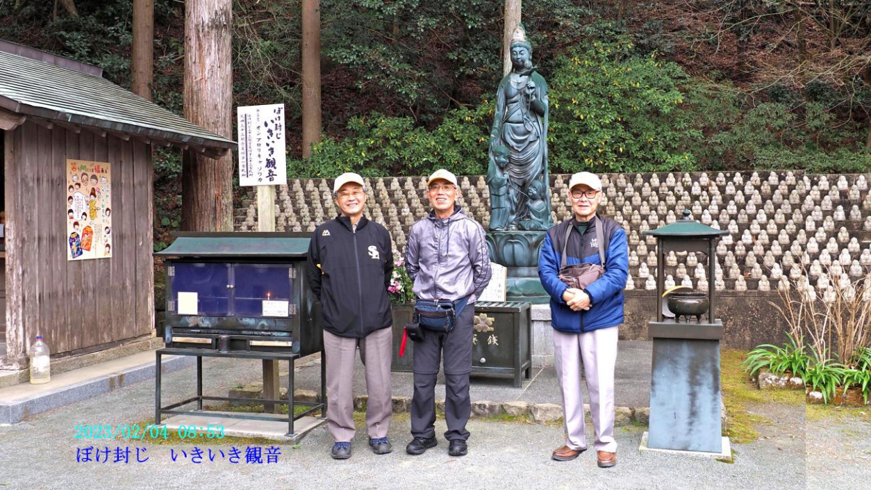
2023/02/04 08:53 ぼけ封じ いきいき観音