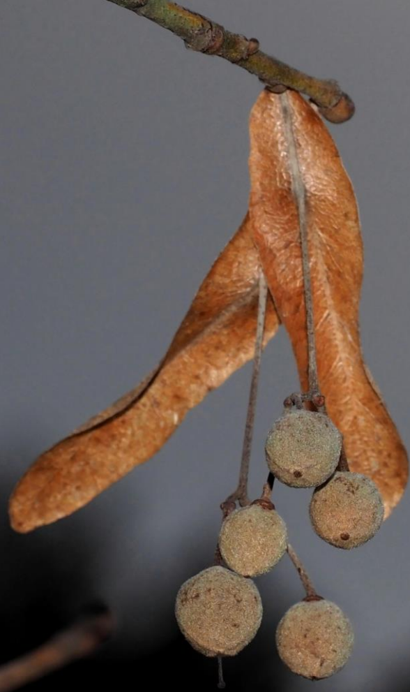
ボダイジュ (菩提樹) シナノキ科