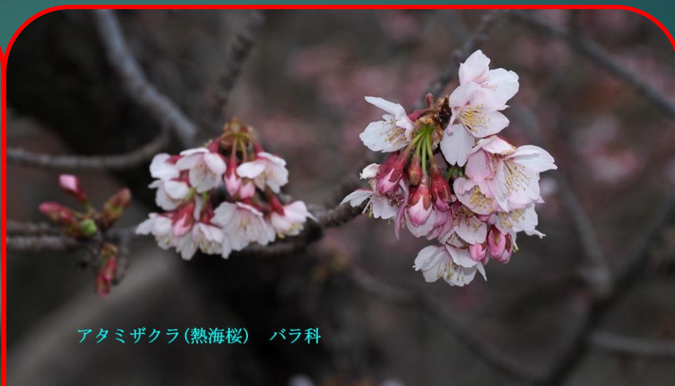
アタミザクラ (熱海桜) バラ科