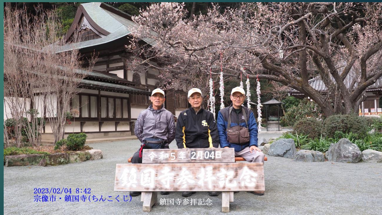
2023/02/04 8:42 宗像市・鎮国寺(ちんこくじ)