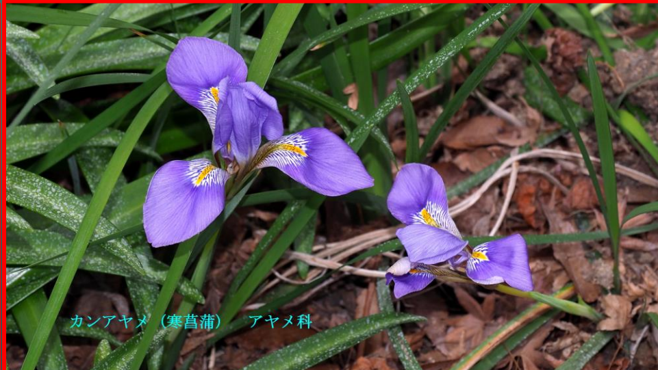
カンアヤメ (寒菥蒲) アヤメ科