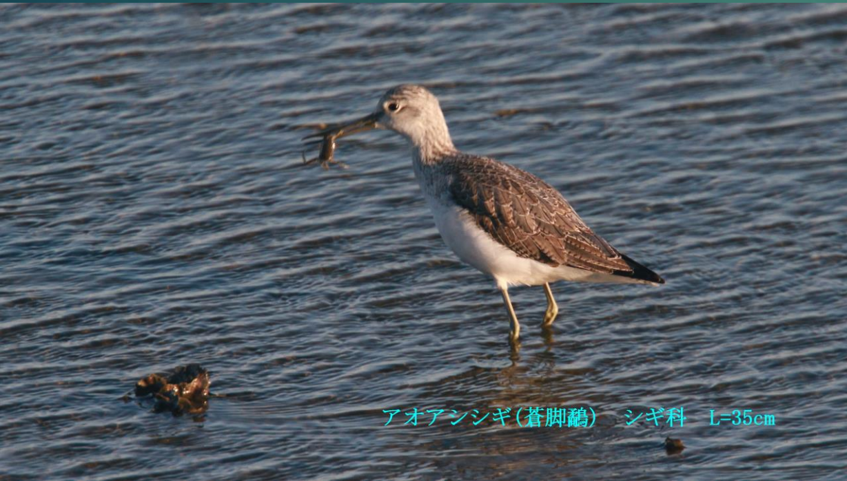
アオアシシギ(蒼脚鶉) シギ科 L=35cm