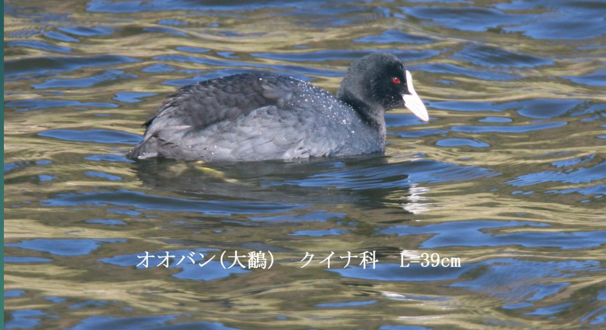
オオバン(大鵜) クイナ科 L=39cm