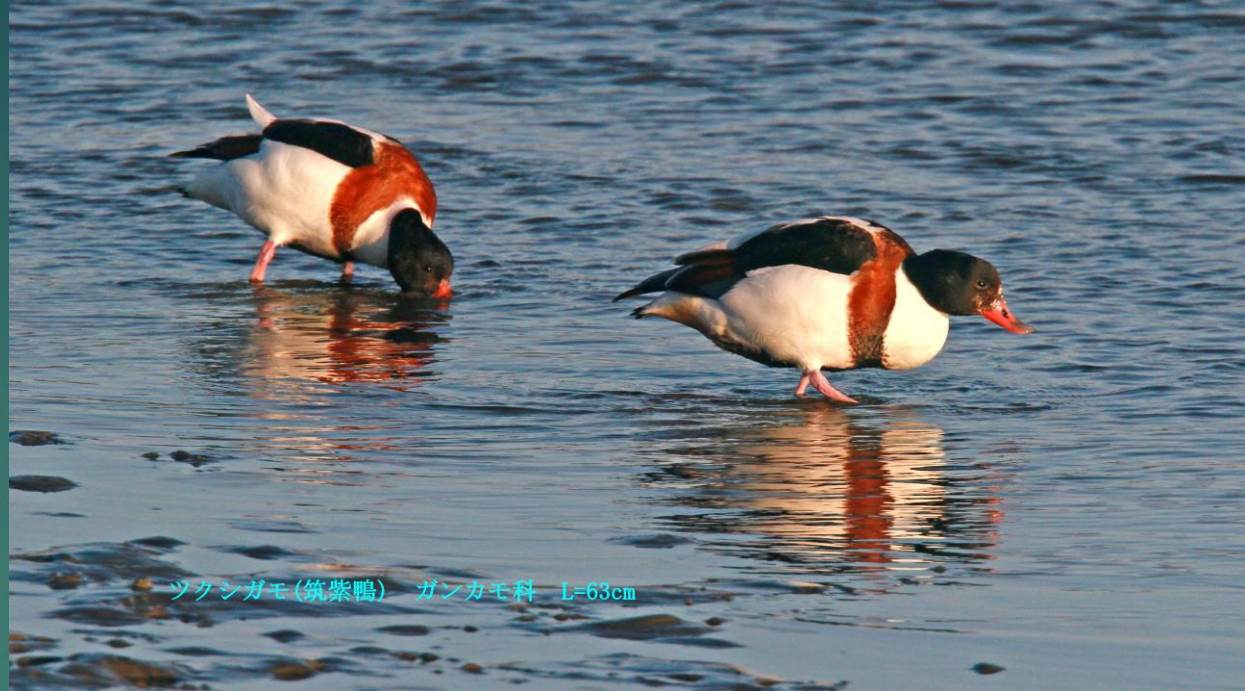
ツクシガモ(筑紫鴨) ガンカモ科 L=63cm