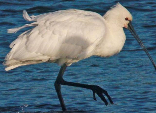
ヘラサギ(篋鷺) トキ科 L=86cm