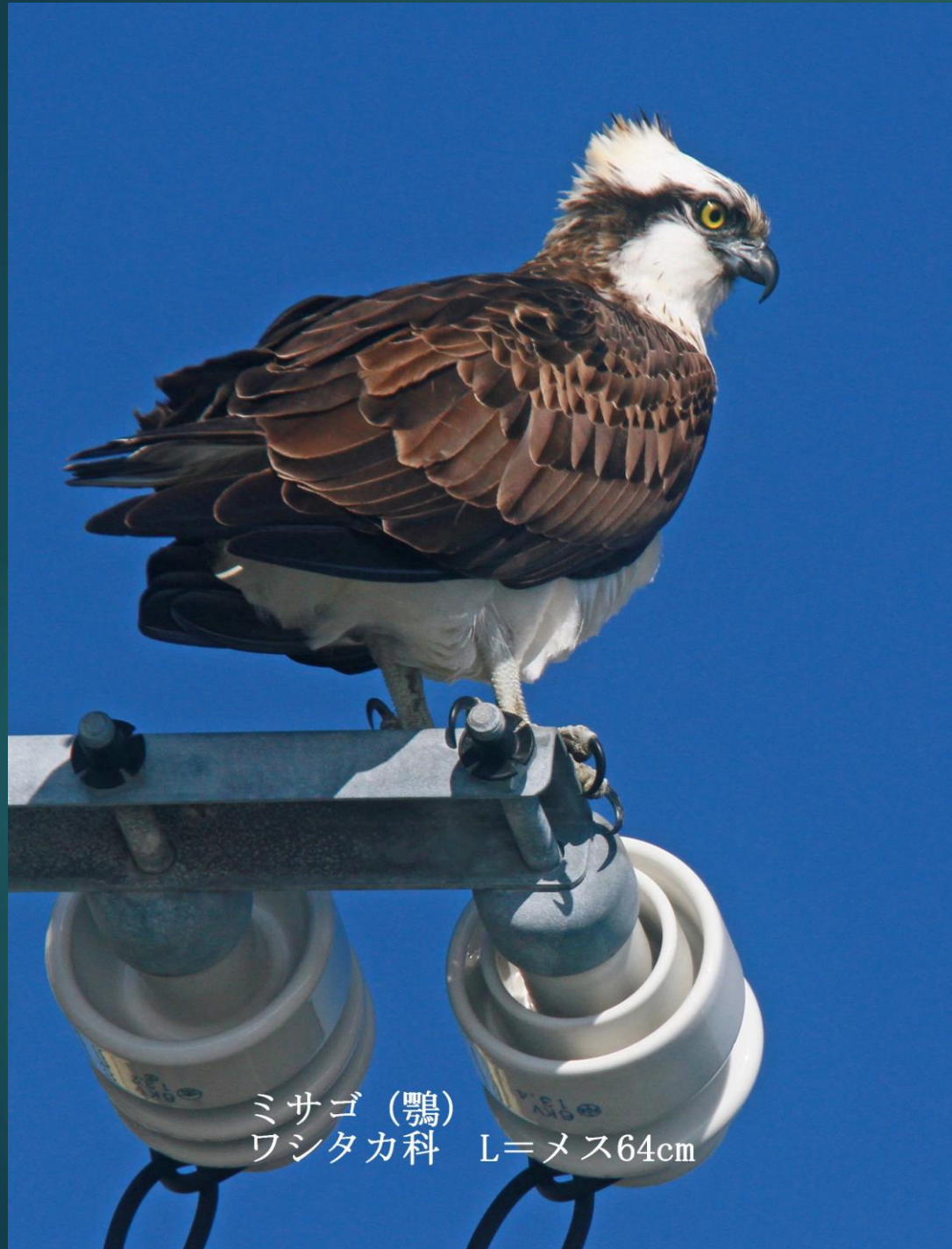
ミサゴ (鵟) ワシタカ科 L=メス64cm