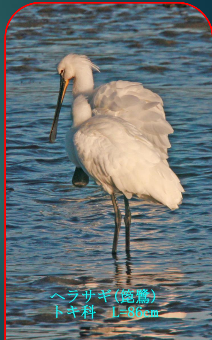
ヘラサギ (篋鷺) トキ科 L=86cm