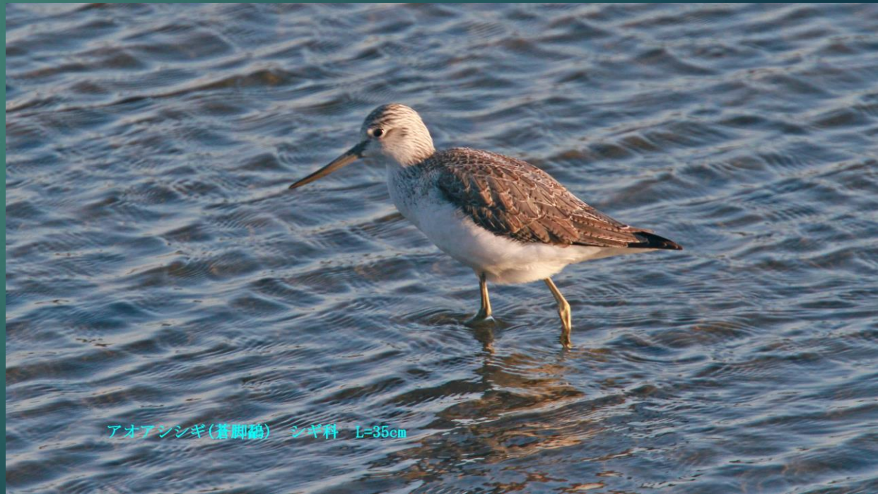
アオアシシギ(蒼脚鶉) シギ科 L=35cm