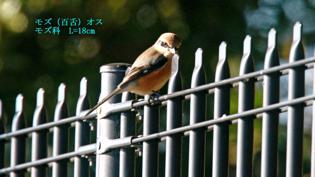
モズ (百舌) オス モズ科 L=18cm