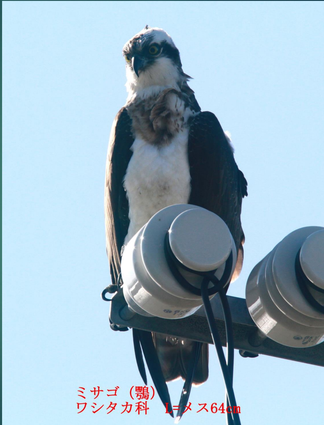
ミサゴ (鵟) ワシタカ科 L=メス64cm