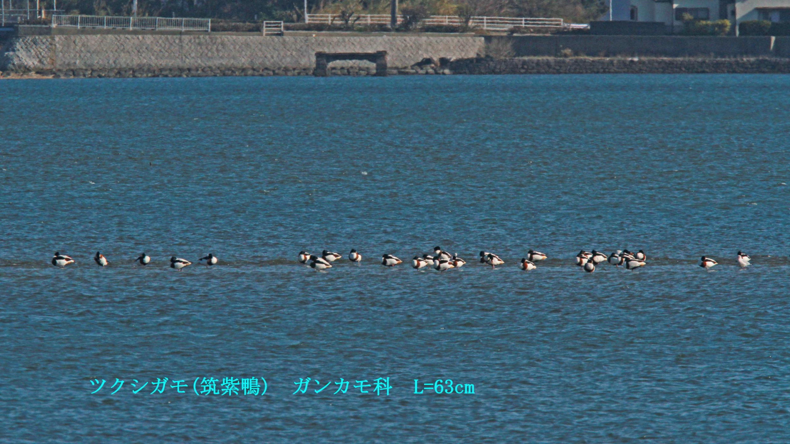
ツクシガモ(筑紫鴨) ガンカモ科 L=63cm