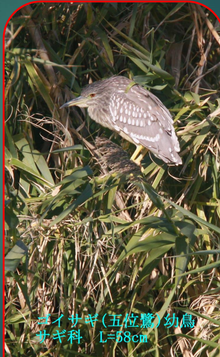
ゴイサギ (五位鷺) 幼鳥 サギ科 L=58cm