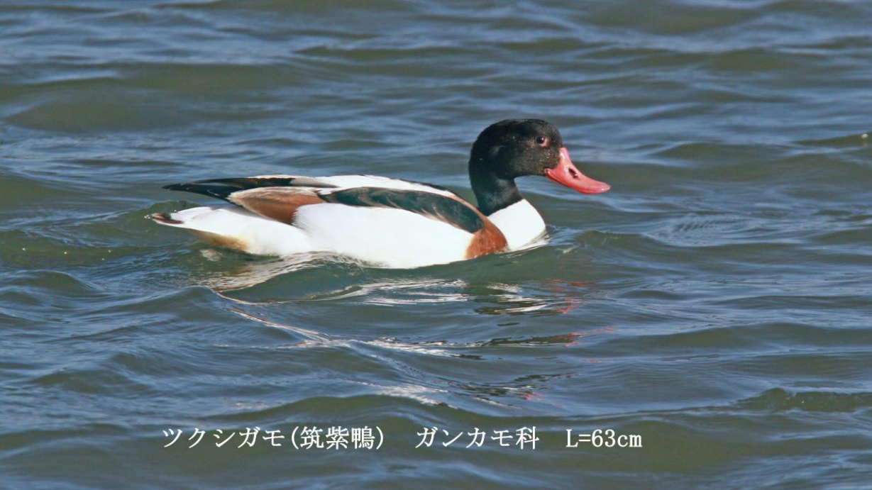
ツクシガモ(筑紫鴨) ガンカモ科 L=63cm