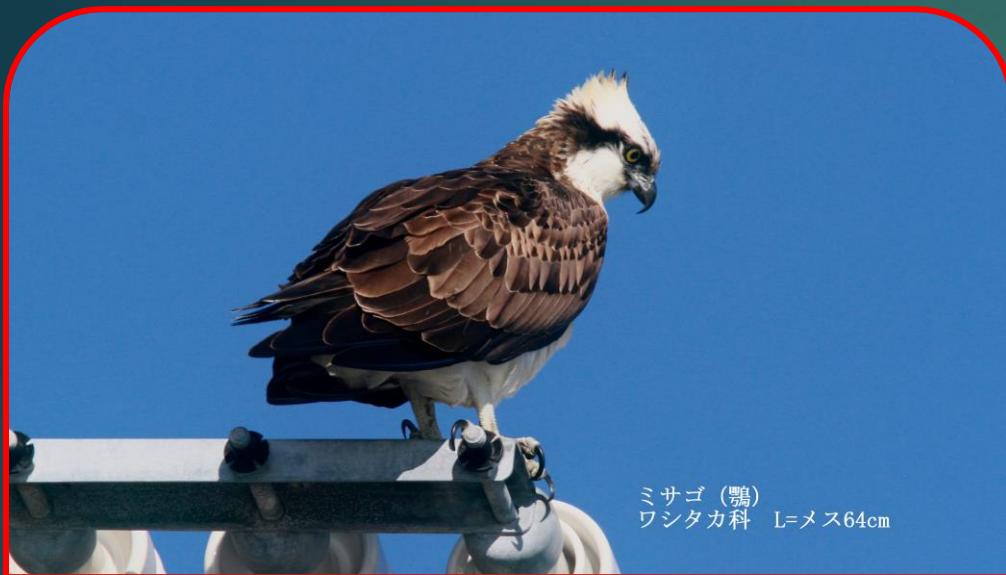
ミサゴ (鵟) ワシタカ科 L=メス64cm