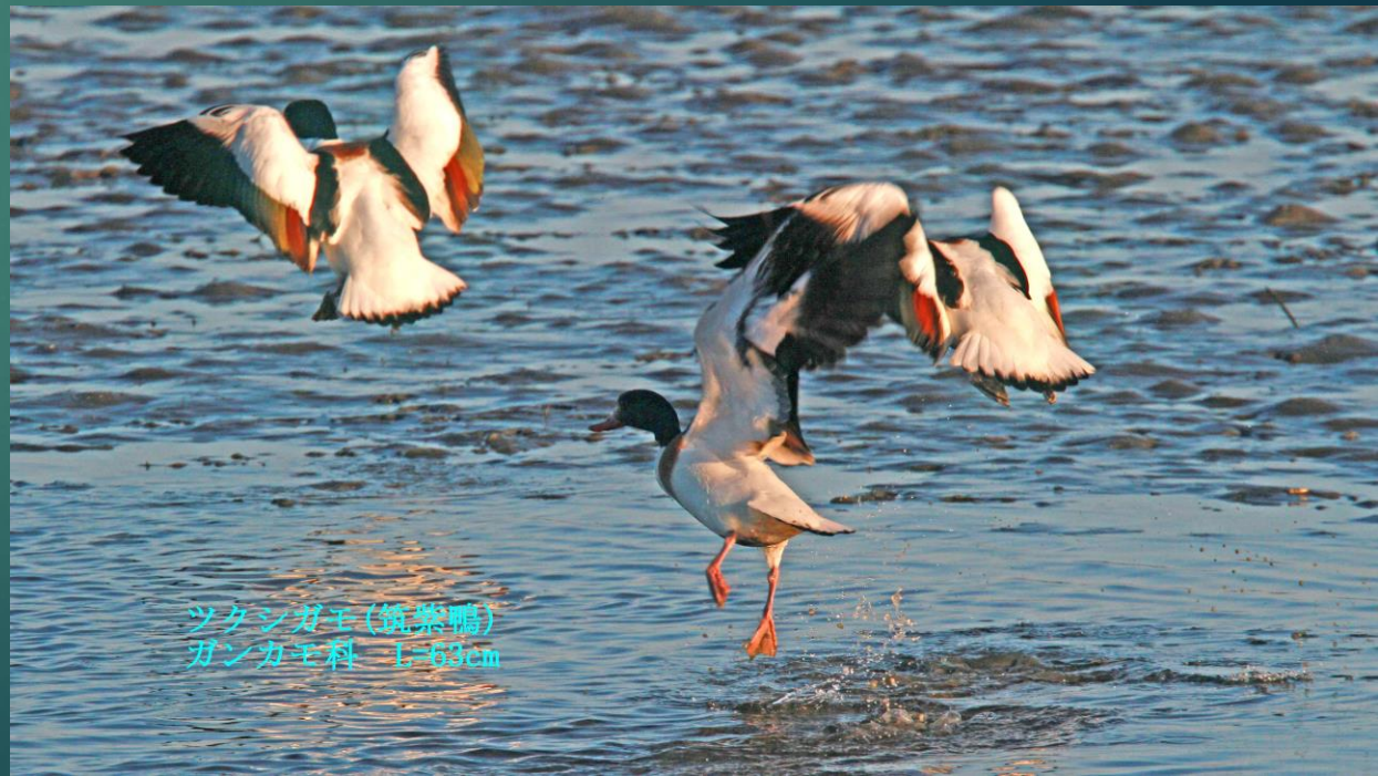
ツクシガモ(筑紫鴨) ガンカモ科 L=63cm