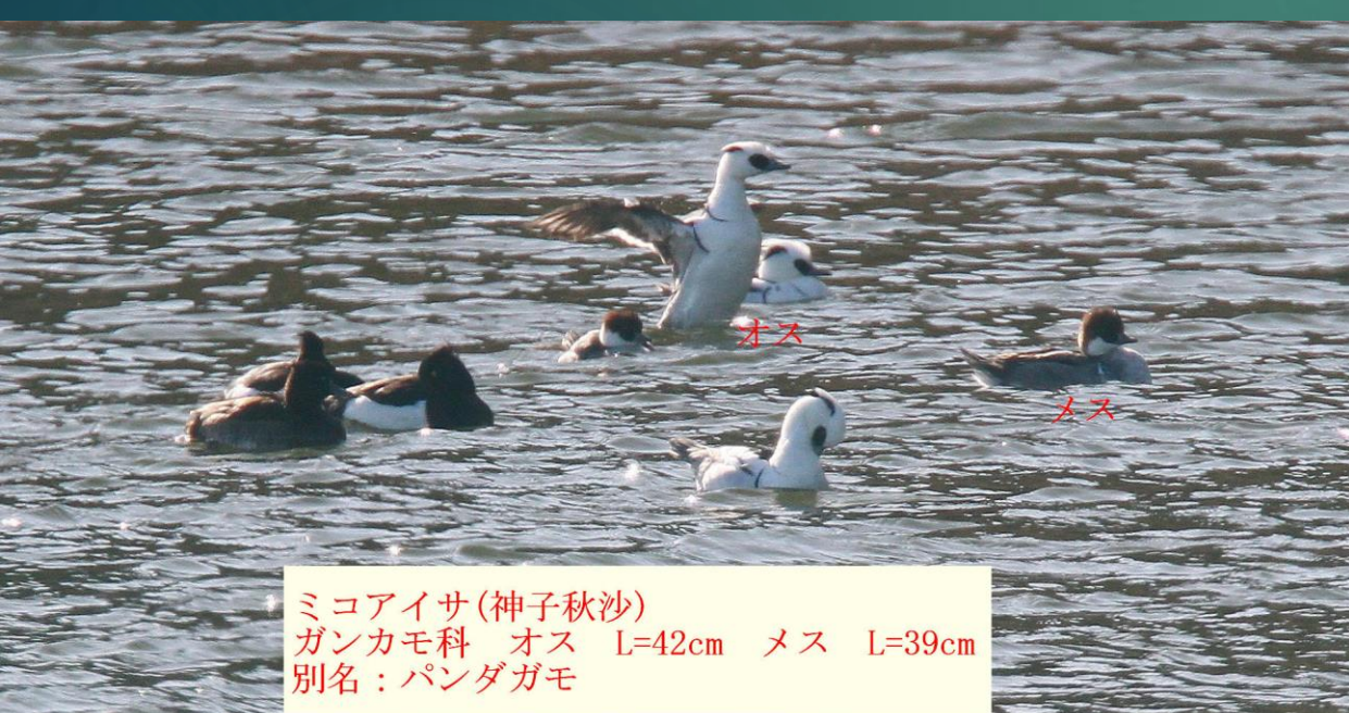
ミコアイサ (神子秋沙) ガンカモ科 オス L=42cm メス L=39cm 別名: パンダガモ