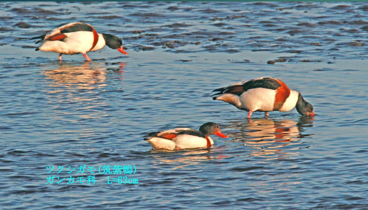
ツクシガモ(筑紫鴨) ガンカモ科 L=63cm