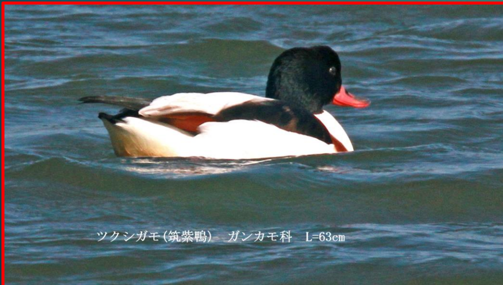
ツクシガモ (筑紫鴨) ガンカモ科 L=63cm