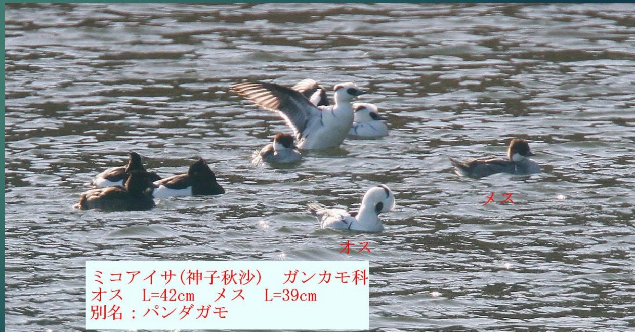
ミコアイサ (神子秋沙) ガンカモ科 オス L=42cm メス L=39cm 別名: パンダガモ