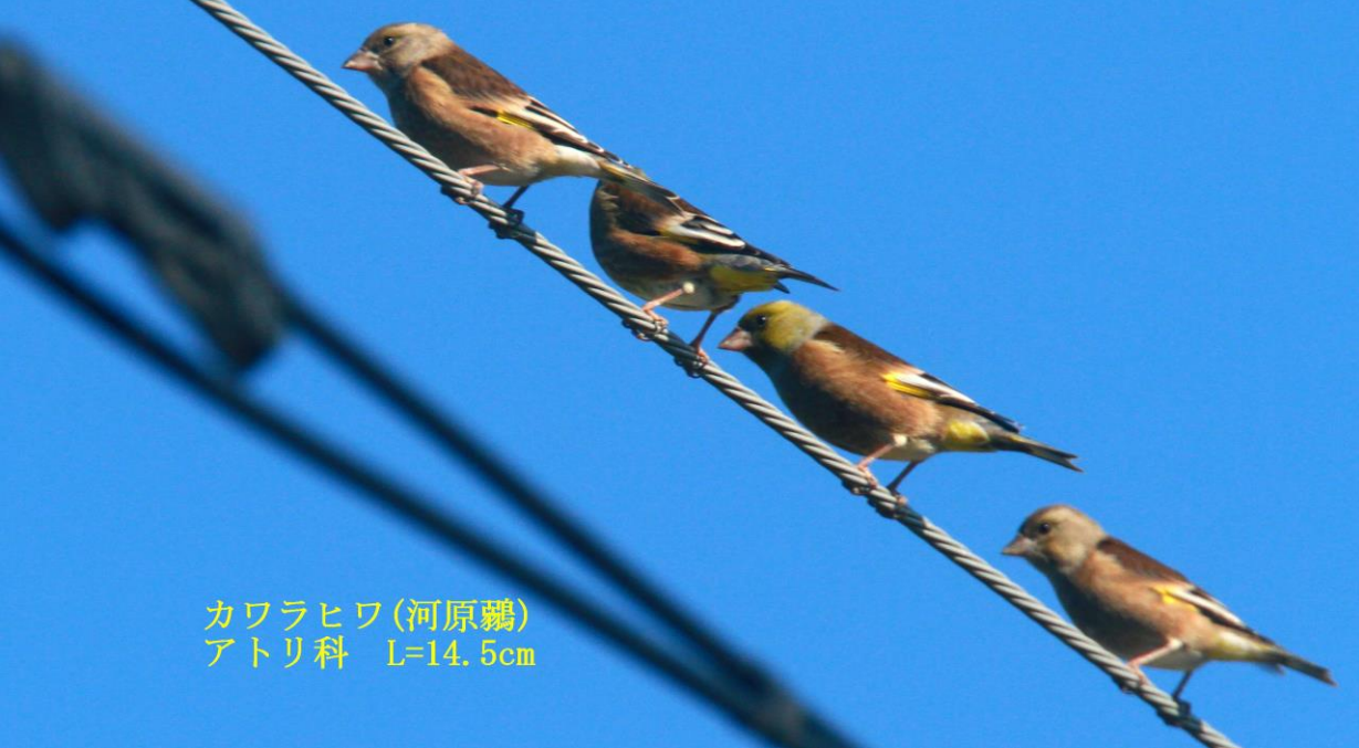
カワラヒワ(河原鶉) アトリ科 L=14.5cm