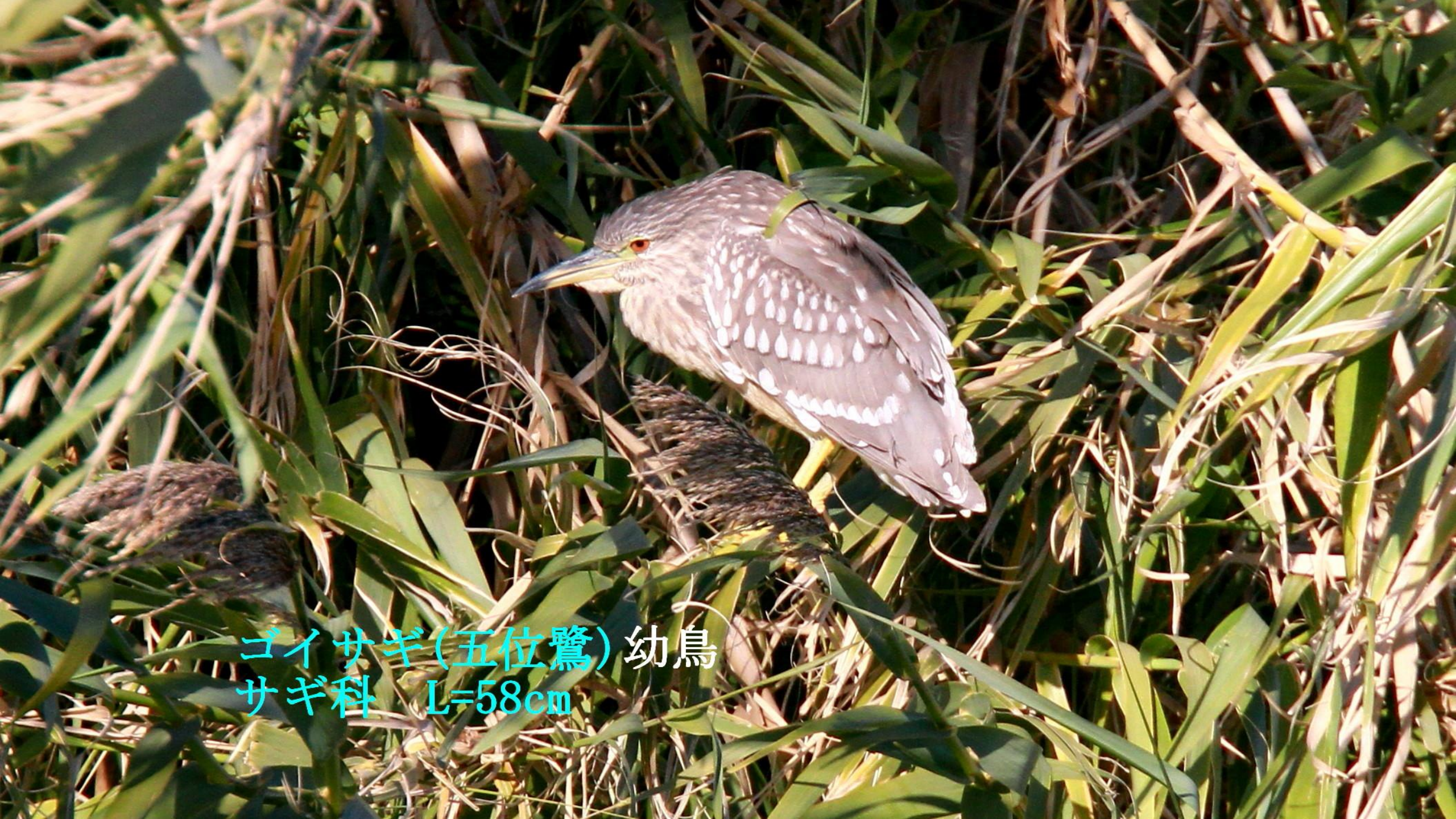
ゴイサギ(五位鷺)幼鳥 サギ科 L=58cm