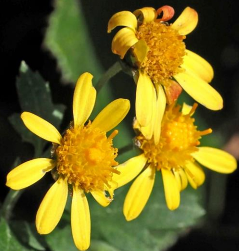
シマカンギク (島寒菊) キク科