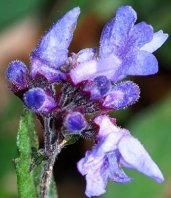
ヤマハッカ (山薄荷) シソ科