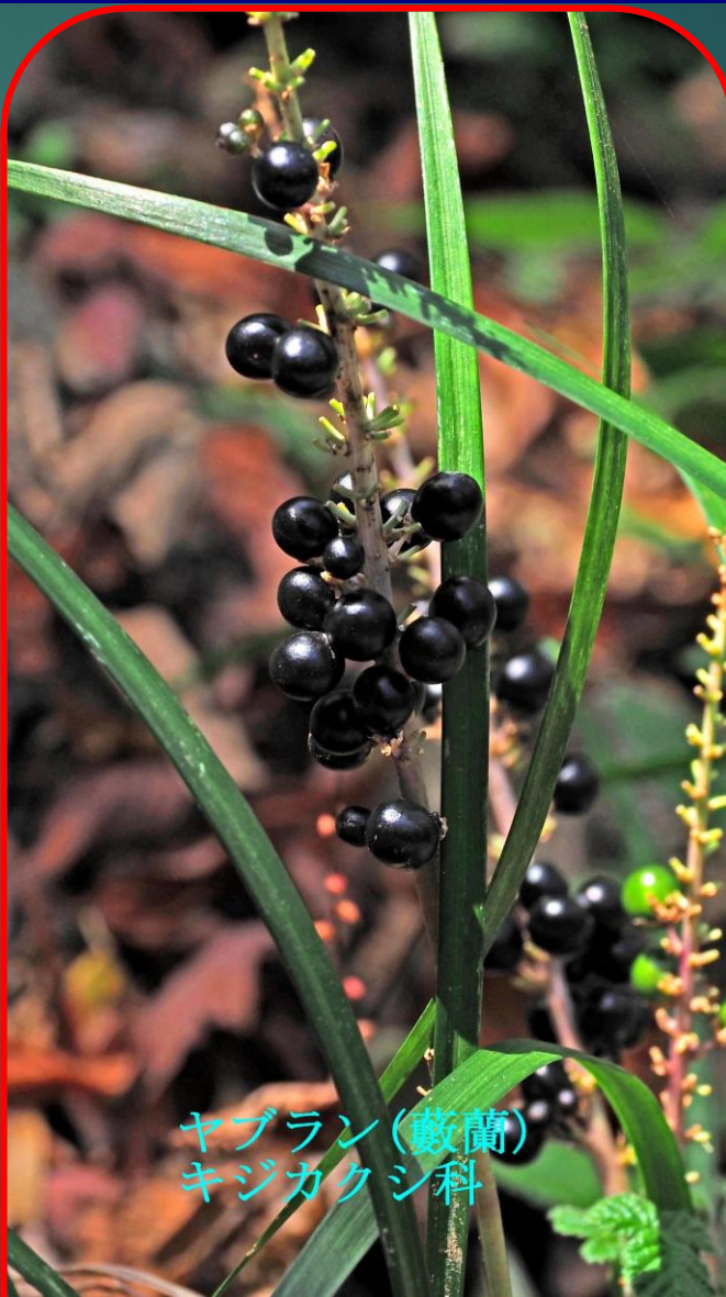
ヤブラン(藪蘭) キジカクシ科