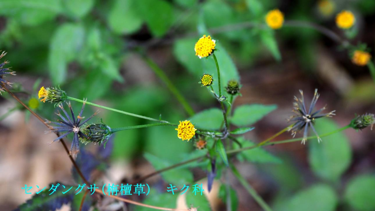
センダングサ(梅檀草) キク科