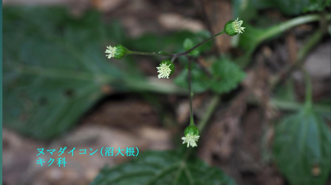
ヌマダイコン (沼大根) キク科