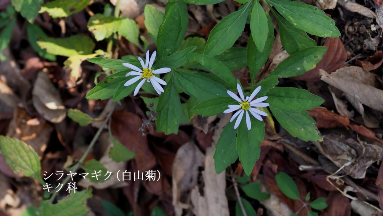
シラヤマギク (白山菊) キク科