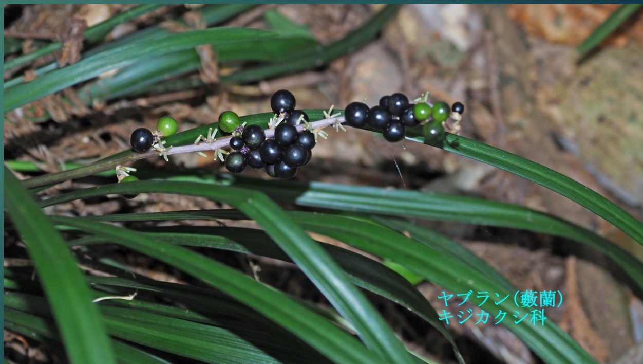
ヤブラン(藪蘭) キジカクシ科