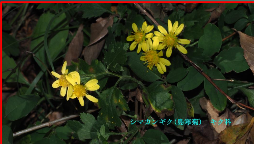
シマカンギク(島寒菊) キク科