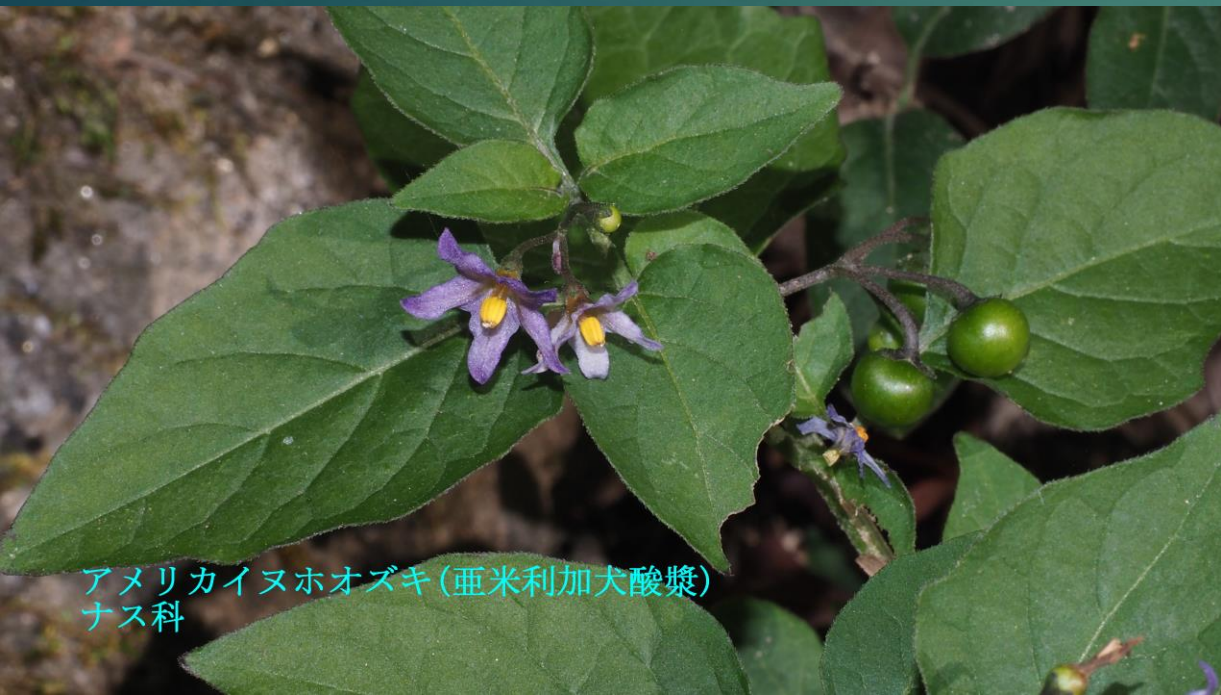
アメリカヌホオズキ (亜米利加犬酸漿) ナス科