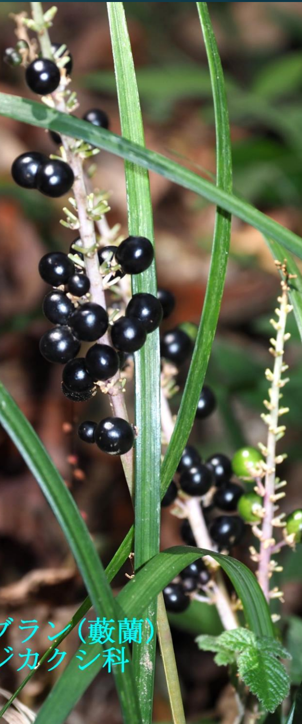
ヤブラン (藪蘭) キジカクシ科