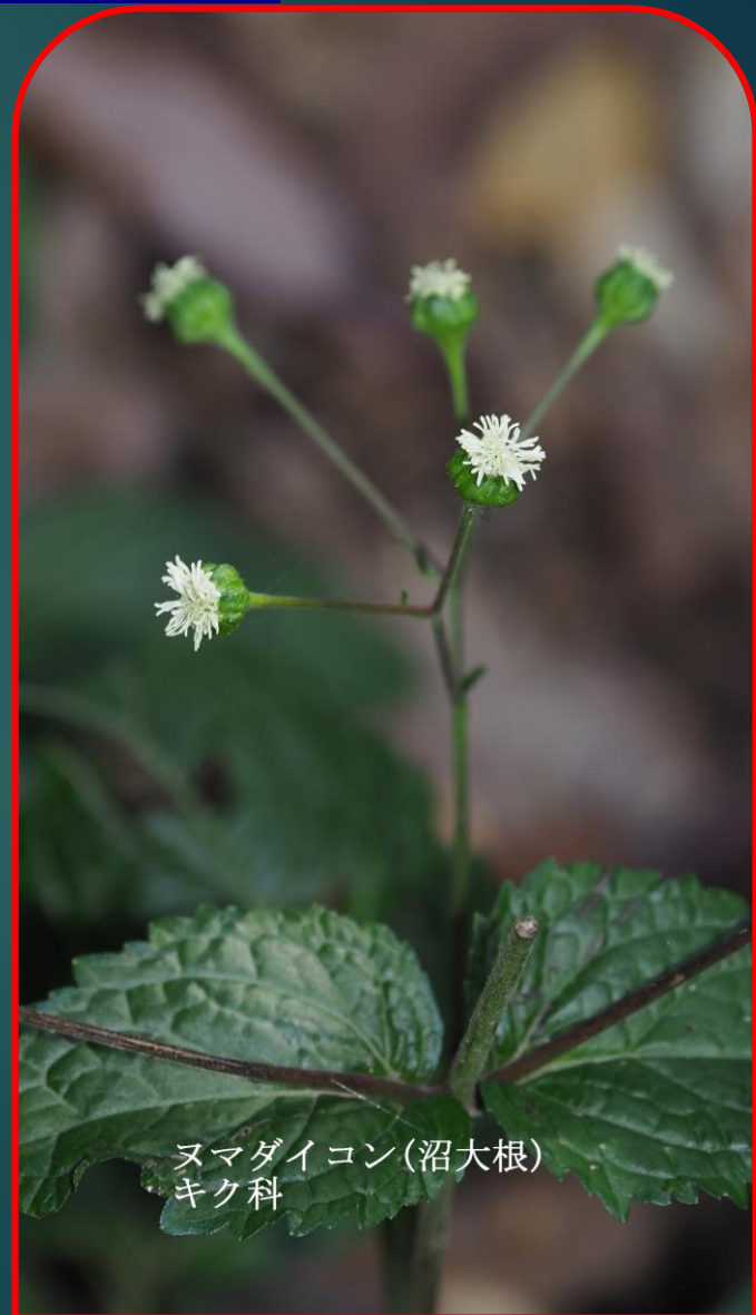
ヌマダイコン(沼大根) キク科