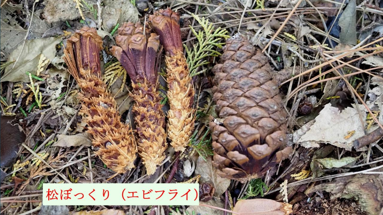
松ぼっくり (エビフライ)