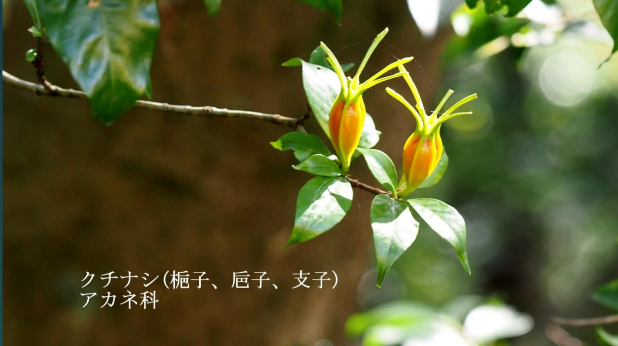
クチナシ(梔子、卮子、支子) アカネ科