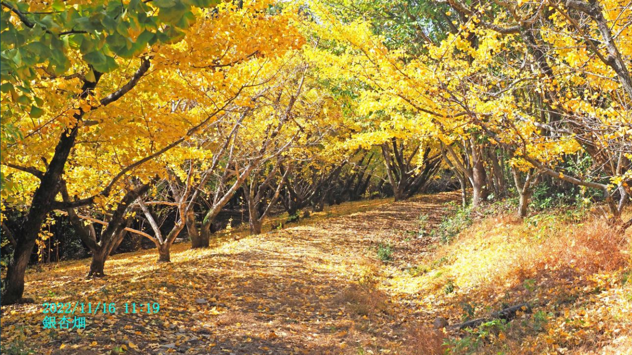
2022/11/16 11:19 銀杏畑