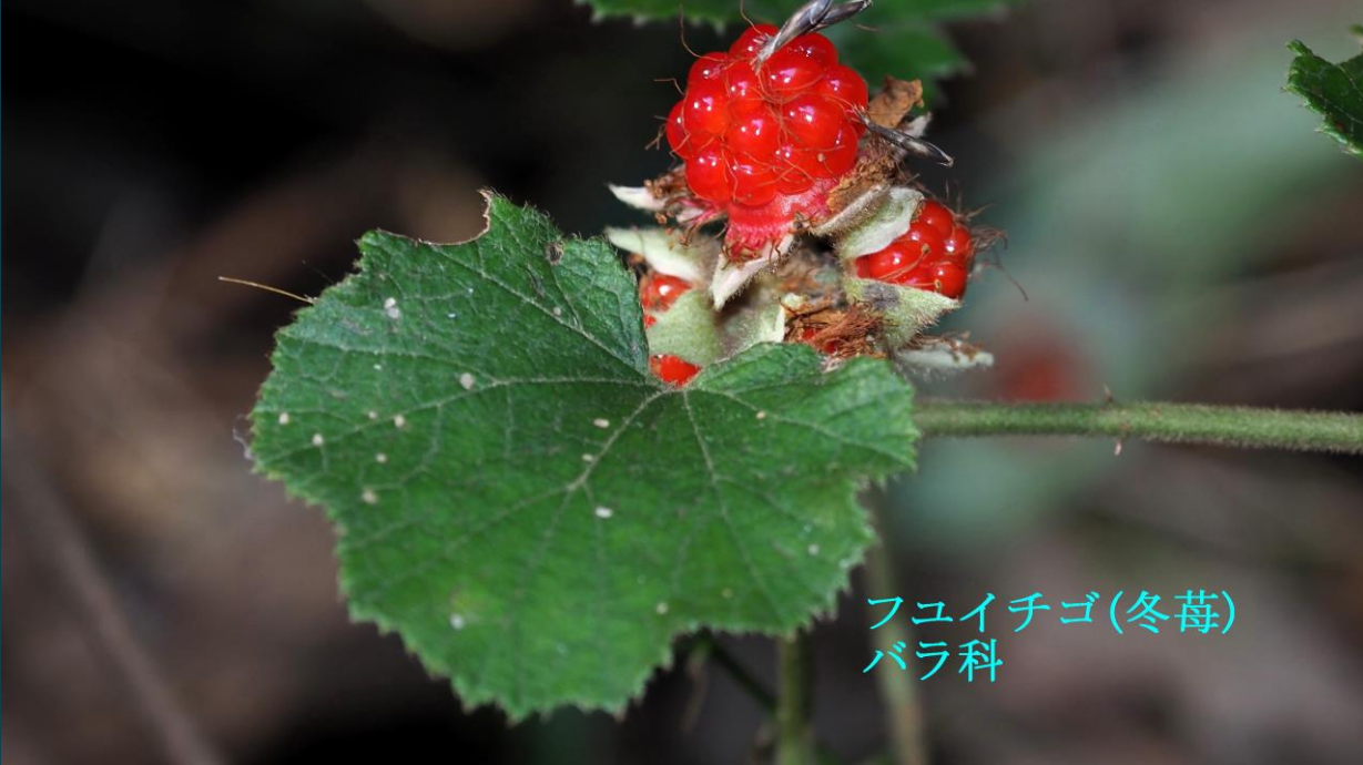
フユイチゴ(冬苺) バラ科