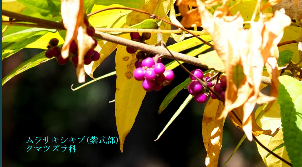
ムラサキシキブ(紫式部) クマツヅラ科