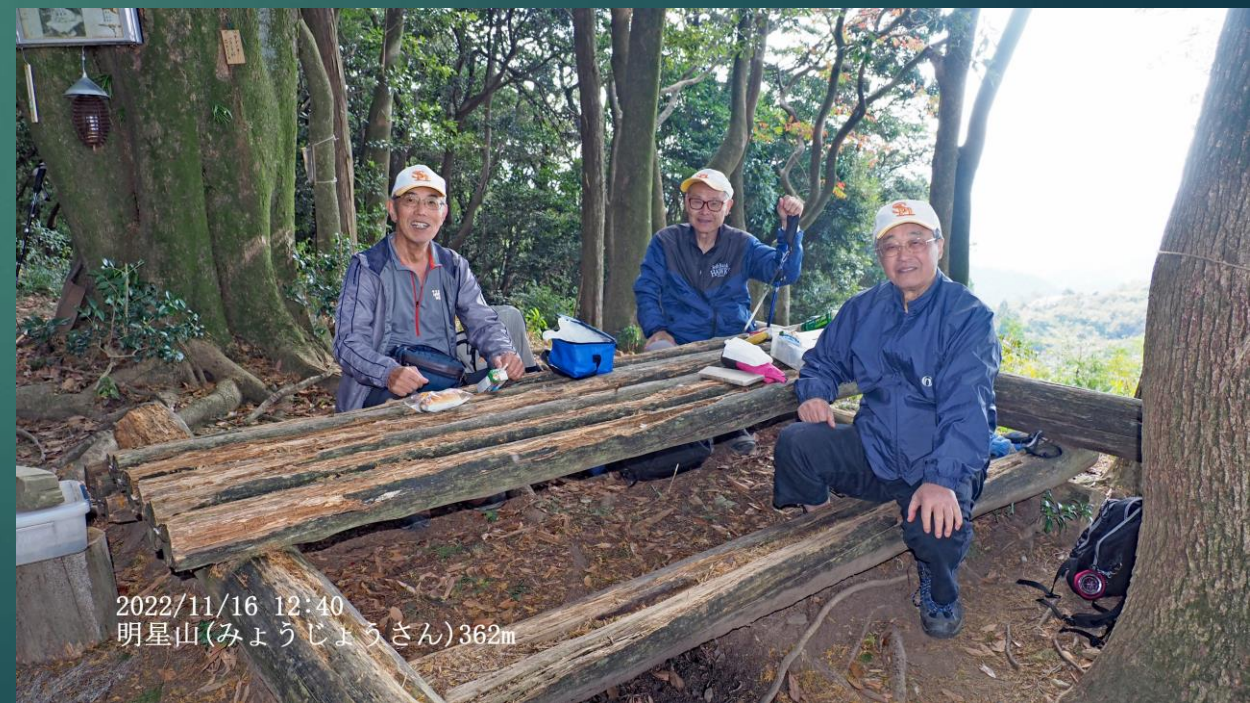
2022/11/16 12:40 明星山(みょうじょうさん)362m