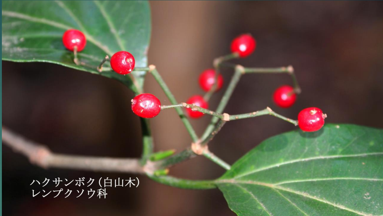
ハクサンボク (白山木) レンプクソウ科