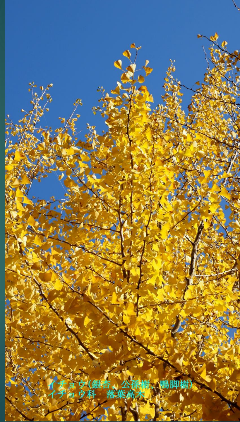
イチョウ(銀杏、公孫樹、鴨脚樹) イチョウ科 落葉高木