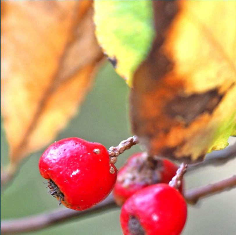
カマツカ ( 鎌柄) バラ科 別名：ウシコロシ