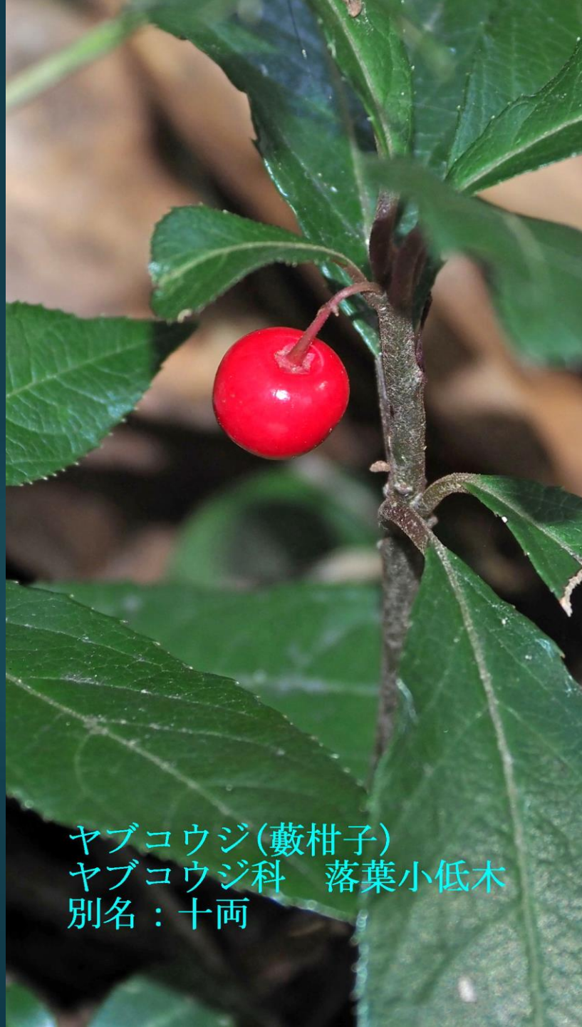
ヤブコウジ(藪柑子) ヤブコウジ科 落葉小低木 別名：十両