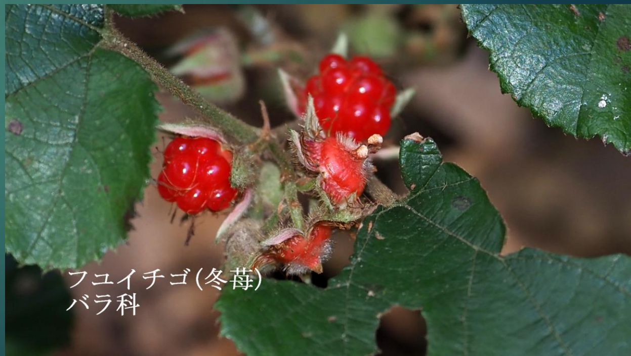
フユイチゴ(冬苺) バラ科