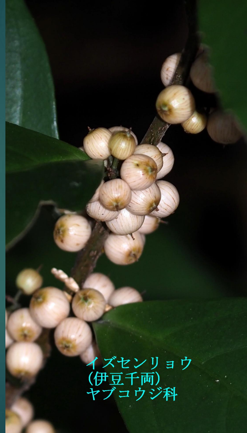
イズセンリョウ (伊豆千両) ヤブコウジ科