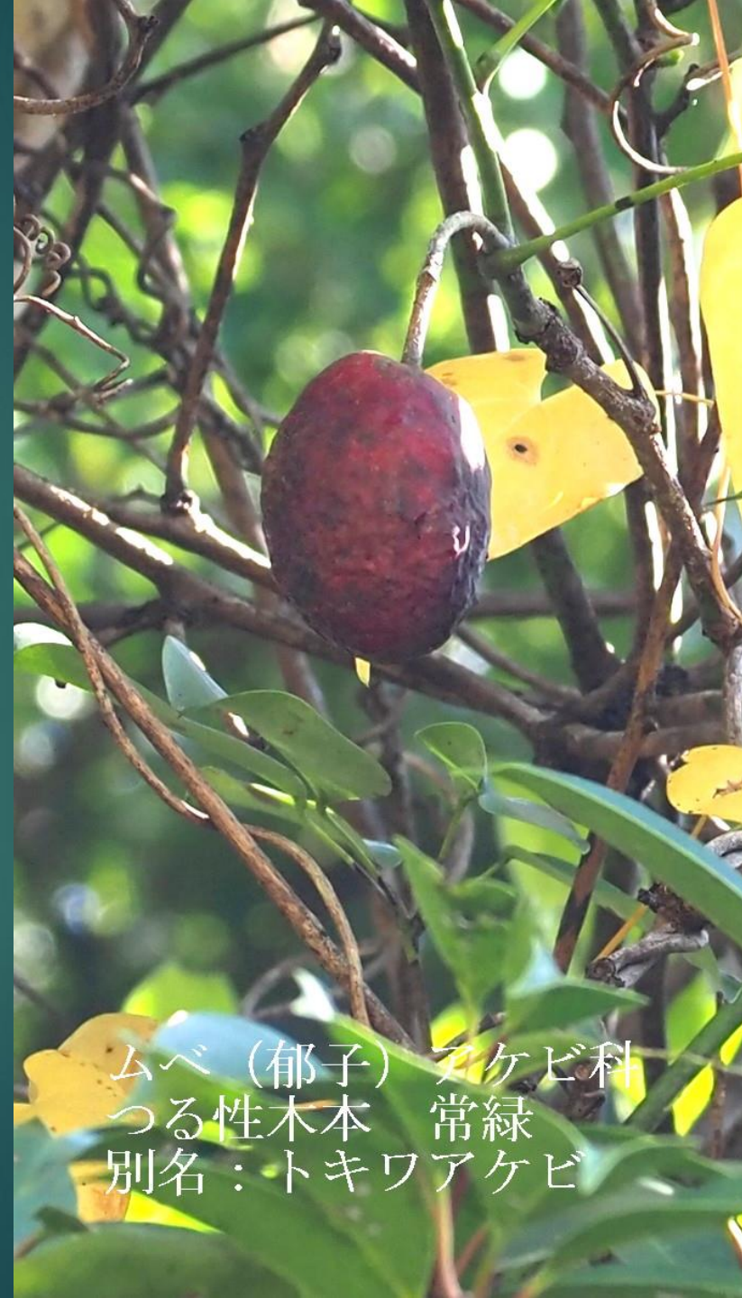
ムベ（郁子）アケビ科 つる性木本 常緑 別名：トキワアケビ