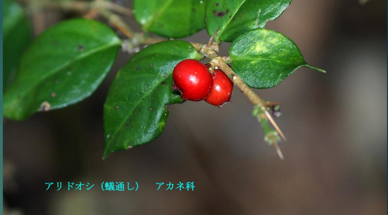
アリドオシ (蟻通し) アカネ科