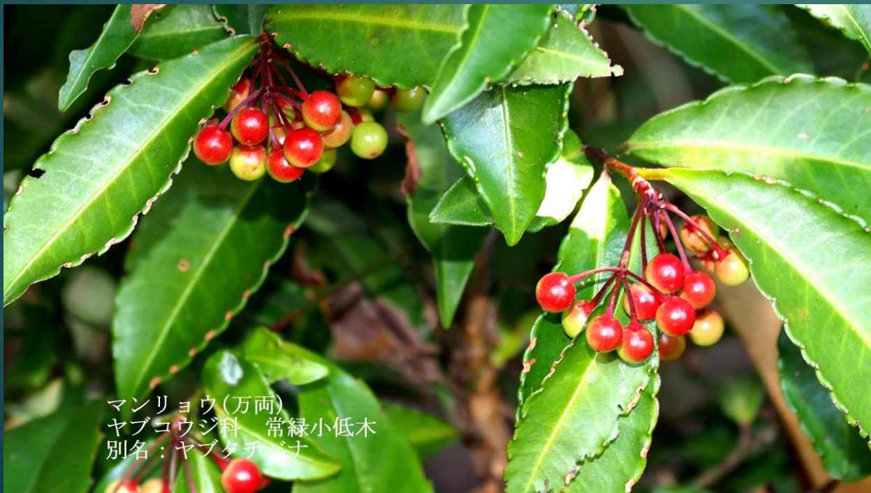
マンリョウ(万両) ヤブコウジ科 常緑小低木 別名：ヤブタチバナ