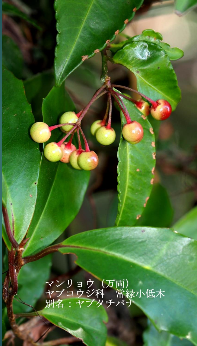
マンリョウ (万両) ヤブコウジ科 常緑小低木 別名：ヤブタチバナ