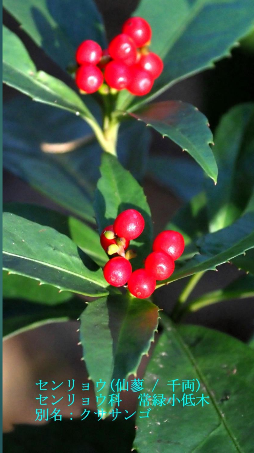
センリョウ(仙蓼 / 千両) センリョウ科 常緑小低木 別名：クササンゴ