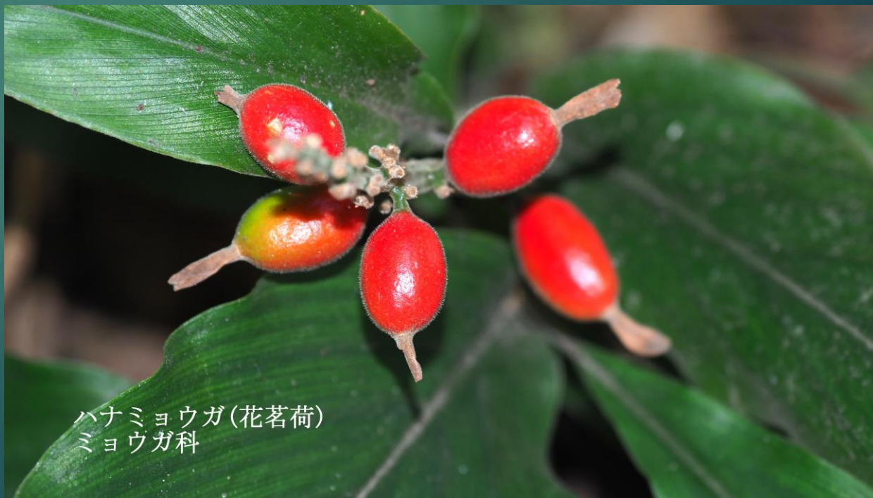
ハナミョウガ (花茗荷) ミョウガ科