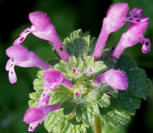
ホトケノザ (仏の座) シソ科