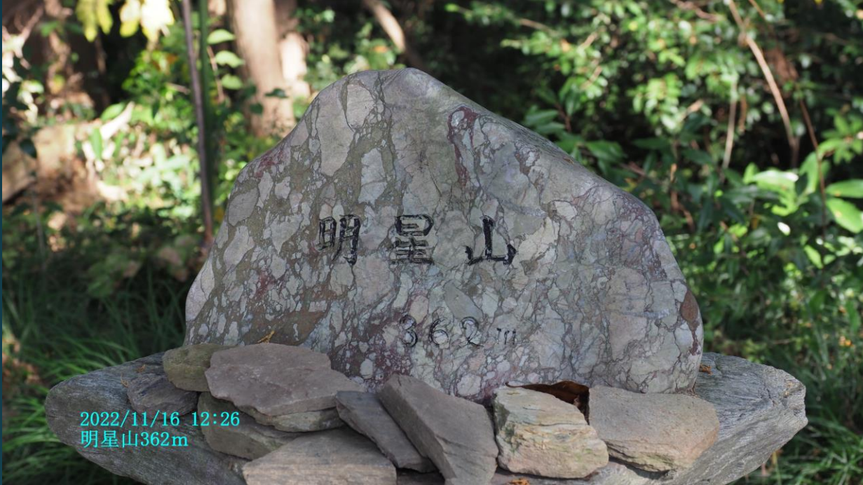
2022/11/16 12:26 明星山362m