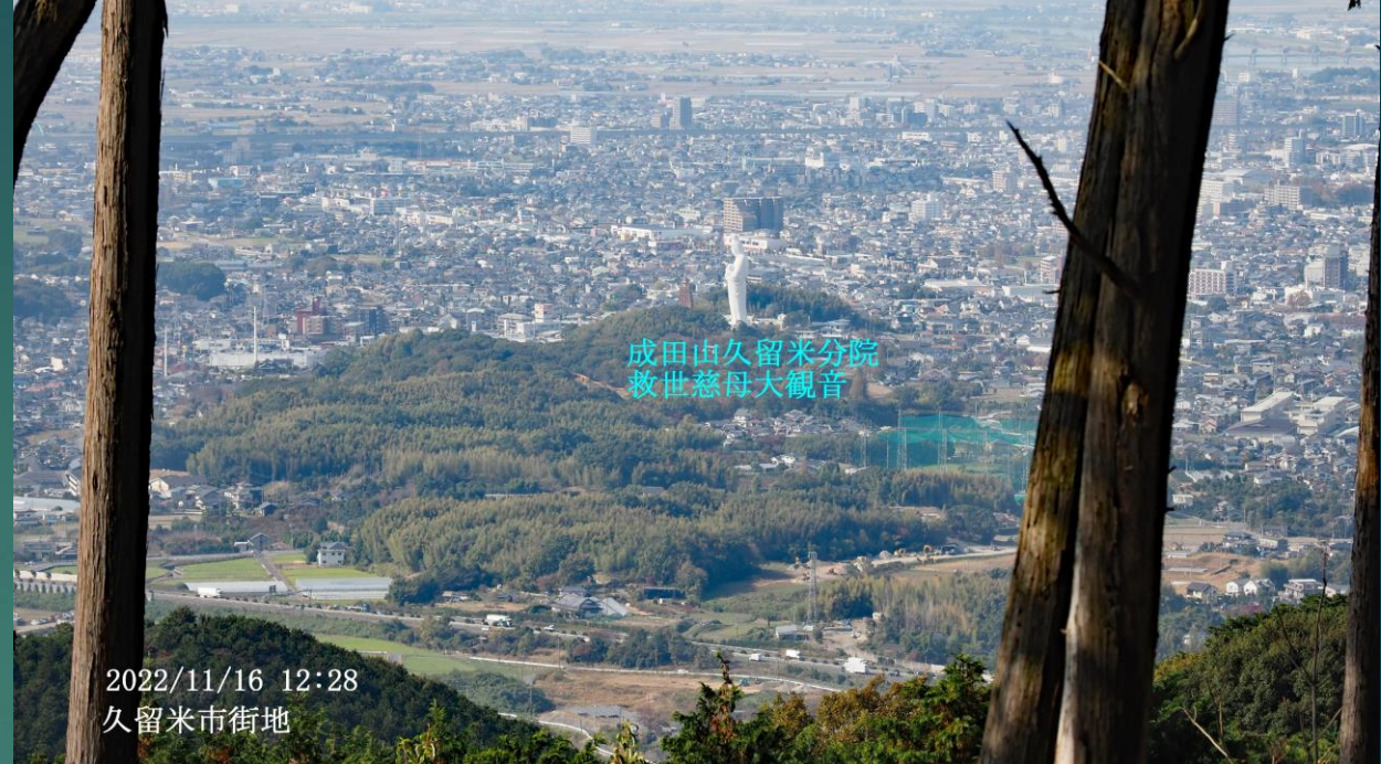
2022/11/16 12:28 久留米市街地