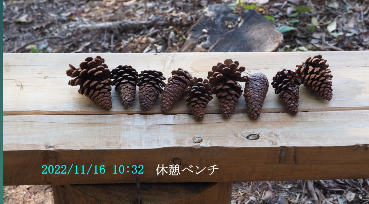
2022/11/16 10:32 休憩ベンチ