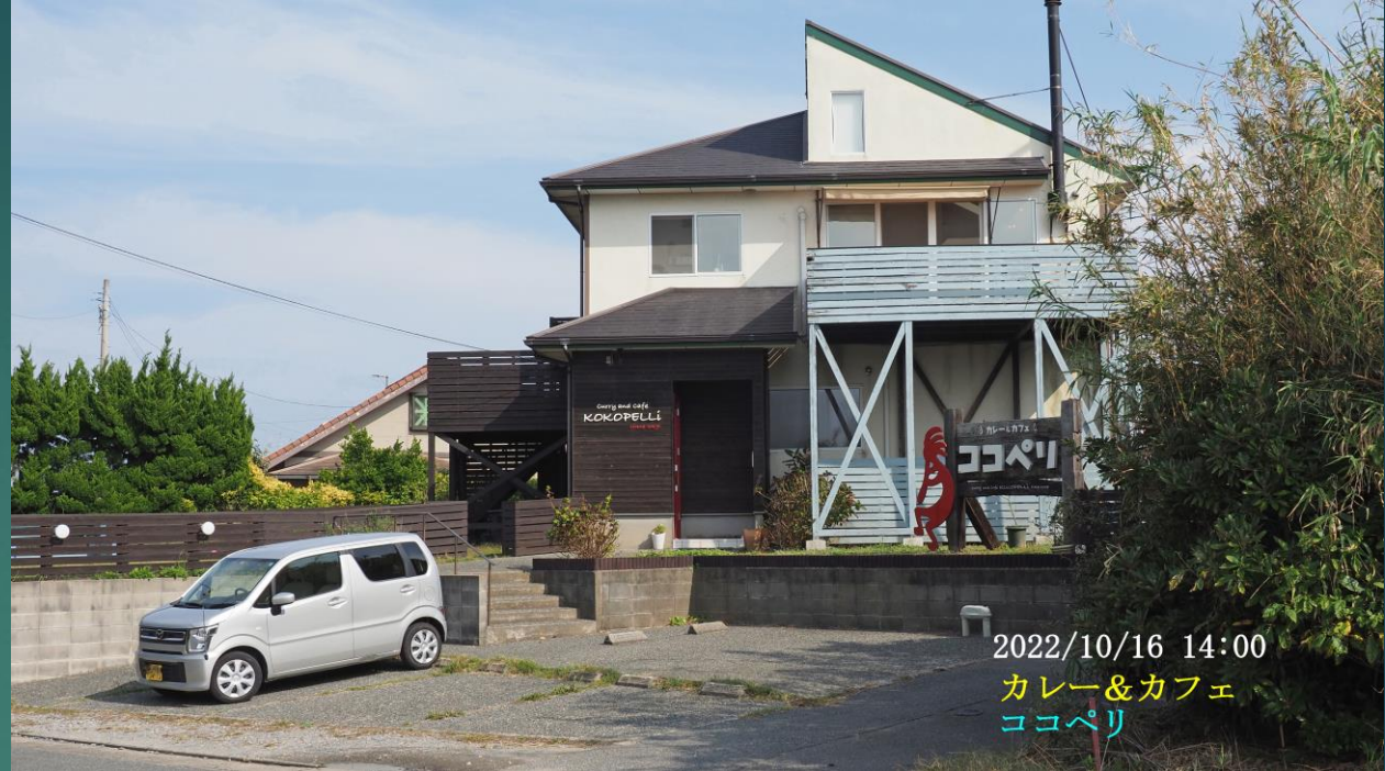
2022/10/16 14:00 カレー&カフェ ココペリ