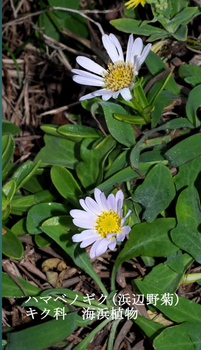
ハマベノギク(浜辺野菊) キク科 海浜植物