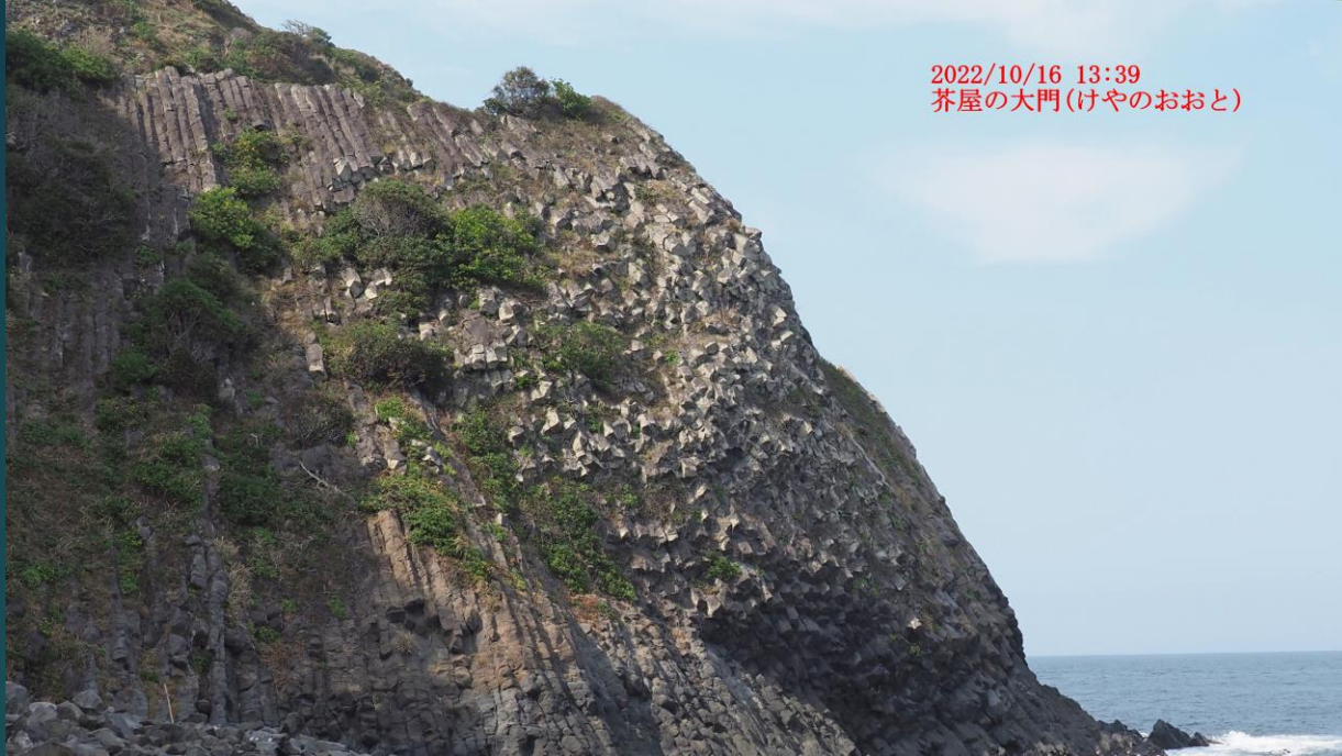
2022/10/16 13:39 芥屋の大門(けやのおおと)