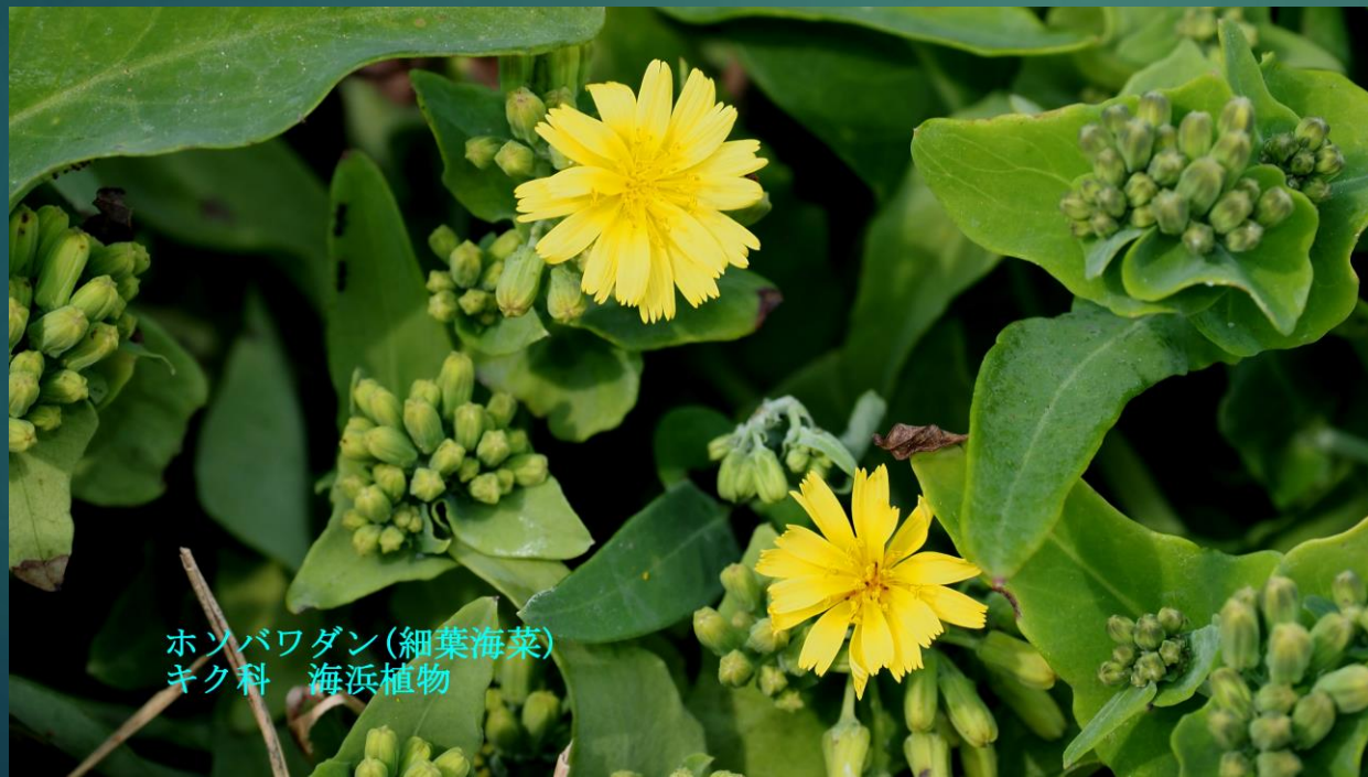
ホソバワダン(細葉海菜) キク科 海浜植物