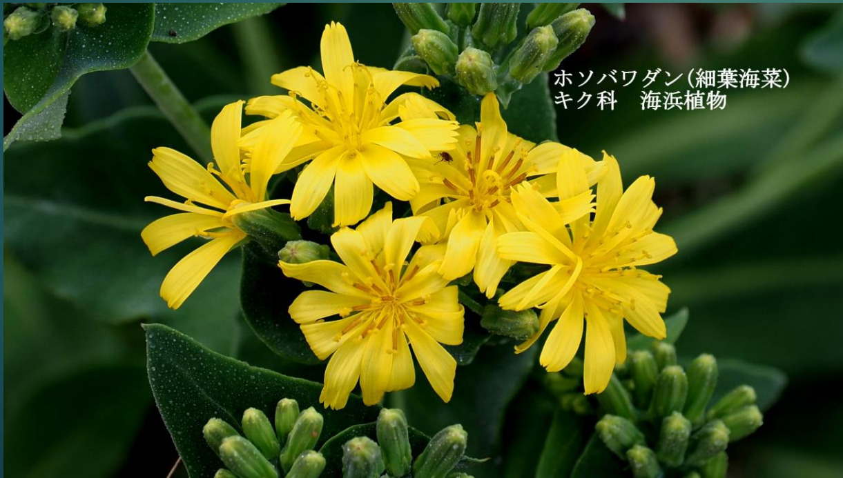
ホソバワダン(細葉海菜) キク科 海浜植物