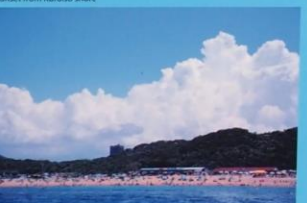
芥屋海水浴場 Keya Bathing Beach