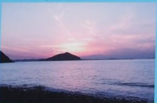
黒磯海岸からの夕日 Sunset from Kuraso shore