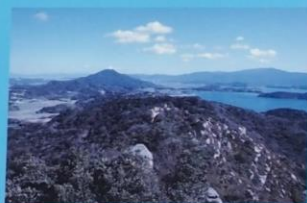
立石山からの展望 View from Mt. Tateishiyama