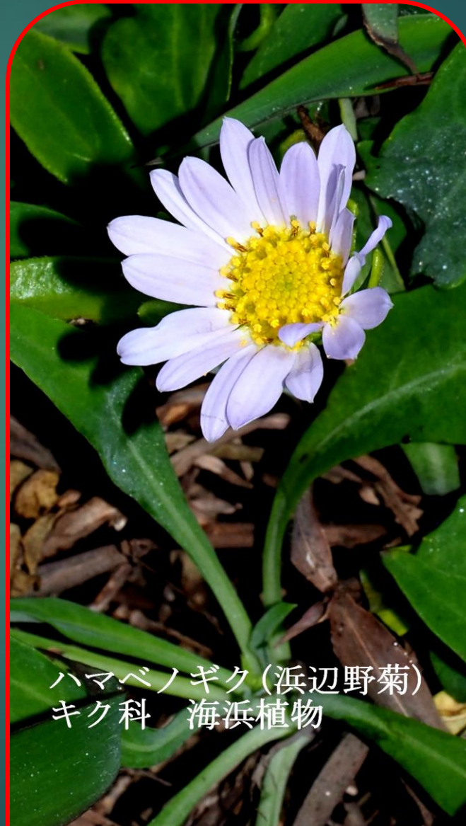
ハマベノギク(浜辺野菊) キク科 海浜植物