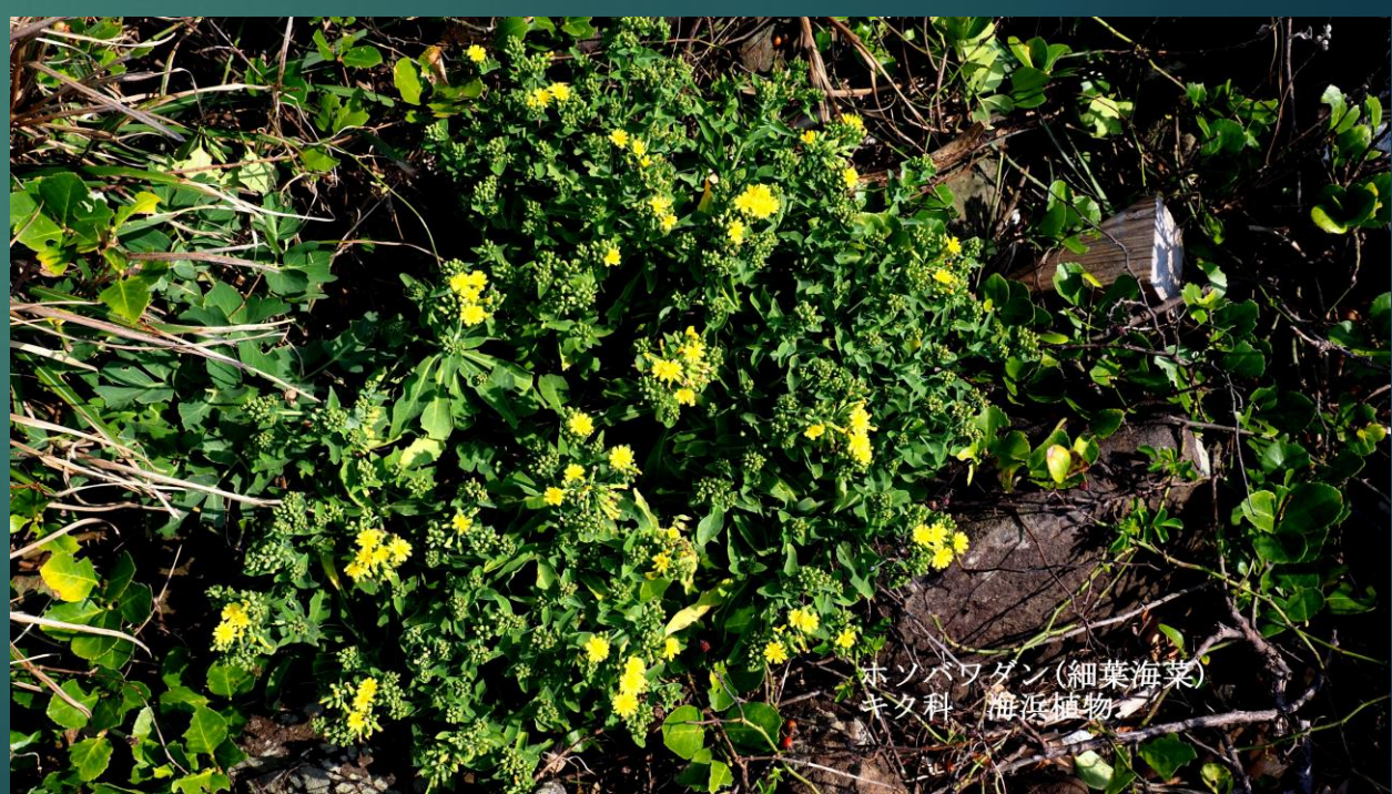
ホソバワダン(細葉海菜) キク科 海浜植物