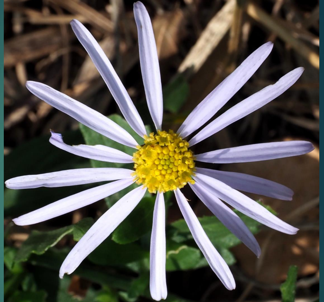
オオユウガギク (大柚香菊) キク科