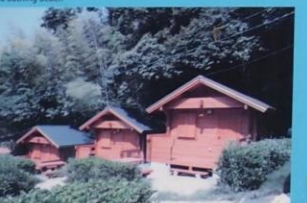
芥屋キャンプ場 Keya Campsite