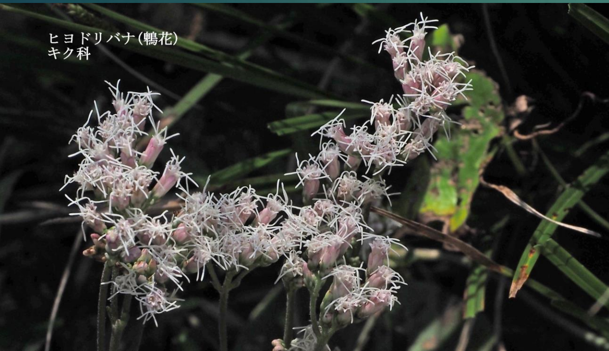
ヒヨドリバナ(鶉花) キク科