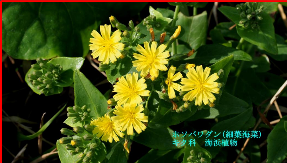
ホソバワダン(細葉海菜) キク科 海浜植物