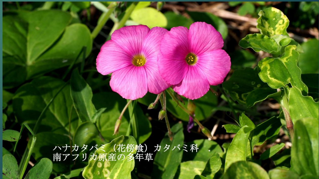
ハナカタバミ(花傍喰)カタバミ科 南アフリカ原産の多年草