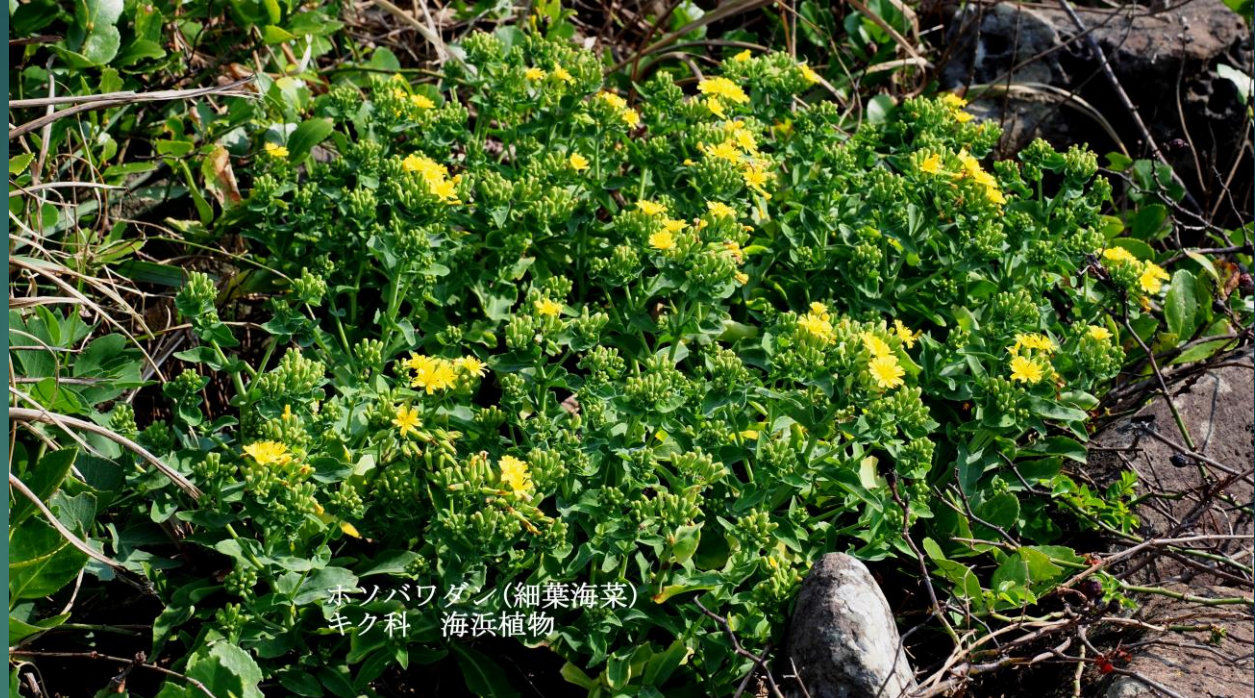
ホソバワダン(細葉海菜) キク科 海浜植物