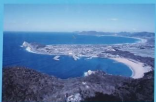
立石山からの展望 View from Mt. Tateishiyama