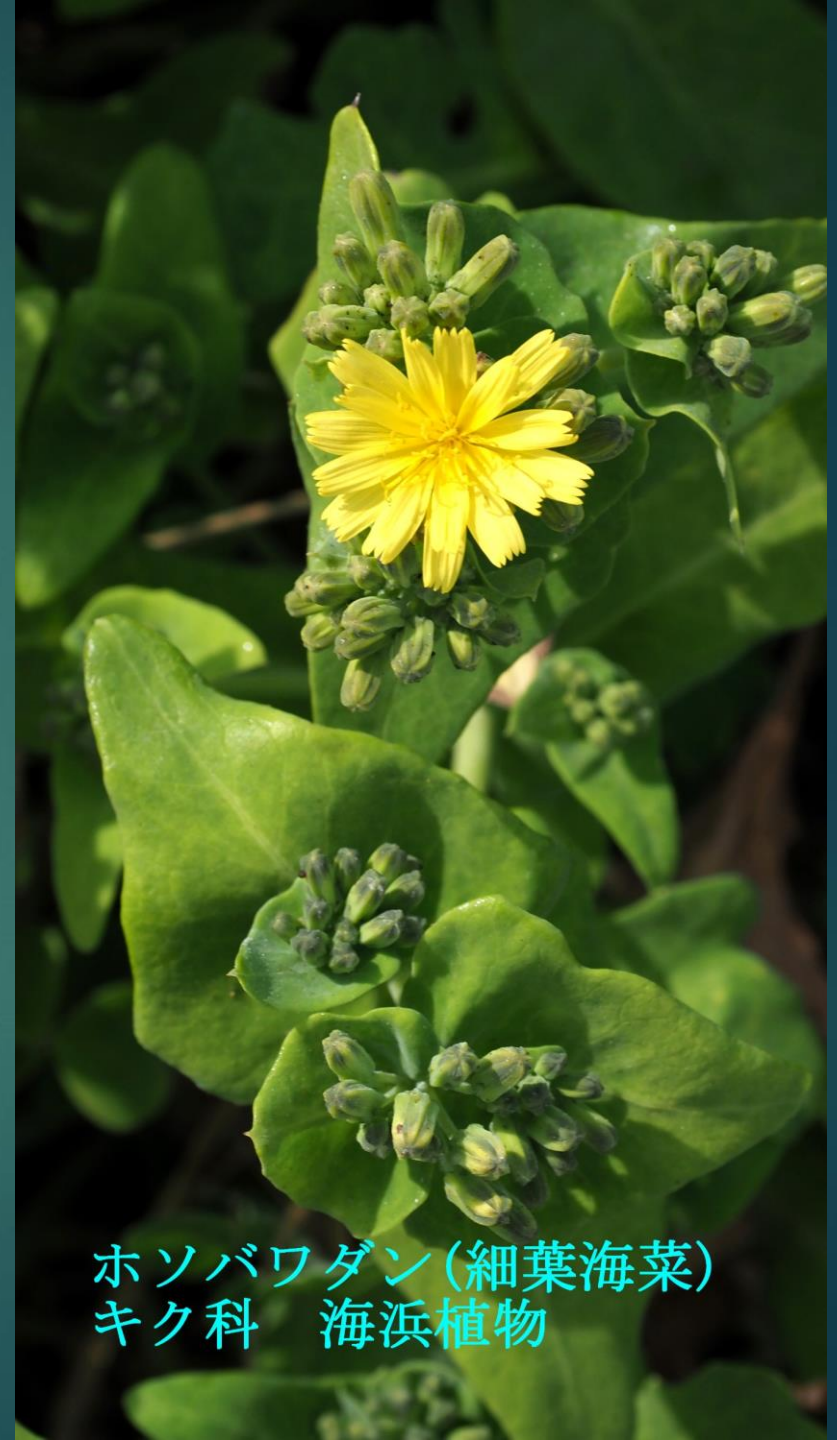
ホソバワダン(細葉海菜) キク科 海浜植物