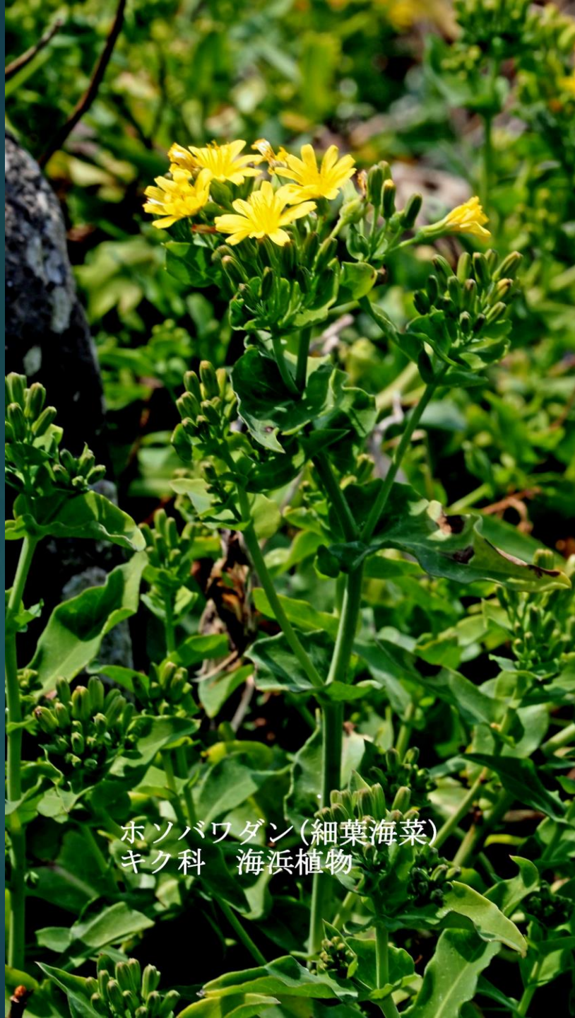
ホソバワダン(細葉海菜) キク科 海浜植物