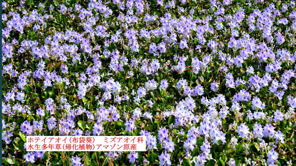
ホテアオイ(布袋葵) ミズアオイ科 水生多年草(帰化植物)アマゾン原産