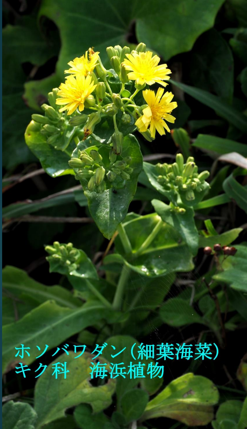
ホソバワダン(細葉海菜) キク科 海浜植物