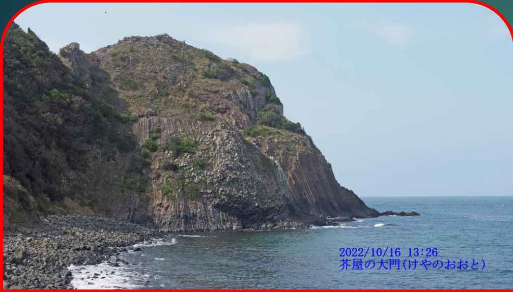
2022/10/16 13:26 芥屋の大門(けやのおおと)