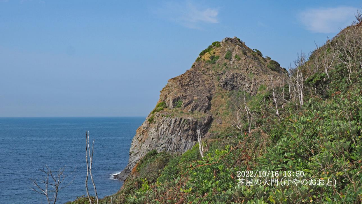
2022/10/16 13:50 芥屋の大門(けやのおおと)