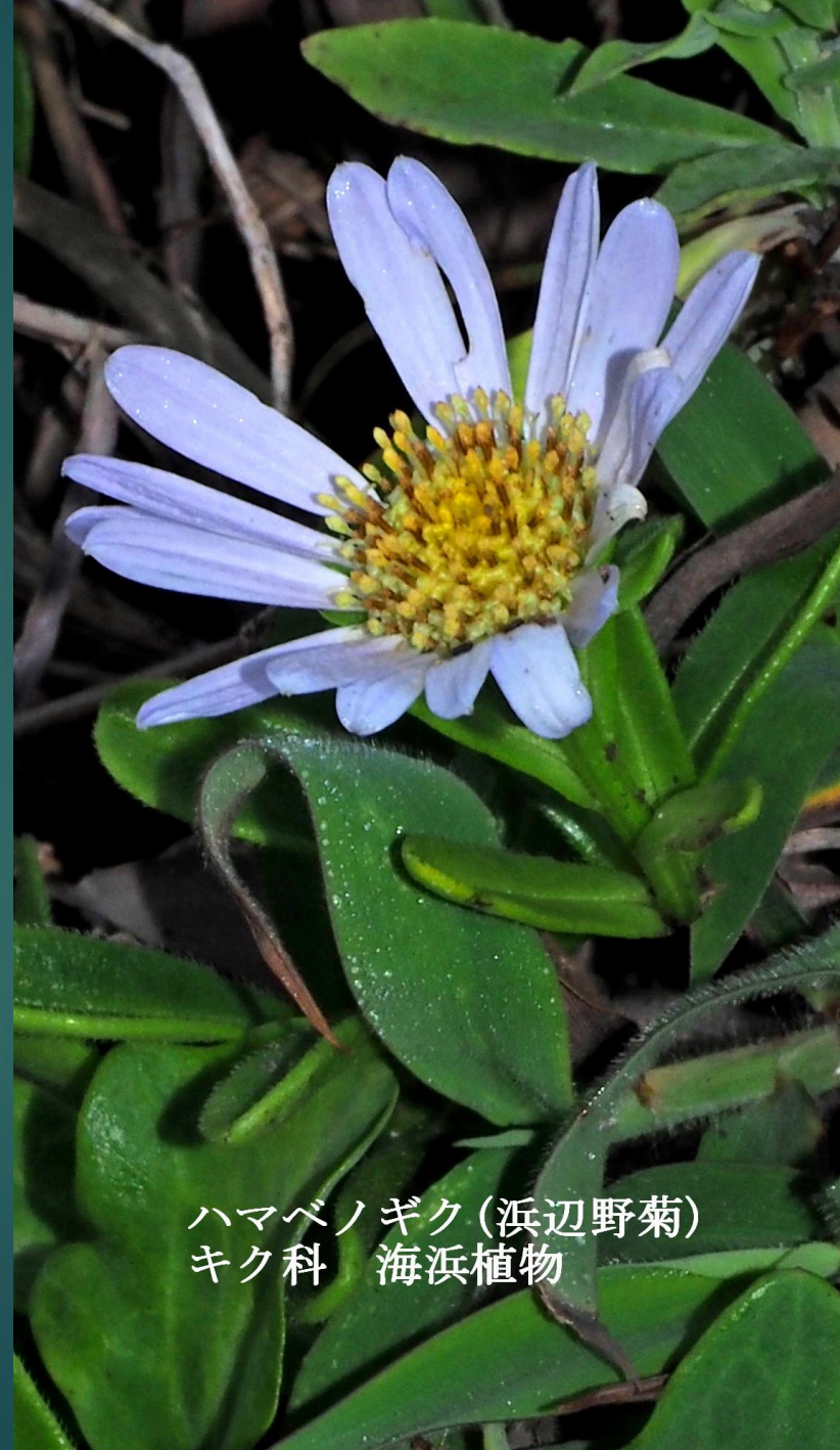
ハマベノギク(浜辺野菊) キク科 海浜植物