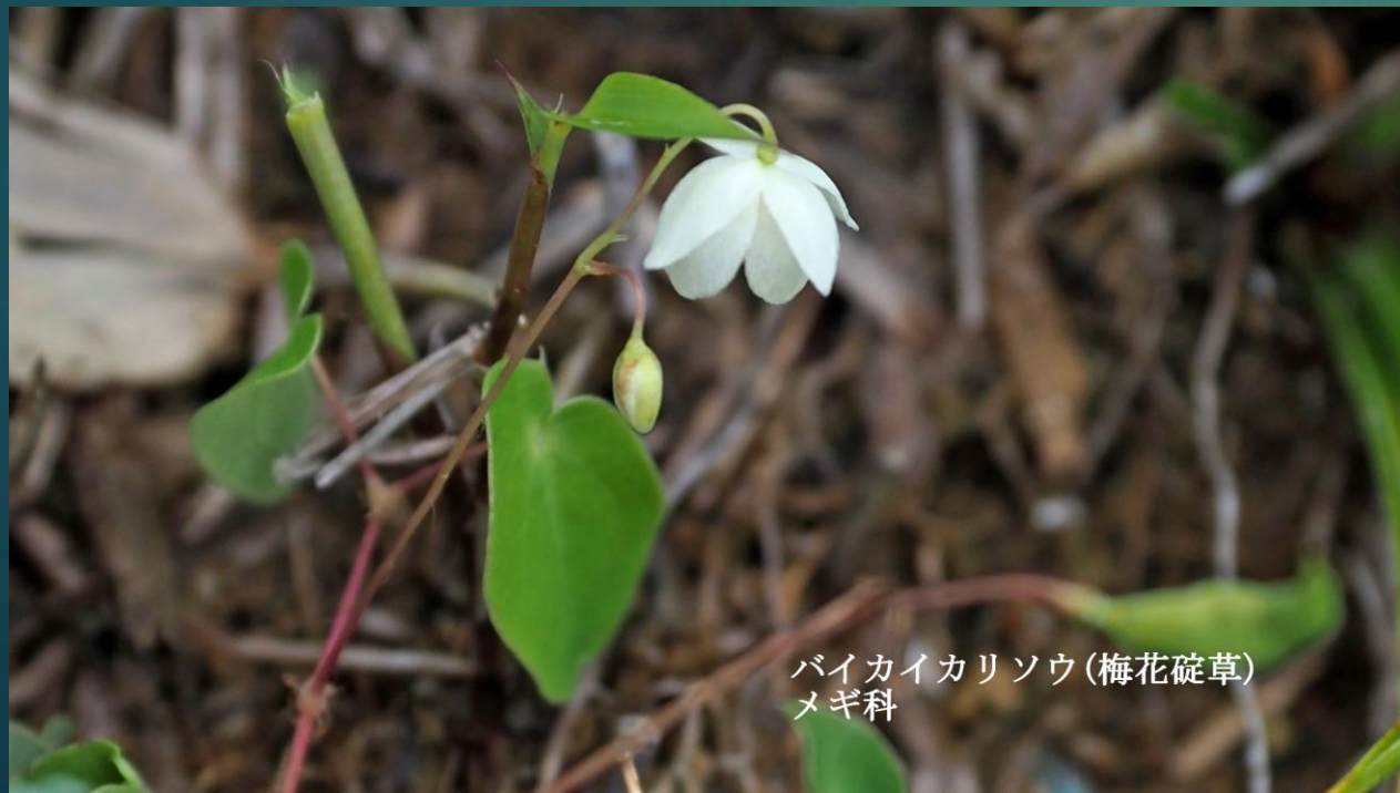
バイカイカリソウ(梅花碓草) メギ科