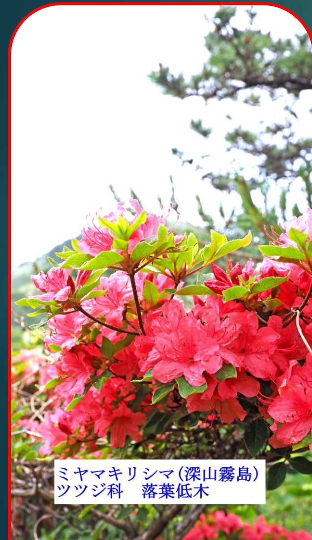
ミヤマキリシマ(深山霧島) ツツジ科 落葉低木