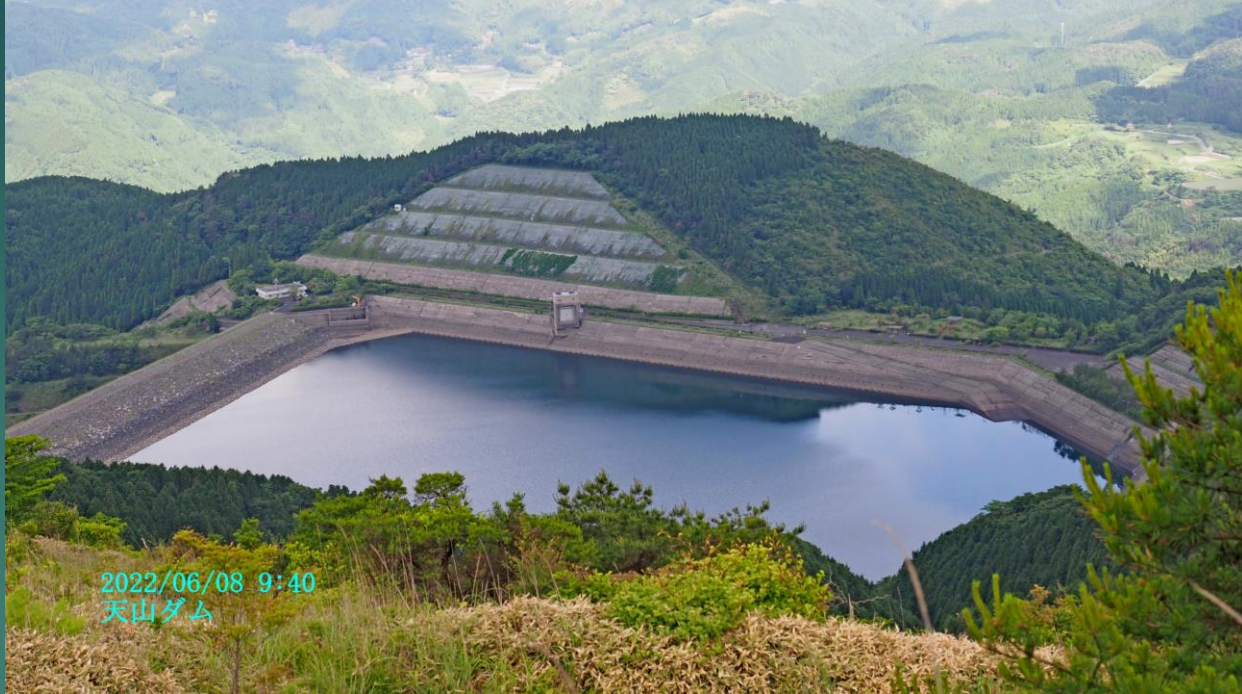
2022/06/08 9:40 天山ダム