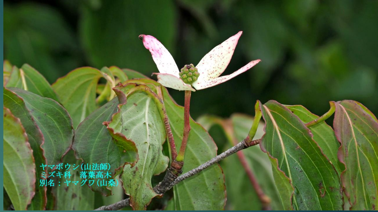
ヤマボウシ(山法師) ミズキ科 落葉高木 別名：ヤマグワ(山桑)