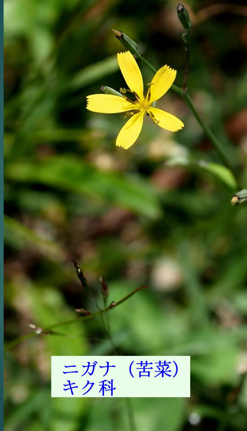
ニガナ (苦菜) キク科