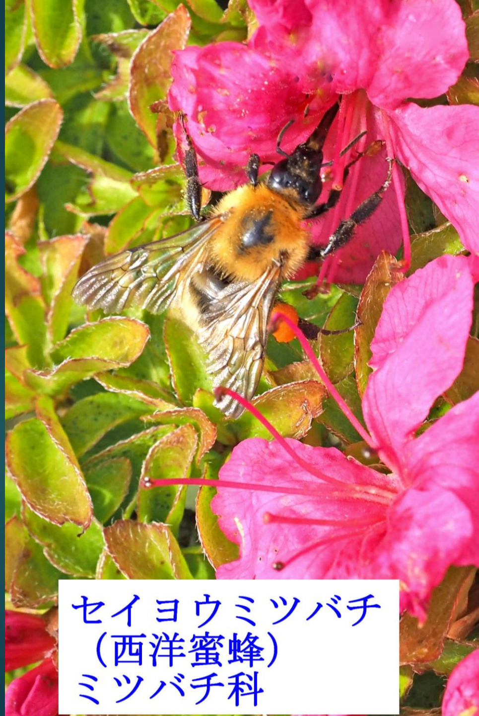
セイヨウミツバチ (西洋蜜蜂) ミツバチ科