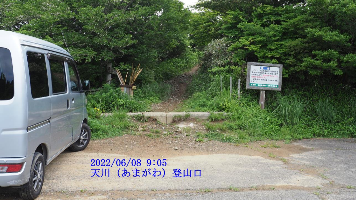
2022/06/08 9:05 天川 (あまがわ) 登山口