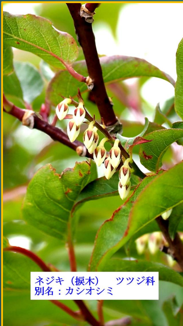
ネジキ(振木) ツツジ科 別名: カシオシミ