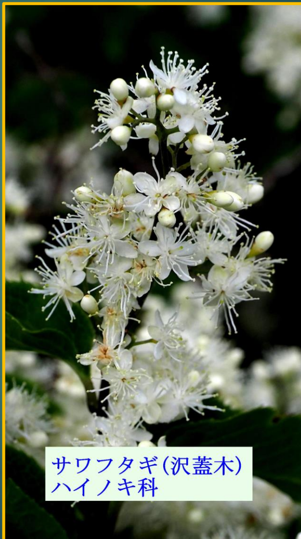
サワフタギ(沢蓋木) ハイノキ科