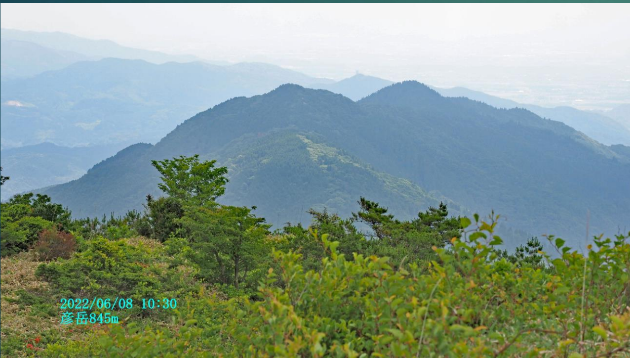
2022/06/08 10:30 彦岳845m