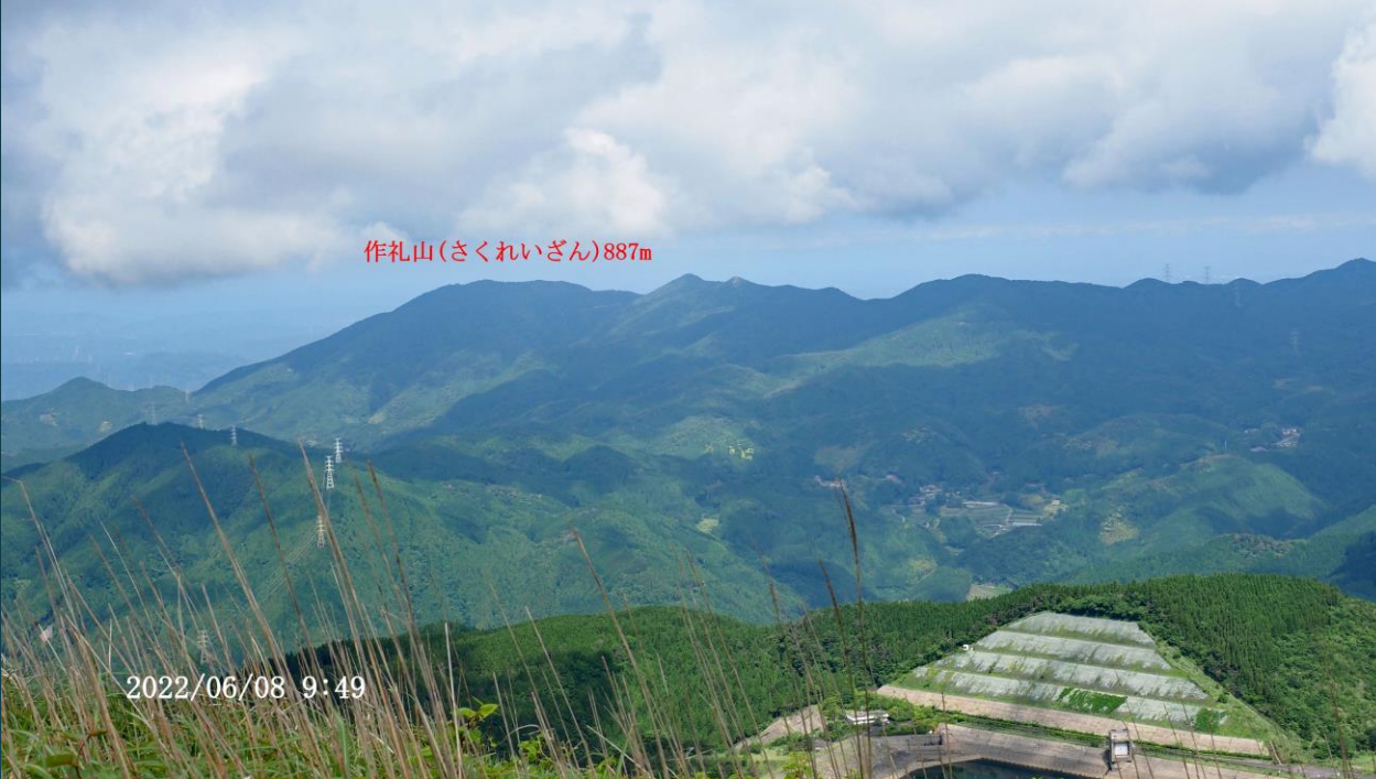
作礼山(さくれいざん)887m