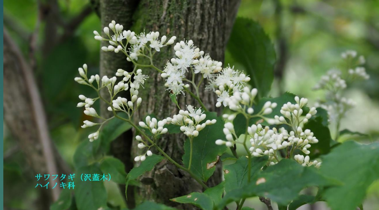
サワフタギ (沢蓋木) ハイノキ科