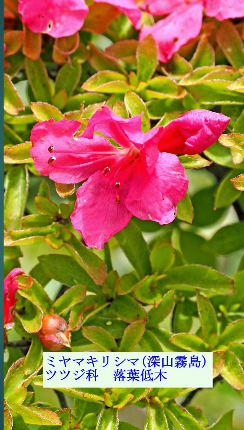
ミヤマキリシマ(深山霧島) ツツジ科 落葉低木