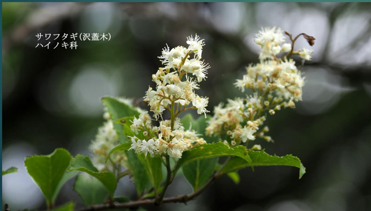
サワフタギ(沢蓋木) ハイノキ科