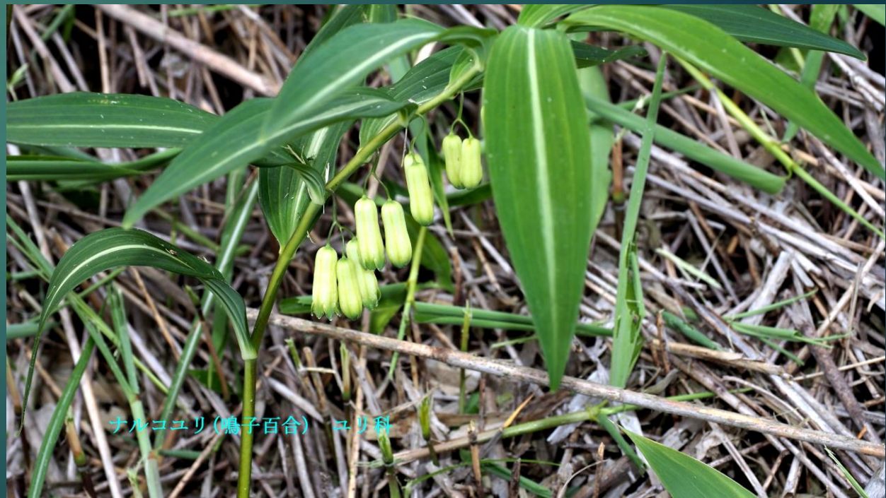
ナルコユリ(鳴子百合) ユリ科