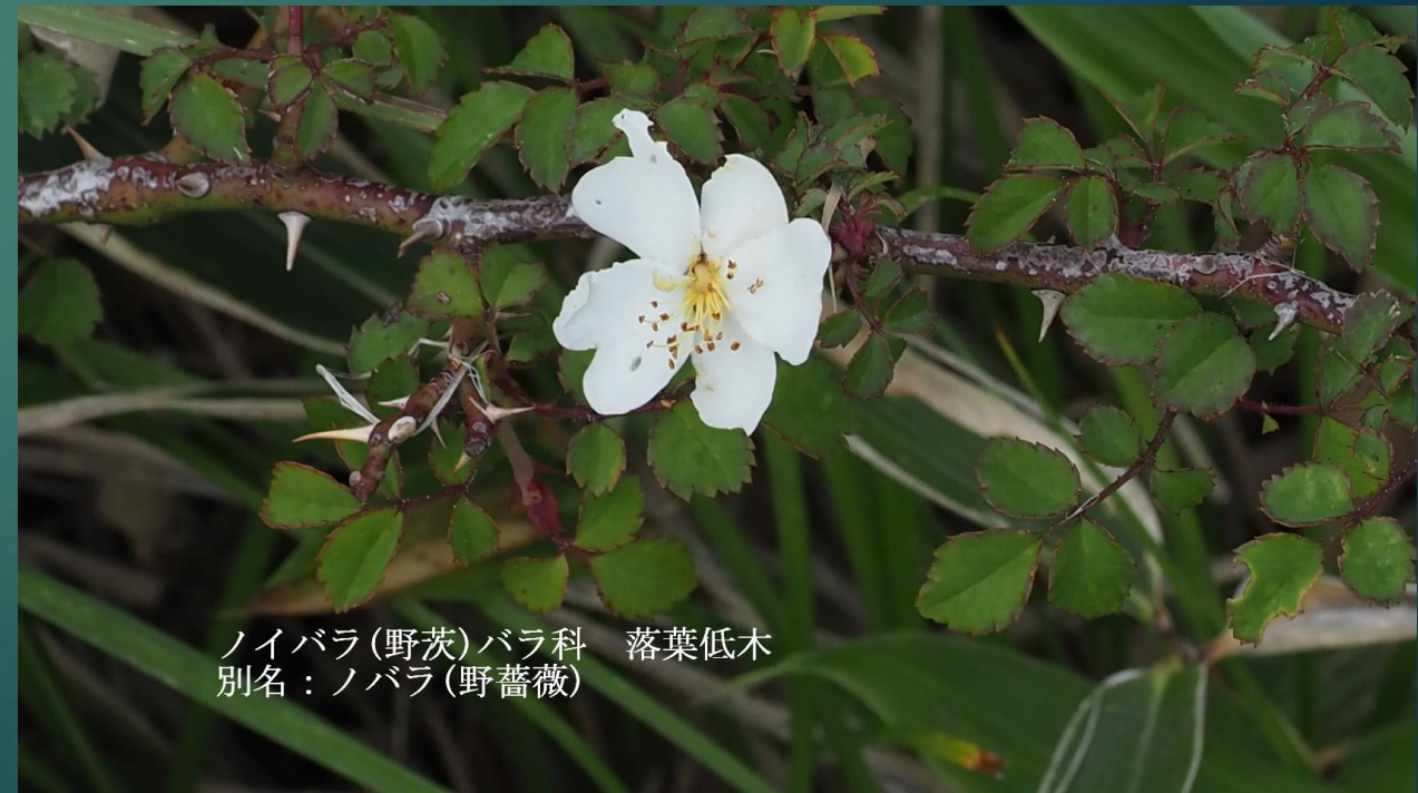
ノイバラ(野茨)バラ科 落葉低木 別名: ノバラ(野薔薇)