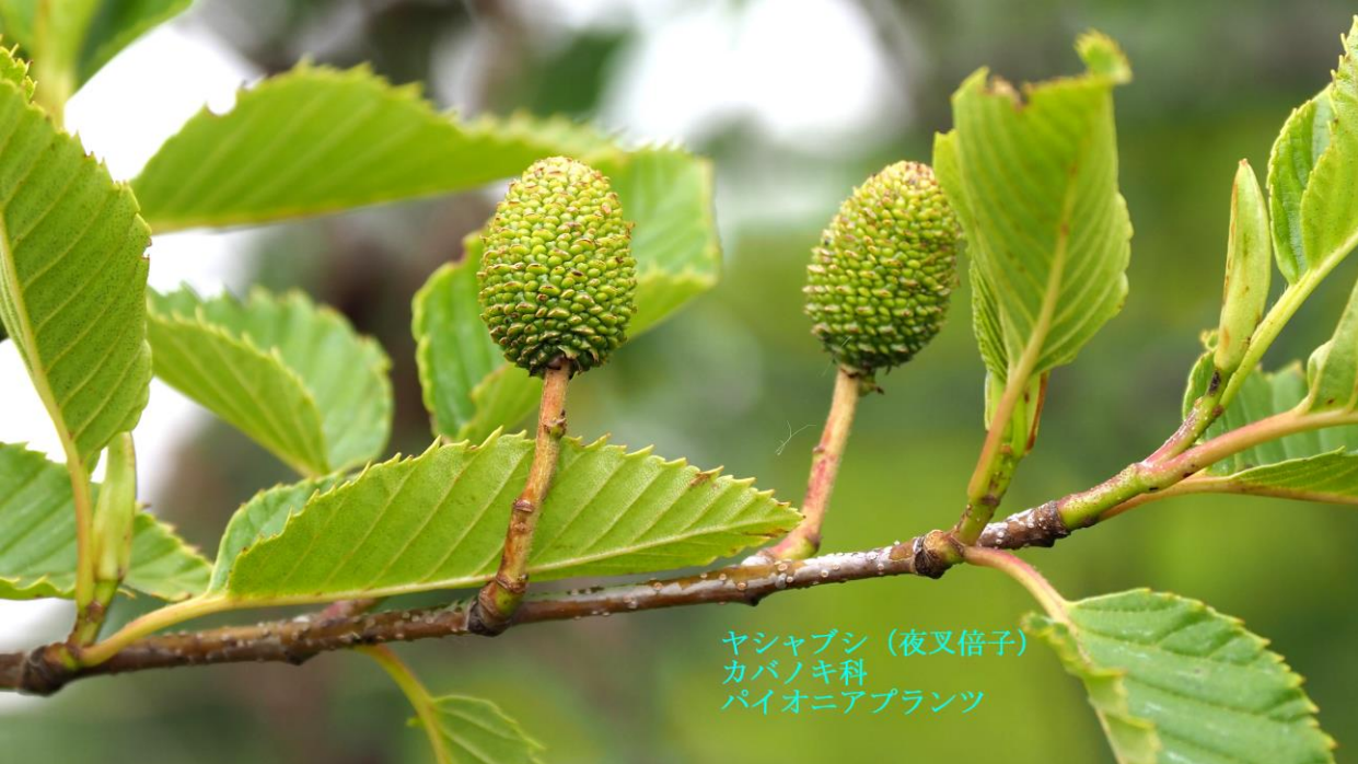
ヤシャブシ (夜叉倍子) カバノキ科 パイオニアプランツ