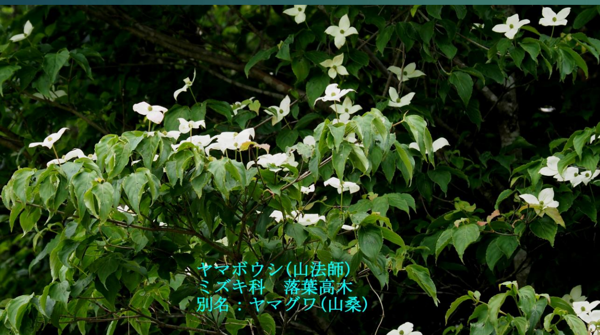
ヤマボウシ (山法師) ミズキ科 落葉高木 別名: ヤマグワ (山桑)