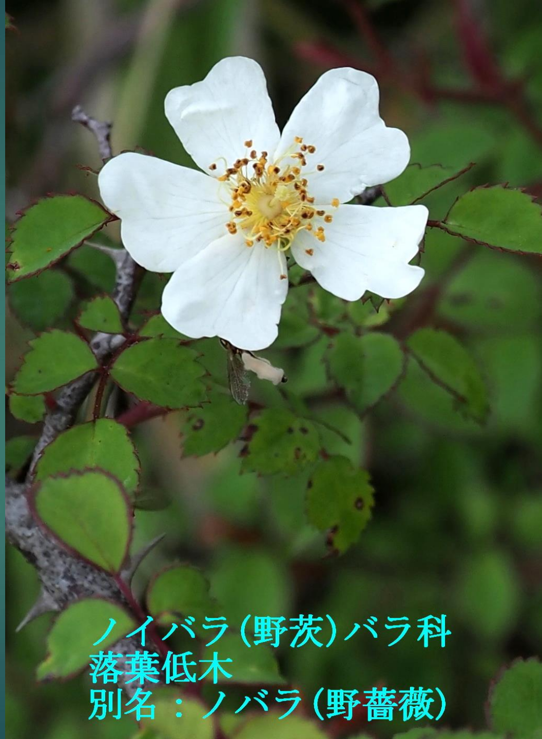
ノイバラ (野茨) バラ科 落葉低木 別名：ノバラ (野薔薇)