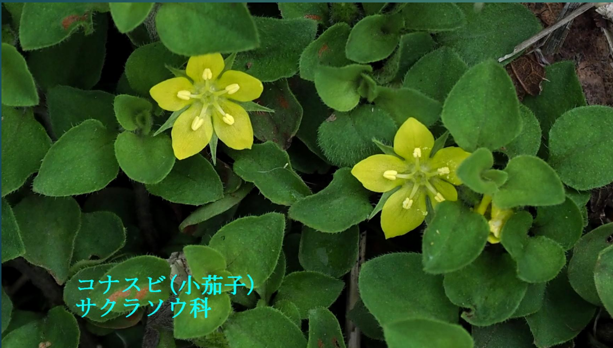
コナスビ (小茄子) サクラソウ科