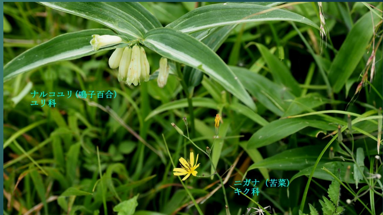
ナルコユリ(鳴子百合) ユリ科