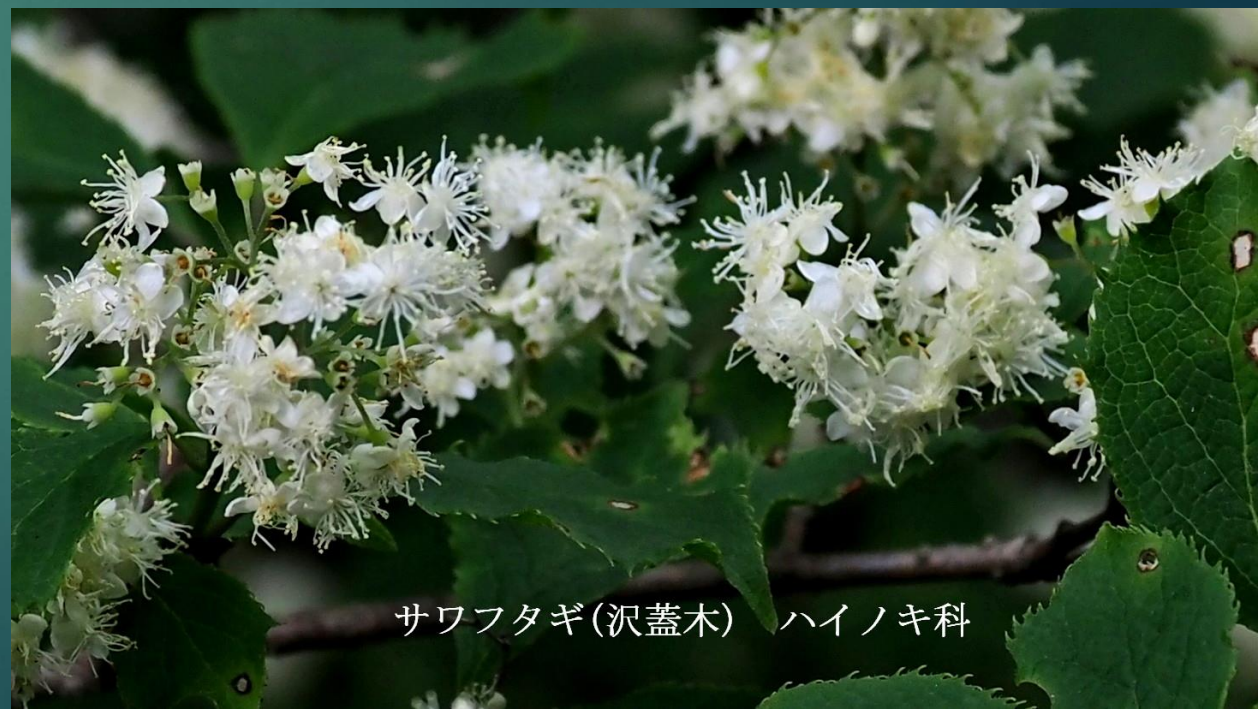
サワフタギ (沢蓋木) ハイノキ科