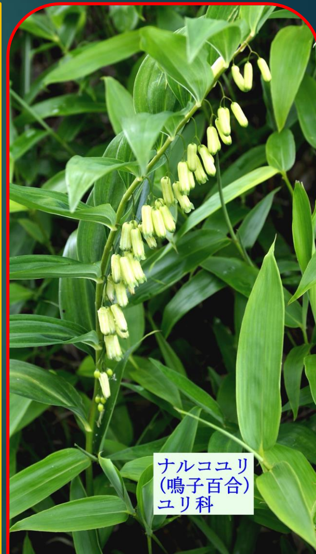
ナルコユリ (鳴子百合) ユリ科