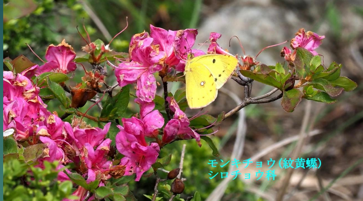
モンキチョウ(紋黄蝶) シロチョウ科