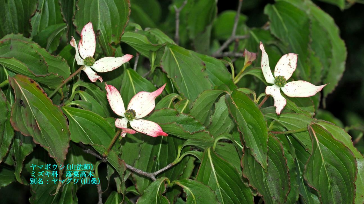
ヤマボウシ(山法師) ミズキ科 落葉高木 別名：ヤマグワ(山桑)