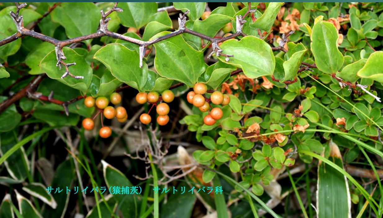
サルトリイバラ(猿捕茨) サルトリイバラ科