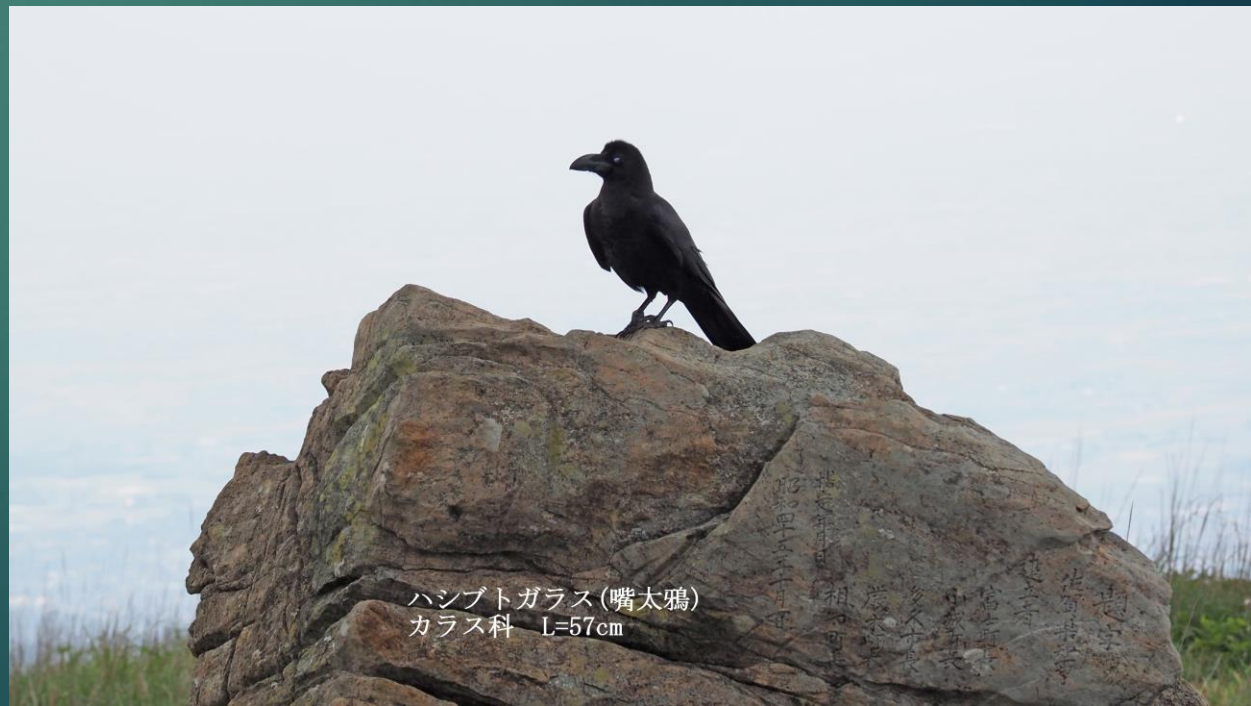
ハシブトガラス(嘴太鴉) カラス科 L=57cm