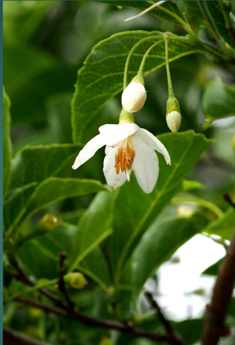
エゴノキ エゴノキ科 落葉小高木 有毒植物