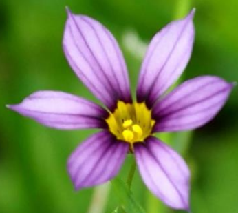
ニワゼキショウ(庭石菖) アヤメ科 帰化植物