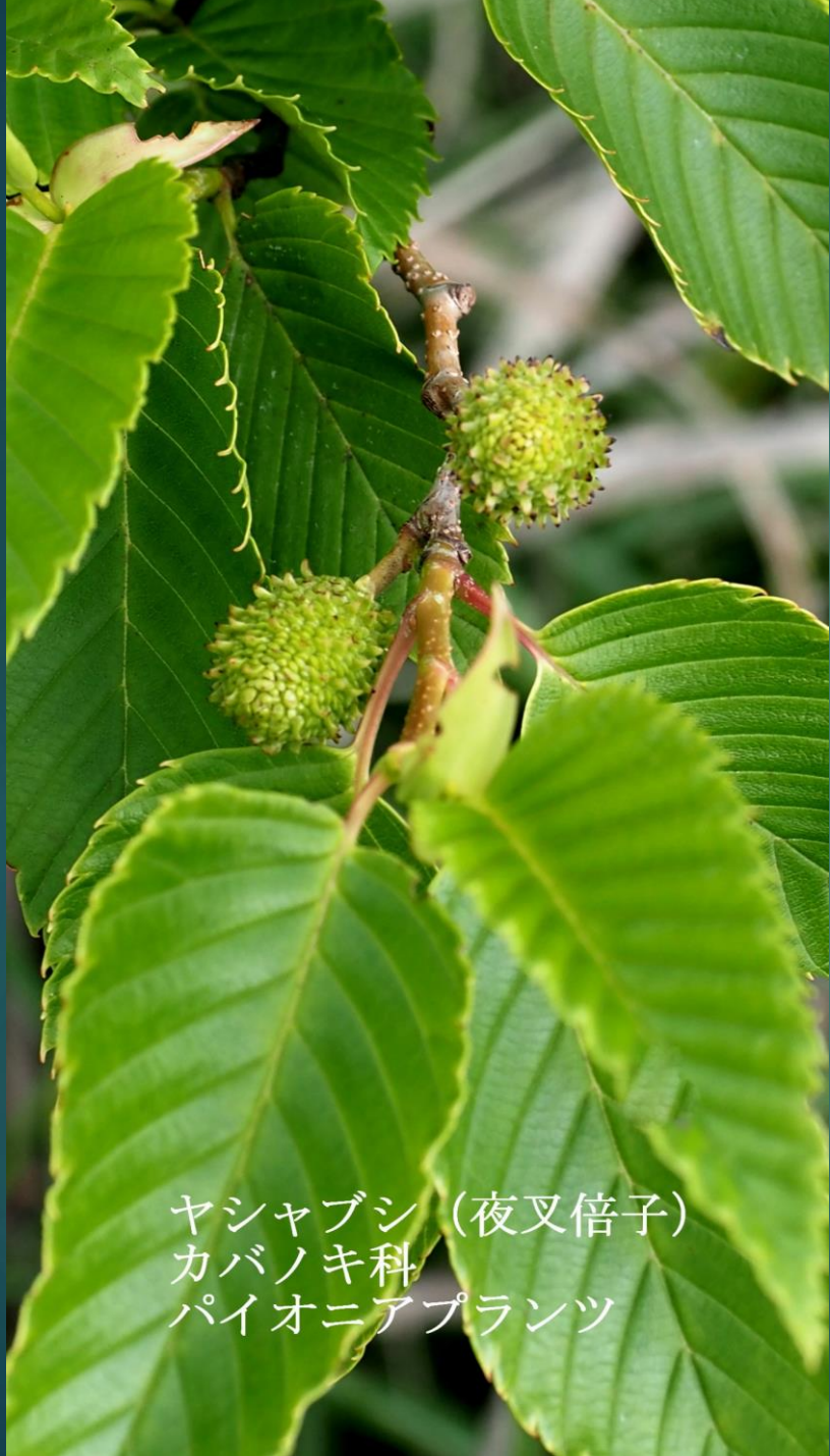
ヤシャブシ (夜叉倍子) カバノキ科 パイオニアプランツ