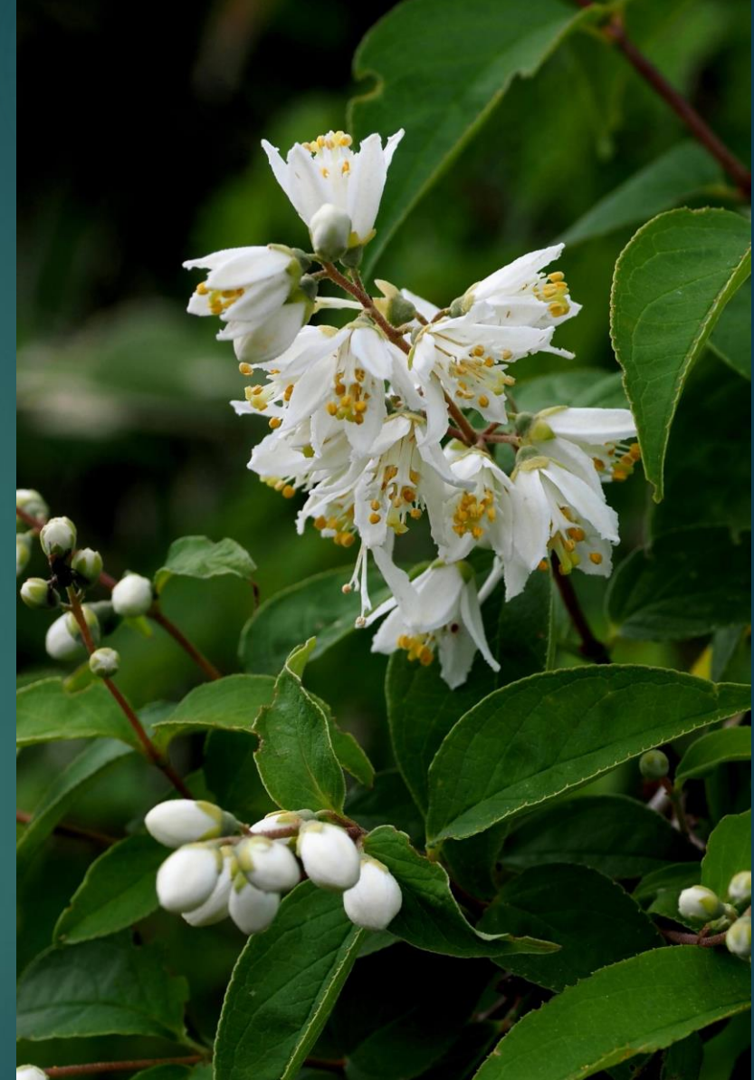
ウツギ(空木) アジサイ科 別名：ウノハナ(卵の花)