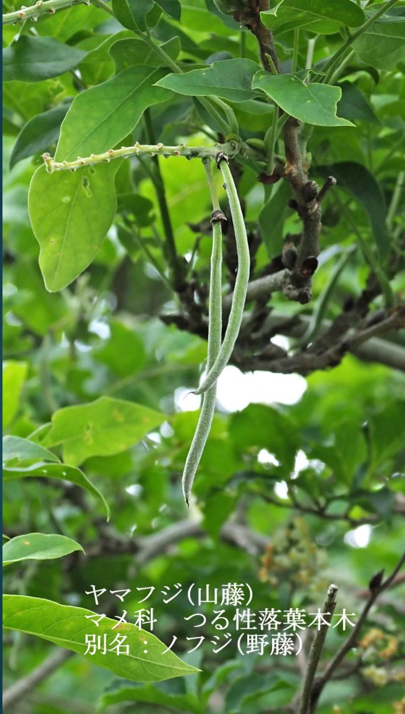
ヤマフジ(山藤) マメ科 つる性落葉本木 別名：ノフジ(野藤)