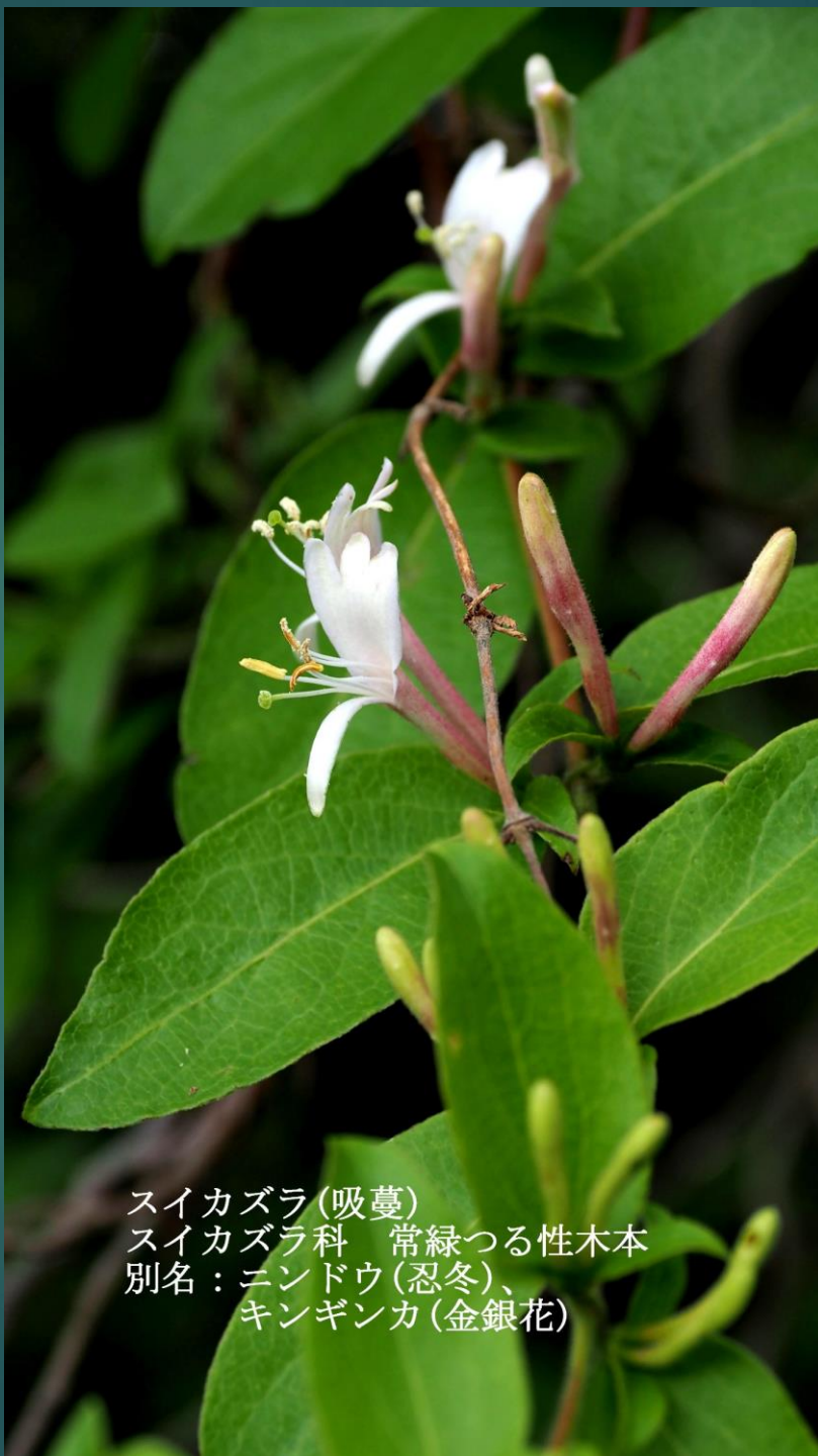
スイカズラ(吸蔓) スイカズラ科 常緑つる性木本 別名：ニンドウ(忍冬)、 キンギンカ(金銀花)