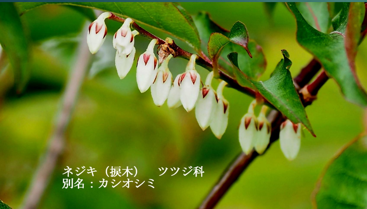
ネジキ (掬木) ツツジ科 別名：カシオシミ