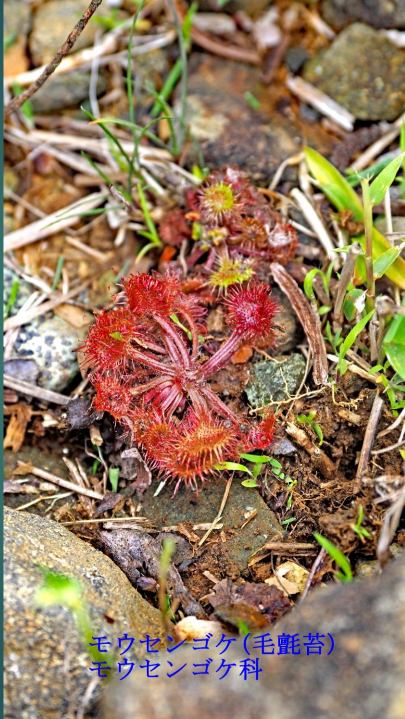
モウセンゴケ(毛氈苔) モウセンゴケ科