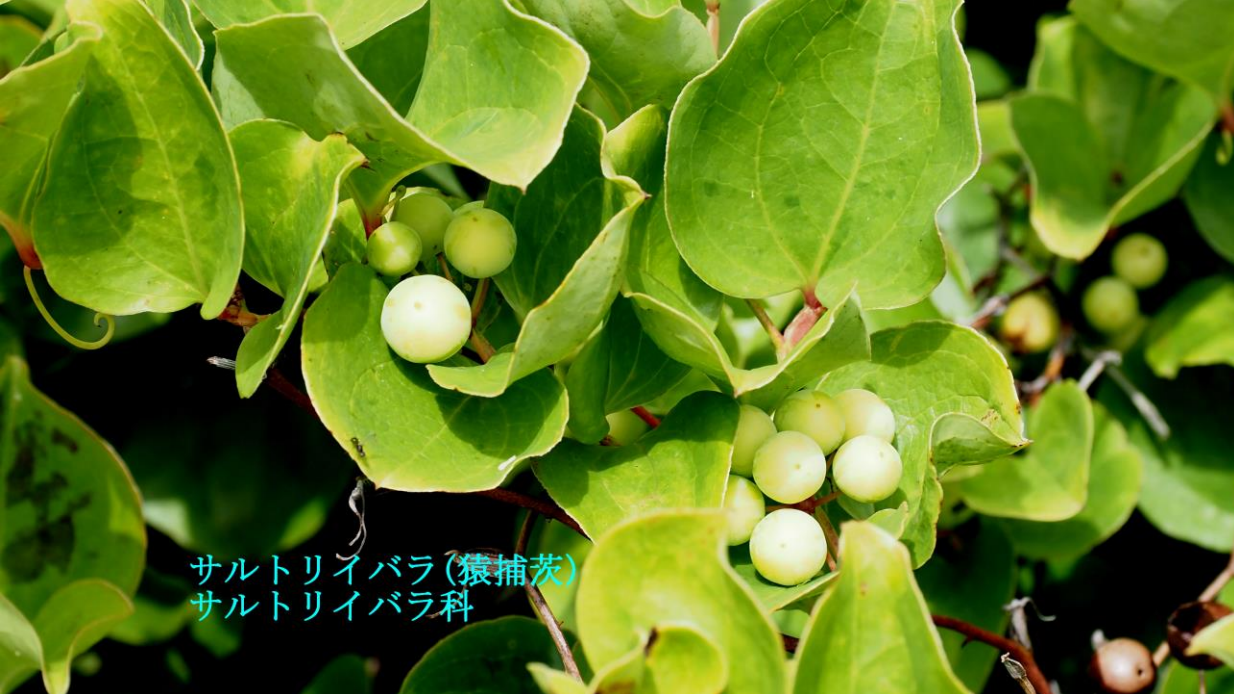
サルトリイバラ(猿捕茨) サルトリイバラ科