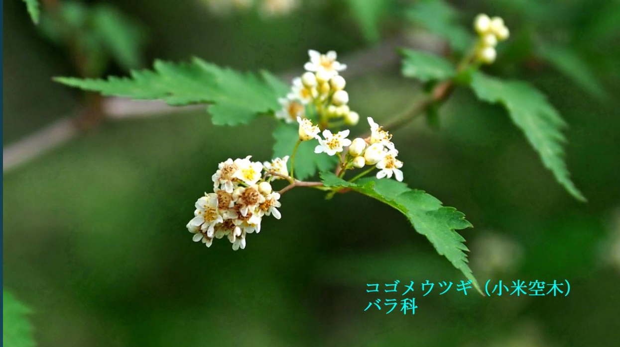
コゴメウツギ (小米空木) バラ科