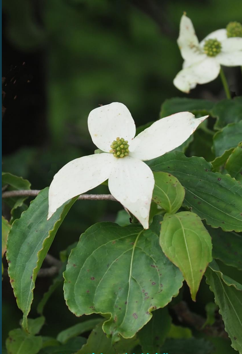
ヤマボウシ(山法師) ミズキ科 落葉高木 別名：ヤマグワ(山桑)