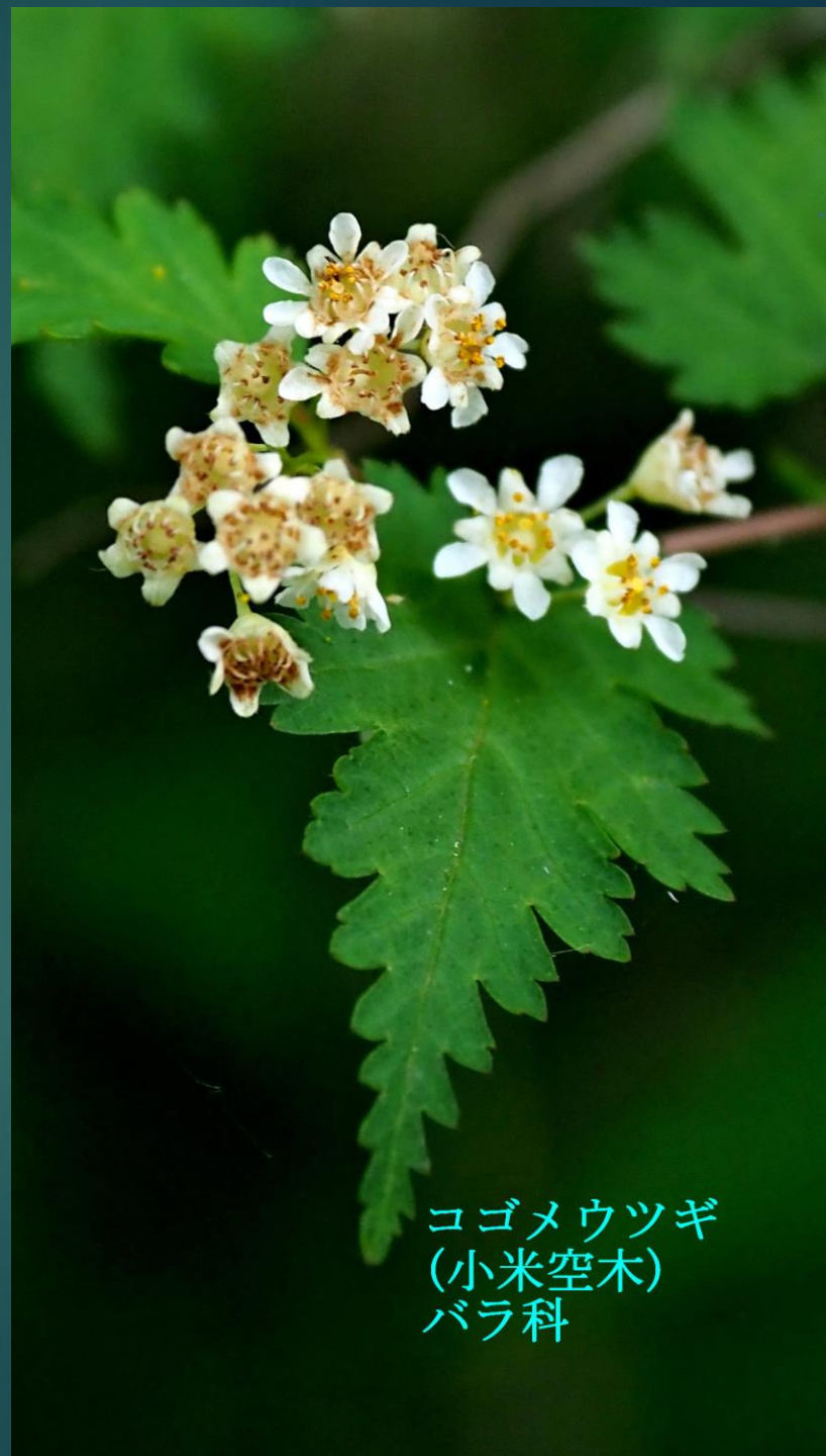
コゴメウツギ (小米空木) バラ科