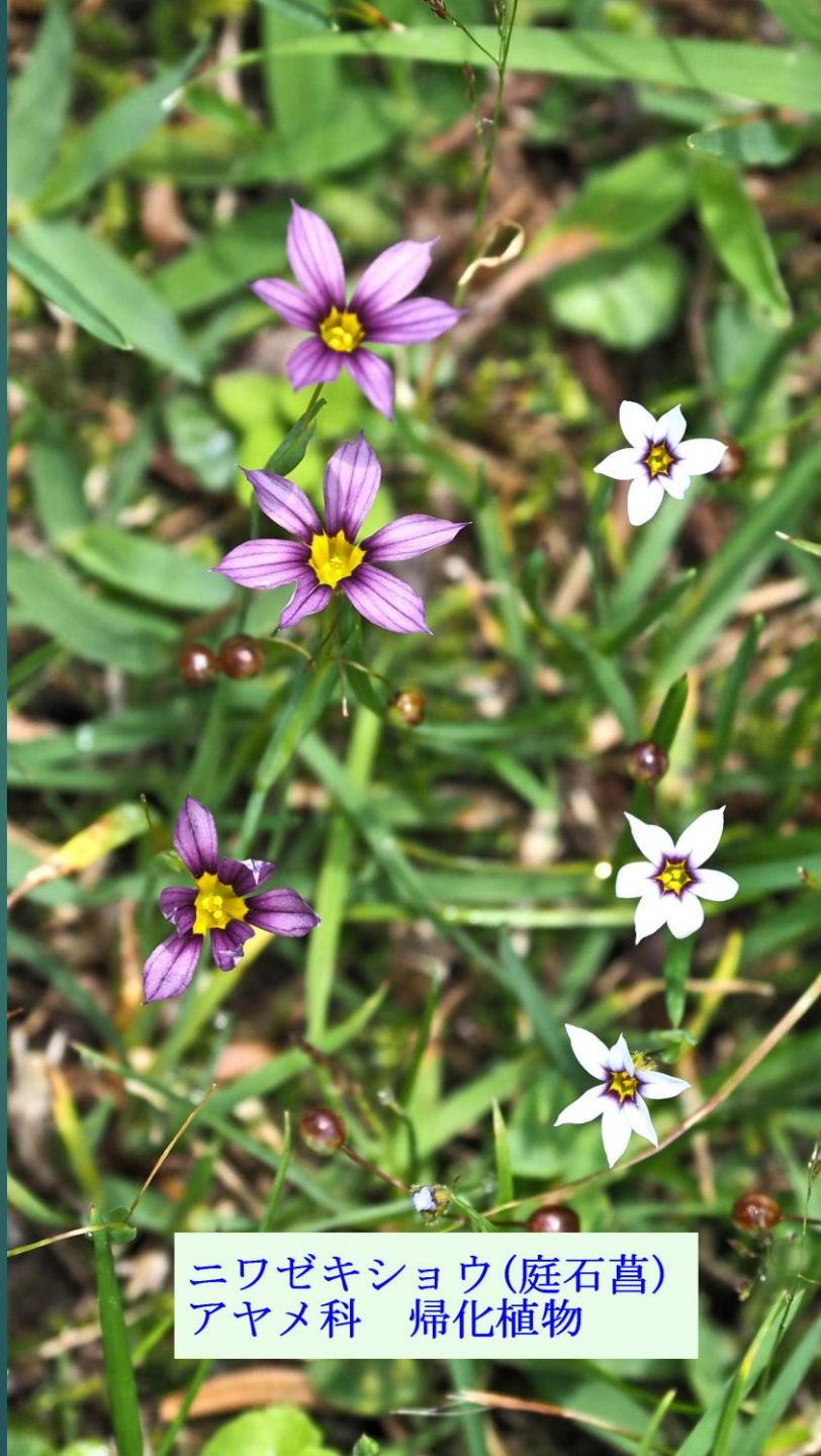
ニワゼキショウ(庭石菖) アヤメ科 帰化植物