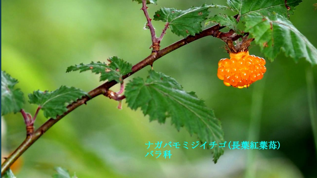
ナガバモミジイチゴ(長葉紅葉苺) バラ科