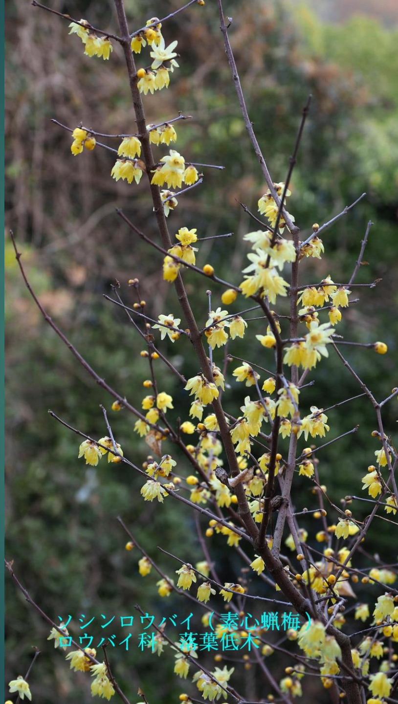
ソシンロウバイ (素心臘梅) ロウバイ科 落葉低木