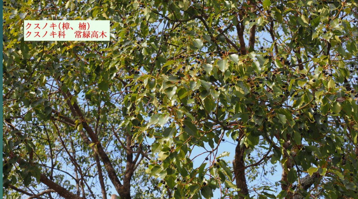
クスノキ(樟、楠) クスノキ科 常緑高木