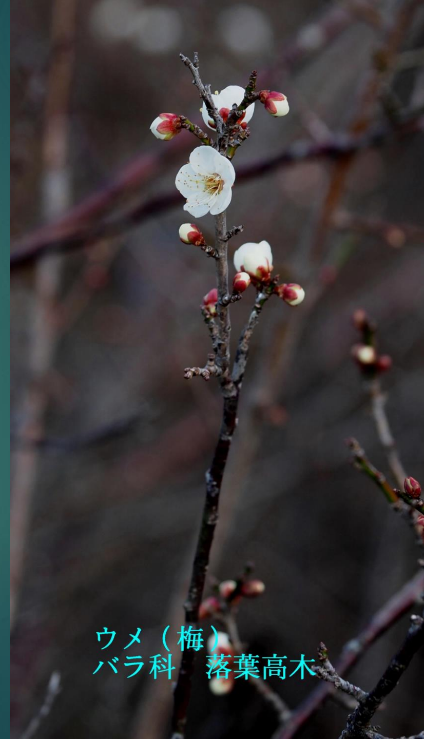
ウメ (梅) バラ科 落葉高木