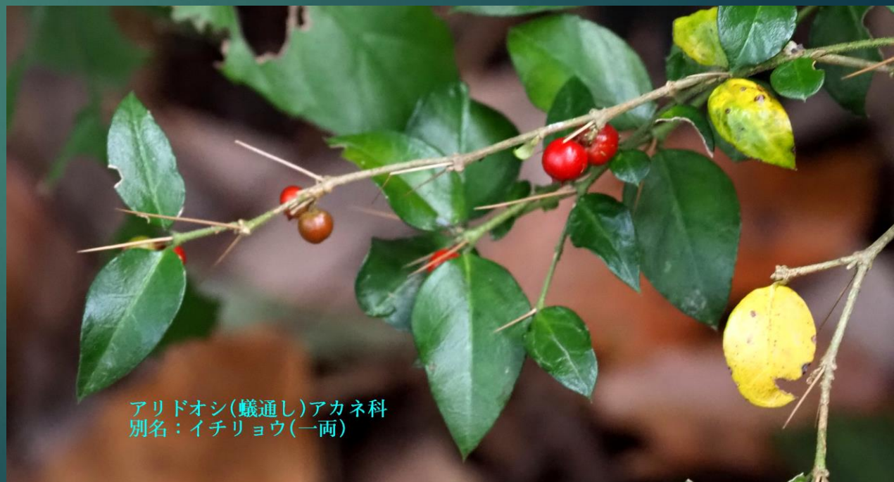
アリドオン (躑躅通し) アカネ科 別名: イチリョウ (一両)