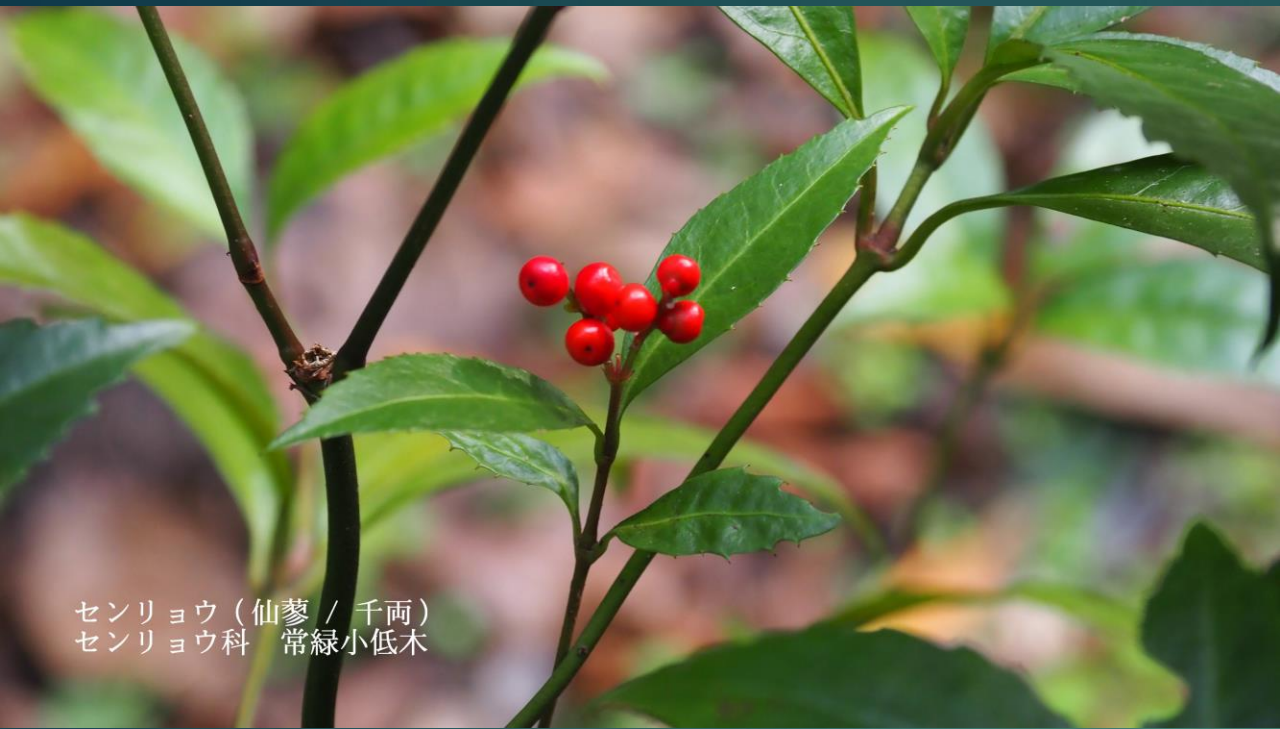
センリョウ (仙蓼 / 千両) センリョウ科 常緑小低木