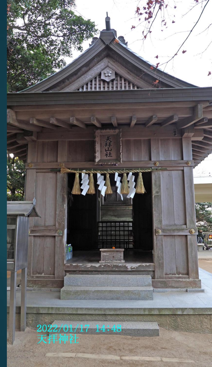
2022/01/17 14:48 天拝神社