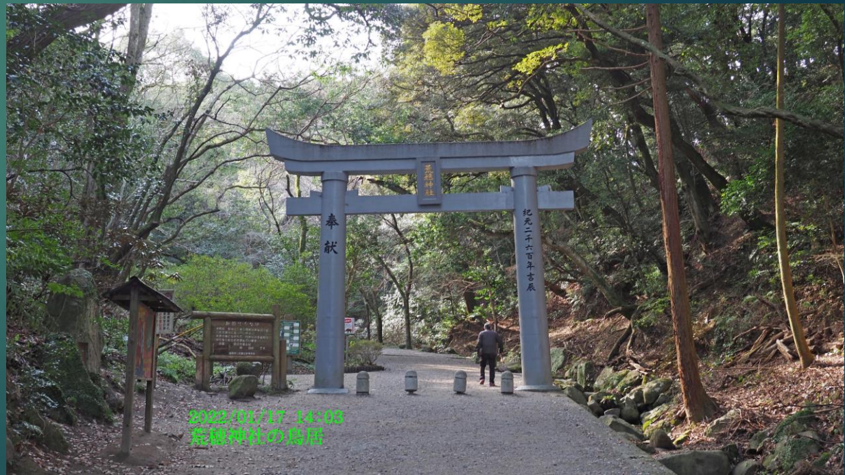
2022/01/17 14:05 藤樹神社の鳥居