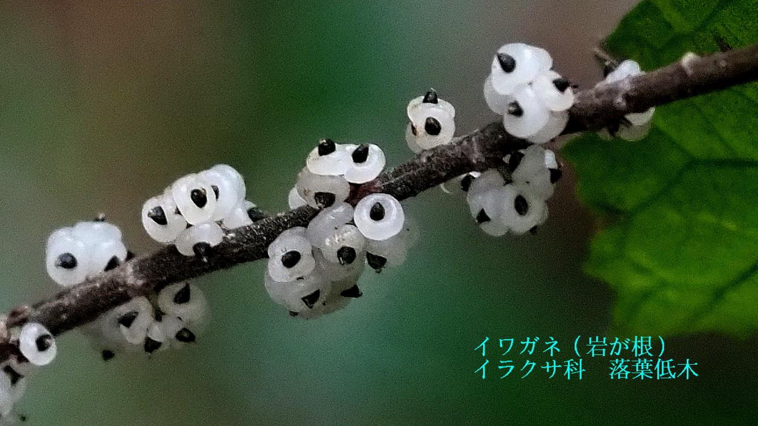
イワガネ（岩が根） イラクサ科 落葉低木