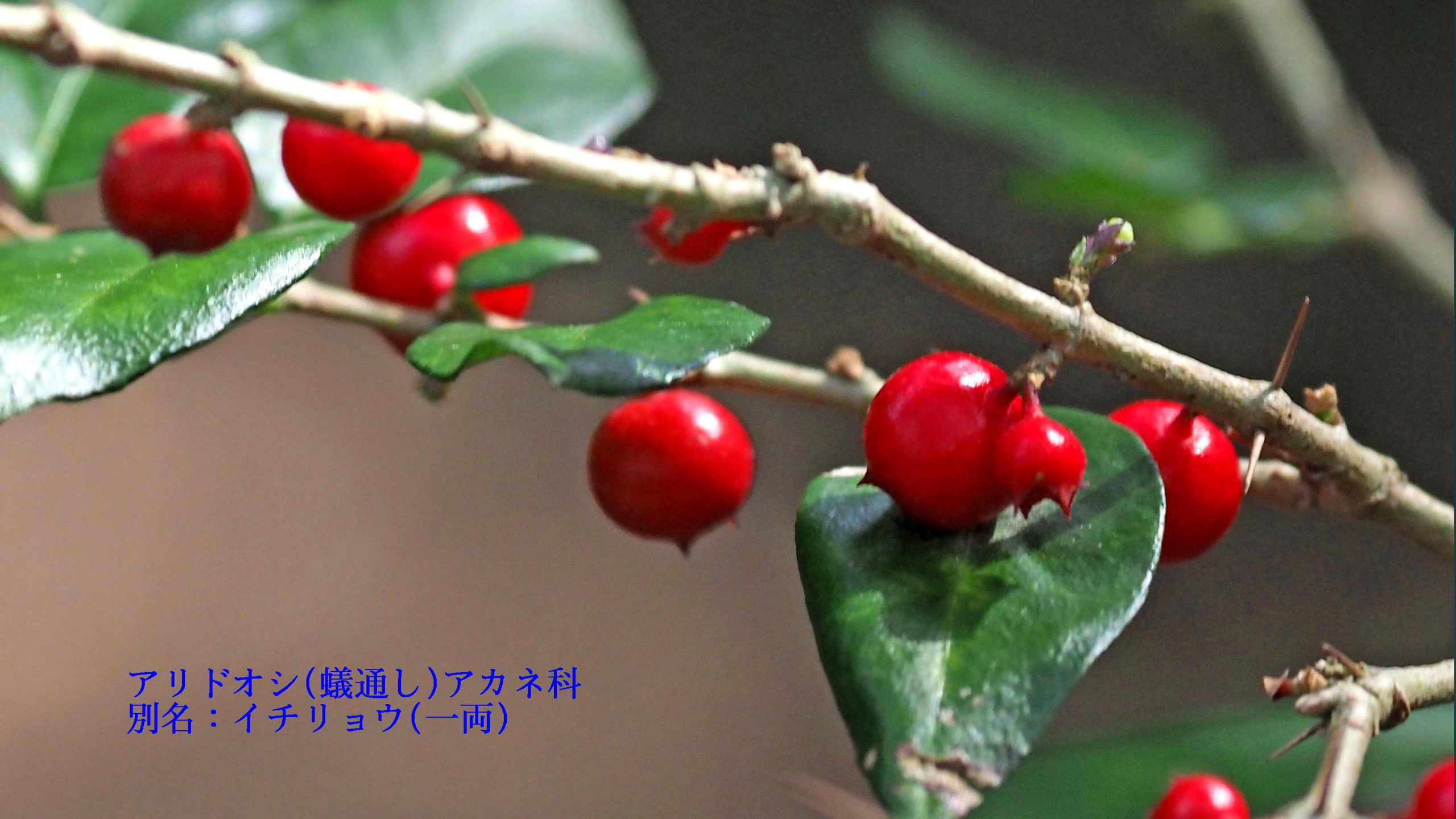
アリドオシ(蟻通し)アカネ科 別名：イチリョウ(一両)