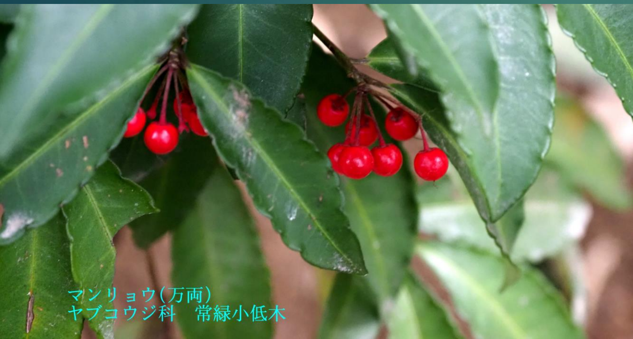
マンリョウ (万両) ヤブコウジ科 常緑小低木