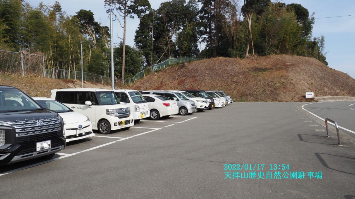
2022/01/17 13:54 天拝山歴史自然公園駐車場