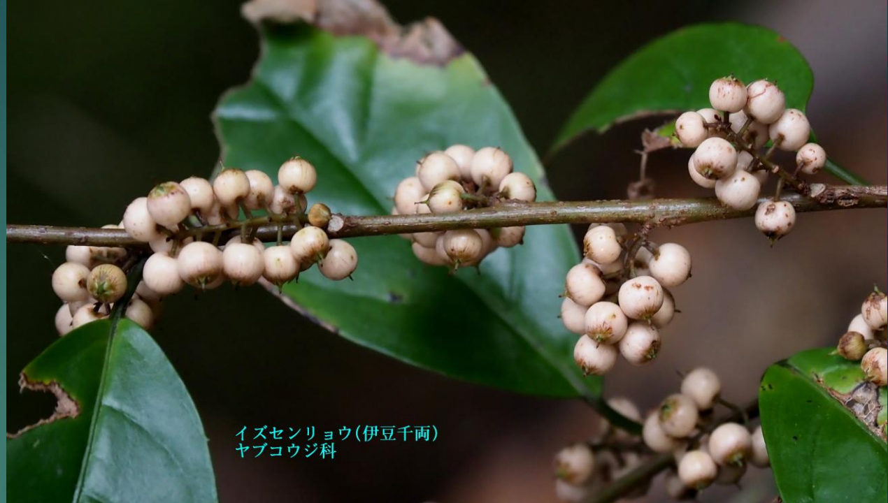
イズセンリョウ (伊豆千両) ヤブコウジ科