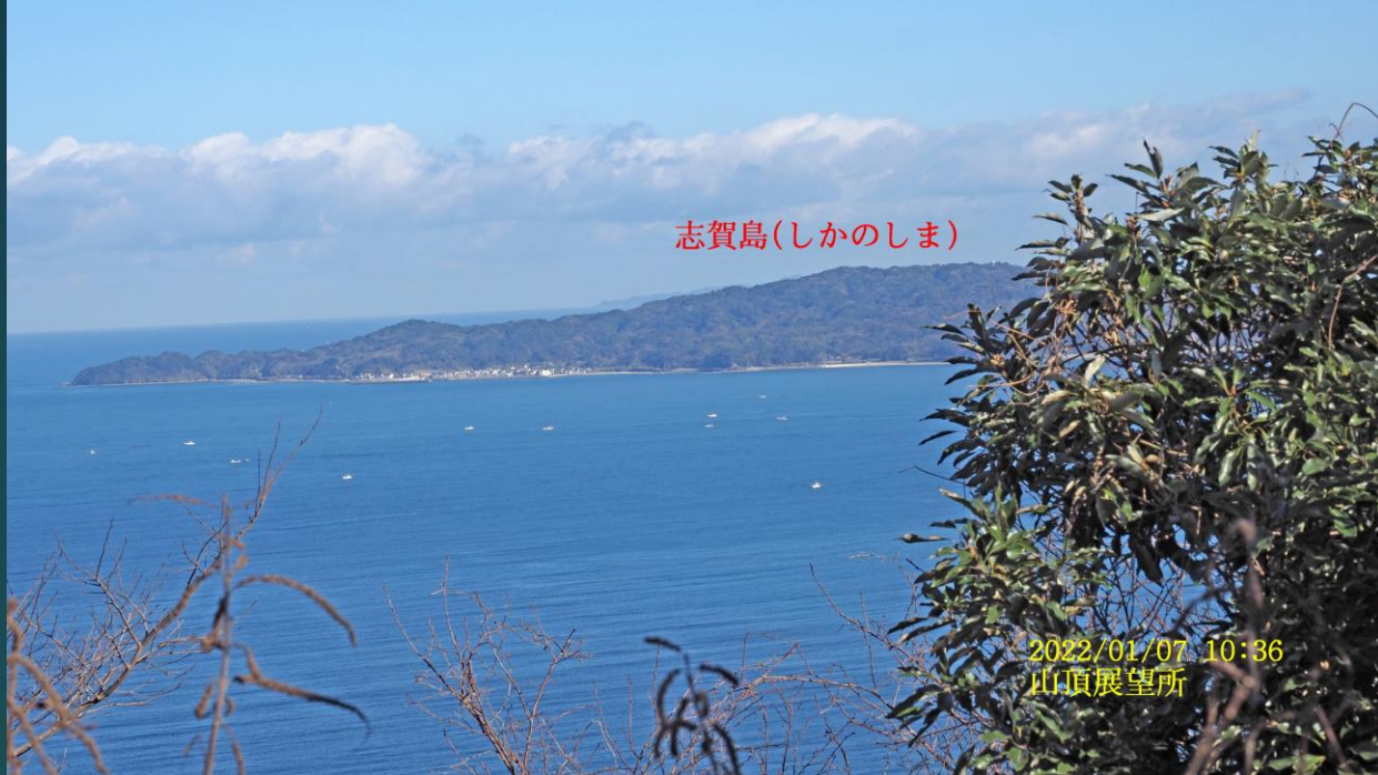
志賀島(しかのしま)