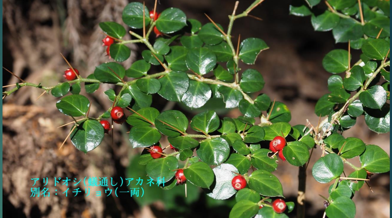
アリドオシ(蟻通し)アカネ科 別名：イチリョウ(一両)