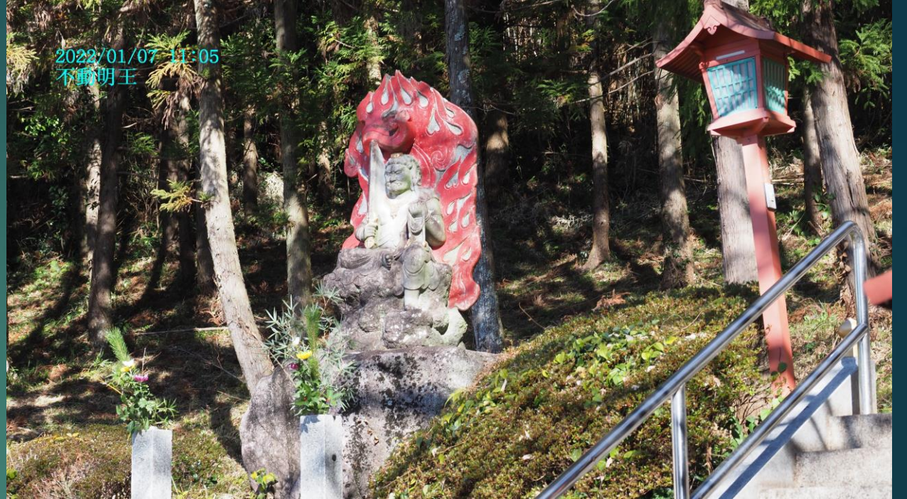
2022/01/07 11:05 不動明王