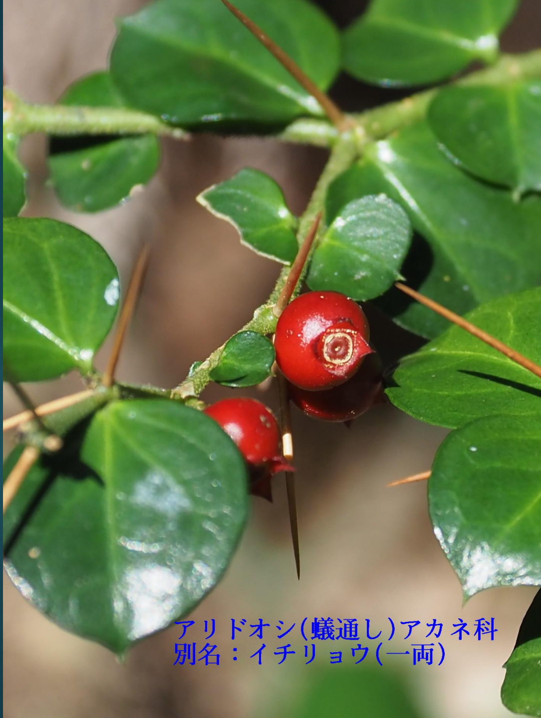
アリドオシ(蟻通し)アカネ科 別名：イチリョウ(一両)