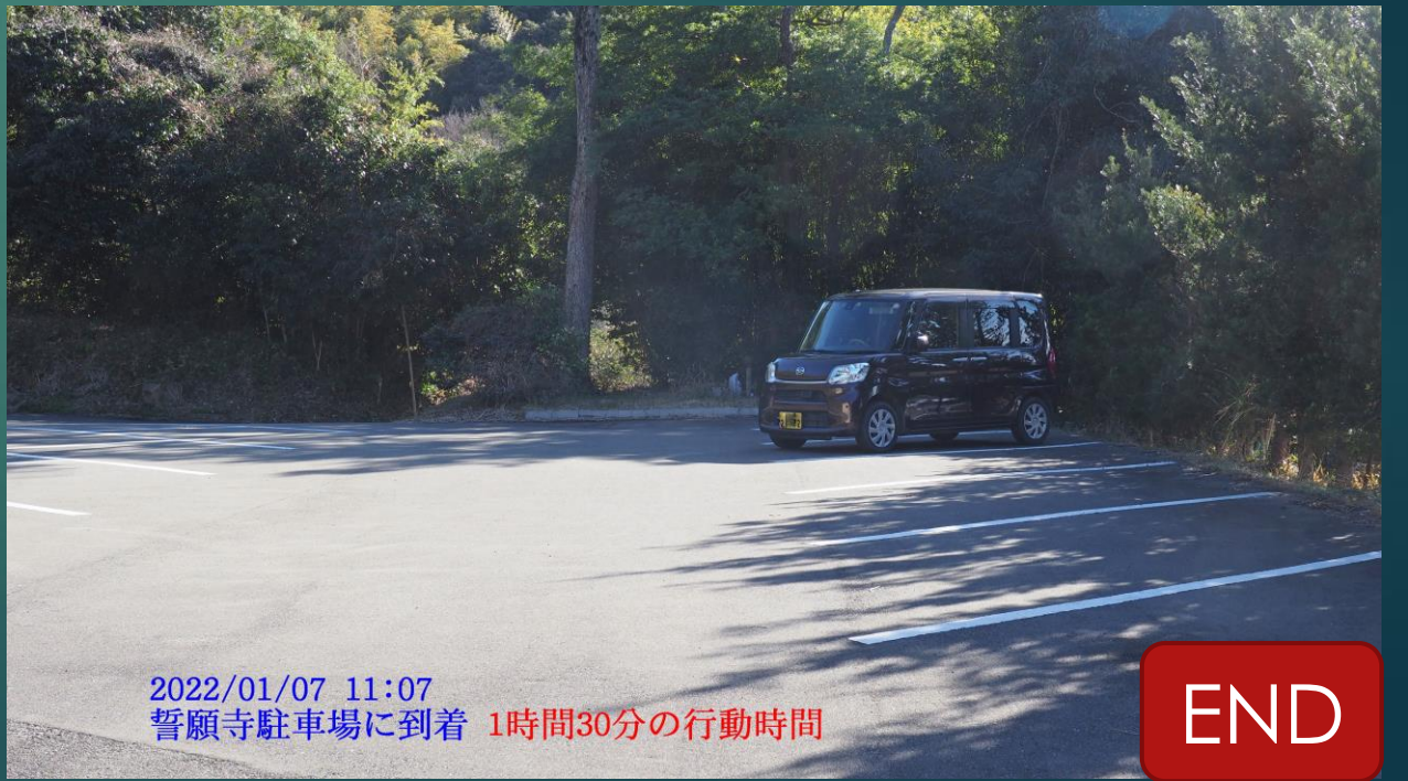
2022/01/07 11:07 誓願寺駐車場に到着 1時間30分の行動時間