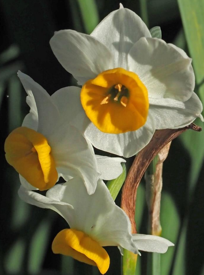
スイセン(水仙) ヒガンバナ科 有毒 別名：雪中花