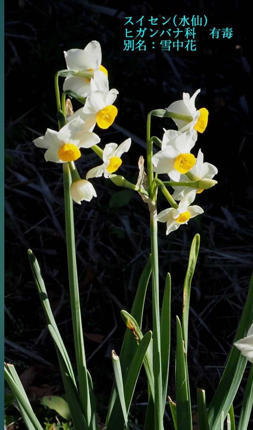
スイセン(水仙) ヒガンバナ科 有毒 別名：雪中花