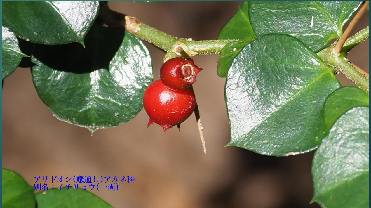
アリドオシ(蟻通し)アカネ科 別名：イチリョウ(一両)