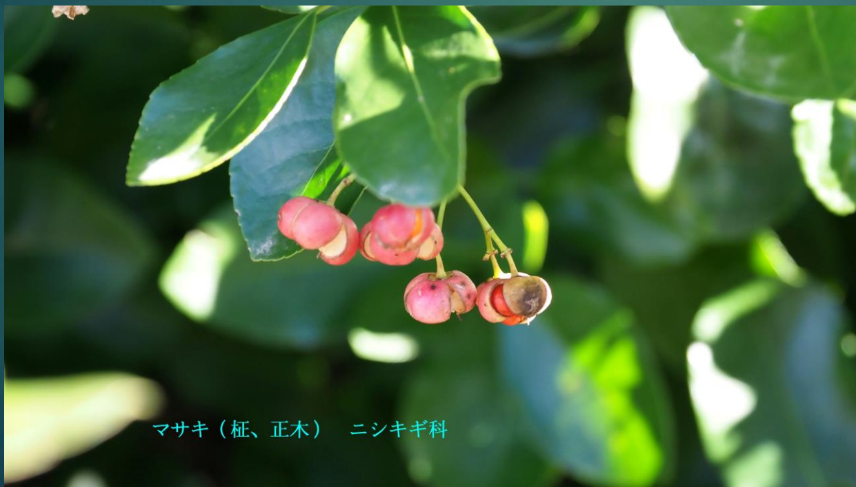
マサキ (柁、正木) ニシキギ科