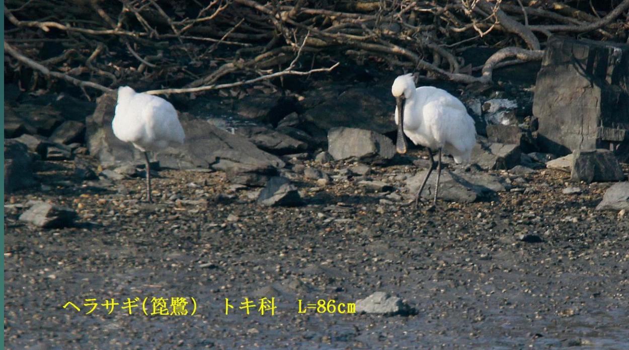
ヘラサギ(篋鷺) トキ科 L=86cm