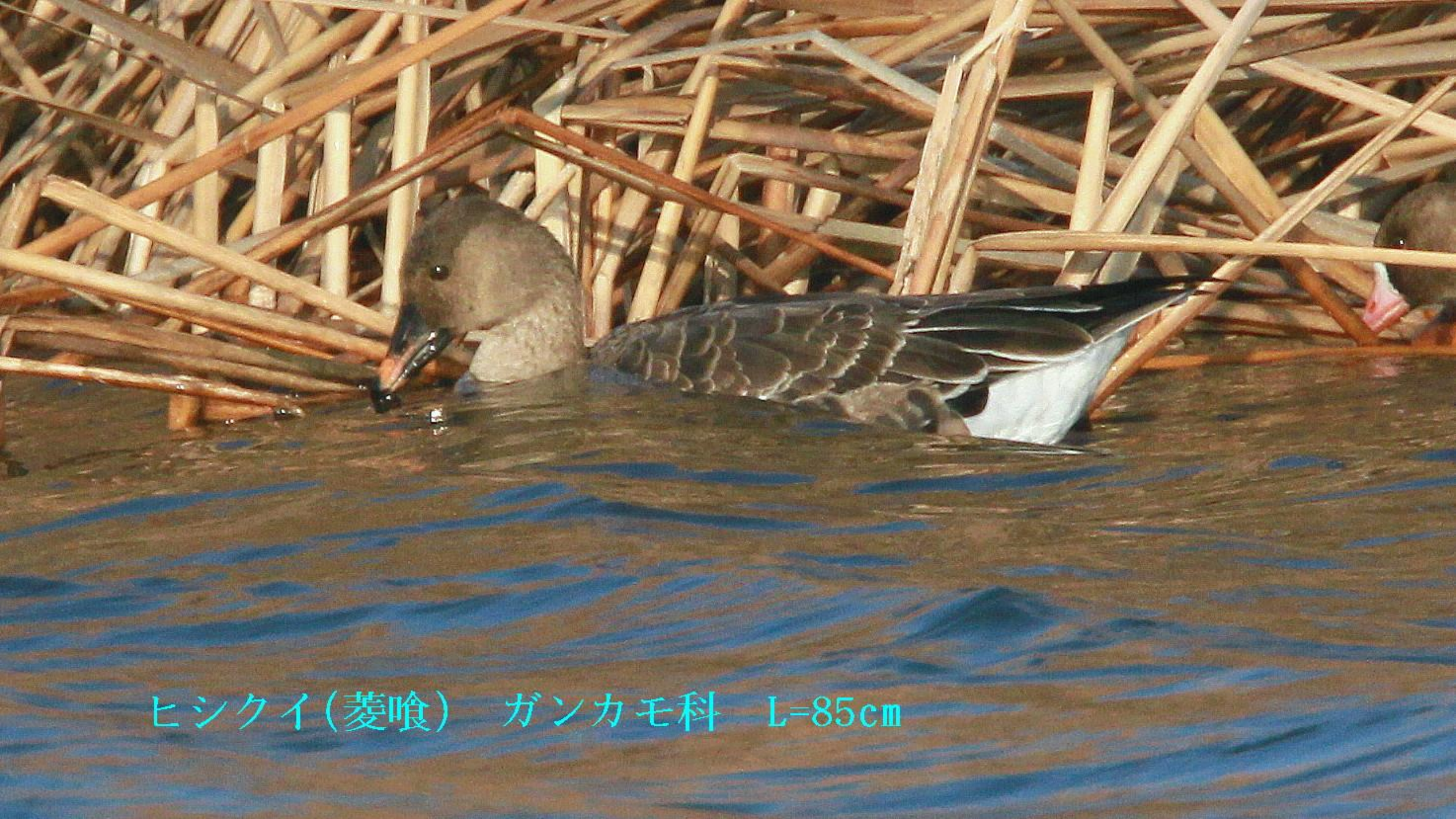
ヒシクイ(菱喰) ガンカモ科 L=85cm