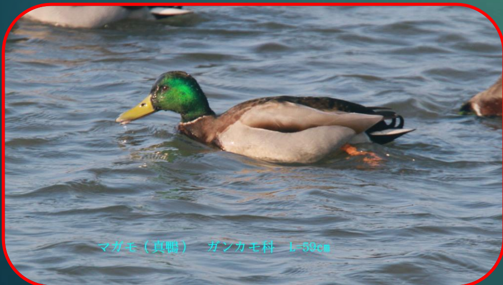
マガモ(真鴨) ガンカモ科 L=59cm