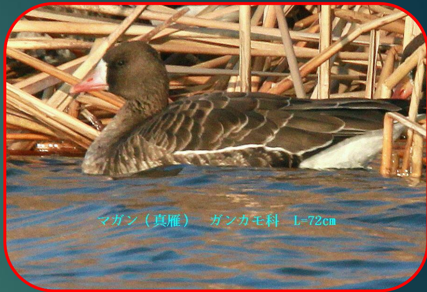
マガン(真雁) ガンカモ科 L=72cm