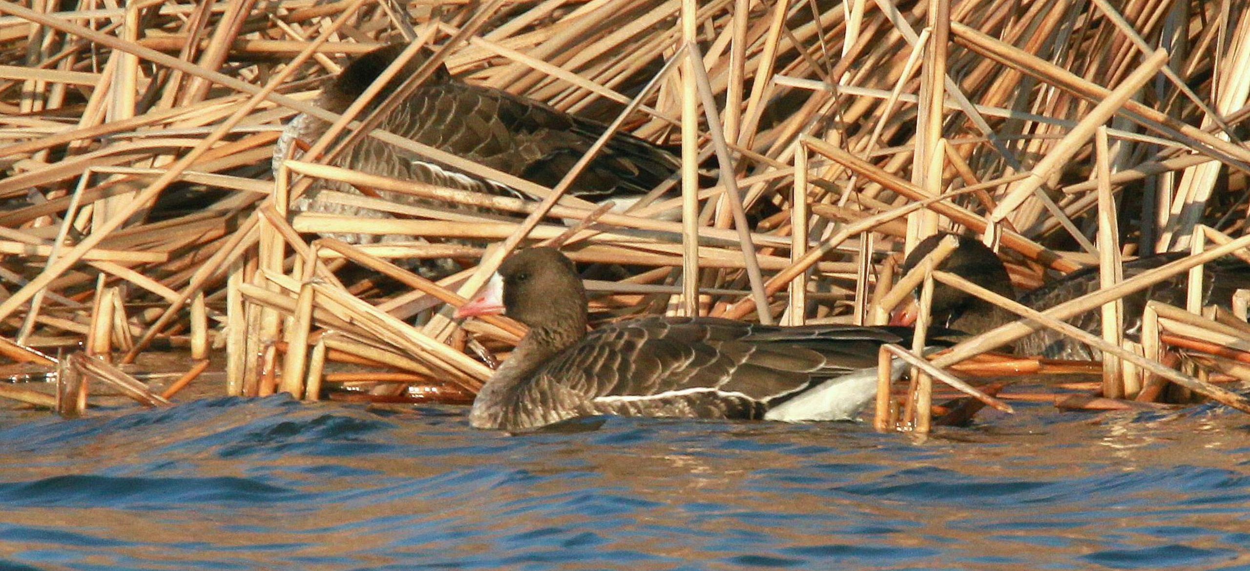
マガン（真雁） ガンカモ科 L=72cm