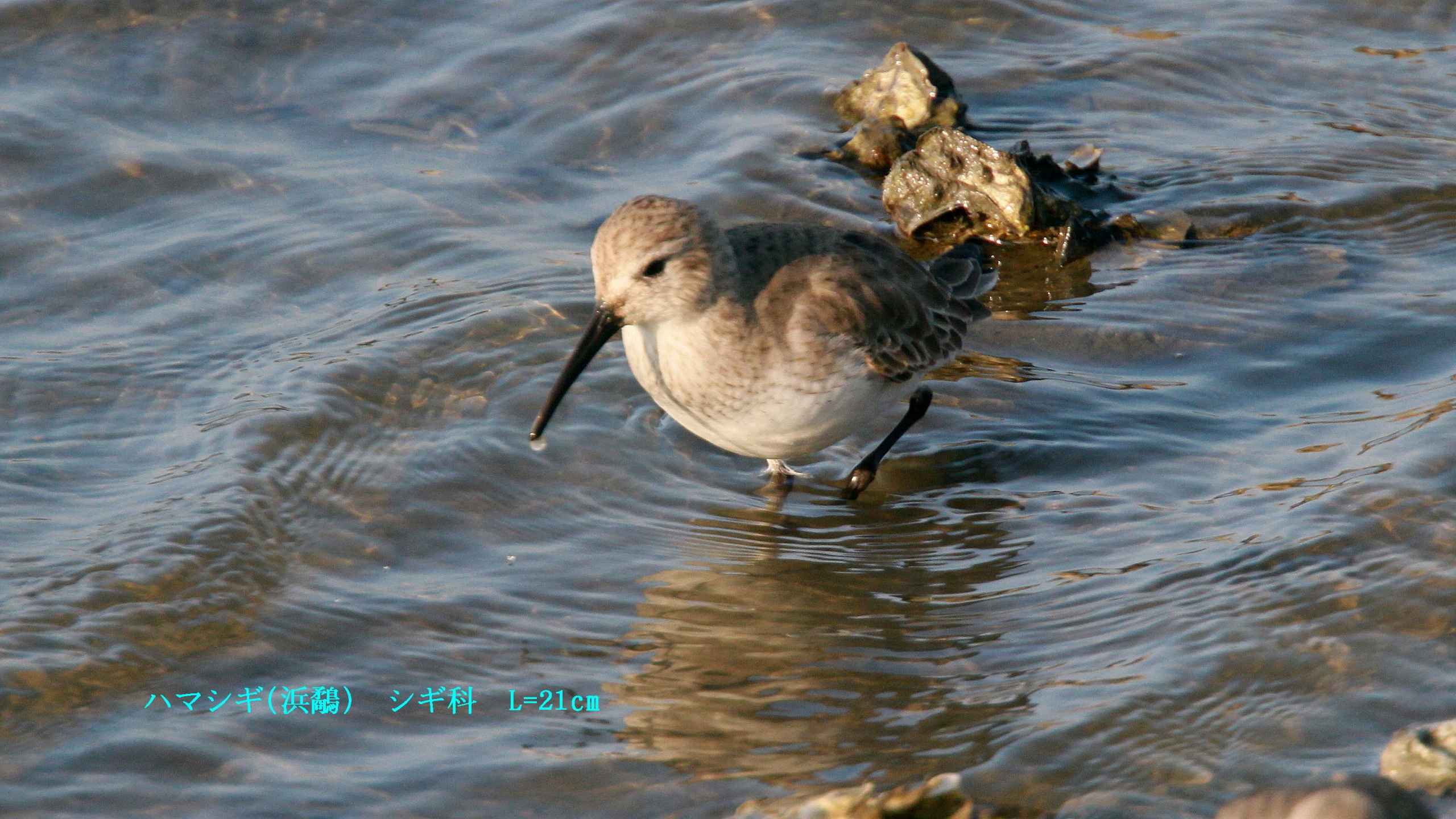
ハマシギ(浜鹬) シギ科 L=21cm