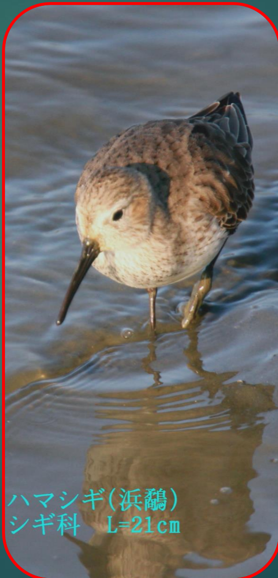
ハマシギ(浜鷺) シギ科 L=21cm