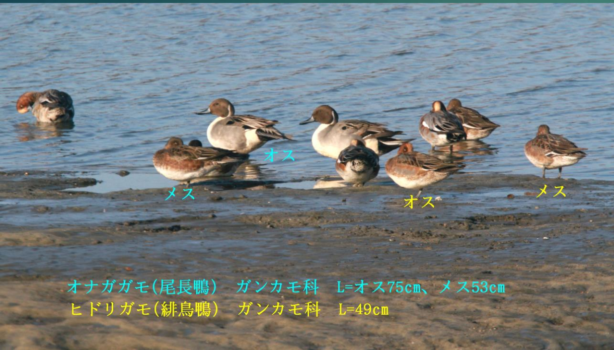
オナガガモ(尾長鴨) ガンカモ科 L=オス75cm、メス53cm ヒドリガモ(緋鳥鴨) ガンカモ科 L=49cm