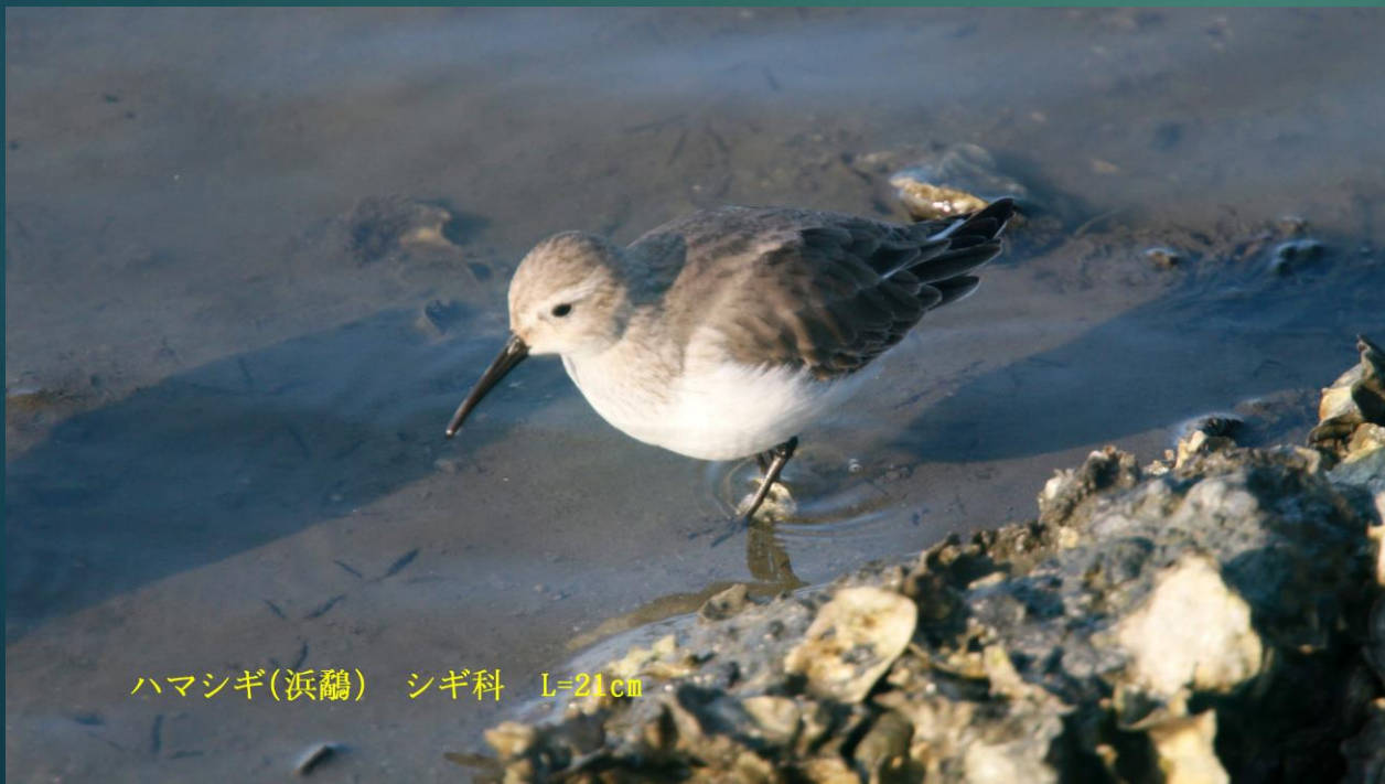
ハマシギ(滨鹬) シギ科 L=21cm