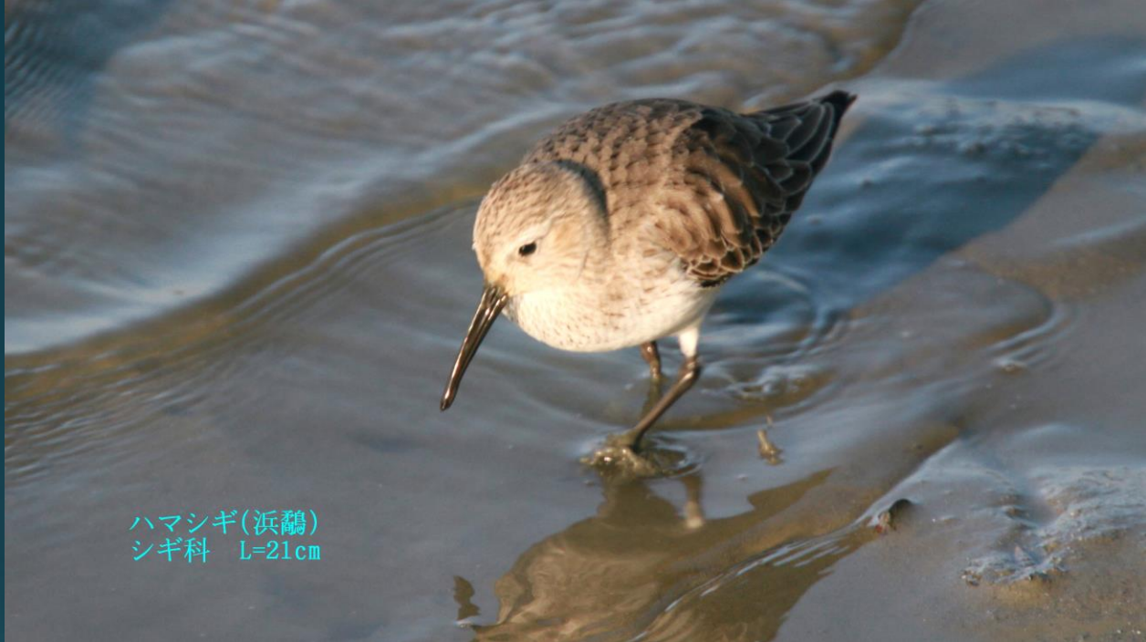
ハマシギ(滨鹬) シギ科 L=21cm