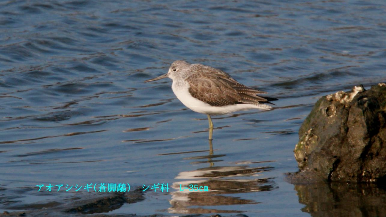
アオアシシギ(蒼脚鶺) シギ科 L=35cm