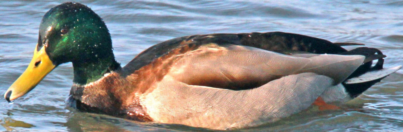
マガモ（真鴨）オス ガンカモ科 L=59cm