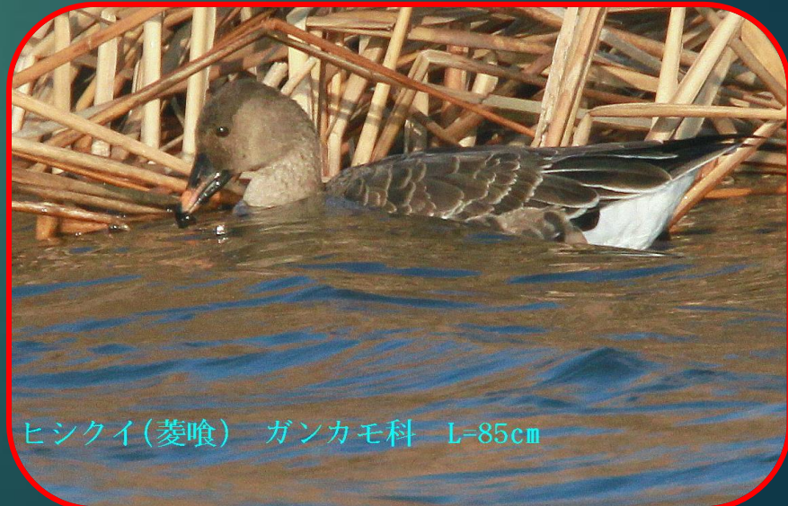
ヒシクイ(菱喰) ガンカモ科 L=85cm