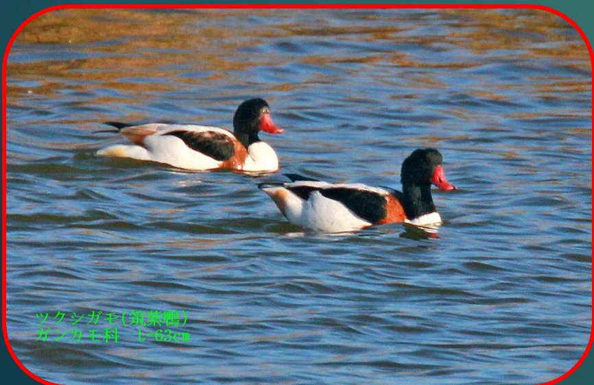
ツクシガモ(鶺鴒鴨) カモメ科 L=63cm