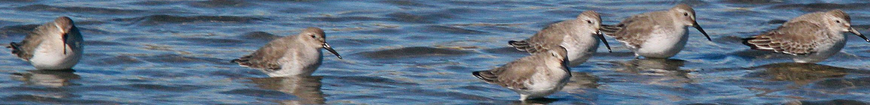
ハマシギ(浜鹬) シギ科 L=21cm