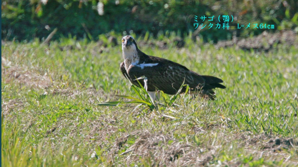
ミサゴ (鵟) ワシタカ科 L=メス64cm