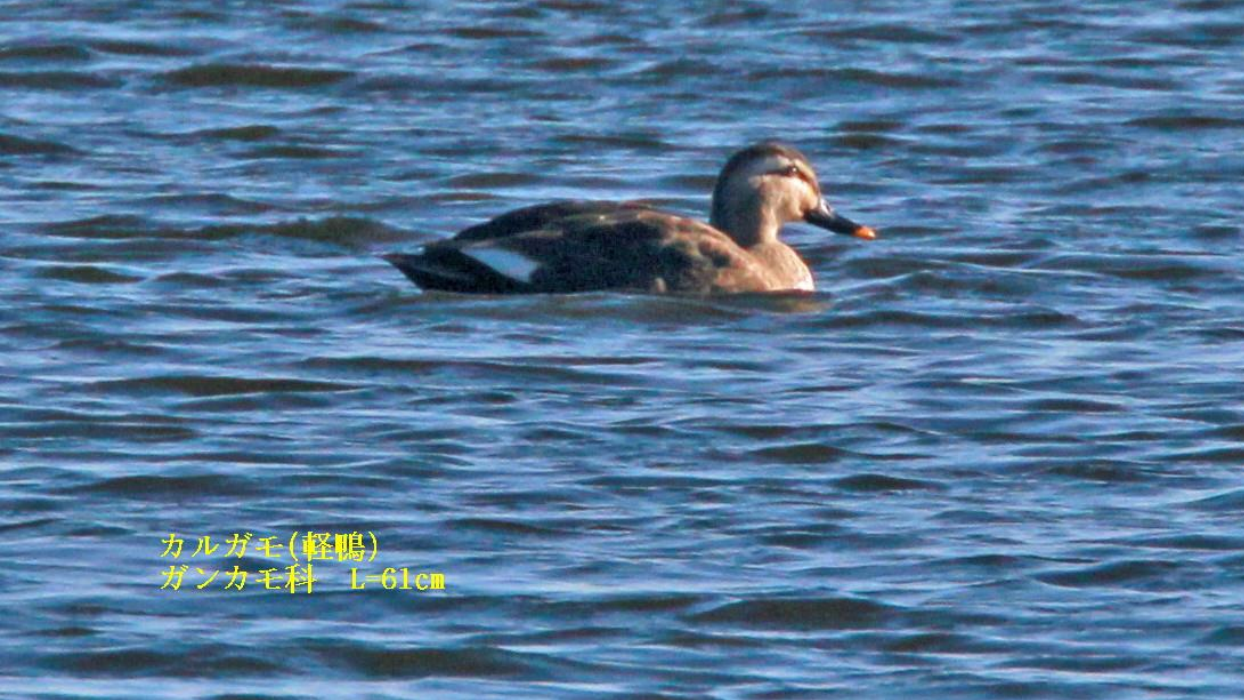
カルガモ(軽鴨) ガンカモ科 L=61cm