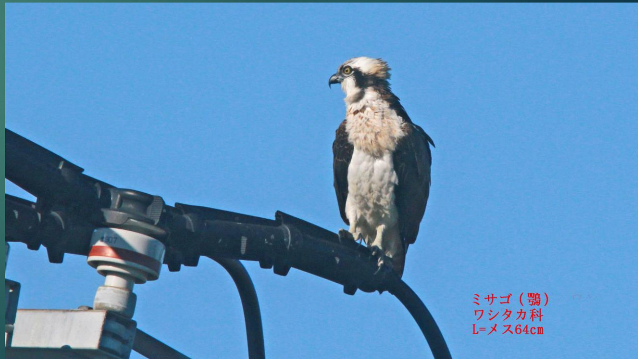
ミサゴ(鵟) ワシタカ科 L=メス64cm