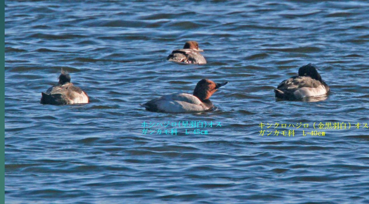
ホンハジロ(早羽白)オス ガンカモ科 L=45cm