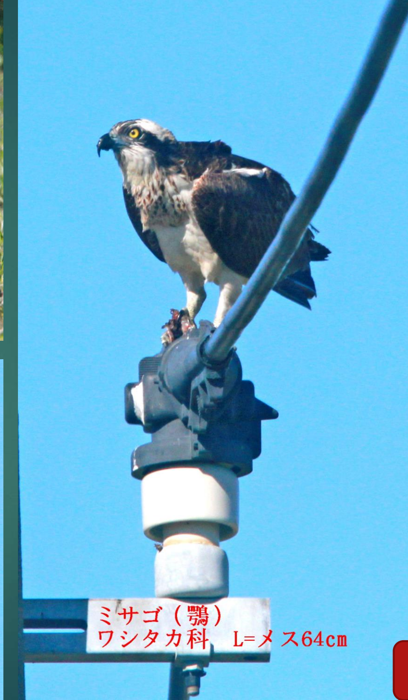
ミサゴ (鵟) ワシタカ科 L=メス64cm