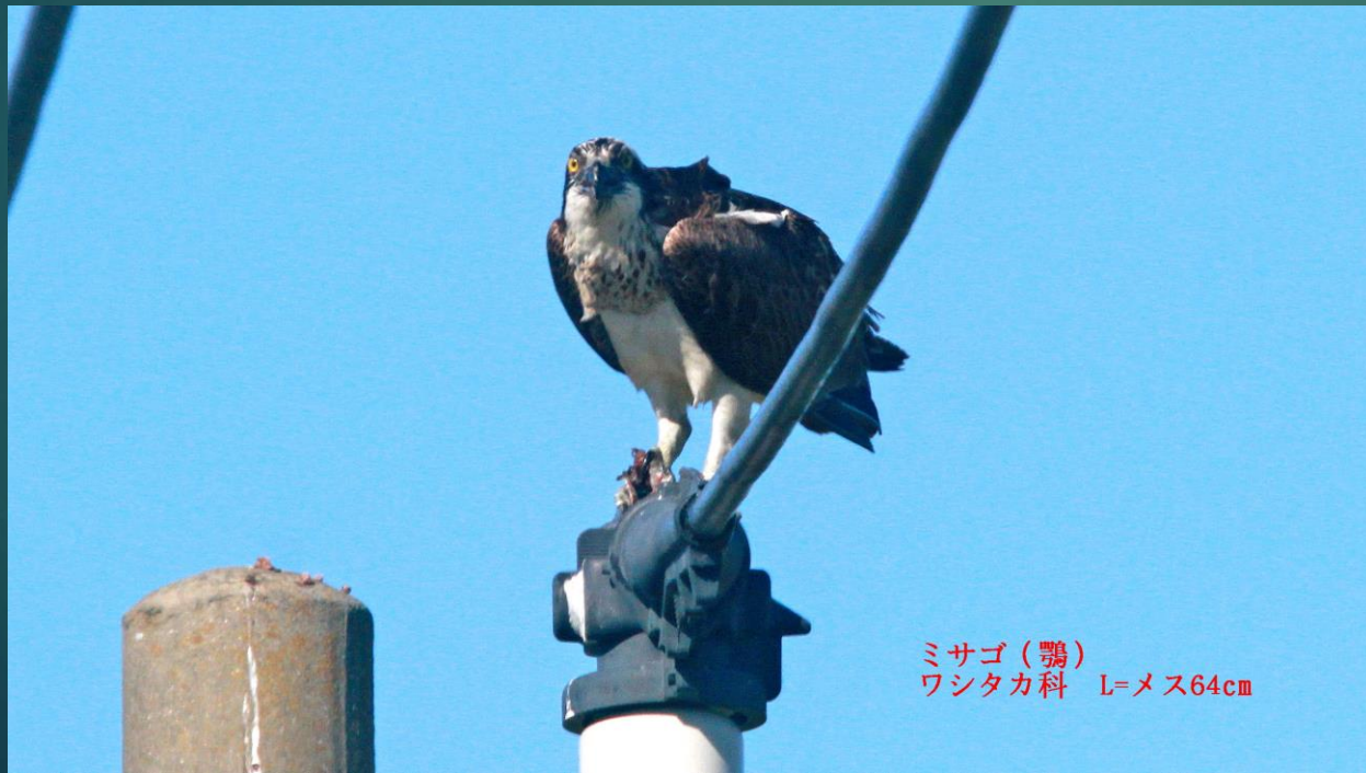
ミサゴ (鵟) ワシタカ科 L=メス64cm