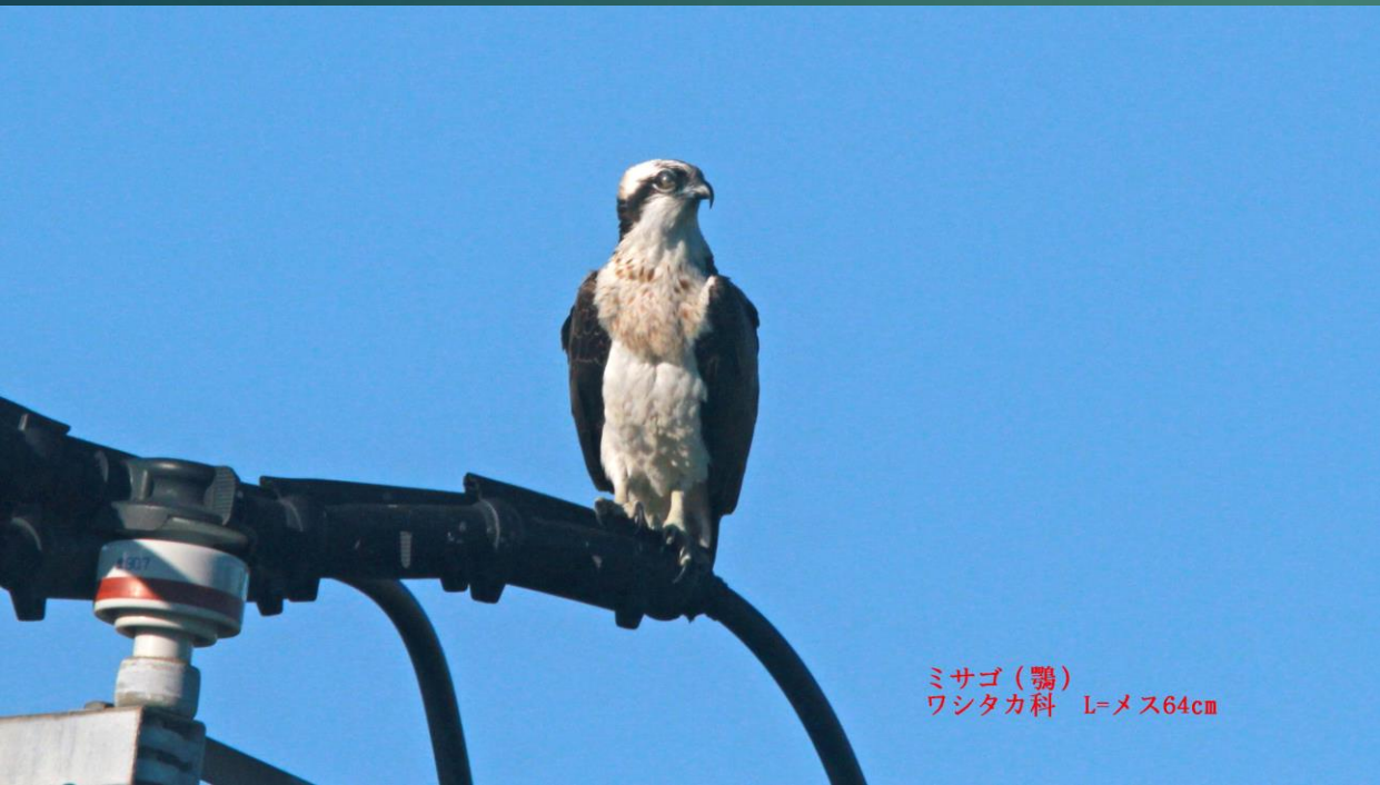
ミサゴ(鵟) ワシタカ科 L=メス64cm