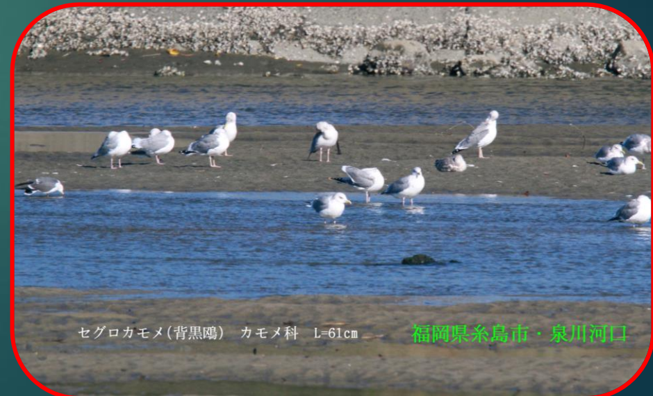
セグロカモメ(背黒鷗) カモメ科 L=61cm