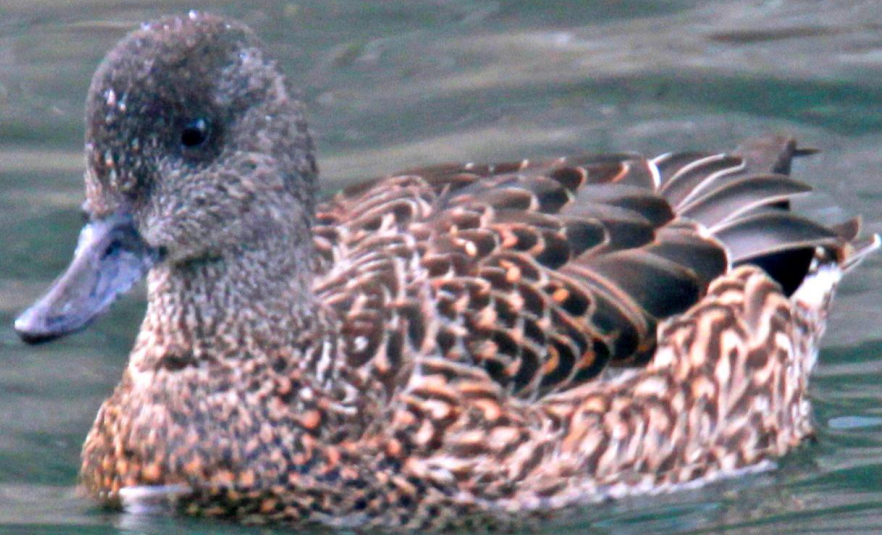
ヨシガモ(葦鴨) ガンカモ科 L=メス48cm