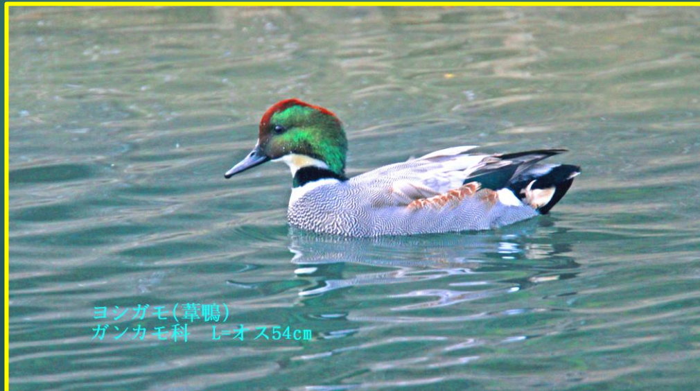
ヨシガモ(葦鴨) ガンカモ科 L=オス54cm