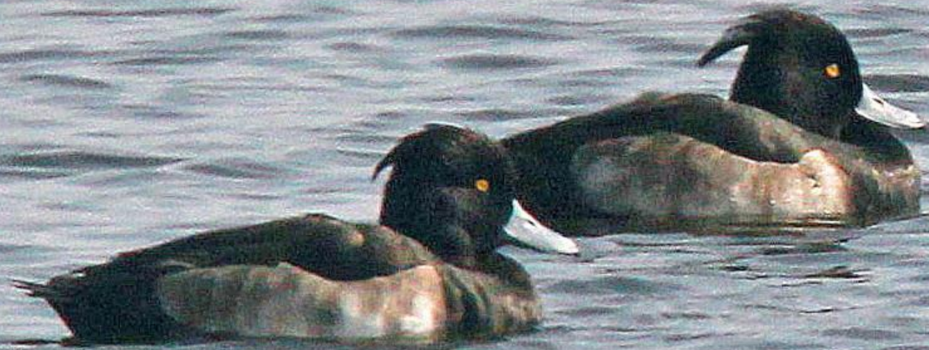
キンクロハジロ（金黒羽白） ガンカモ科 L=40cm