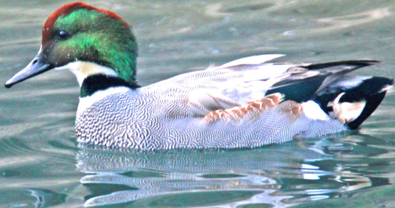
ヨシガモ(葦鴨) ガンカモ科 L=オス54cm