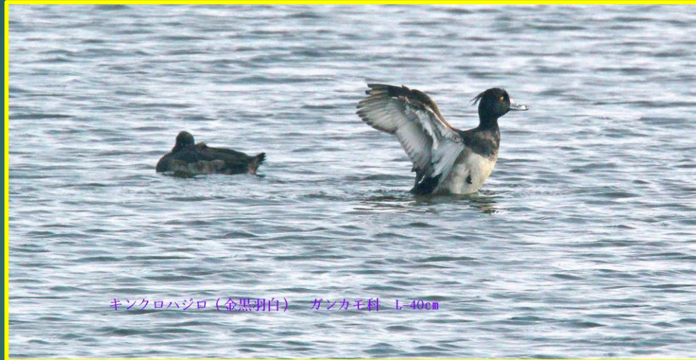
キンクロハジロ(金黒羽白) ガンカモ科 L=40cm