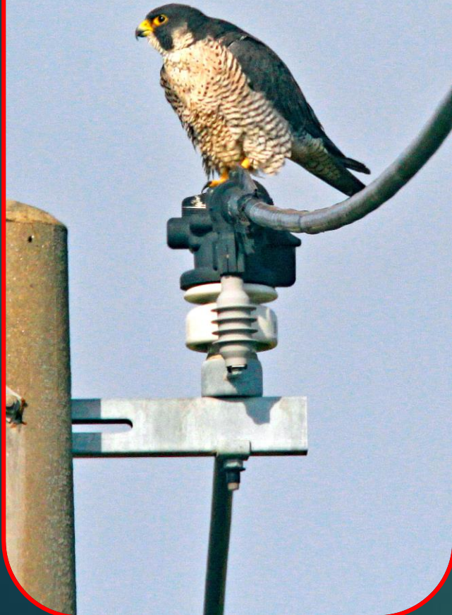
ハヤブサ(隼) ハヤブサ科 L=メス49cm