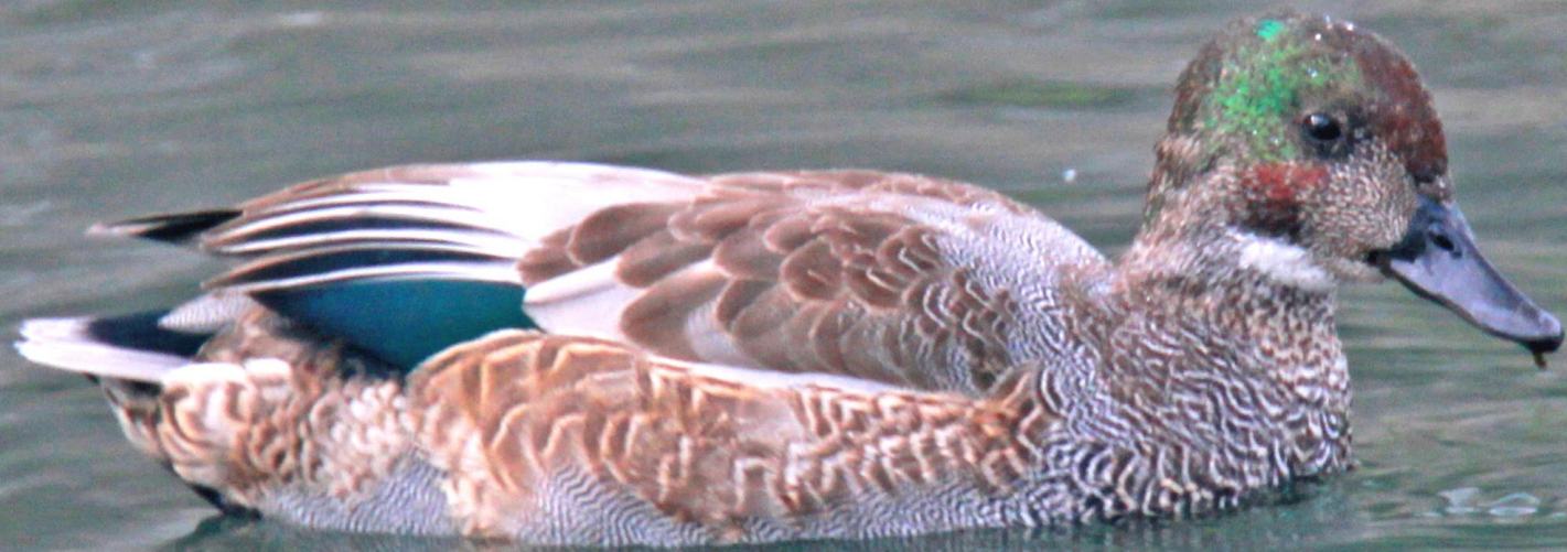
ヨシガモ(葦鴨) ガンカモ科 L=54cmオス(エクリップス)