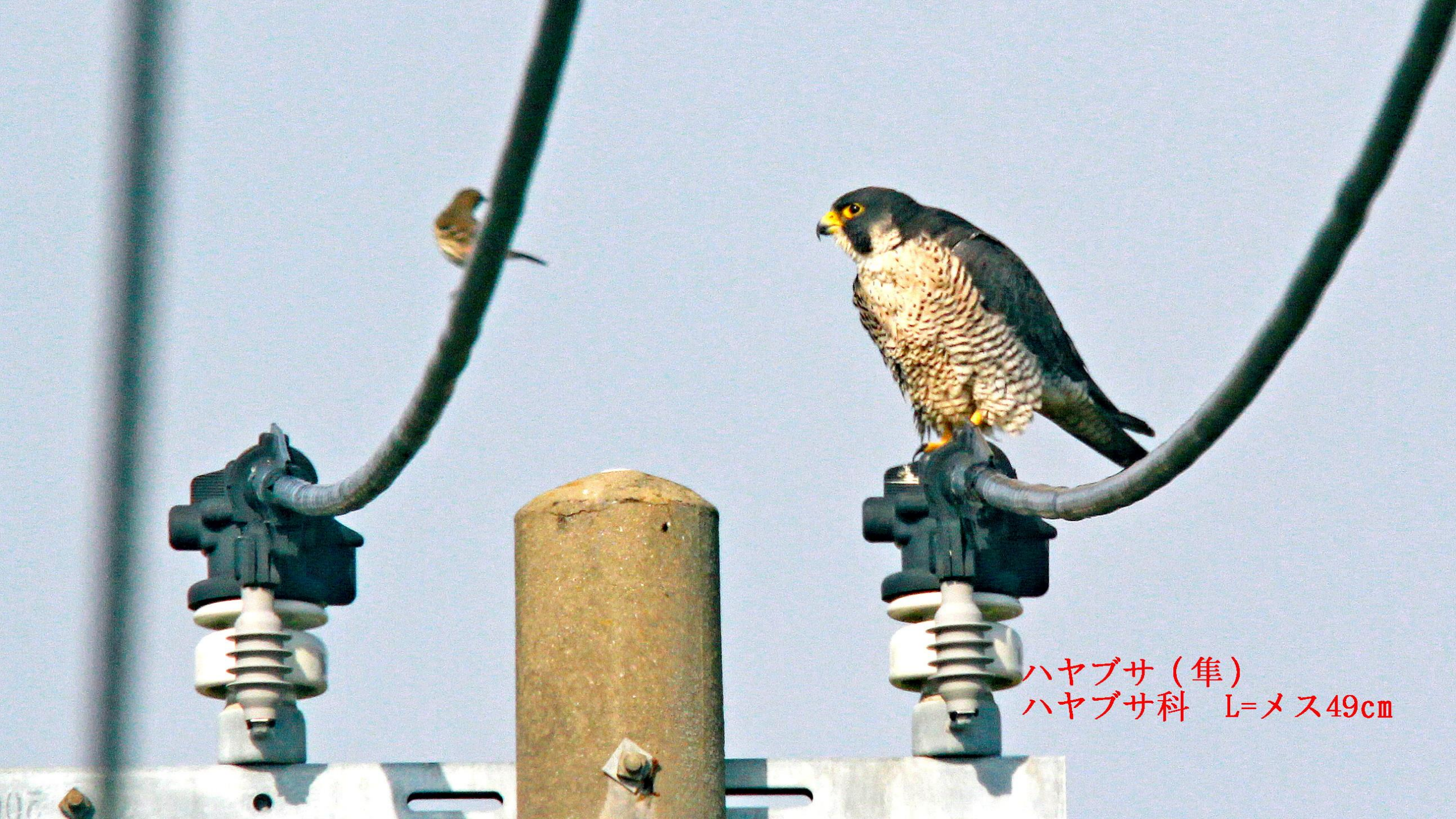
ハヤブサ (隼) ハヤブサ科 L=メス49cm