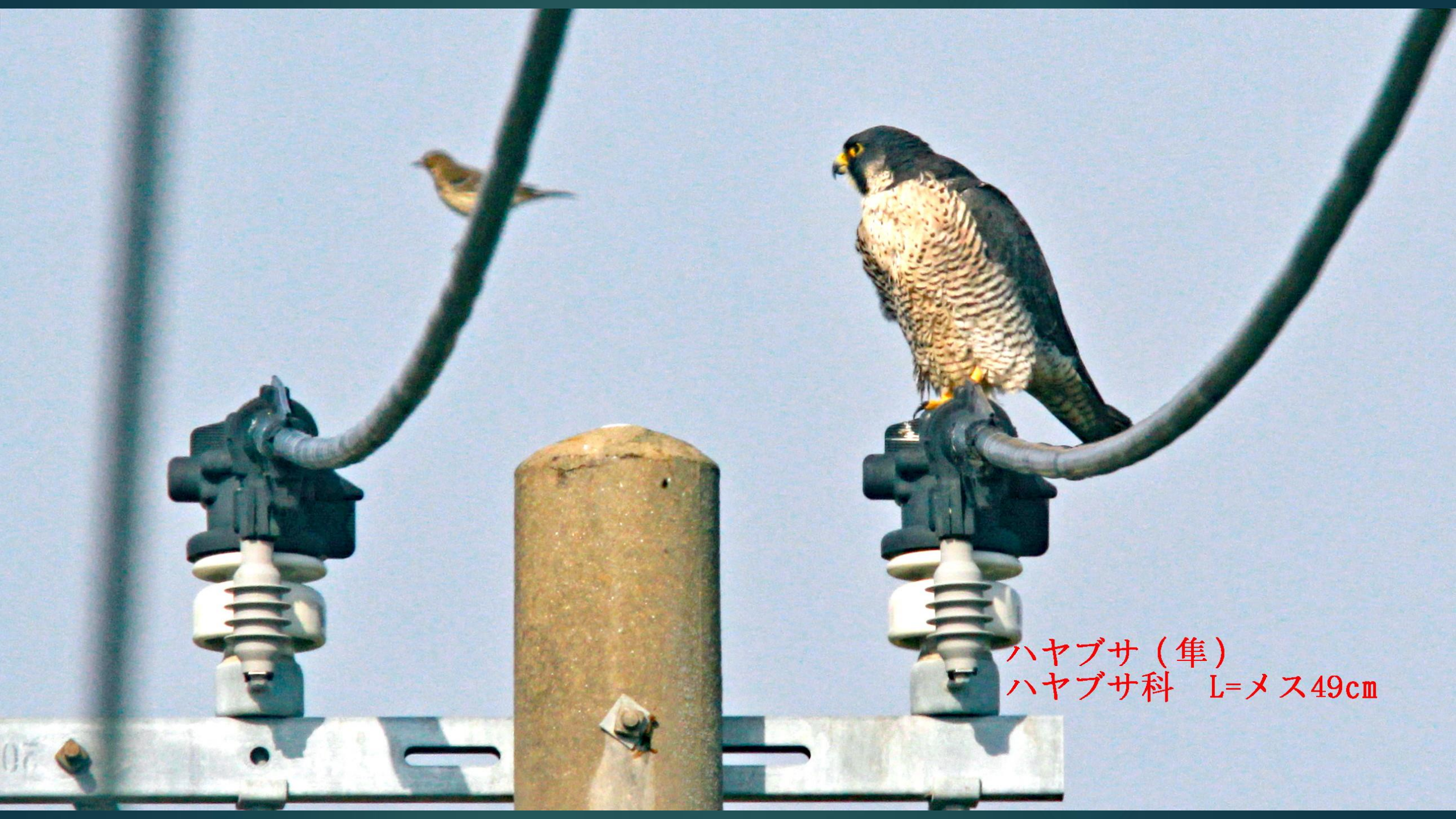
ハヤブサ (隼) ハヤブサ科 L=メス49cm