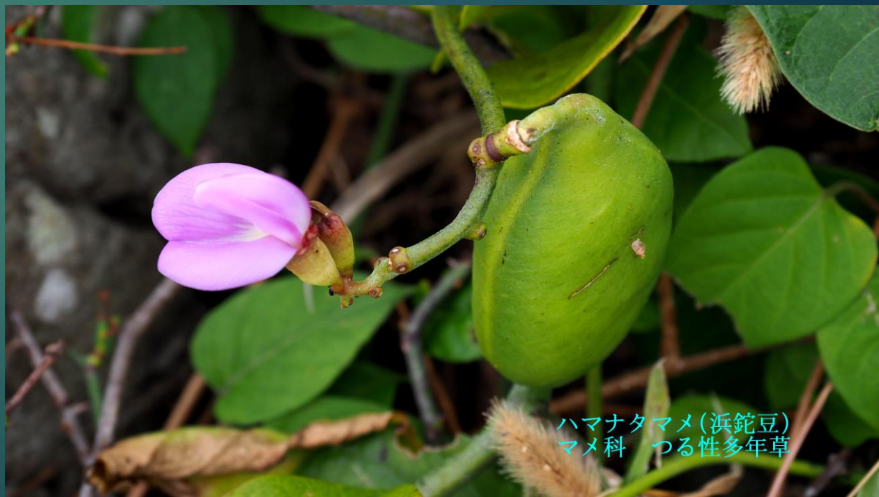
ハマナタマメ(浜鈍豆) マメ科 つる性多年草