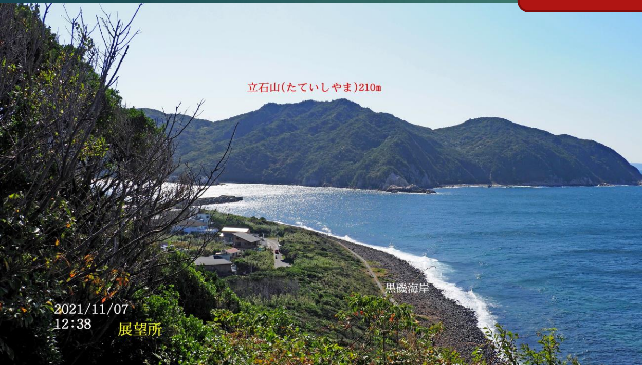
立石山(たていしやま)210m