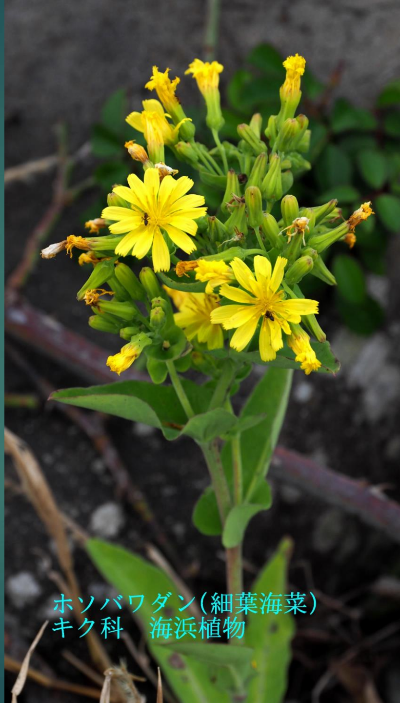
ホソバワダン(細葉海菜) キク科 海浜植物