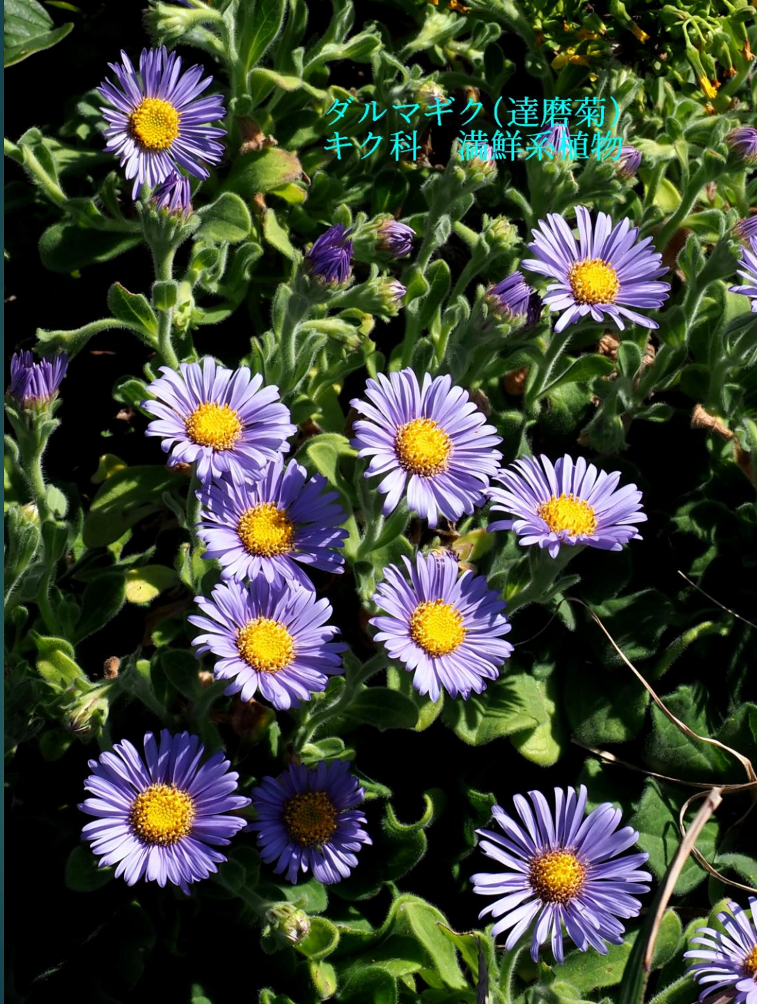
ダルマギク(達磨菊) キク科 満鮮系植物