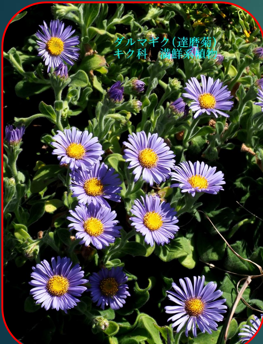
ダルマギク(達磨菊) キク科 満鮮系植物