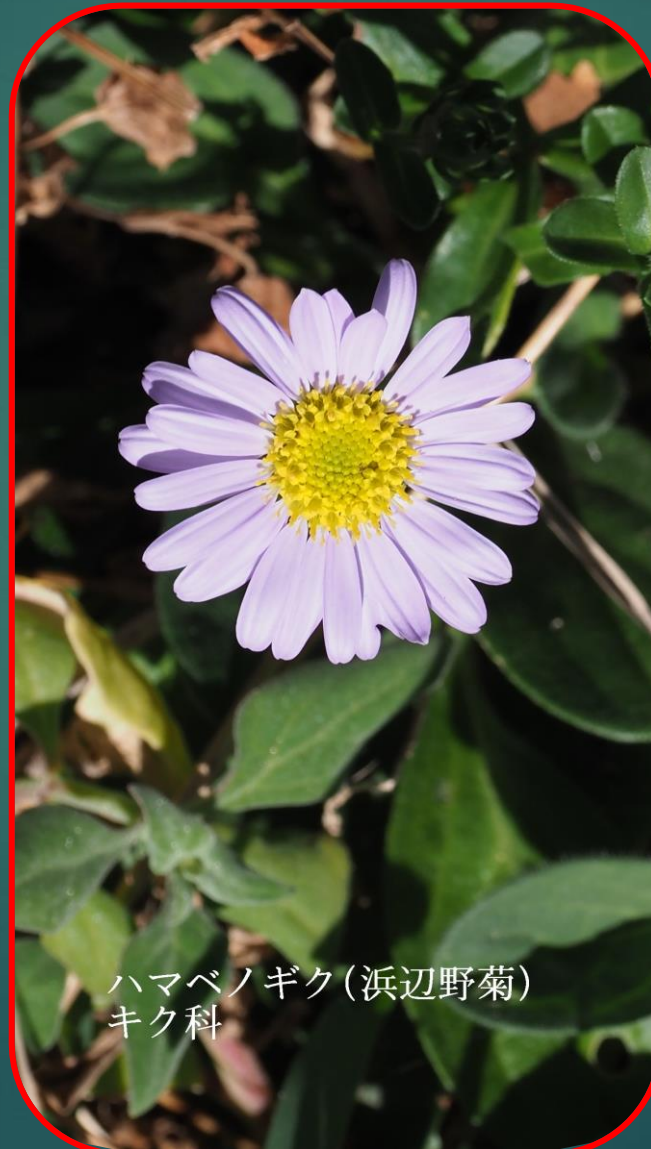
ハマベノギク(浜辺野菊) キク科