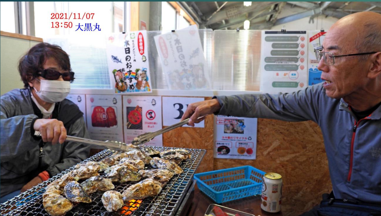
2021/11/07 13:50 大黒丸