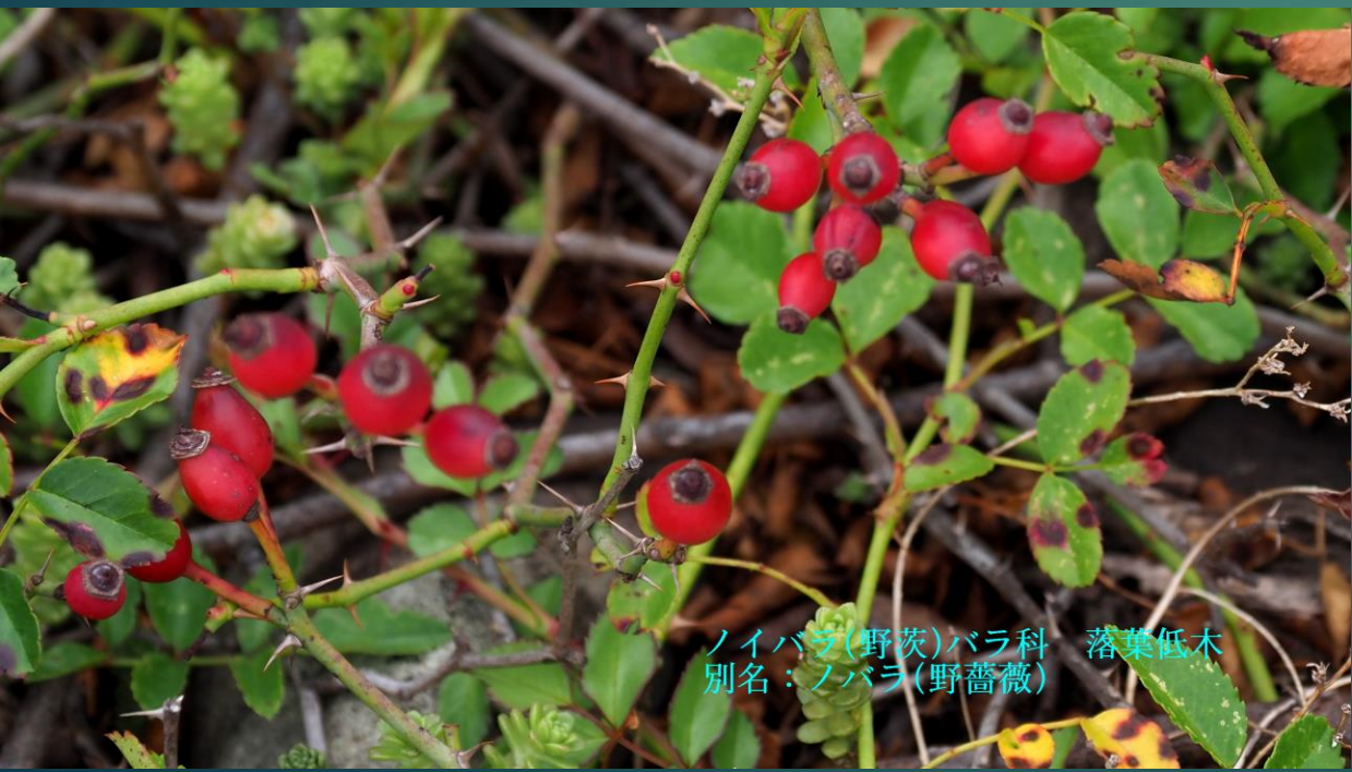
ノイバラ(野茨)バラ科 落葉低木 別名：ノバラ(野薔薇)