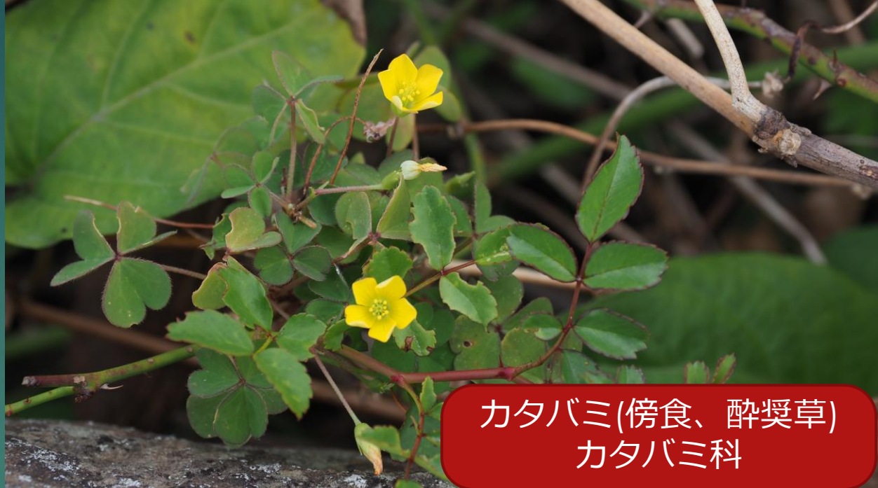
カタバミ(傍食、酔奨草) カタバミ科