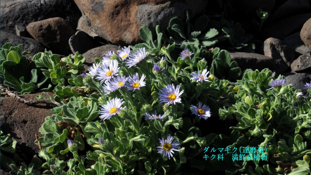
ダルマギク(達磨菊) キク科 満鮮系植物