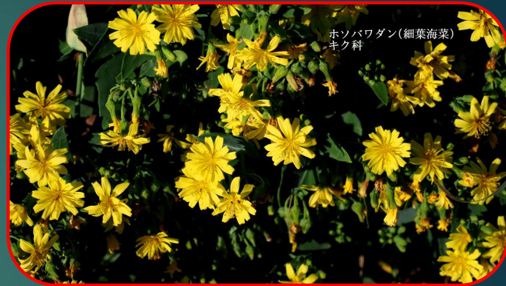
ホソバワダン(細葉海菜) キク科