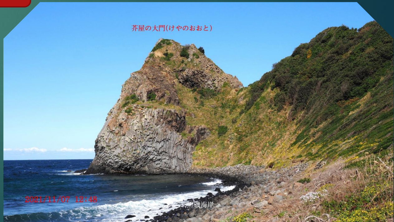
芥屋の大門(けやのおおと)