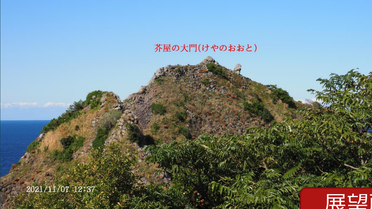
芥屋の大門(けやのおおと)