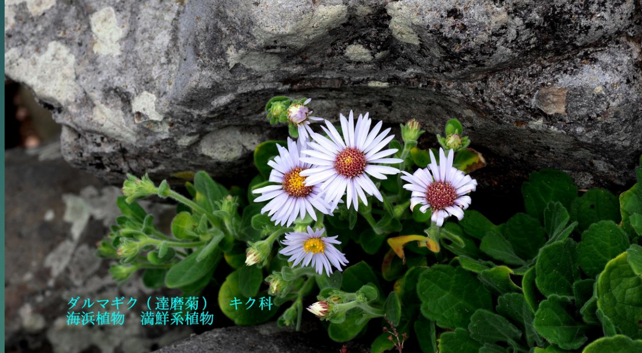
ダルマガク(達磨菊) キク科 海浜植物 満鮮系植物