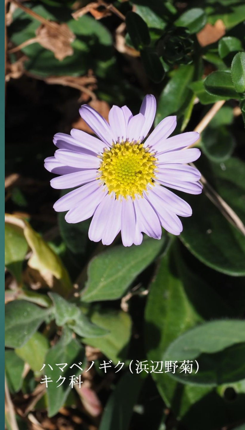
ハマベノギク (浜辺野菊) キク科