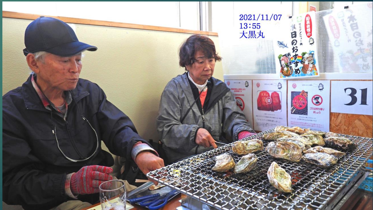
2021/11/07 13:55 大黒丸