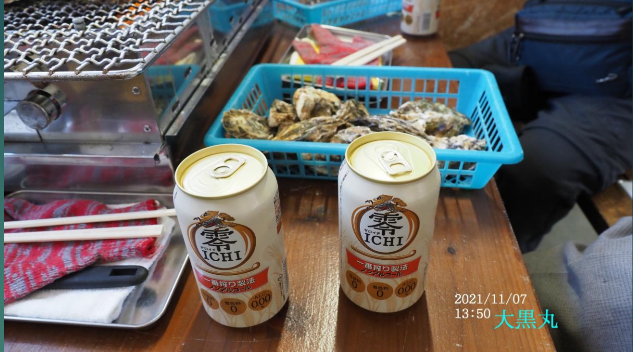
2021/11/07 13:50 大黒丸