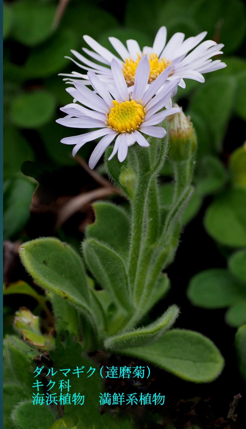
ダルマガク(達磨菊) キク科 海浜植物 満鮮系植物