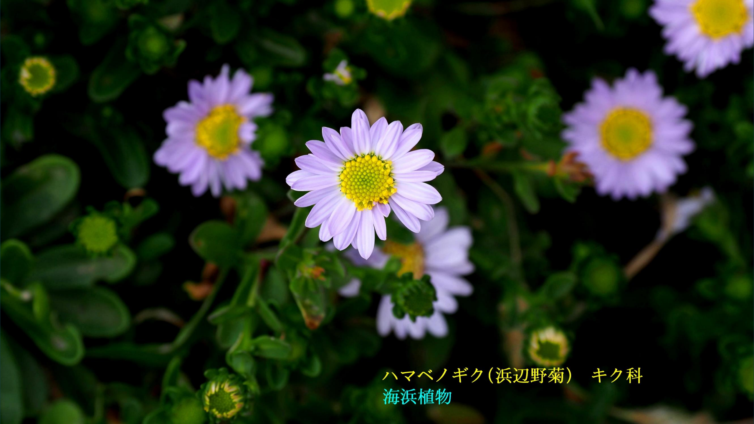
ハマベノギク(浜辺野菊) キク科 海浜植物