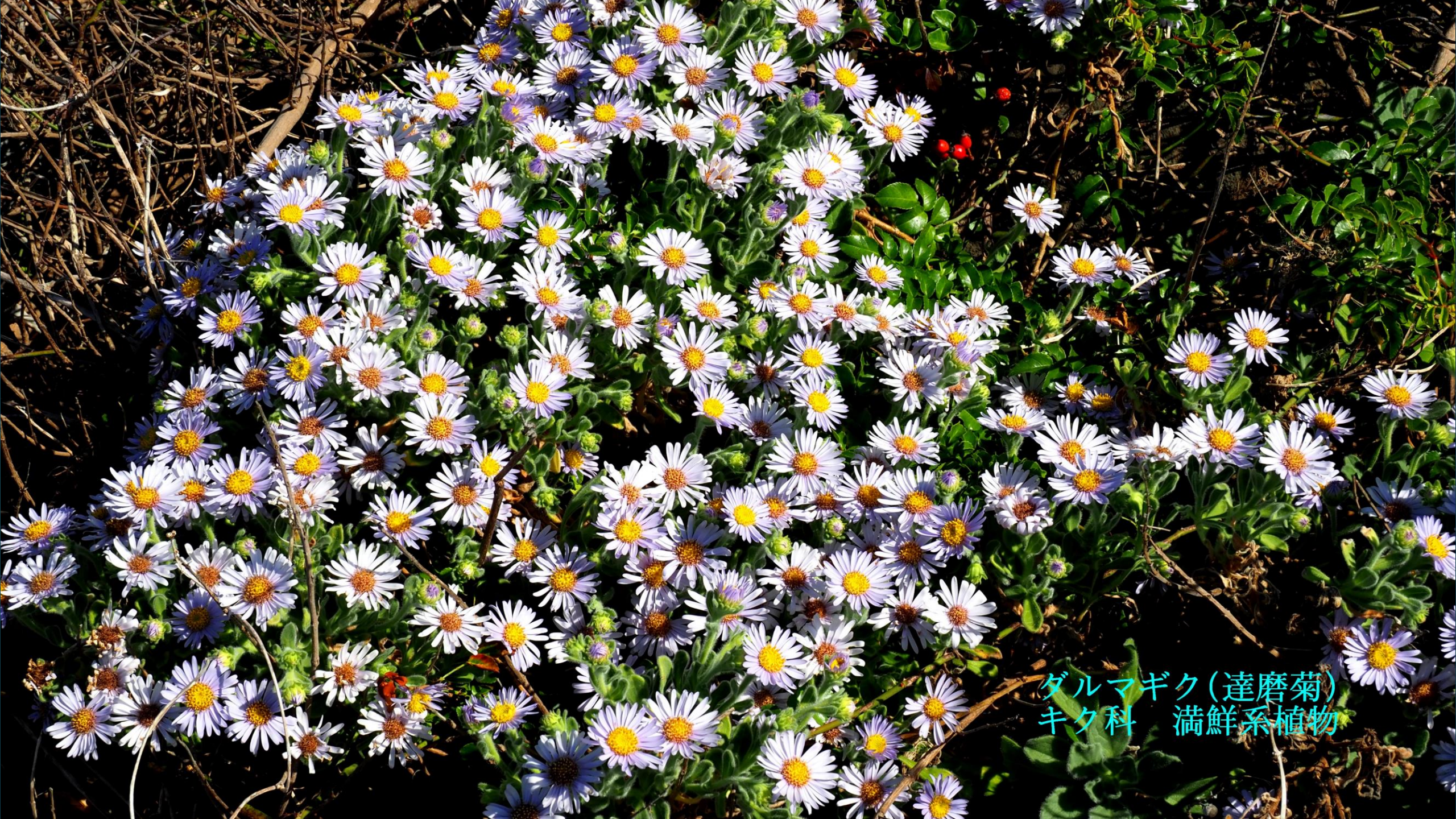
ダルマギク(達磨菊) キク科 満鮮系植物