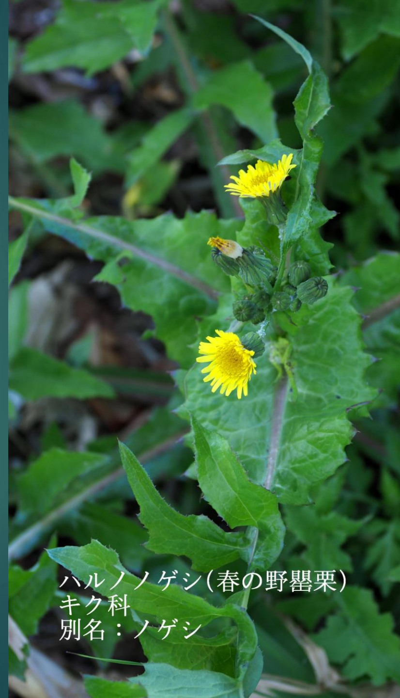
ハルノノゲシ(春の野罌粟) キク科 別名：ノゲシ