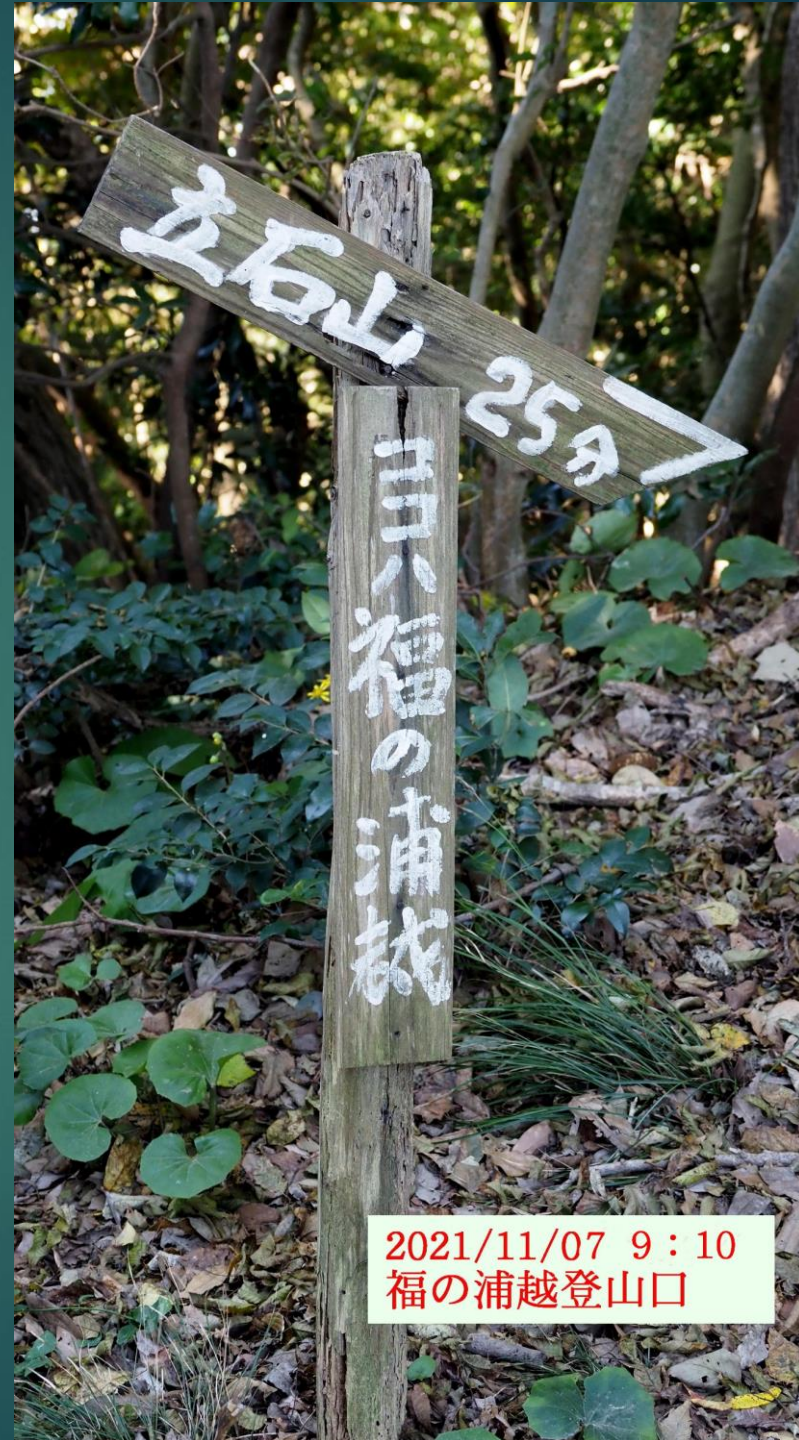
2021/11/07 9:10 福の浦越登山口