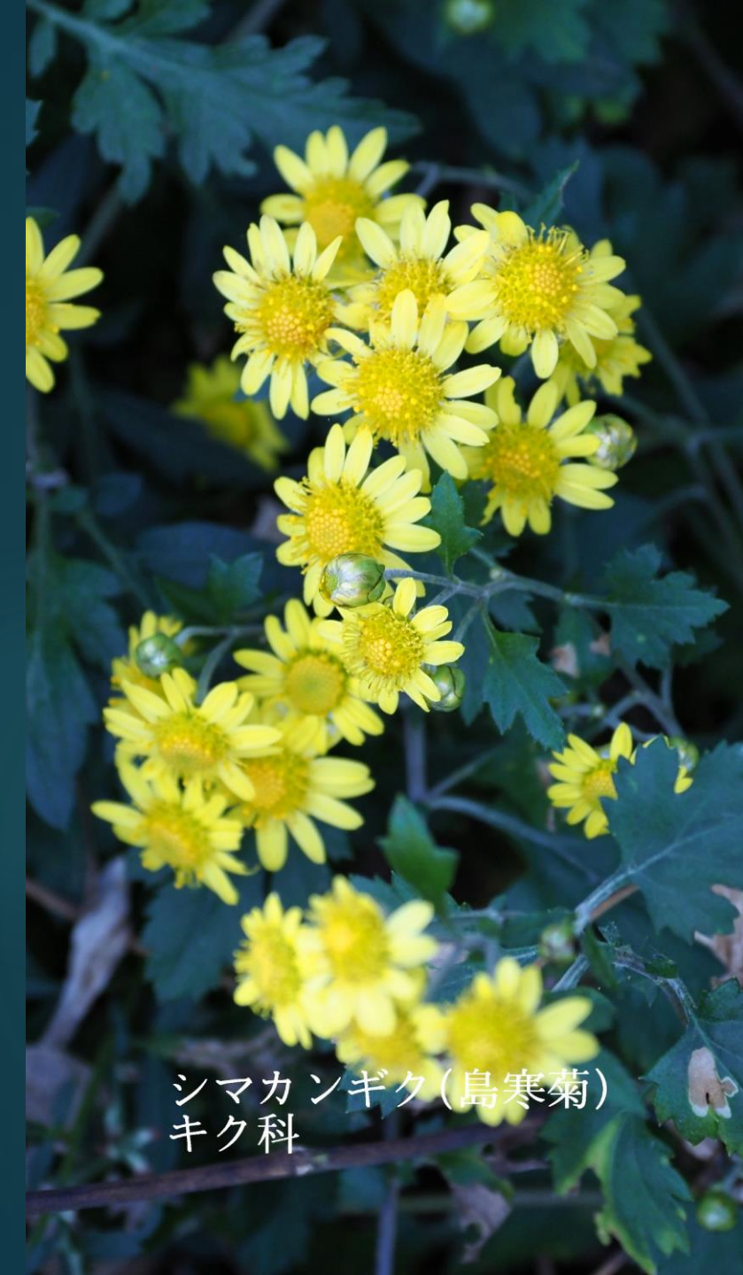
シマカンギク(島寒菊) キク科