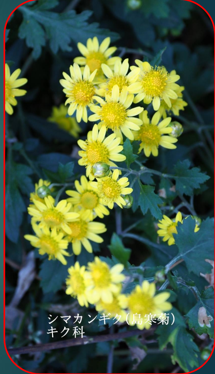
シマカンギク(島寒菊) キク科