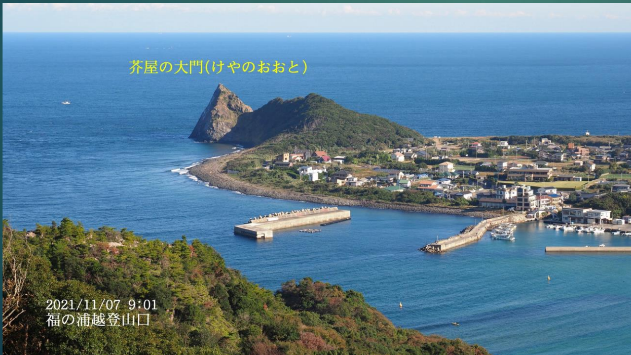
芥屋の大門(けやのおおと)