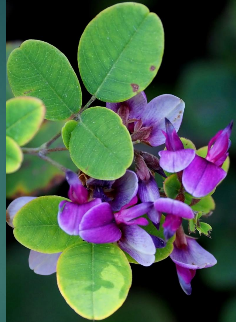
マルバハギ(丸葉萩) ハギ科 落葉低木 別名：ミヤマハギ