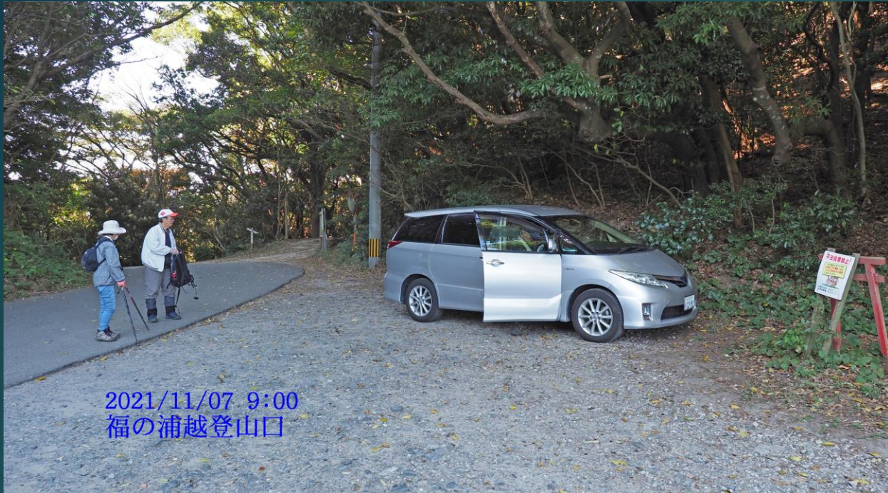
2021/11/07 9:00 福の浦越登山口