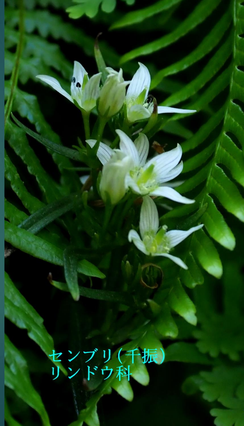
センブリ(千振) リンドウ科