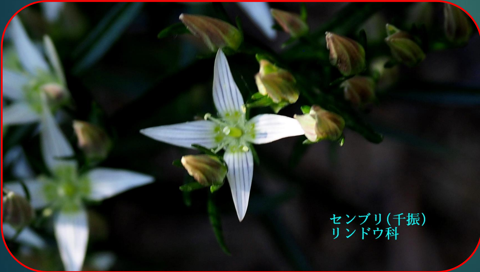
センブリ(千振) リンドウ科