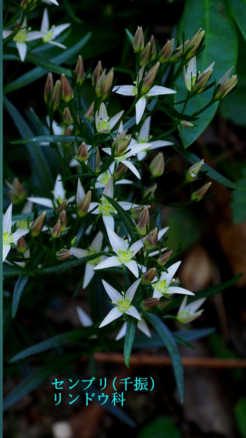
センブリ(千振) リンドウ科