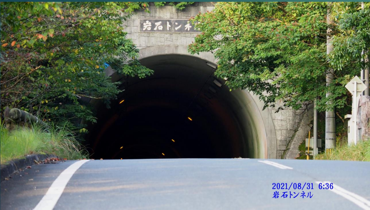
2021/08/31 6:36 岩石トンネル