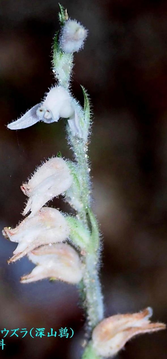
ミヤマウズラ(深山鶉) ラン科