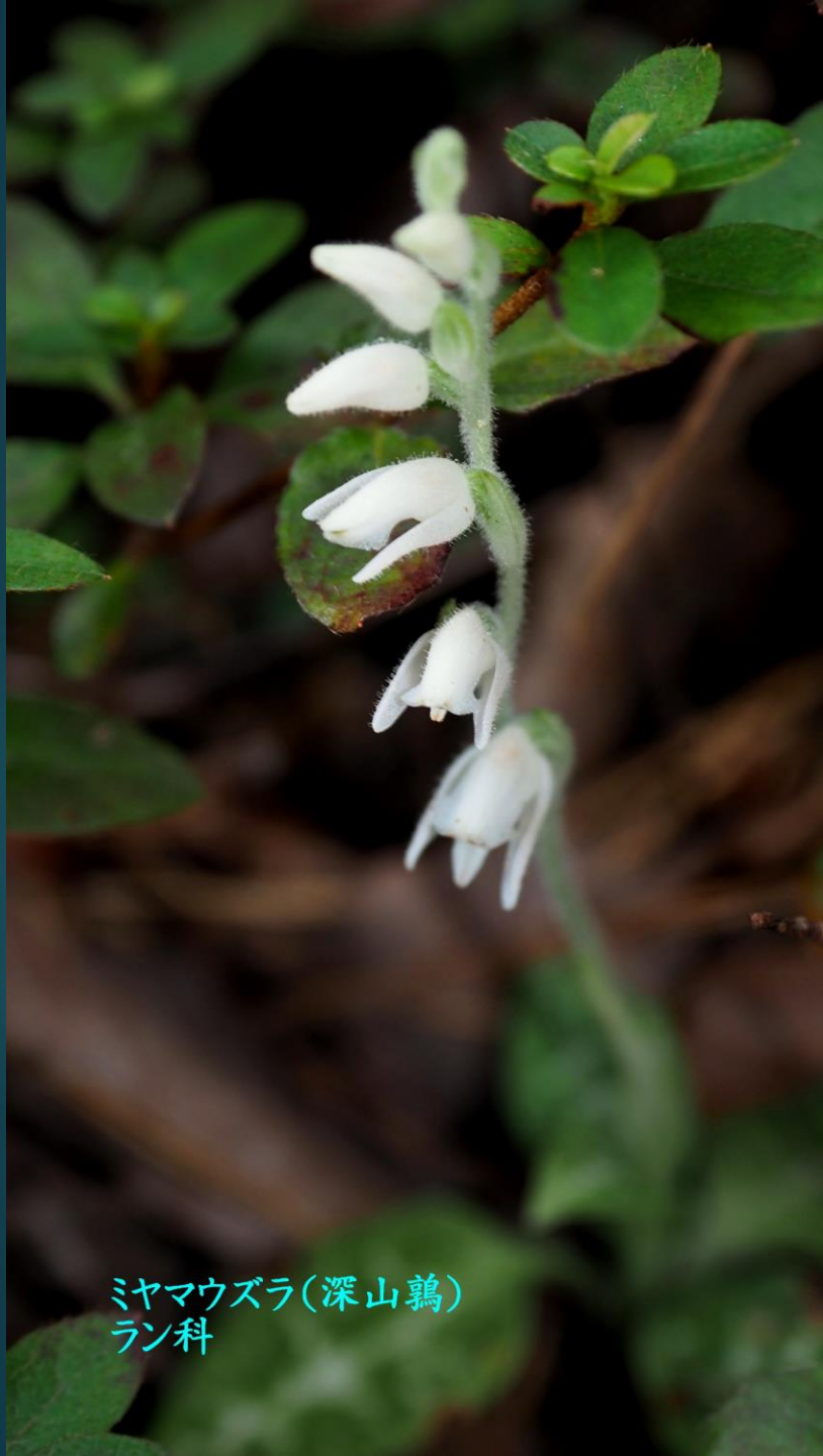
ミヤマウズラ(深山鶉) ラン科