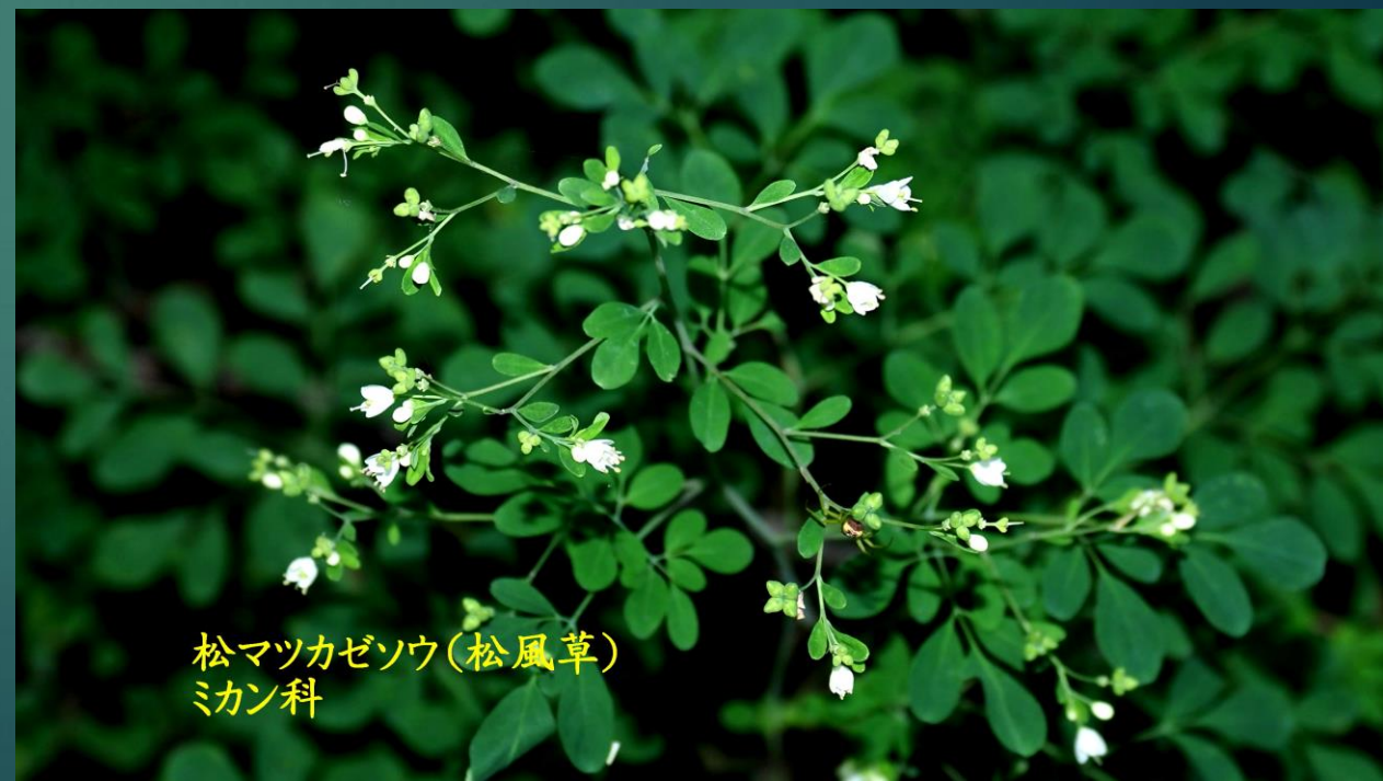
松マツカゼソウ(松風草) ミカン科