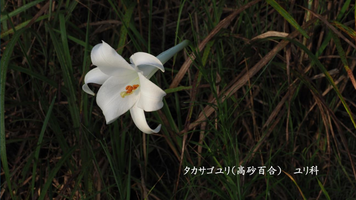
タカサゴユリ(高砂百合) ユリ科