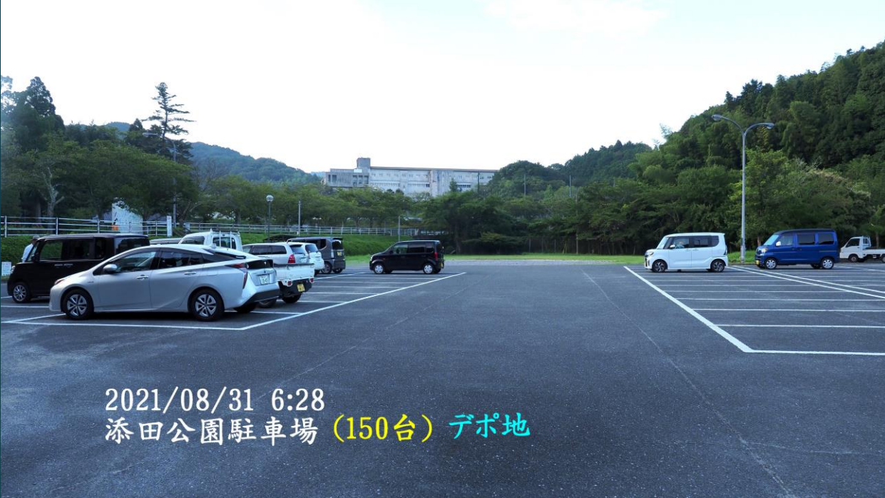
2021/08/31 6:28 添田公園駐車場 (150台) デポ地