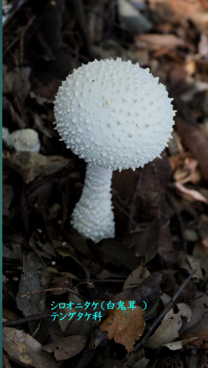
シロオニタケ(白鬼茸) テングタケ科