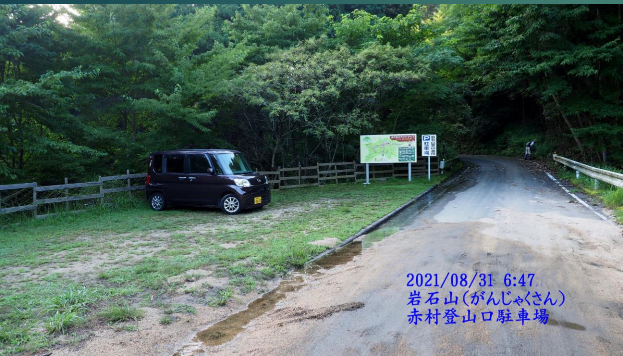
2021/08/31 6:47 岩石山(がんじゃくさん) 赤村登山口駐車場