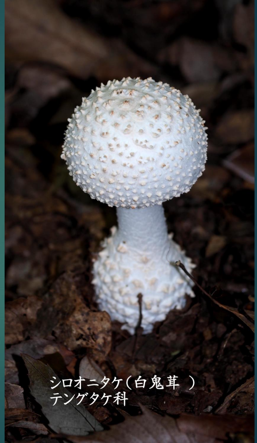
シロオニタケ(白鬼茸) テングタケ科