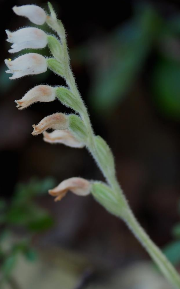
ミヤマウズラ(深山鶉) ラン科