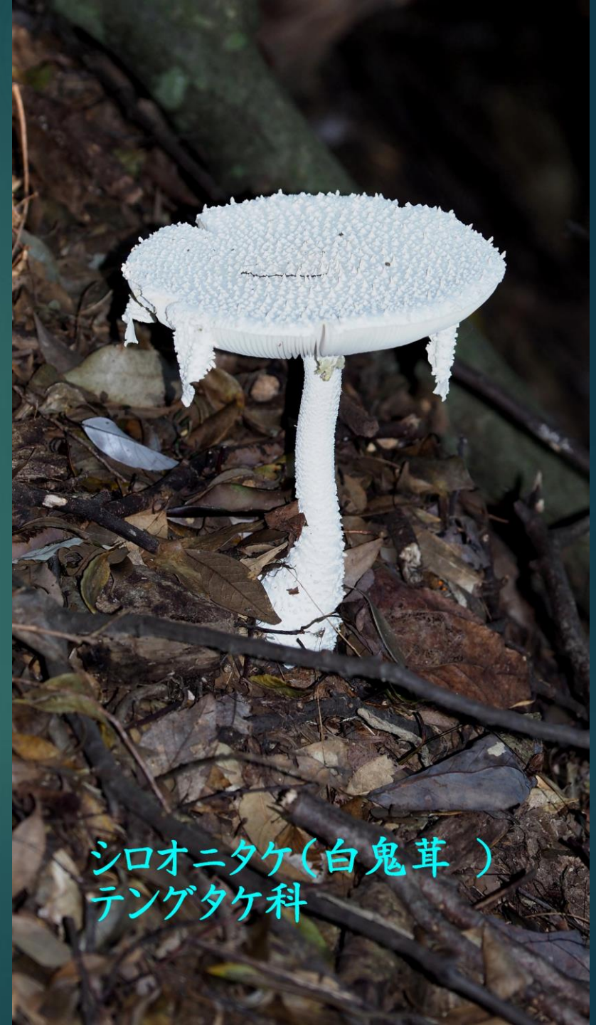
シロオニタケ(白鬼茸) テングタケ科