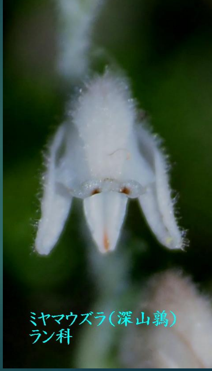
ミヤマウズラ(深山鶉) ラン科