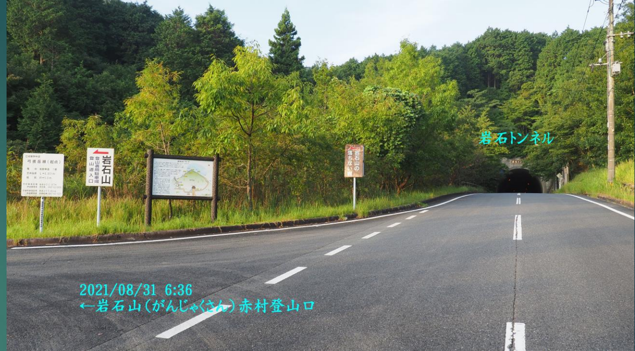
2021/08/31 6:36 ←岩石山(がんじゃくさん) 赤村登山口