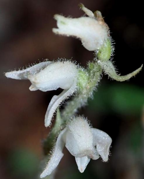
ミヤマウズラ(深山鶉) ラン科