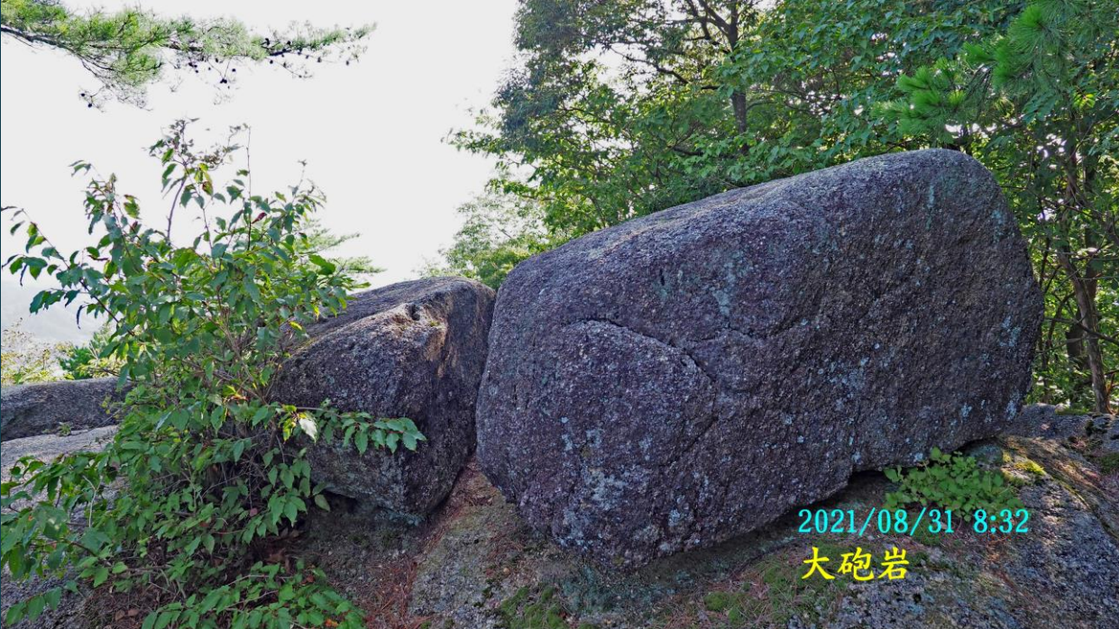
2021/08/31 8:32 大砲岩