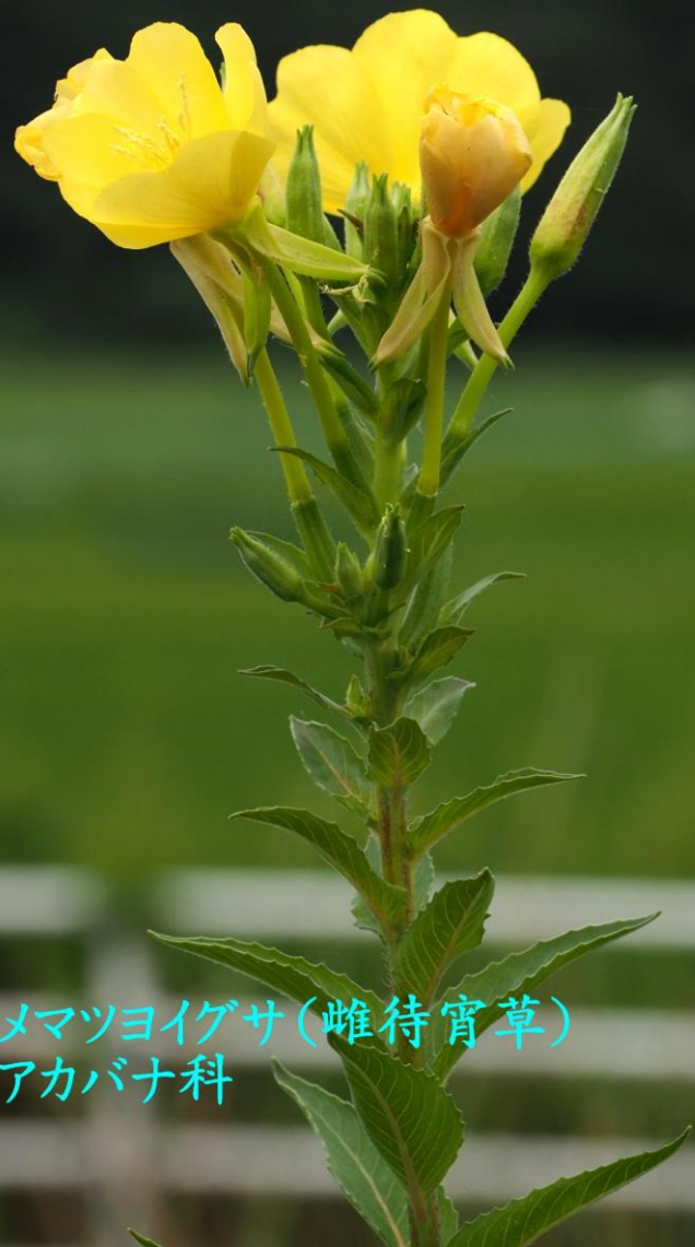
メマツヨイグサ(雌待宵草) アカバナ科