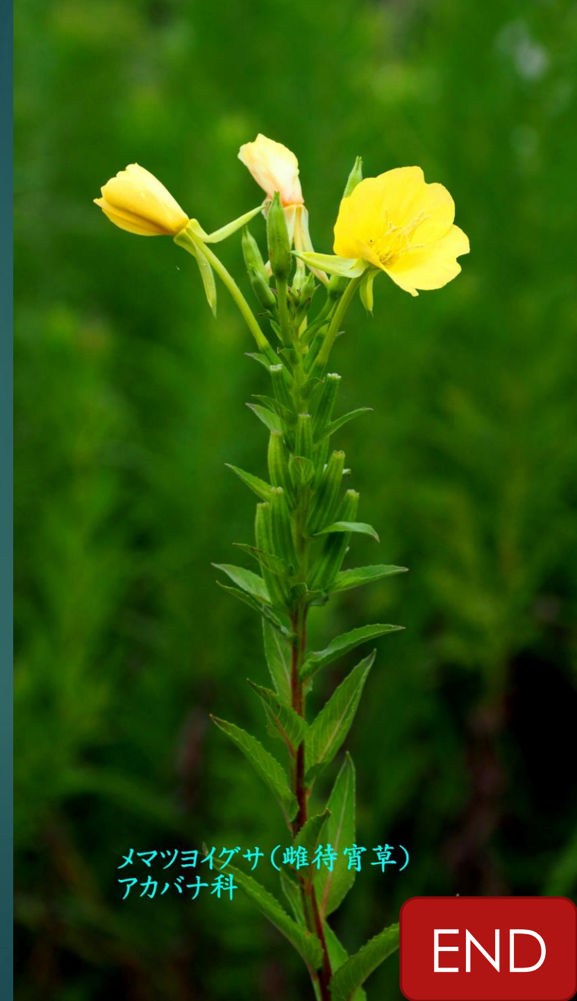
メマツヨイグサ(雌待宵草) アカバナ科