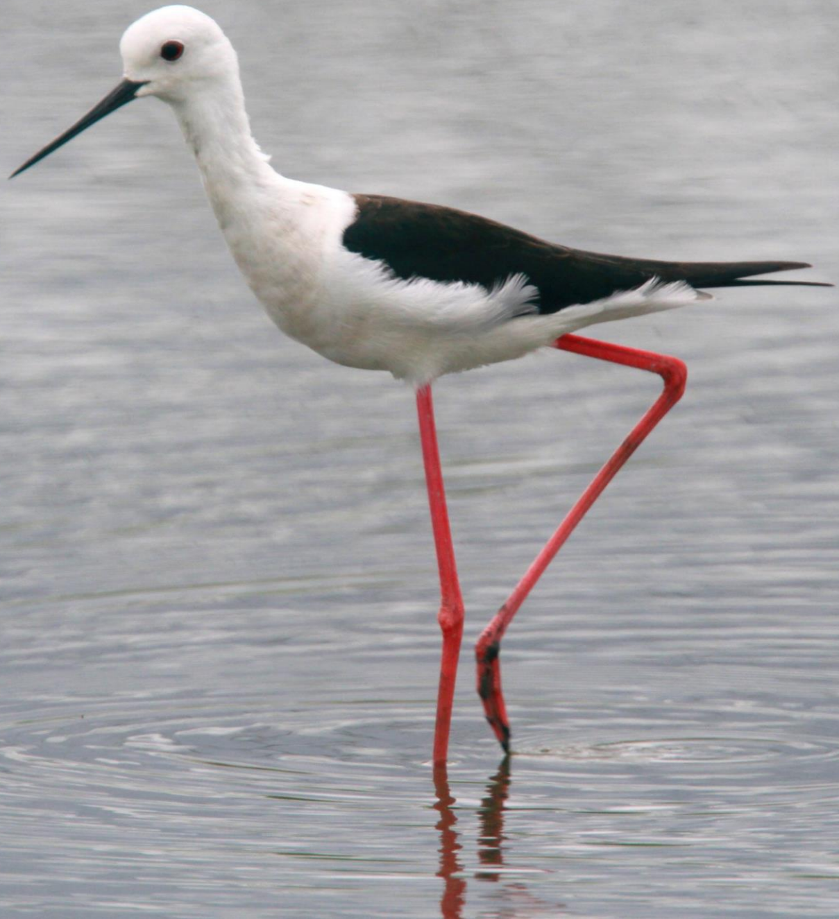
セイタカシギ(丈高鷺)オス セイタカシギ科 L=32cm