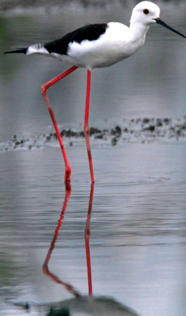
セイタカシギ(丈高鷺)オス セイタカシギ科 L=32cm