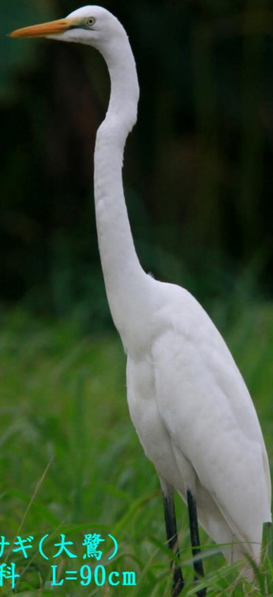
ダイサギ(大鷺) サギ科 L=90cm