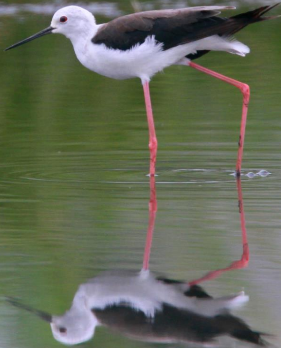
セイタカシギ(丈高鷺)メス セイタカシギ科 L=32cm