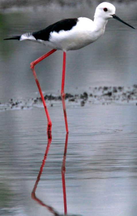
セイタカシギ(丈高鷺)オス セイタカシギ科 L=32cm