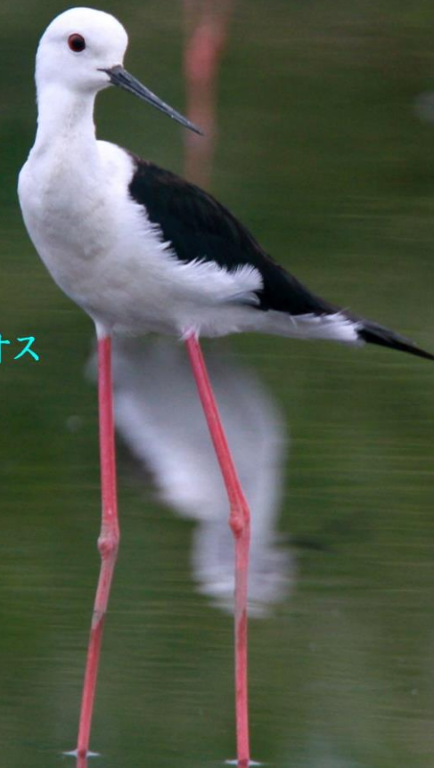
セイタカシギ(丈高鷺) セイタカシギ科 L=32cm