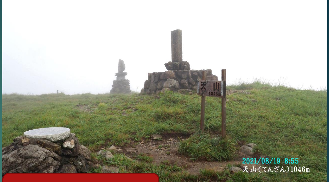
2021/08/19 8:55 天山(てんざん)1046m