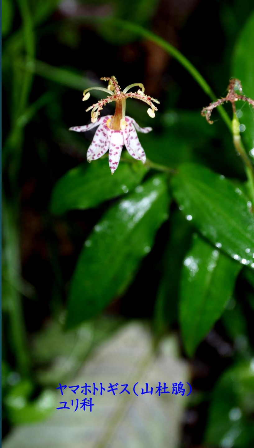
ヤマホトギス(山杜鵑) ユリ科