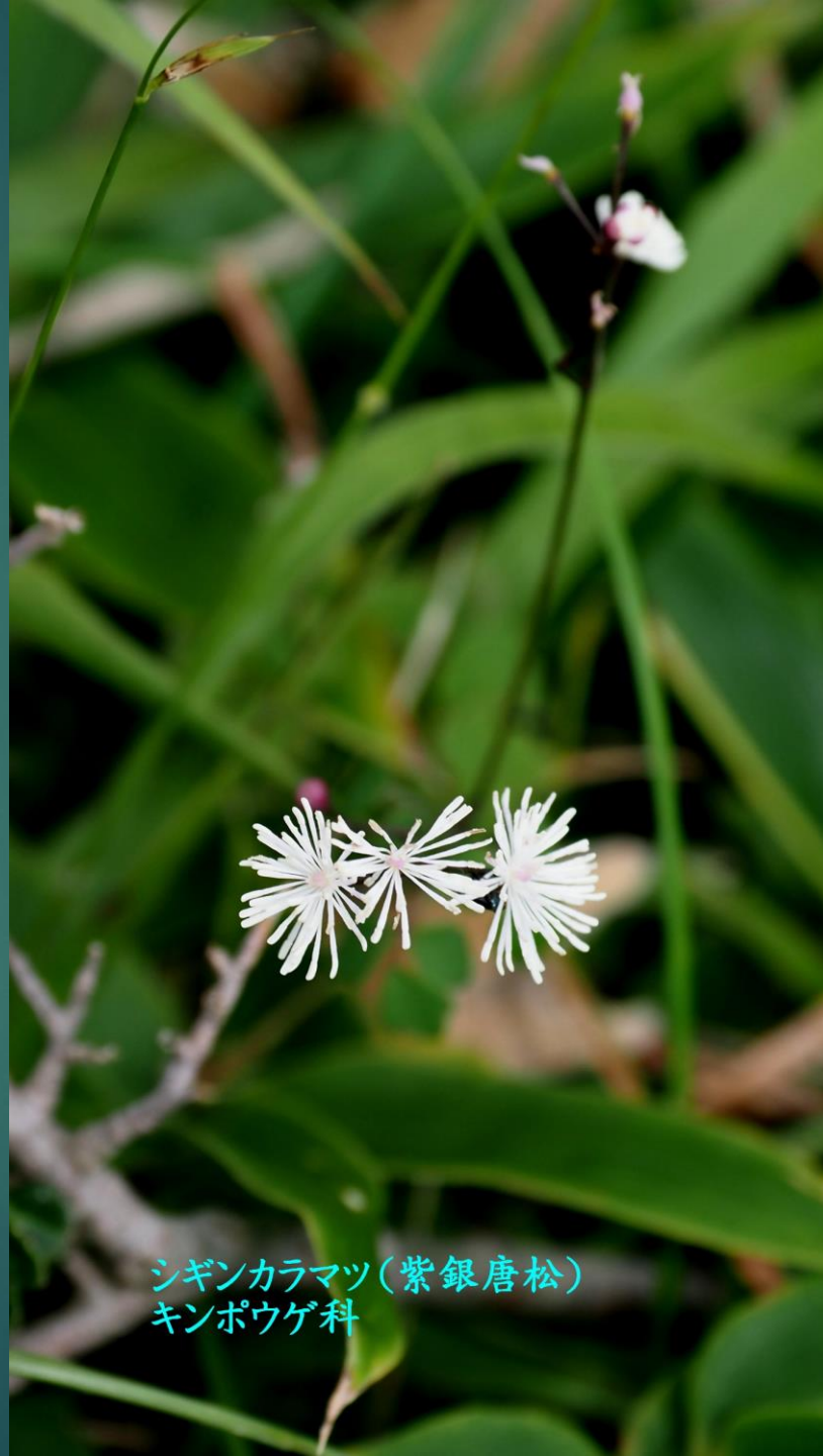
シギンカラマツ(紫銀唐松) キンポウゲ科