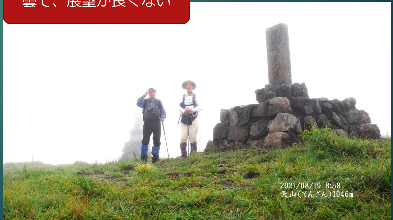
2021/08/19 8:58 天山(てんざん)1046m