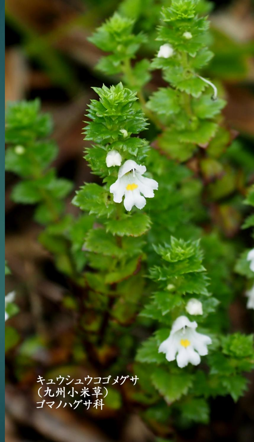
キュウシュウコゴメグサ (九州小米草) ゴマノハグサ科