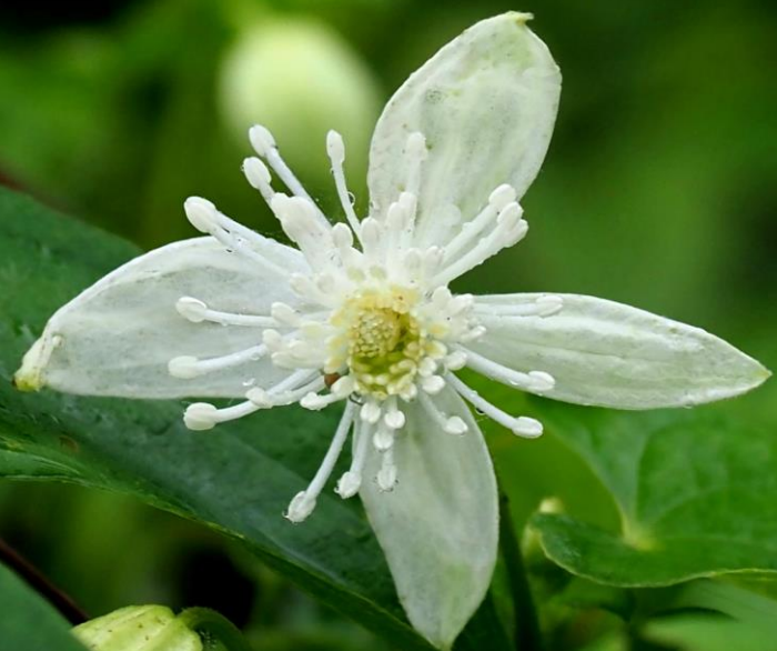
ボタンヅル(牡丹蔓) キンポウゲ科 ツル性半低木