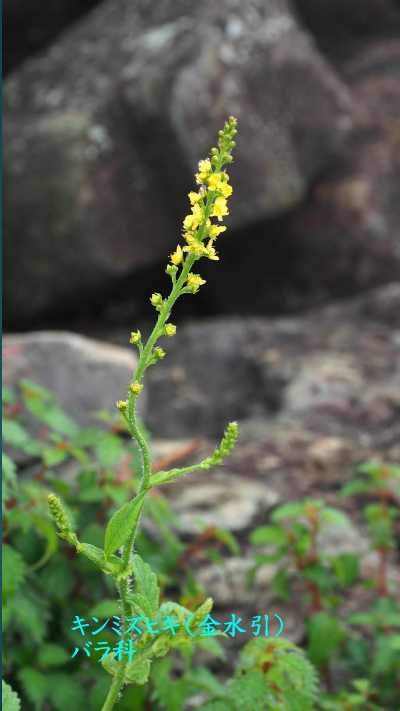
キンミズヒキ(金水引) バラ科