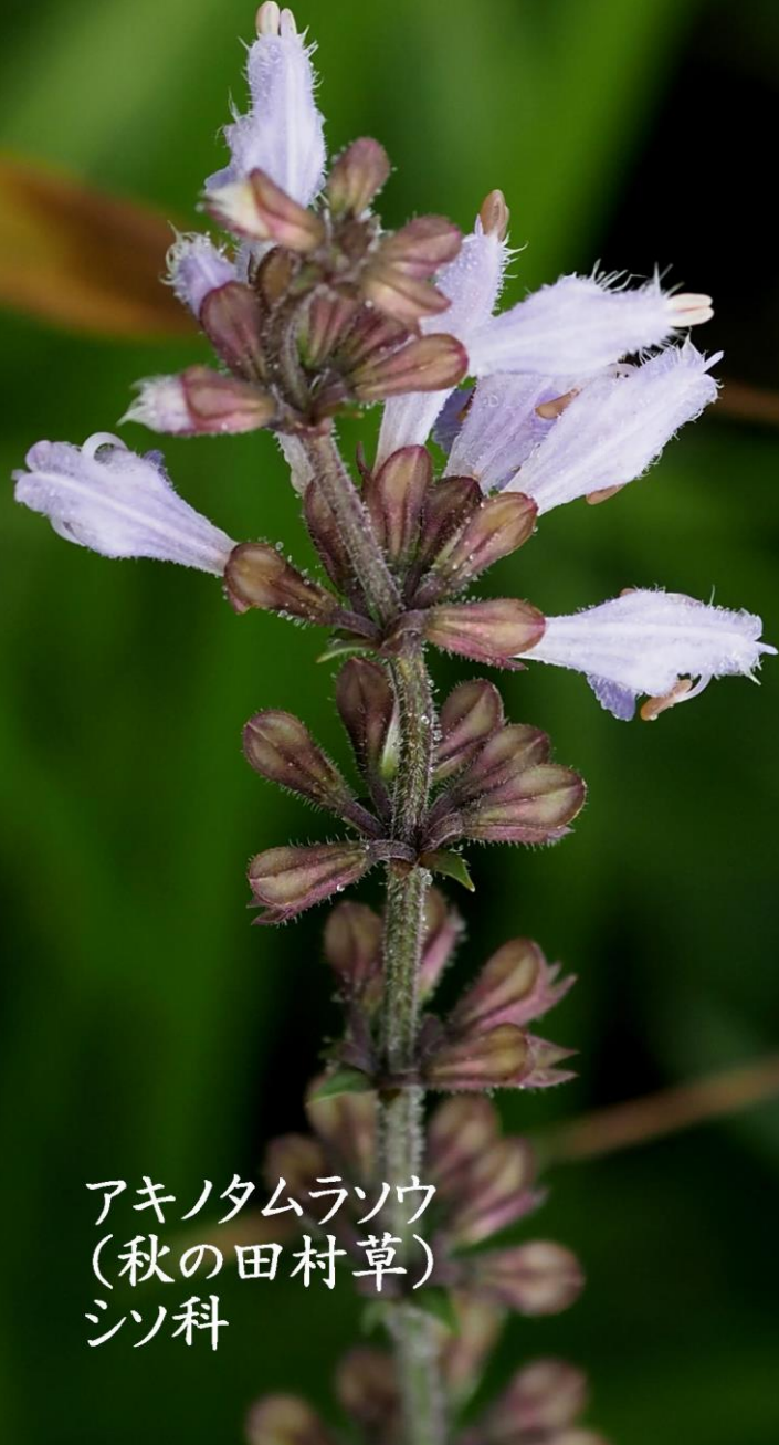
アキノタムラソウ (秋の田村草) シソ科