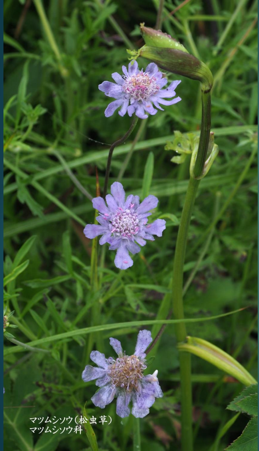
マツムシソウ(松虫草) マツムシソウ科