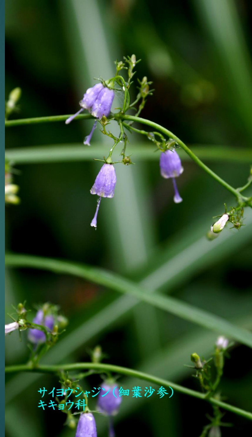
サイヨウシャジン(細葉沙参) キキョウ科