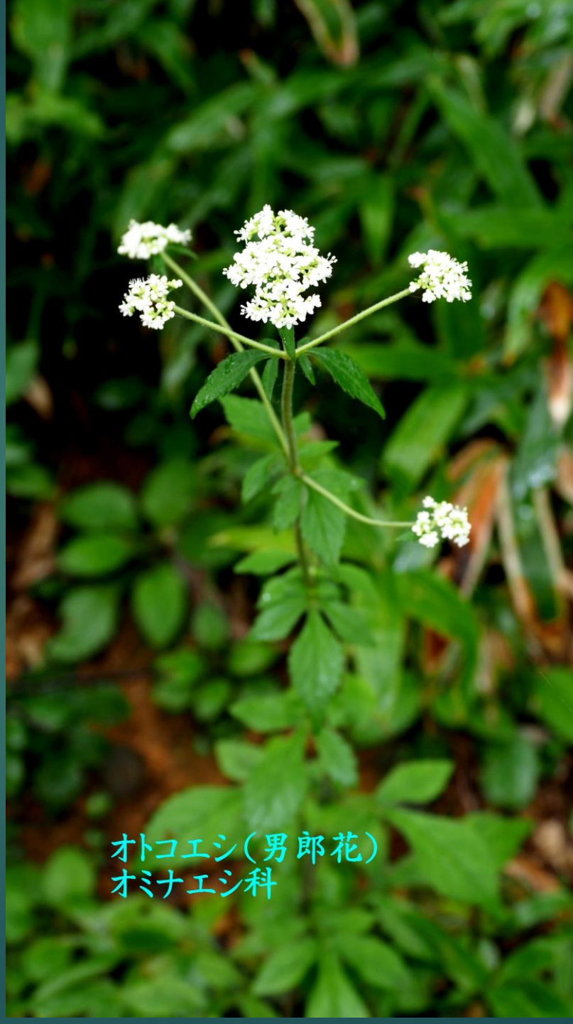
オトコエシ(男 郎花) オミナエシ科