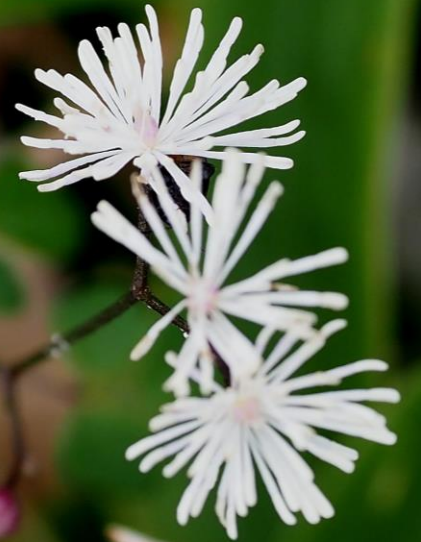
シギンカラマツ (紫銀唐松) キンポウゲ科