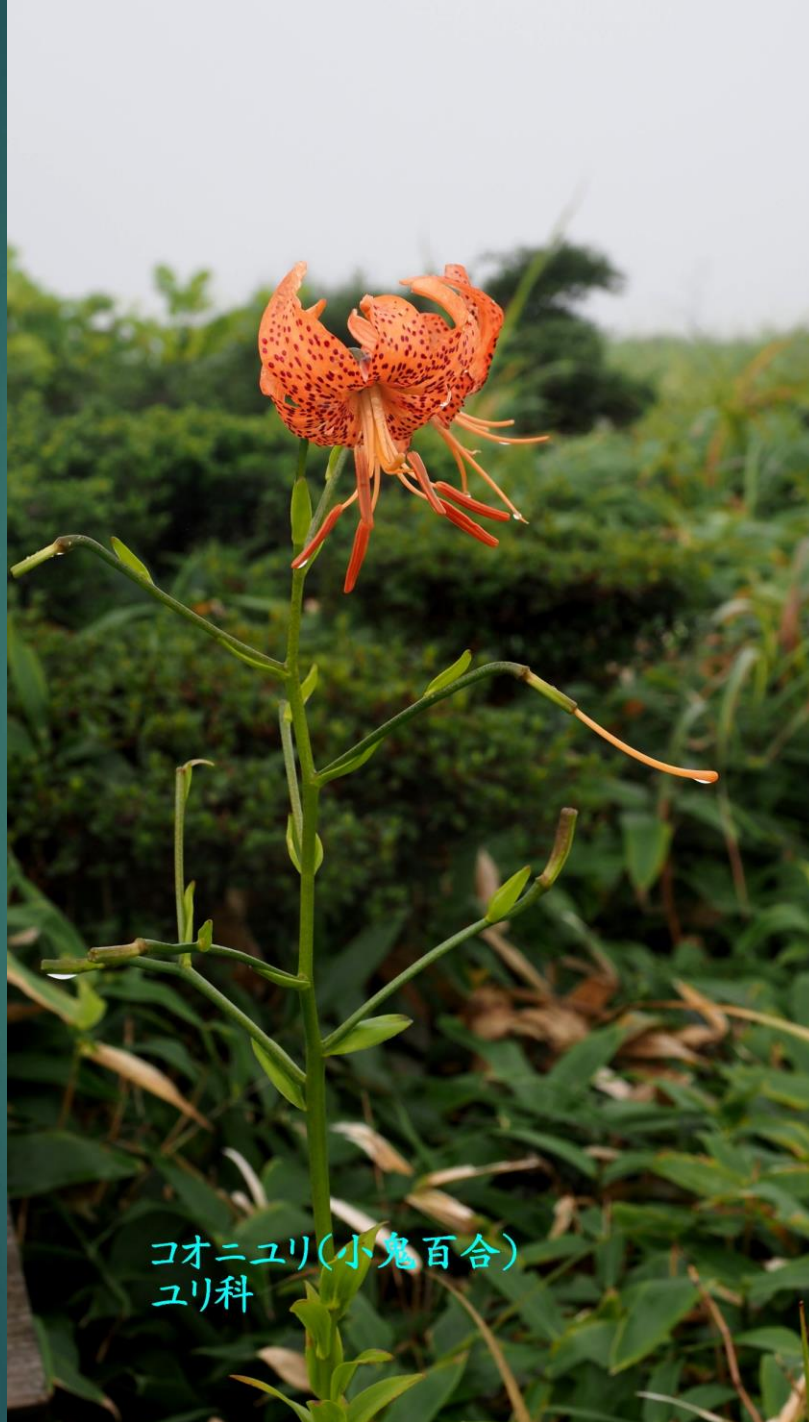
コオニユリ(小鬼百合) ユリ科