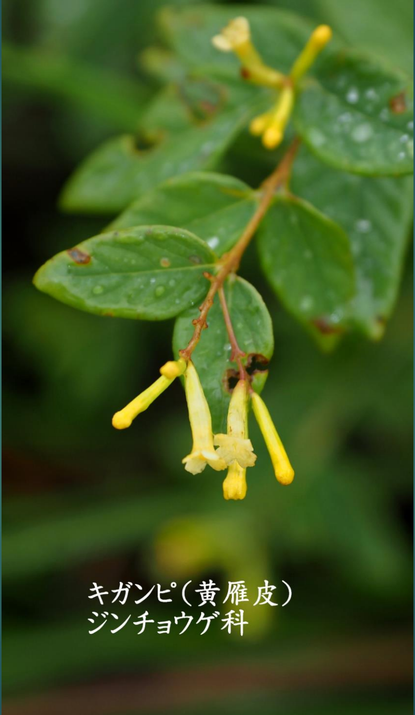
キガンピ(黄雁皮) ジンチョウゲ科