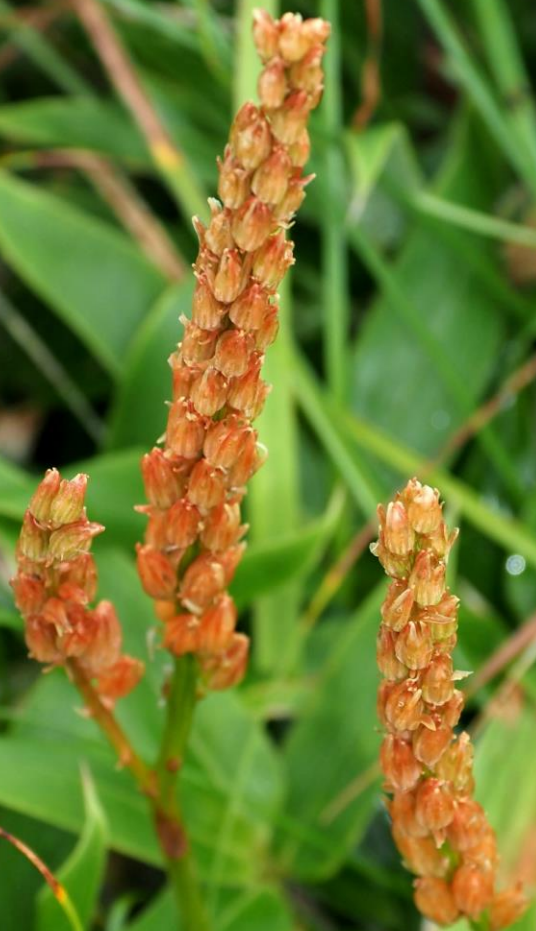
ノギリラン(芒蘭) ユリ科