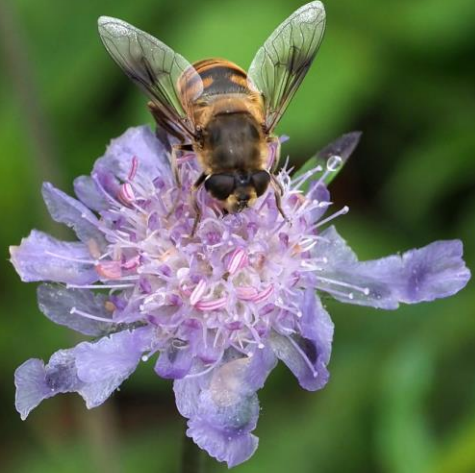
マツムシソウ(松虫草) マツムシソウ科