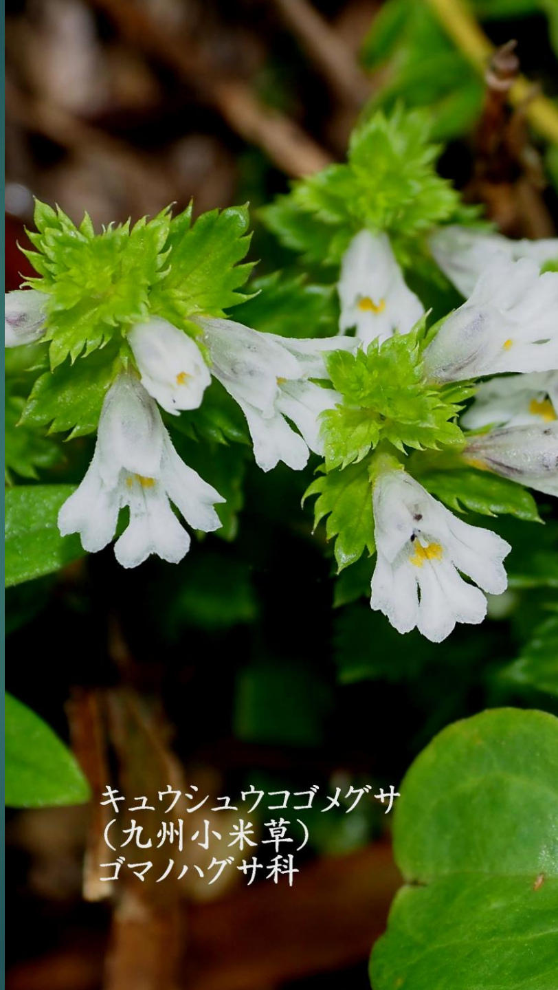
キュウシュウコゴメグサ (九州小米草) ゴマノハグサ科