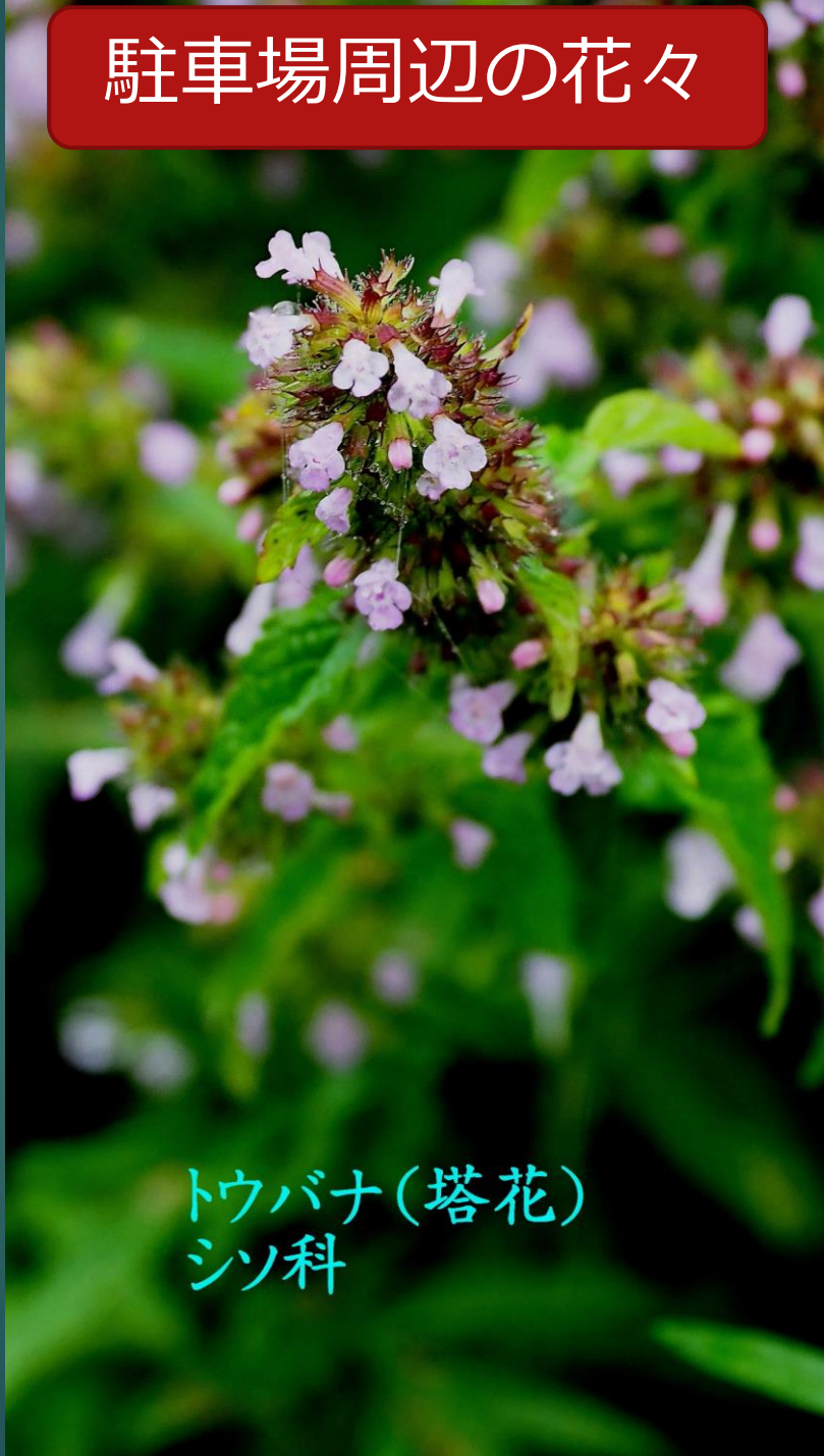
トウバナ(塔花) シソ科