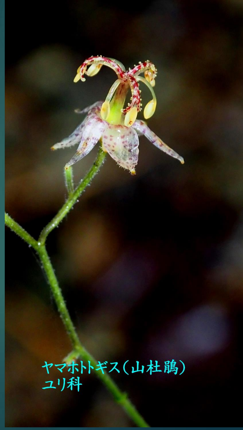
ヤマホトギス(山杜鵑) ユリ科