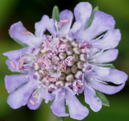
マツムシソウ (松虫草) マツムシソウ科