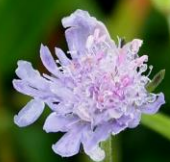
マツムシソウ(松虫草) マツムシソウ科