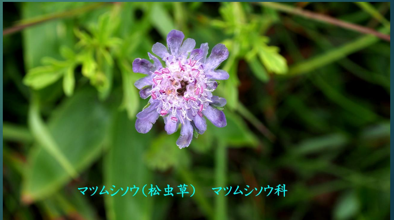
マツムシソウ(松虫草) マツムシソウ科