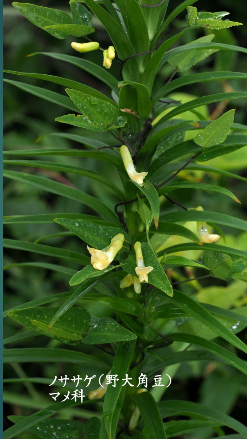
ノササゲ(野大角豆) マメ科