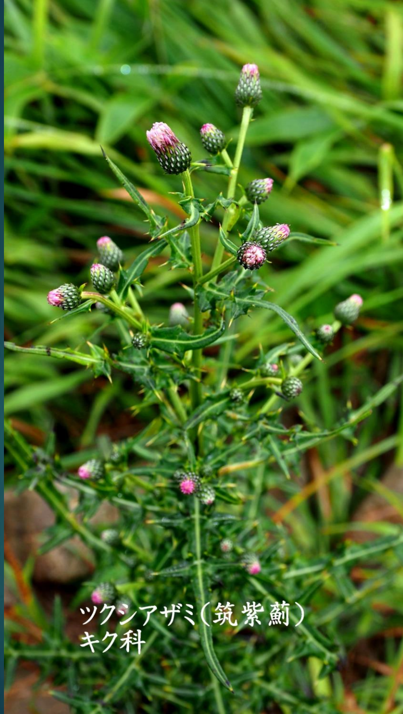
ツクシアザミ(筑紫薊) キク科