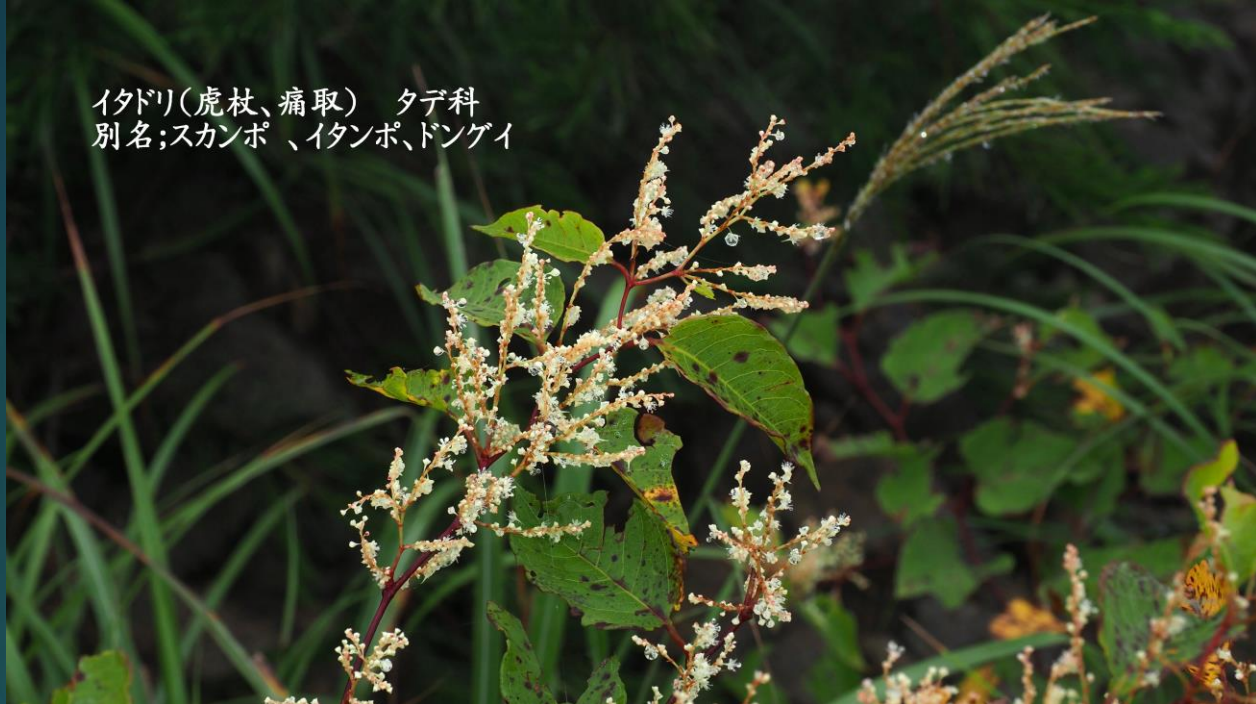
イタドリ(虎杖、痛取) タデ科 別名;スカンポ、イタンポ、ドンゲイ