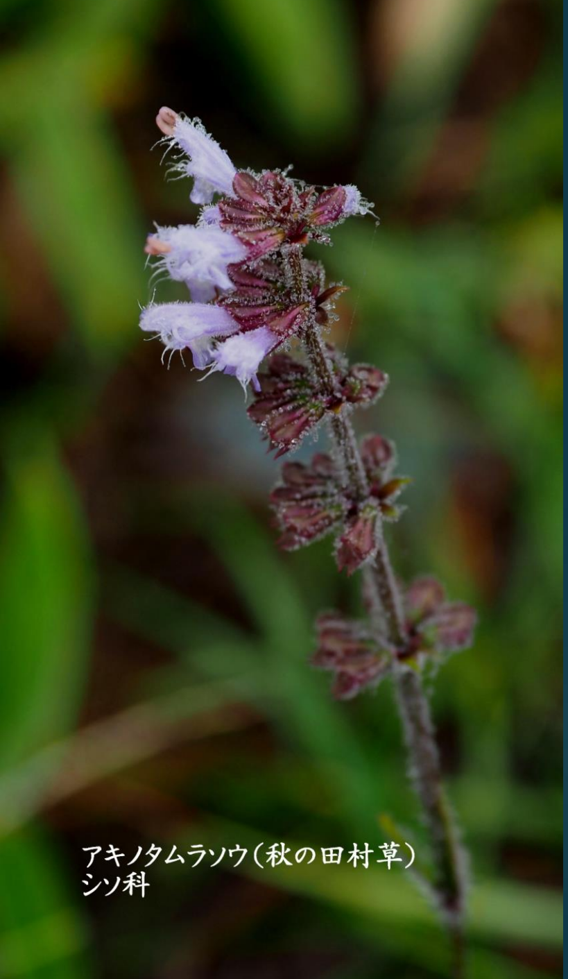
アキノタムラソウ(秋の田村草) シソ科