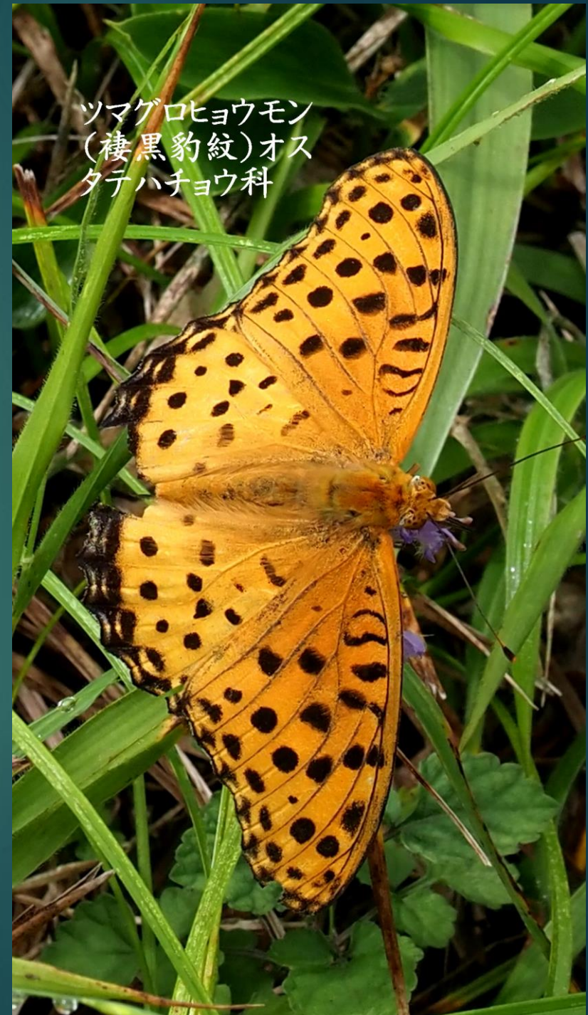
ツマゲロヒョウモン (棲黒豹紋)オス タテハチョウ科