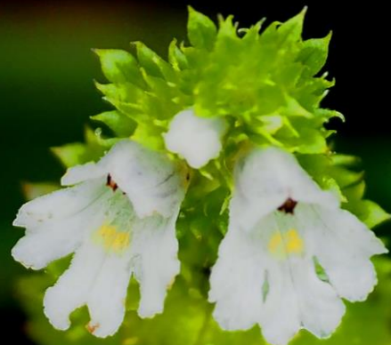
キュウシュウコゴメグサ (九州小米草) ゴマノハグサ科