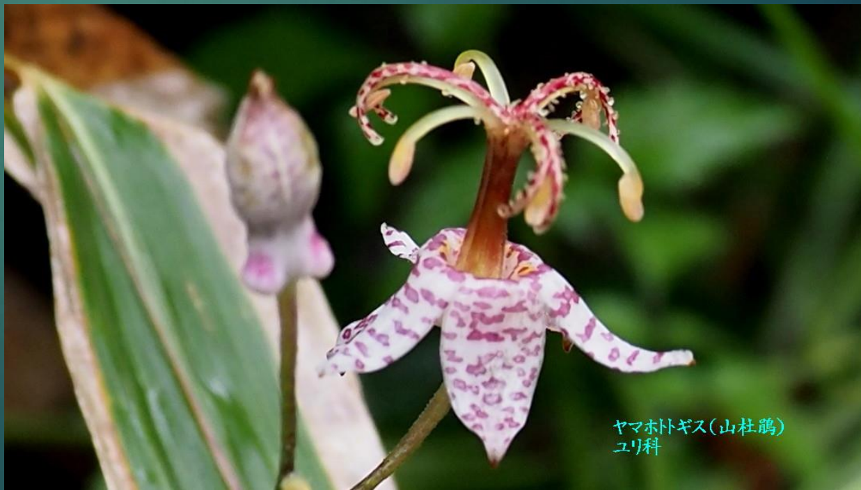
ヤマホトギス(山杜鵑) ユリ科