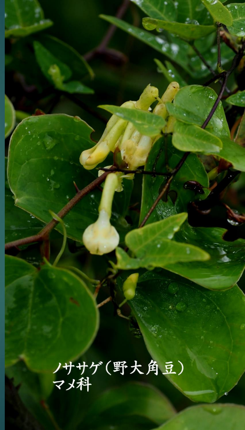
ノササゲ(野大角豆) マメ科