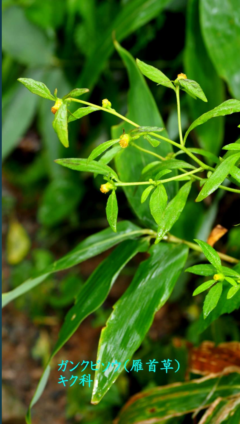
ガンクビソウ(雁首草) キク科