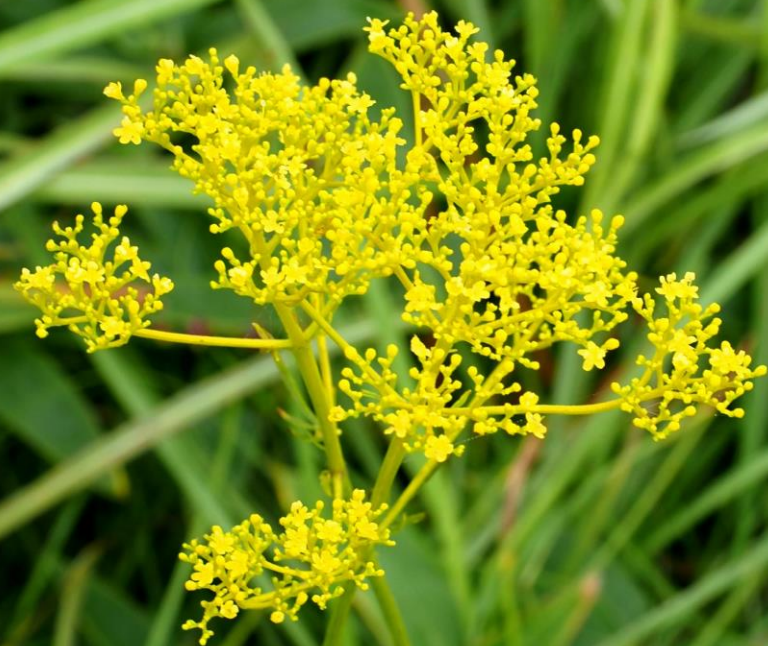
オミナエシ(女郎花) オミナエシ科