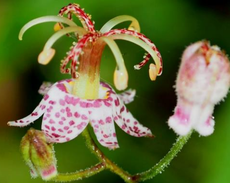
ヤマホトトギス(山杜鵑) ユリ科