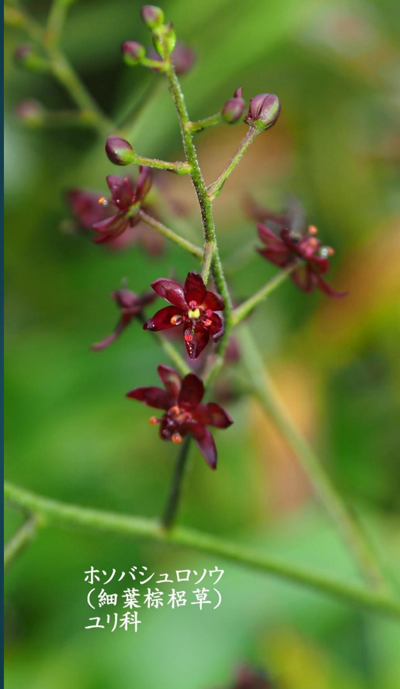
ホソバシュロソウ (細葉棕栂草) ユリ科