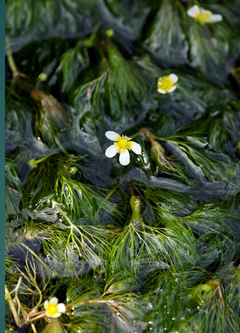
ヒメバイカモ(姫梅花藻) キンポウゲ科 沈水植物 常緑多年草