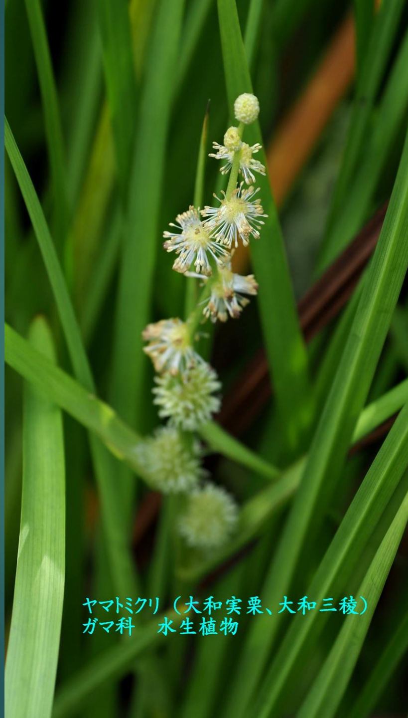
ヤマトミクリ (大和実栗、大和三稜) ガマ科 水生植物