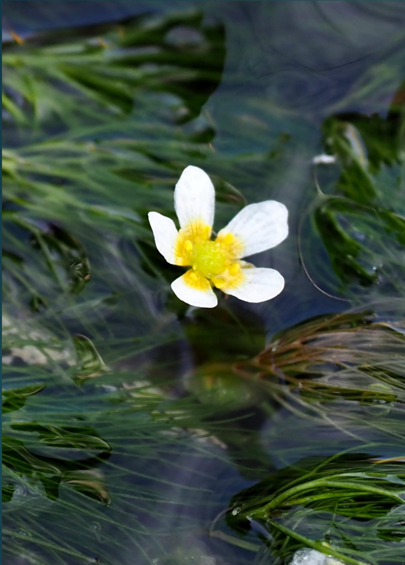
ヒメバイカモ(姫梅花藻) キンポウゲ科 沈水植物 常緑多年草