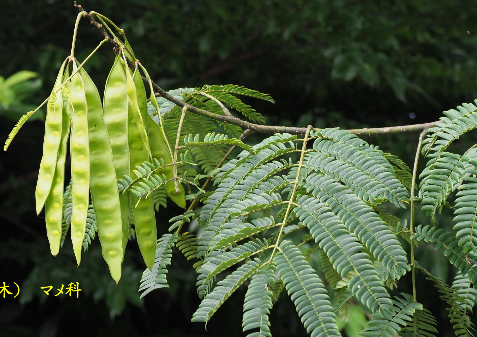
ネムノキ(合歡木) マメ科