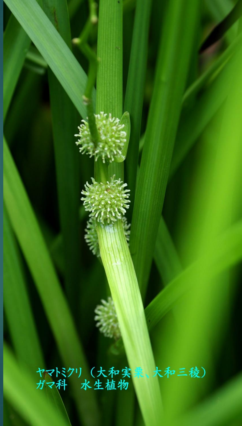
ヤマトミクリ (大和実栗、大和三稜) ガマ科 水生植物