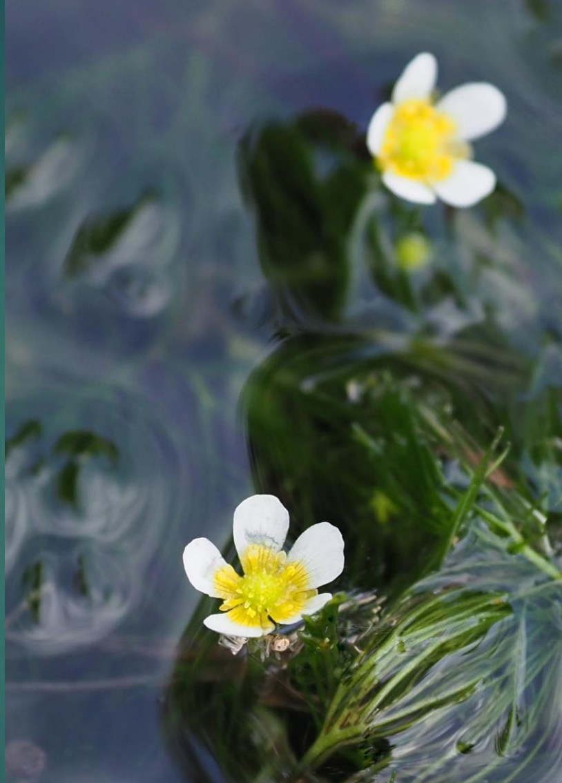
ヒメバイカモ(姫梅花藻) キンポウゲ科 沈水植物 常緑多年草