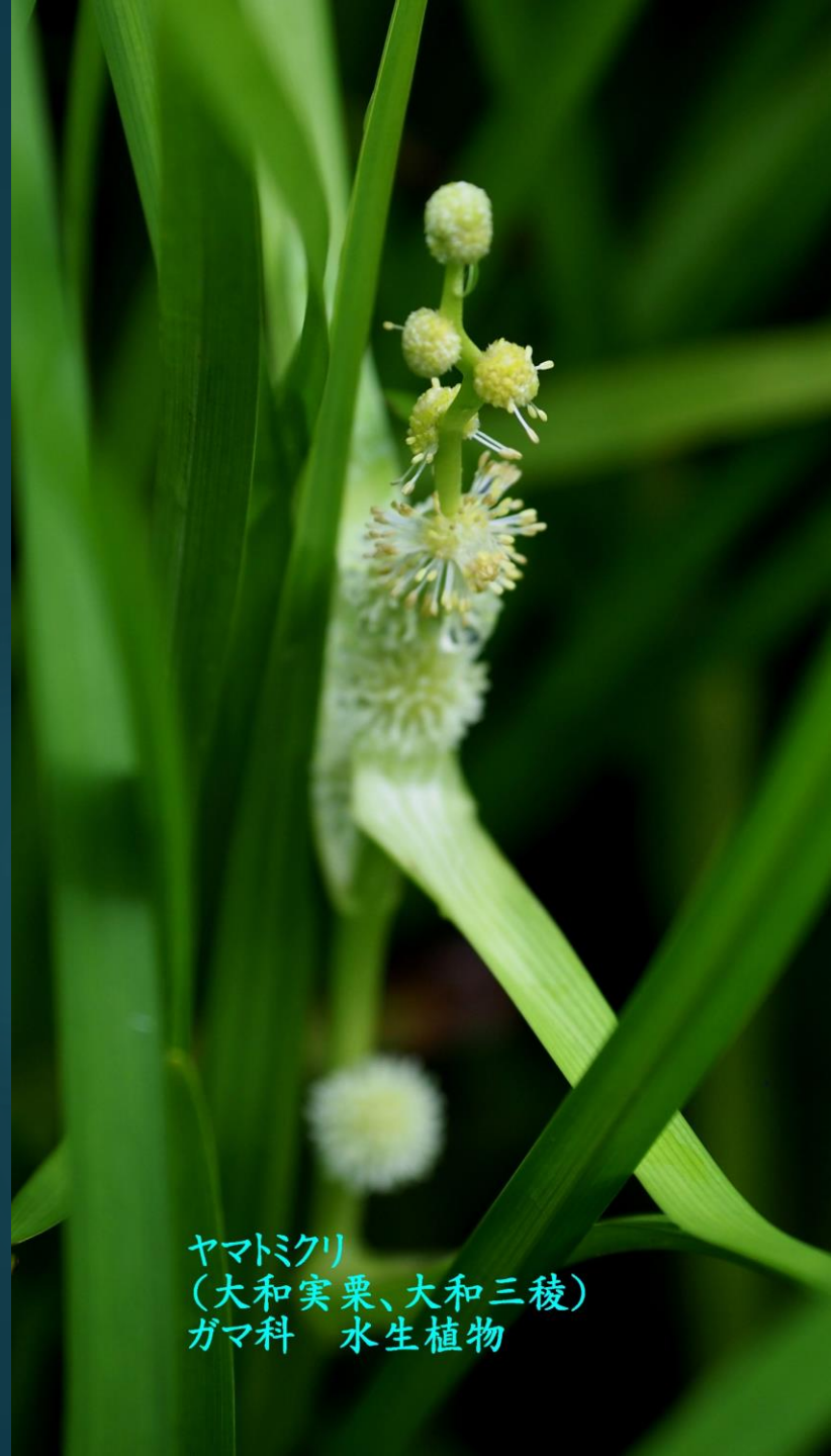
ヤマトミクリ (大和実栗、大和三稜) ガマ科 水生植物