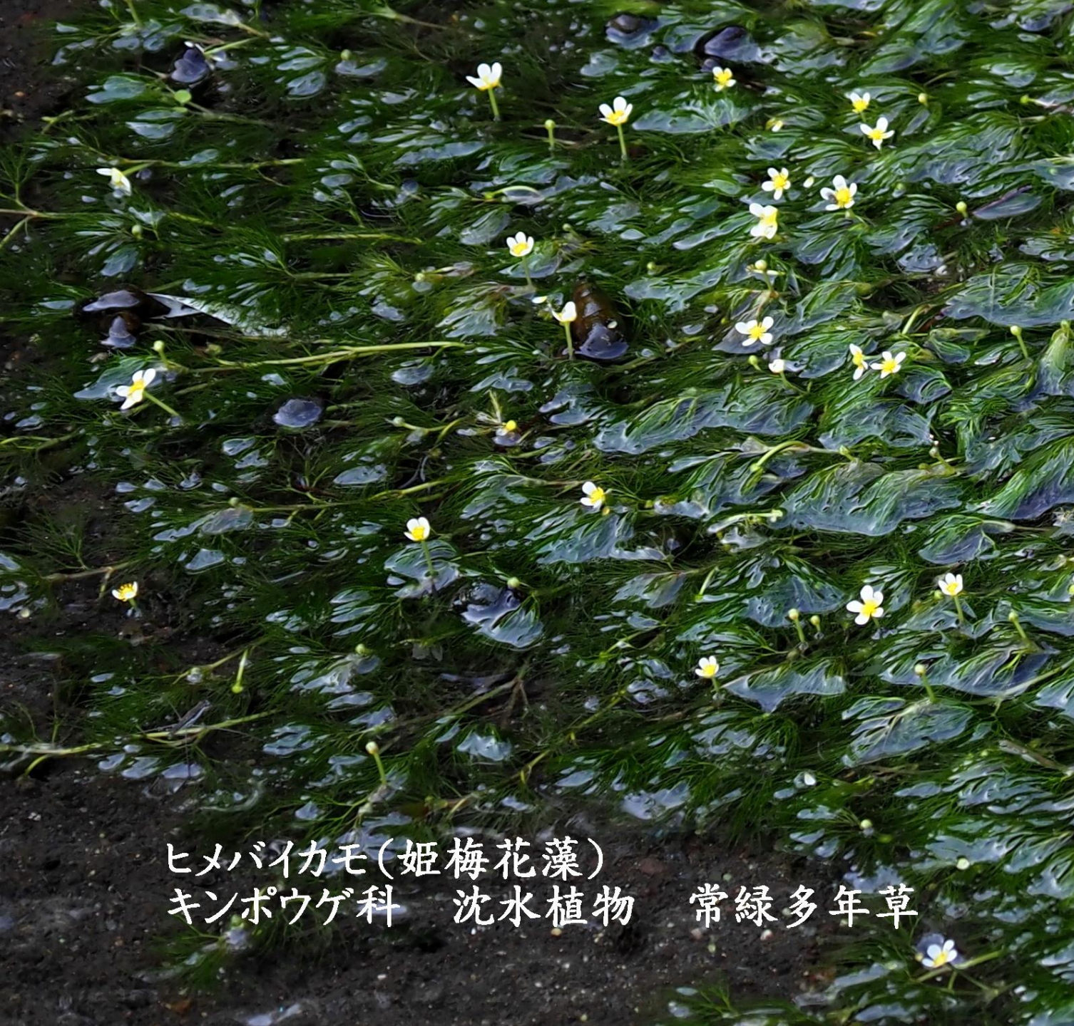
ヒメバイカモ(姫梅花藻) キンポウゲ科 沈水植物 常緑多年草