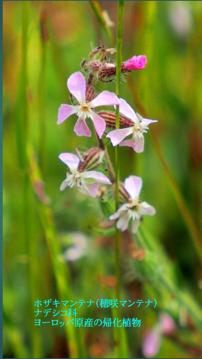
ホザキマンテナ(穂咲マンテナ) ナデシコ科 ヨーロッパ原産の帰化植物