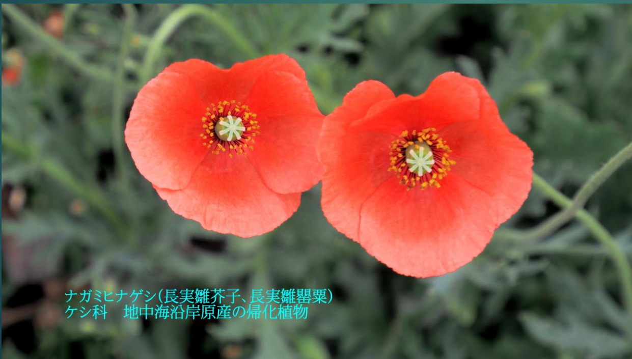
ナガミヒナゲン(長実雛芥子、長実雛罌粟) ケシ科 地中海沿岸原産の帰化植物