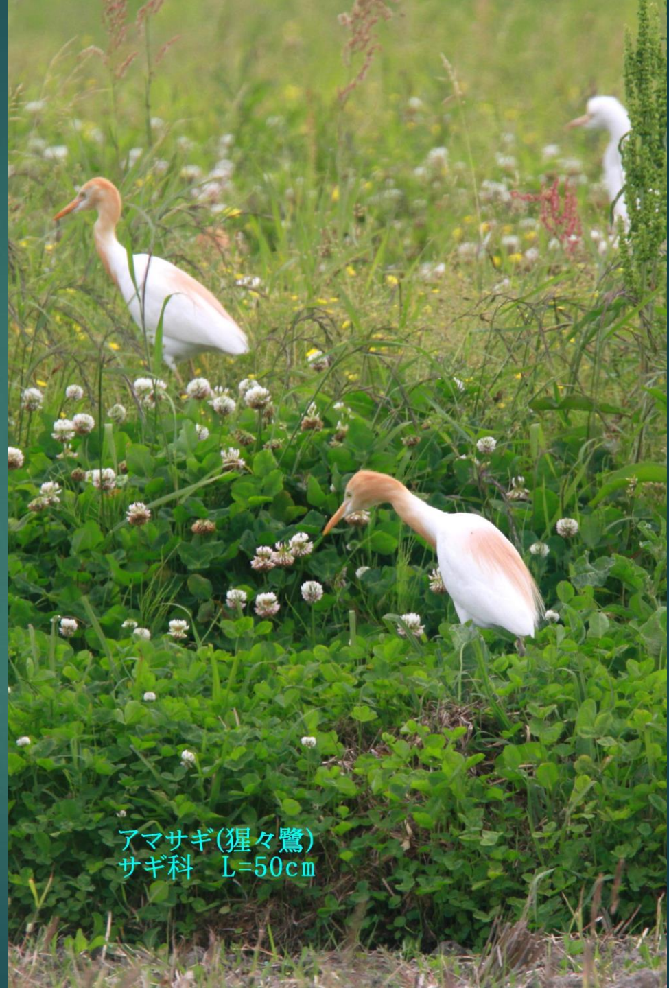
アマサギ(猩々鷺) サギ科 L=50cm