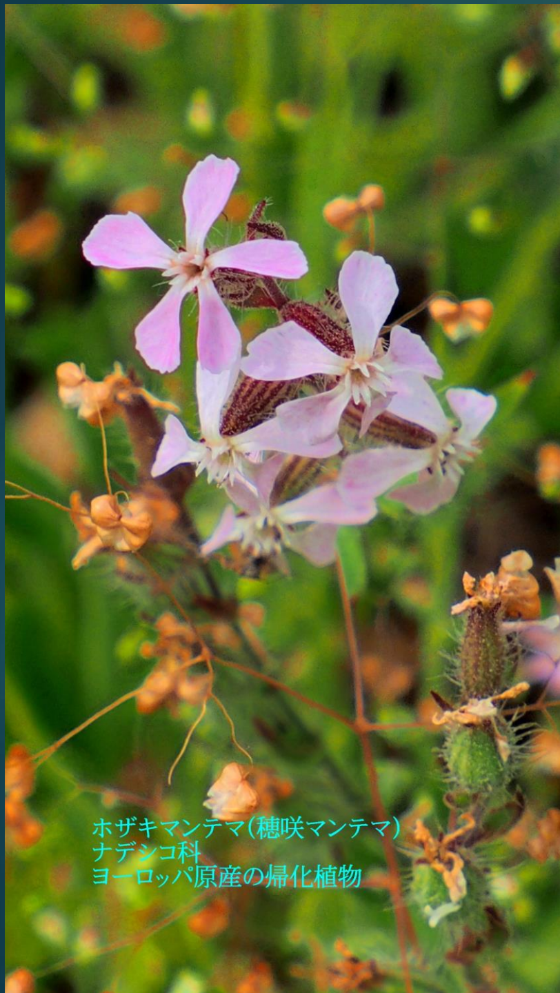
ホザキマンテマ(穂咲マンテマ) ナデシコ科 ヨーロッパ原産の帰化植物