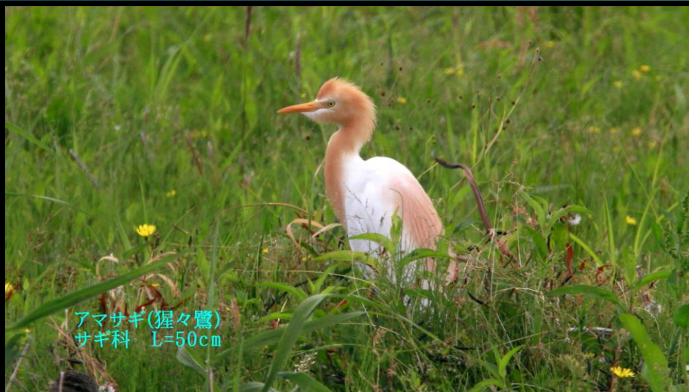
アマサギ(猩々鷺) サギ科 L=50cm