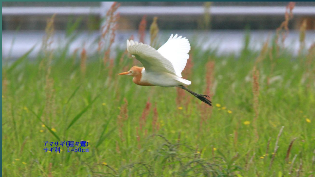
アマサギ(猩々鷺) サギ科 L=50cm