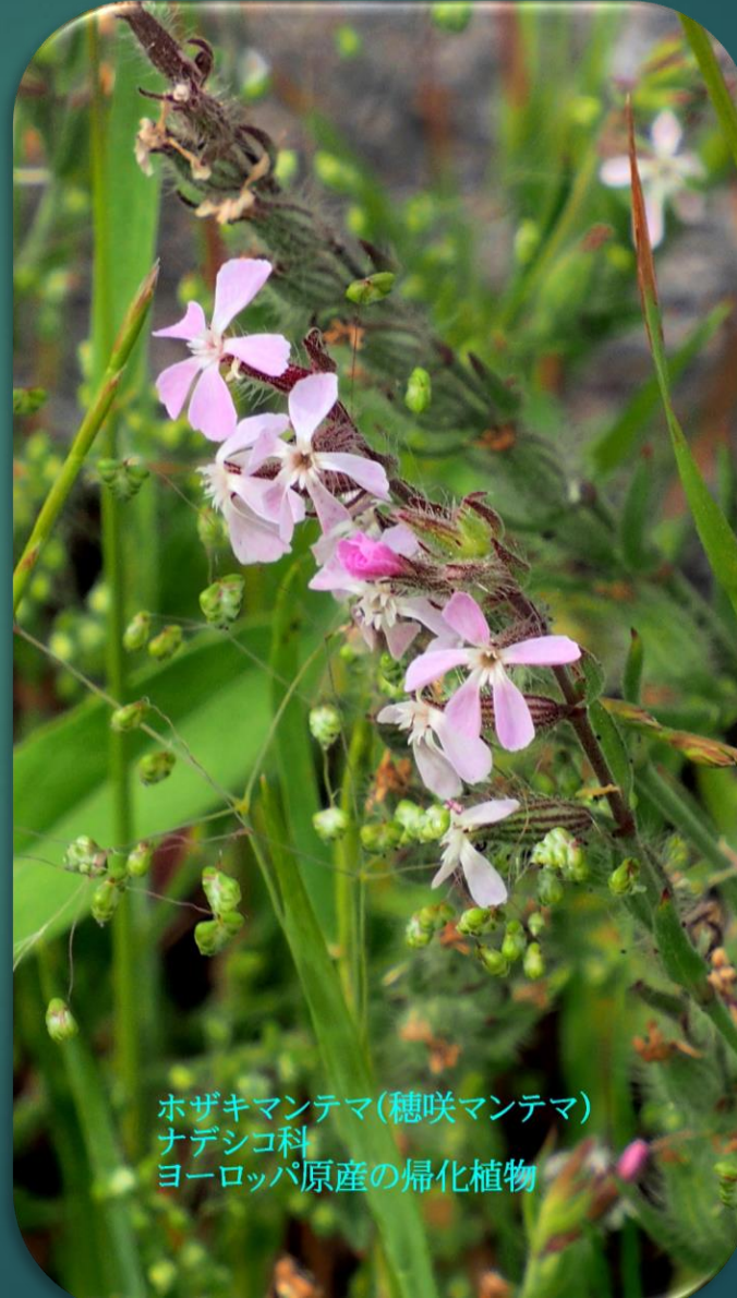
ホザキマンテマ(穂咲マンテマ) ナデシコ科 ヨーロッパ原産の帰化植物