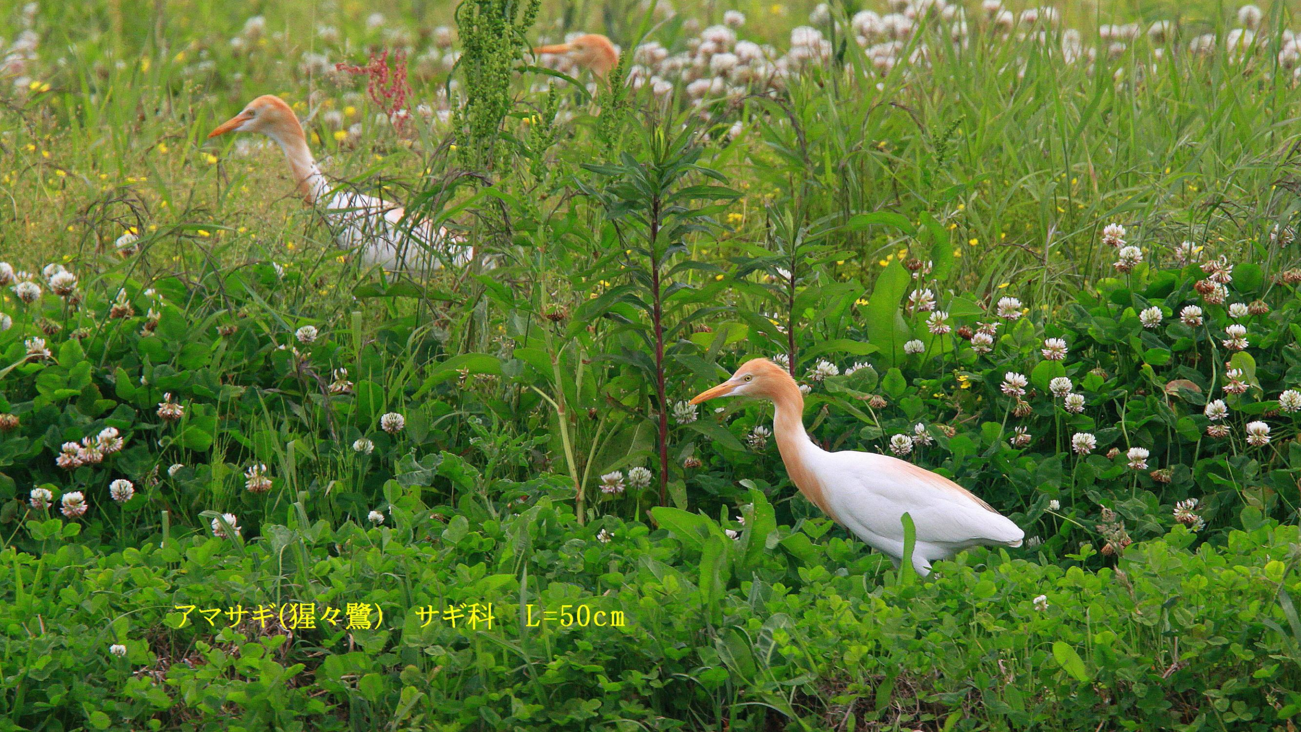
アマサギ(猩々鷺) サギ科 L=50cm