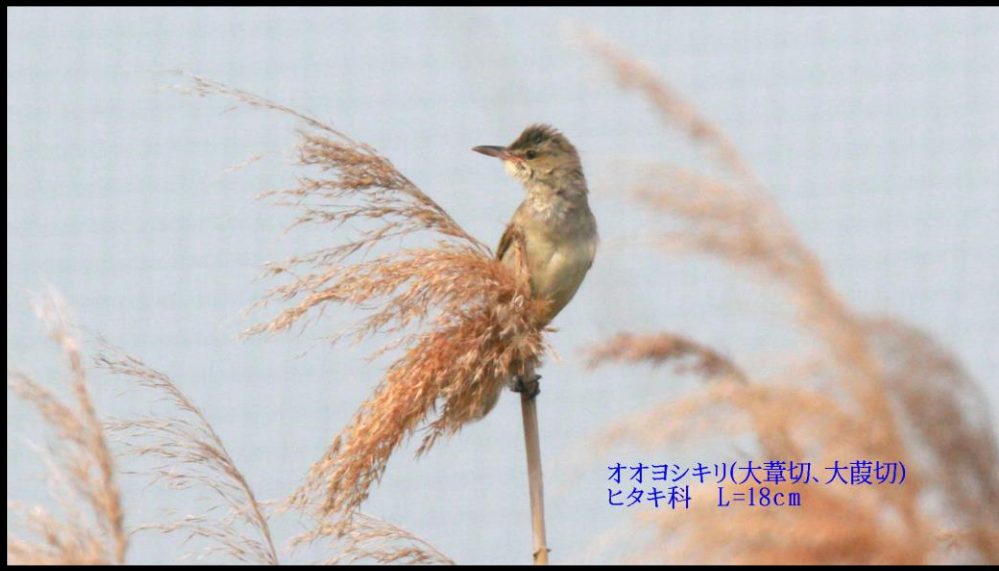
オオヨシキリ(大葦切、大葭切) ヒタキ科 L=18cm