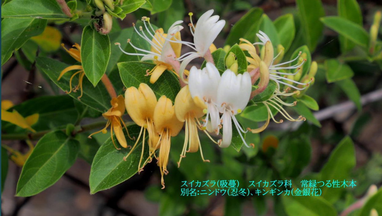
スイカズラ(吸蔓) スイカズラ科 常緑つる性木本 別名:ニンドウ(忍冬)、キンギンカ(金銀花)