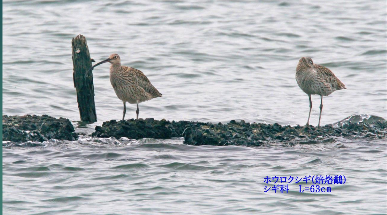
ハウロクシギ(焙烙鵜) シギ科 L=63cm