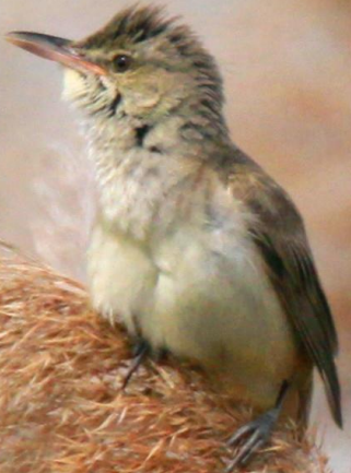
オオヨシキリ (大葦切、大葎切) ヒタキ科 L=18cm