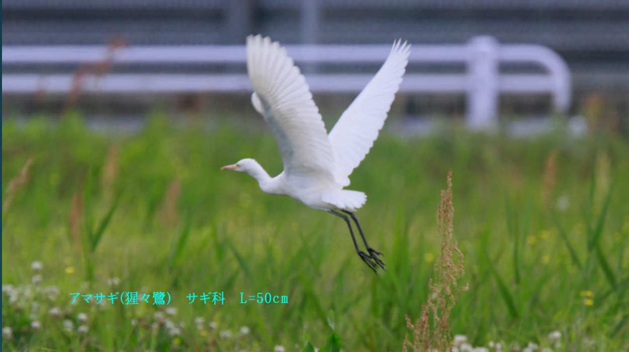
アマサギ(猩々鷺) サギ科 L=50cm