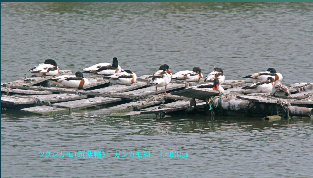
ツクシガモ(筑紫鴨) ガンカモ科 L=63cm