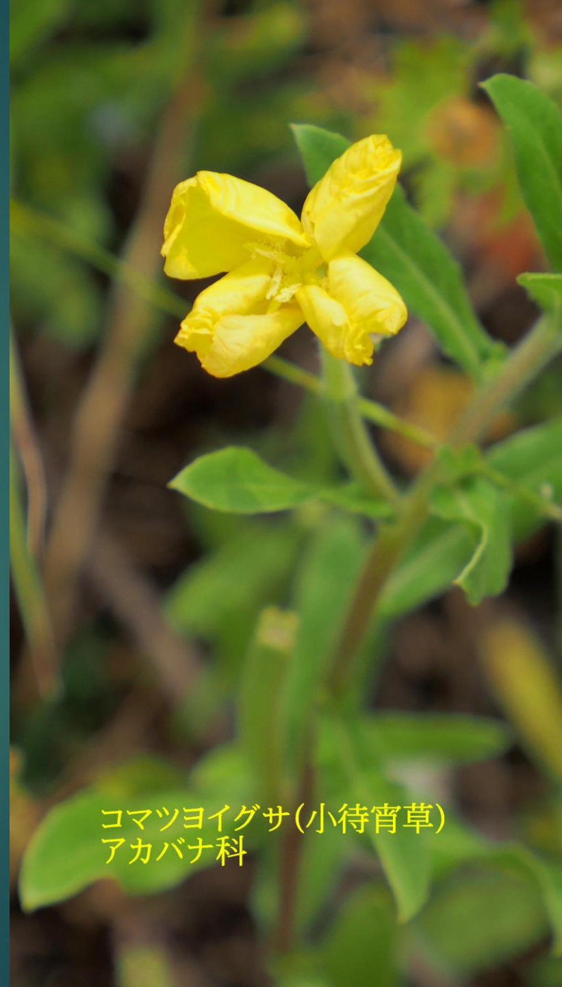
コマツヨイグサ(小待宵草) アカバナ科