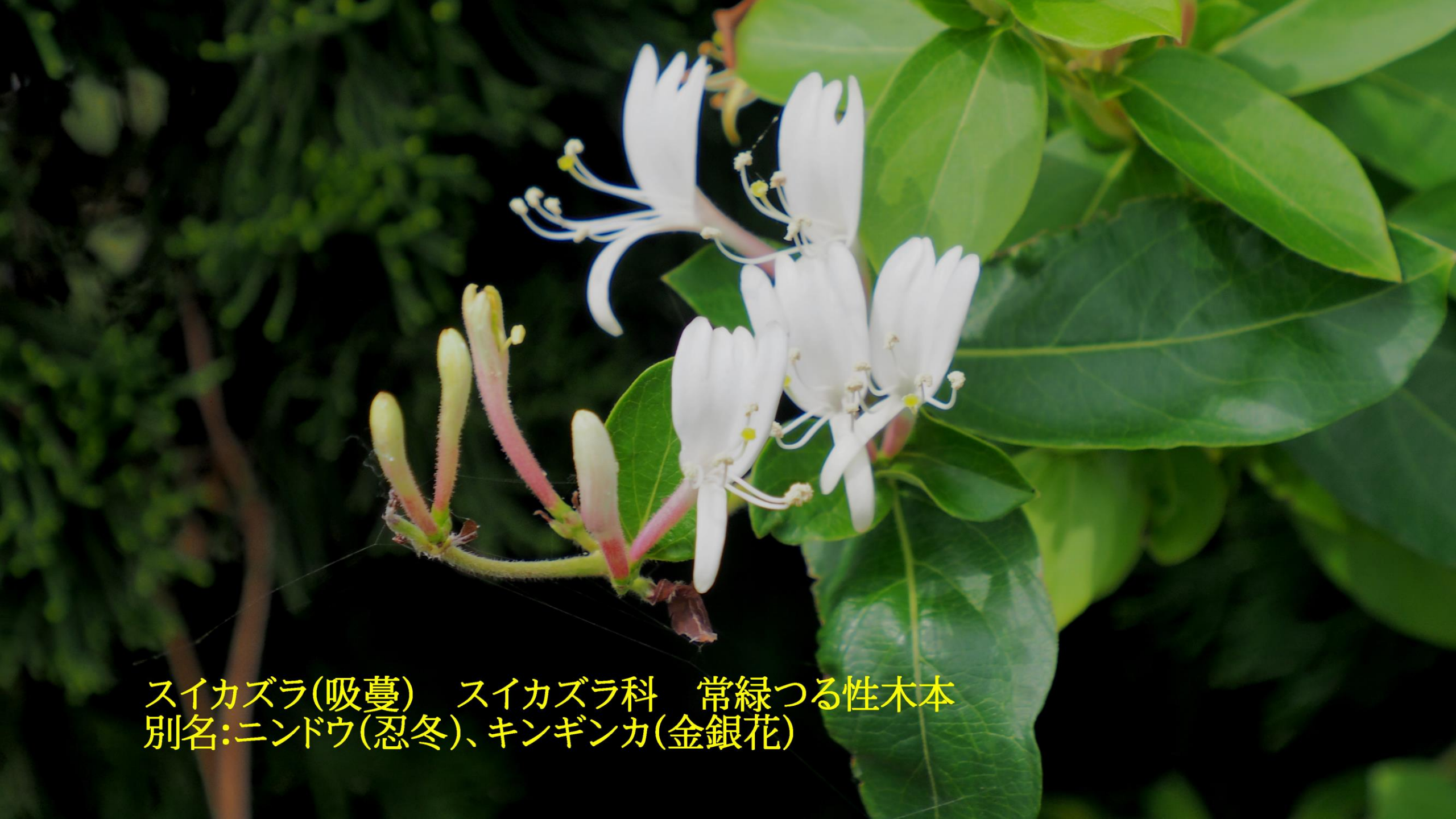
スイカズラ(吸蔓) スイカズラ科 常緑つる性木本 別名:ニンドウ(忍冬)、キンギンカ(金銀花)