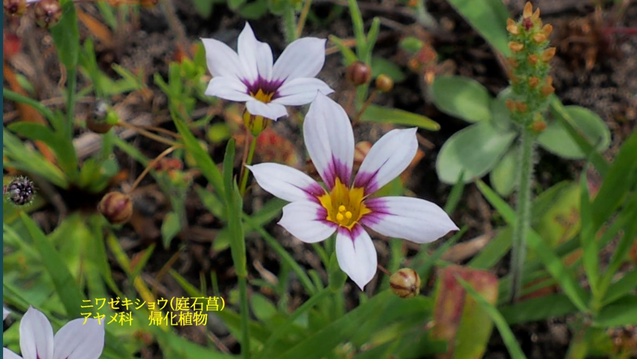
ニワゼキショウ(庭石菖) アヤメ科 帰化植物