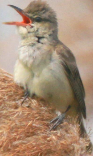
オオヨシキリ (大葦切、大葎切) ヒタキ科 L=18cm