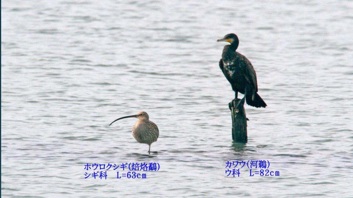
ハウロクシギ(焙烙鵜) シギ科 L=63cm