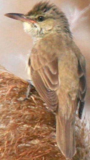
オオヨシキリ (大葦切、大葎切) ヒタキ科 L=18cm