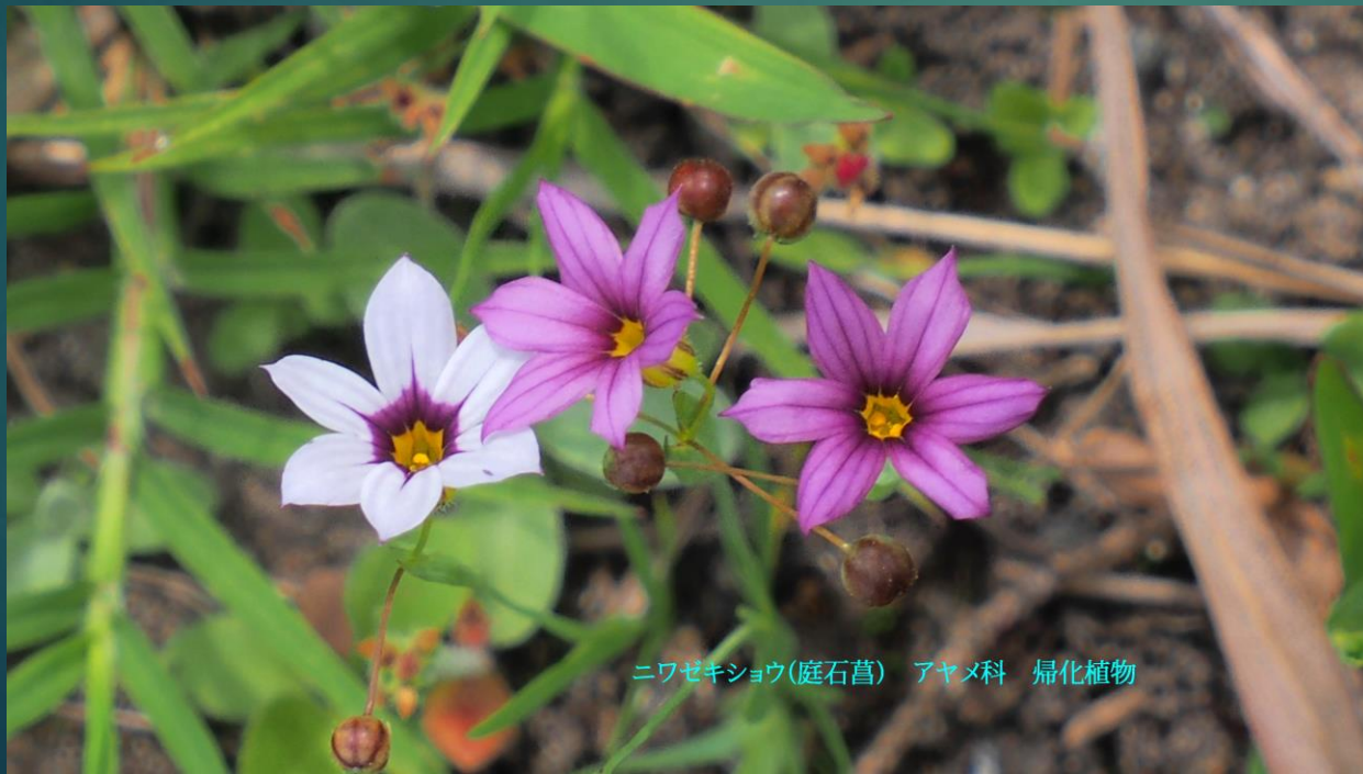
ニワゼキショウ(庭石菖) アヤメ科 帰化植物