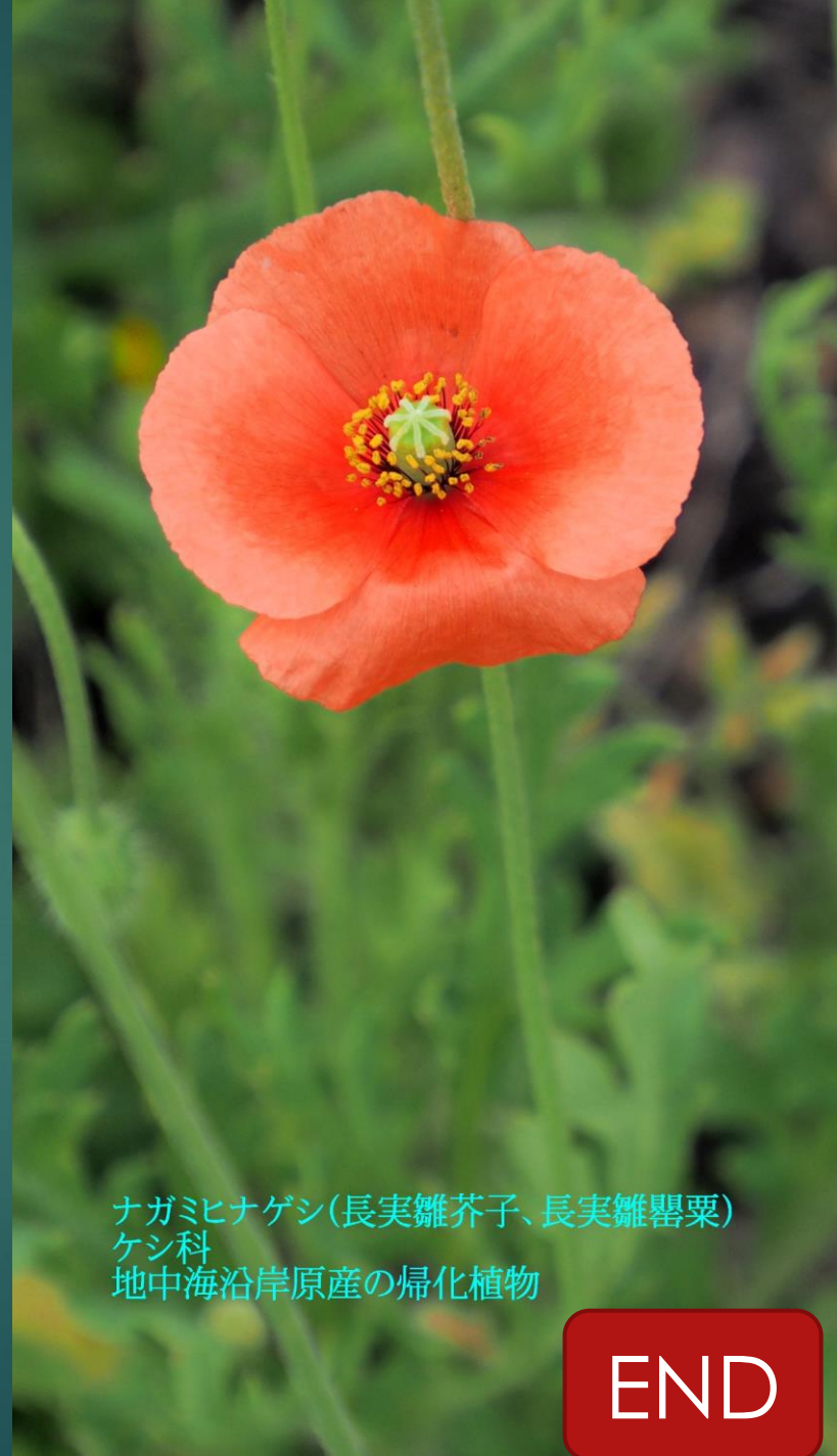
ナガミヒナゲン(長実雛芥子、長実雛罌粟) ケシ科 地中海沿岸原産の帰化植物