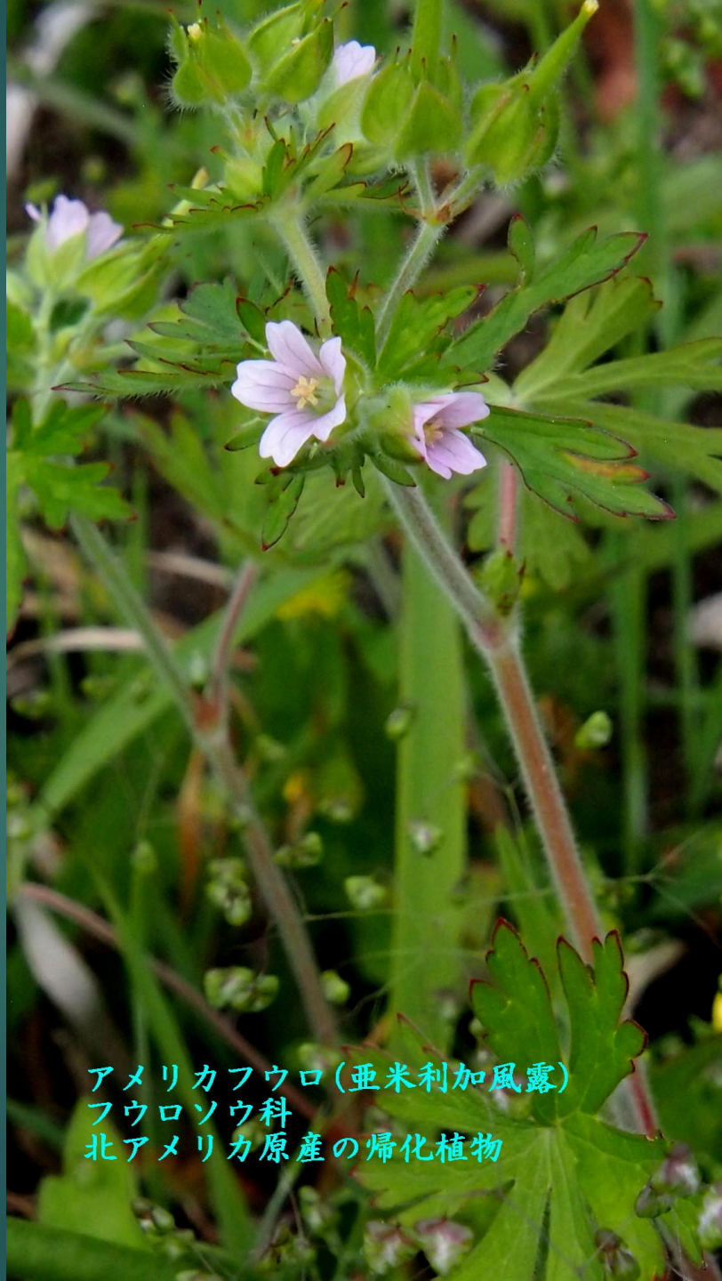
アメリカフウロ(亜米利加風露) フウロソウ科 北アメリカ原産の帰化植物