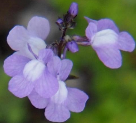
マツバウンラン(松葉海蘭) ラン科 北アメリカ原産の帰化植物