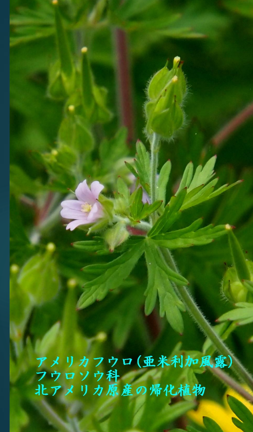
アメリカフウロ(亜米利加風露) フウロソウ科 北アメリカ原産の帰化植物