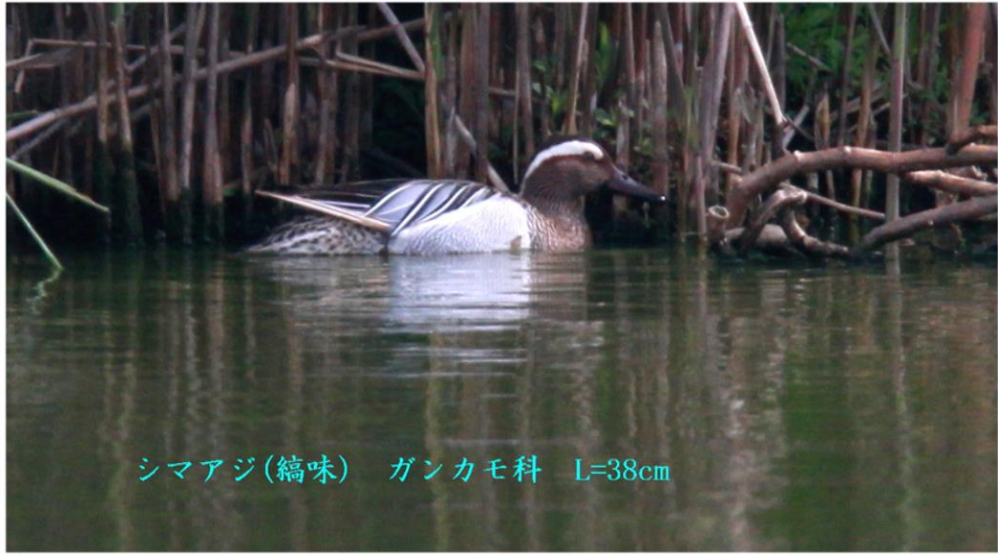
シマアジ(縞味) ガンカモ科 L=38cm