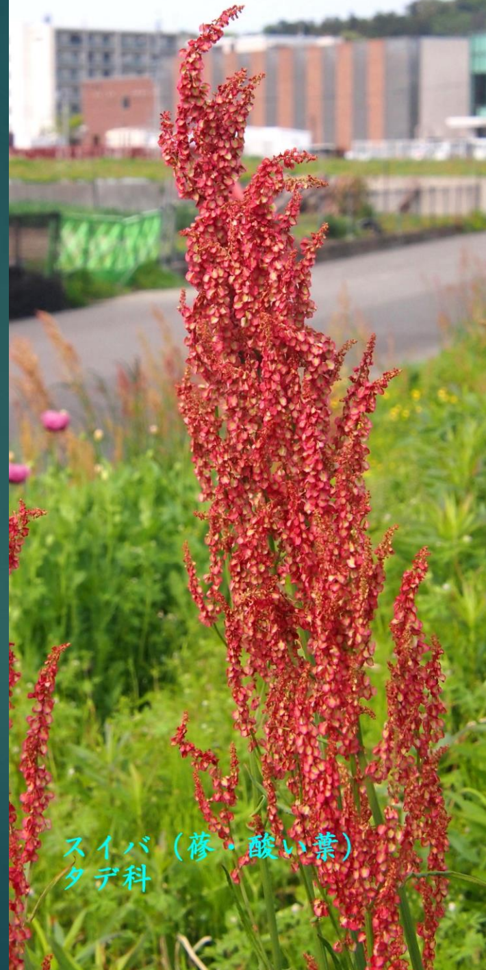
スイバ(蔘・酸い葉) タデ科