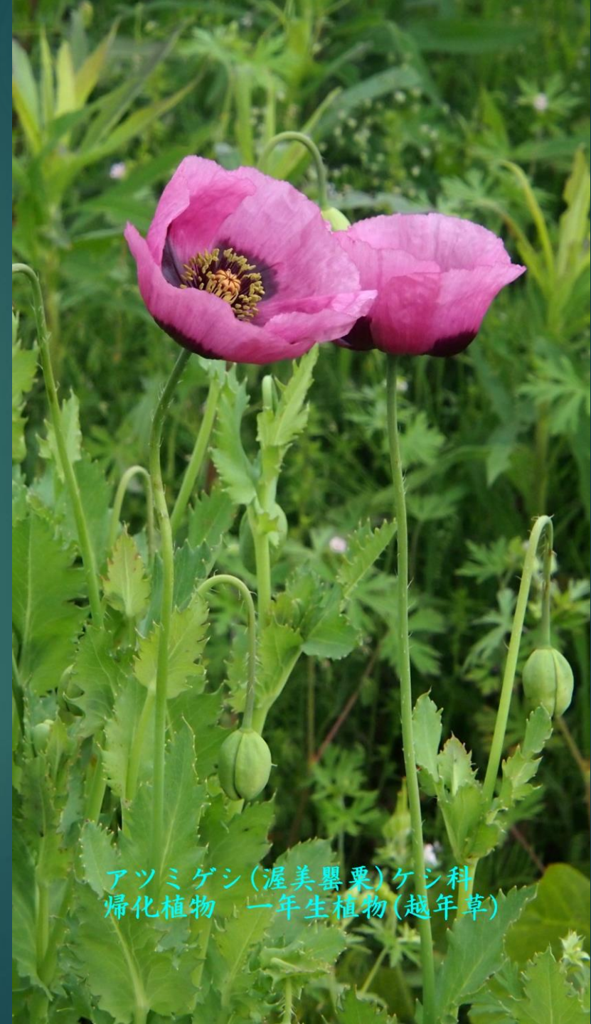
アツミゲシ(渥美罌粟)ケシ科 帰化植物 一年生植物(越年草)