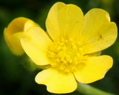
ウマノアシガタ(馬の脚形) キンポウゲ科 別名: キンポウゲ(金鳳花)