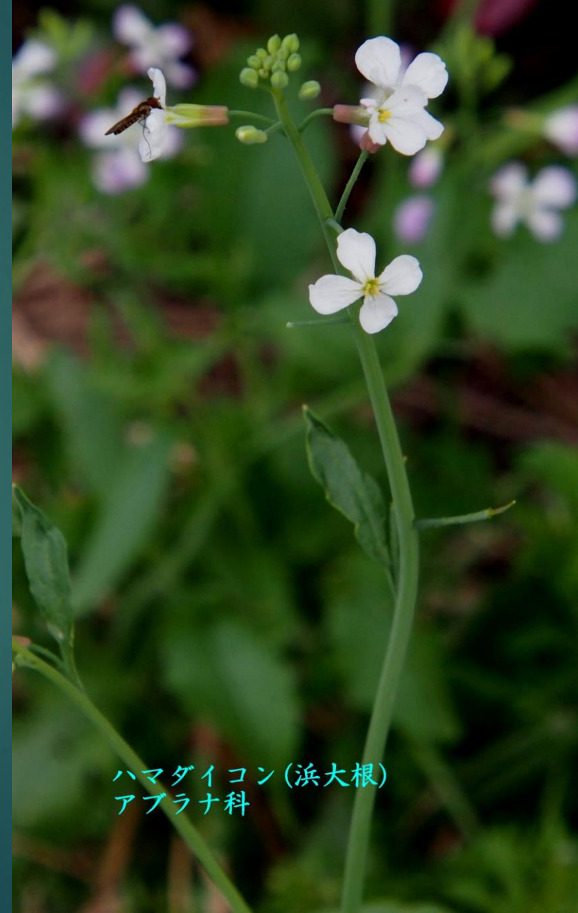
ハマダイコン(浜大根) アブラナ科