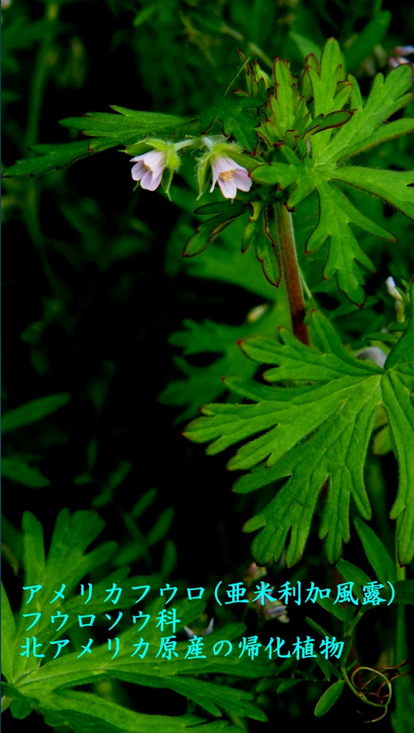
アメリカフウロ (亜米利加風露) フウロソウ科 北アメリカ原産の帰化植物