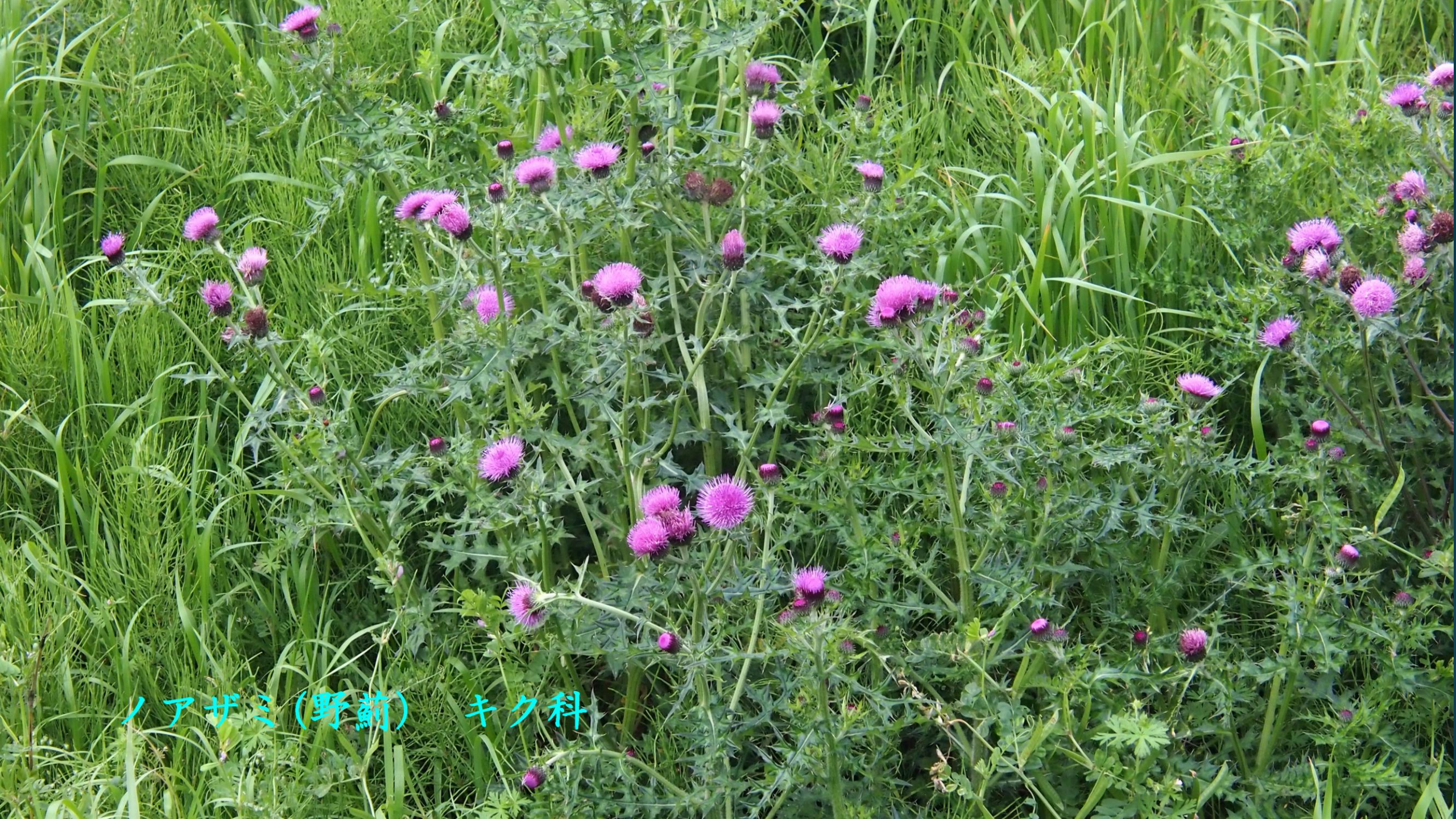
ノアザミ (野薊) キク科