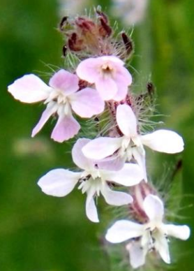
ホザキマンテマ(穂咲マンテマ) ナデシコ科 ヨーロッパ原産の帰化植物