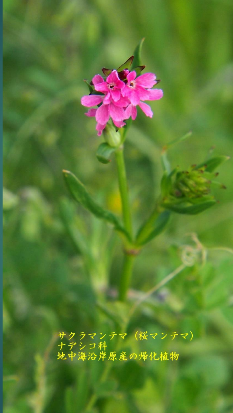
サクラマンテマ (桜マンテマ) ナデシコ科 地中海沿岸原産の帰化植物