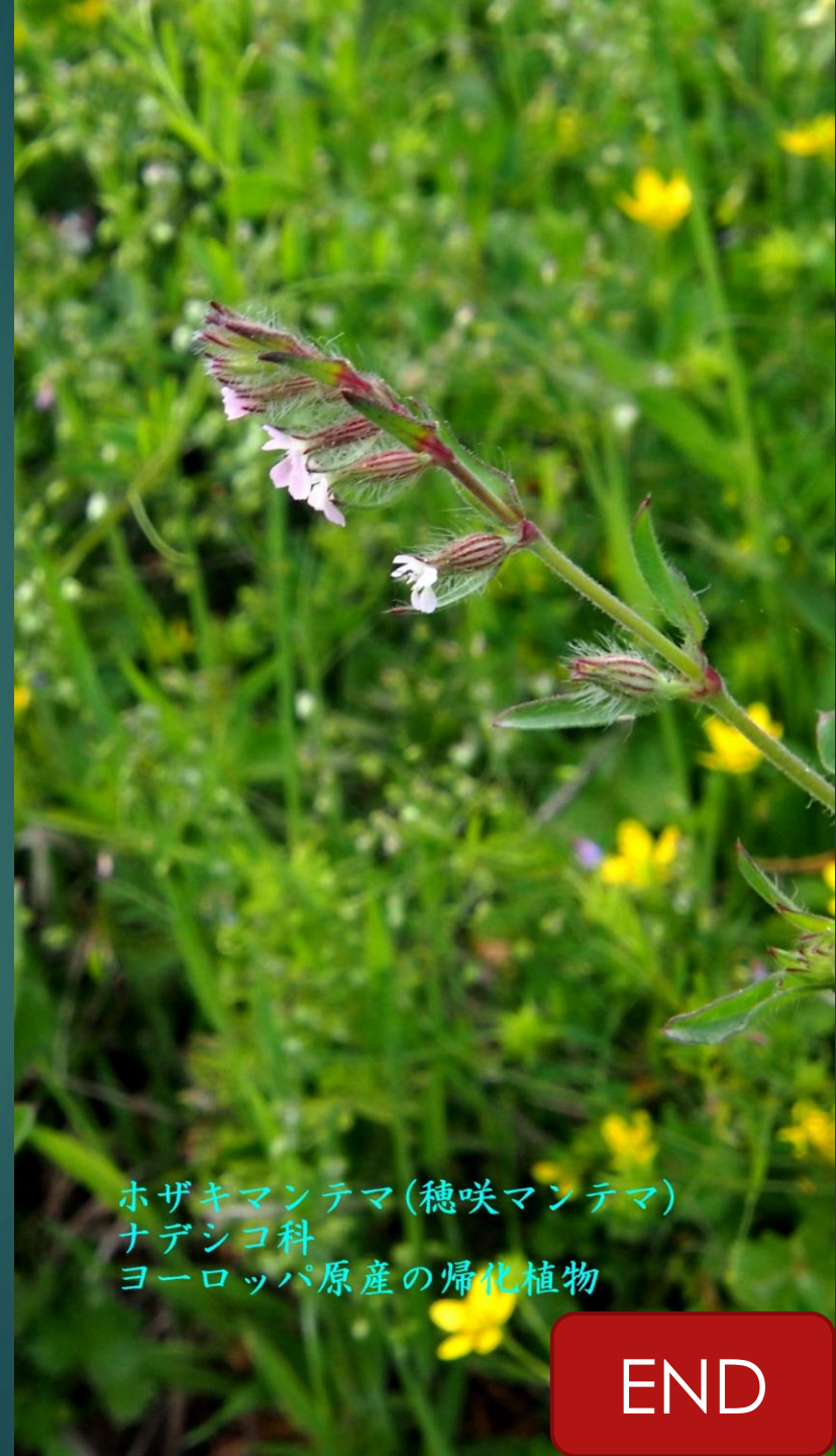
ホザキマンテマ(穂咲マンテマ) ナデシコ科 ヨーロッパ原産の帰化植物