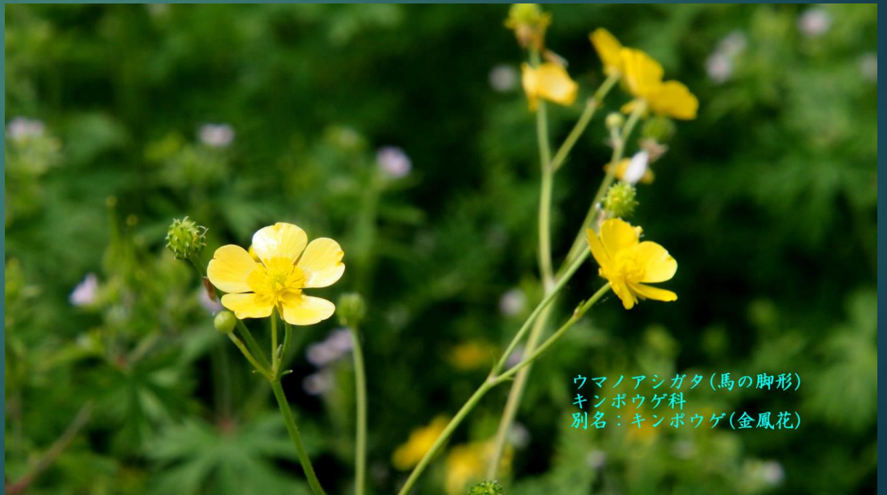
ウマノアシガタ(馬の脚形) キンポウゲ科 別名: キンポウゲ(金鳳花)