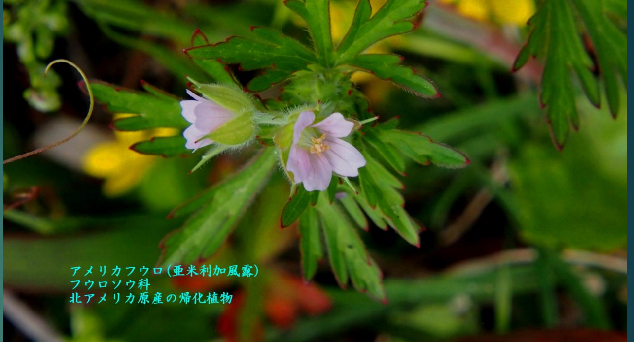
アメリカフウロ(亜米利加風露) フウロソウ科 北アメリカ原産の帰化植物