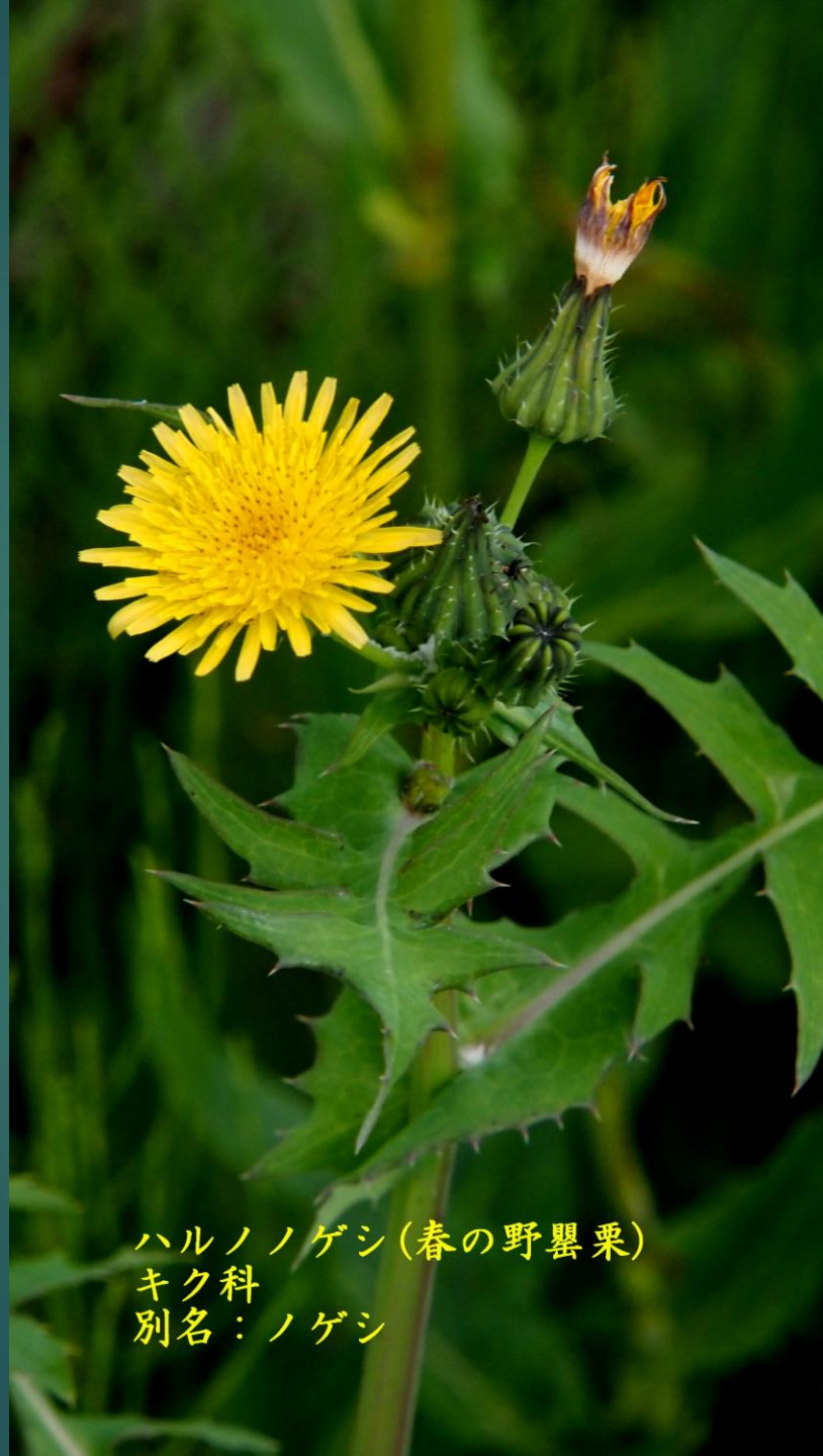
ハルノノゲシ(春の野罌粟) キク科 別名：ノゲシ