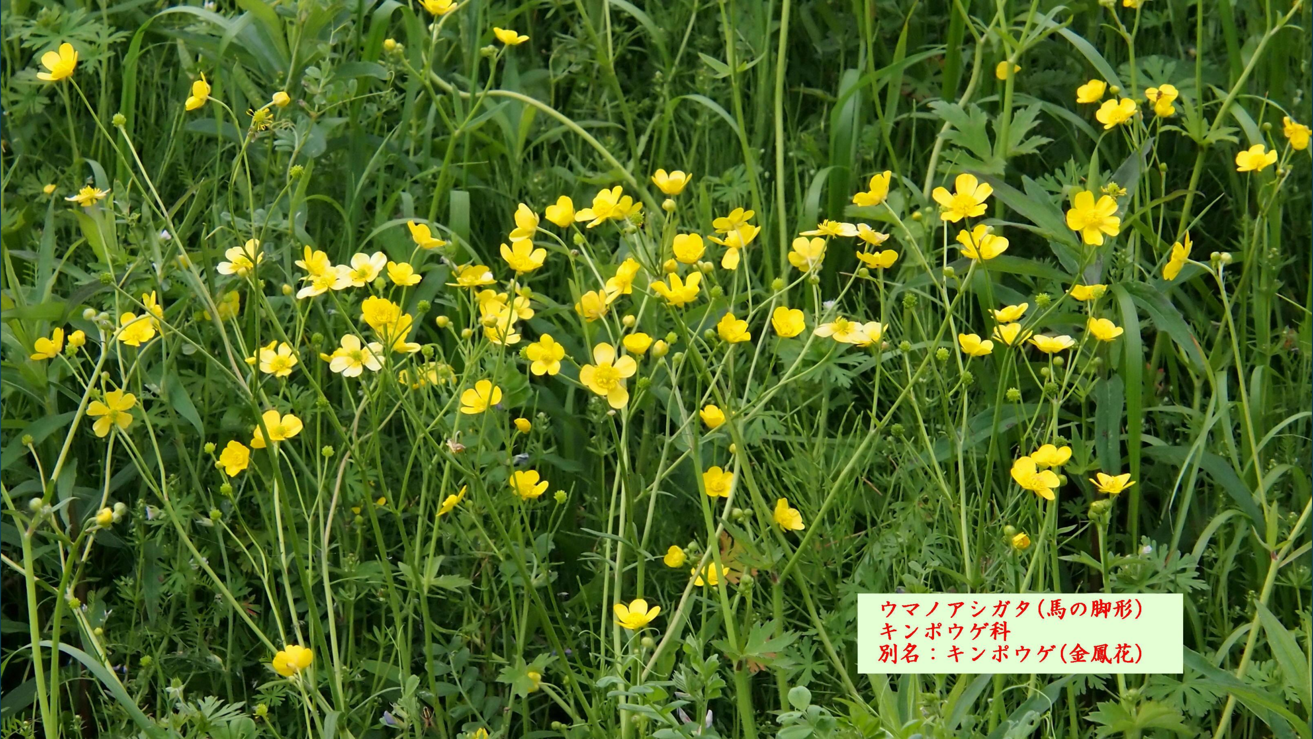
ウマノアシガタ(馬の脚形) キンポウゲ科 別名：キンポウゲ(金鳳花)