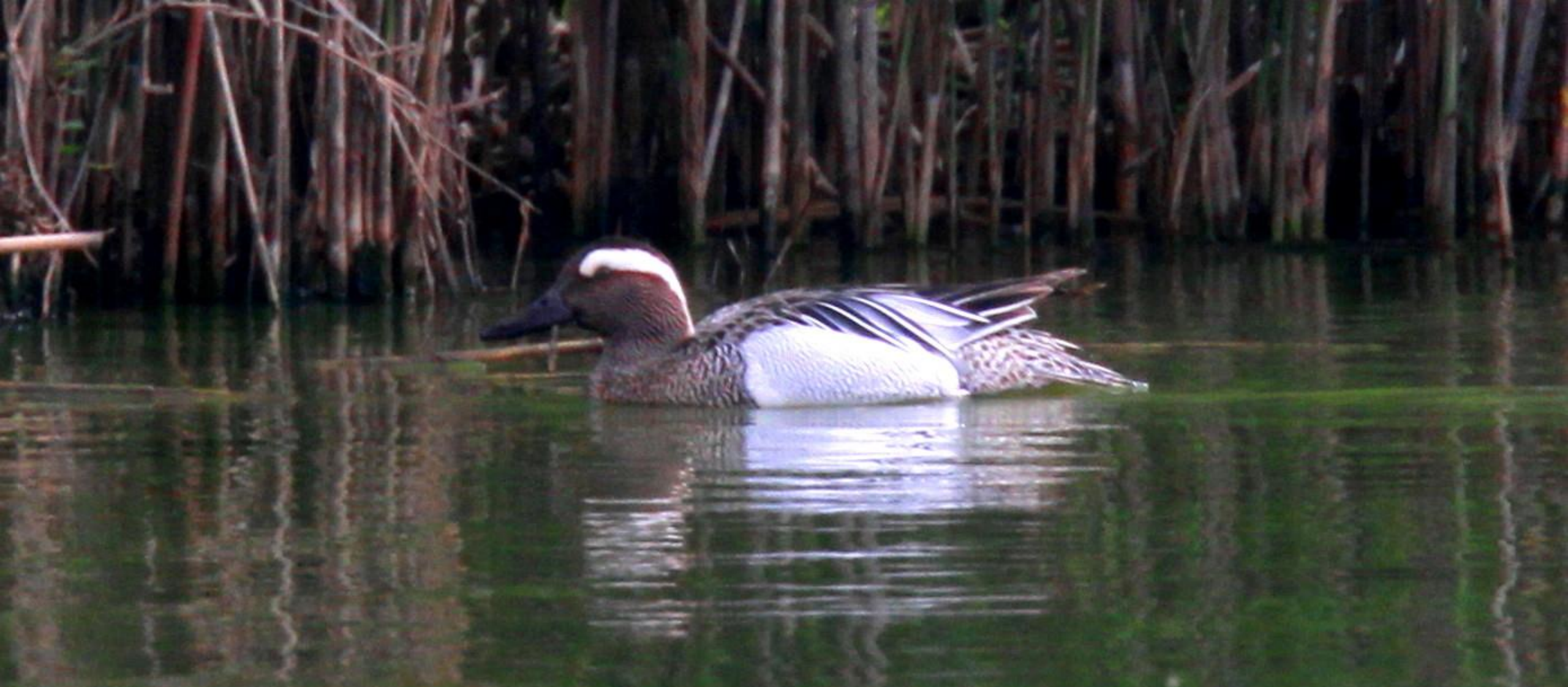
シマアジ(縞味) ガンカモ科 L=38cm