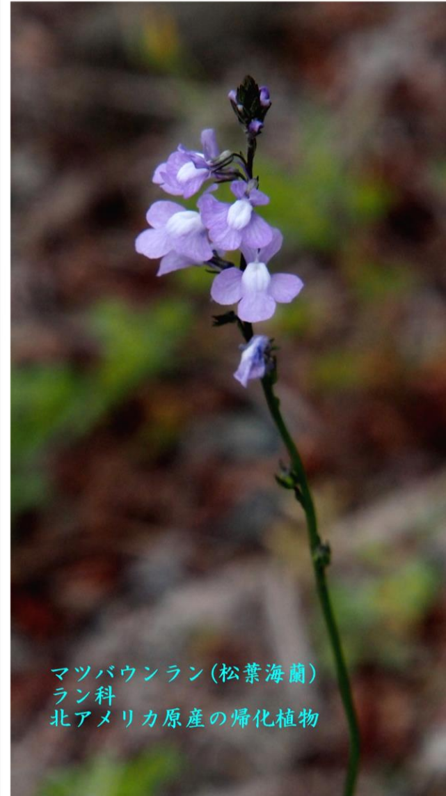
マツバウンラン(松葉海蘭) ラン科 北アメリカ原産の帰化植物