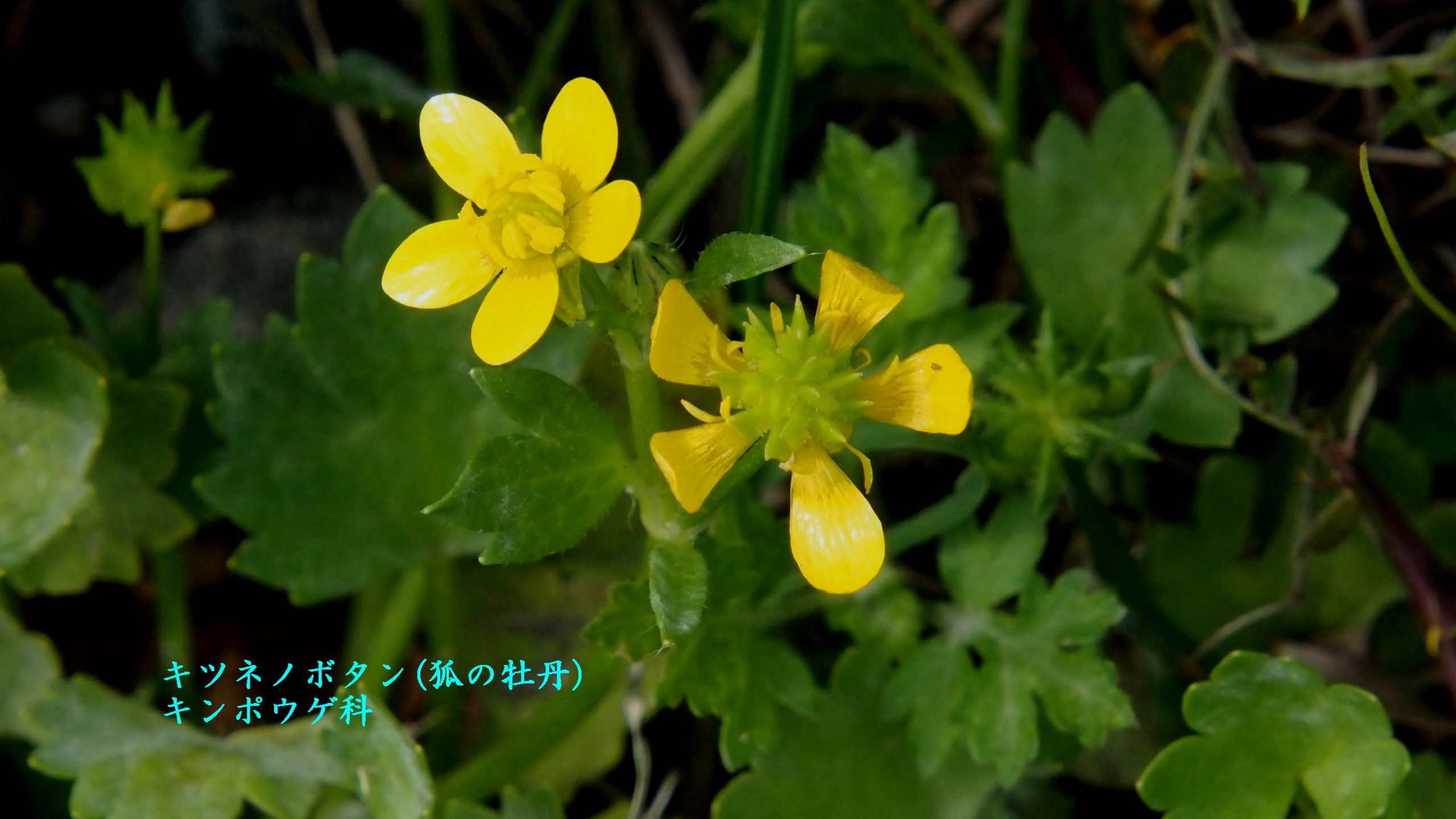
キツネノボタン(狐の牡丹) キンポウゲ科