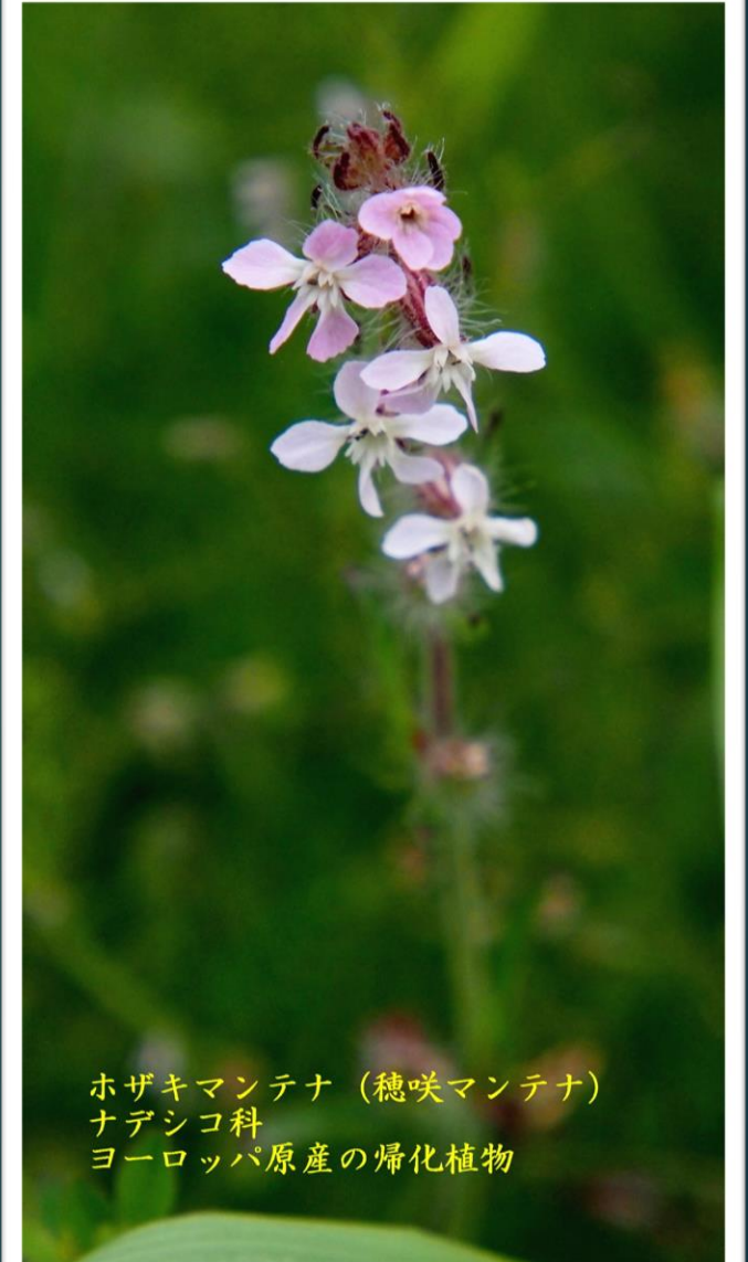
ホザキマンテナ(穂咲マンテナ) ナデシコ科 ヨーロッパ原産の帰化植物