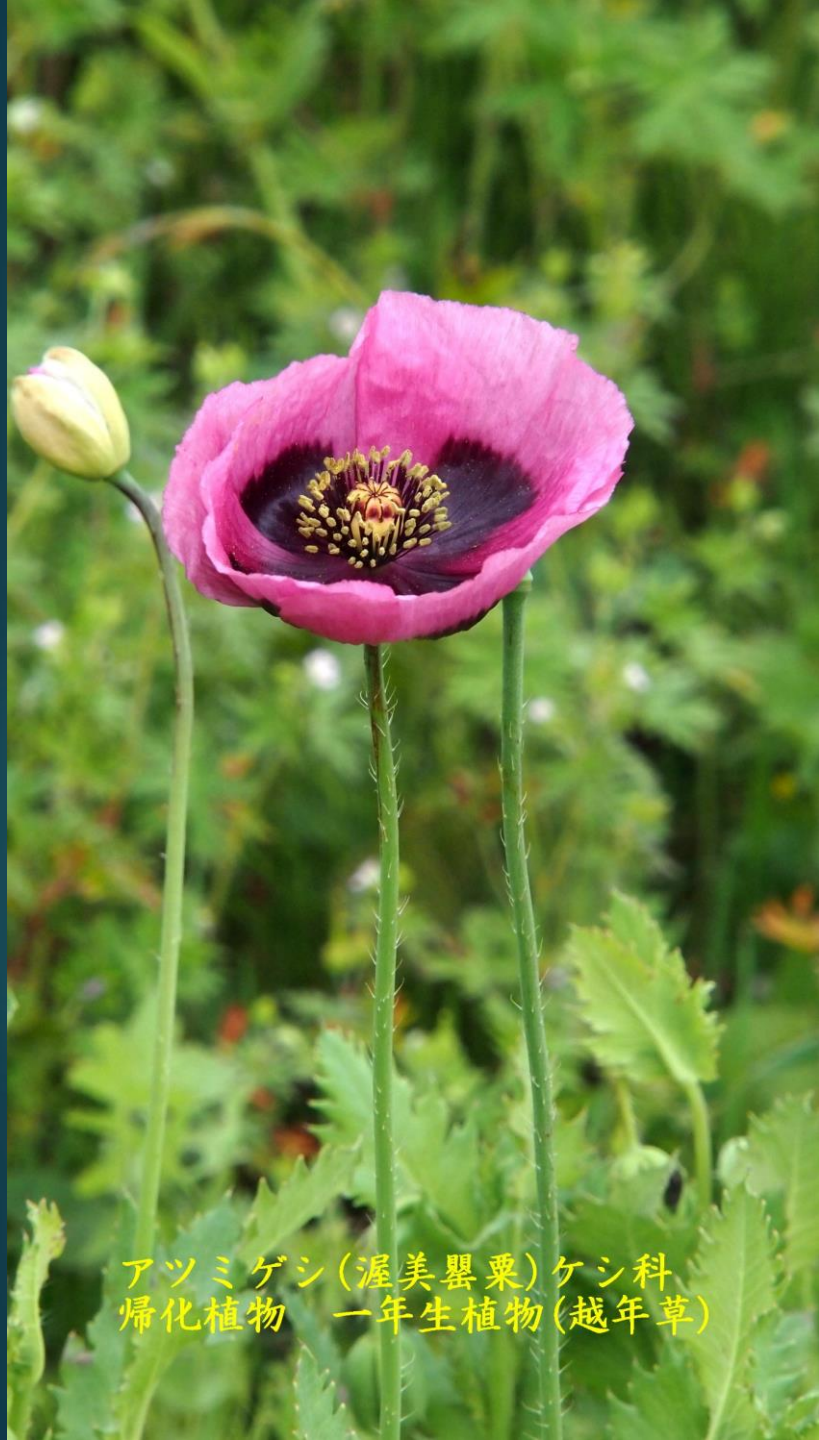
アツミゲシ(渥美罌粟)ケシ科 帰化植物 一年生植物(越年草)