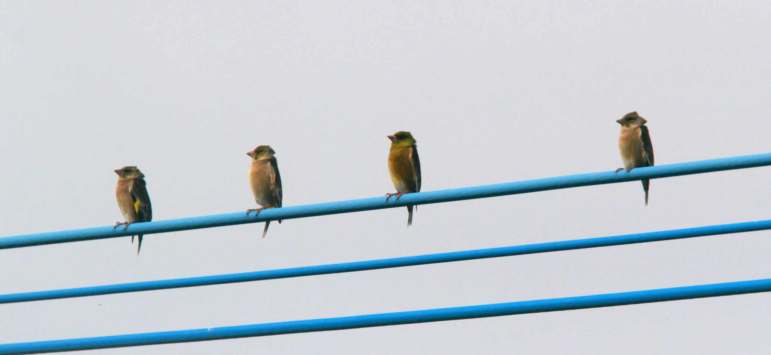
カワラヒワ (河原鶉) アトリ科 L=14.5cm