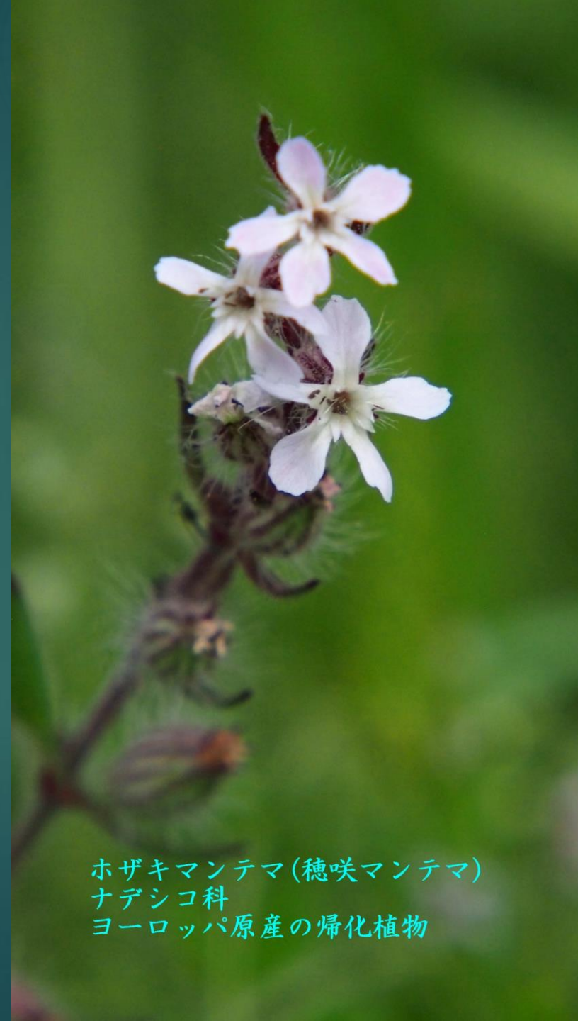
ホザキマンテマ (穂咲マンテマ) ナデシコ科 ヨーロッパ原産の帰化植物