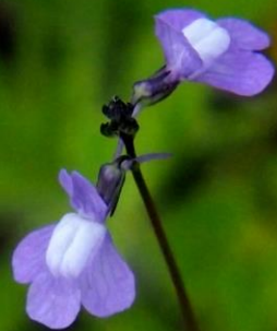
マツバウンラン(松葉海蘭) ラン科 北アメリカ原産の帰化植物