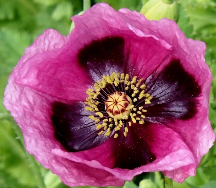
アツミゲシ(渥美罌粟)ケシ科 帰化植物 一年生植物(越年草)