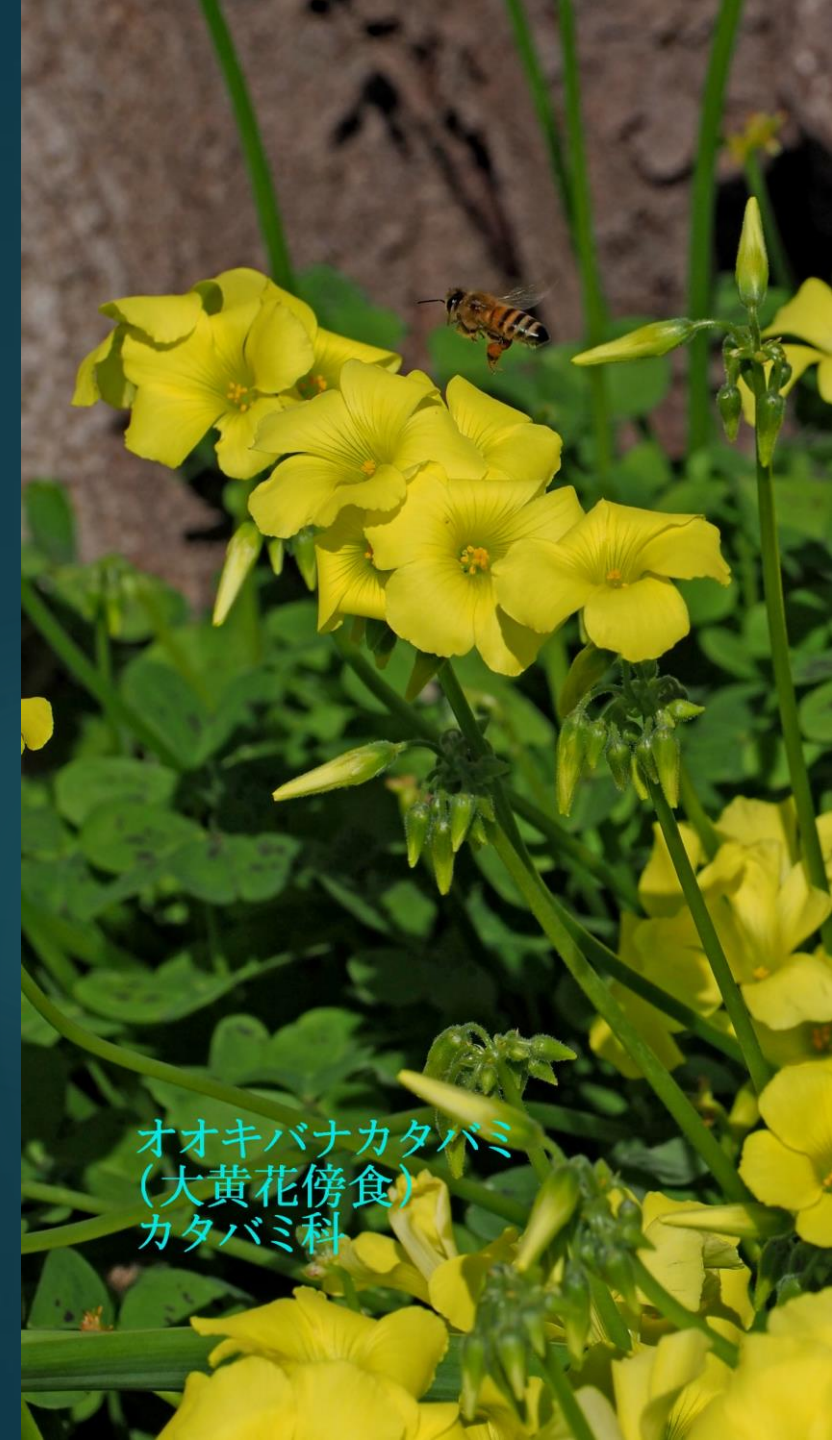
オオキバナカタバミ (大黄花傍食) カタバミ科