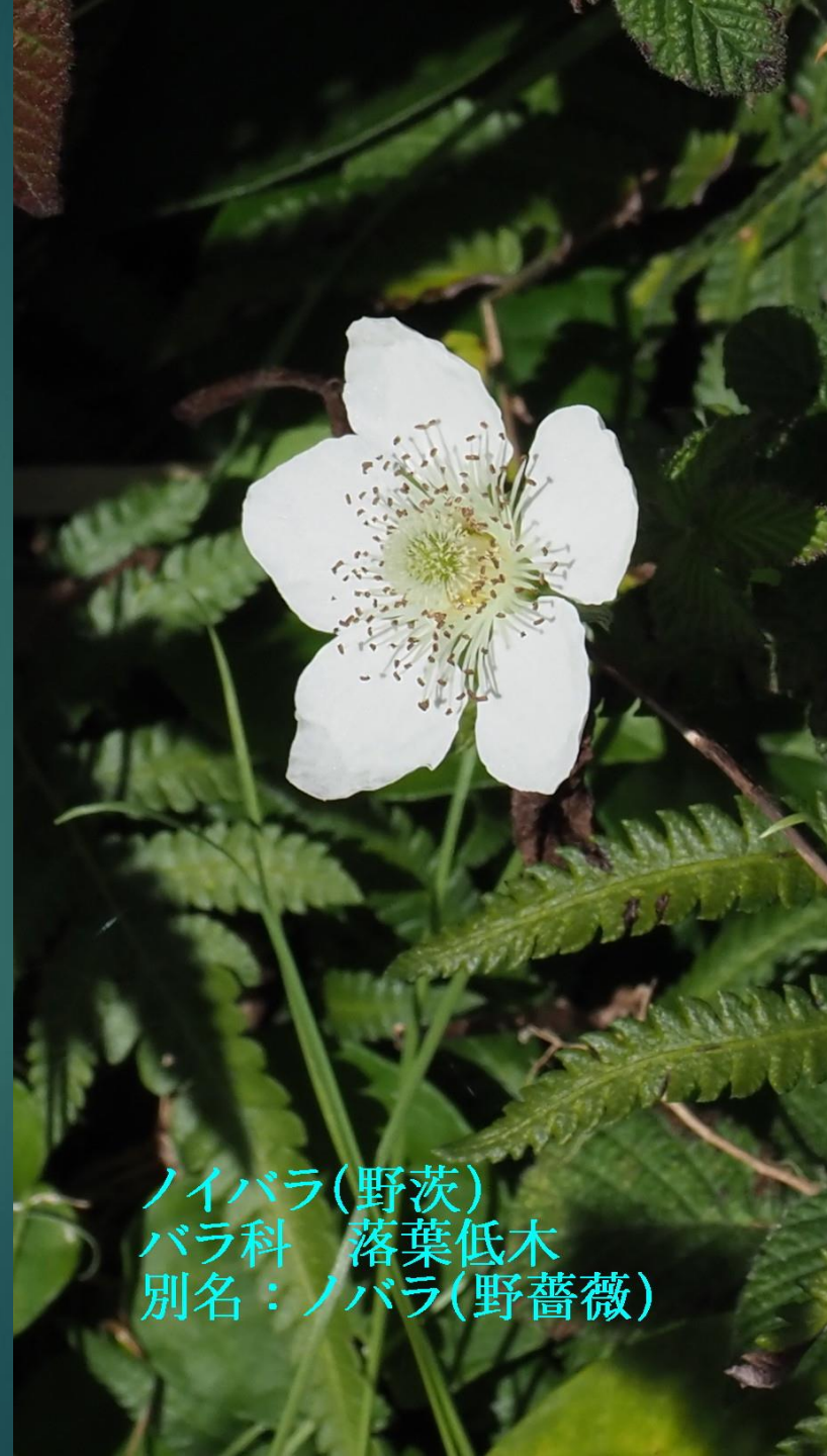
ノイバラ (野茨) バラ科 落葉低木 別名: ノバラ (野薔薇)