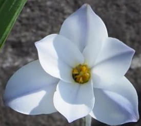
ハナニラ (花韭 ネギ亜科) 別名: セイヨウアマナ (西洋甘菜)