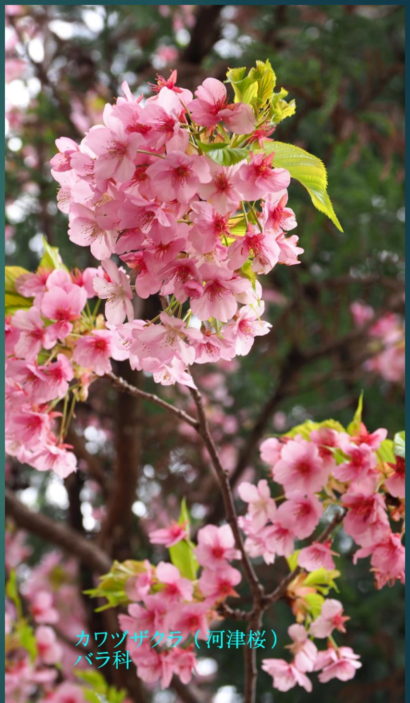
カワヅザクラ（河津桜） バラ科