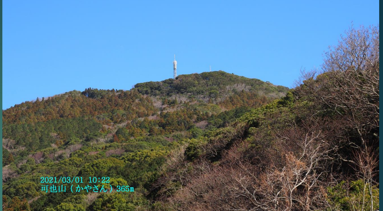
2021/03/01 10:22 可也山(かやさん) 365m