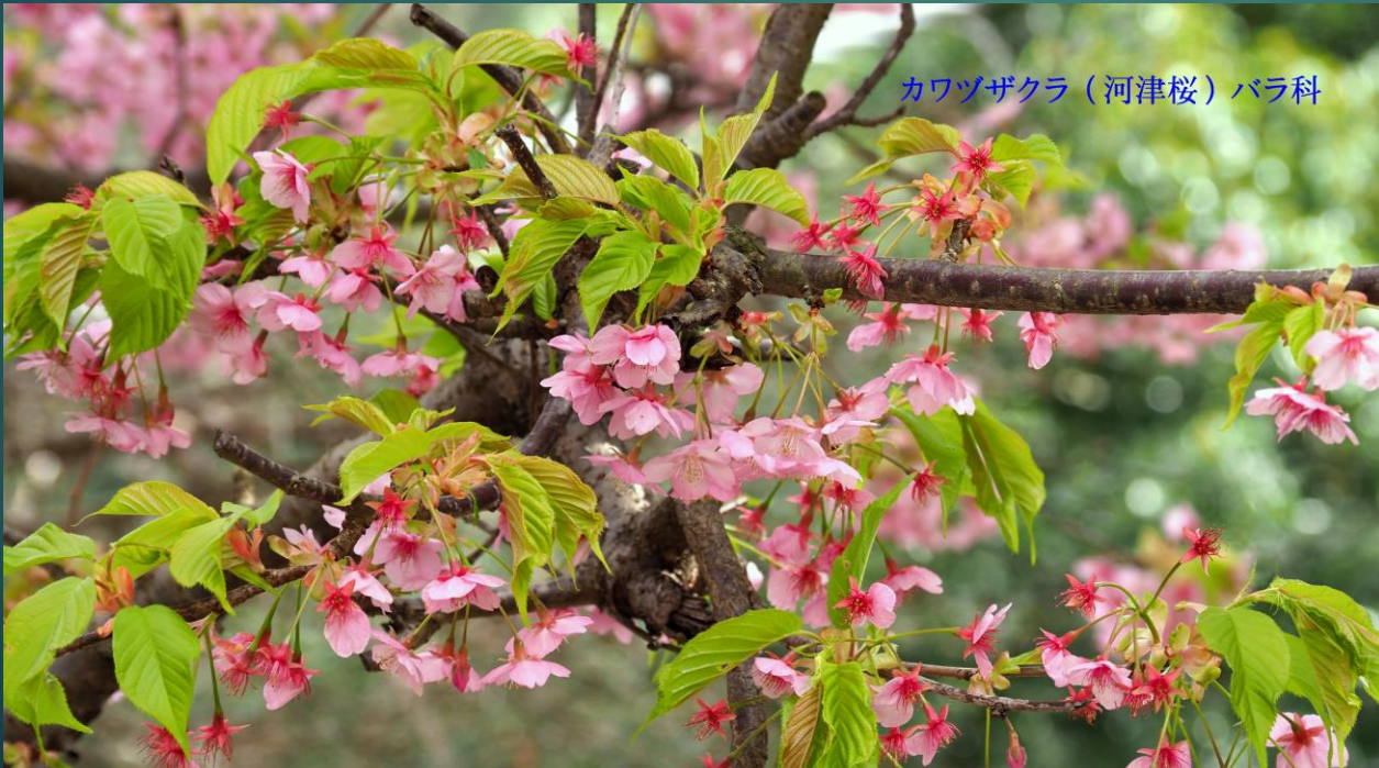
カワヅザクラ（河津桜）バラ科