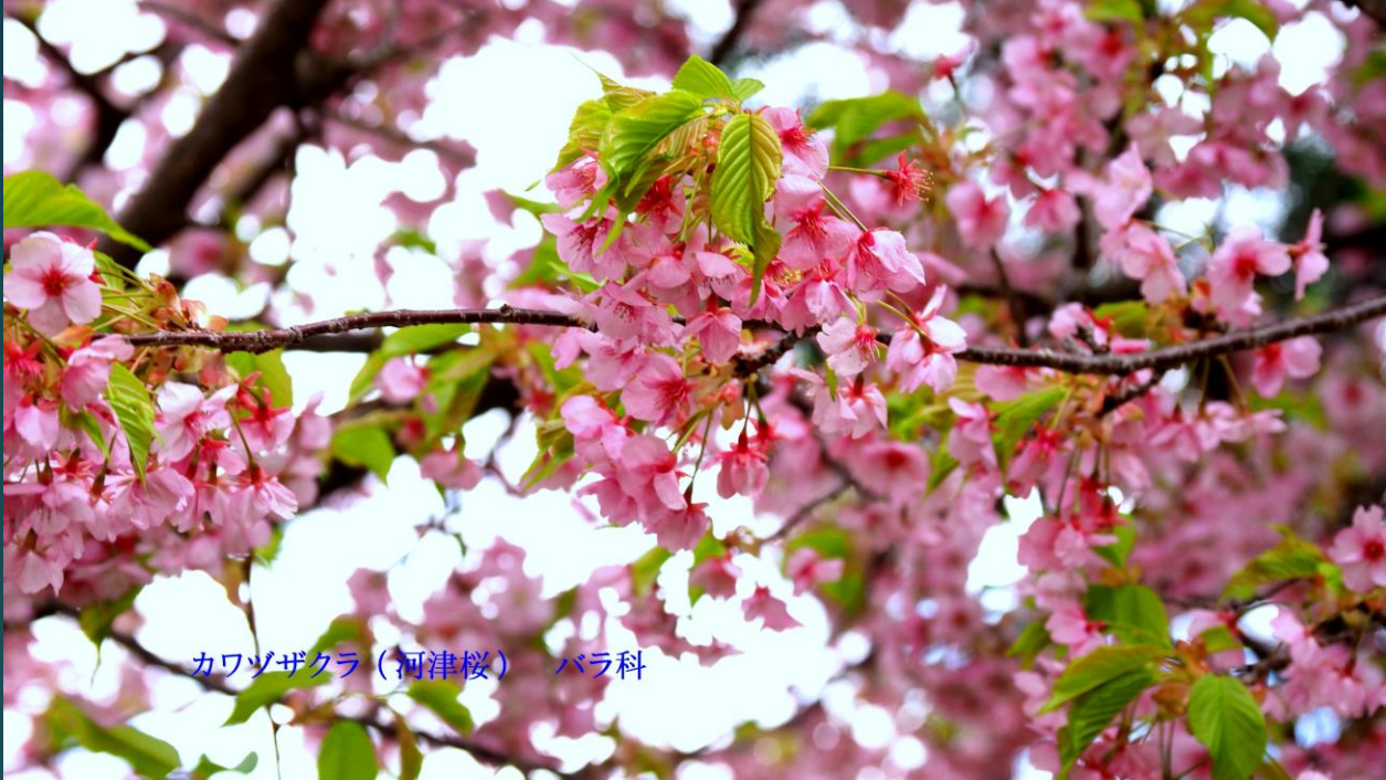
カワヅザクラ（河津桜）バラ科