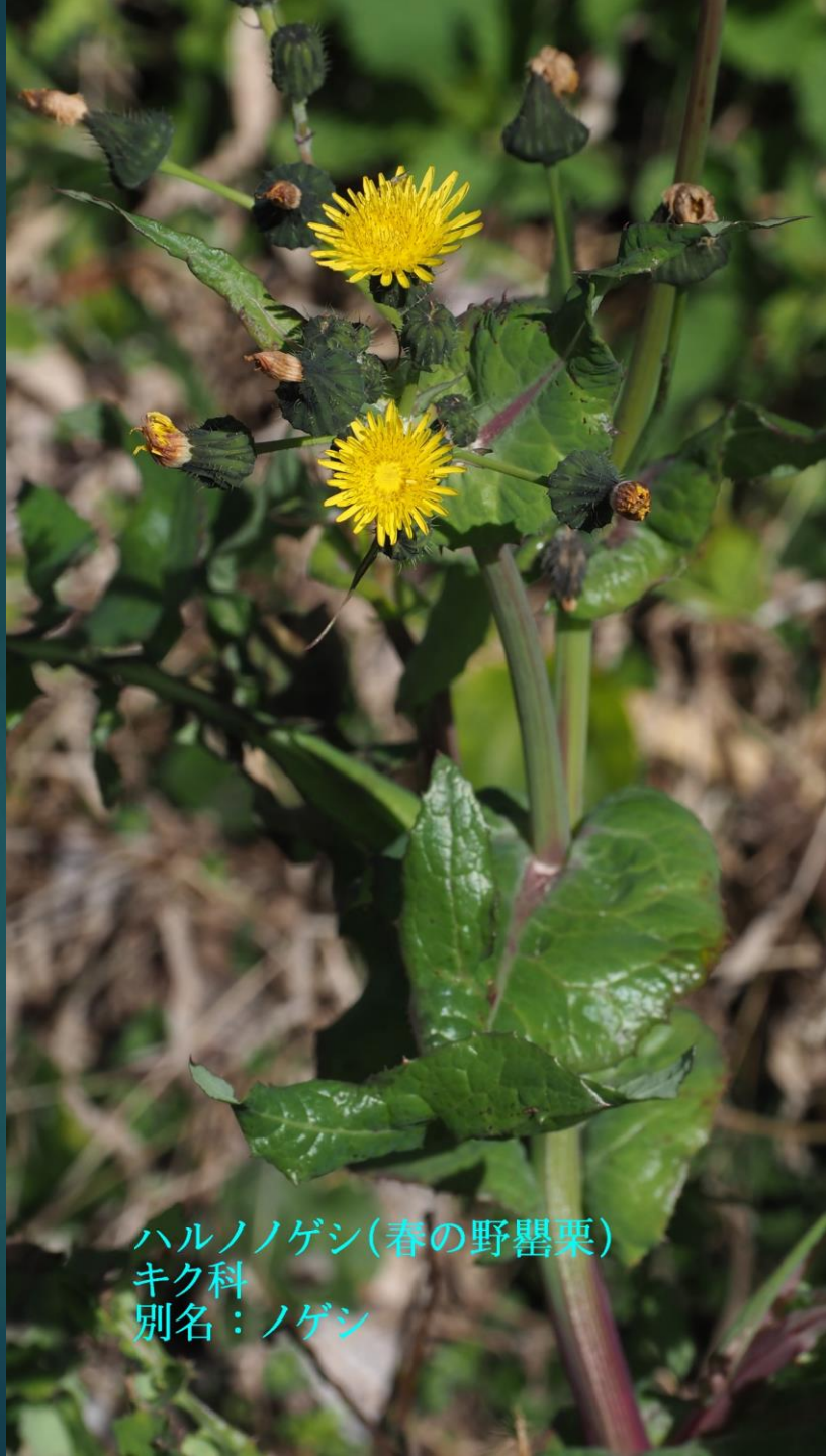
ハルノノゲン(春の野罌粟) キク科 別名：ノゲン