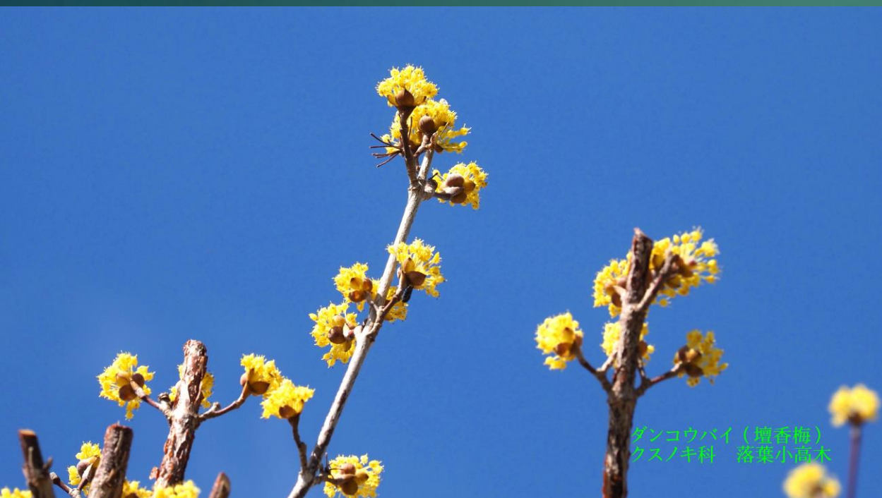
ダンコウバイ (壇香梅) クスノキ科 落葉小高木