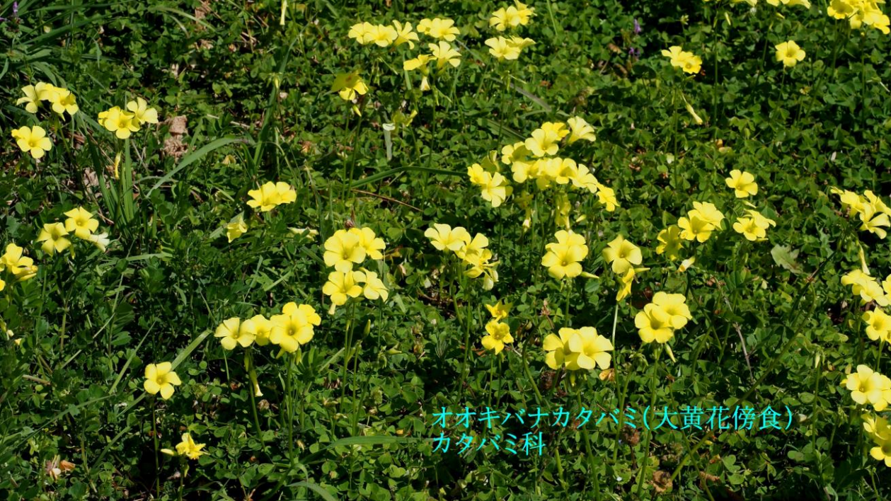
オオキバナカタバミ(大黄花傍食) カタバミ科