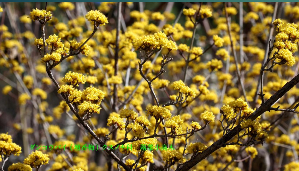
ダンコウバイ(壇香梅)クスノキ科 落葉小高木