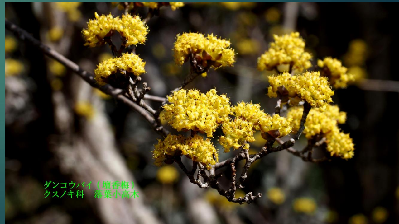
ダンコウバイ(壇香梅) クスノキ科 落葉小高木