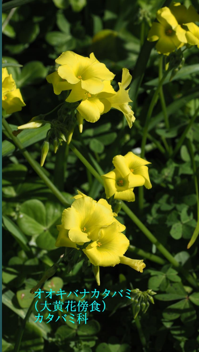
オオキバナカタバミ (大黄花傍食) カタバミ科