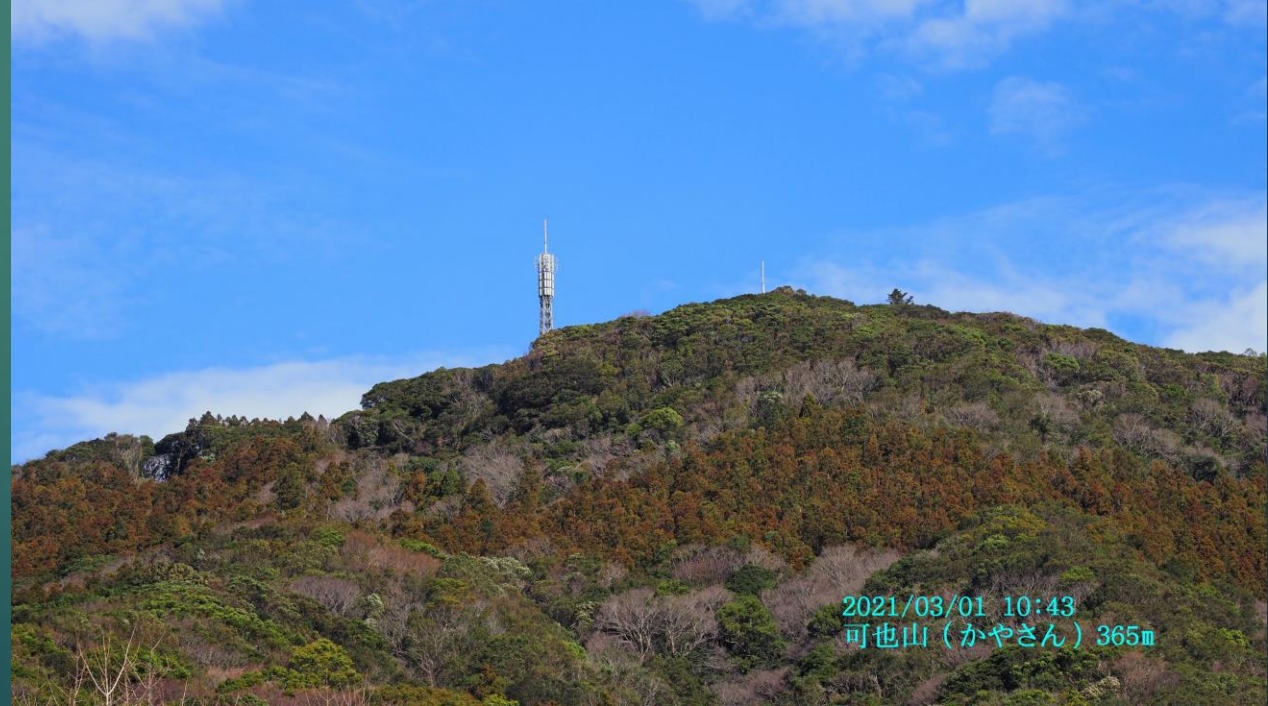
2021/03/01 10:43 可也山 (かやさん) 365m