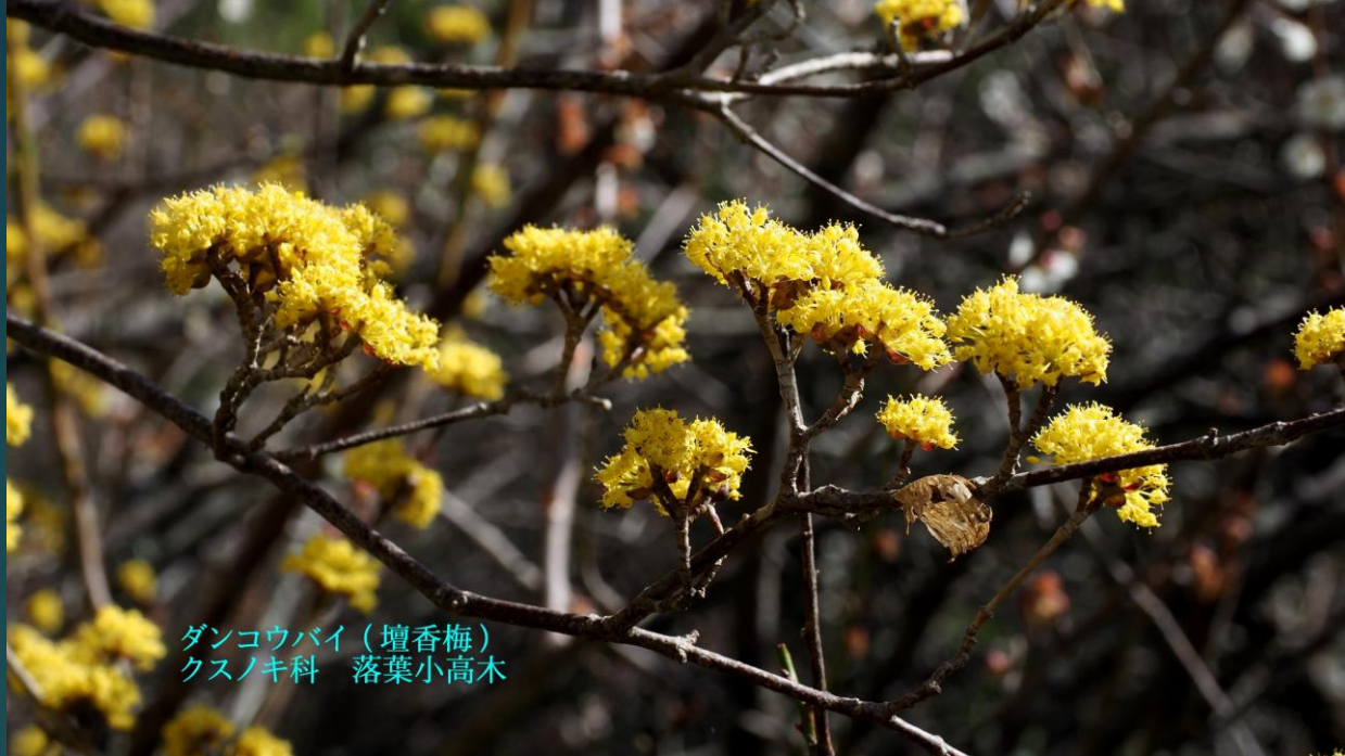
ダンコウバイ (壇香梅) クスノキ科 落葉小高木