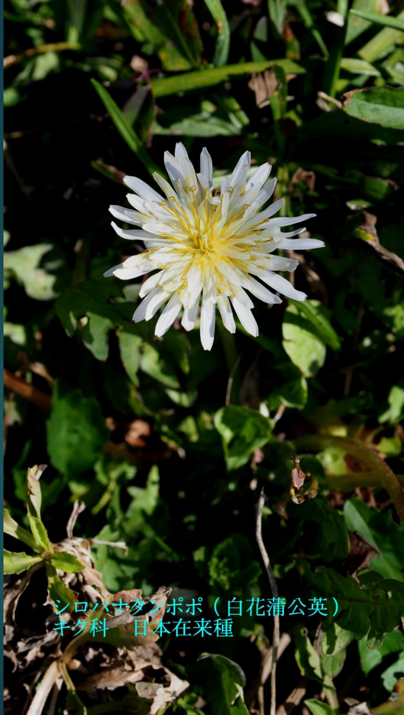
シロバナタンポポ (白花蒲公英) キク科 日本在来種