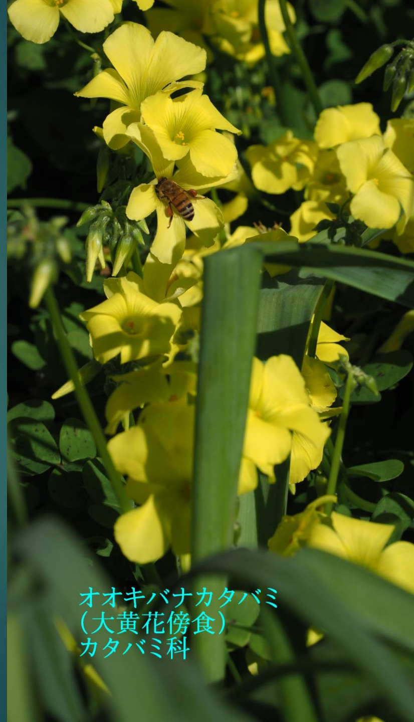
オオキバナカタバミ (大黄花傍食) カタバミ科