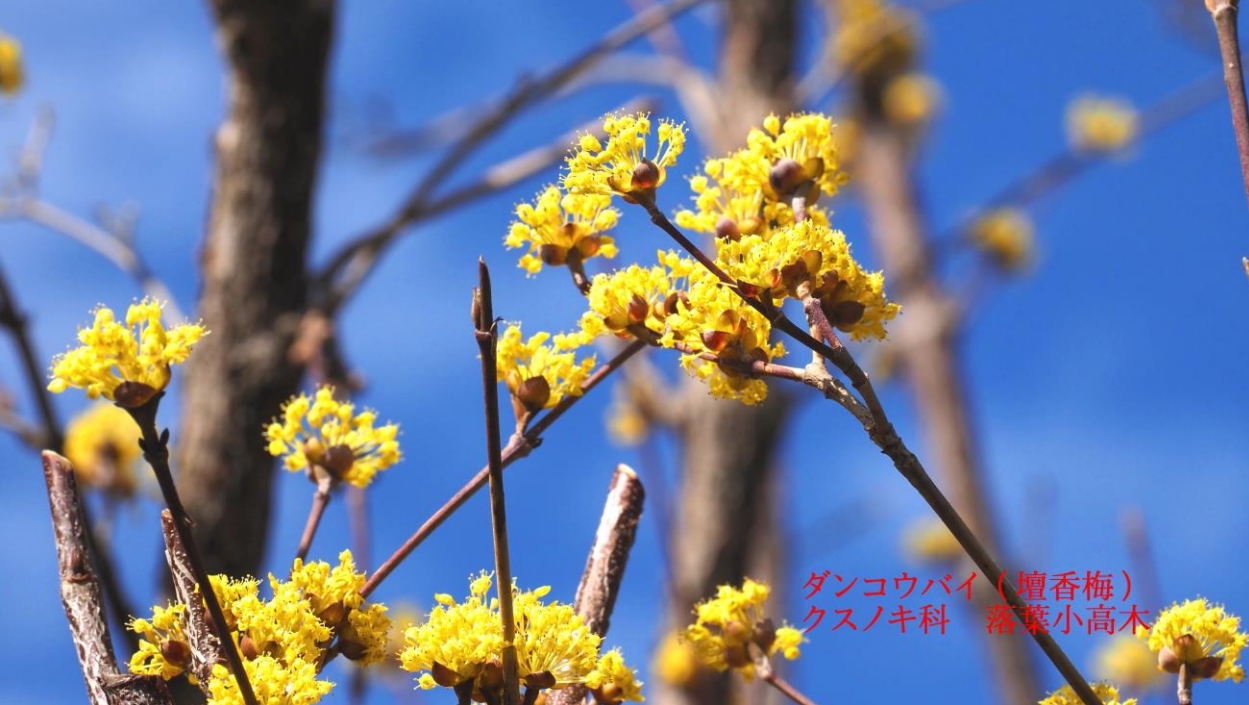
ダンコウバイ (壇香梅) クスノキ科 落葉小高木