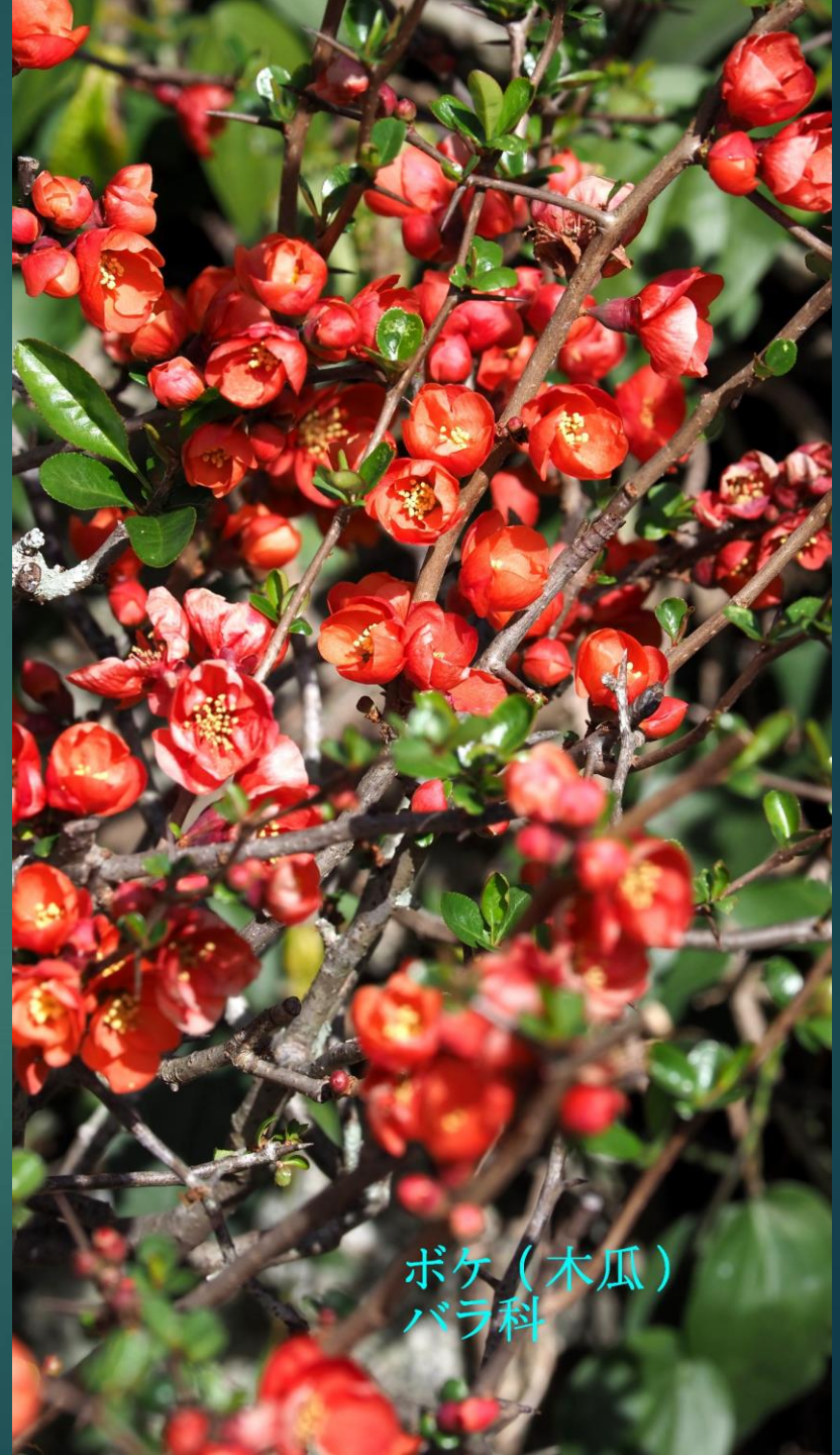
ボケ (木瓜) バラ科