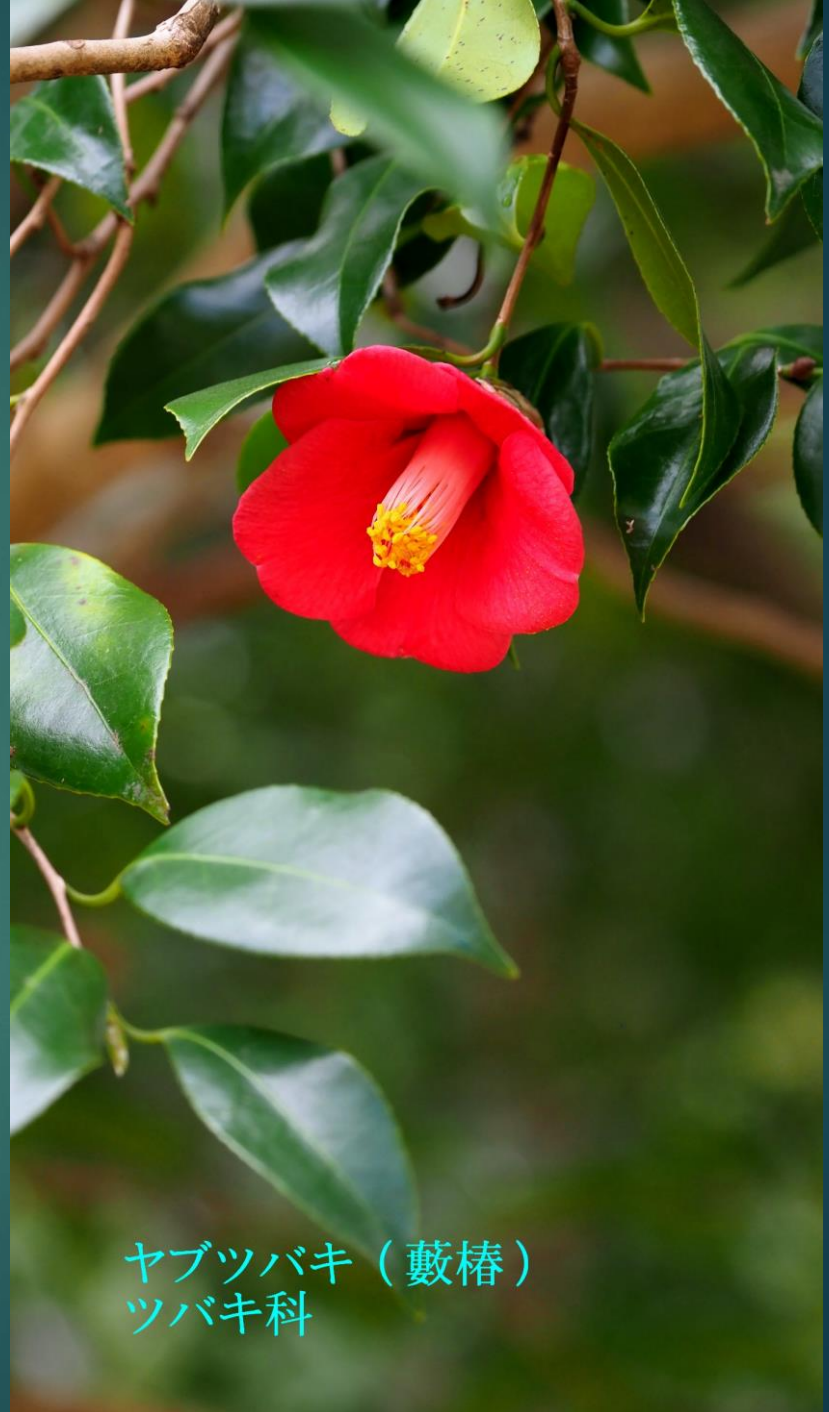
ヤブツバキ (藪椿) ツバキ科