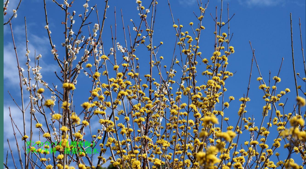
ダンコウバイ(壇香梅) クスノキ科 落葉小高木