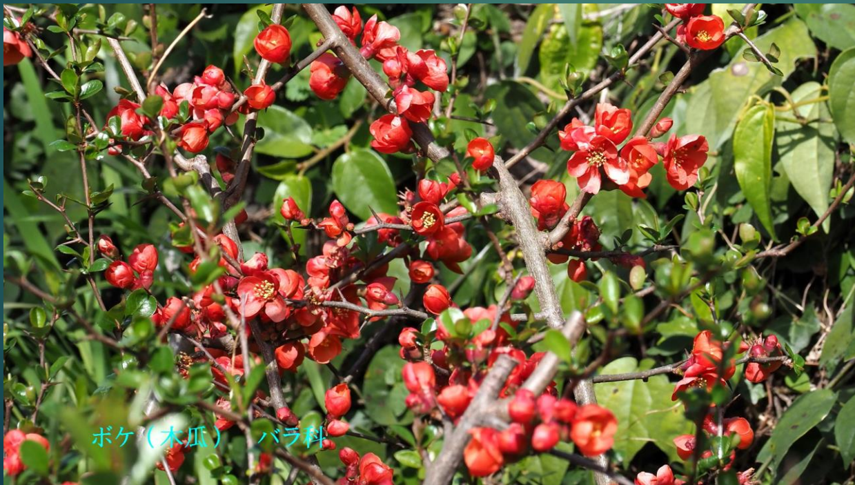
ボケ (木瓜) バラ科