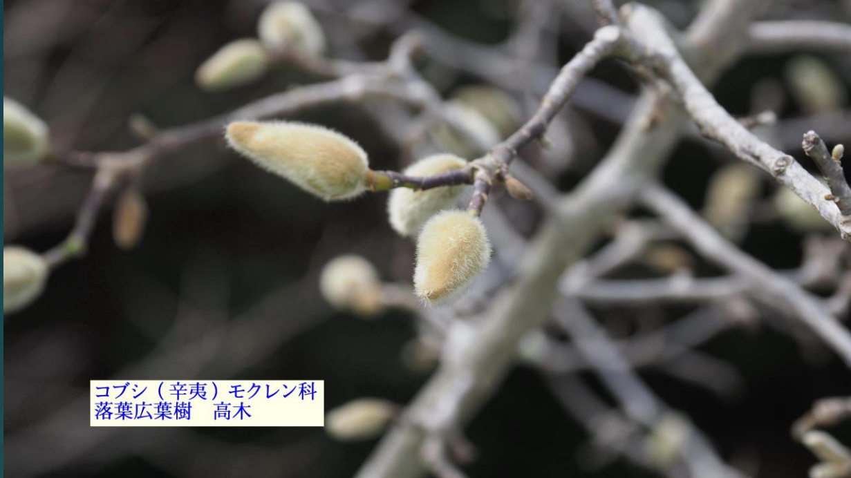
コブシ (辛夷) モクレン科 落葉広葉樹 高木