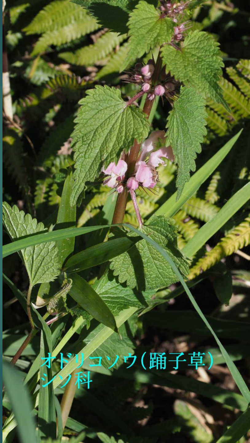
オドリコソウ (踊子草) シソ科