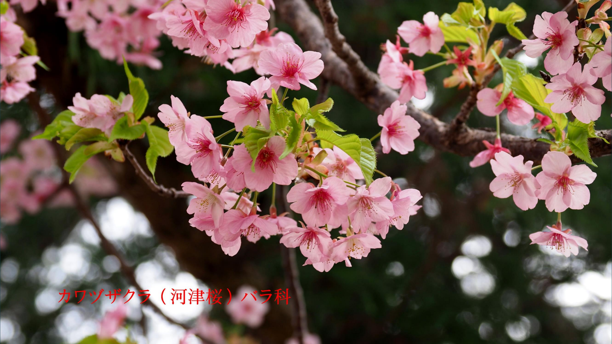
カワヅザクラ（河津桜）バラ科