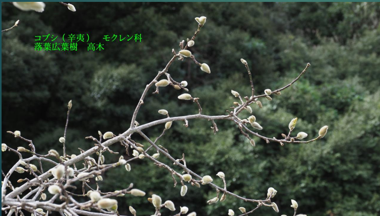
コブシ (辛夷) モクレン科 落葉広葉樹 高木