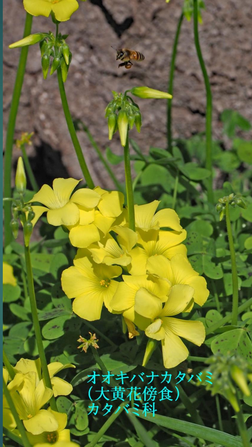
オオキバナカタバミ (大黄花傍食) カタバミ科