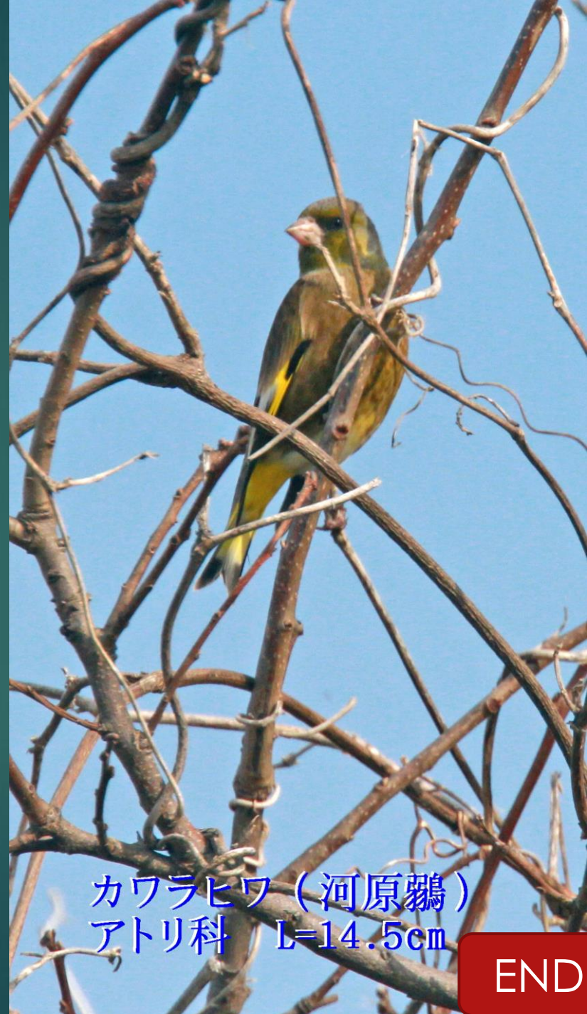
カワラヒワ (河原鶉) アトリ科 L=14.5cm