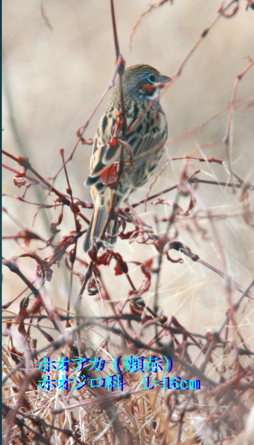
ホオアカ (頬赤) ホオジロ科 L=16cm