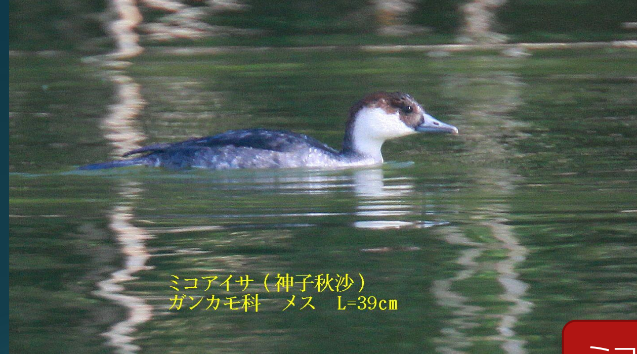
ミコアイサ (神子秋沙) ガンカモ科 メス L=39cm