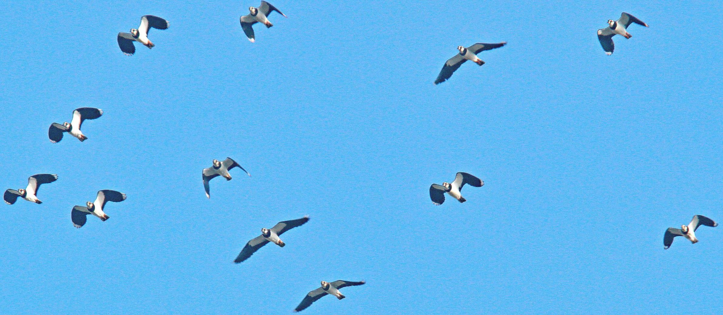
タゲリ（田鳧） チドリ科 L=32cm