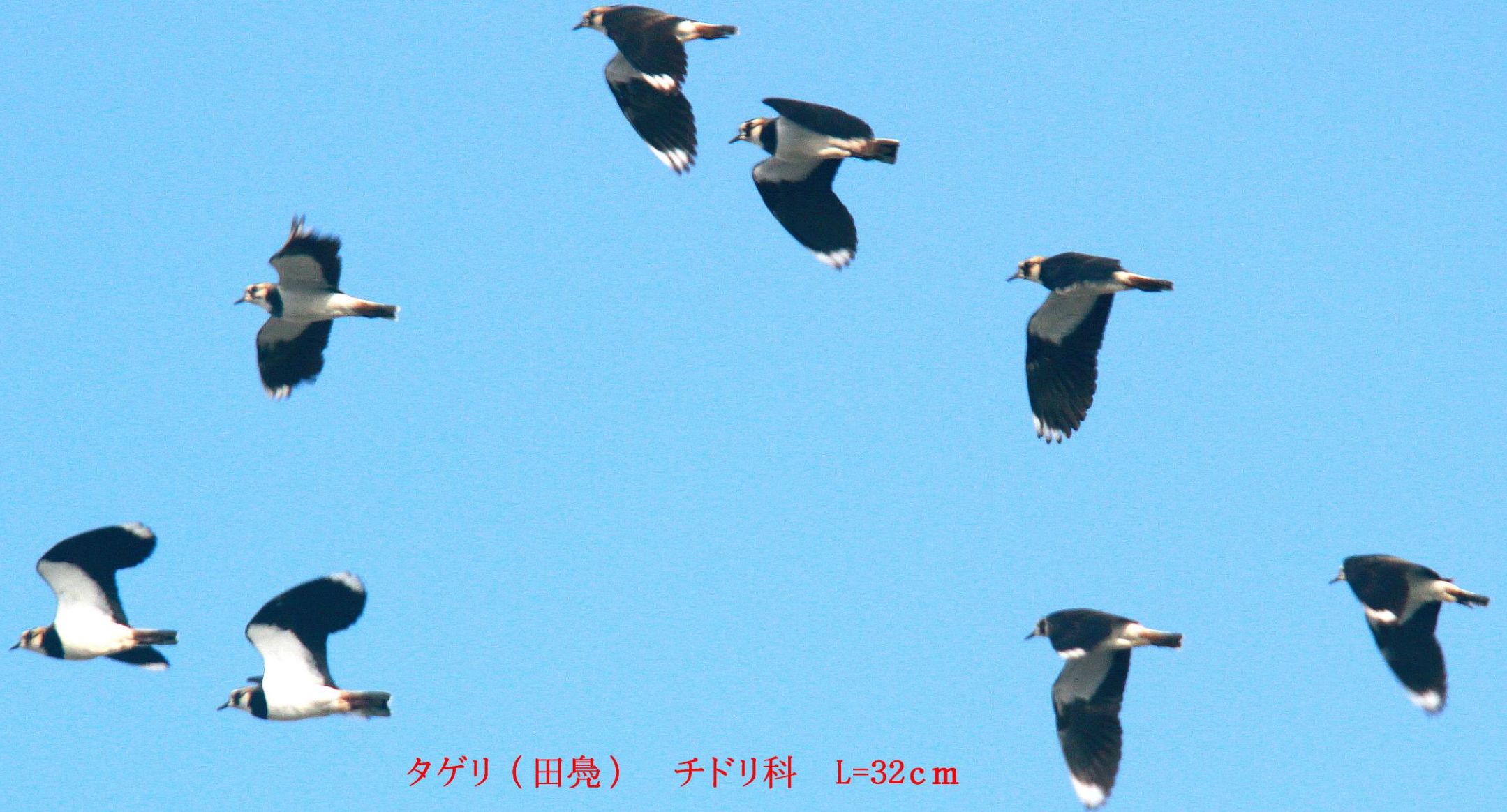
タゲリ (田嶋) チドリ科 L=32cm