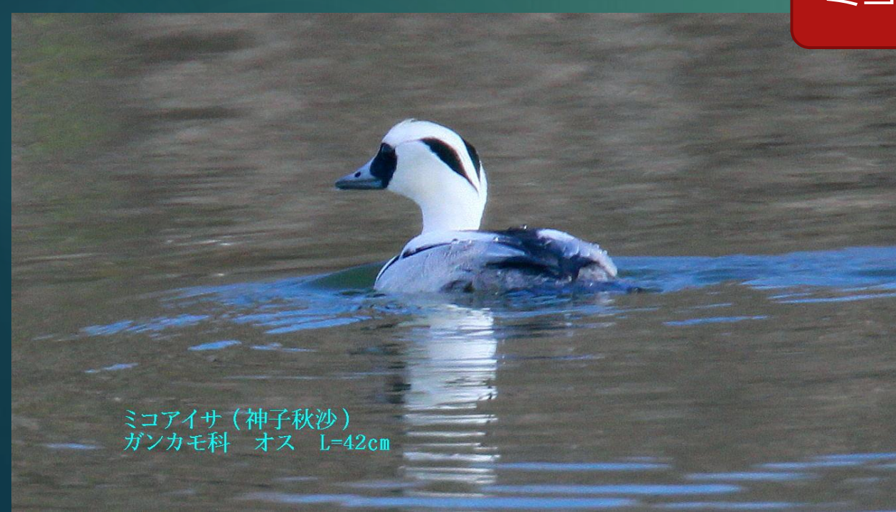
ミコアイサ (神子秋沙) ガンカモ科 オス L=42cm