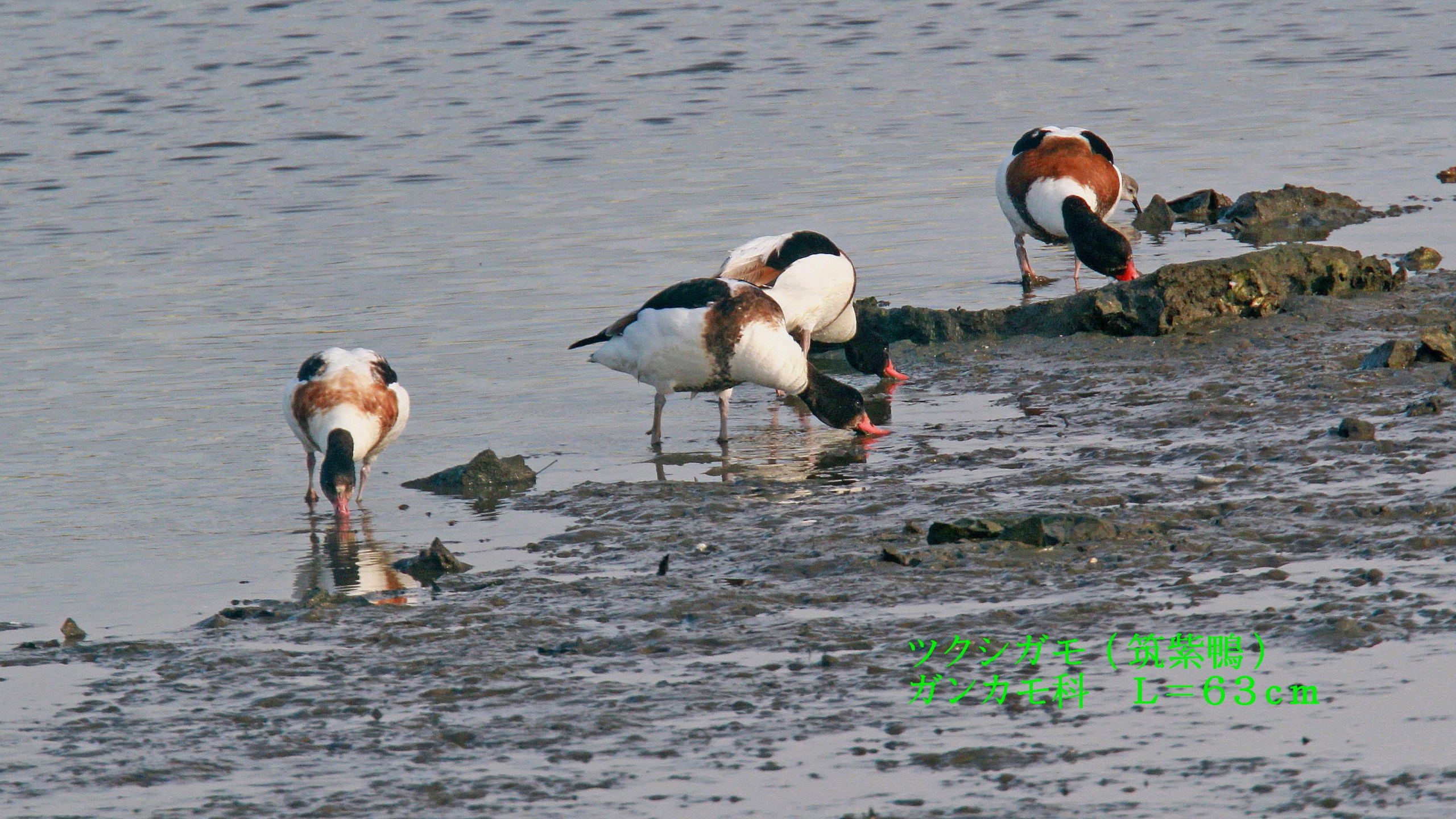
ツクシガモ (筑紫鴨) ガンカモ科 L=63cm