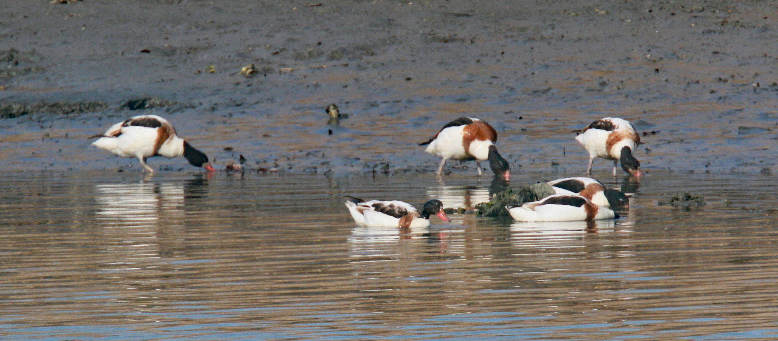
ツクシガモ（筑紫鴨） ガンカモ科 L=63cm