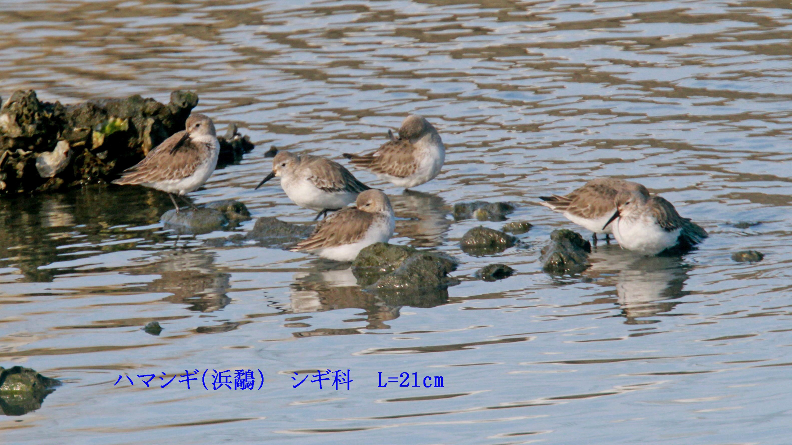
ハマシギ(浜鹬) シギ科 L=21cm