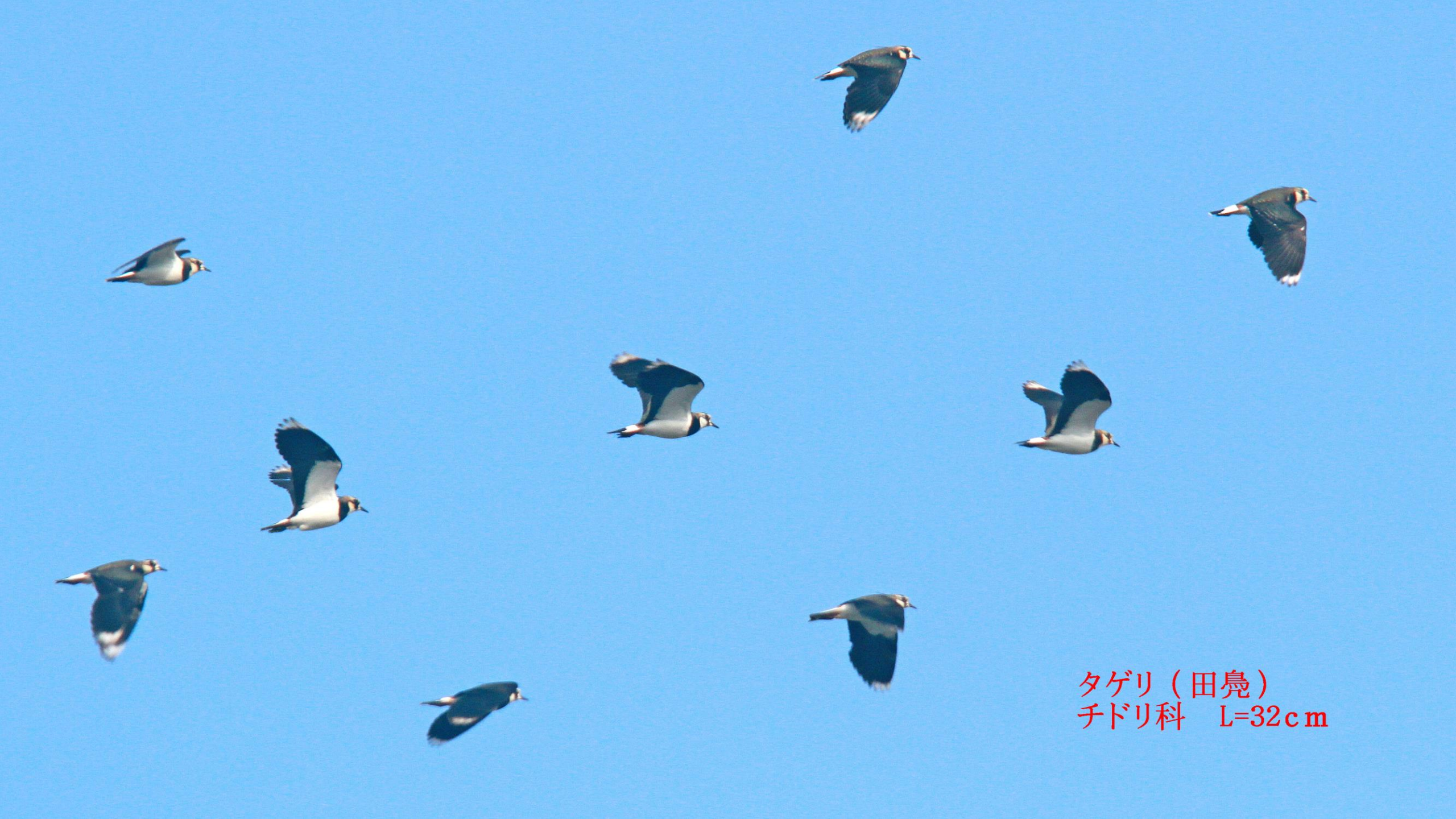
タゲリ (田鳧) チドリ科 L=32cm