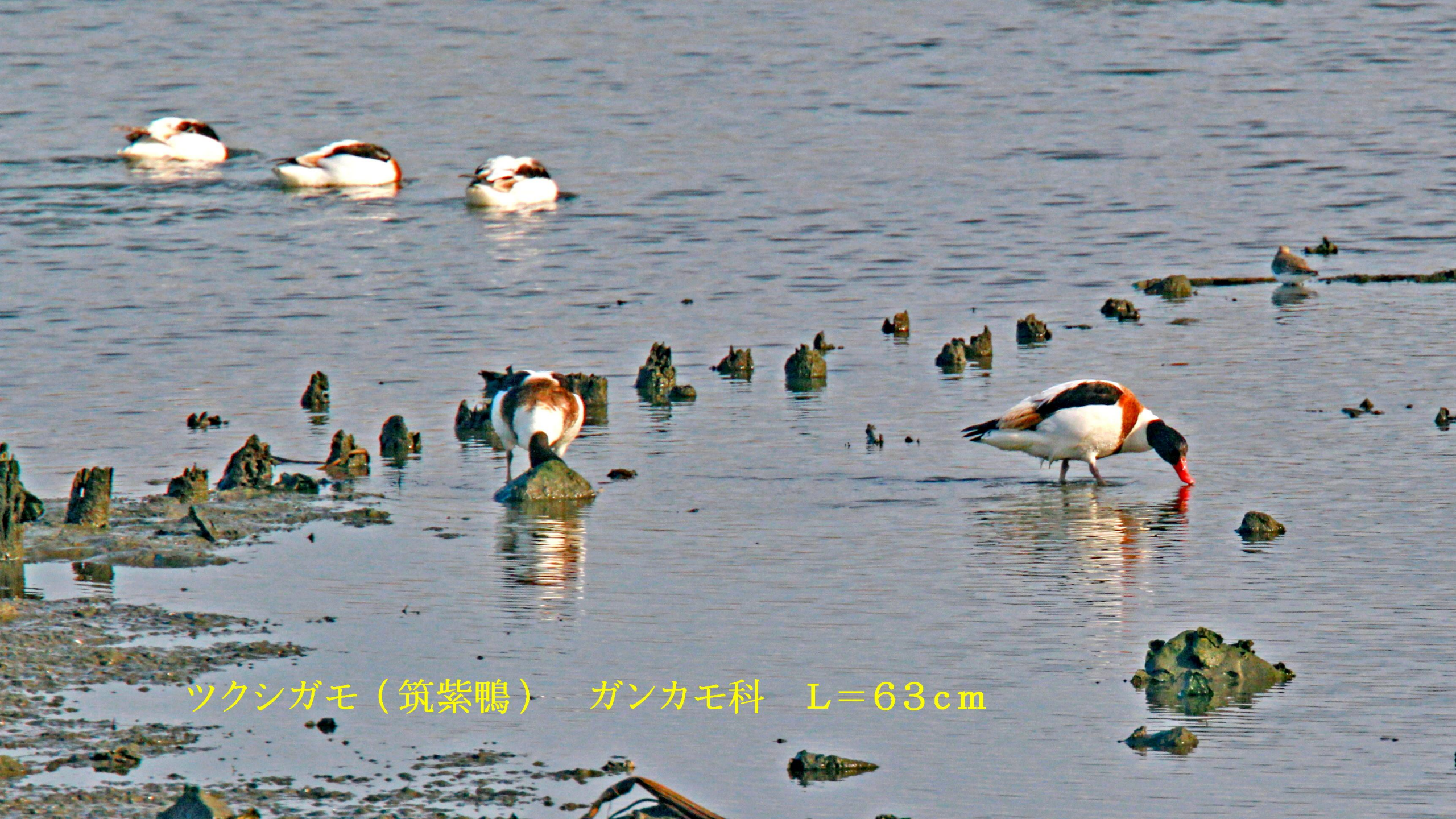
ツクシガモ（筑紫鴨） ガンカモ科 L=63cm