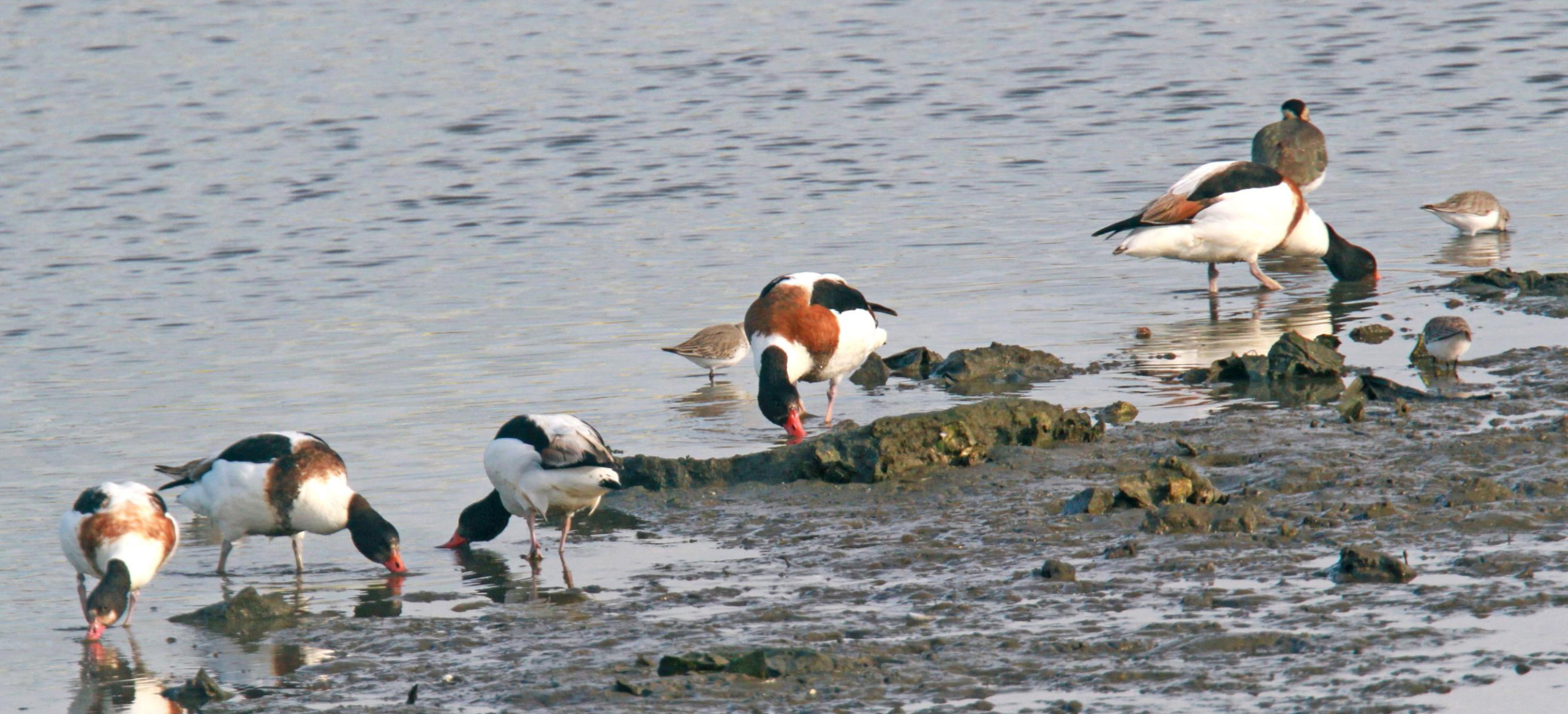
ツクシガモ（筑紫鴨） ガンカモ科 L=63cm