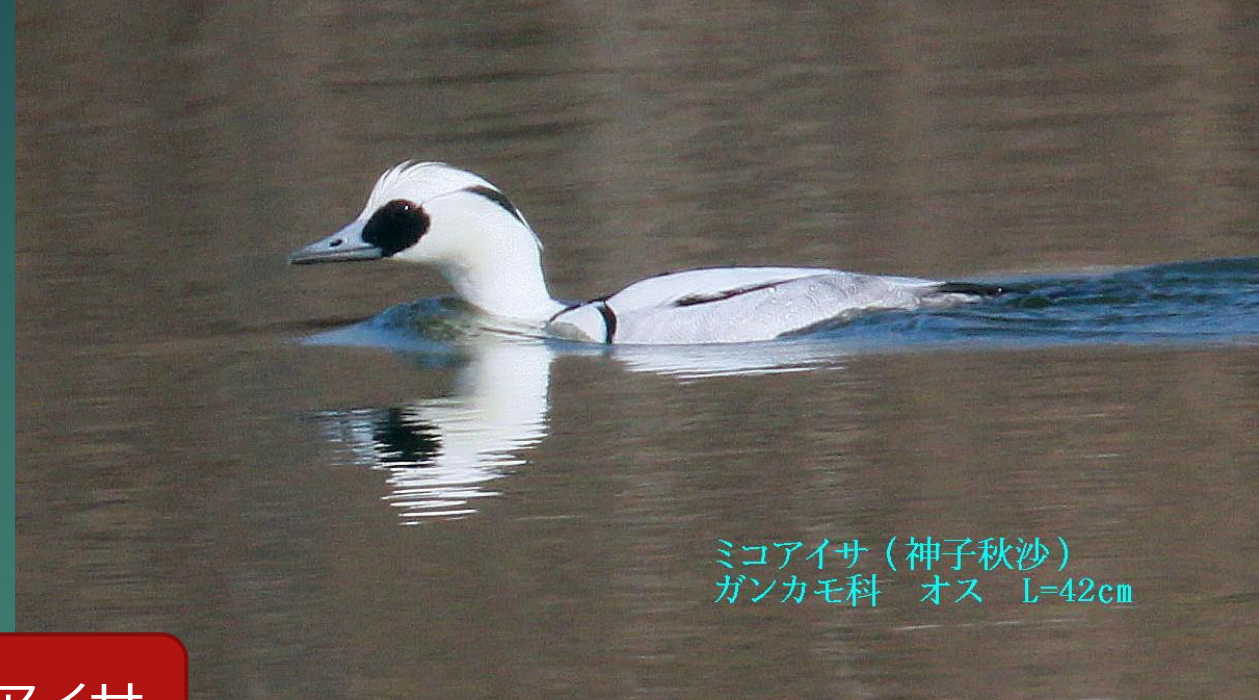
ミコアイサ (神子秋沙) ガンカモ科 オス L=42cm