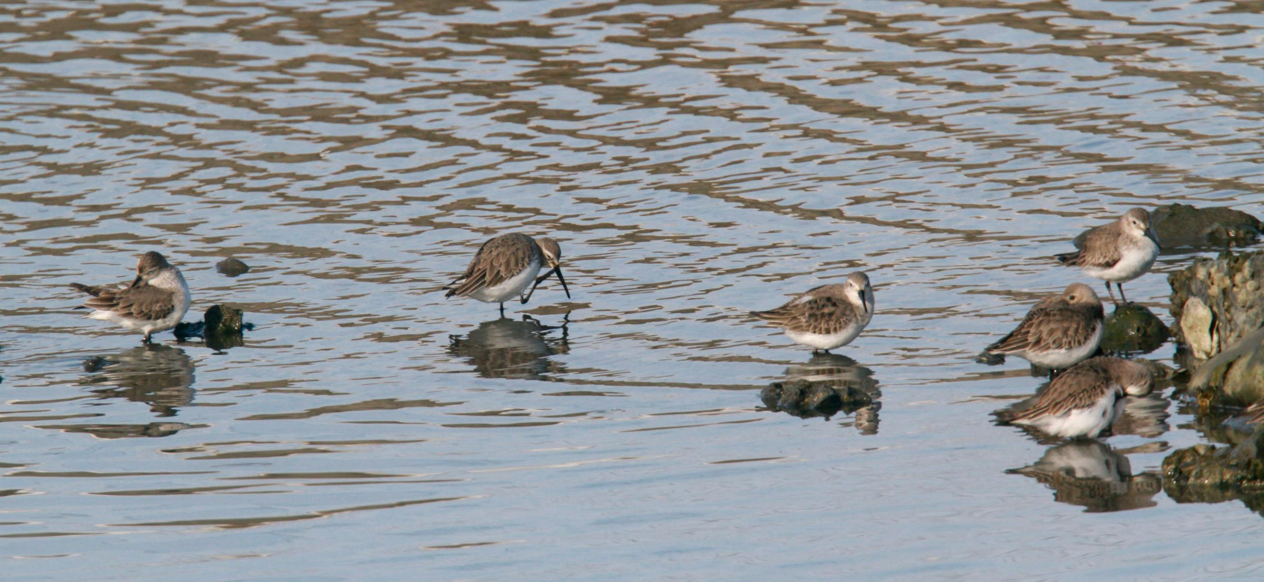
ハマシギ(浜鹬) シギ科 L=21cm