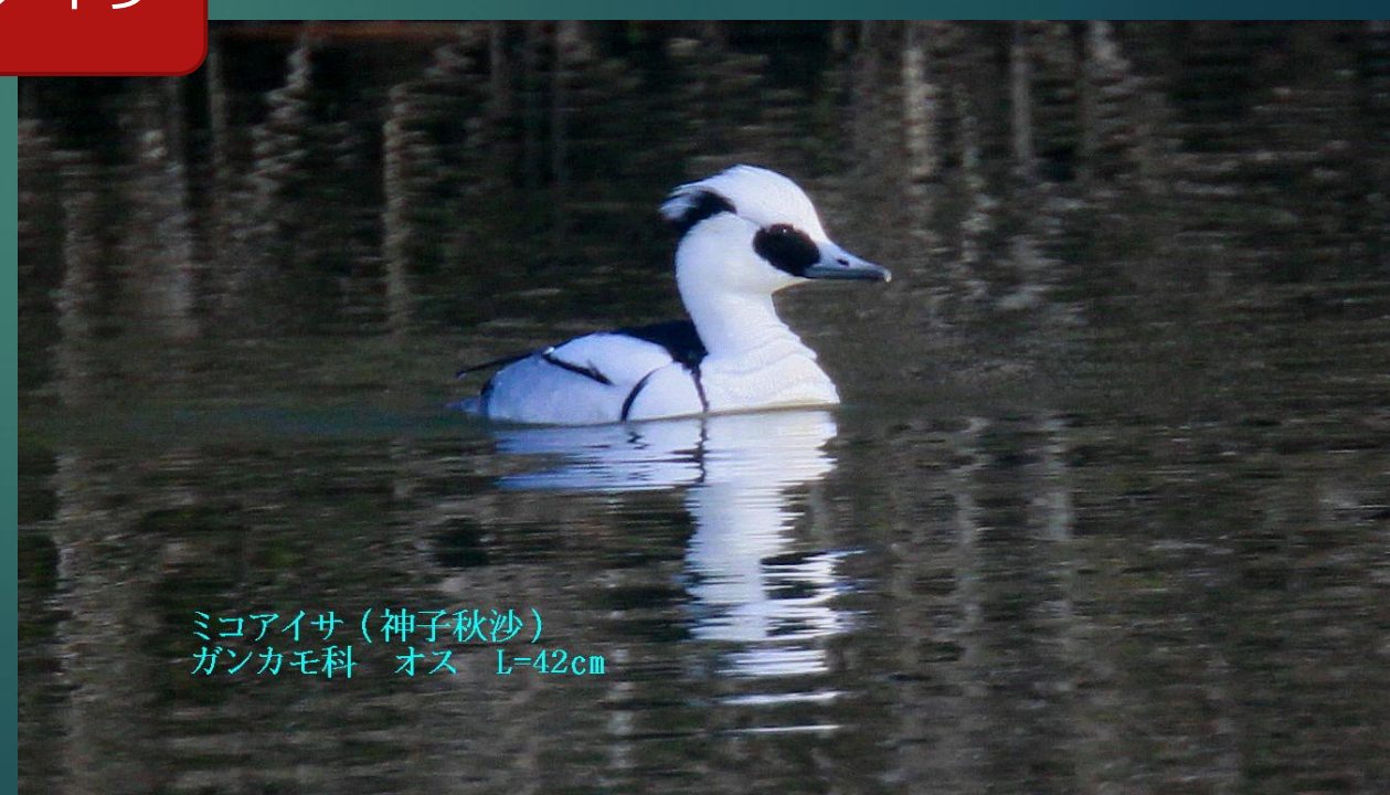
ミコアイサ (神子秋沙) ガンカモ科 オス L=42cm