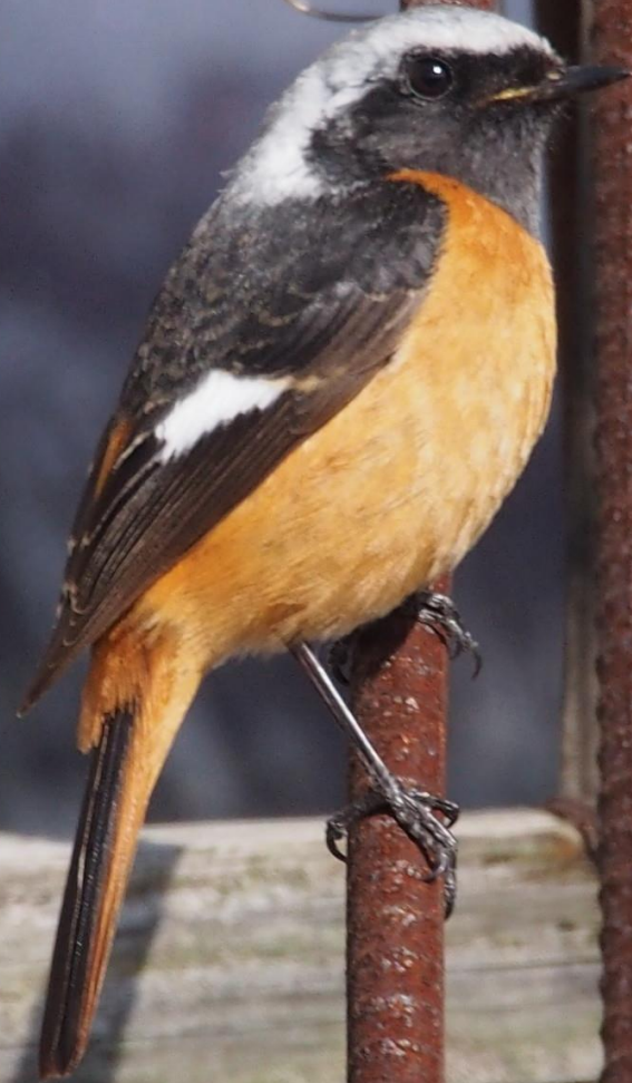
ジョウビタキ(尉鶺)オス ヒタキ科 L=14cm