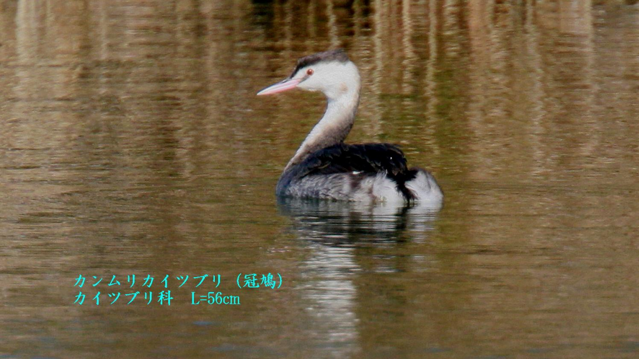
カンムリカイツブリ (冠鳩) カイツブリ科 L=56cm