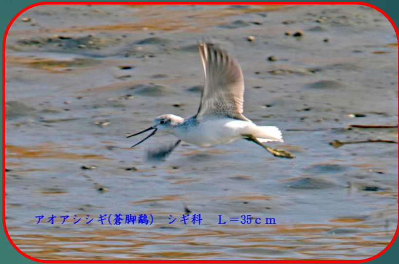
アオアシシギ(蒼脚鶴) シギ科 L=35cm