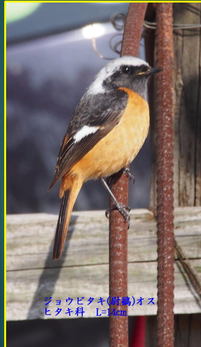
ジョウビタキ(耐鷺)オス ヒタキ科 L=14cm