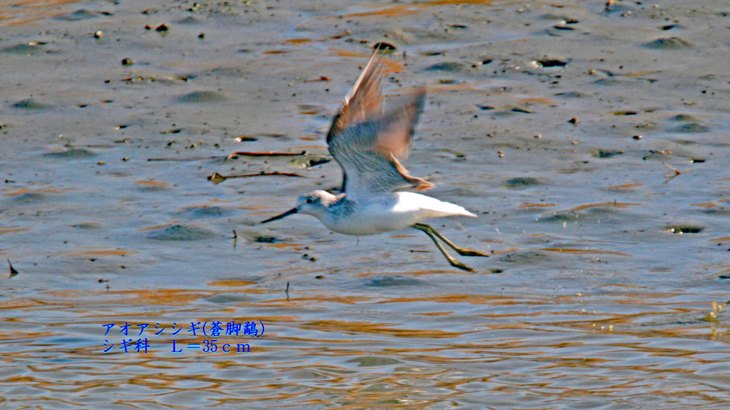
アオアシシギ(蒼脚鷗) シギ科 L=35cm