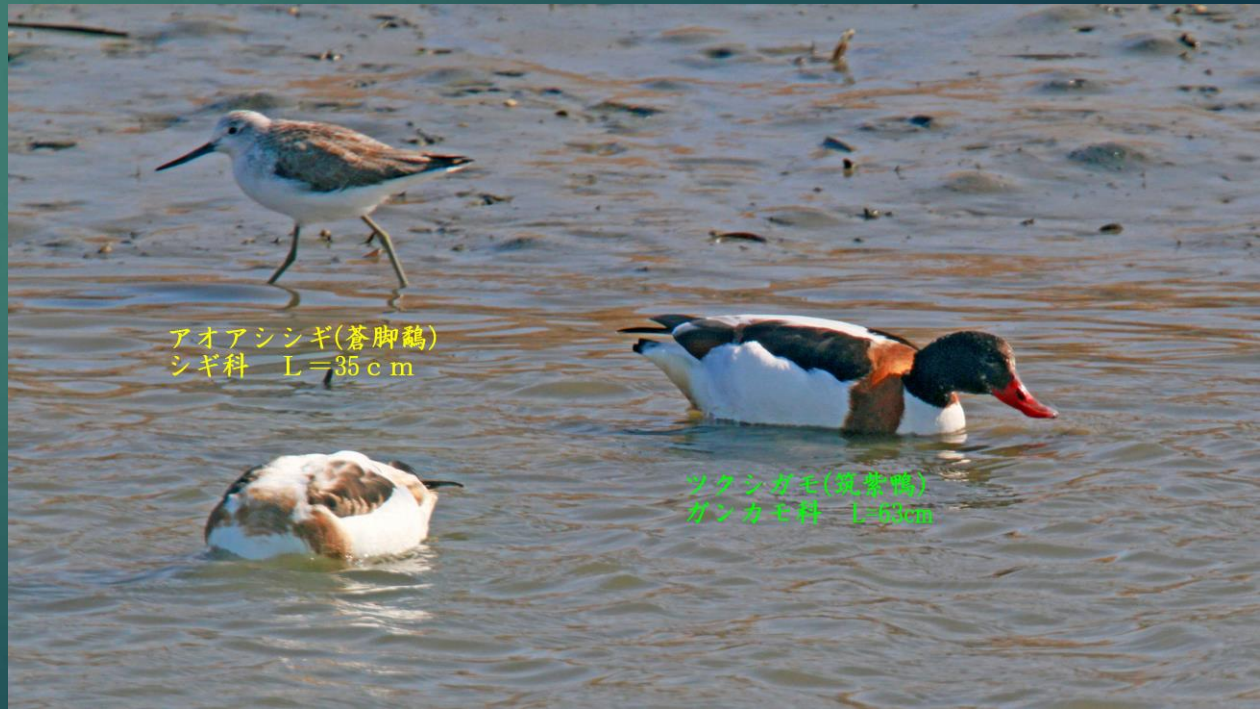
アオアシシギ(蒼脚鵞) シギ科 L=35cm