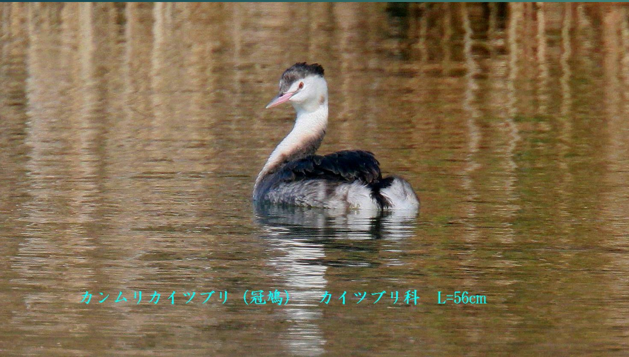
カンムリカイツブリ (冠鳩) カイツブリ科 L=56cm