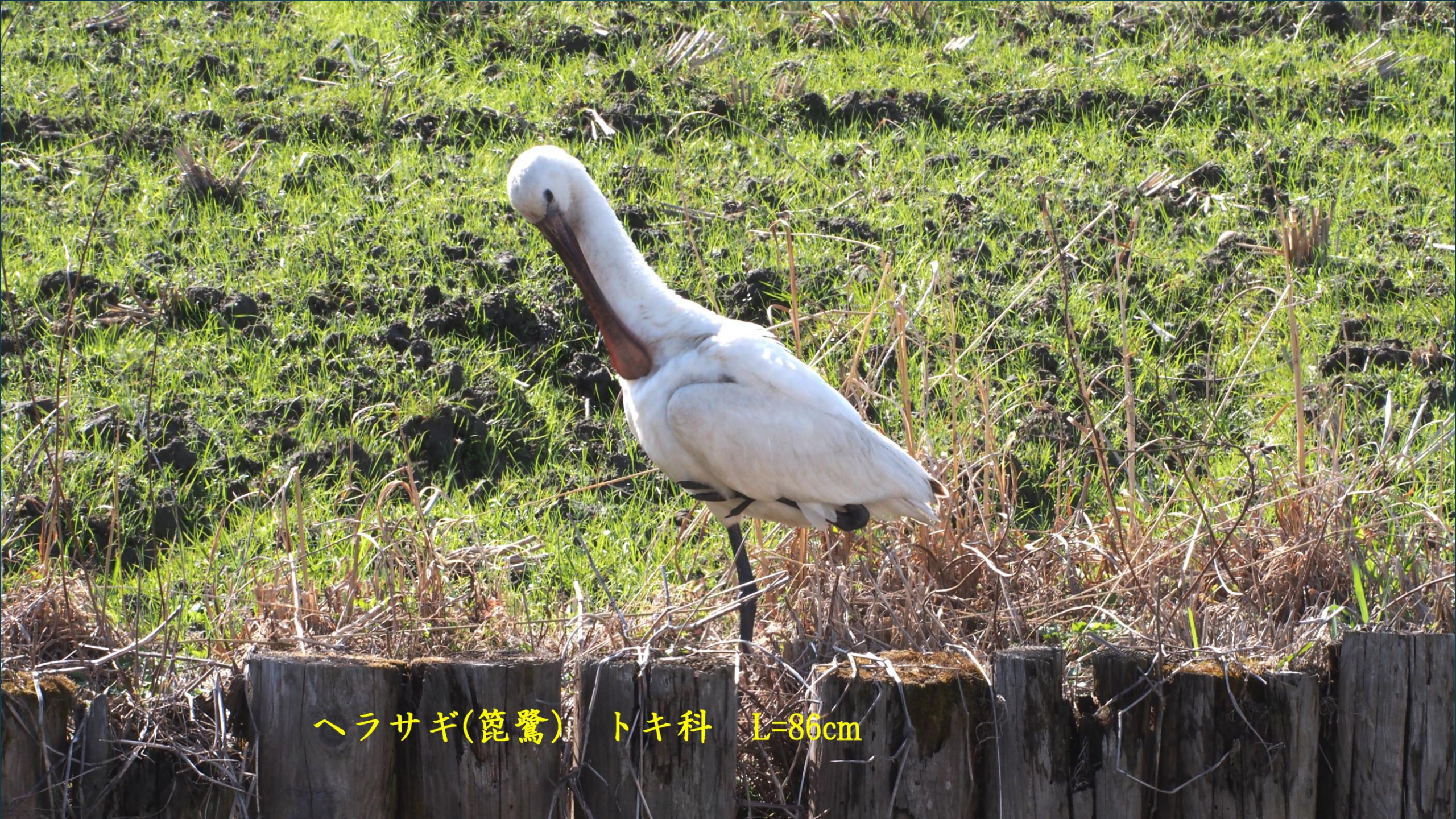
ヘラサギ(篋鷺) トキ科 L=86cm