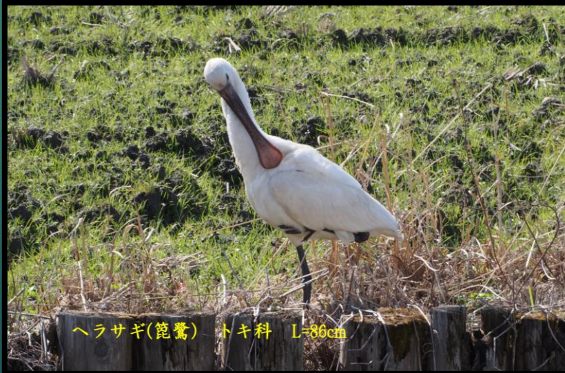
ヘラサギ(篋鷺) トキ科 L=86cm