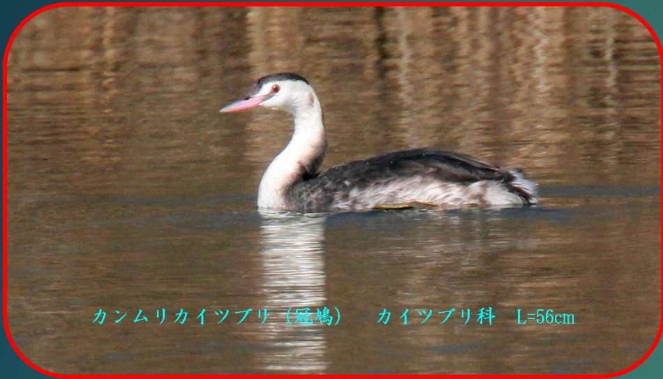
カンムリカイツブリ (冠鳩) カイツブリ科 L=56cm