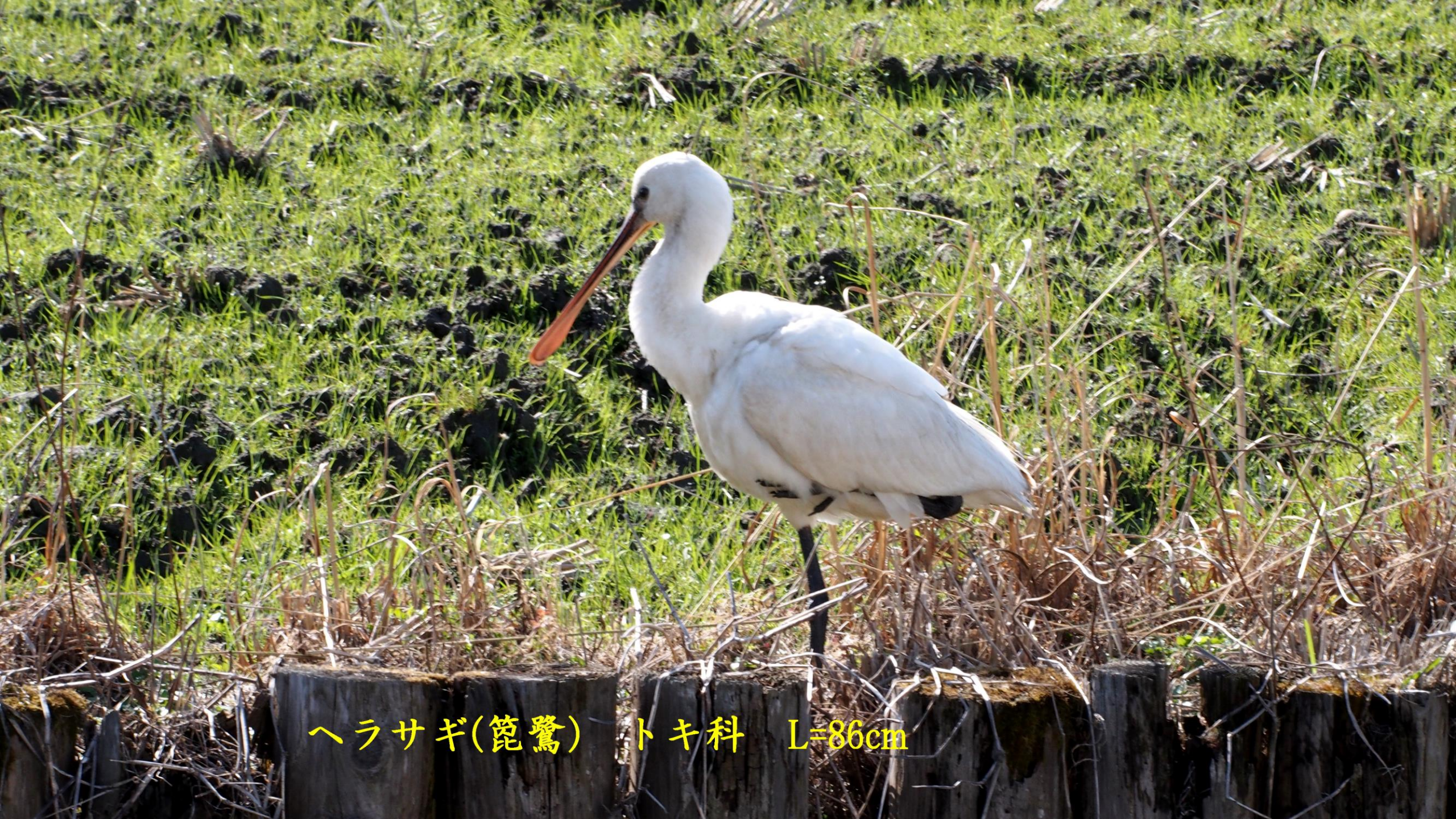
ヘラサギ(篋鷺) トキ科 L=86cm