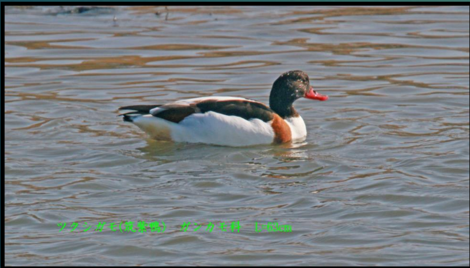
サシガモ(歌麩鴨) ガンカモ科 L=42cm