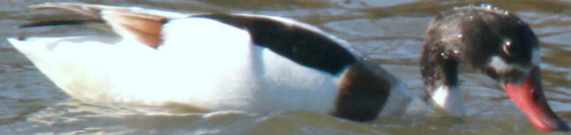
ツクシガモ(筑紫鴨) ガンカモ科 L=63cm