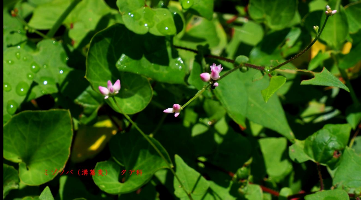
ミゾソバ(溝蕎麦) タデ科