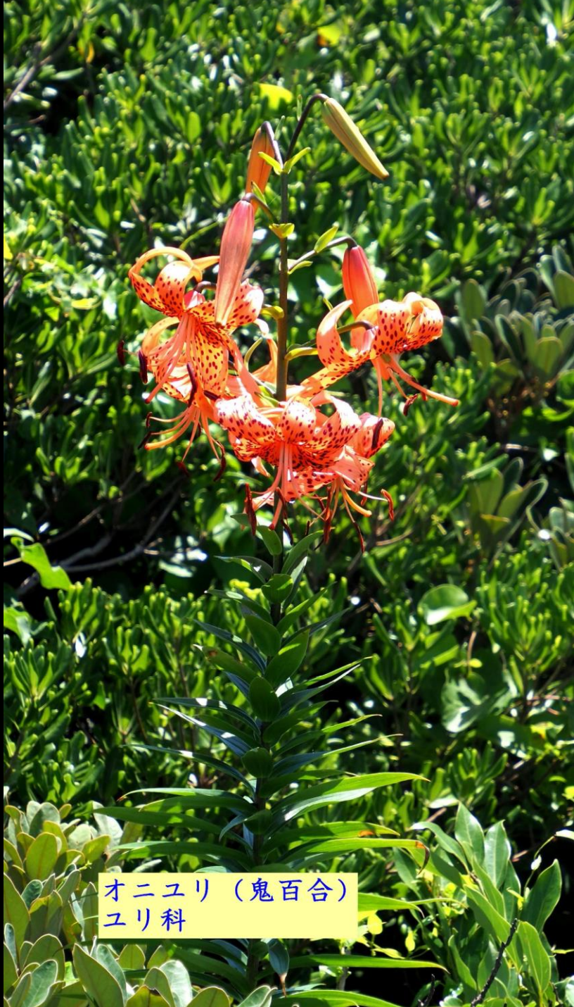
オニユリ (鬼百合) ユリ科