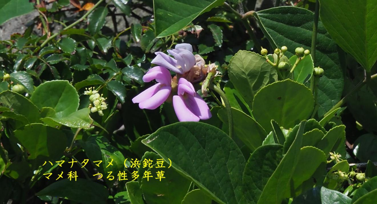
ハマナタマメ (浜鈍豆) マメ科 つる性多年草