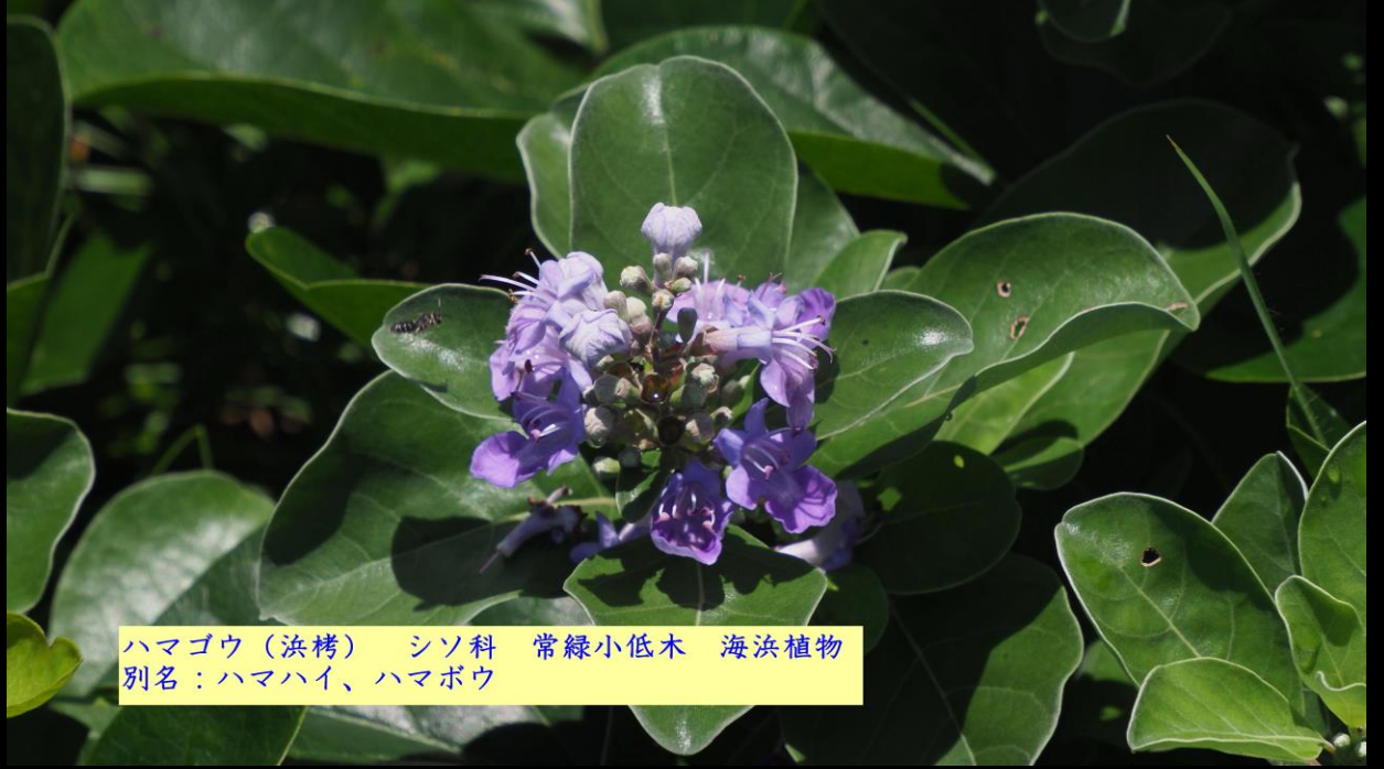
ハマゴウ（浜栲） シソ科 常緑小低木 海浜植物 別名：ハマハイ、ハマボウ