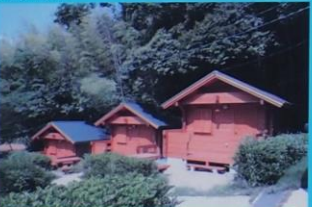
芥屋キャンプ場 Keya Campsite