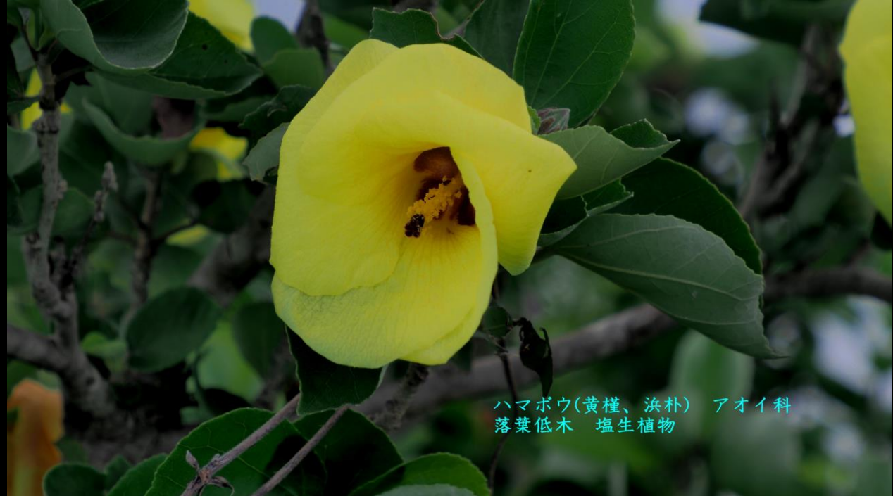
ハマボウ(黄槿、浜朴) アオイ科 落葉低木 塩生植物