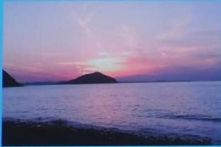
黒磯海岸からの夕日 Sunset from Kurosoo shore