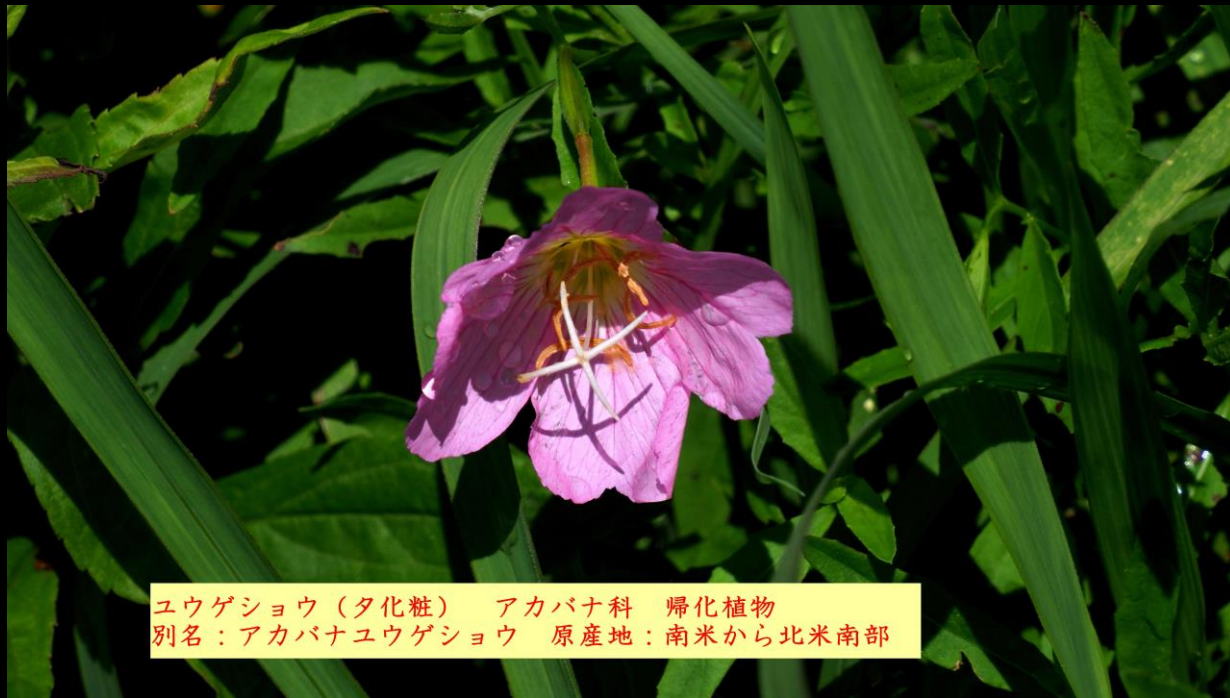
ユウゲショウ (タ化粧) アカバナ科 帰化植物 別名: アカバナユウゲショウ 原産地: 南米から北米南部