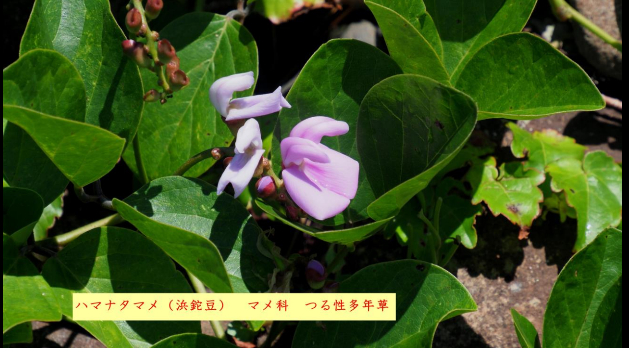
ハマナタマメ (浜鈍豆) マメ科 つる性多年草