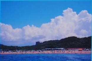
芥屋海水浴場 Keya Bathing Beach