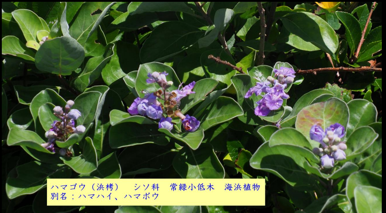
ハマゴウ (浜栲) シソ科 常緑小低木 海浜植物 別名：ハマハイ、ハマボウ