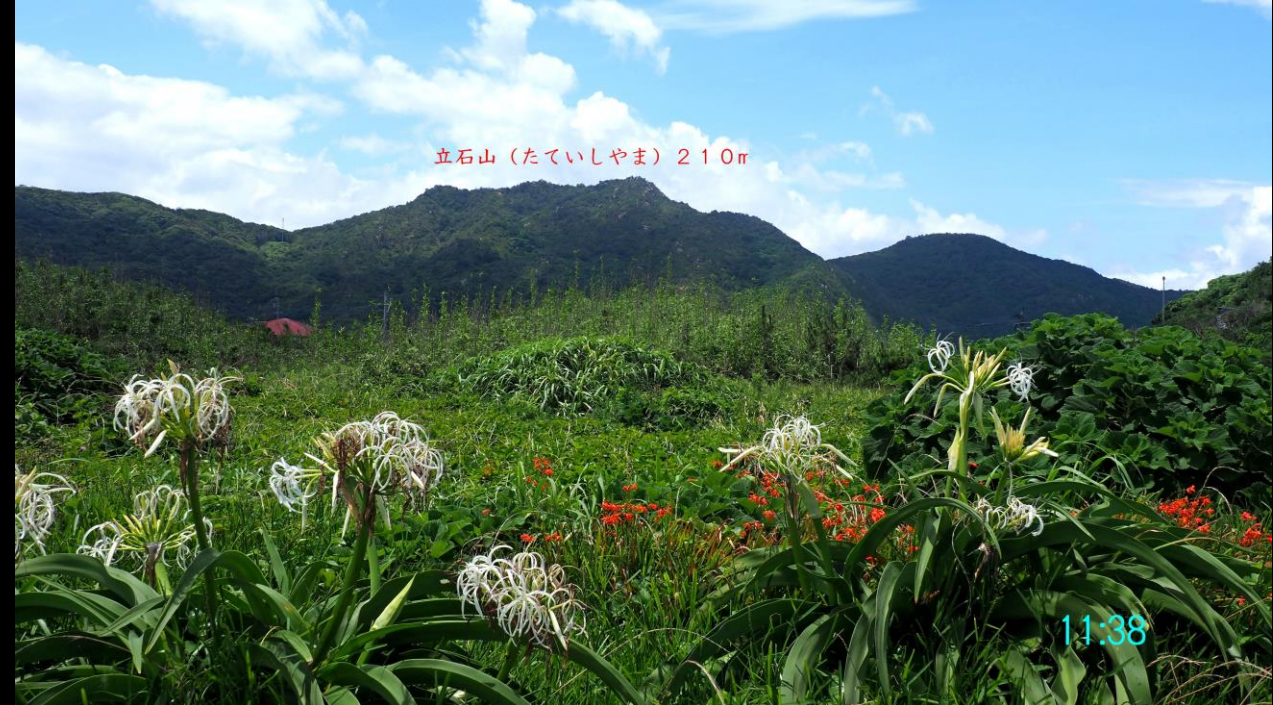
立石山 (たていしやま) 210m