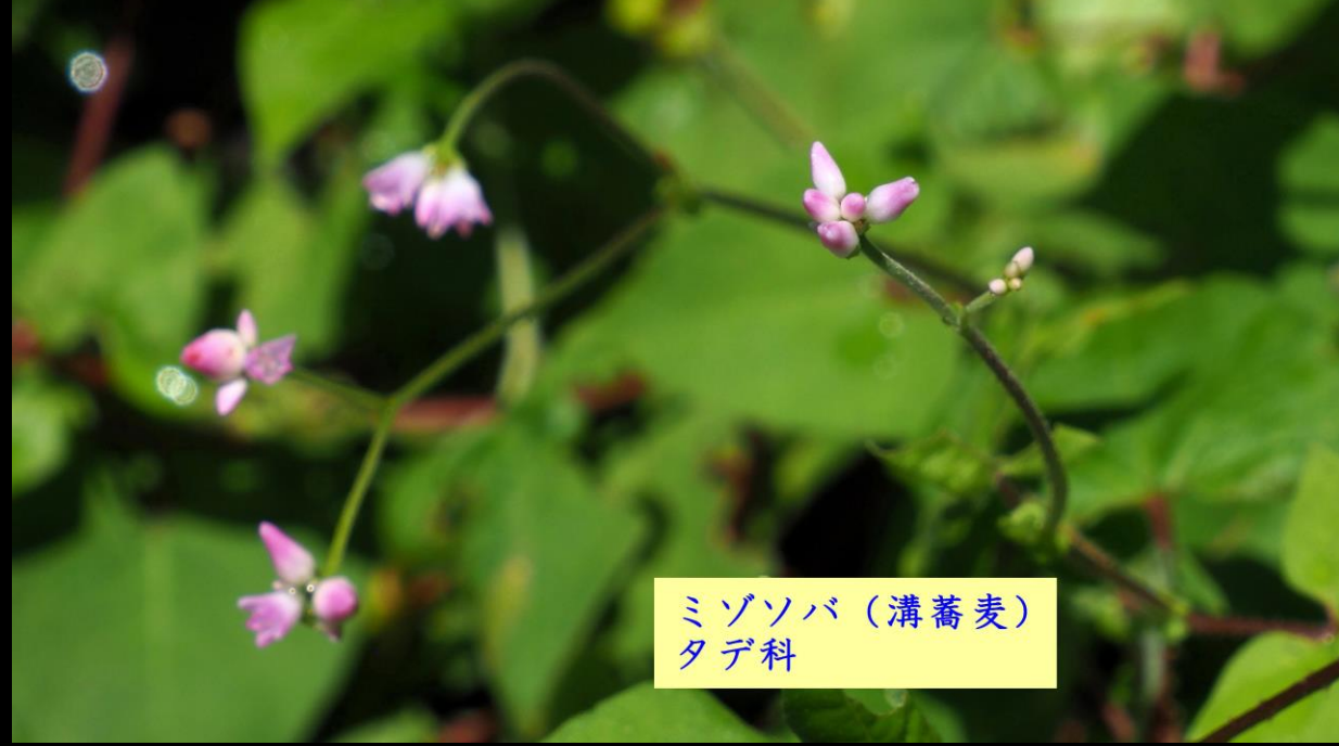
ミゾソバ (溝蕎麦) タデ科