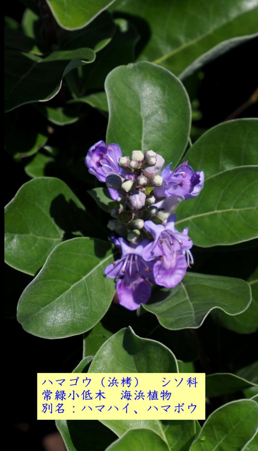
ハマゴウ（浜栲） シソ科 常緑小低木 海浜植物 別名：ハマハイ、ハマボウ