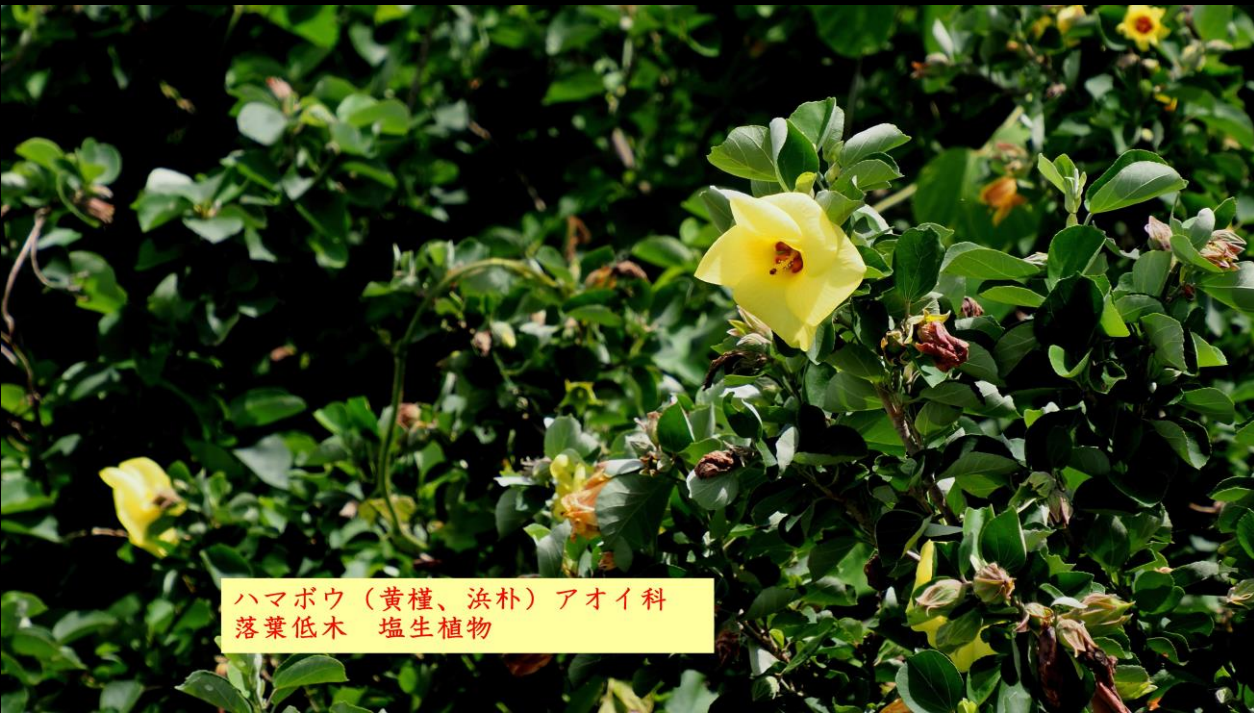
ハマボウ(黄槿、浜朴) アオイ科 落葉低木 塩生植物