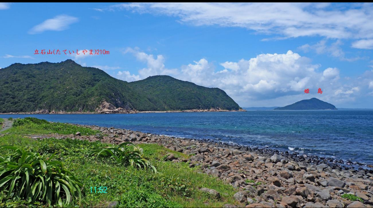
立石山(たていしやま)210m