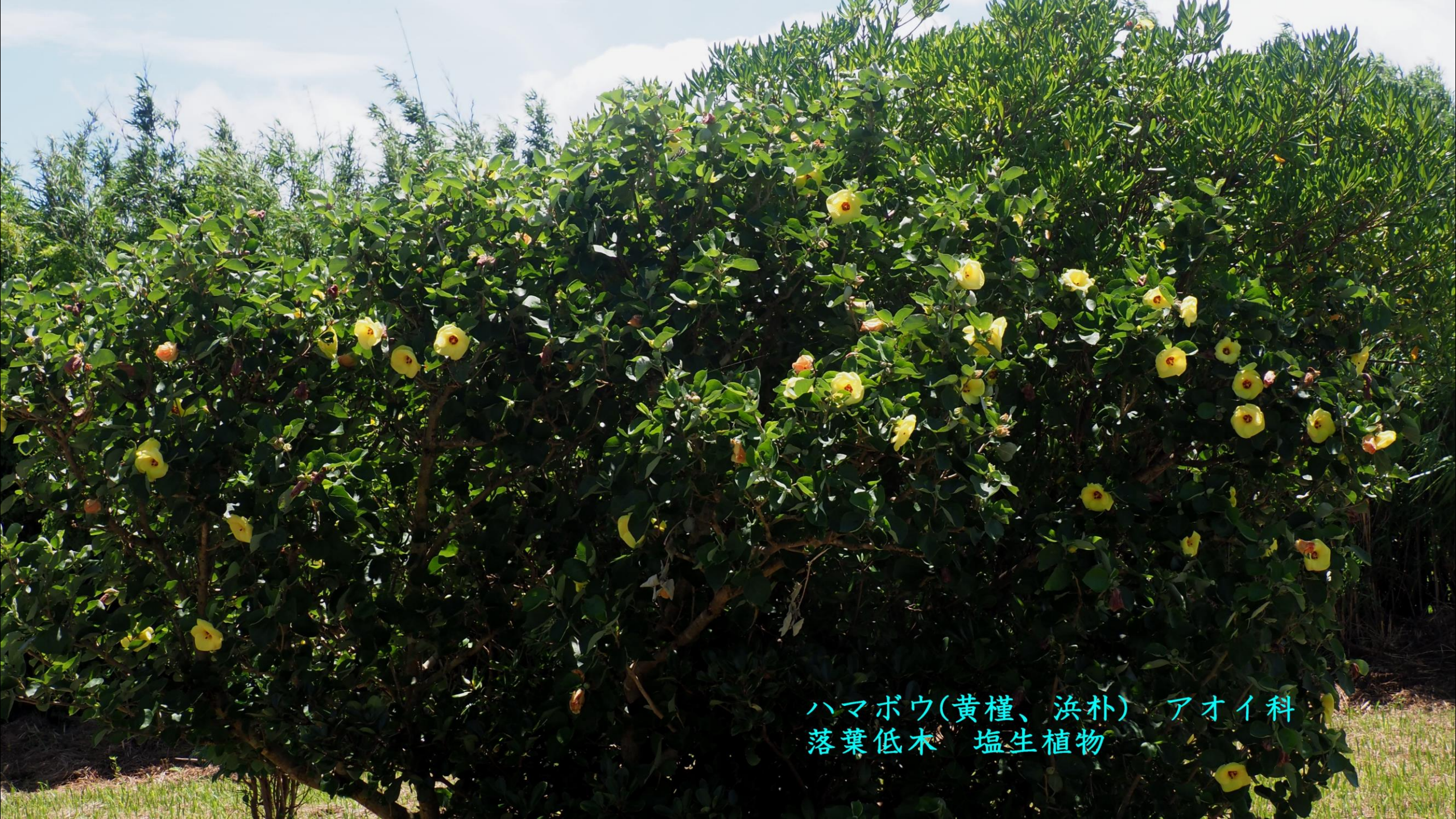
ハマボウ(黄槿、浜朴) アオイ科 落葉低木 塩生植物