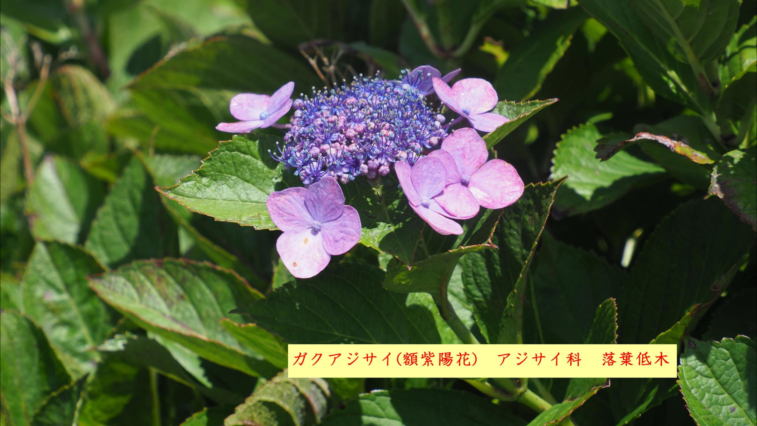
ガクアジサイ(額紫陽花) アジサイ科 落葉低木