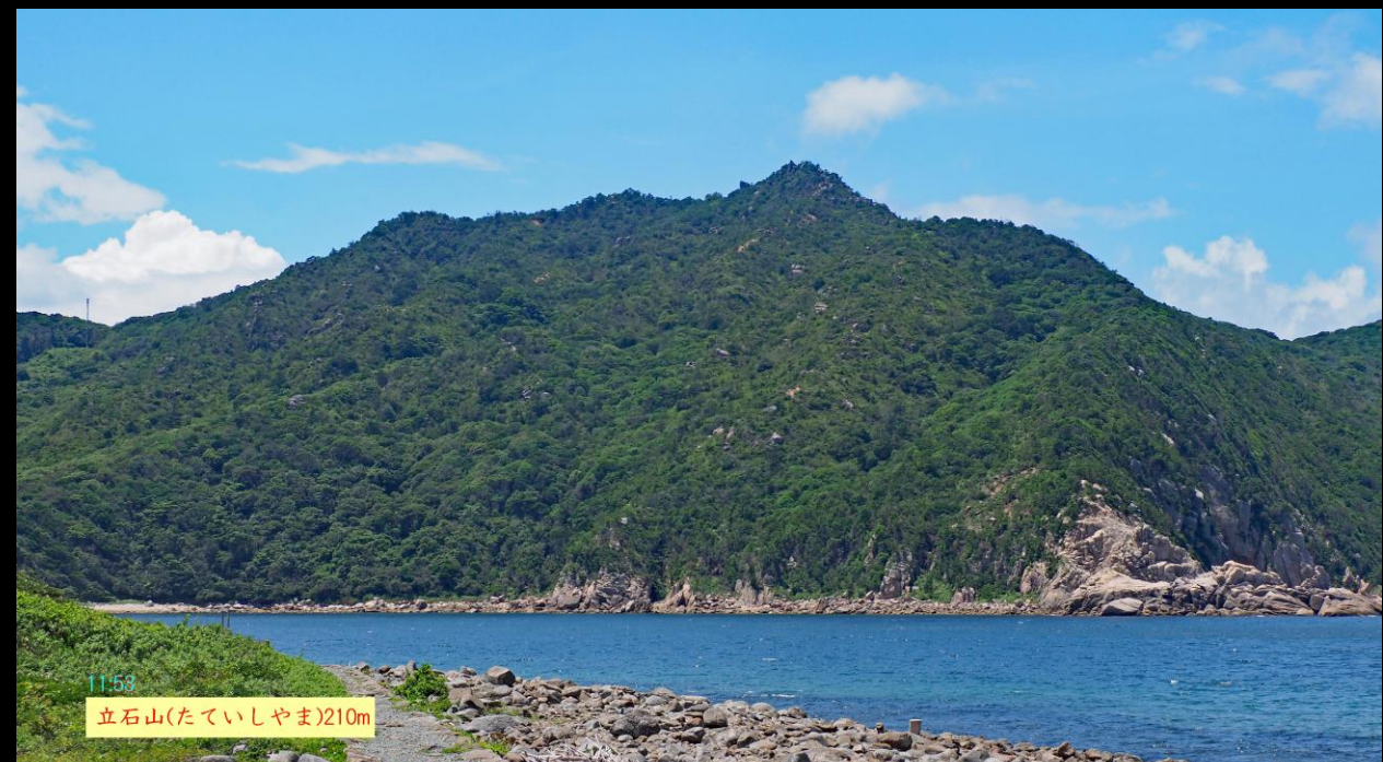
11:58 立石山(たていしやま)210m