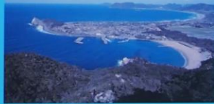
立石山からの展望 View from Mt. Tateishiyama