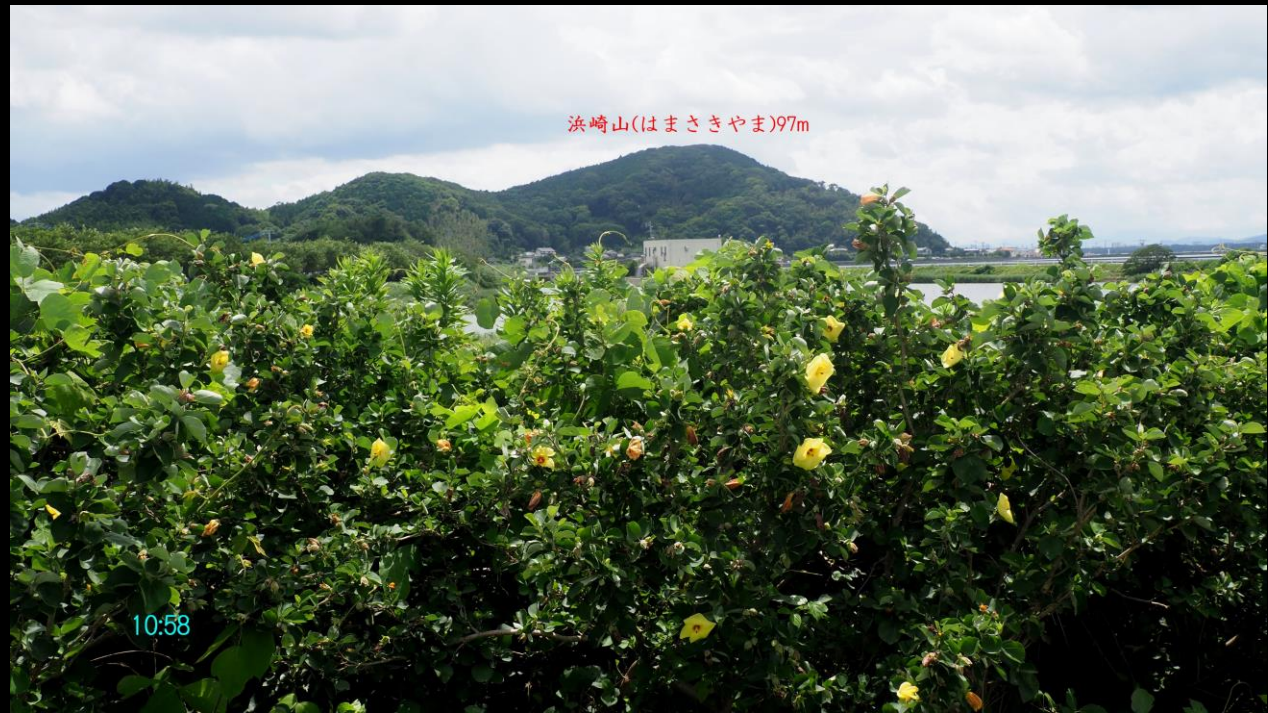
浜崎山(はまさきやま)97m