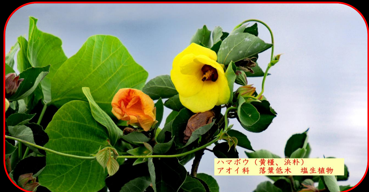
ハマボウ（黄槿、浜朴） アオイ科 落葉低木 塩生植物