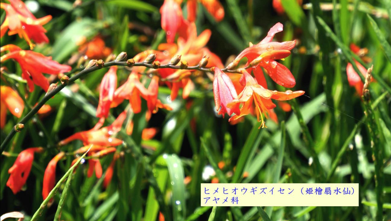
ヒメヒオウギズイセン (姫檜扇水仙) アヤメ科