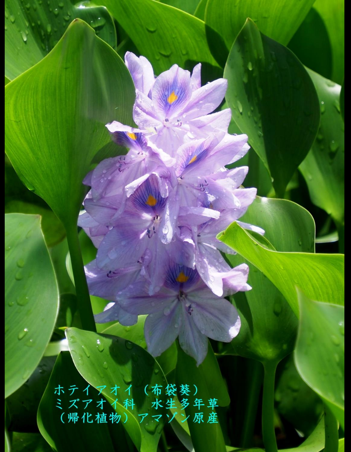
ホテアオイ (布袋葵) ミズアオイ科 水生多年草 (帰化植物) アマゾン原産