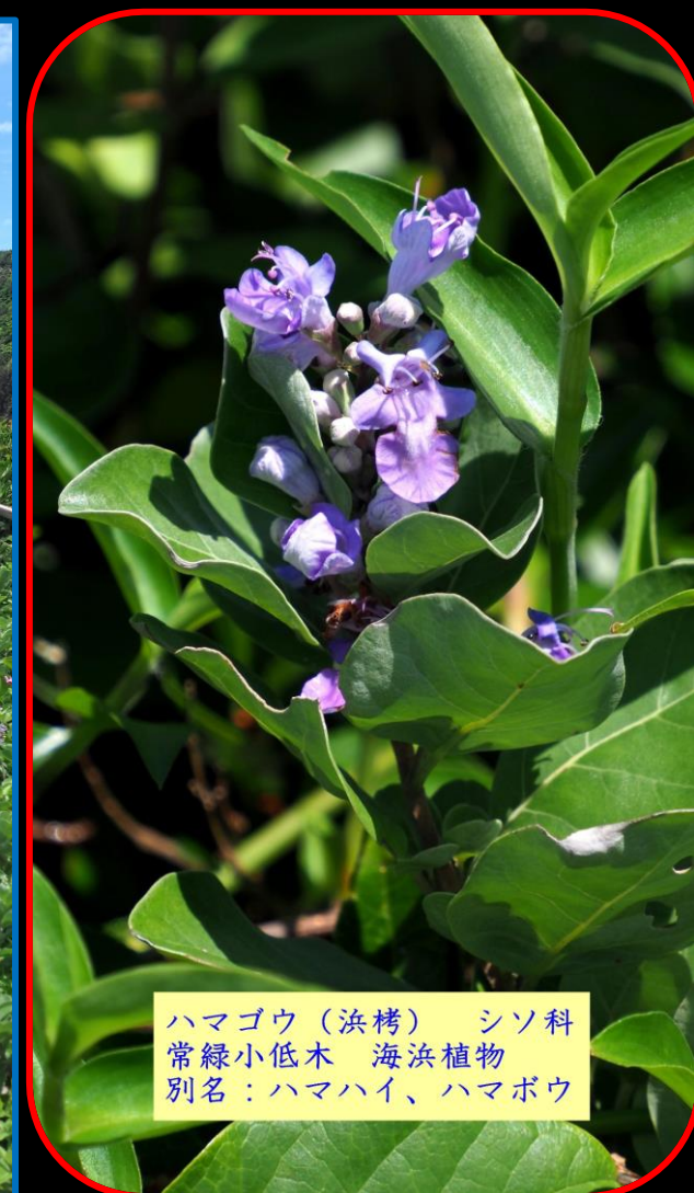
ハマゴウ（浜栲） シソ科 常緑小低木 海浜植物 別名：ハマハイ、ハマボウ