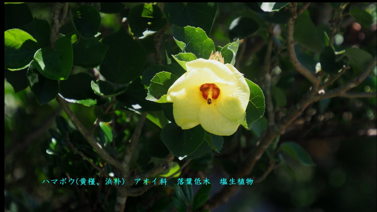
ハマボウ (黄槿、浜朴) アオイ科 落葉低木 塩生植物