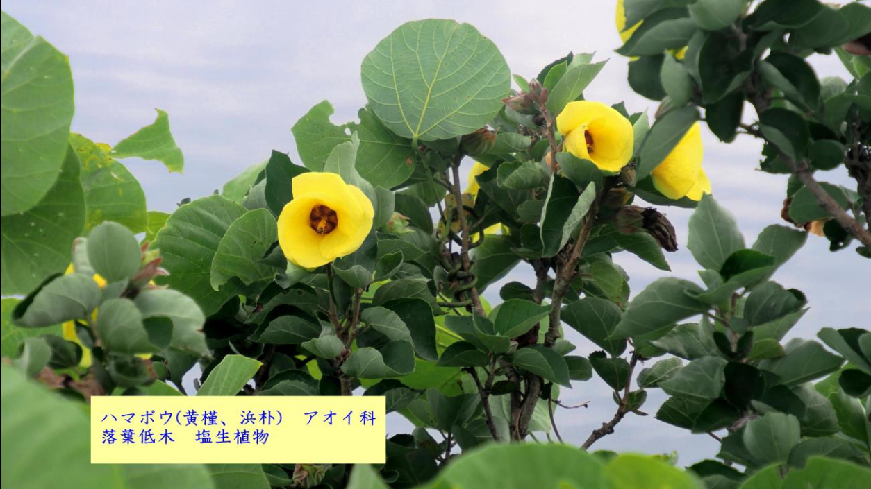
ハマボウ(黄槿、浜朴) アオイ科 落葉低木 塩生植物