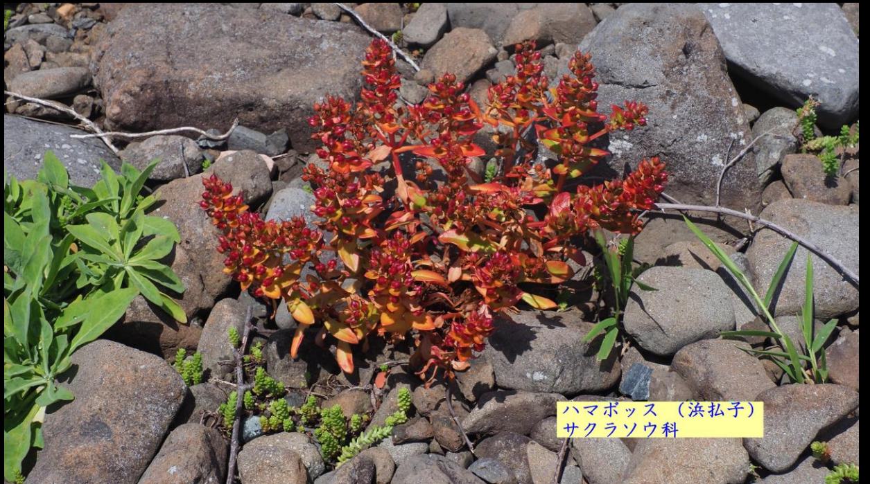
ハマボッサ（浜払子） サクラソウ科