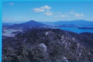
立石山からの展望 View from Mt. Tateishiyama