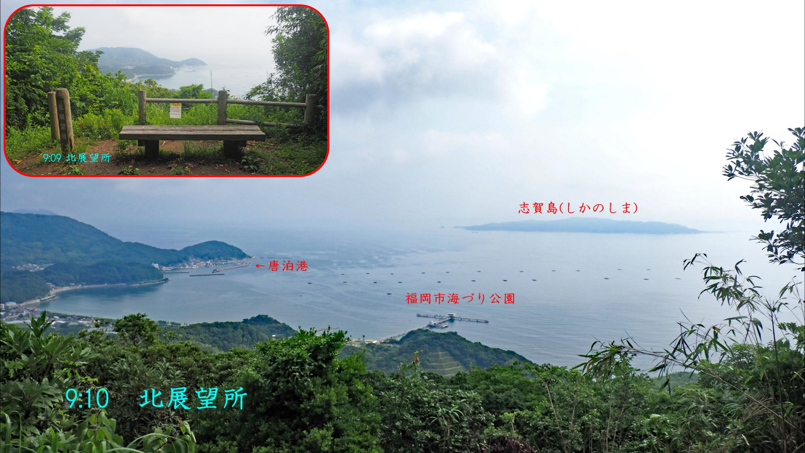
志賀島(しかのしま)