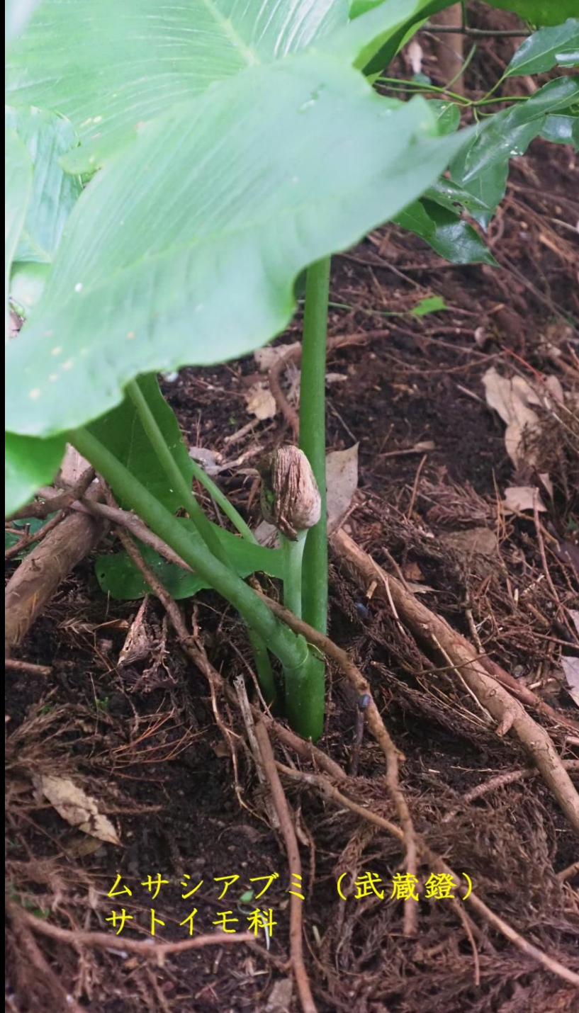
ムサシアブミ (武蔵鐙) サトイモ科