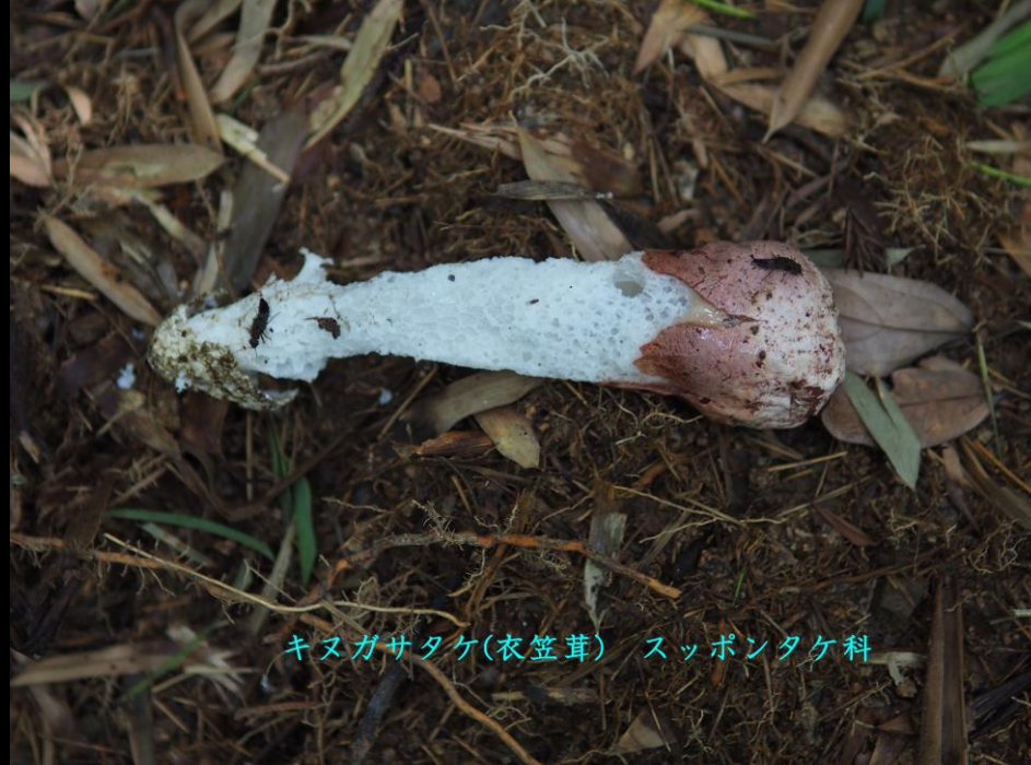
キノガサタケ(衣笠茸) スッポントケ科