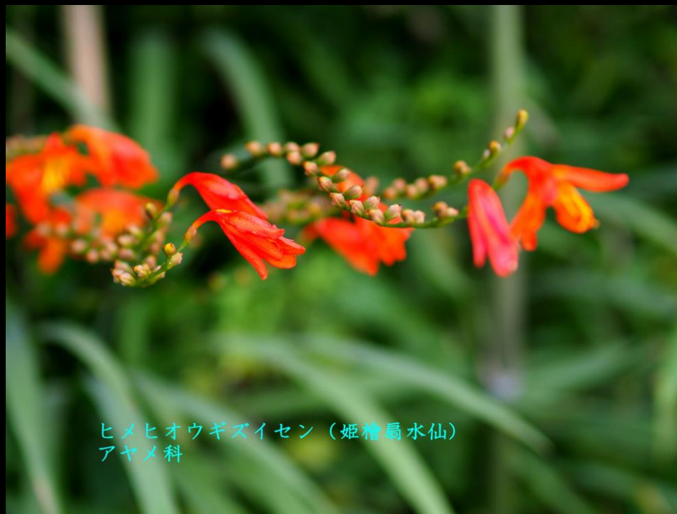
ヒメヒオウギズイセン (姫檜扇水仙) アヤメ科