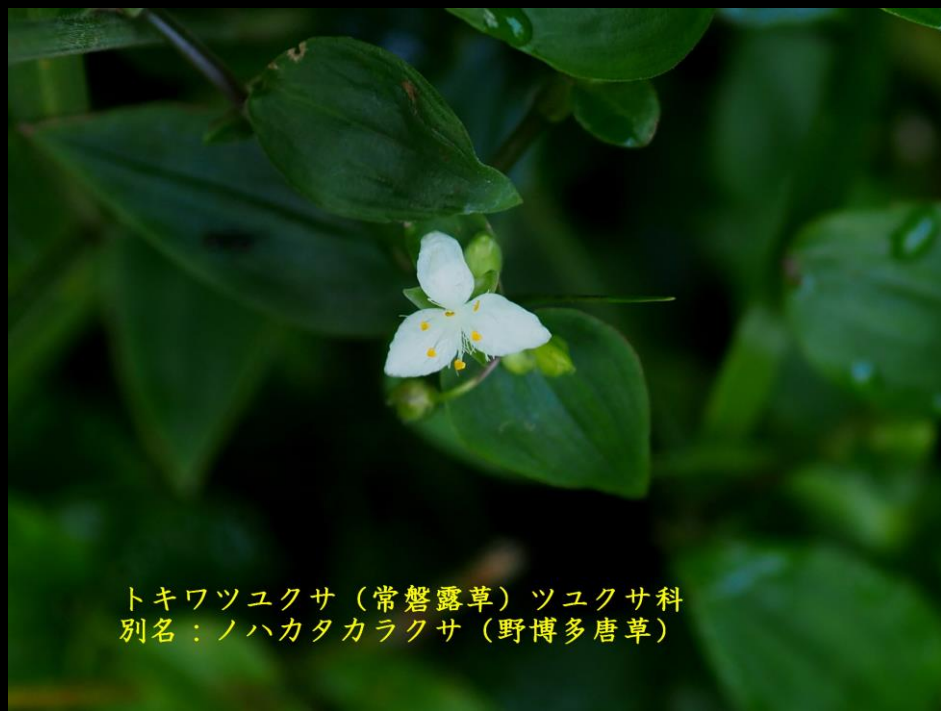
トキワツユクサ(常盤露草) ツユクサ科 別名: ノハカタカラクサ(野博多唐草)