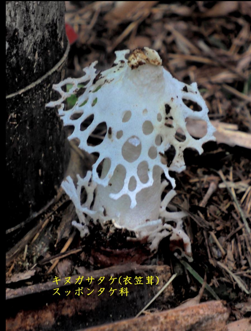
キヌガサタケ（衣笠茸） スッポンタケ科