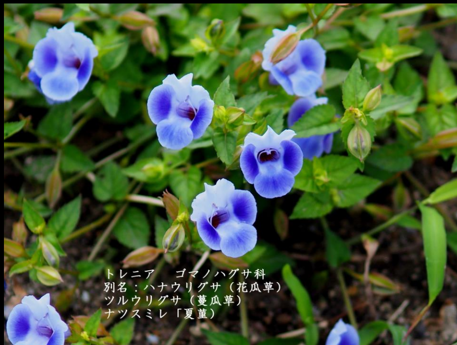
トレニア ゴマノハグサ科 別名：ハナウリグサ (花瓜草) ツルウリグサ (蔓瓜草) ナツスマレ「夏童」