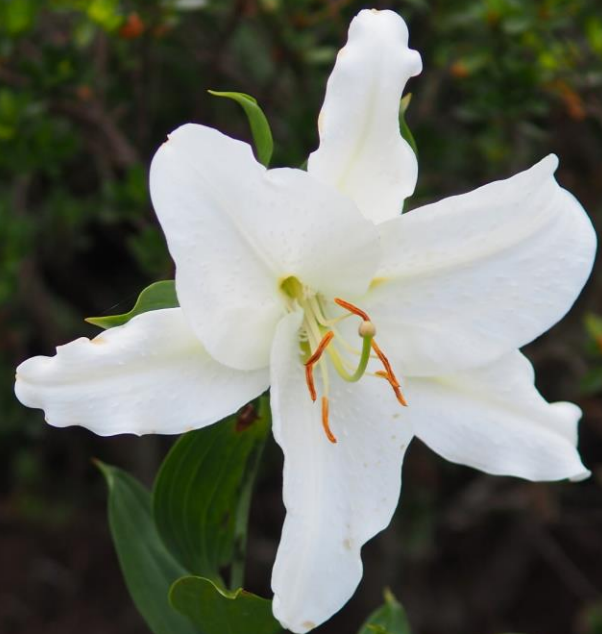
テッポウユリ (鉄砲百合) ユリ科