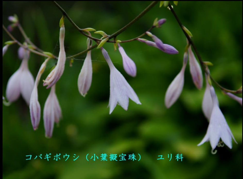
コバギボウシ (小葉擬宝珠) ユリ科