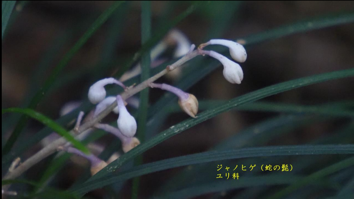
ジャノヒゲ(蛇の髭) ユリ科