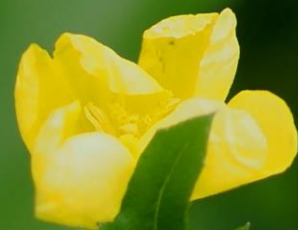
マツヨイグサ (待宵草) アカバナ科