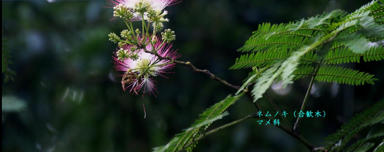
ネムノキ(合歓木) マメ科