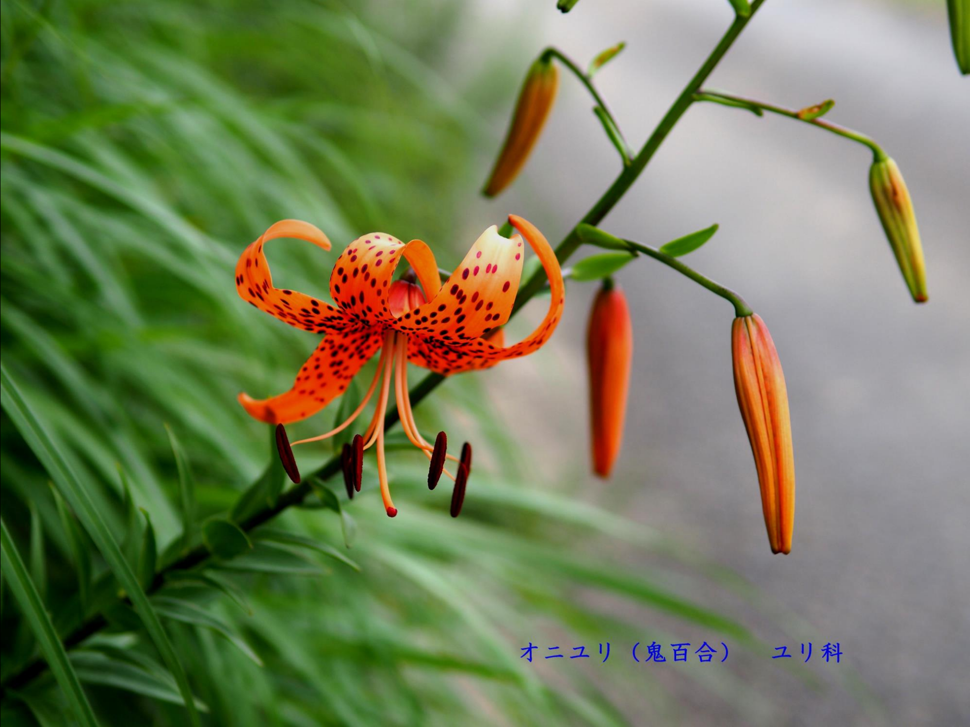
オニユリ (鬼百合) ユリ科