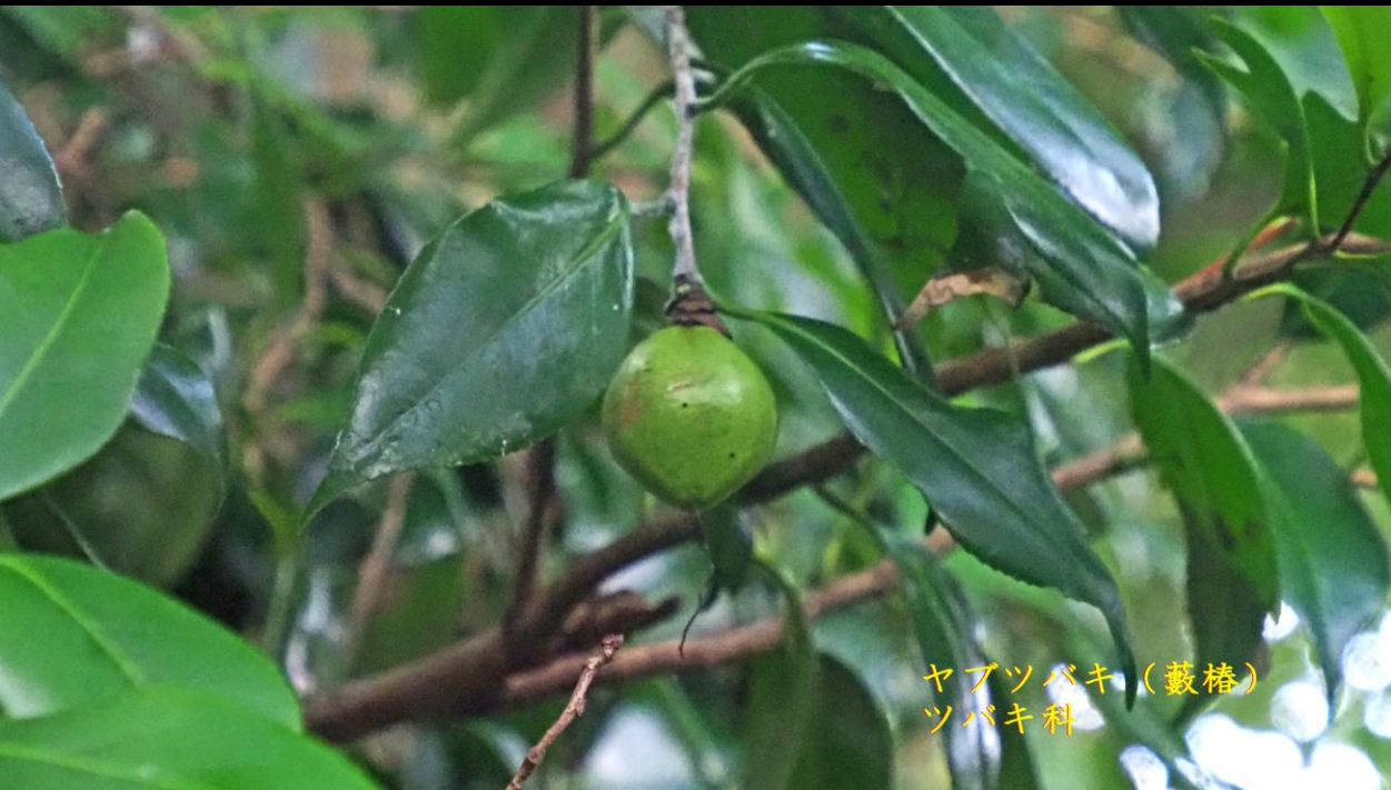
ヤブツバキ (藪椿) ツバキ科