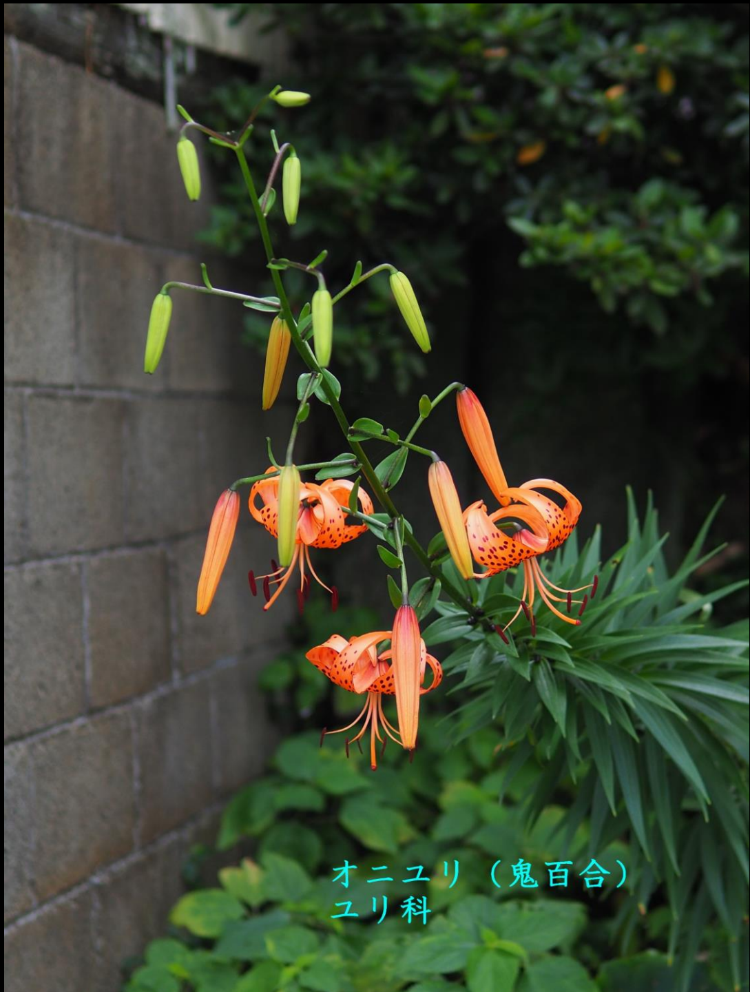
オニユリ (鬼百合) ユリ科