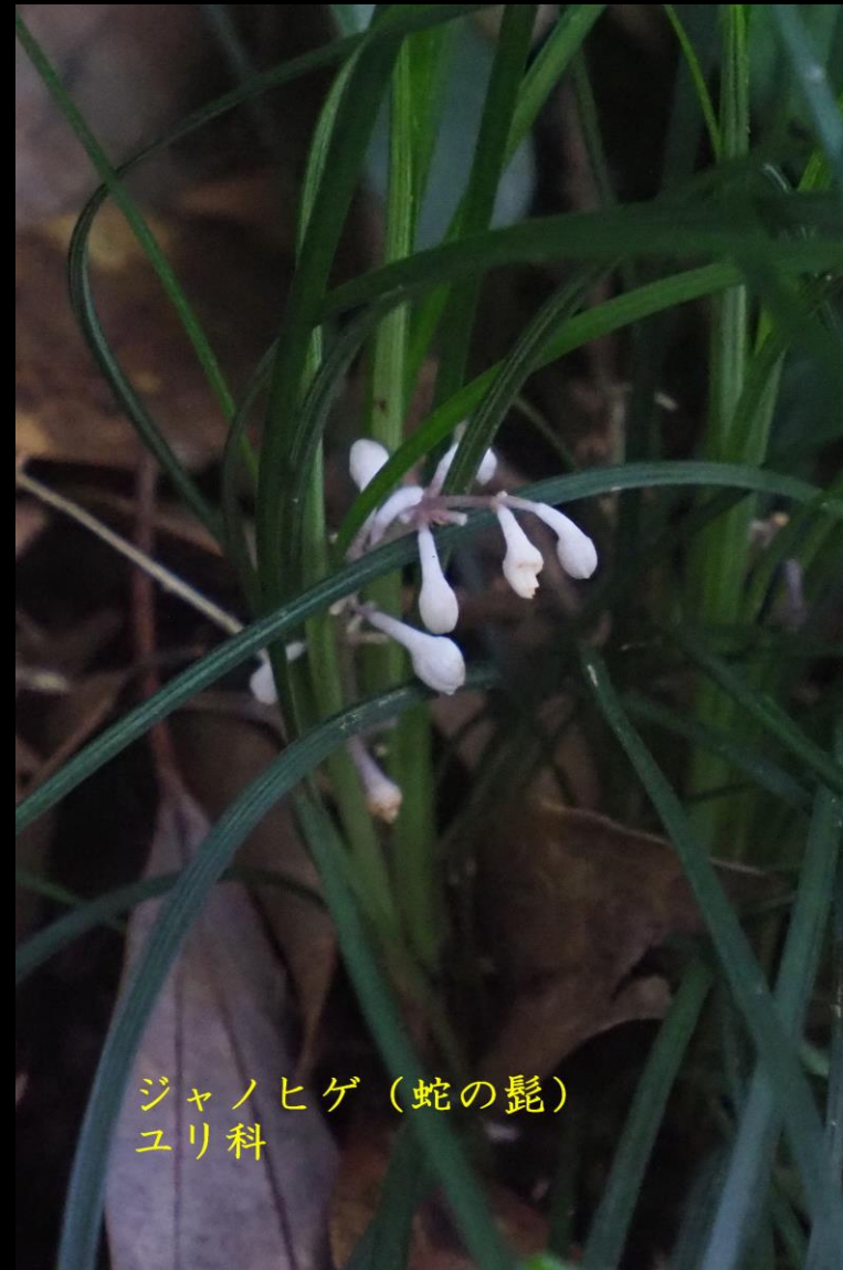
ジャノヒゲ（蛇の髭） ユリ科