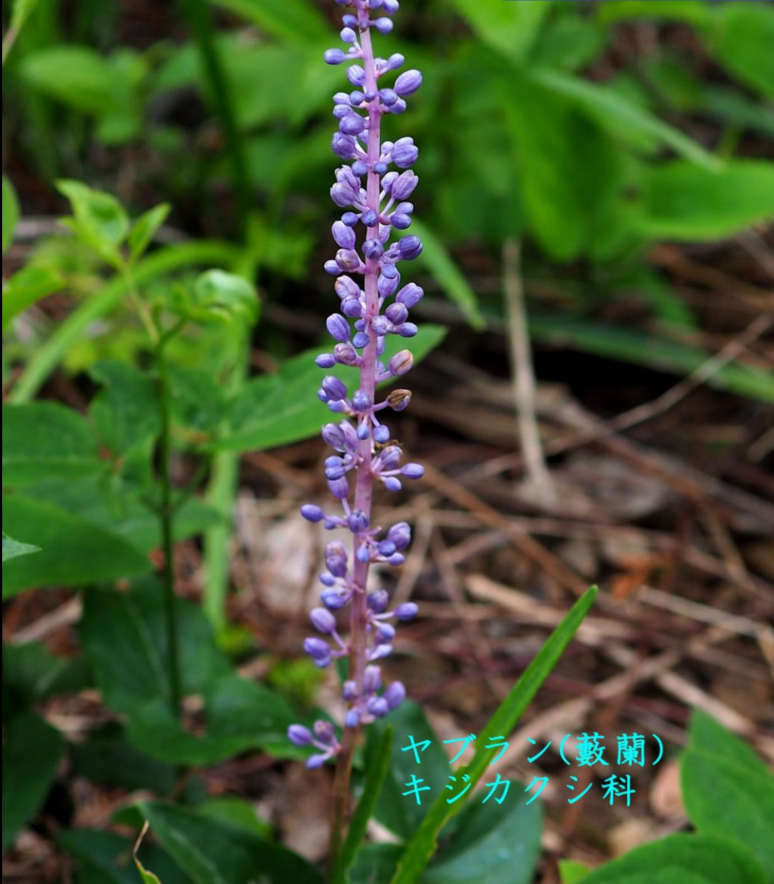
ヤブラン(藪蘭) キジカクシ科