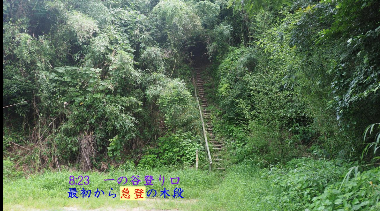
8:23 一の谷登り口 最初から急登の木段