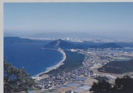
柑子岳から今津方面を望む