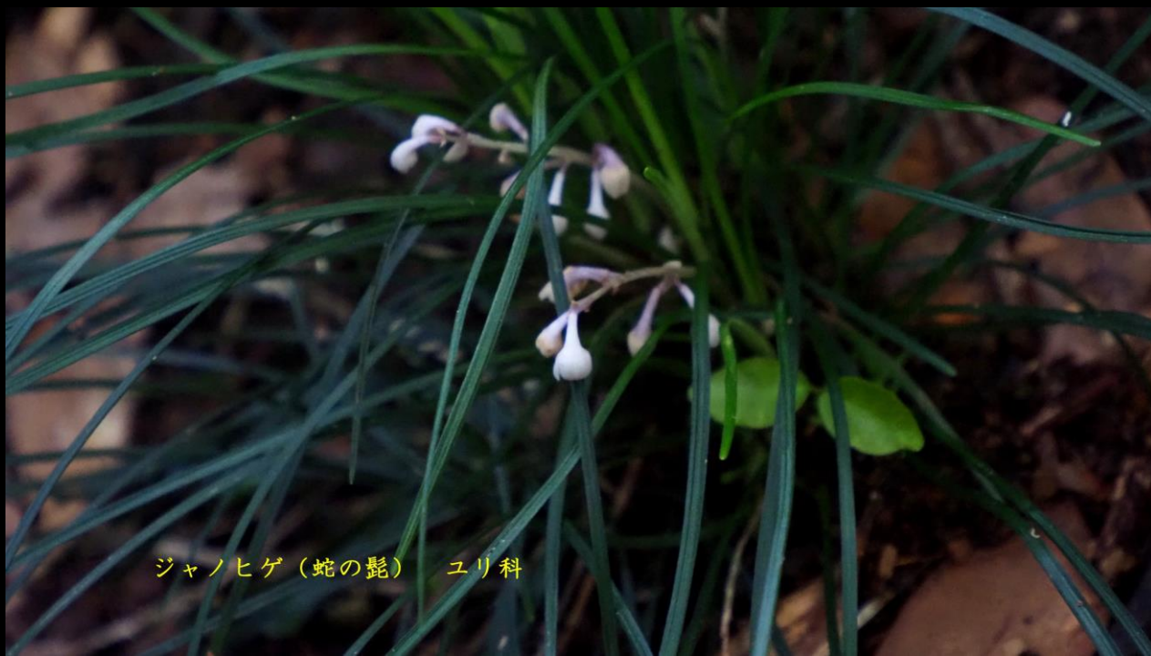
ジャノヒゲ (蛇の髭) ユリ科