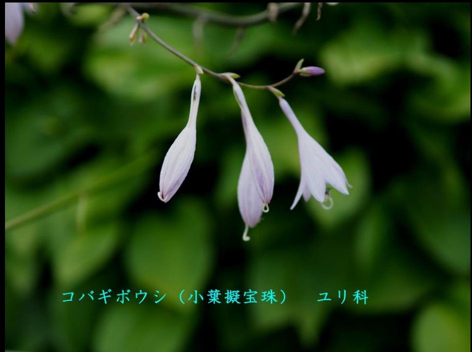
コバギボウシ (小葉擬宝珠) ユリ科