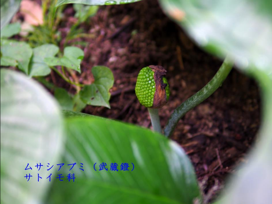
ムサシアブミ (武蔵鐙) サトイモ科