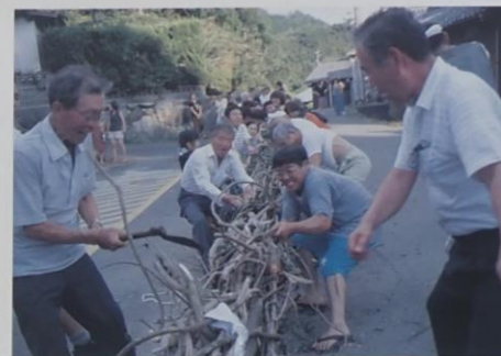
草場の盆綱引き (市指定無形民俗文化財)