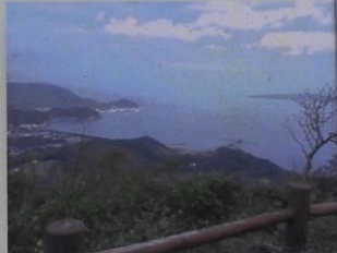
南展望所からの眺望