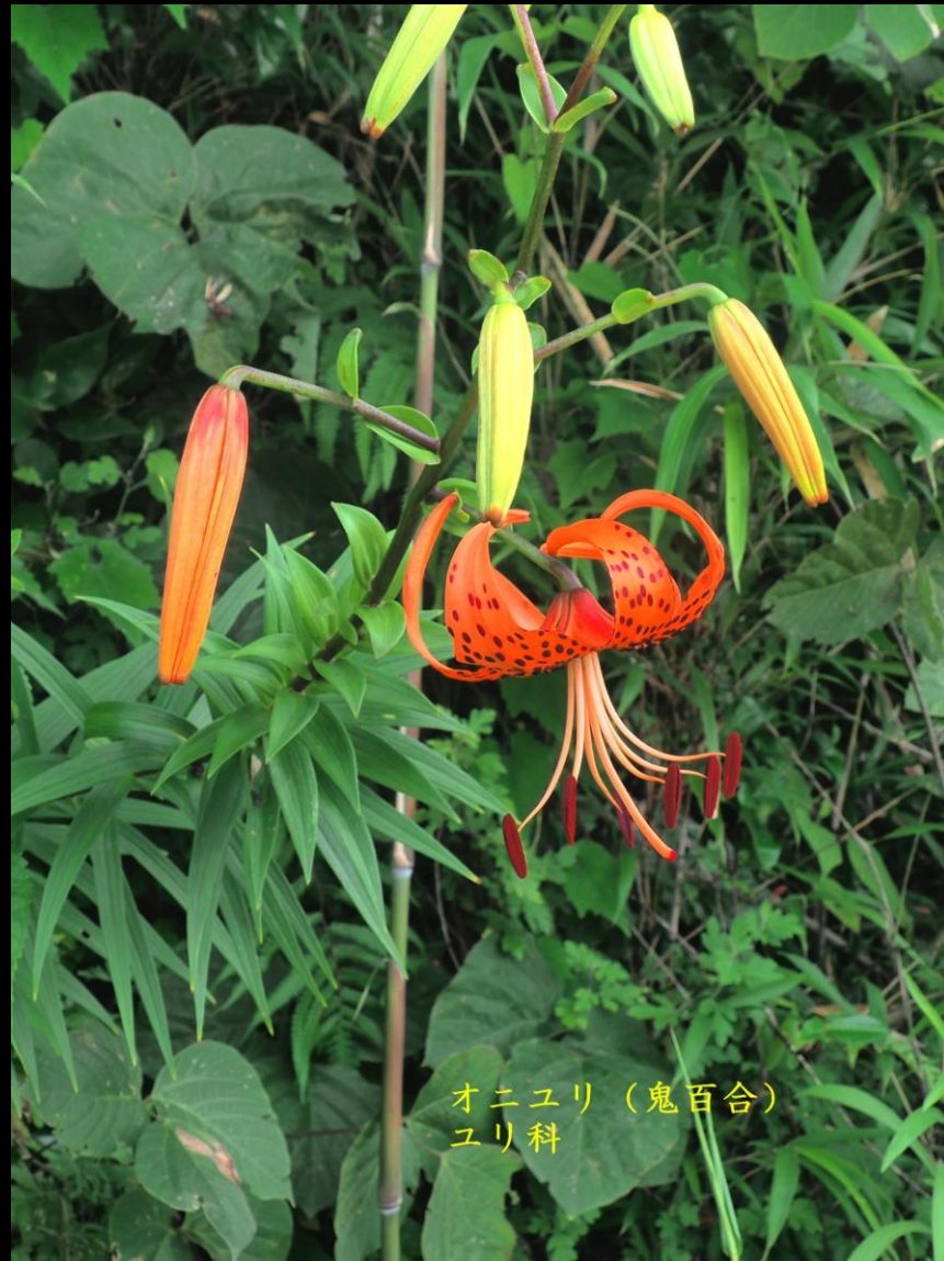
オニユリ（鬼百合） ユリ科