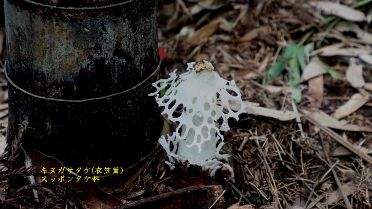
キノガサタケ(衣笠茸) スッポントケ科