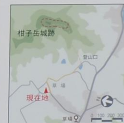
柑子岳城跡への案内図