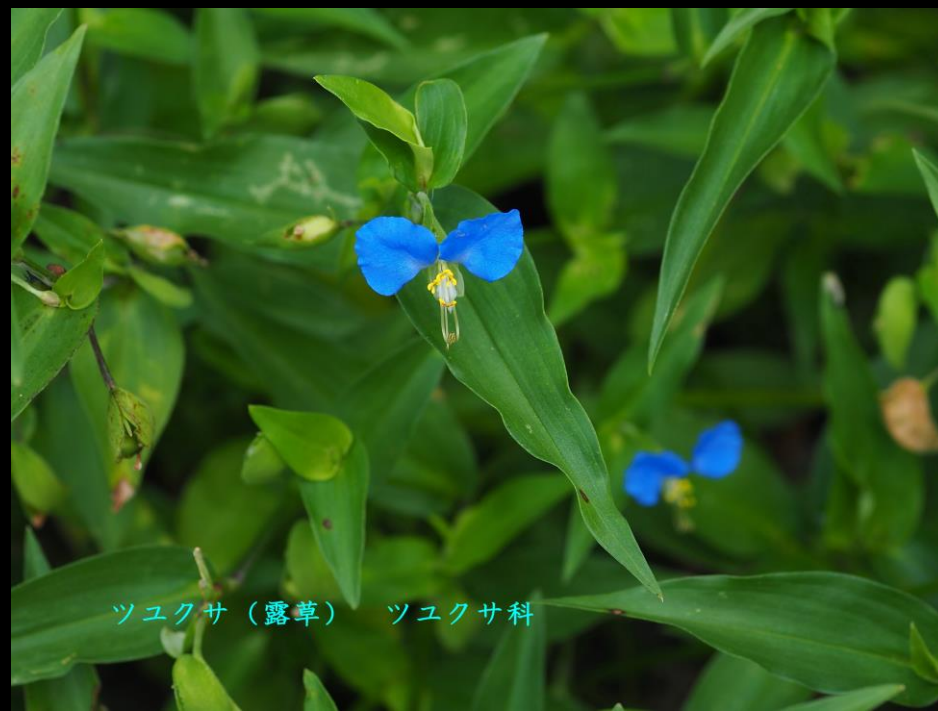
ツユクサ(露草) ツユクサ科