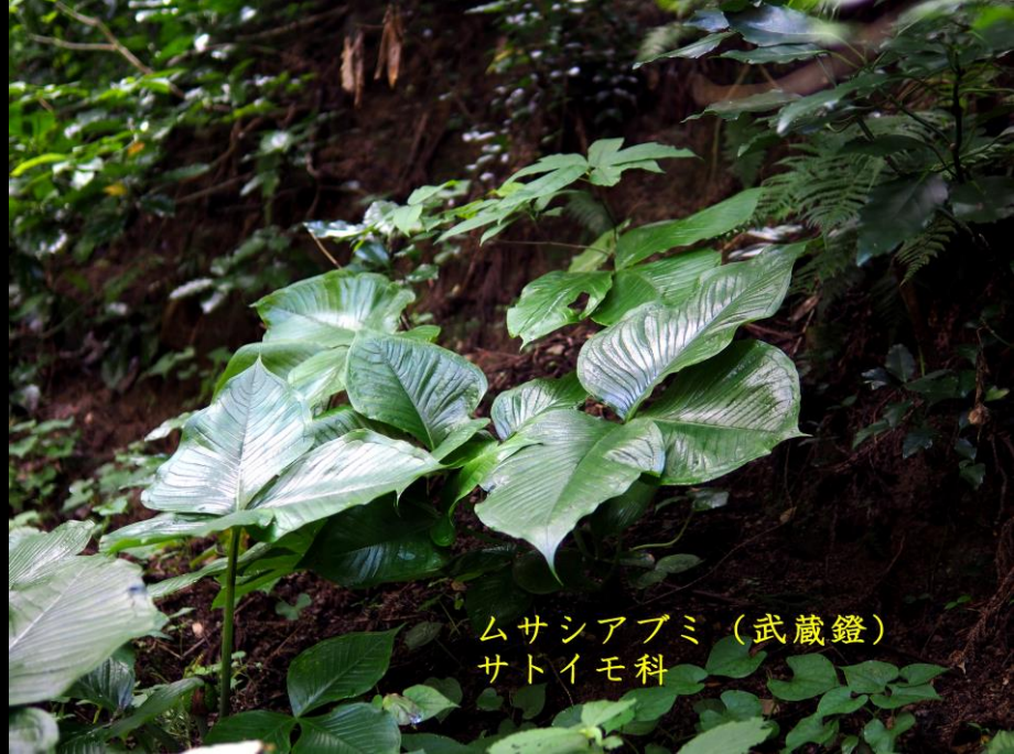
ムサシアブミ (武蔵鐙) サトイモ科