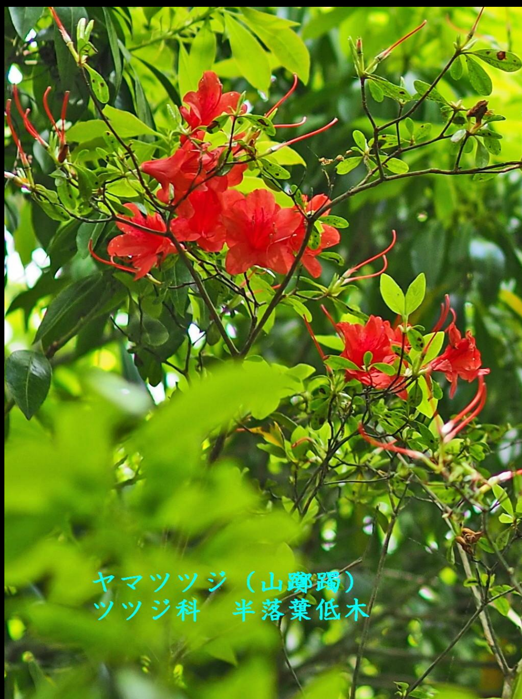
ヤマツツジ (山躑躅) ツツジ科 半落葉低木