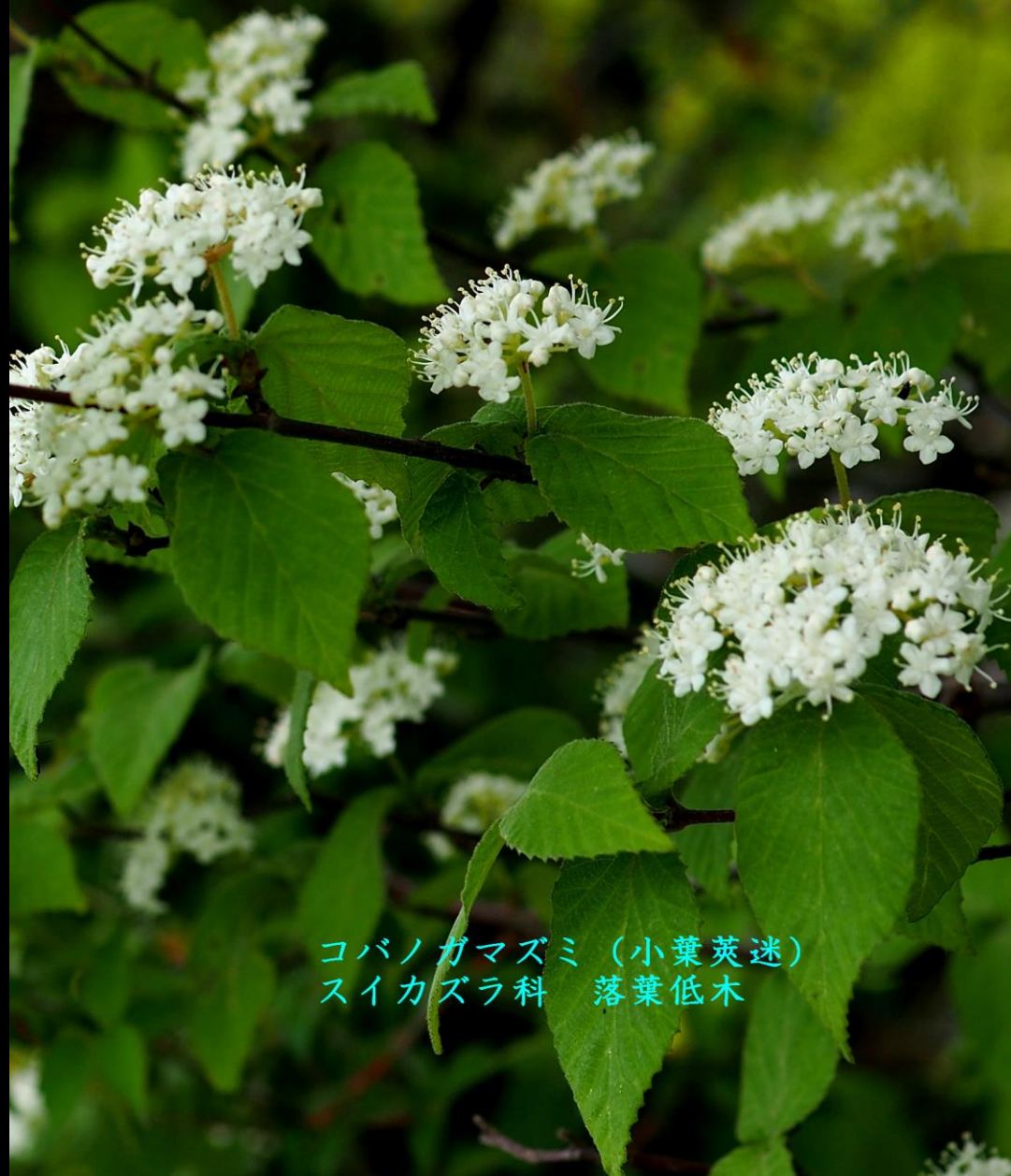
コバノガマズミ (小葉莢迷) スイカズラ科 落葉低木