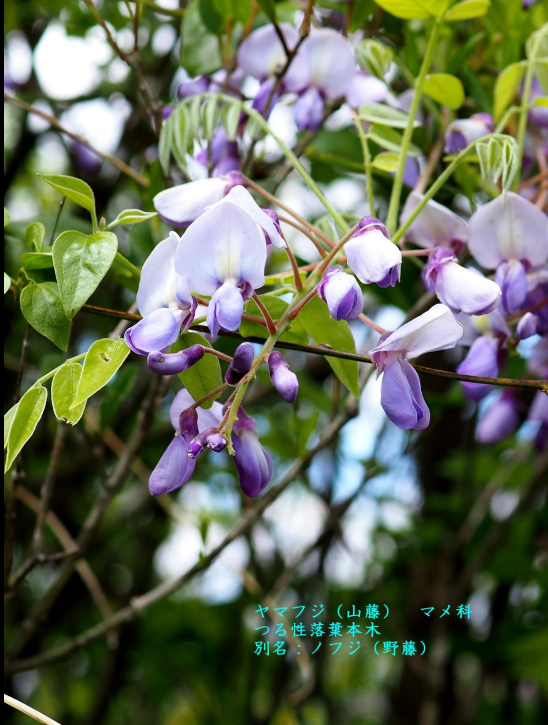
ヤマフジ (山藤) マメ科 つる性落葉本木 別名：ノフジ (野藤)