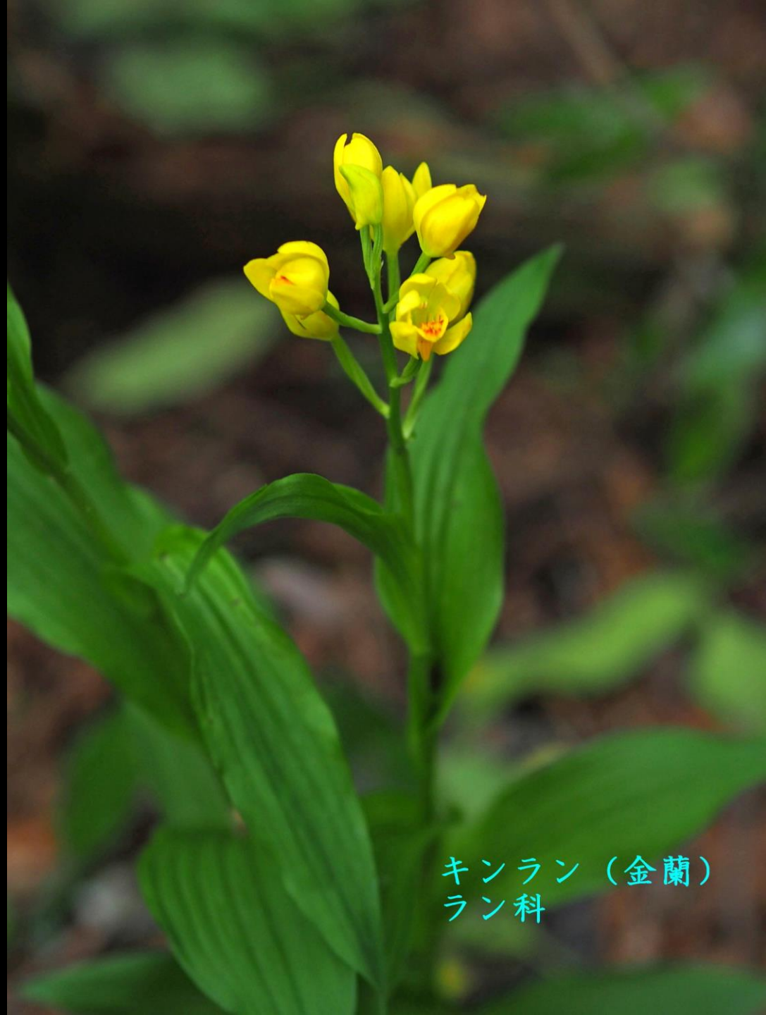
キンラン (金蘭) ラン科