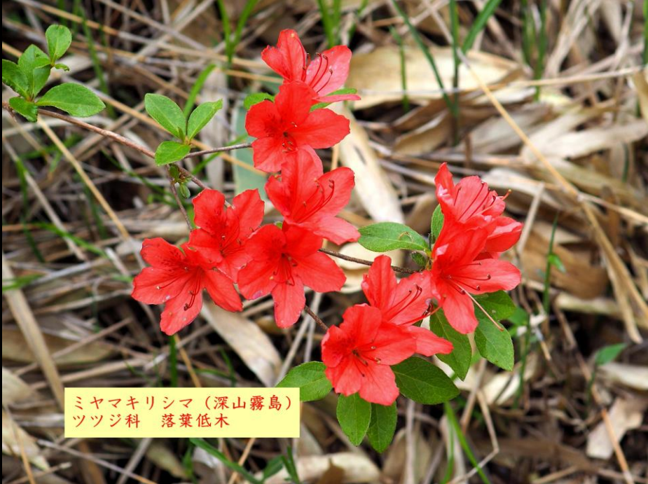
ミヤマキリシマ (深山霧島) ツツジ科 落葉低木