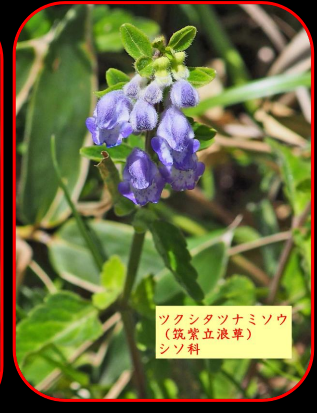
ツクシタツナミソウ （筑紫立浪草） シソ科