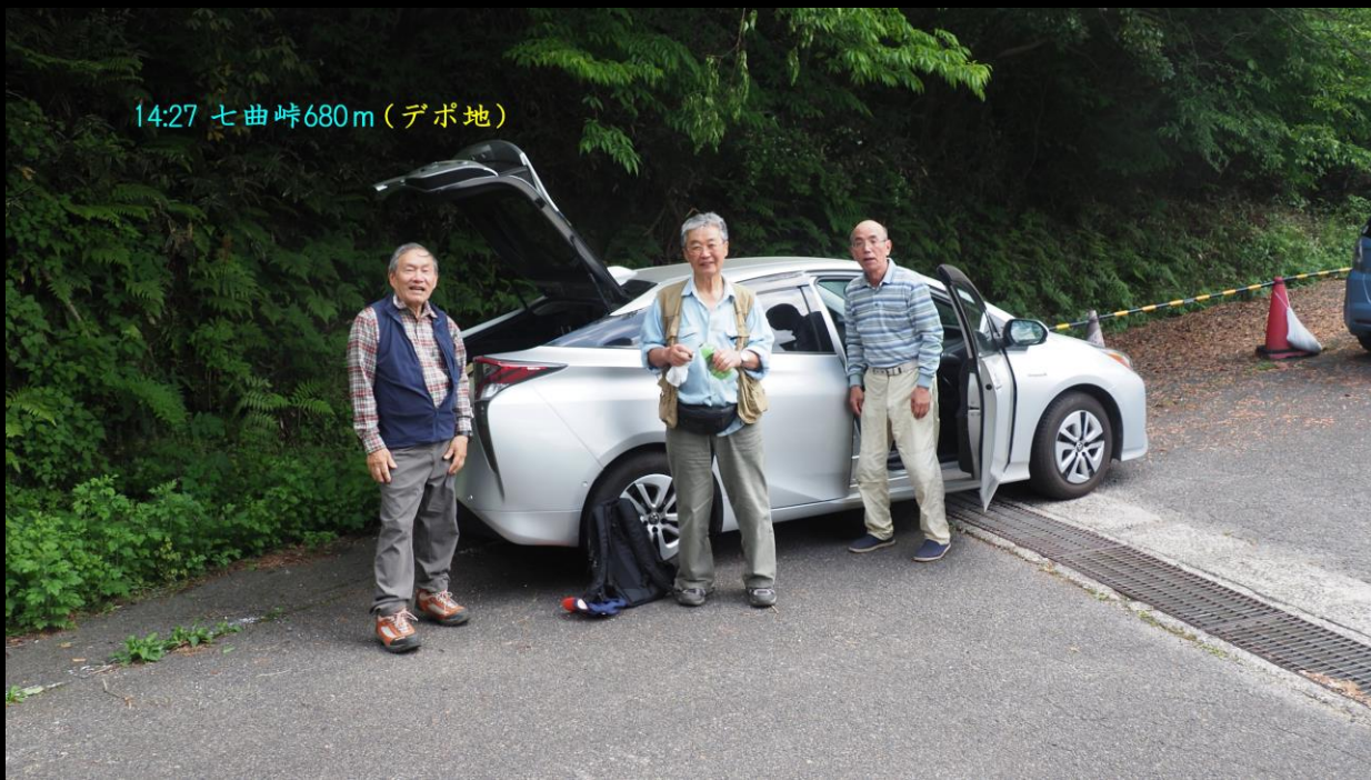
14:27 七曲峠680m (デポ地)