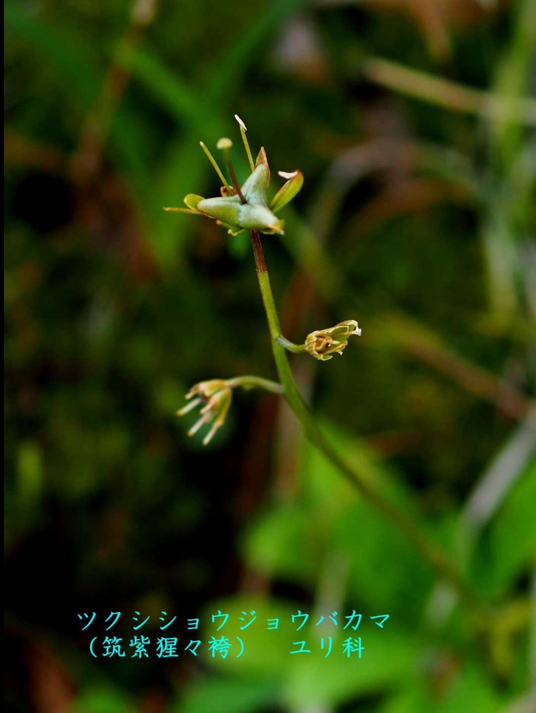
ツクシショウジョウバカマ (筑紫猩々袴) ユリ科