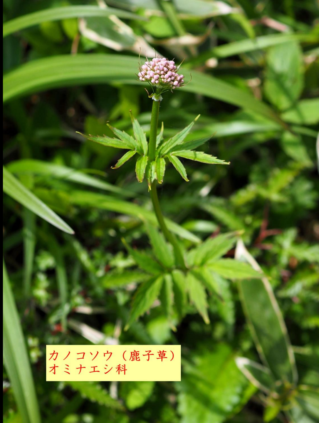
カノコソウ (鹿子草) オミナエシ科