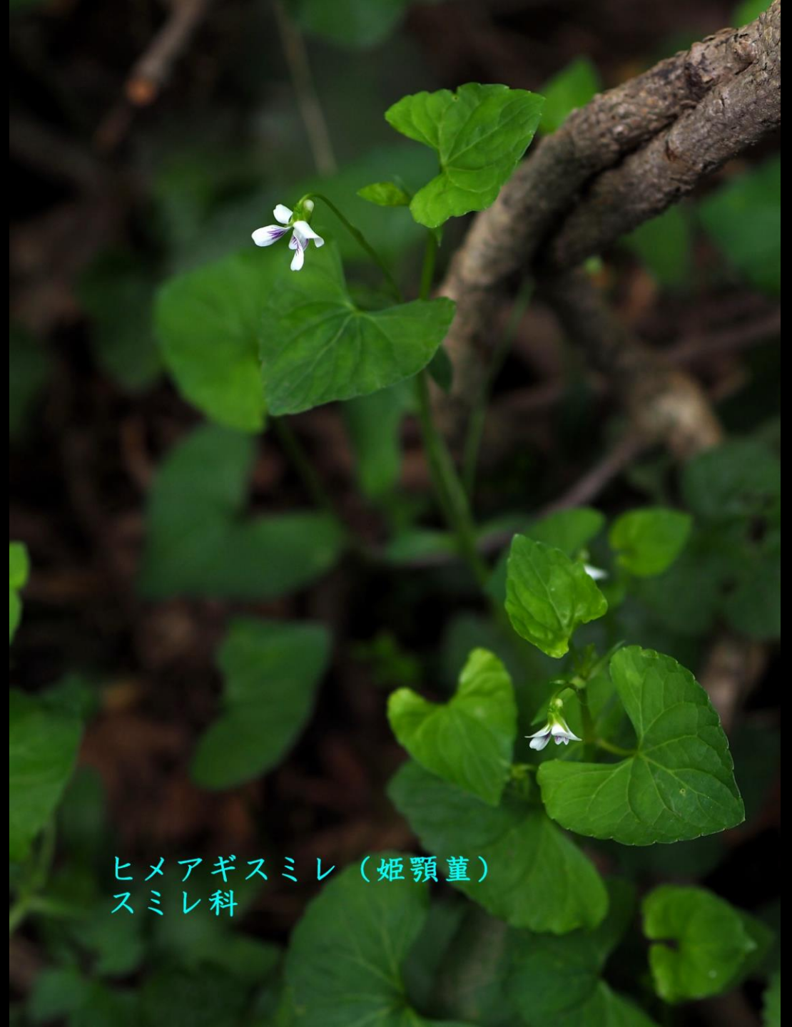
ヒメアギスミレ (姫顎堇) スミレ科