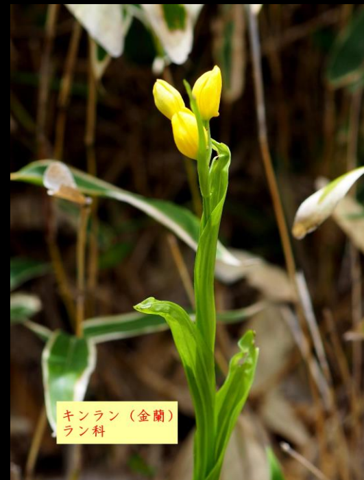
キンラン (金蘭) ラン科