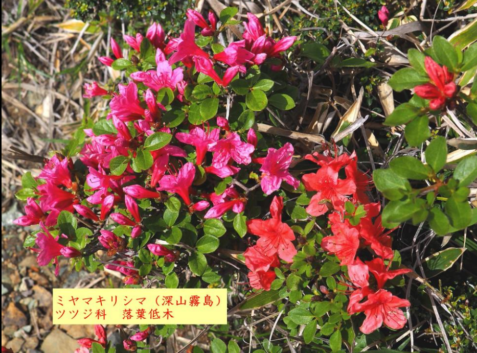
ミヤマキリシマ (深山霧島) ツツジ科 落葉低木