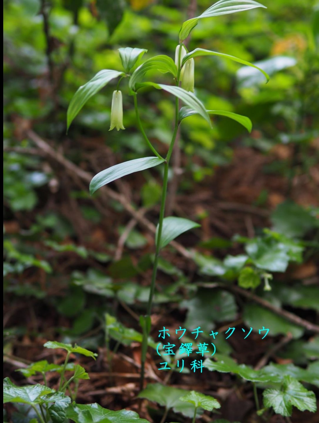
ホウチャクソウ (宝鐸草) ユリ科