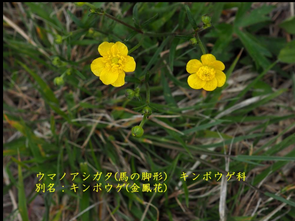
ウマノアシガタ(馬の脚形) キンポウゲ科 別名：キンポウゲ(金鳳花)