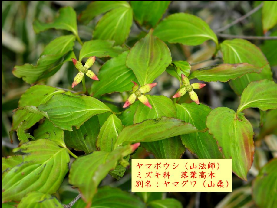
ヤマボウシ (山法師) ミズキ科 落葉高木 別名: ヤマグワ (山桑)