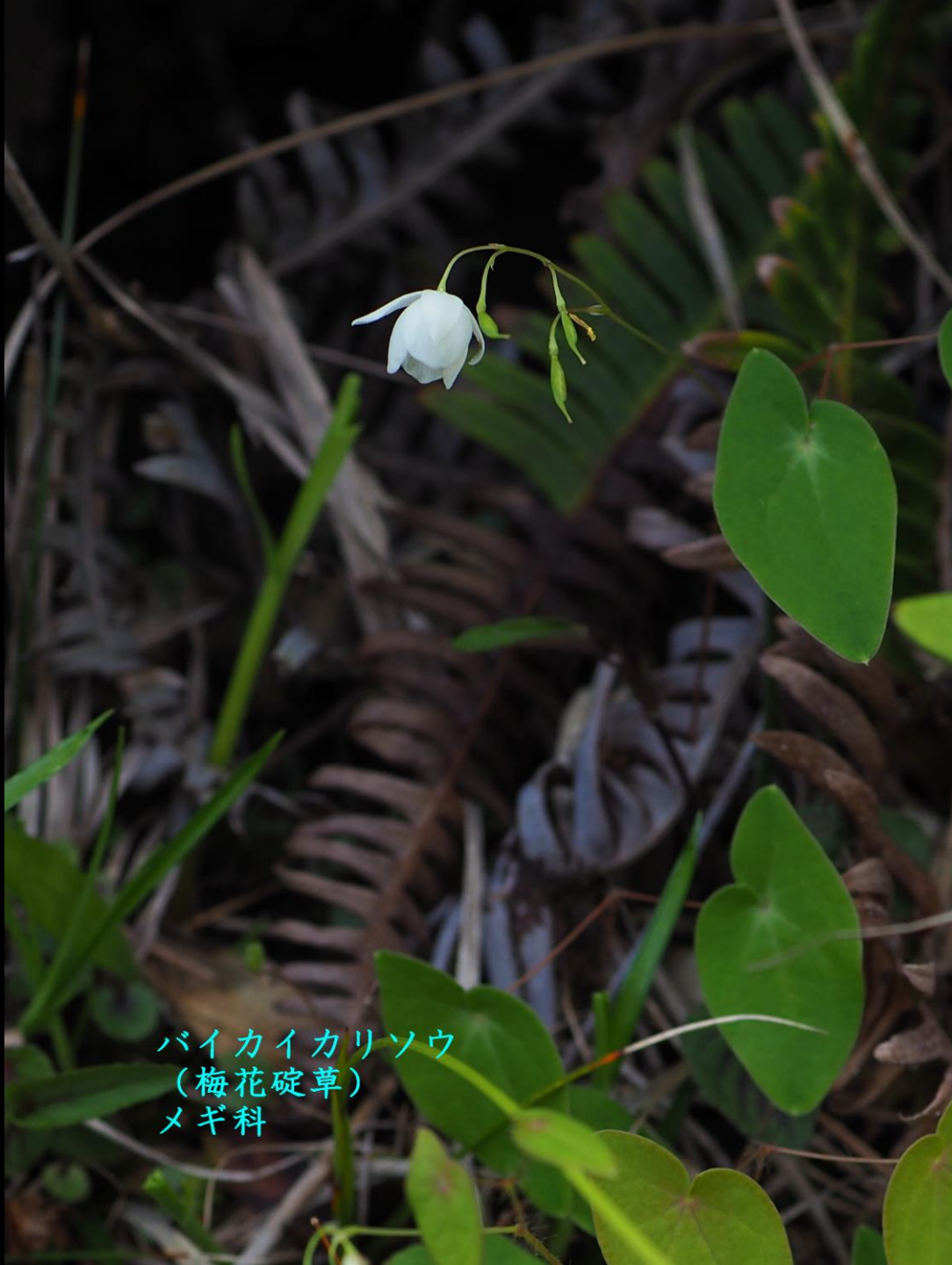
バイカイカリソウ (梅花碇草) メギ科