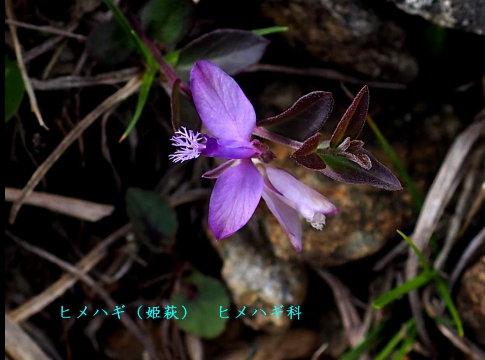
ヒメハギ (姫萩) ヒメハギ科