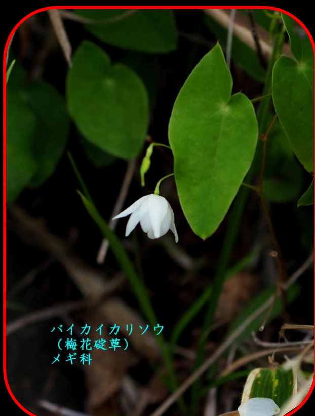
バイカイカリソウ （梅花碓草） メギ科