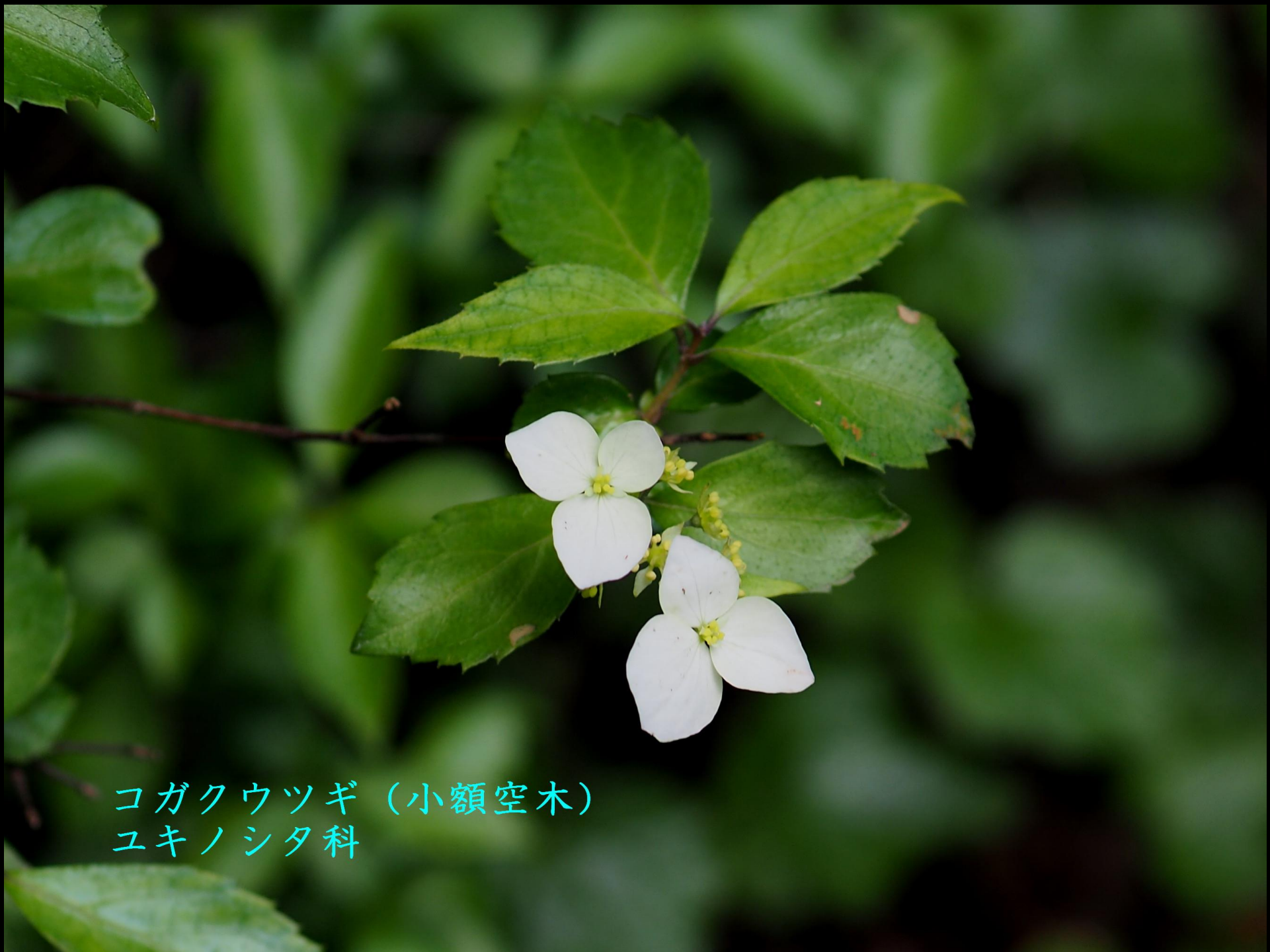
コガクウツギ (小額空木) ユキノシタ科