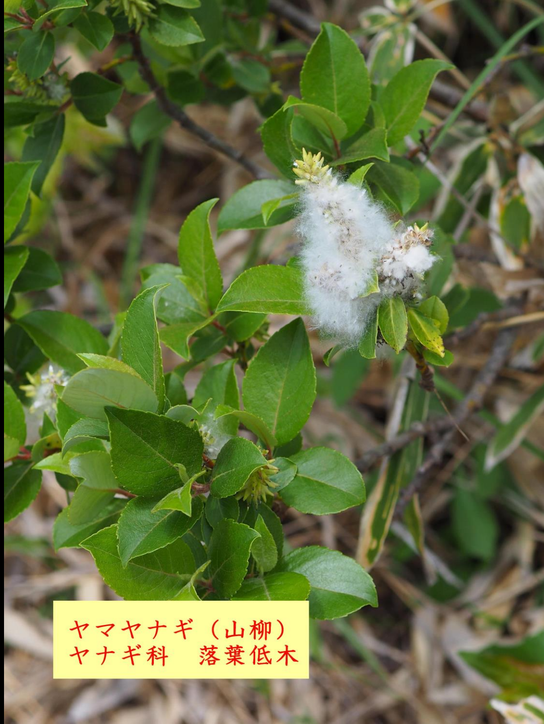
ヤマヤナギ (山柳) ヤナギ科 落葉低木