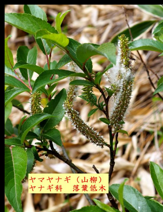
ヤマヤナギ (山柳) ヤナギ科 落葉低木