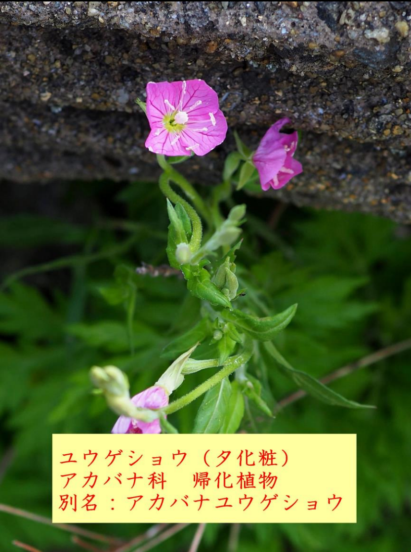
ユウゲショウ（夕化粧） アカバナ科 帰化植物 別名：アカバナユウゲショウ