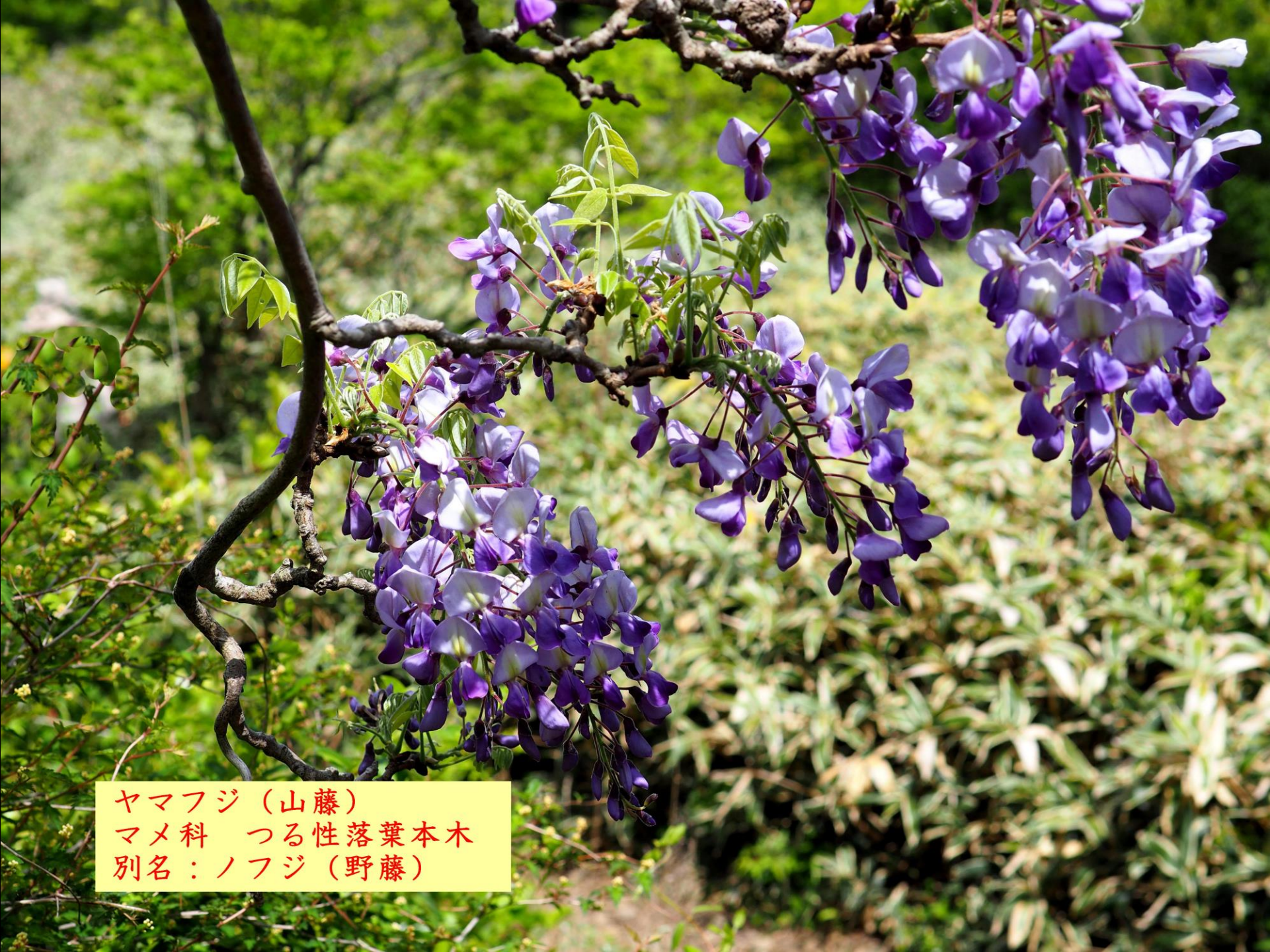
ヤマフジ (山藤) マメ科 つる性落葉本木 別名：ノフジ (野藤)