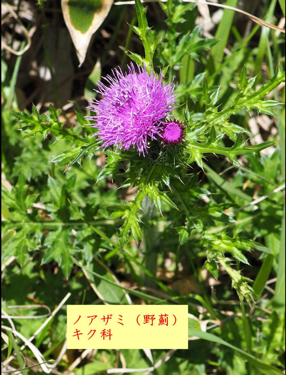
ノアザミ (野薊) キク科