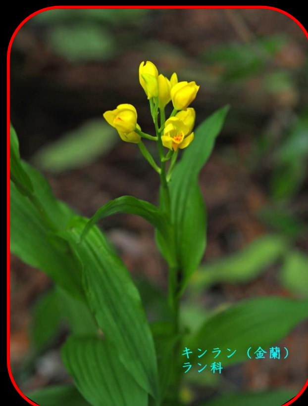
キンラン（金蘭） ラン科