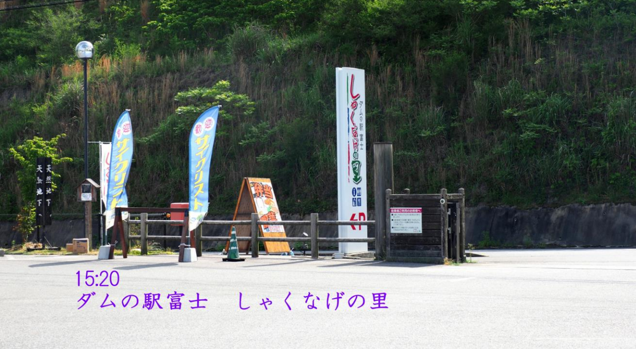
15:20 ダム駅富士 しゃくなげの里