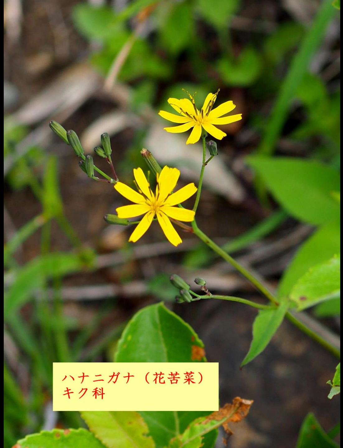
ハナニガナ（花苦菜） キク科