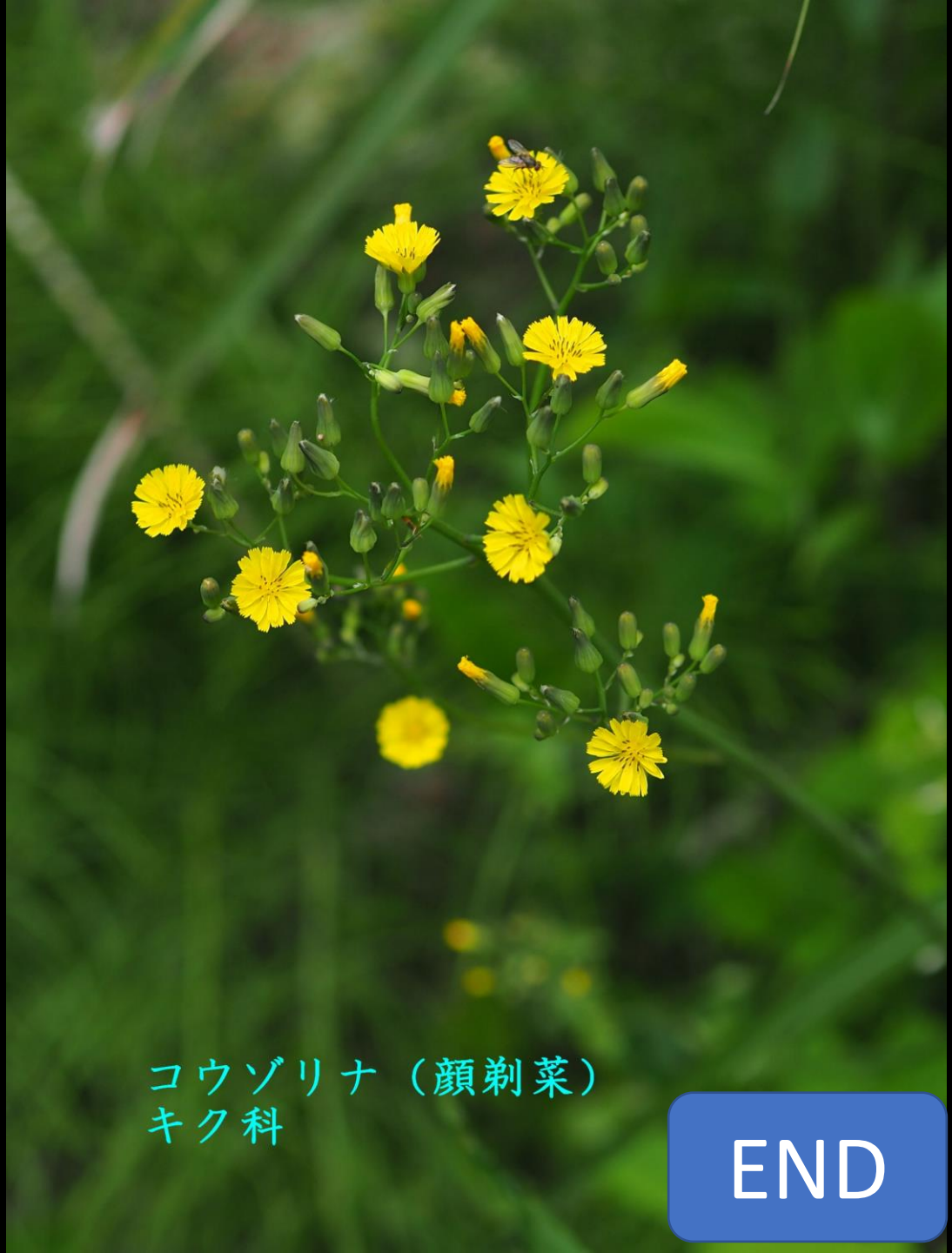
コウゾリナ（顔剃菜） キク科