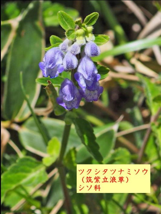
ツクシタツナミソウ (筑紫立浪草) シソ科