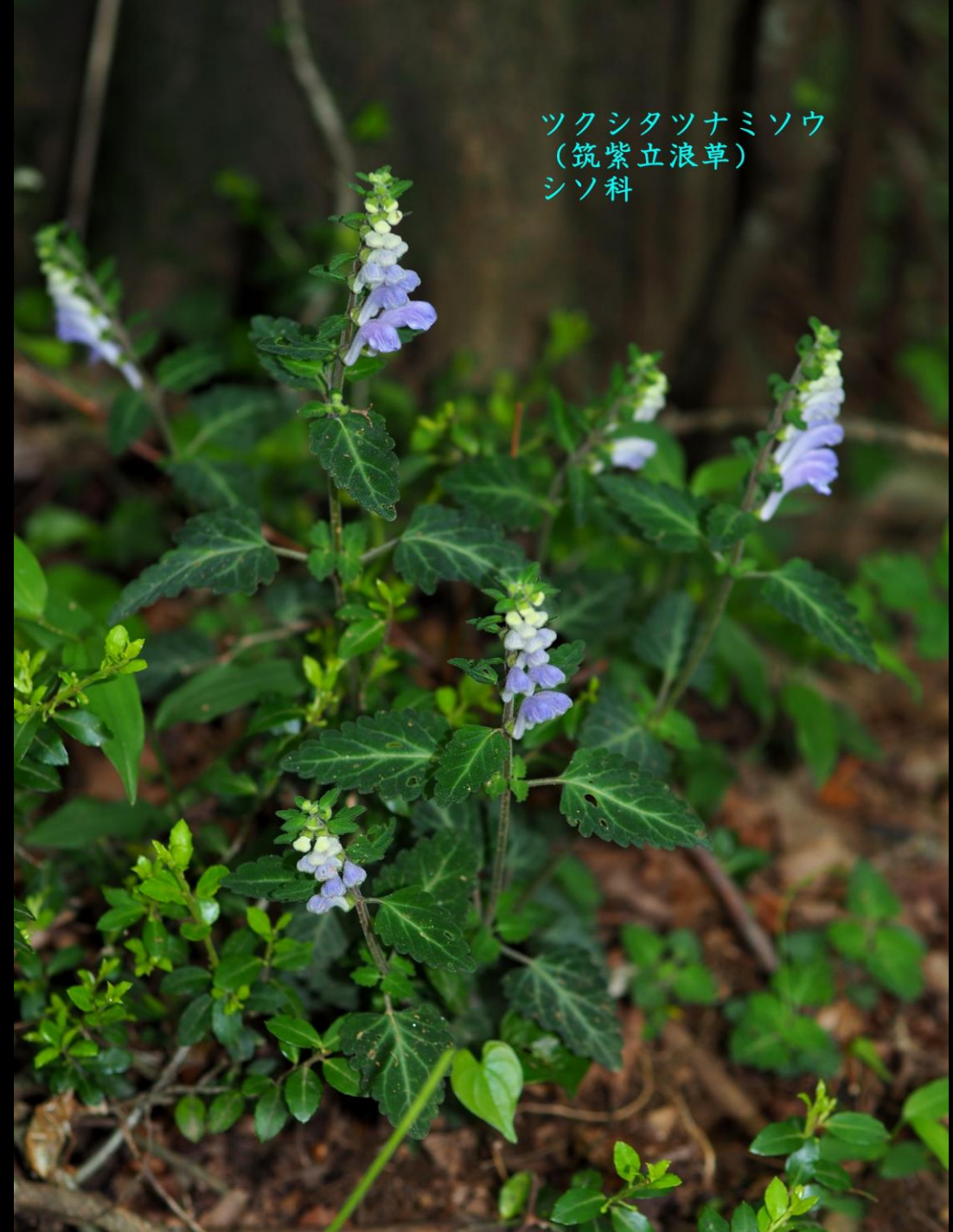
ツクシタツナミソウ (筑紫立浪草) シソ科