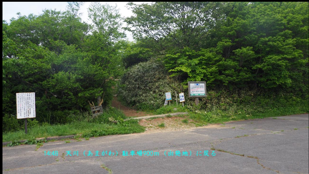
14:48 天川(あまがわ) 駐車場900m (出発地)に戻る