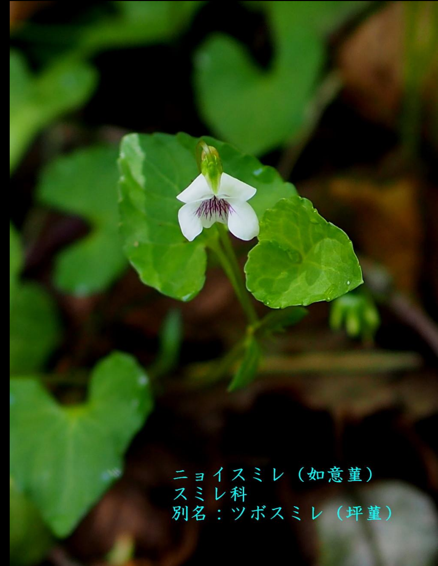
ニョイスミレ（如意堇） スミレ科 別名：ツボスミレ（坪堇）