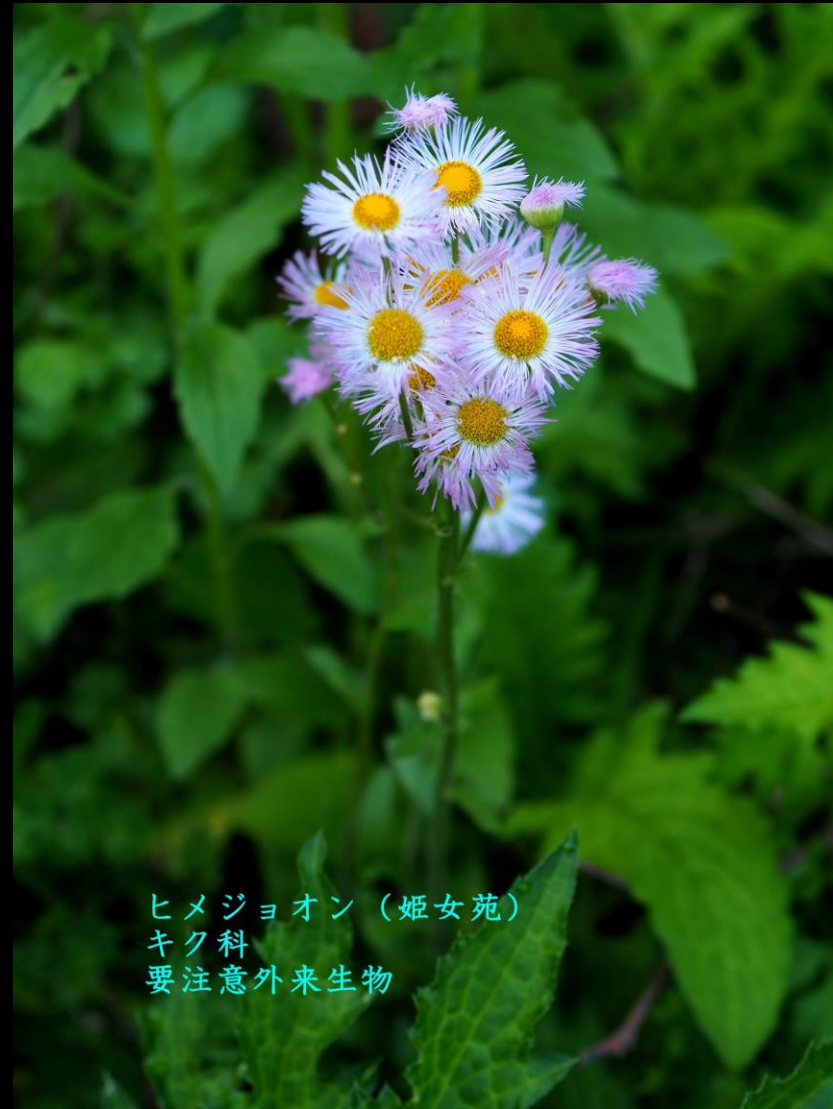
ヒメジョオン（姫女苑） キク科 要注意外来生物