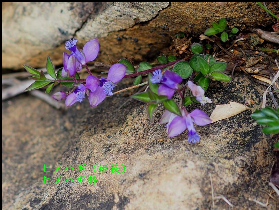
ヒメハギ (姫萩) ヒメハギ科