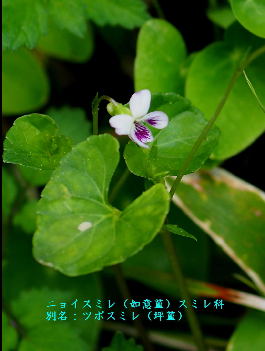
ニョイスミレ (如意堇) スミレ科 別名：ツボスミレ (坪堇)