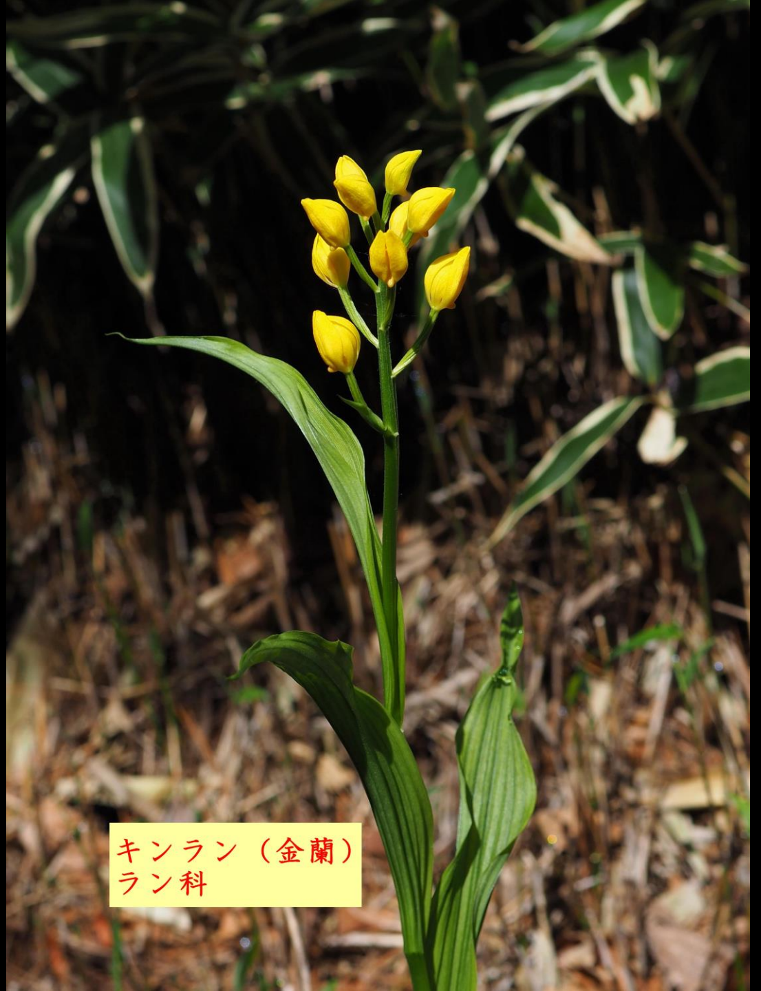
キンラン (金蘭) ラン科