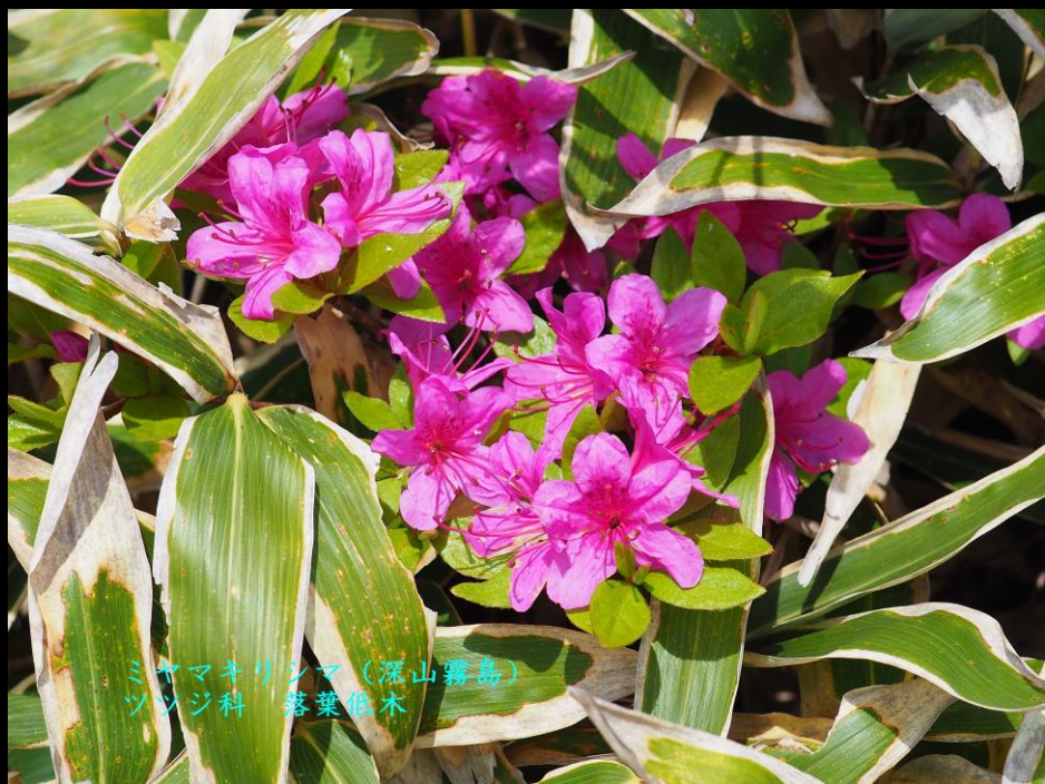
ミヤマキリシマ (深山霧島) ツツジ科 落葉低木