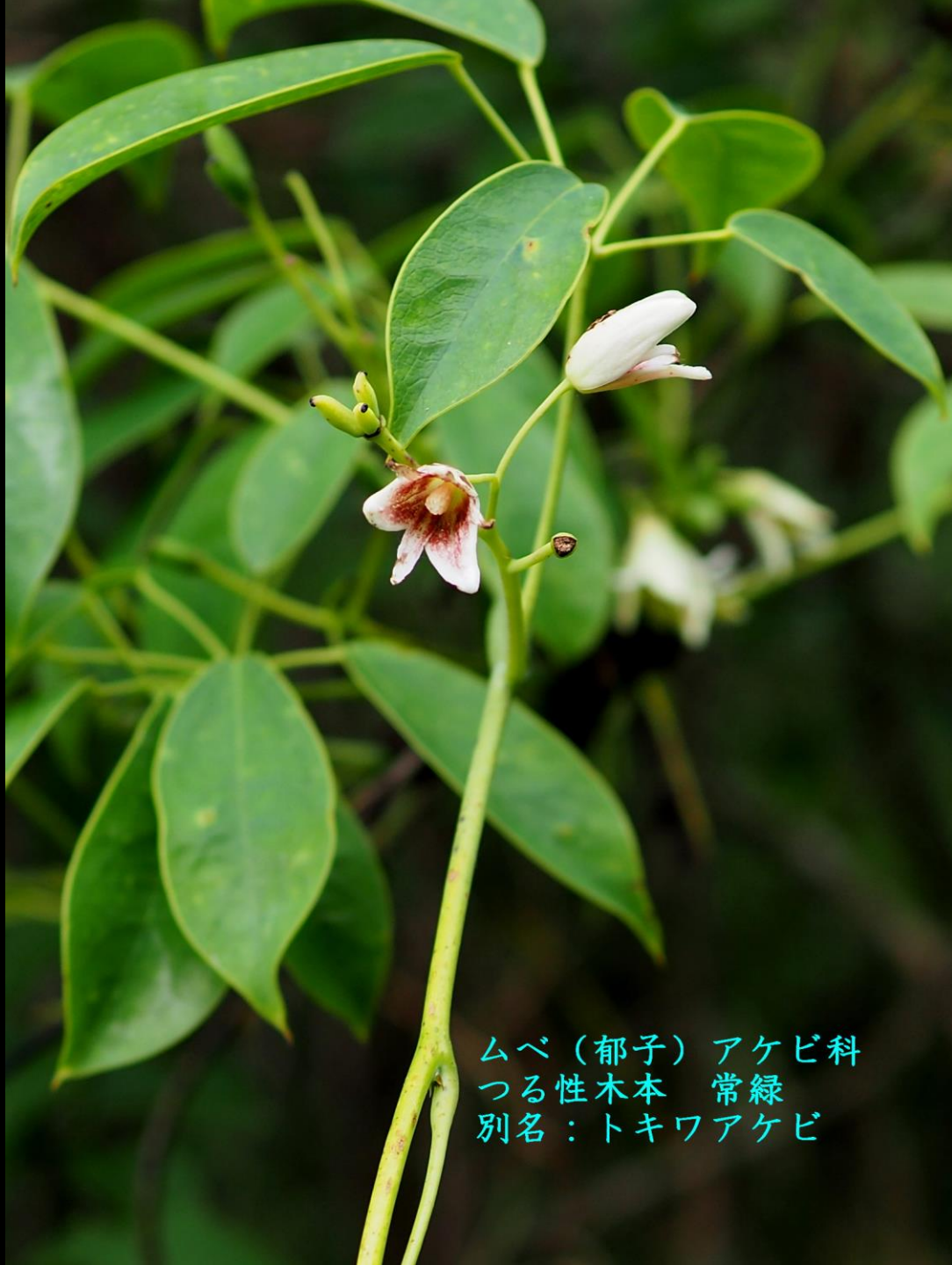
ムベ（郁子）アケビ科 つる性木本 常緑 別名：トキワアケビ