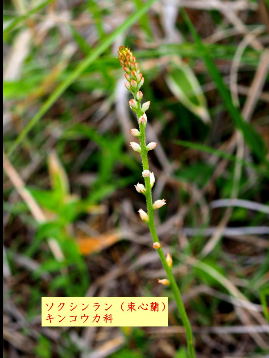
ソクシンラン (束心蘭) キンコウカ科