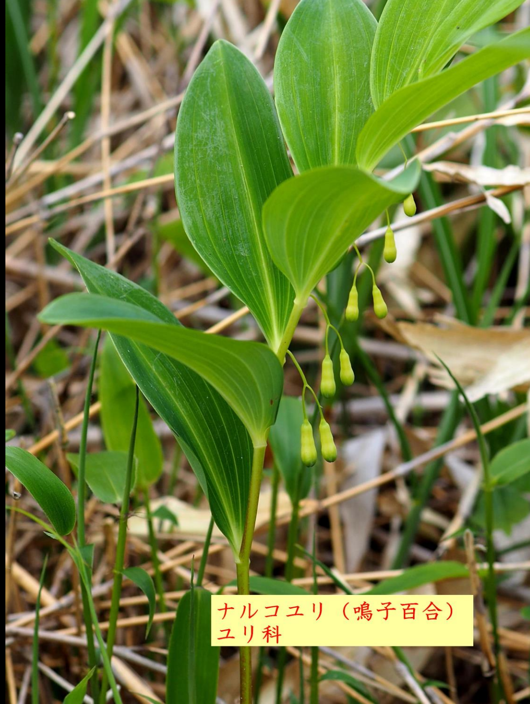
ナルコユリ（鳴子百合） ユリ科