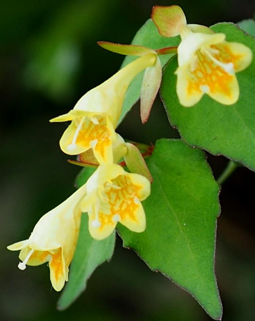
コツクバネウツギ (小衝羽根空木) スイカズラ科