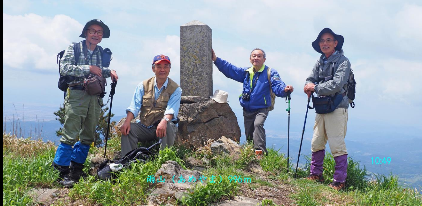
雨山 (おめやま) 996m