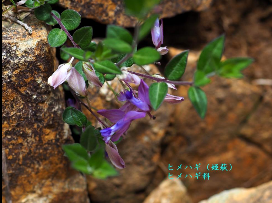
ヒメハギ (姫萩) ヒメハギ科