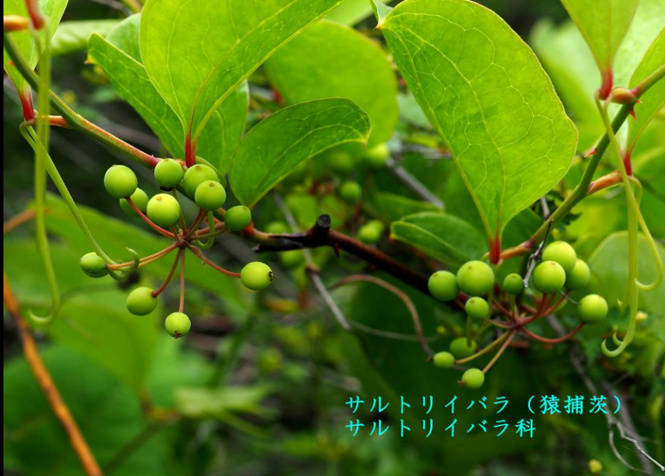
サルトリイバラ (猿捕茨) サルトリイバラ科