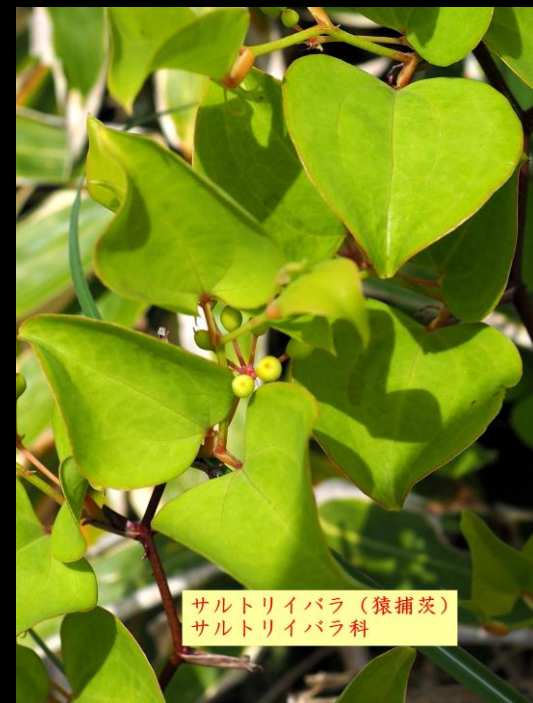
サルトリイバラ (猿捕茨) サルトリイバラ科