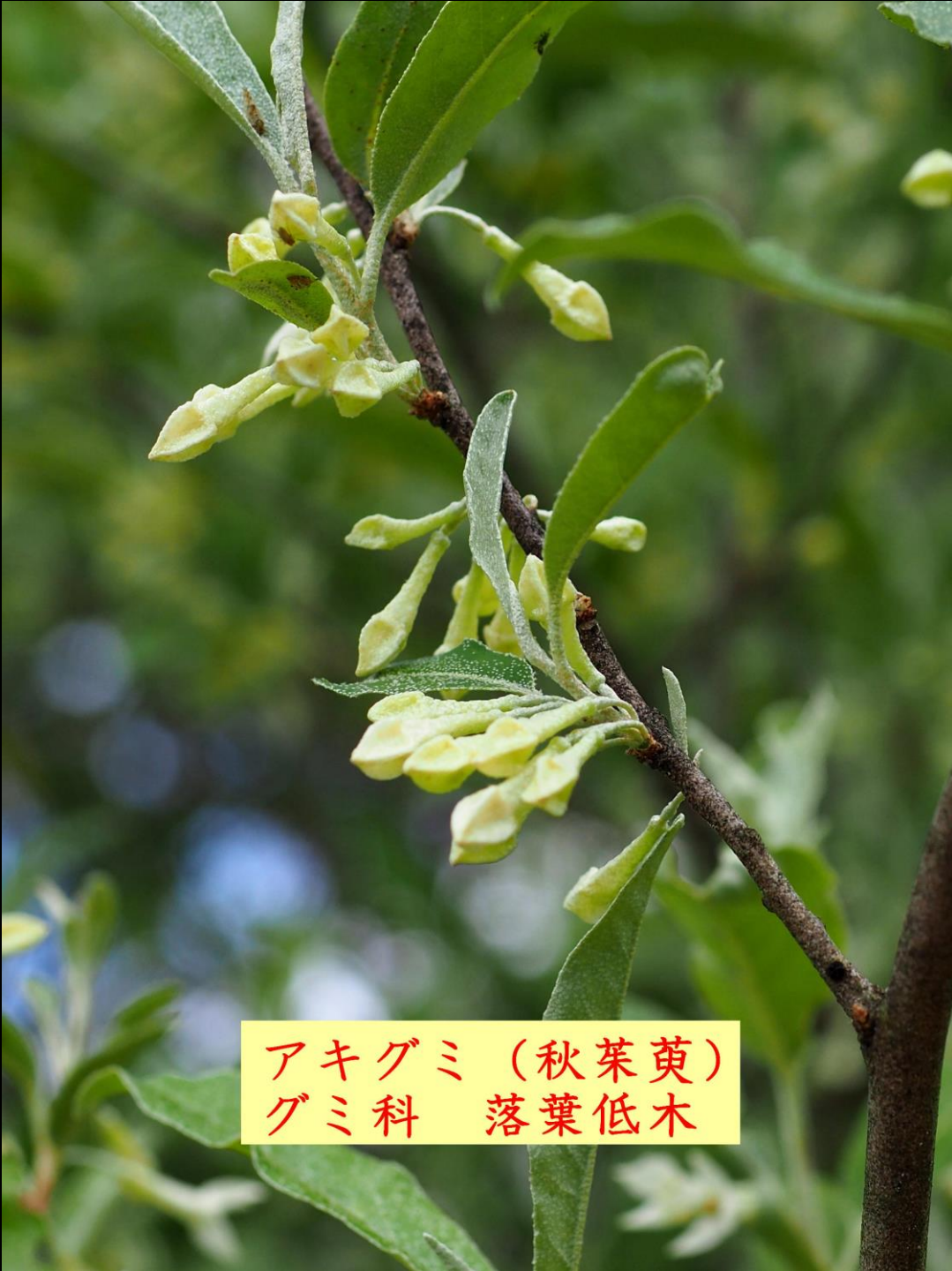
アキグミ (秋葉萸) グミ科 落葉低木