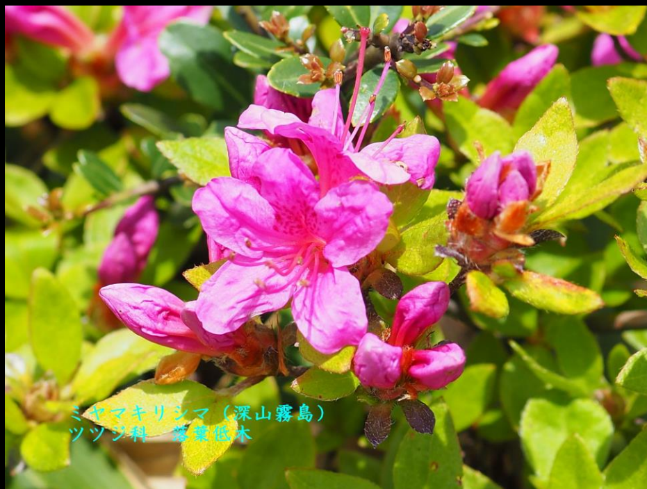
ミヤマキリシマ (深山霧島) ツツジ科 落葉低木