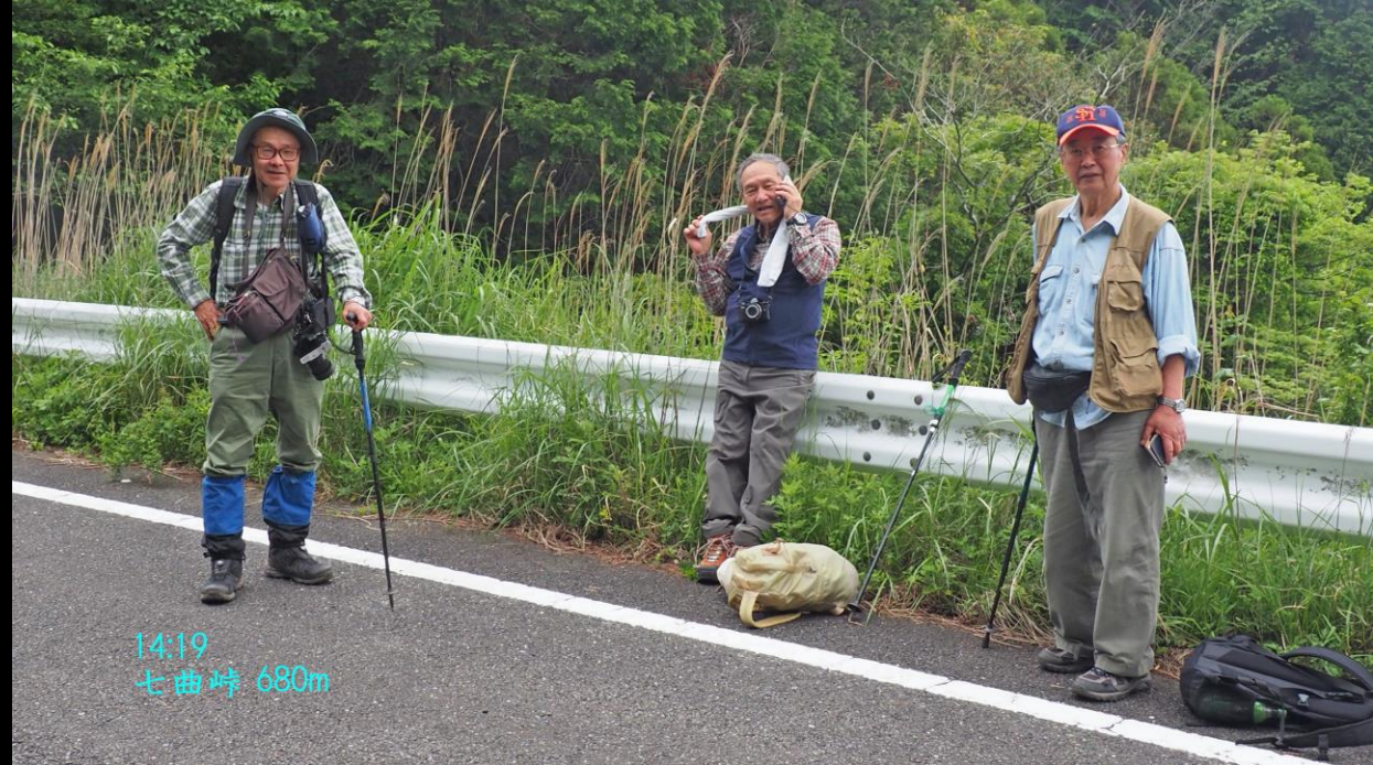
14:19 七曲峠 680m