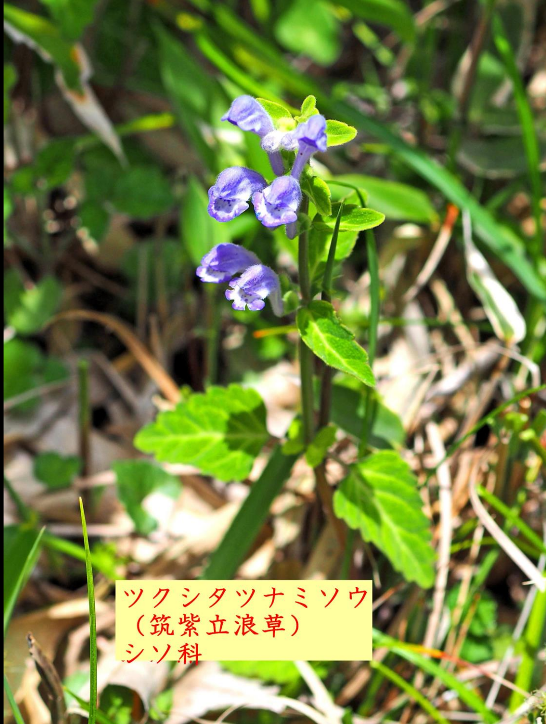
ツクシタツナミソウ (筑紫立浪草) シソ科