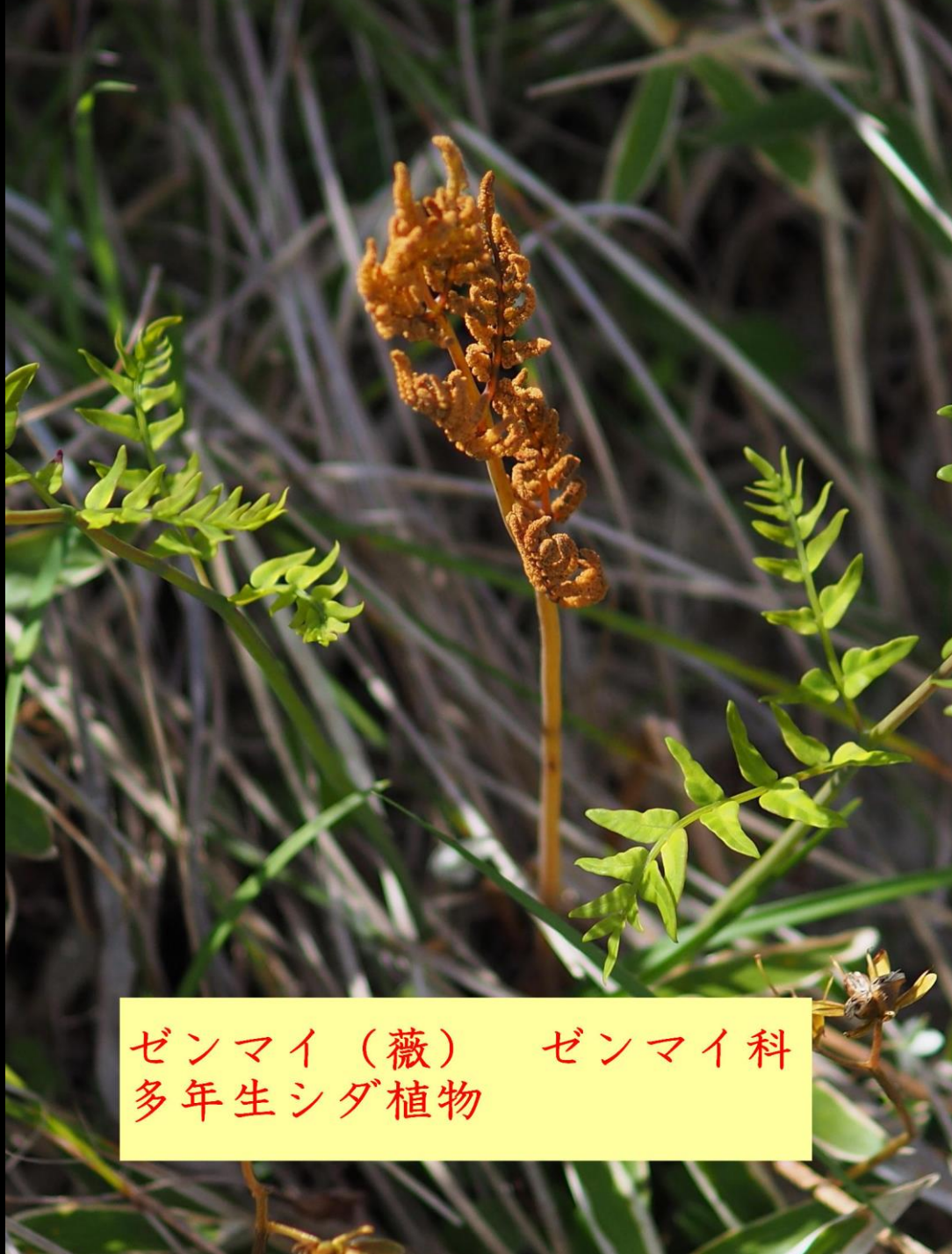
ゼンマイ（蕨） ゼンマイ科 多年生シダ植物