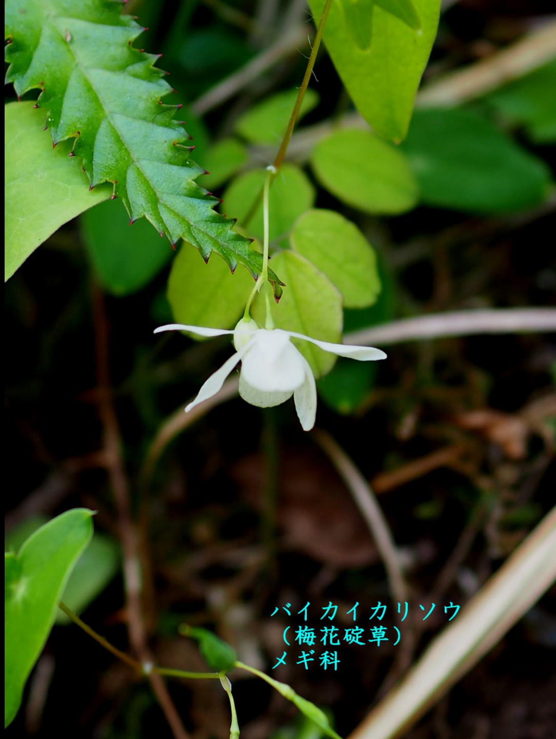
バイカイカリソウ (梅花碓草) メギ科