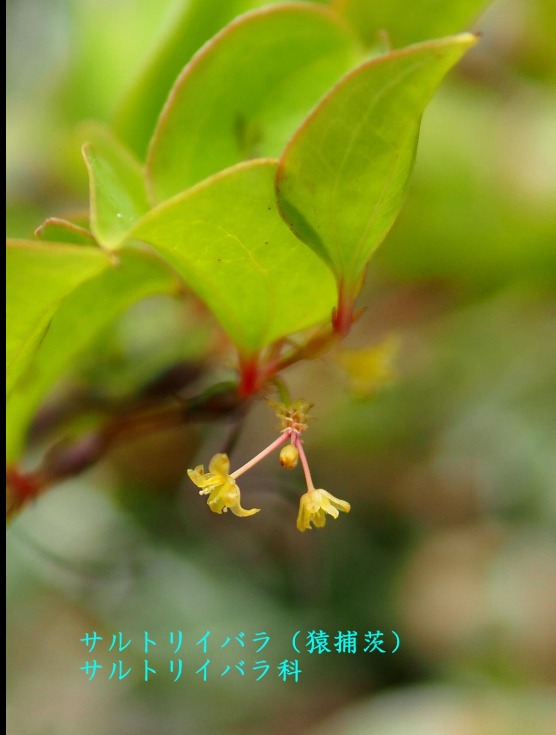
サルトリイバラ（猿捕茨） サルトリイバラ科