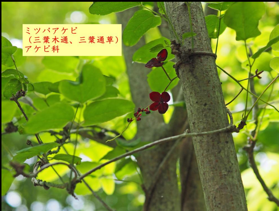
ミツバアケビ (三葉木通、三葉通草) アケビ科