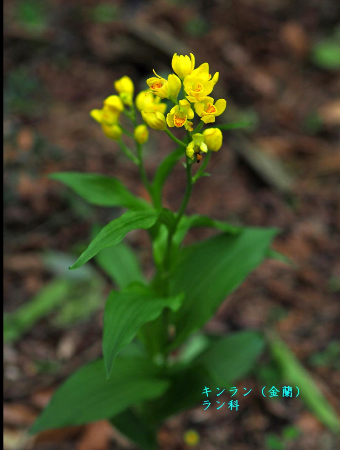
キンラン (金蘭) ラン科