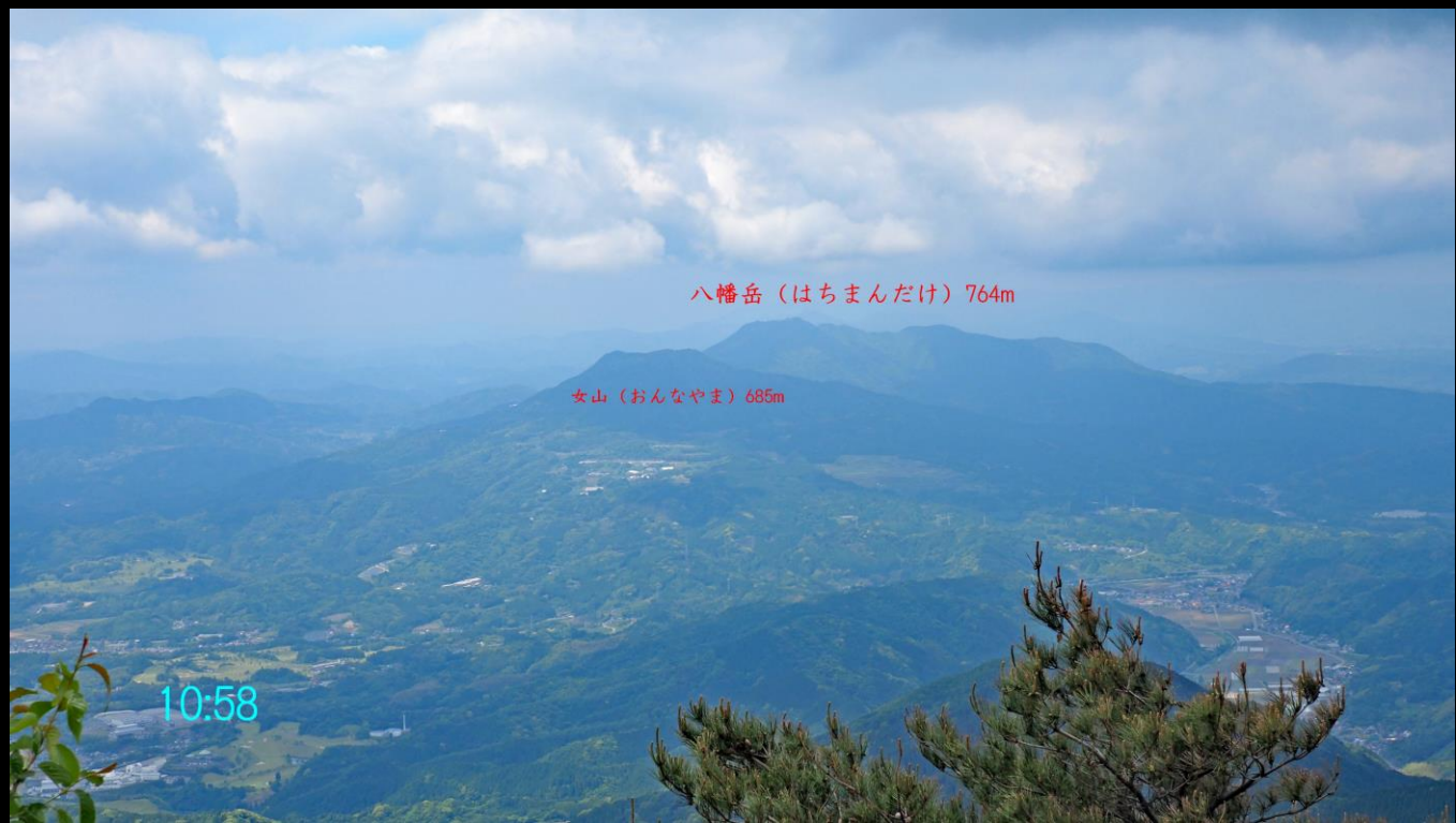
八幡岳 (はちまんだけ) 764m