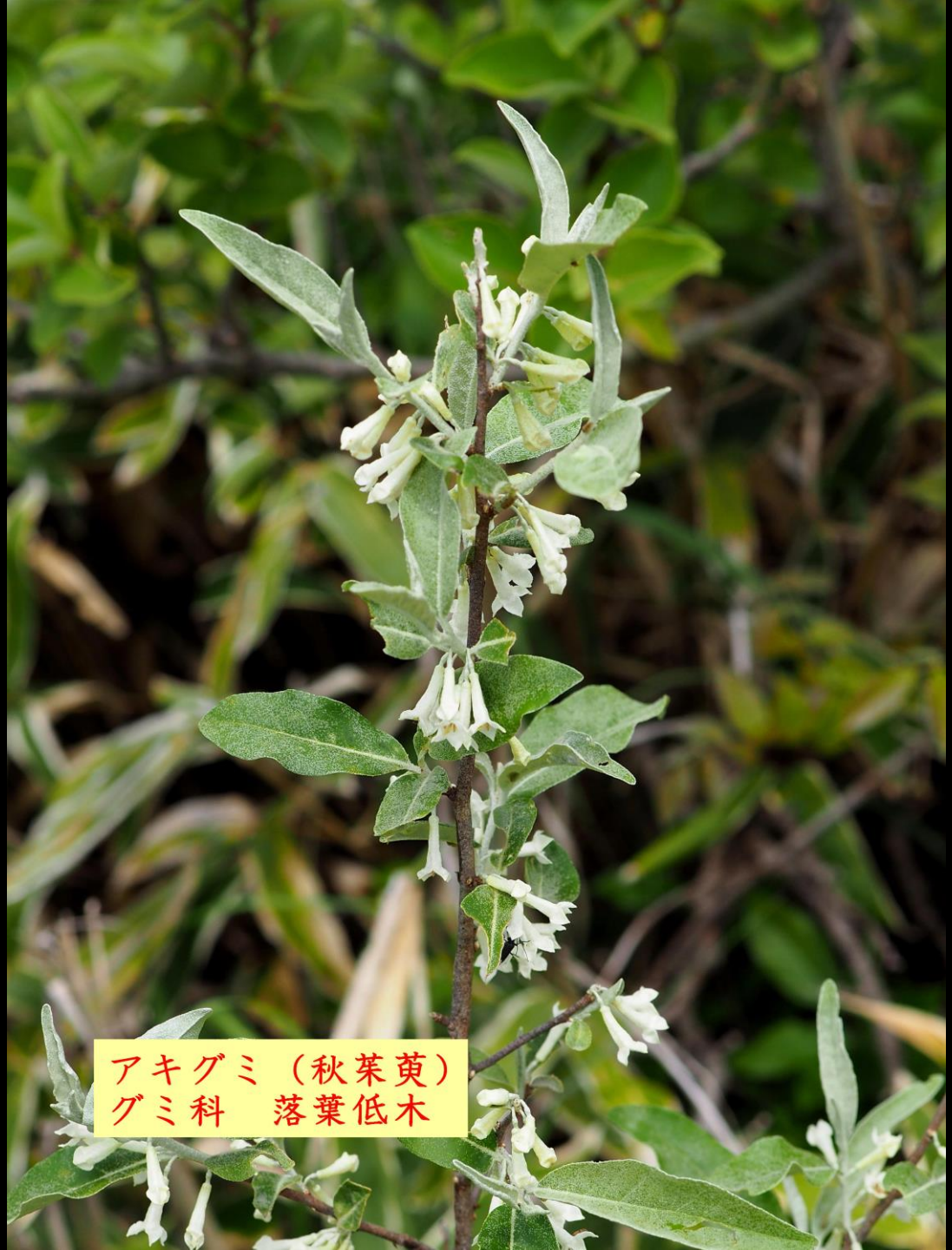
アキグミ (秋茱萸) グミ科 落葉低木