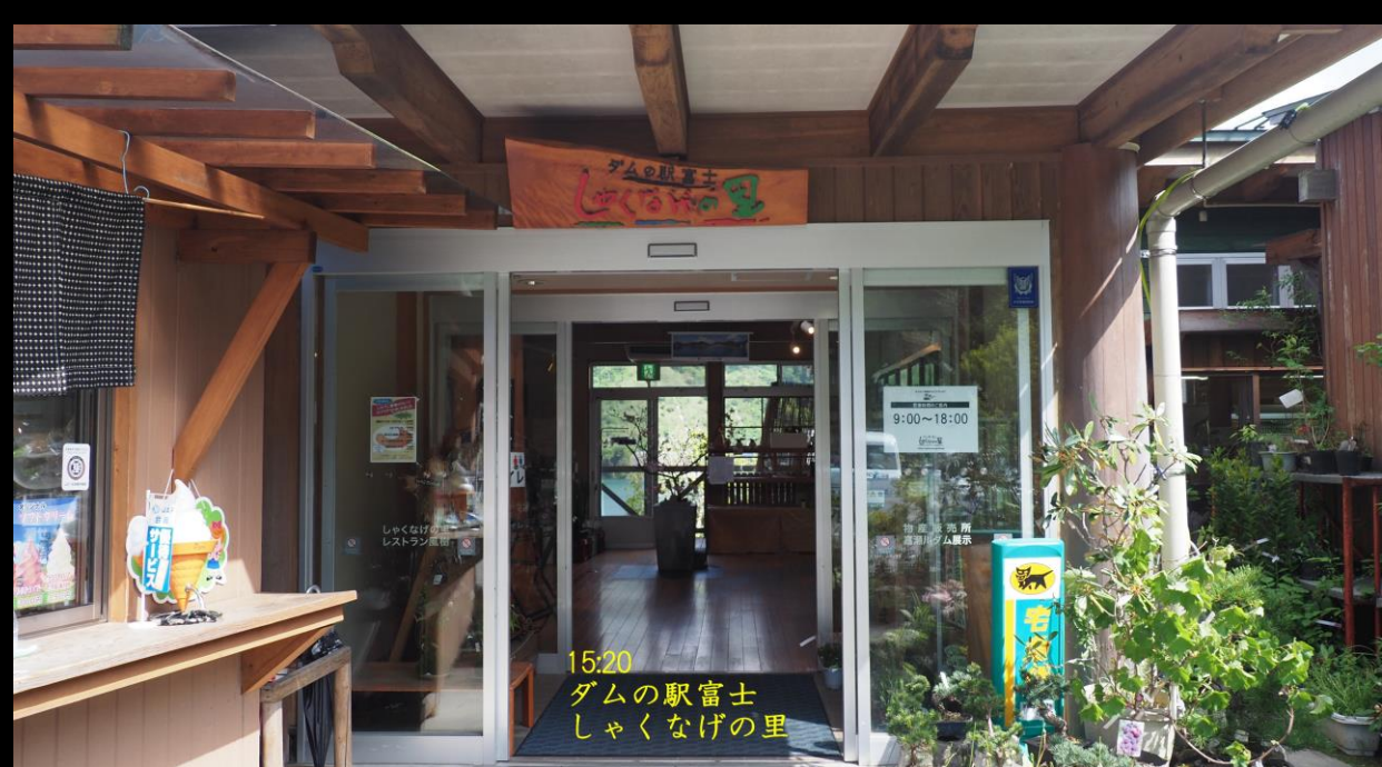
15:20 ダム駅富士 しゃくなげの里

下山後、ダム駅富士 しゃくなげの里に立ち寄り、 地元のお土産、農産物を購入した。 山中で出会った登山客もいた。 考えることは、変わりないと思った。