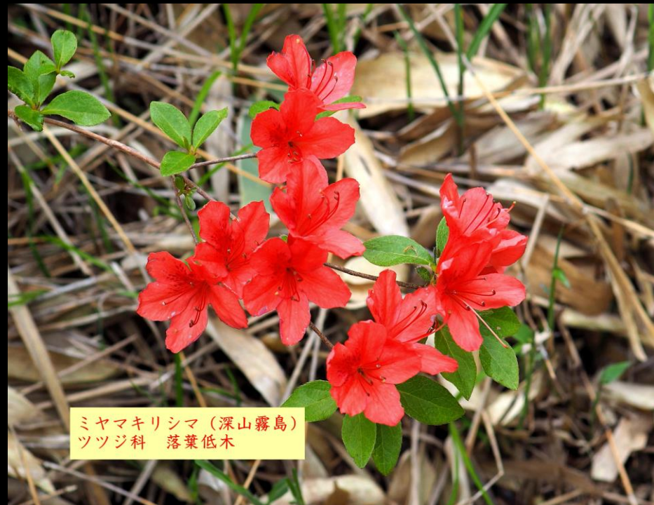
ミヤマキリシマ (深山霧島) ツツジ科 落葉低木