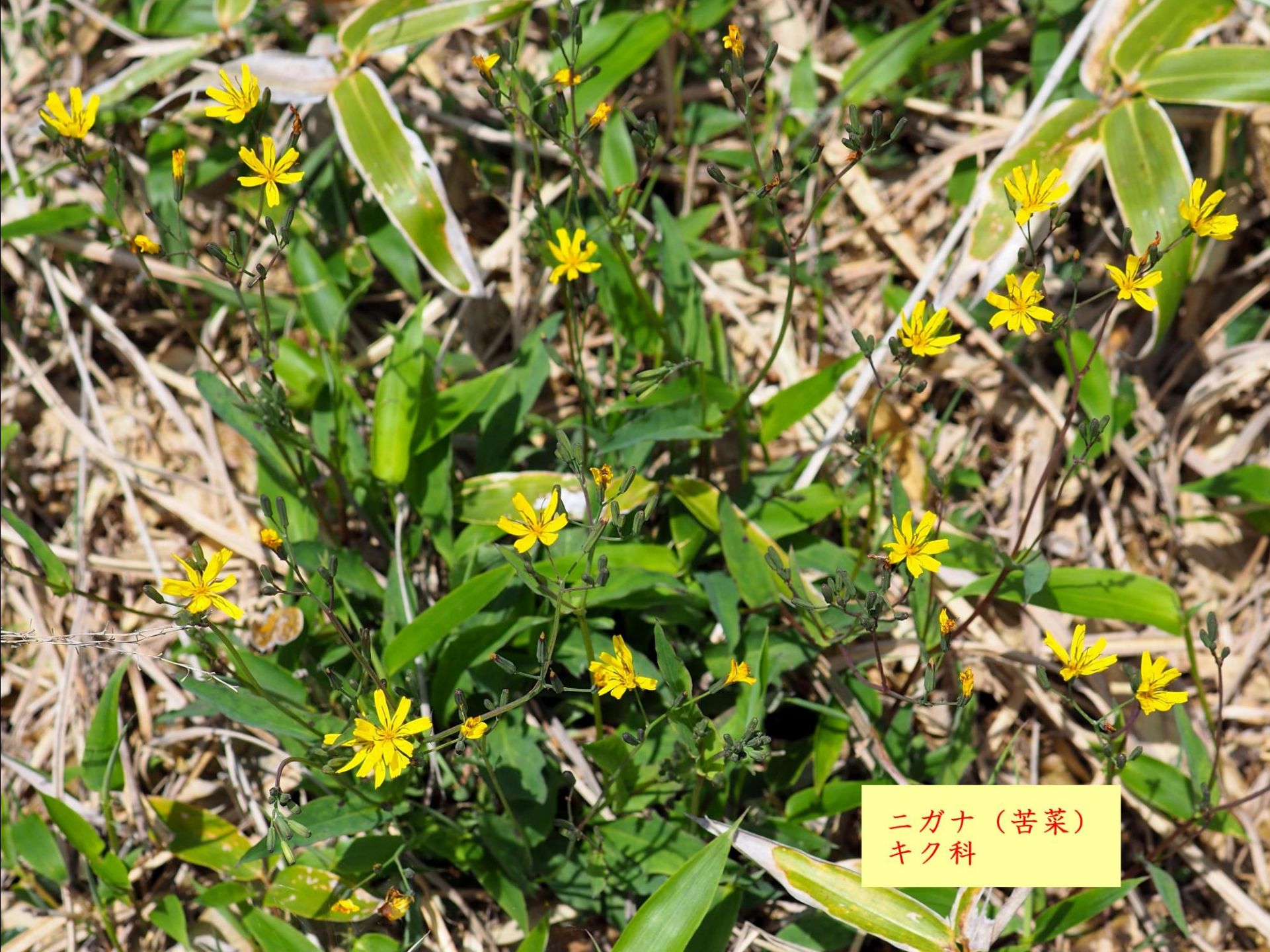
ニガナ (苦菜) キク科