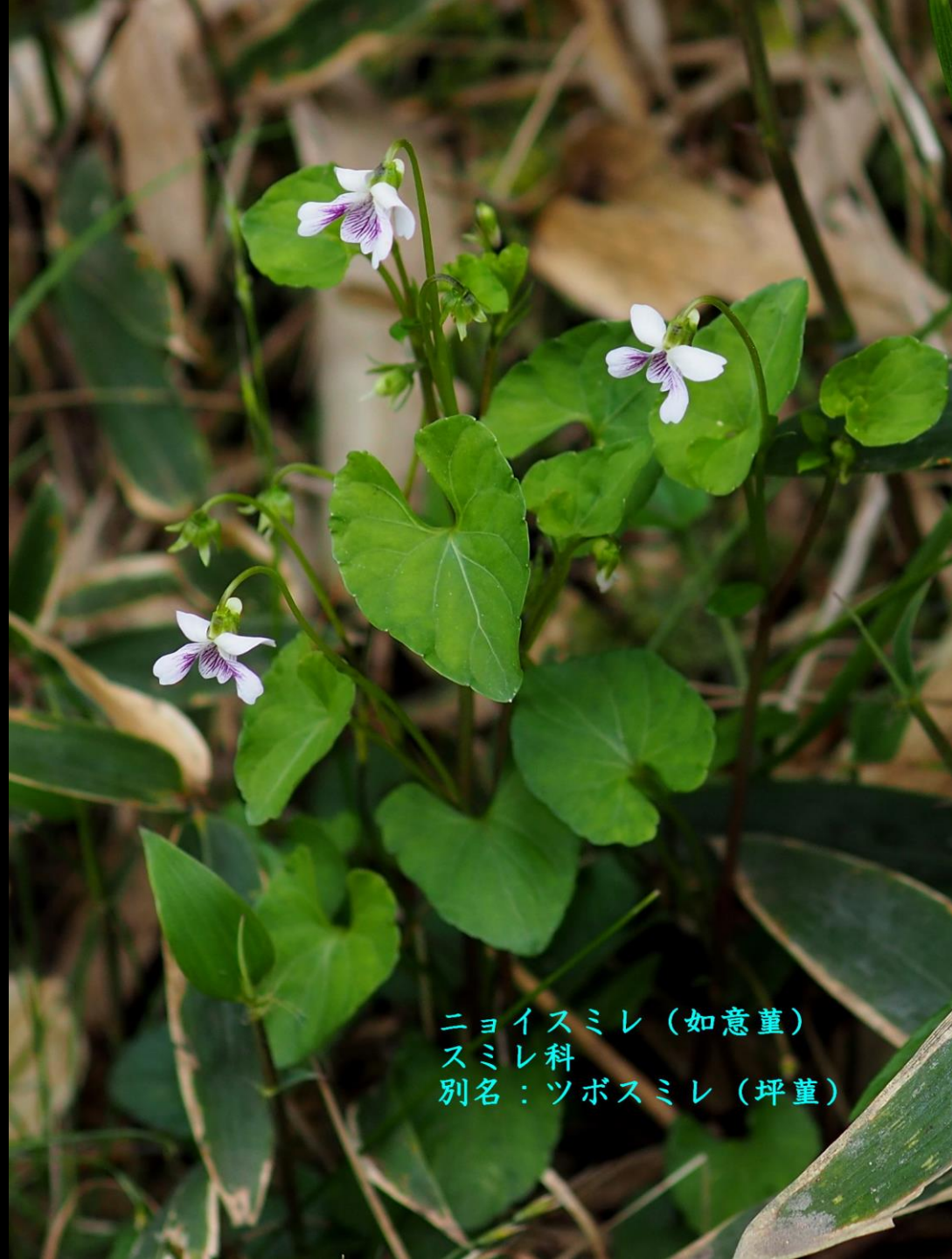
ニョイスミレ (如意堇) スミレ科 別名：ツボスミレ (坪堇)