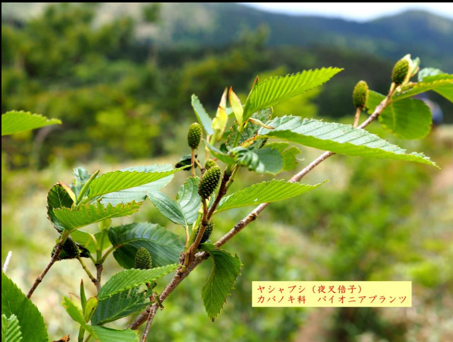
ヤシャブシ (夜叉倍子) カバノキ科 バイオニアプラント