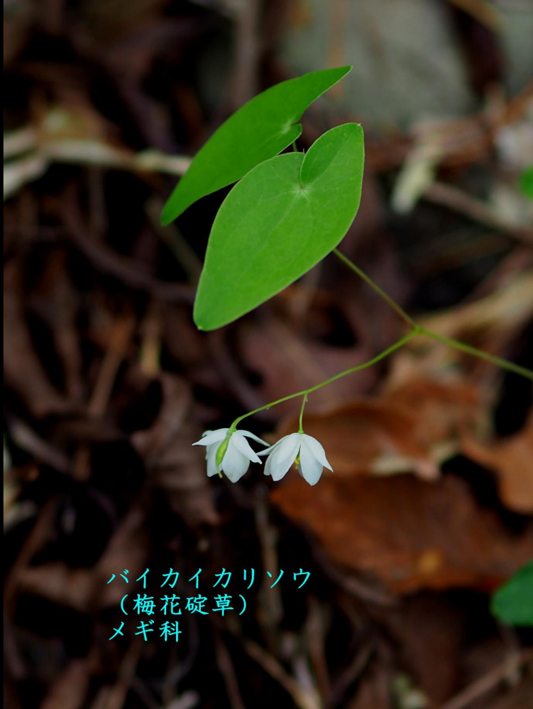
バイカイカリソウ (梅花碇草) メギ科