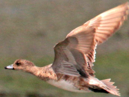
ヒドリガモ(緋鳥鴨)メス ガンカモ科 L=49cm