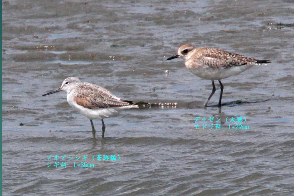
アオアシシギ (蒼脚鷗) シギ科 L=35cm