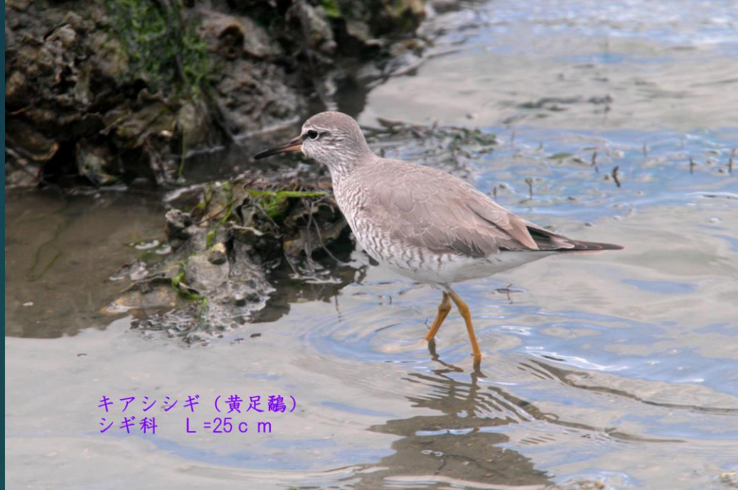
キアシシギ (黄足鷗) シギ科 L=25cm