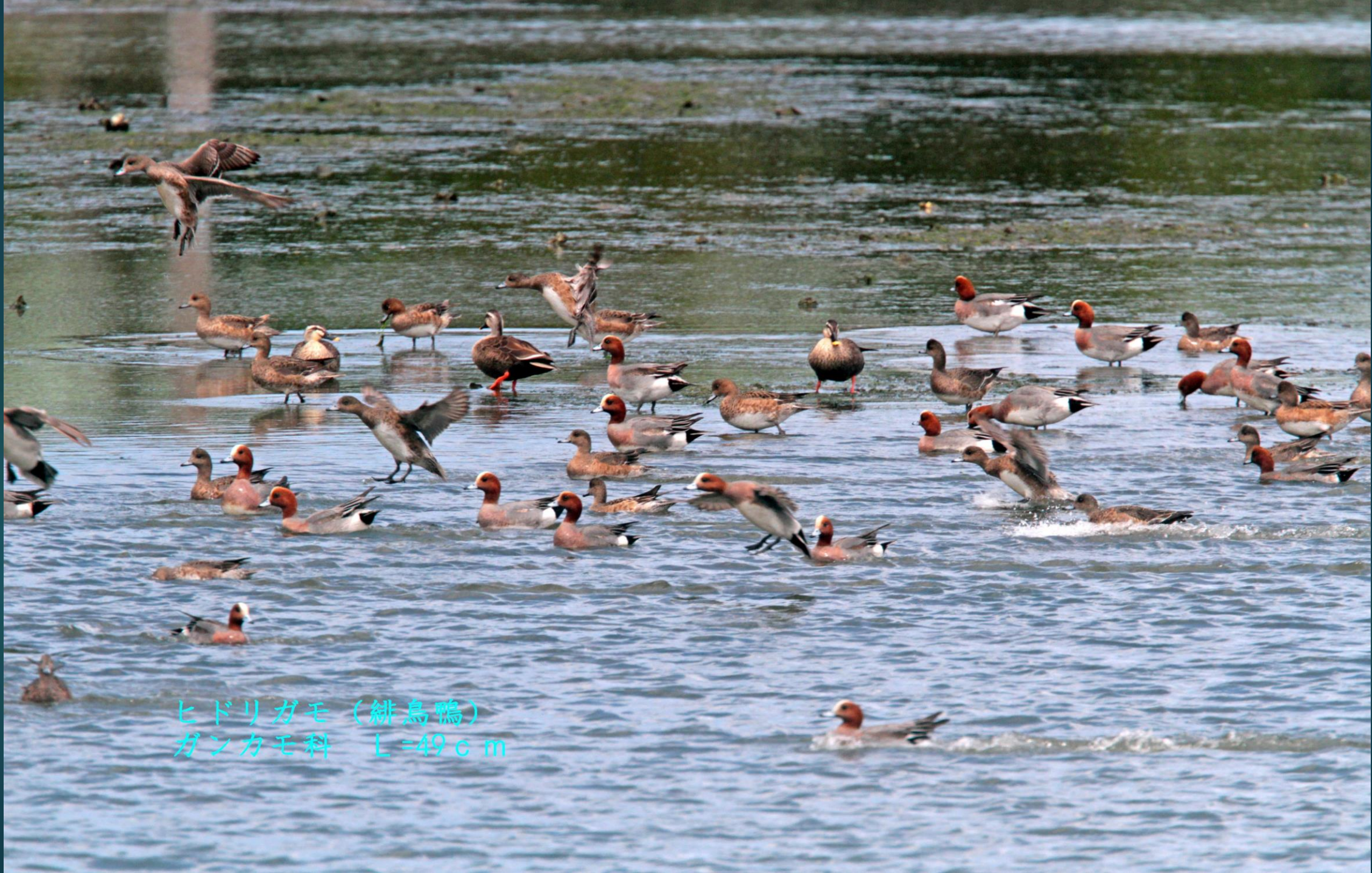
ヒドリガモ (緋鳥鴨) ガンカモ科 L=49cm