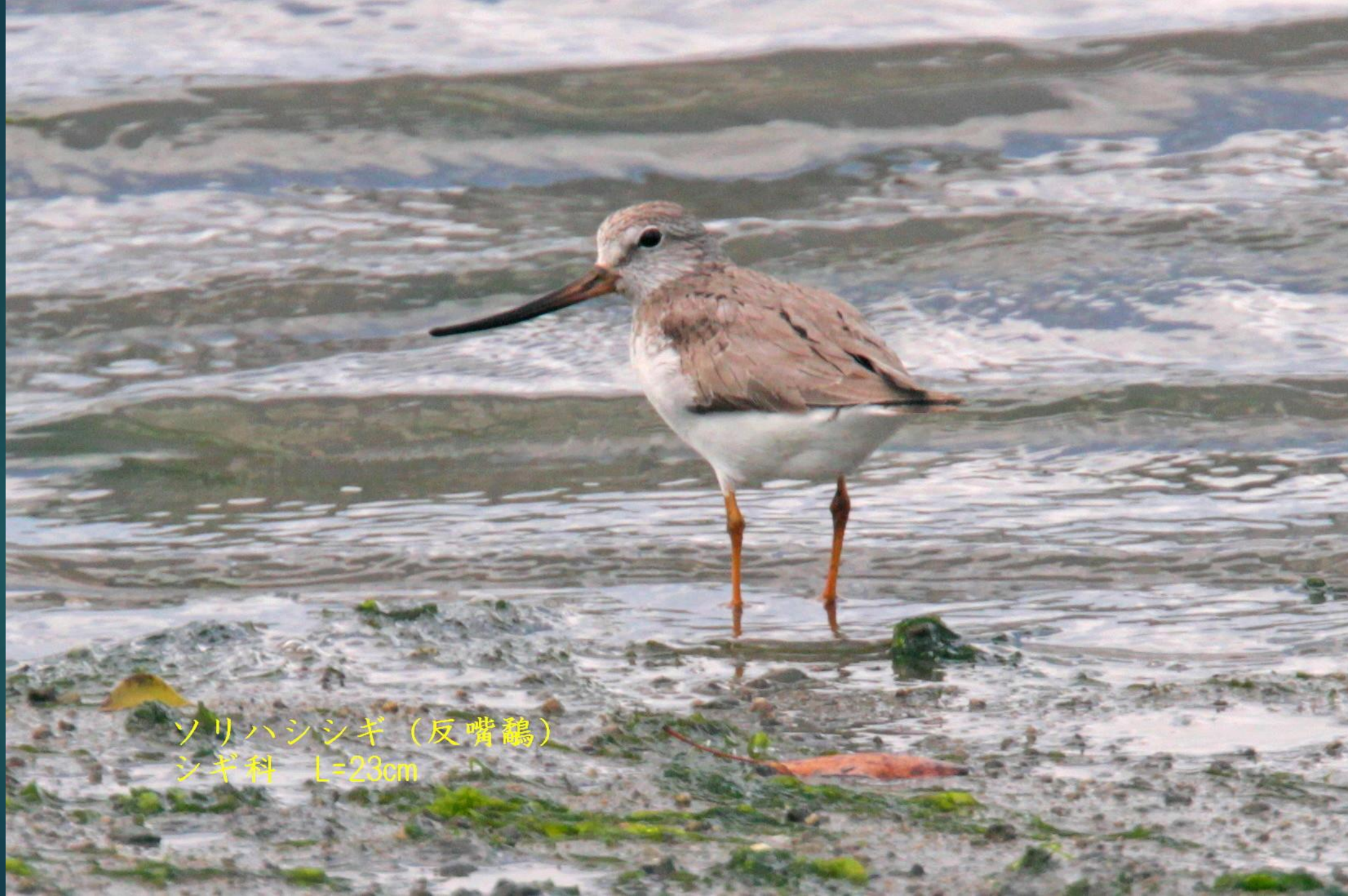
ソリハシシギ (反嘴鷸) シギ科 L=23cm