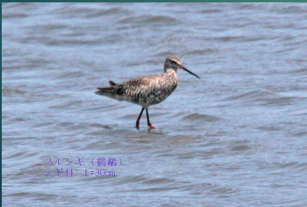
ツルシギ (鶴鷗) シギ科 L=30cm