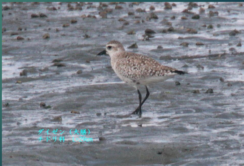
ダイゼン (大膳) チドリ科 L=29cm