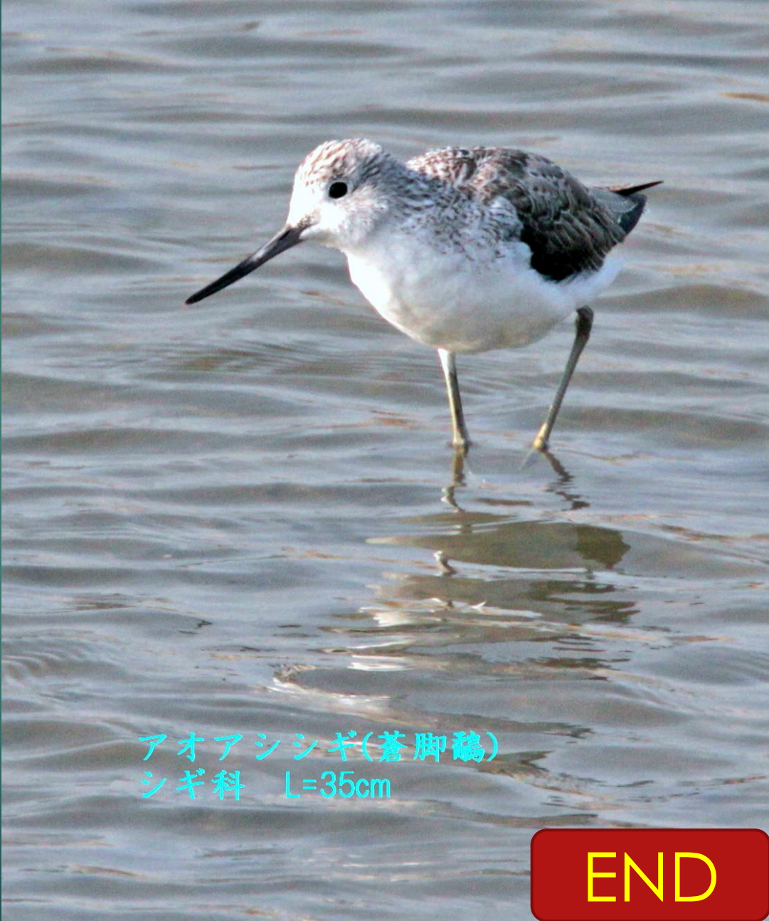
アオアシシギ(蒼脚鷸) シギ科 L=35cm