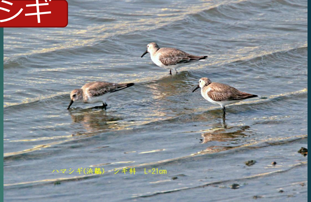
ハマシギ(滨鹬) シギ科 L=21cm