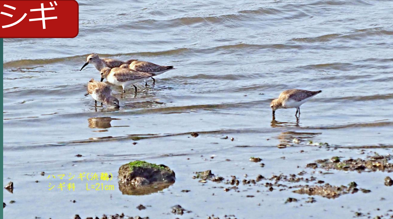
ハマシギ(浜鷗) シギ科 L=21cm