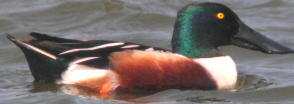
ハシビロガモ（嘴広鴨）オス ガンカモ科 L=50cm