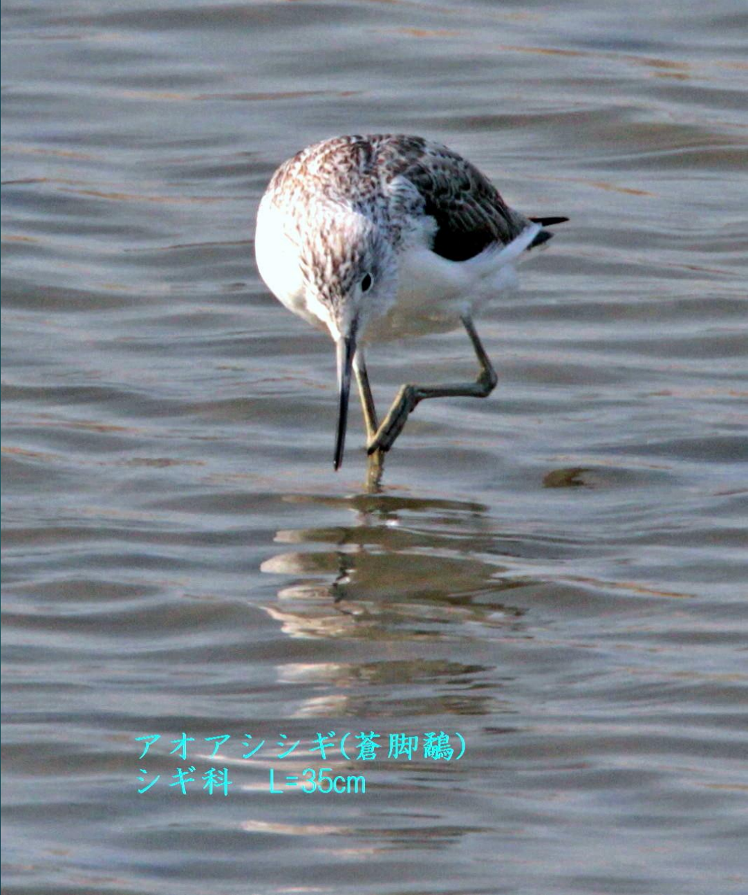
アオアシシギ(蒼脚鷸) シギ科 L=35cm