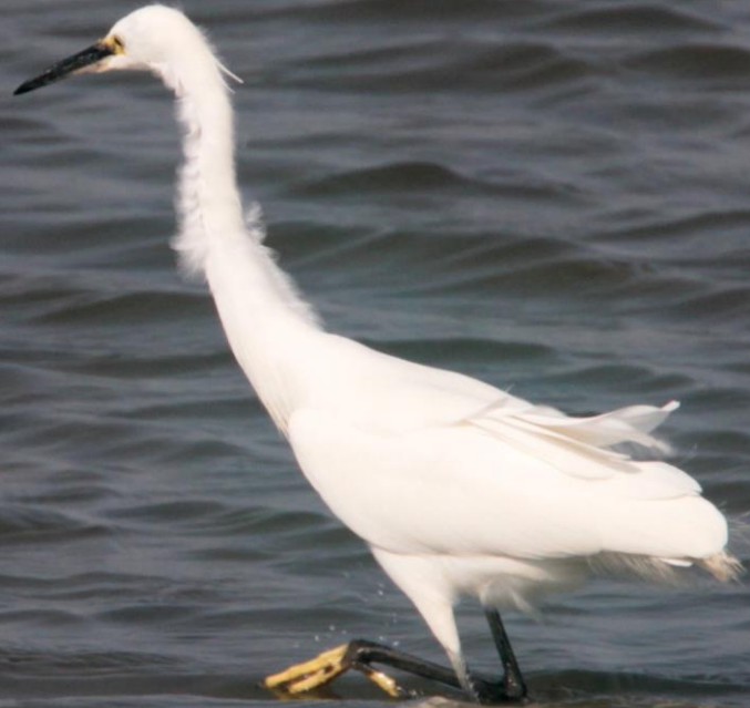
コサギ (小鷺) サギ科 L=61cm