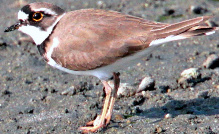
コチドリ (小千鳥) チドリ科 L=16cm