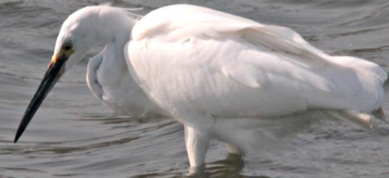
コサギ (小鷺) サギ科 L=61cm