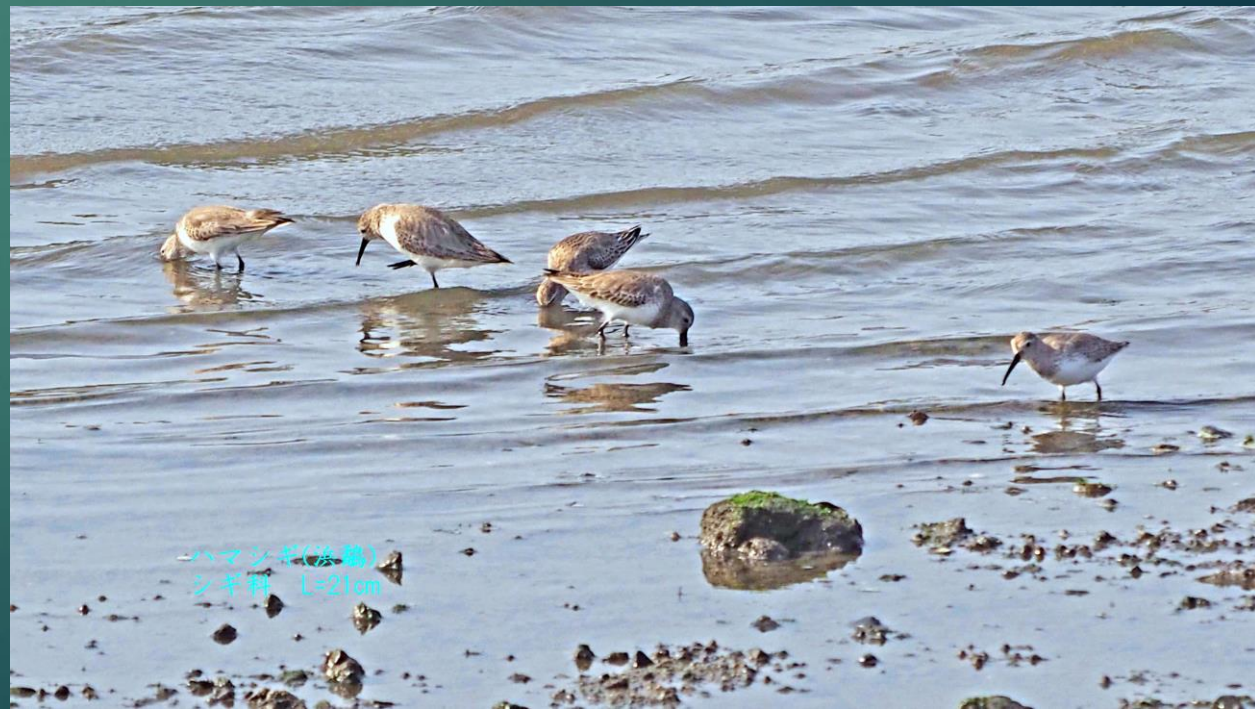
ハマシギ(浜鷗) シギ科 L=21cm