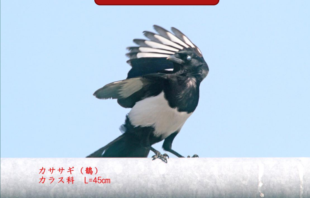
カササギ (鶻) カラス科 L=45cm