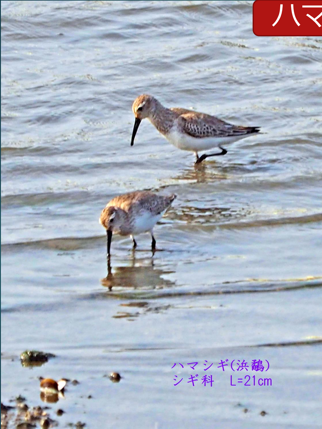
ハマシギ(浜鷗) シギ科 L=21cm