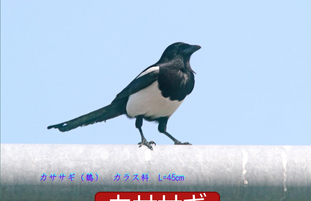
カササギ (鶻) カラス科 L=45cm