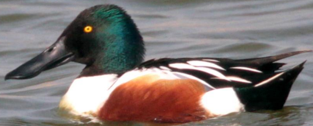
ハシビロガモ（嘴広鴨）オス ガンカモ科 L=50cm