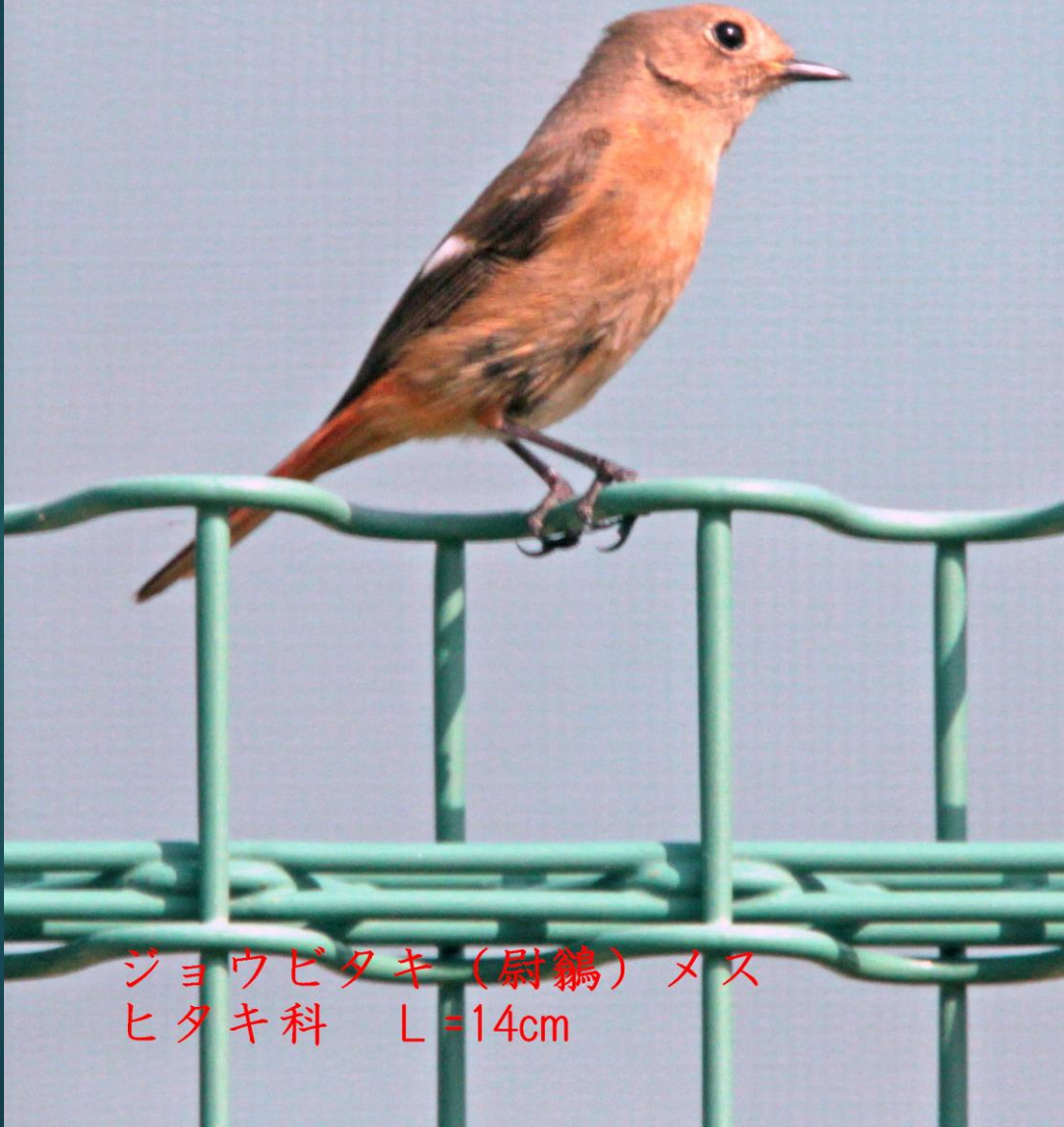
ジョウビタキ (尉鶉) メス ヒタキ科 L=14cm