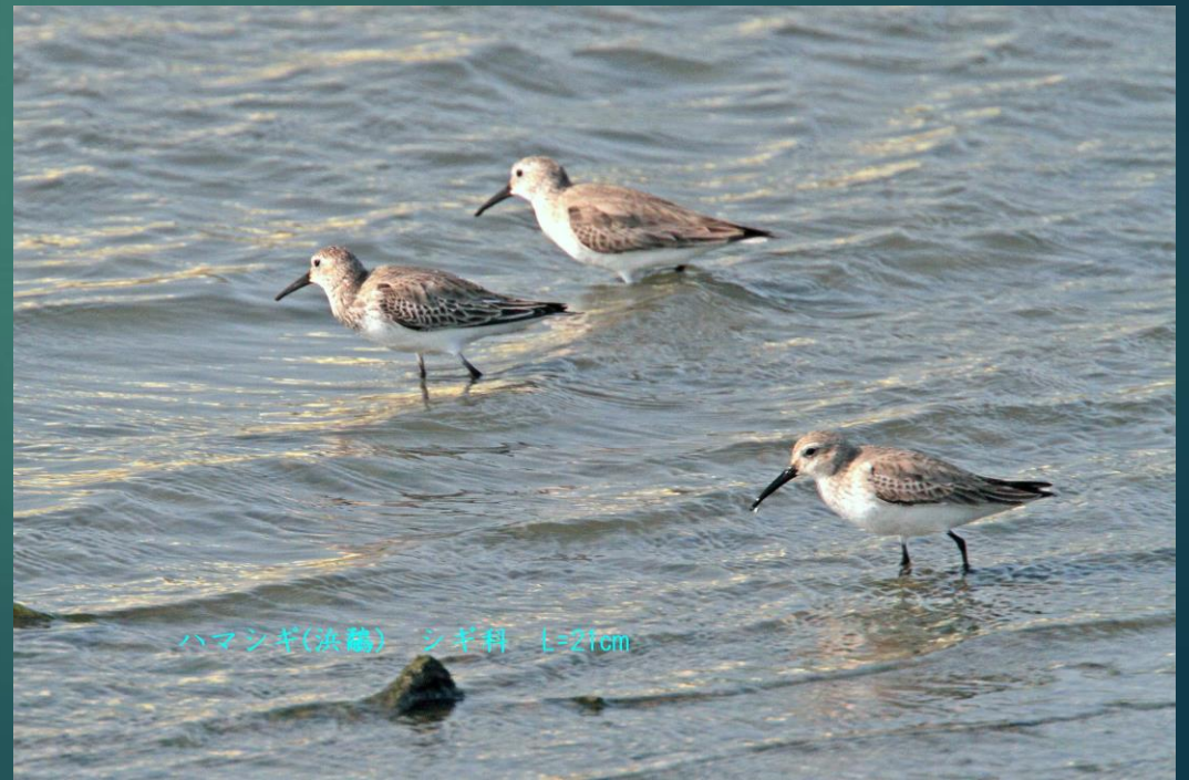
ハマシギ(滨鹬) シギ科 L=21cm