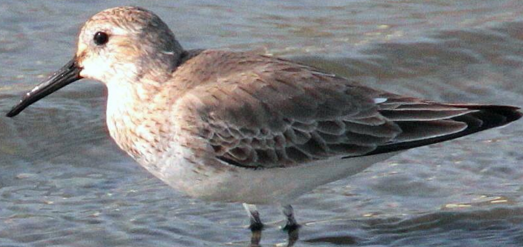
ハマシギ(滨鹬) シギ科 L=21cm