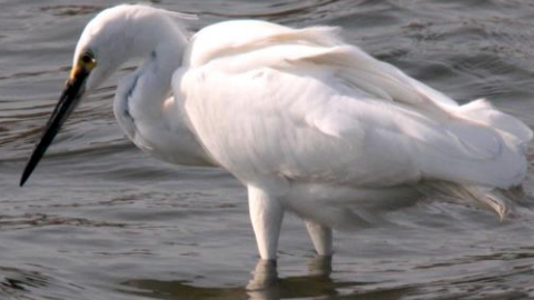
コサギ (小鷺) サギ科 L=61cm