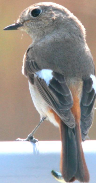
ジョウビタキ (尉鶺) メス ヒタキ科 L=14cm