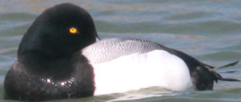
スズガモ（鈴鴨） ガンカモ科 L=オス47cm