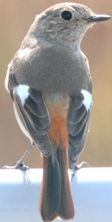
ジョウビタキ (尉鶺) メス ヒタキ科 L=14cm