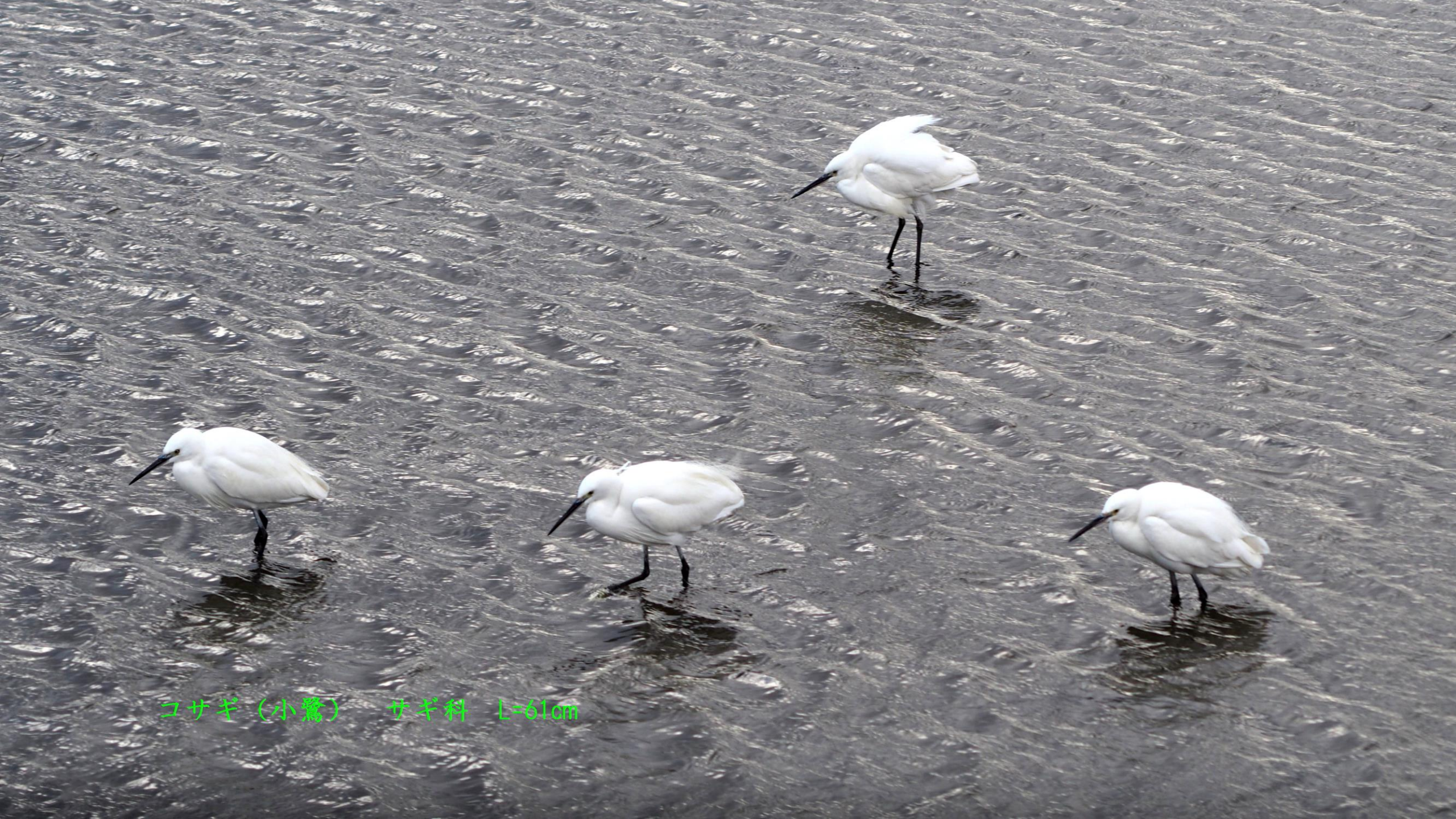
コサギ (小鷺) サギ科 L=61cm