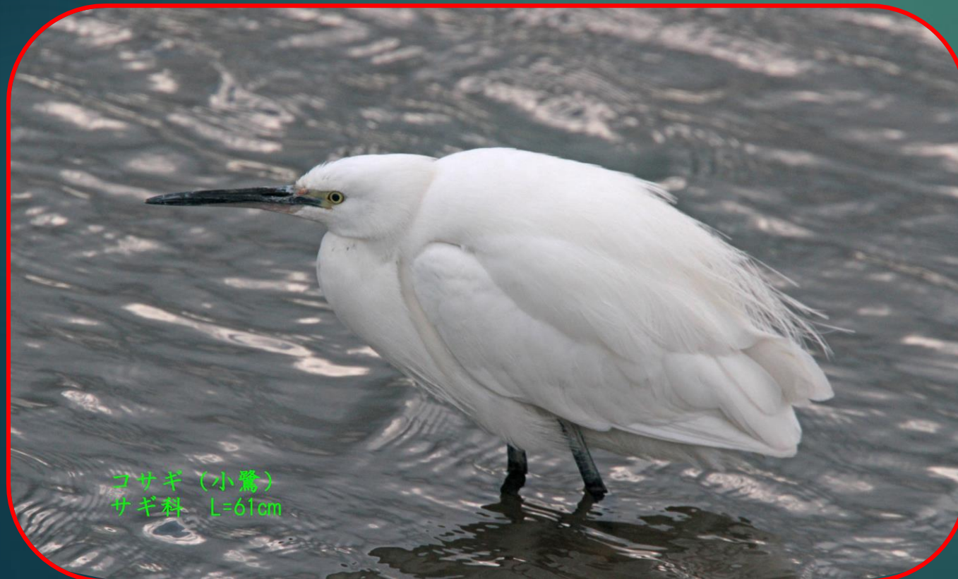
コサギ (小鷺) サギ科 L=61cm