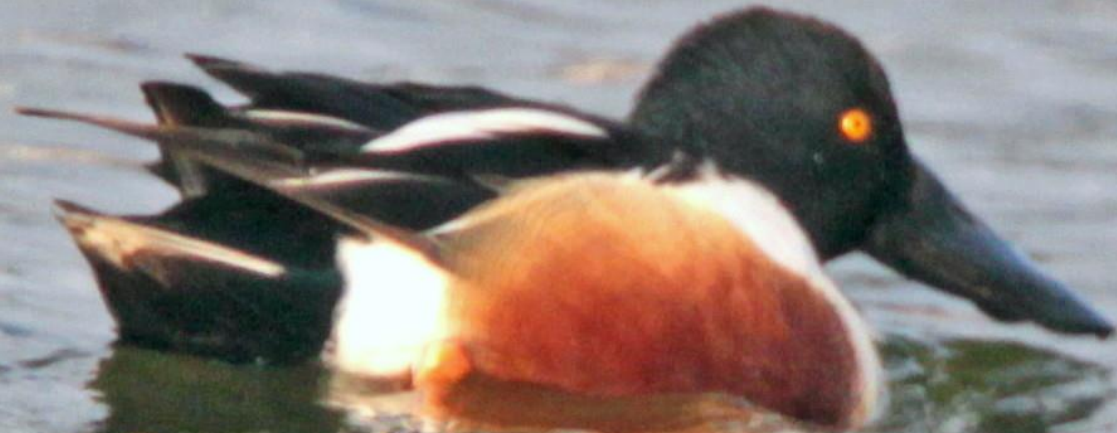
ハシビロガモ(嘴広鴨)オス ガンカモ科 L=50cm