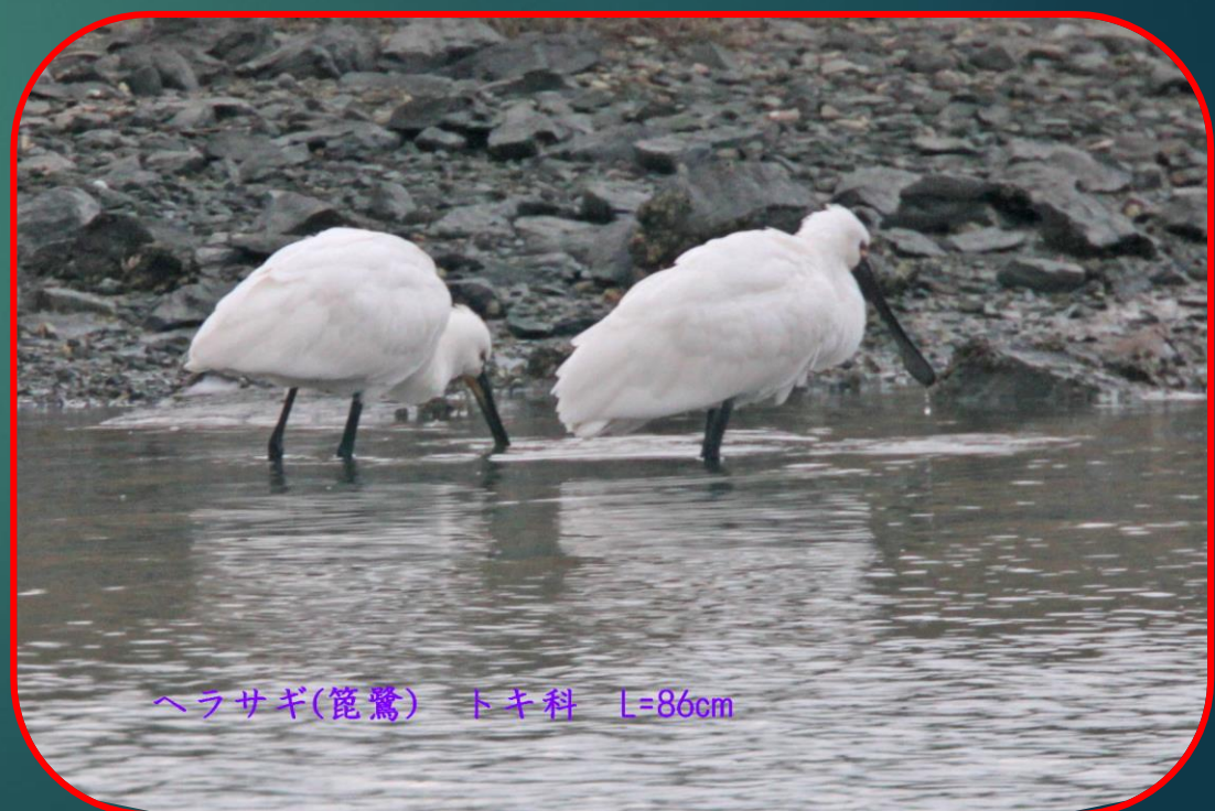
ヘラサギ (篋鷺) トキ科 L=86cm