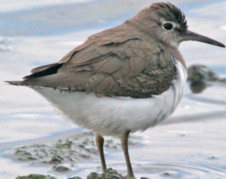
イソシギ(磯鶺) シギ科 L=20cm