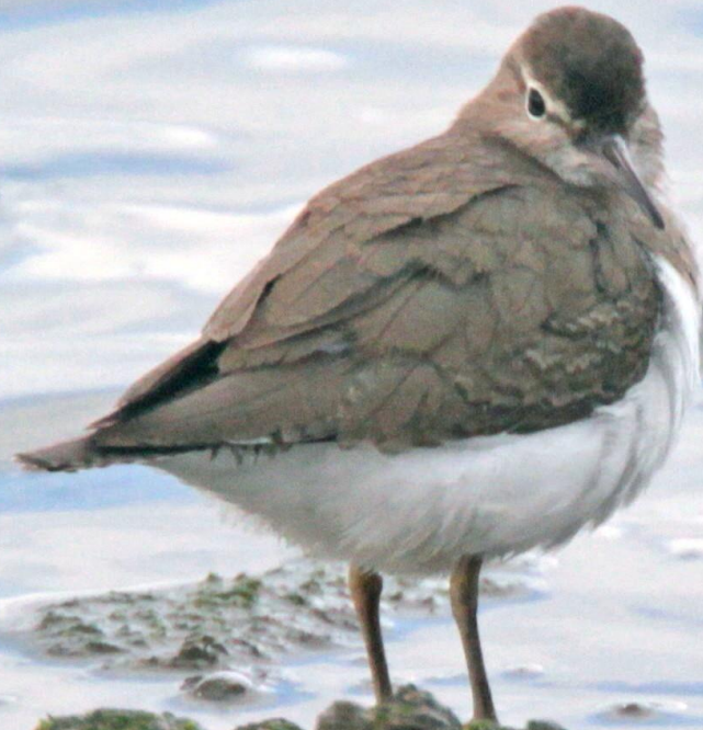
イソシギ(磯鶺) シギ科 L=20cm