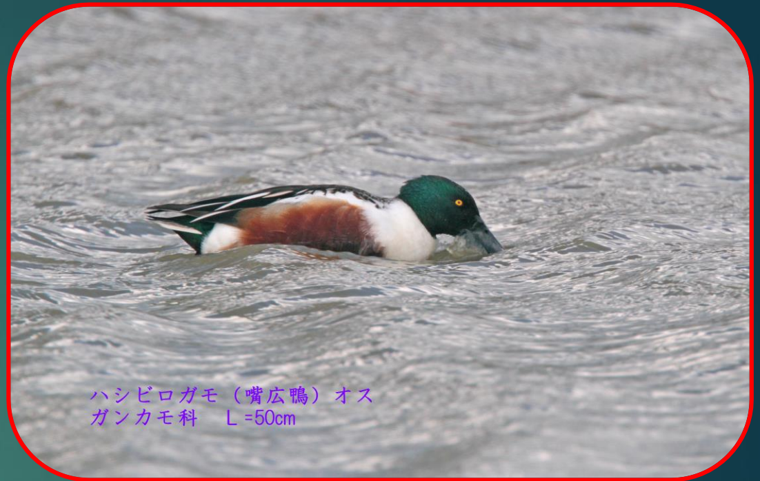
ハシビロガモ (嘴広鴨) オス ガンカモ科 L=50cm