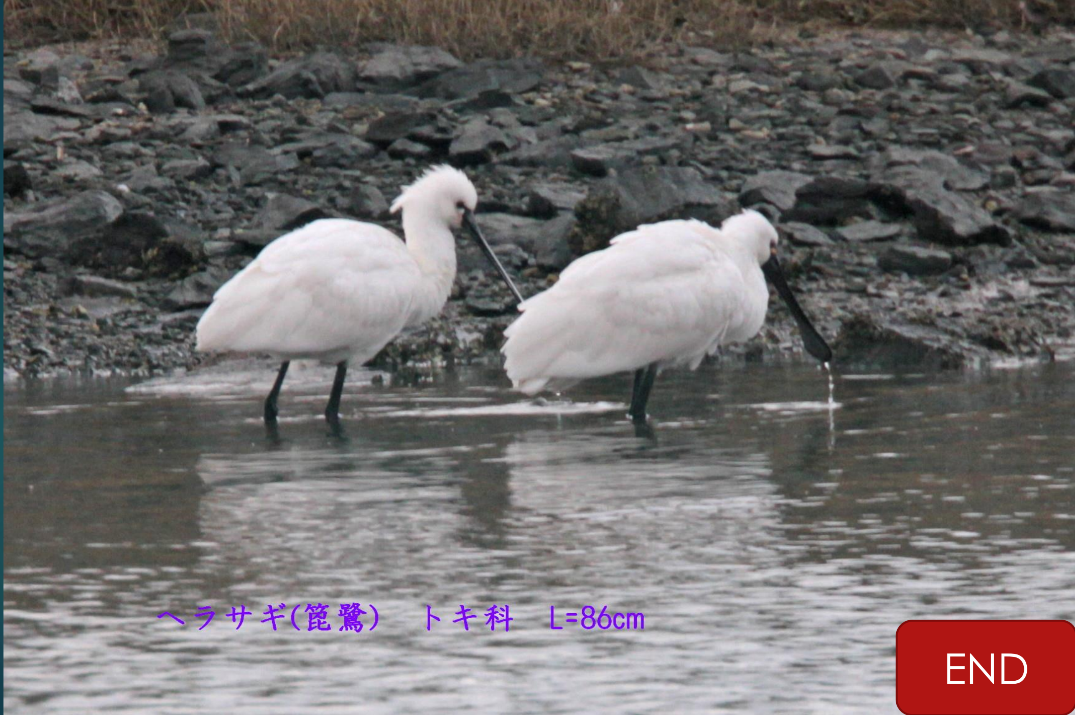
ヘラサギ(篋鷺) トキ科 L=86cm