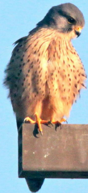
チョウゲンボウ(長元坊) ハヤブサ科 L=オス33cm