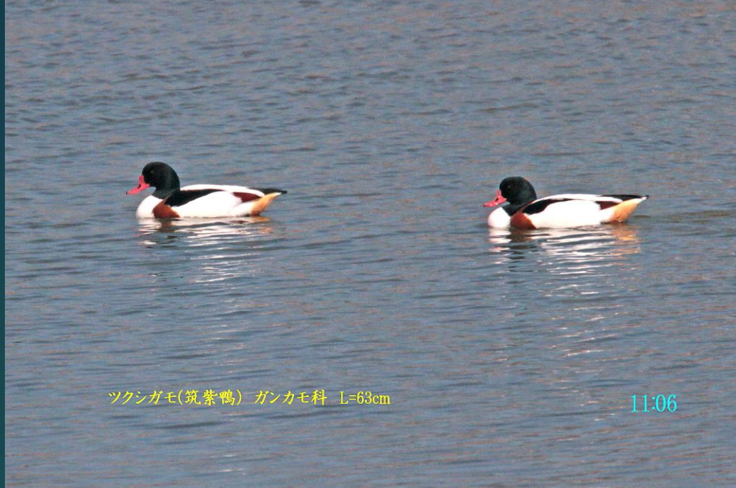
ツクシガモ(筑紫鴨) ガンカモ科 L=63cm