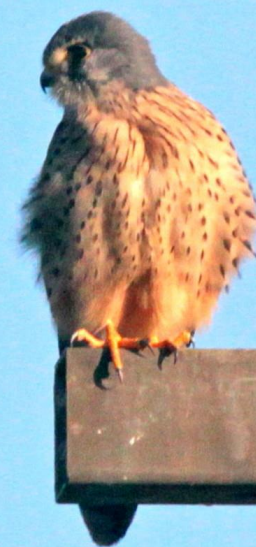
チョウゲンボウ(長元坊) ハヤブサ科 L=オス33cm