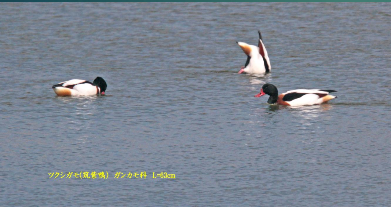
ツクシガモ(筑紫鴨) ガンカモ科 L=63cm