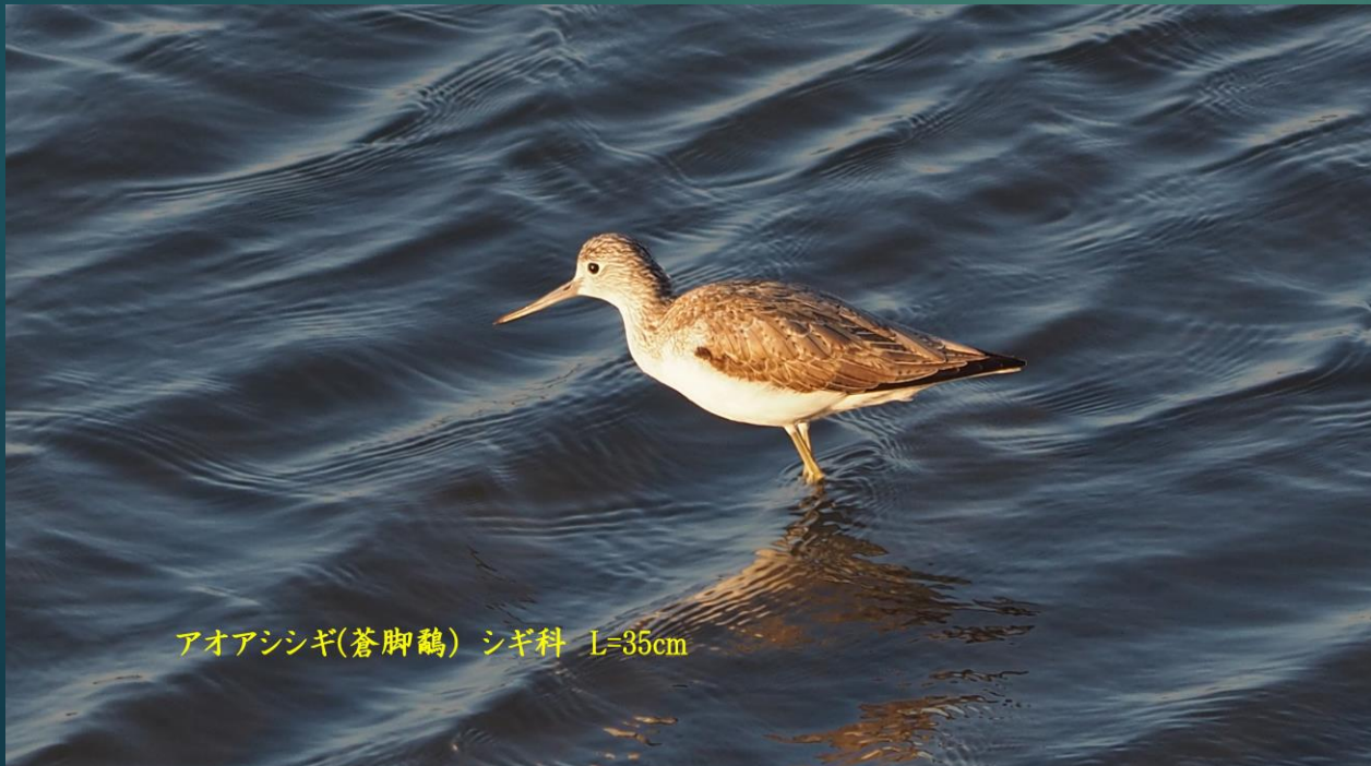
アオアシシギ(蒼脚鷸) シギ科 L=35cm