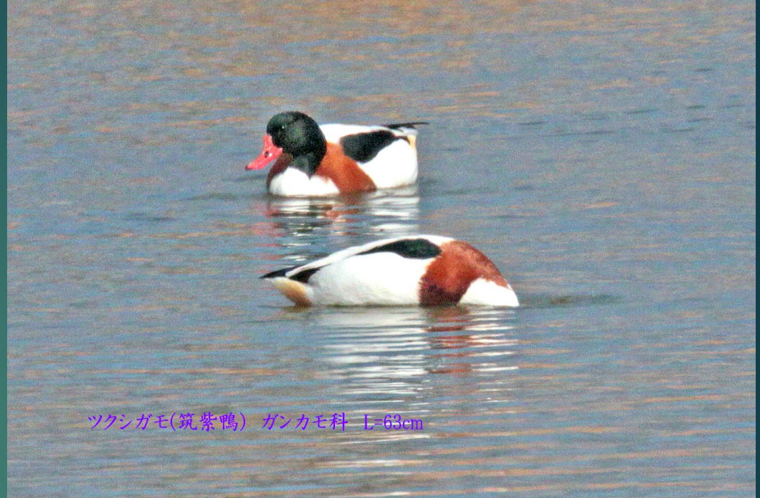
ツクシガモ(筑紫鴨) ガンカモ科 L=63cm