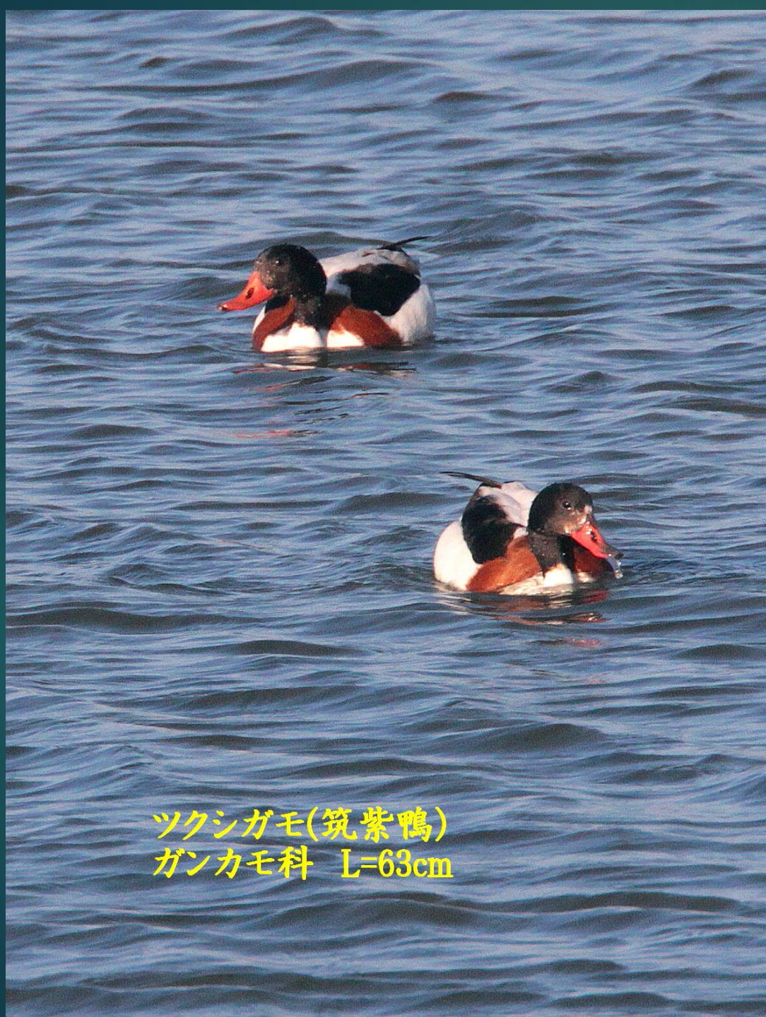
ツクシガモ(筑紫鴨) ガンカモ科 L=63cm