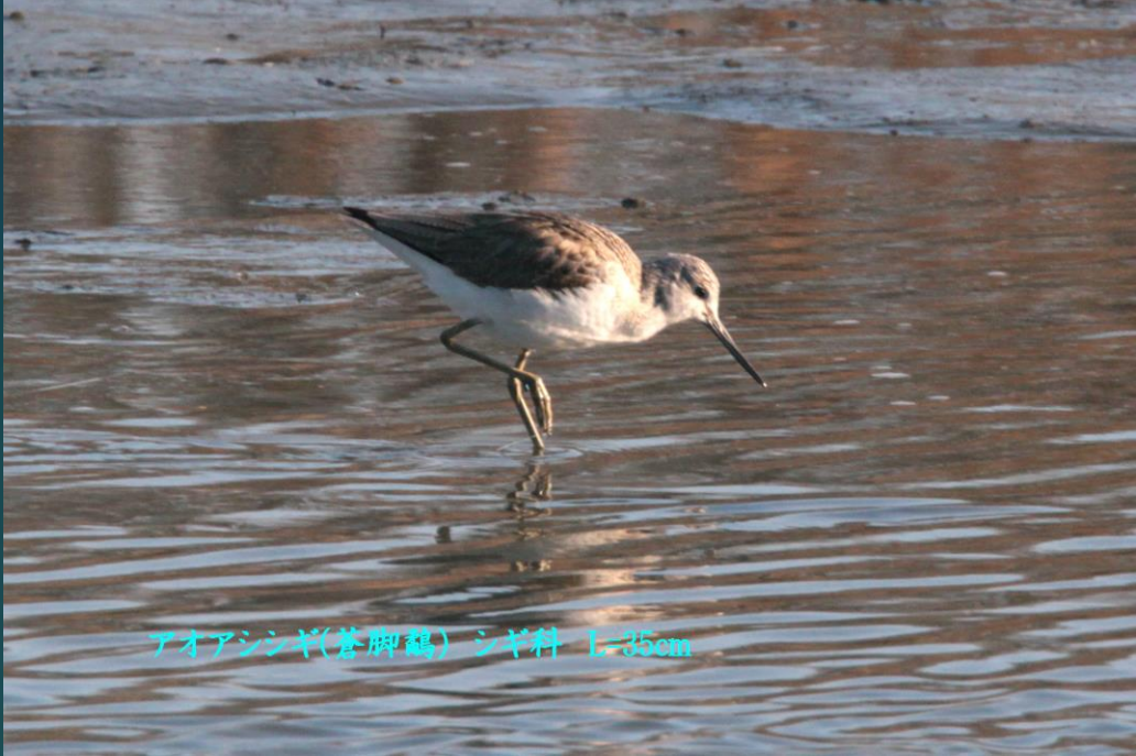
アオアシシギ(蒼脚鷸) シギ科 L=35cm