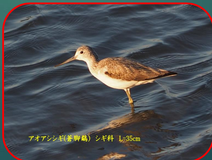
アオアシシギ(蒼脚鷗) シギ科 L=35cm