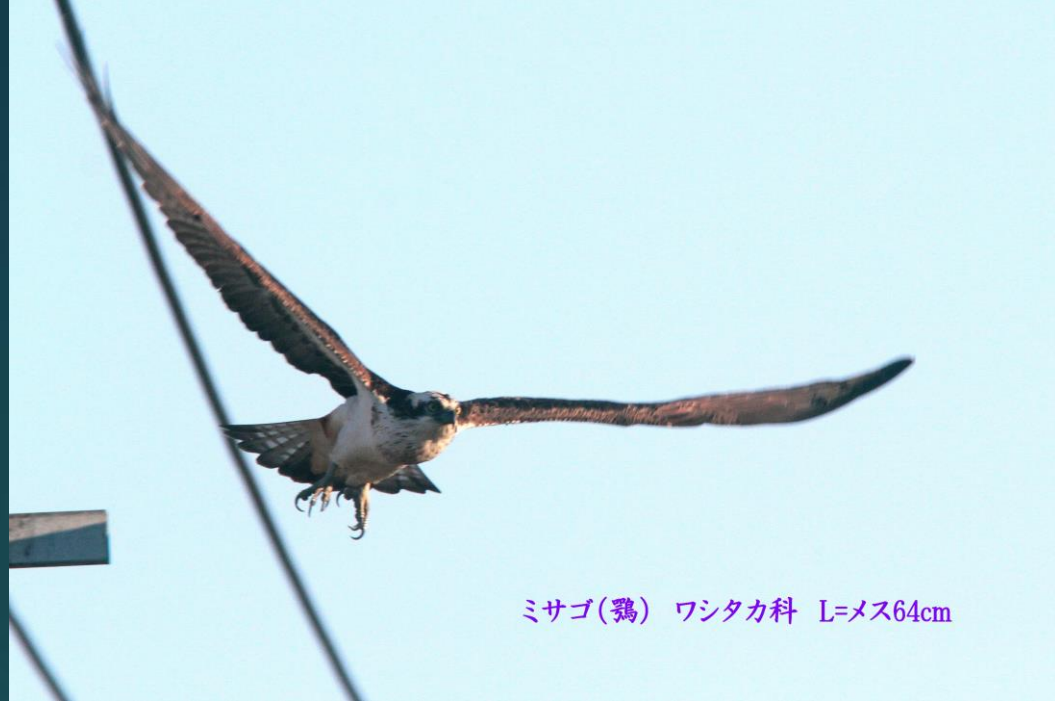
ミサゴ(鶯) ワシタカ科 L=メス64cm