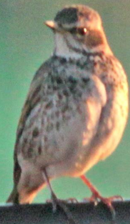
ホオジロ(頬白)幼鳥 ホオジロ科 L=16cm