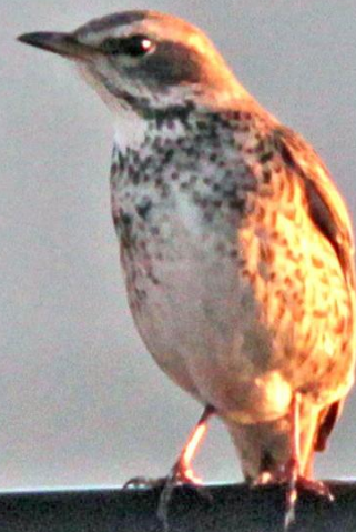
ツグミ(鶉) ヒタキ科 L=24cm