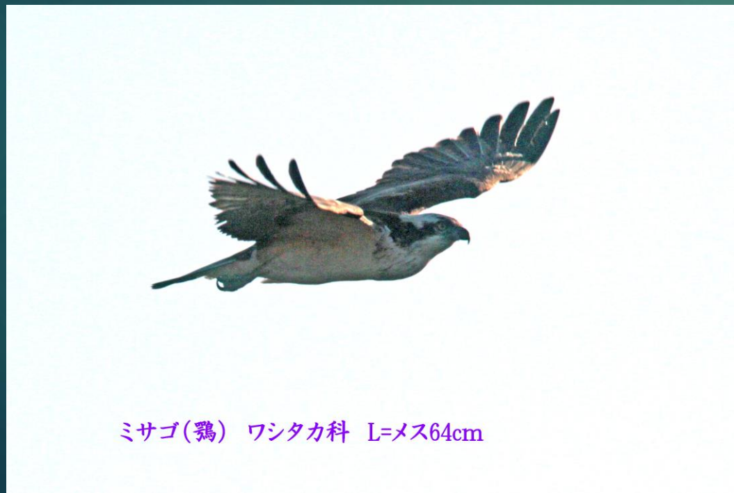
ミサゴ(鶯) ワシタカ科 L=メス64cm