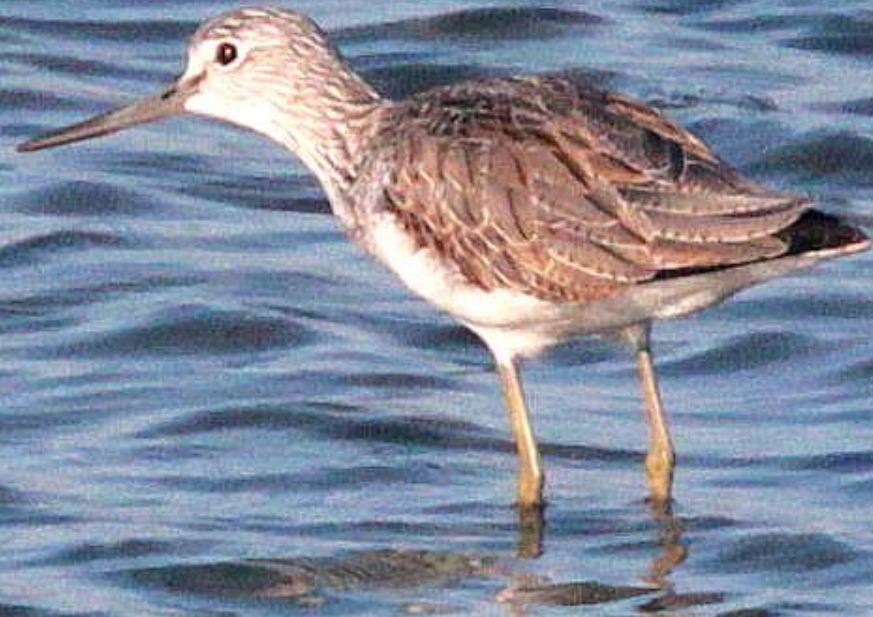
アオアシシギ(蒼脚鷸) シギ科 L=35cm