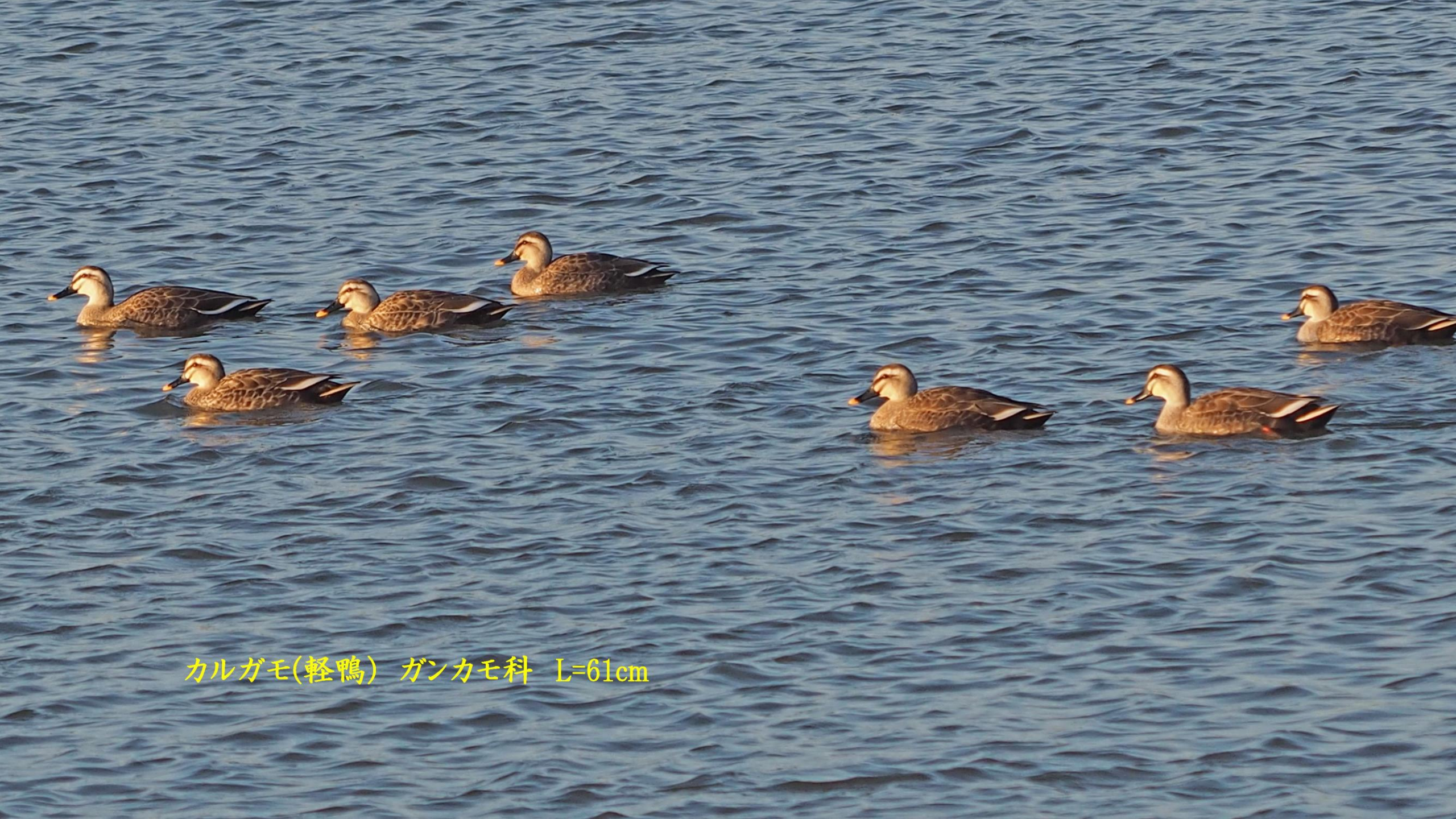
カルガモ(軽鴨) ガンかも科 L=61cm