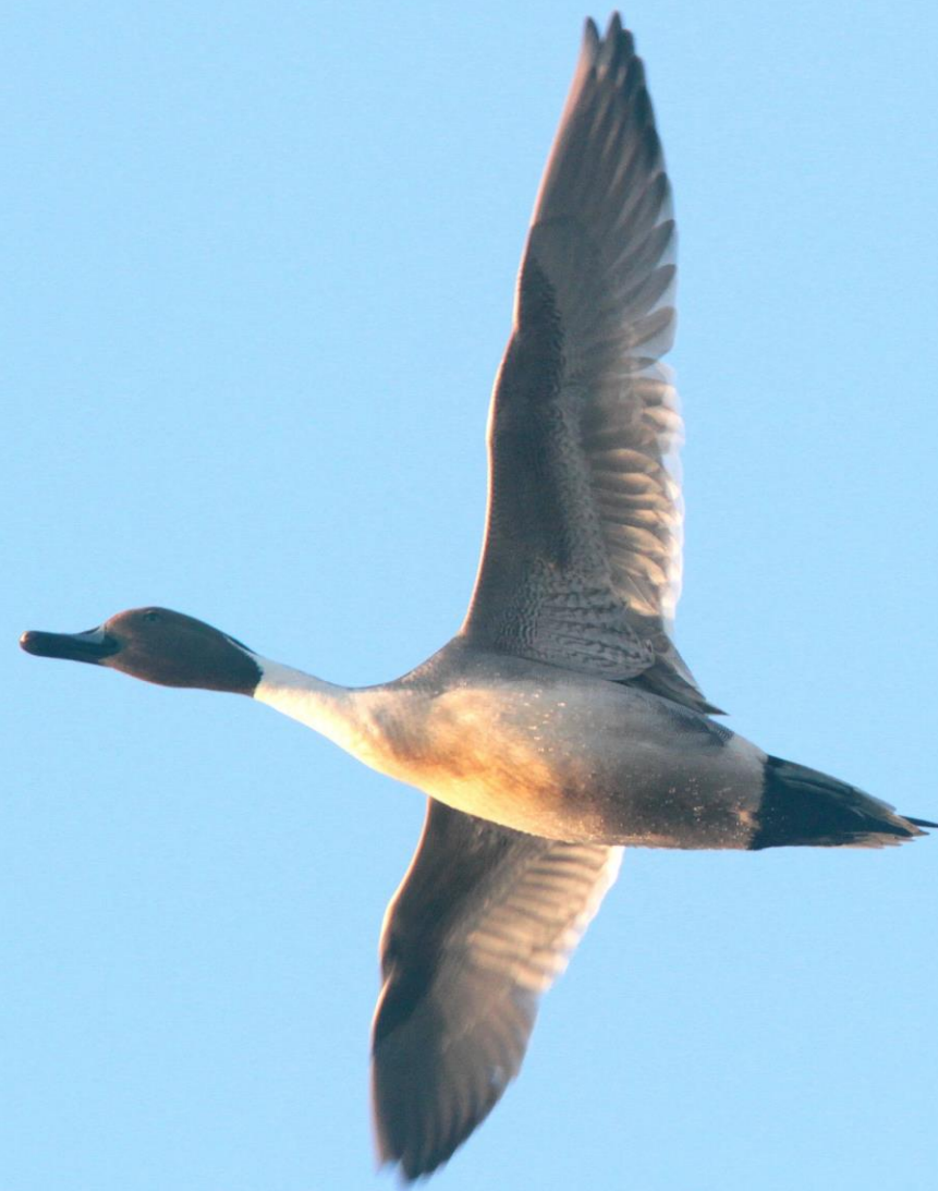
オナガガモ(尾長鴨) ガンカモ科 L=オス75cm