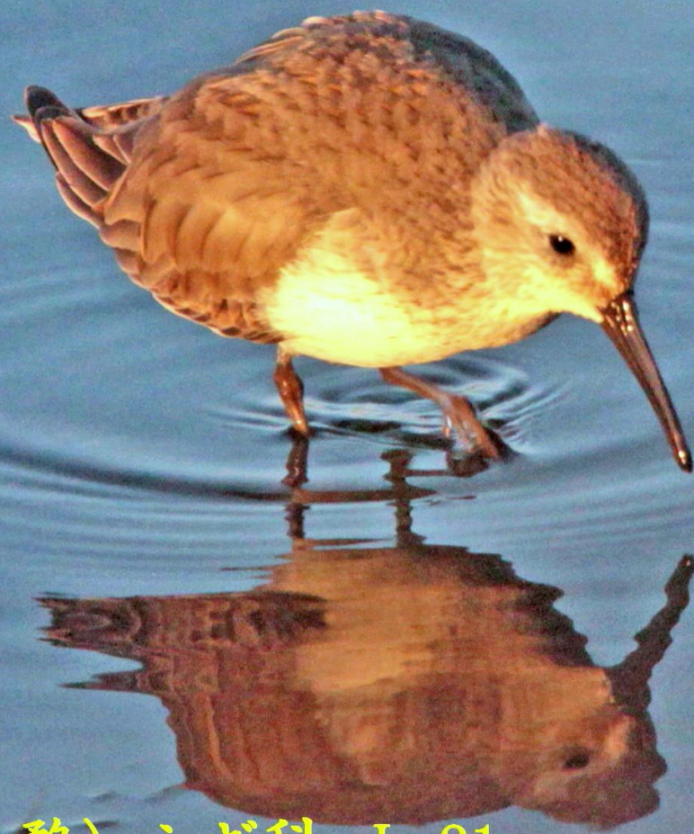
ハマシギ(滨鹬) シギ科 L=21cm