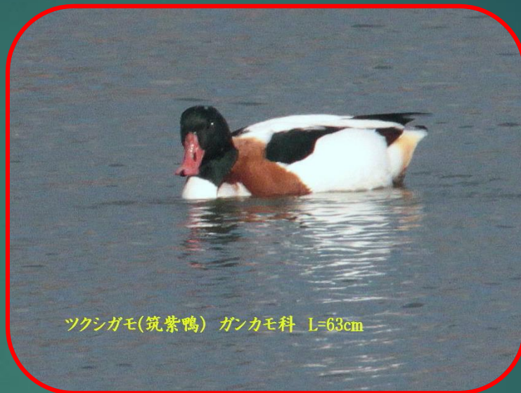
ツクシガモ(筑紫鴨) ガンカモ科 L=63cm