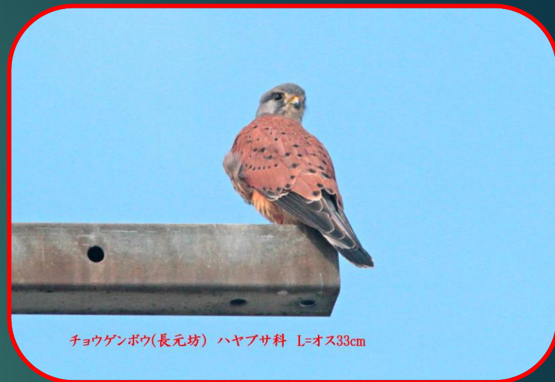
チョウゲンボウ(長元坊) ハヤブサ科 L=オス33cm