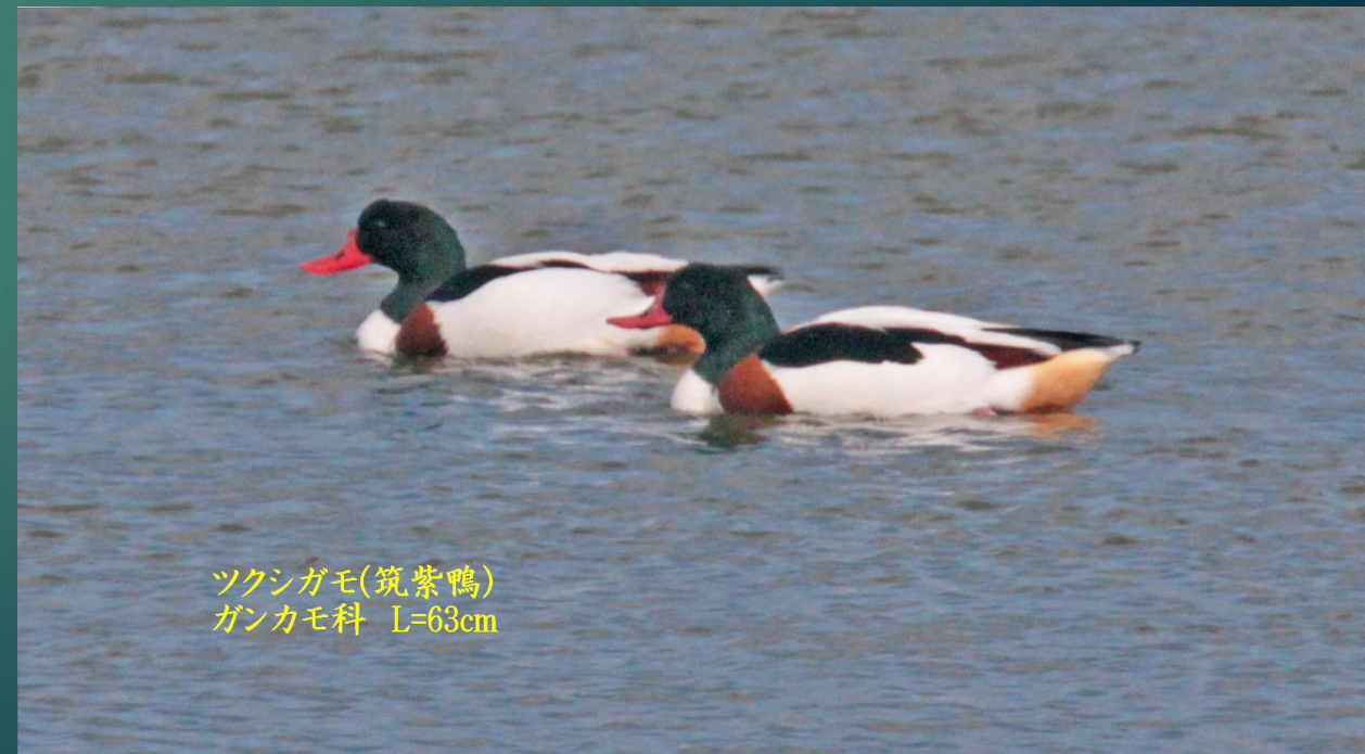
ツクシガモ(筑紫鴨) ガンカモ科 L=63cm