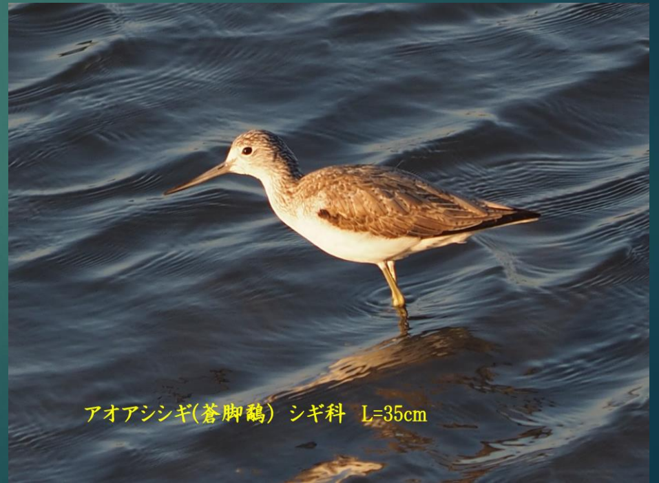
アオアシシギ(蒼脚鷸) シギ科 L=35cm