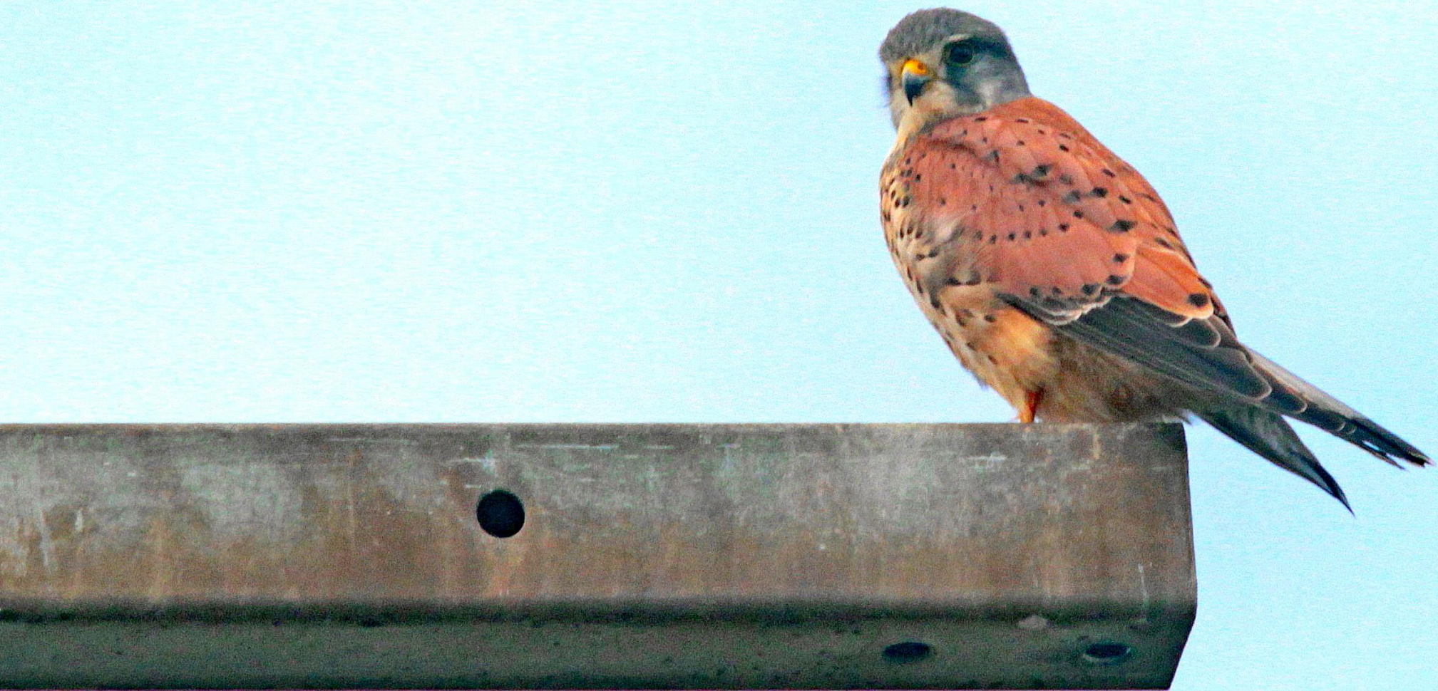
チョウゲンボウ(長元坊) ハヤブサ科 L=オス33cm