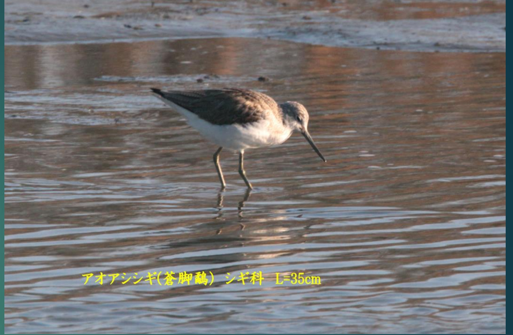
アオアシシギ(蒼脚鷸) シギ科 L=35cm