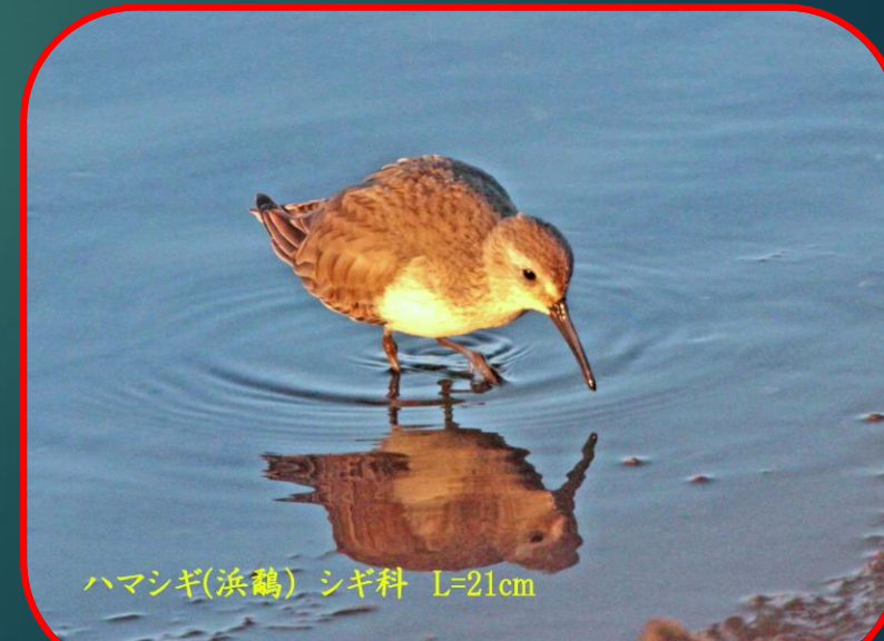
ハマシギ(浜鷗) シギ科 L=21cm