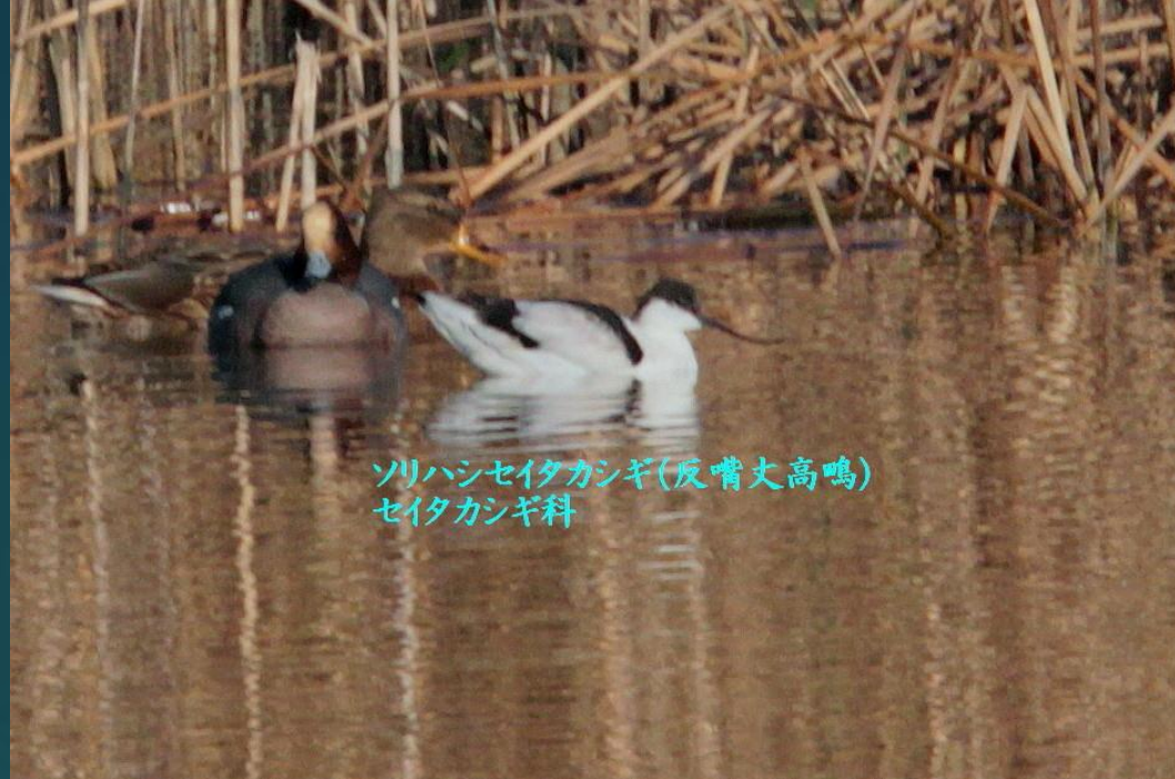
ソリハシセイタカシギ(反嘴丈高鳴) セイタカシギ科