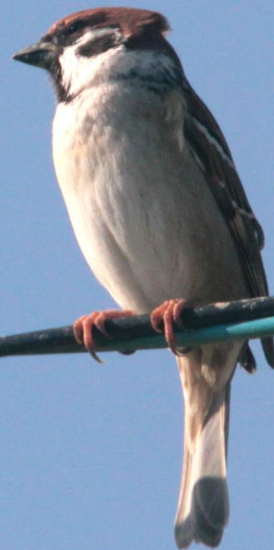
スズメ(雀) スズメ科 L=14.5cm