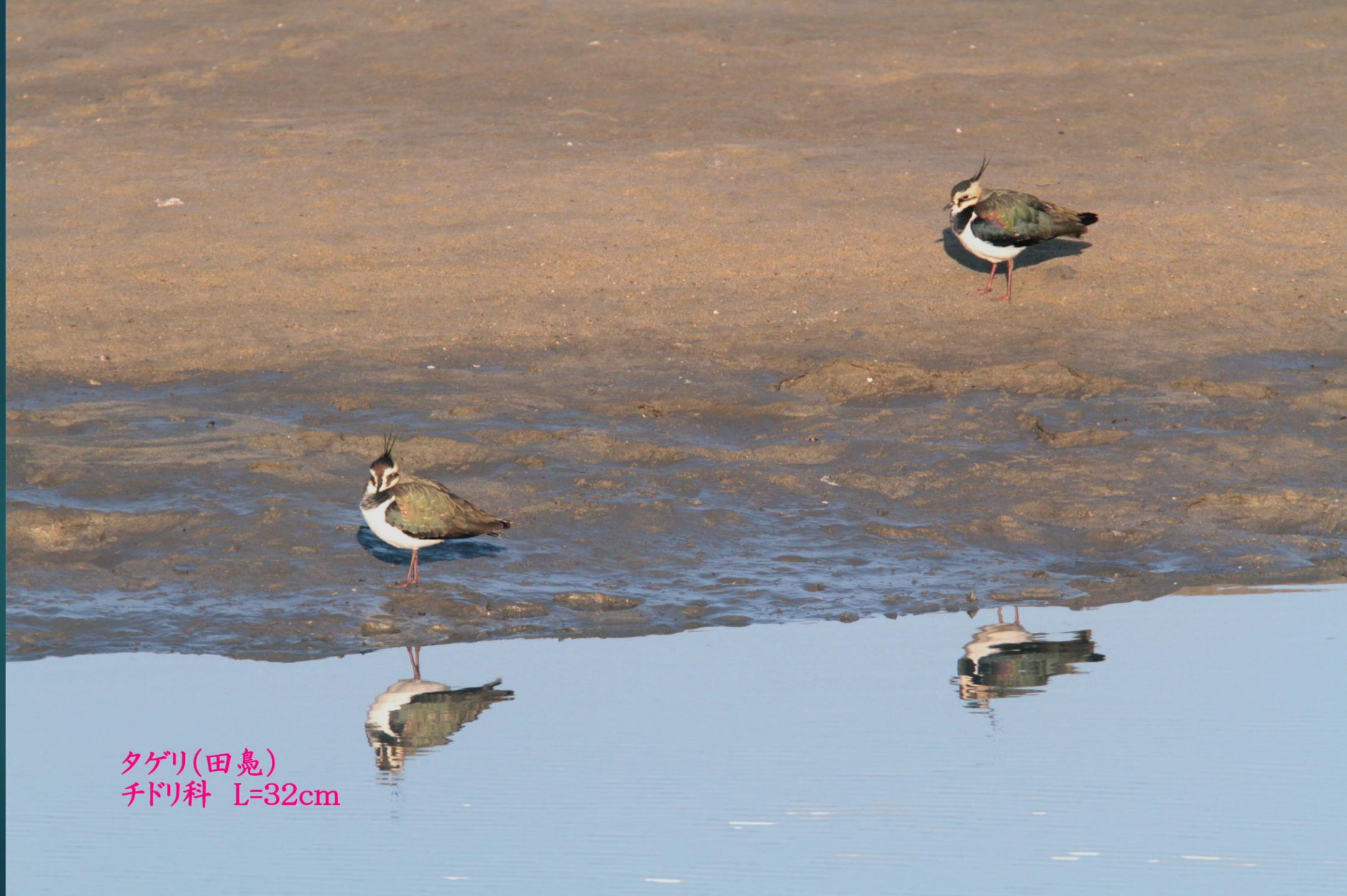
タゲリ(田鳧) チドリ科 L=32cm