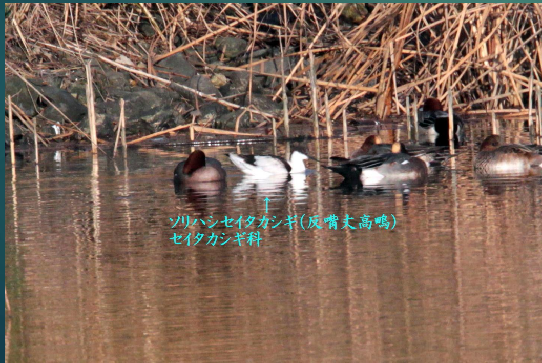
↑ ソリハシセイタカシギ(反嘴丈高鳴) セイタカシギ科