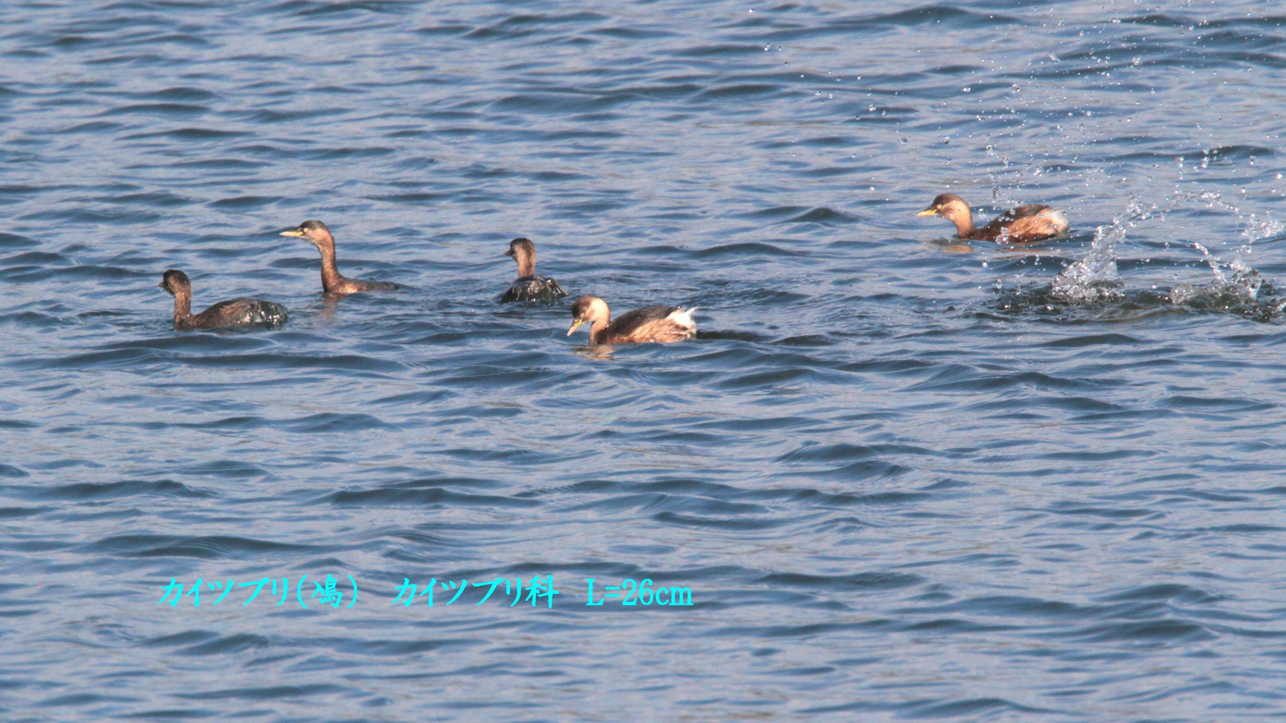
カイツブリ(鳩) カイツブリ科 L=26cm