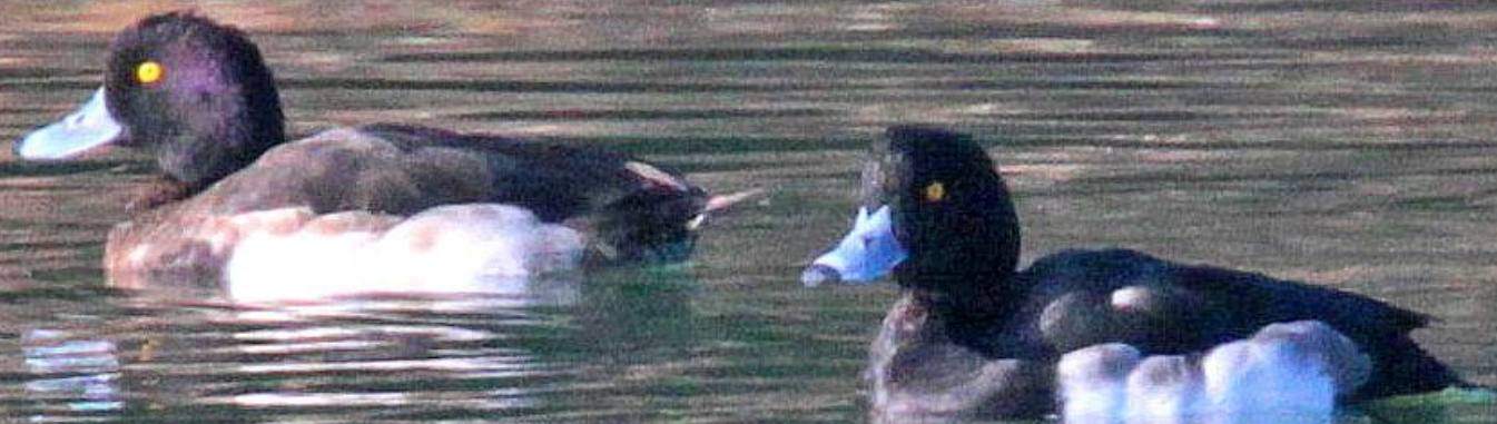
キンクロハジロ(金黒羽白) ガンカモ科 L=40cm