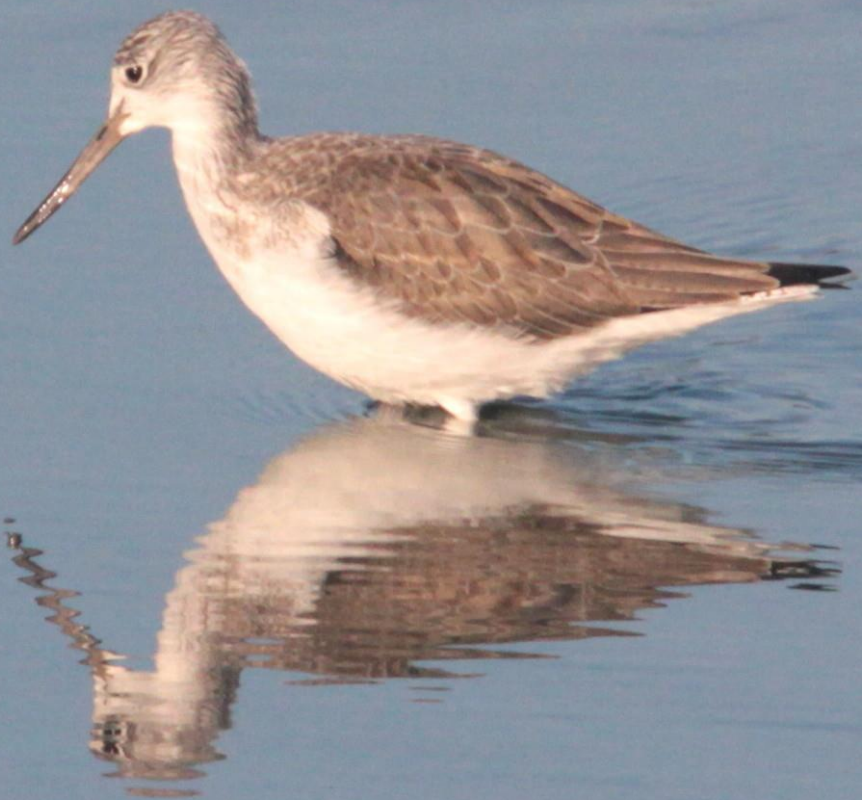
アオアシシギ(蒼脚鷸) シギ科 L=35cm