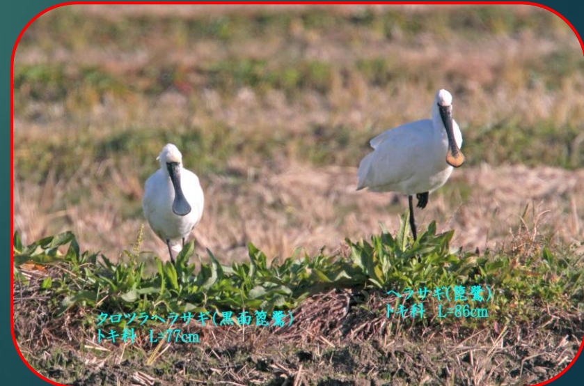
ヘラサギ(篋鷺) トキ科 L=86cm