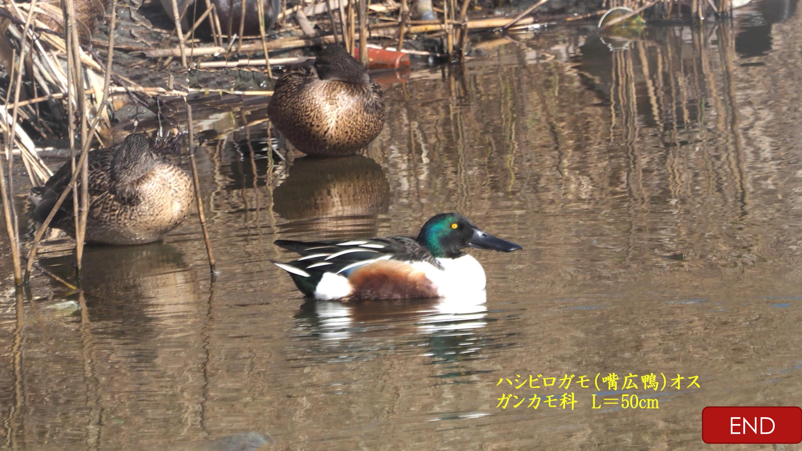
ハシビロガモ(嘴広鴨)オス ガンカモ科 L=50cm