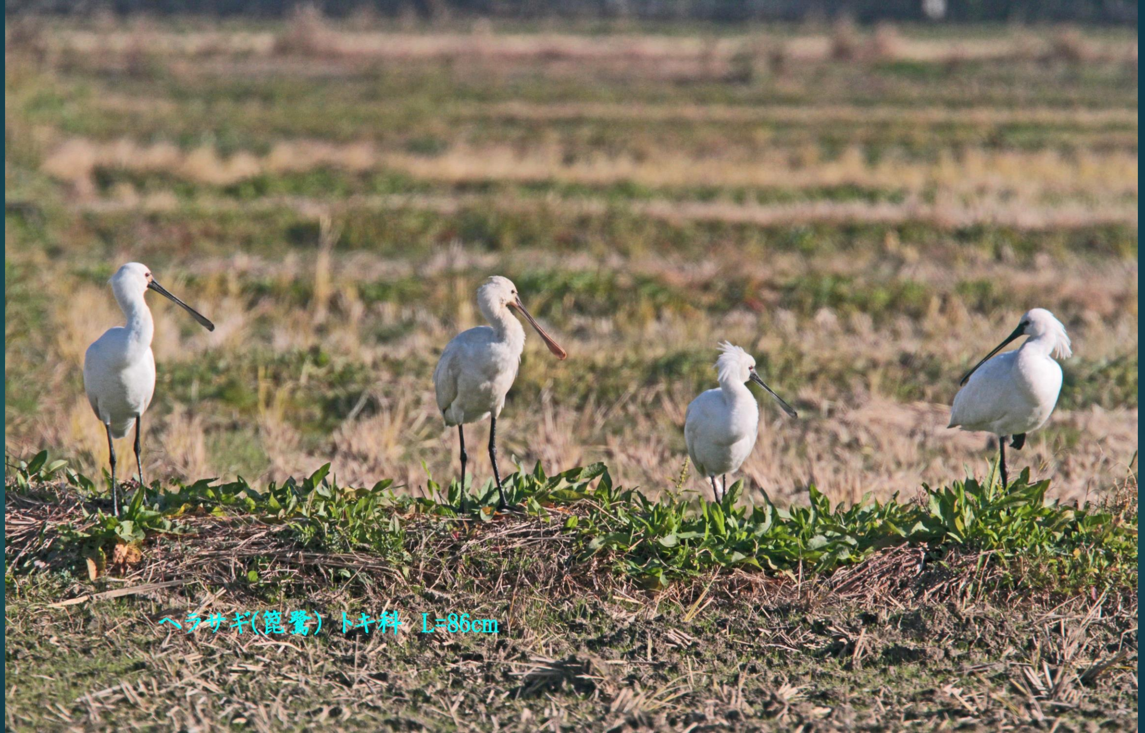
ヘラサギ(籠鷺) トキ科 L=86cm