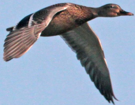
マガモ(真鴨) ガンカモ科 L=59cm