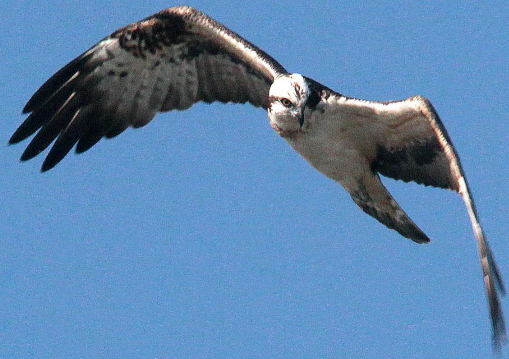
ミサゴ(鶉) ワシタカ科 L=メス64cm