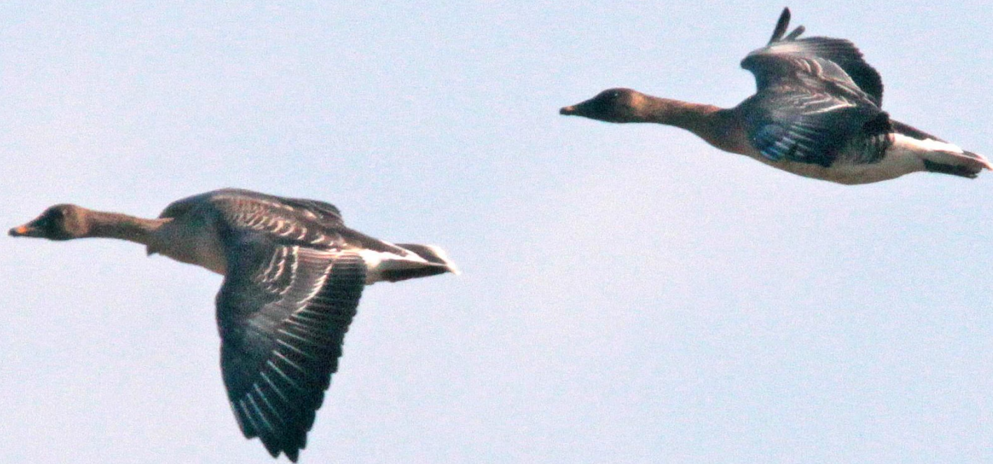
ヒシクイ(菱喰) ガンカモ科 L=85cm