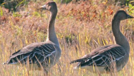
ヒシクイ(菱喰) ガンカモ科 L=85cm