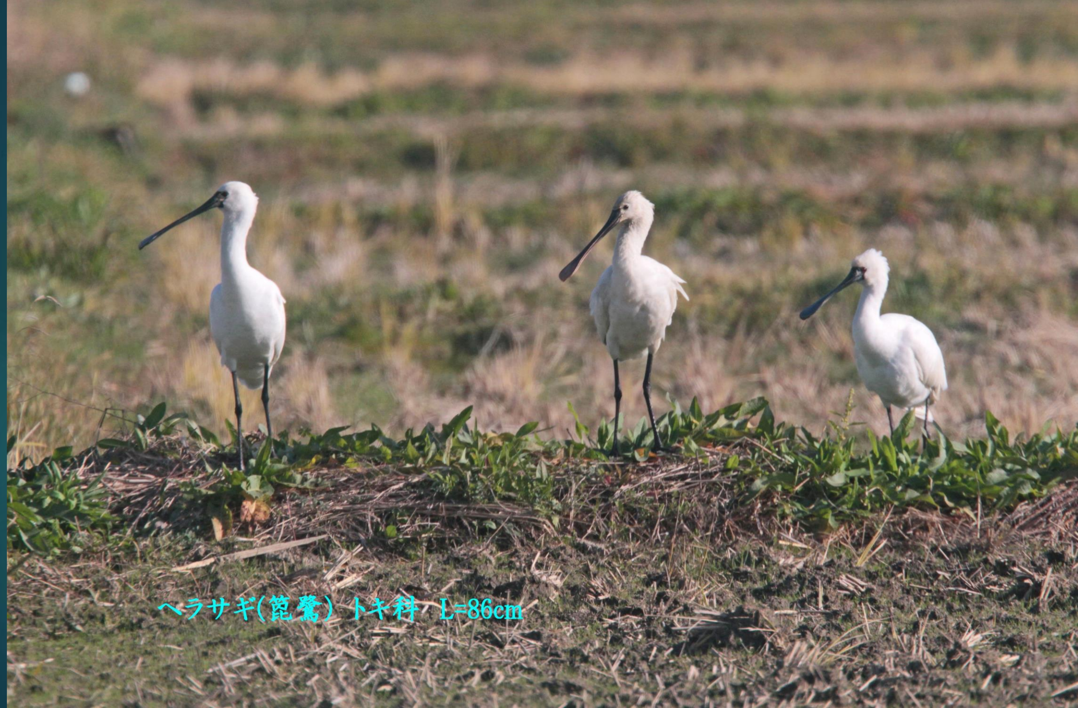
ヘラサギ(篋鷺) トキ科 L=86cm