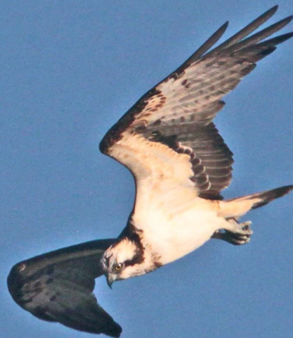
ミサゴ(鵟) ワシタカ科 L=メス64cm