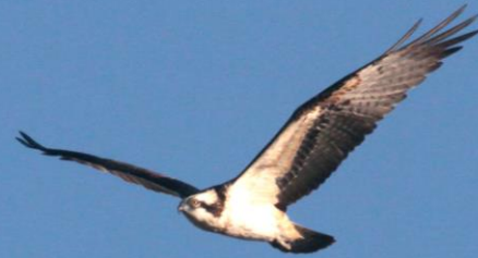
ミサゴ(鶺鴒) ワシタカ科 L=メス64cm