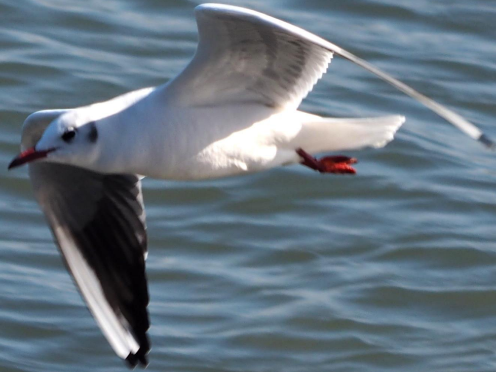
ユリカモメ(百合鷗) カモメ科 L=40cm