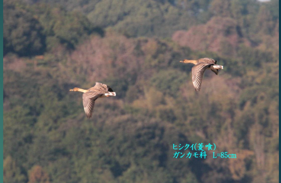
ヒシクイ(菱喰) ガンカモ科 L=85cm