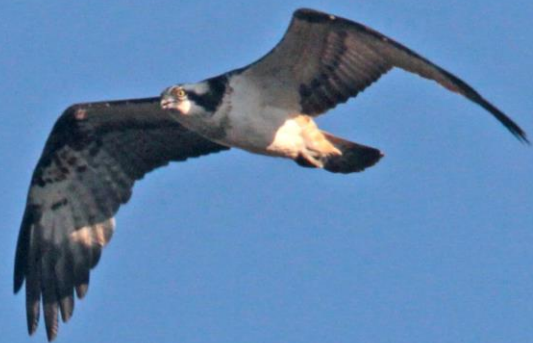
ミサゴ(鵟) ワシタカ科 L=メス64cm