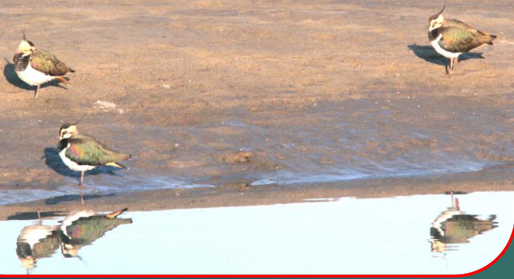
タゲリ(田鳧) チドリ科 L=32cm