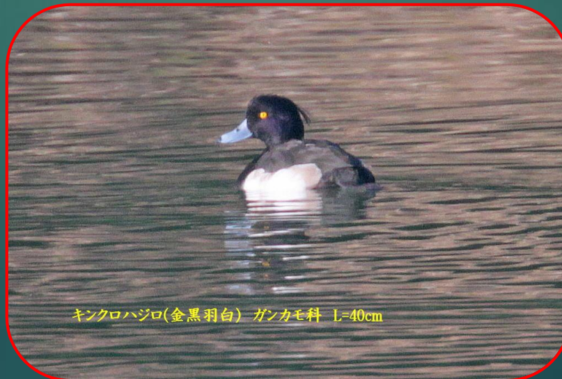
キンクロハジロ(金黒羽白) ガンカモ科 L=40cm