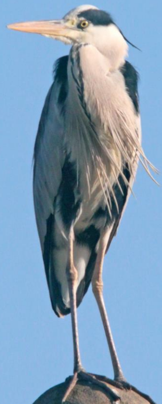
アオサギ(蒼鷺) サギ科 L=93cm