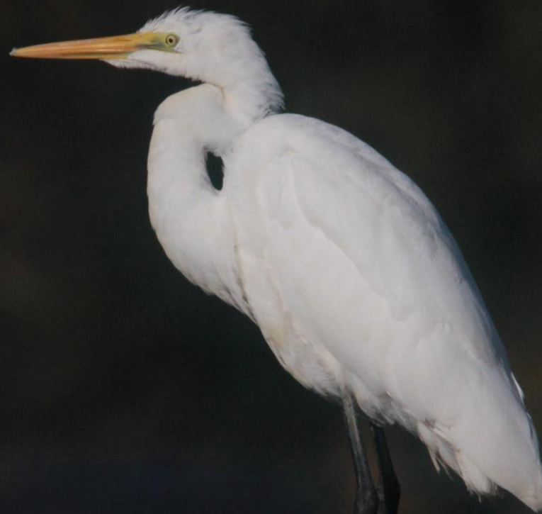
ダイサギ(大鷺) サギ科 L=90cm