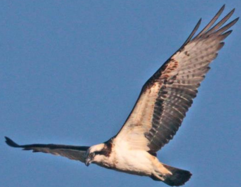
ミサゴ(鵟) ワシタカ科 L=メス64cm