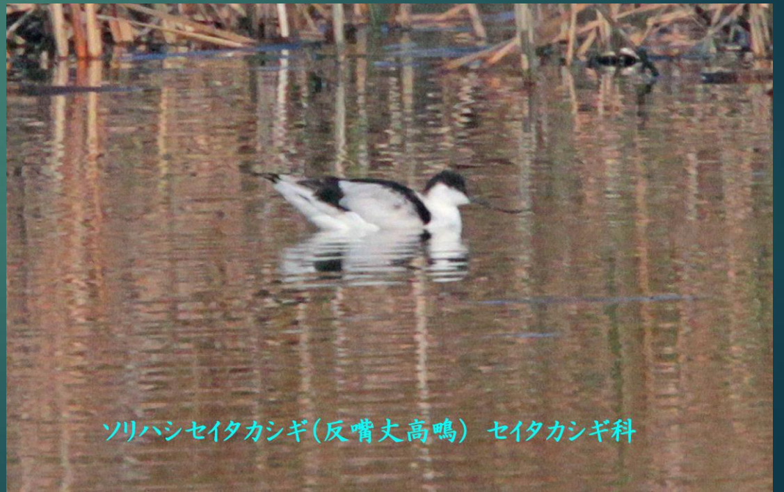
ソリハシセイタカシギ(反嘴丈高鳴) セイタカシギ科