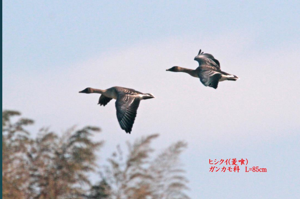
ヒシクイ(菱喰) ガンカモ科 L=85cm