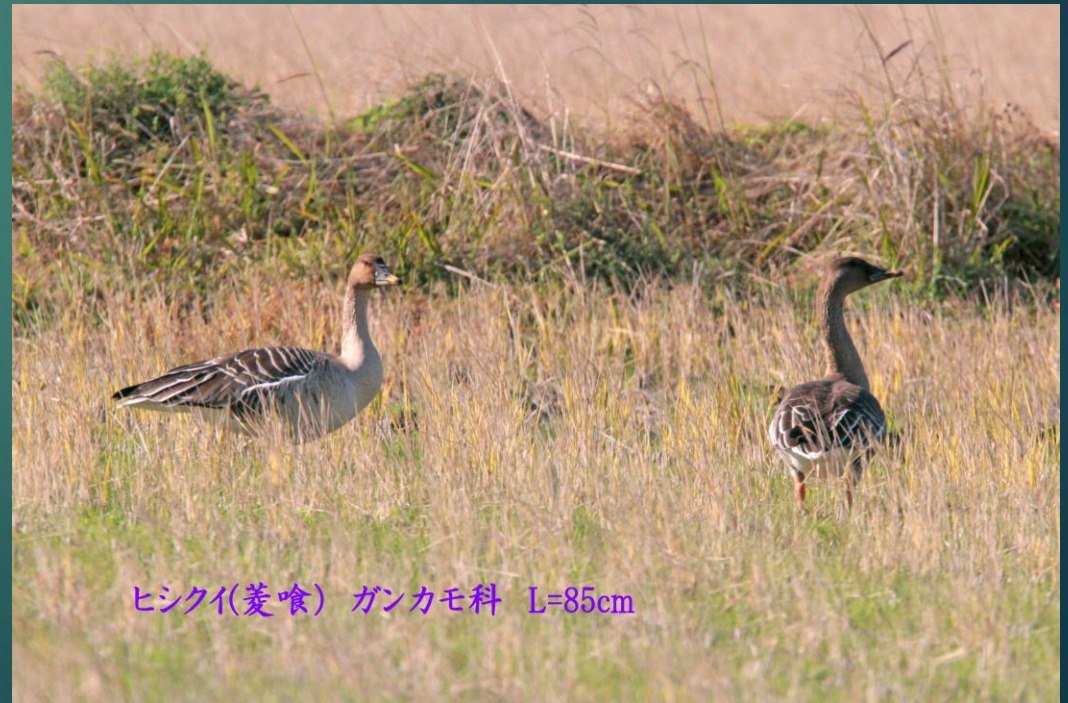
ヒシクイ(菱喰) ガンカモ科 L=85cm