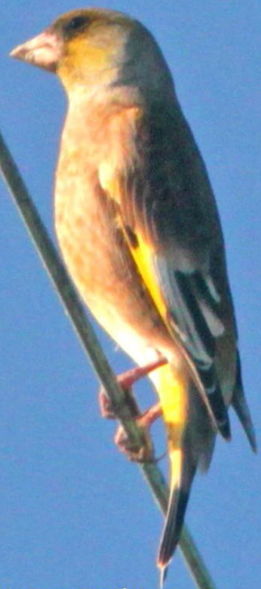
カワラヒワ(河原鶉)オス アトリ科 L=14.5cm