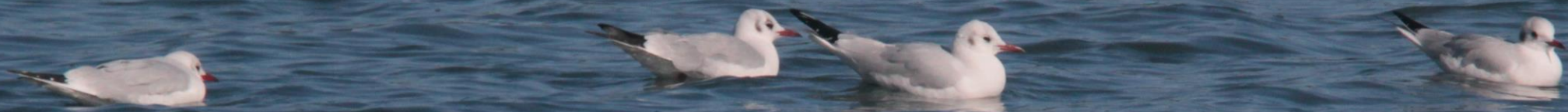
ユリカモメ(百合鷗) カモメ科 L=40cm