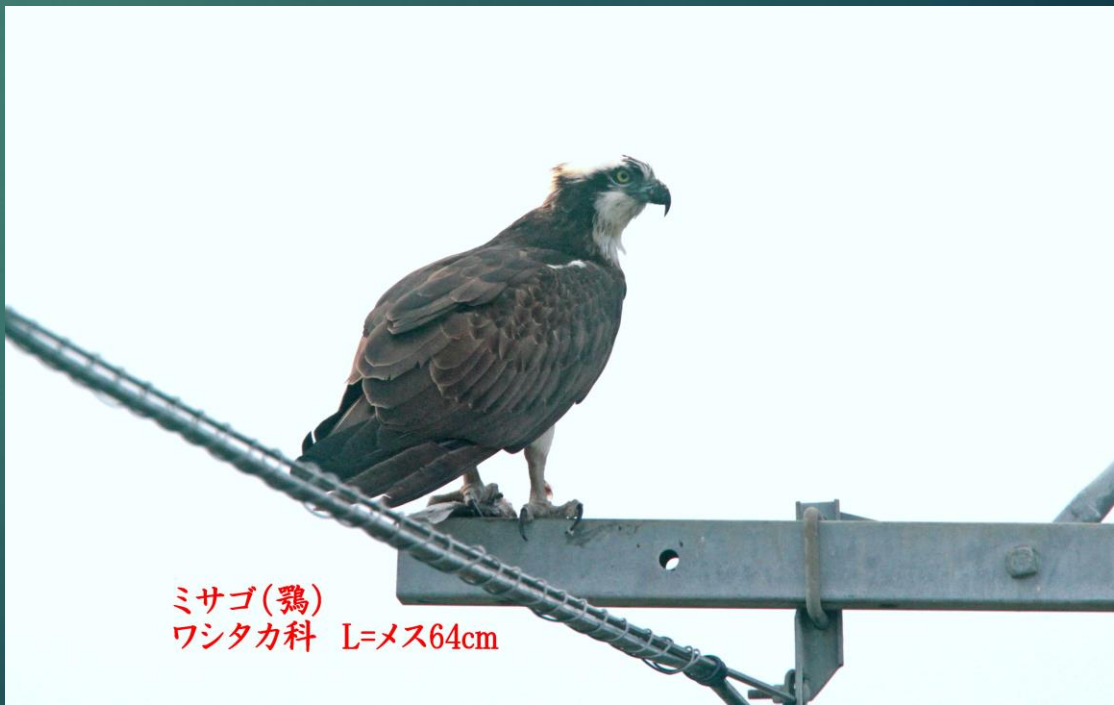
ミサゴ(鵟) ワシタカ科 L=メス64cm