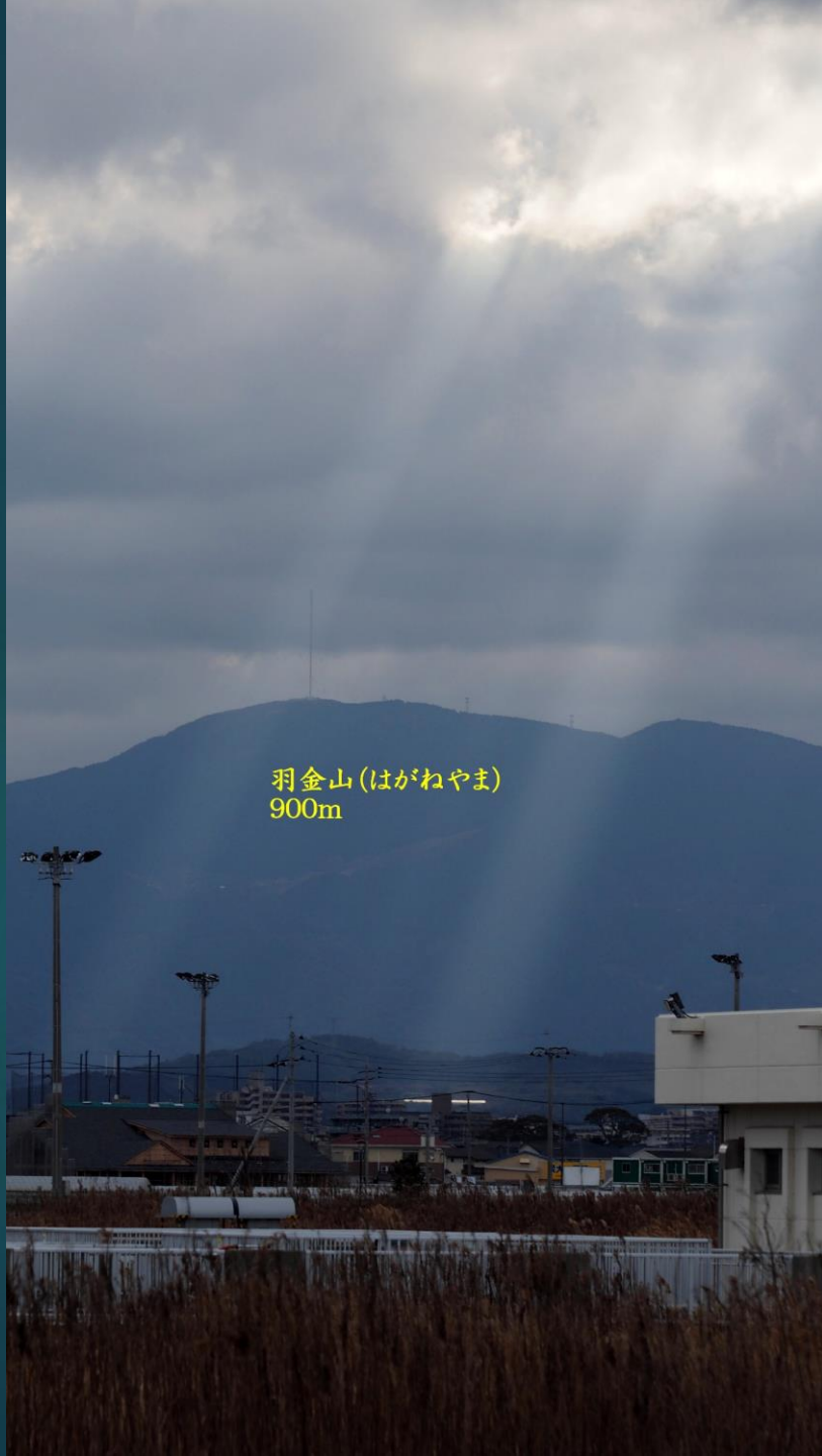
羽金山 (はがねやま) 900m