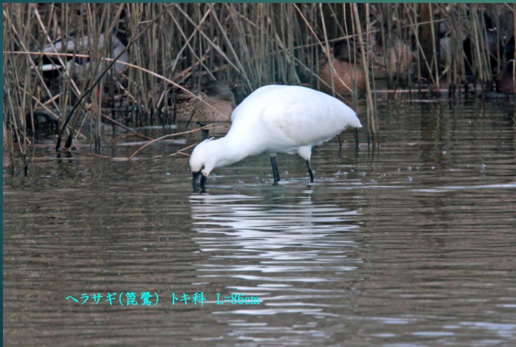
ヘラサギ(篋鷺) トキ科 L=86cm