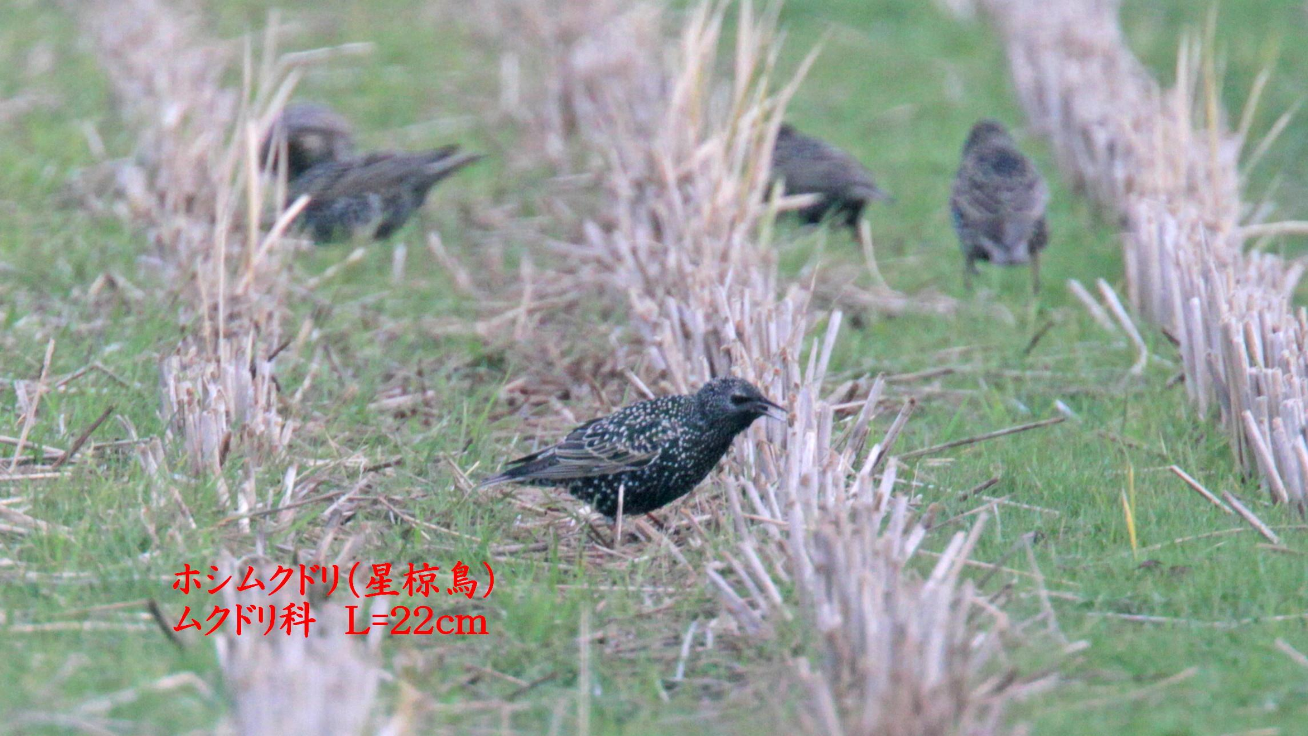
ホシムクドリ(星椋鳥) ムクドリ科 L=22cm