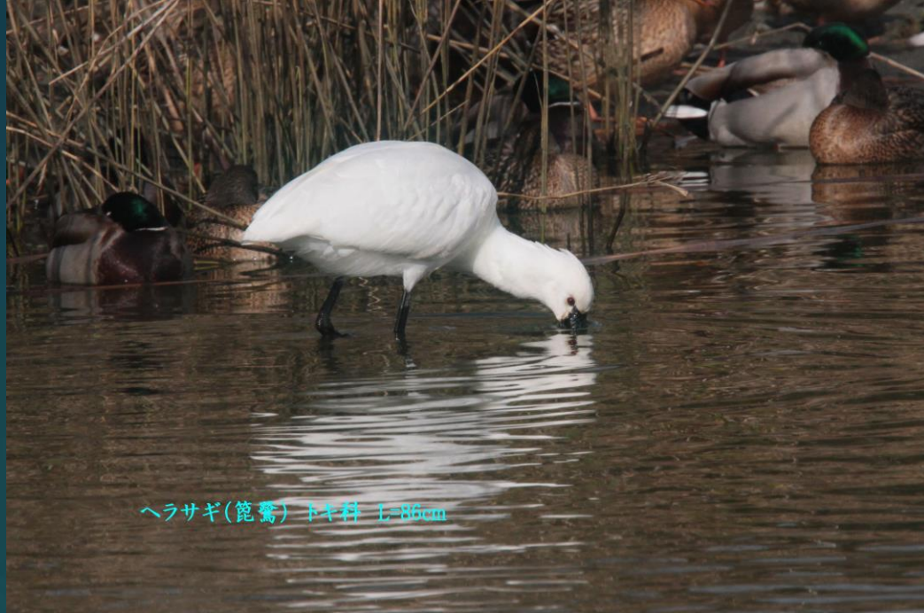
ヘラサギ(篋鷺) トキ科 L=86cm