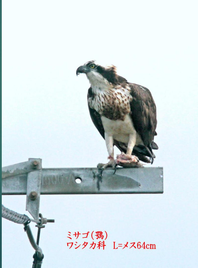
ミサゴ(鶉) ワシタカ科 L=メス64cm