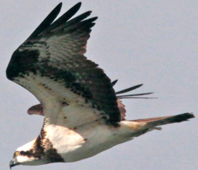
ミサゴ(鵟) ワシタカ科 L=メス64cm