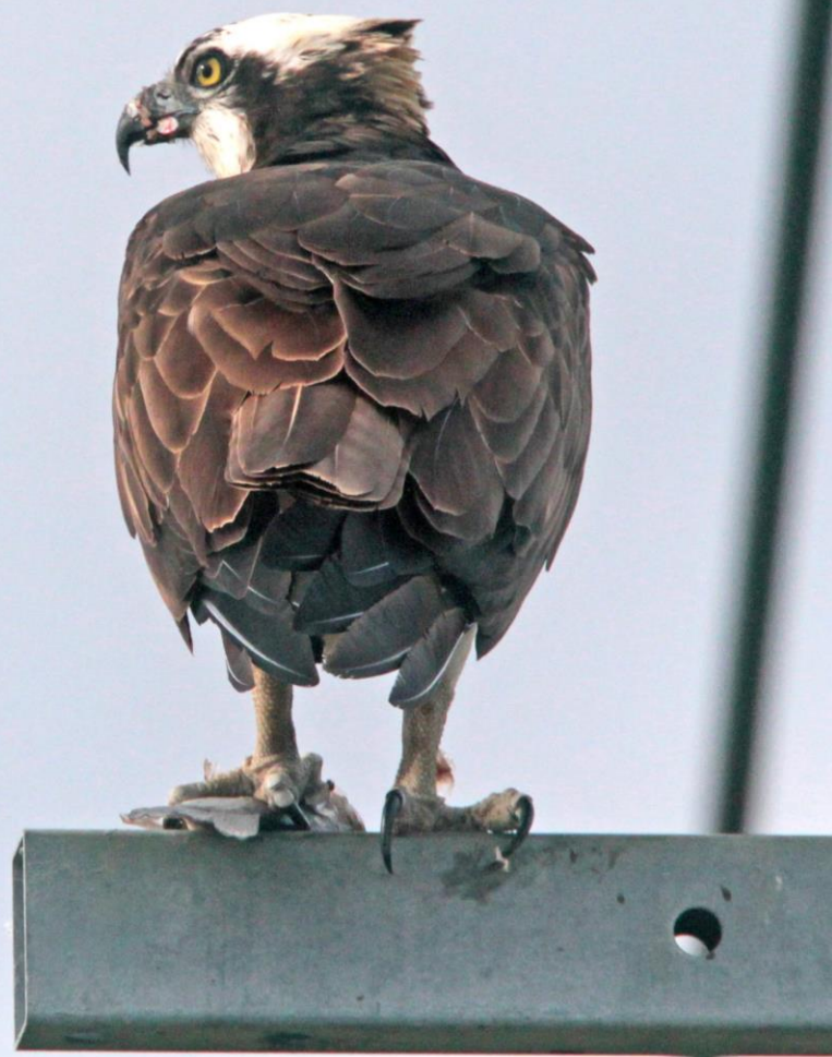
ミサゴ(鵟) ワシタカ科 L=メス64cm