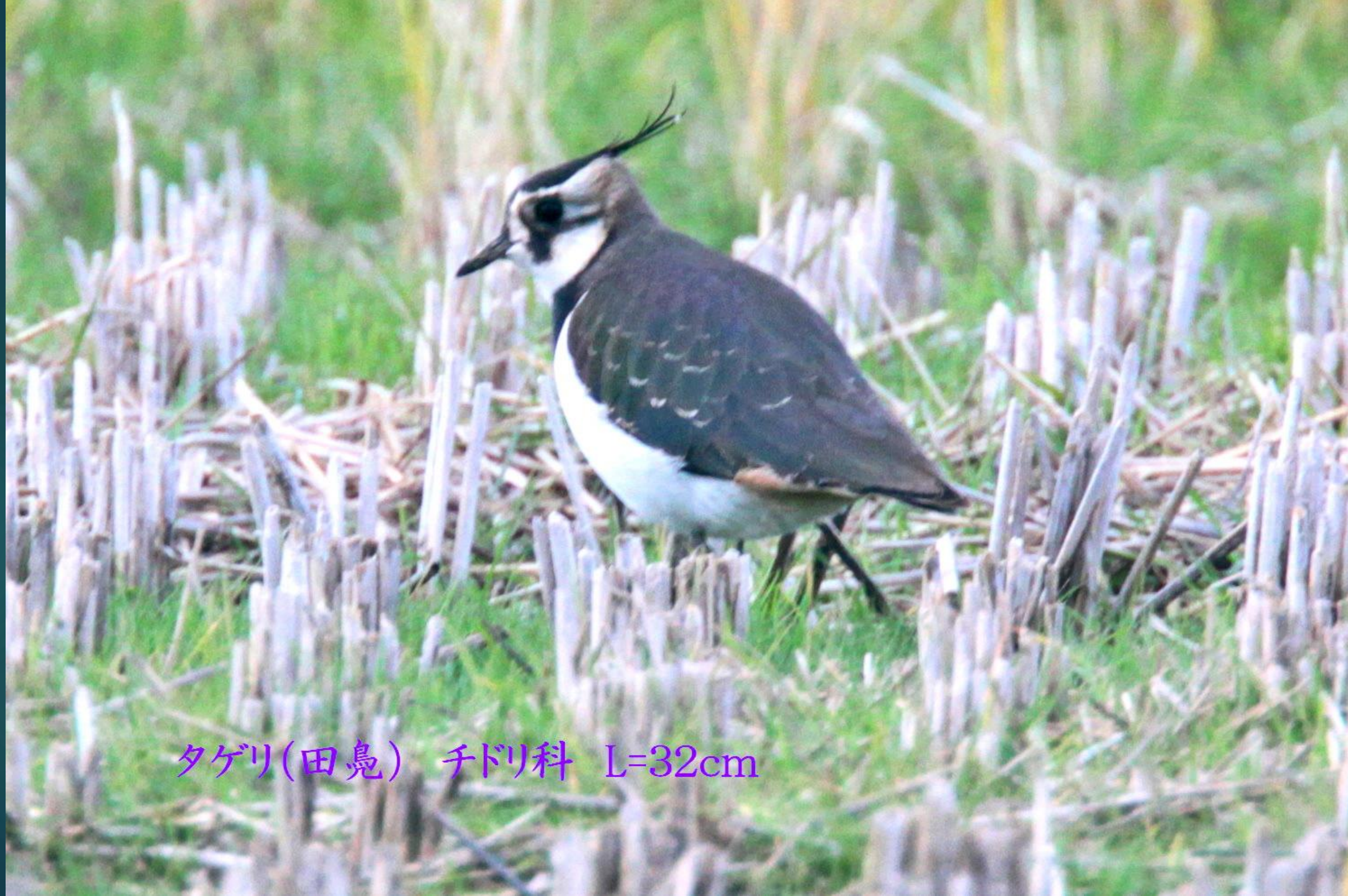
タゲリ(田嶋) チドリ科 L=32cm