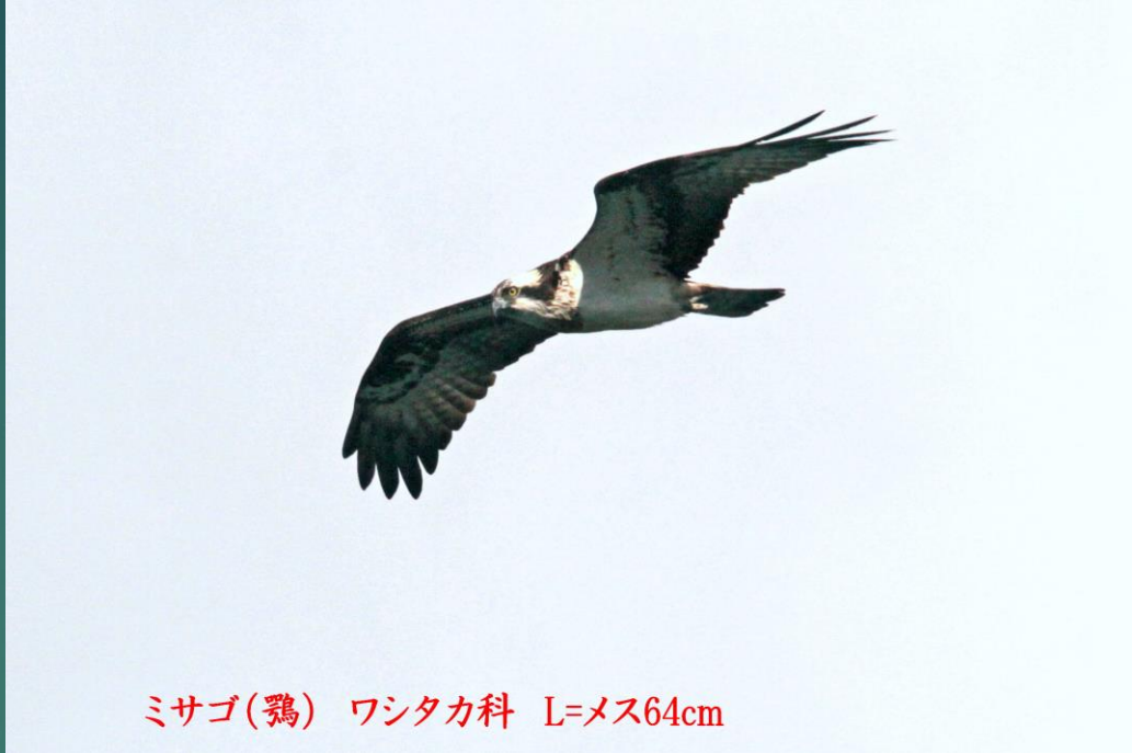
ミサゴ(鷲) ワシタカ科 L=メス64cm