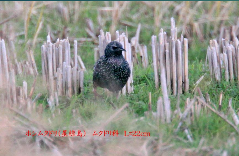
ホシムクドリ(星椋鳥) ムクドリ科 L=22cm