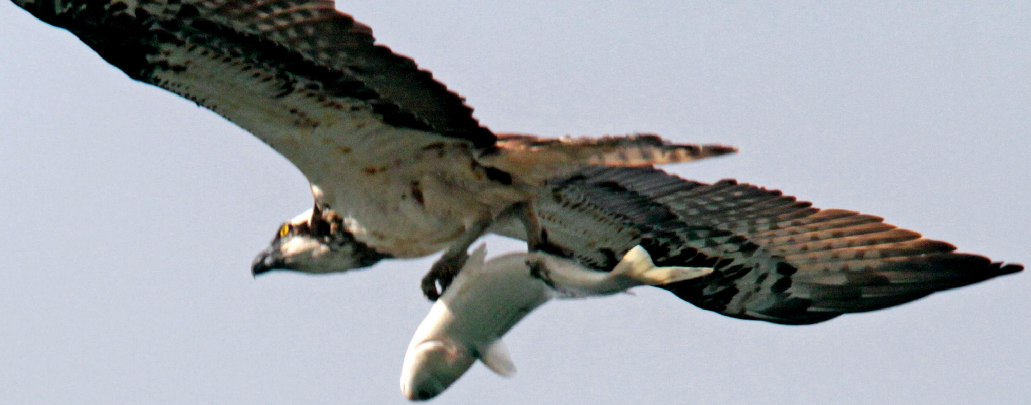
ミサゴ(鵟) ワシタカ科 L=メス64cm