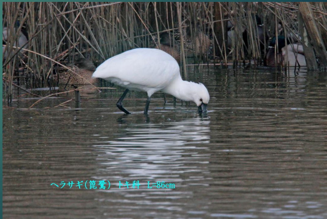
ヘラサギ(篋鷺) トキ科 L=86cm