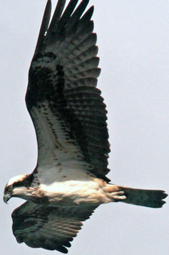
ミサゴ(鵟) ワシタカ科 L=メス64cm