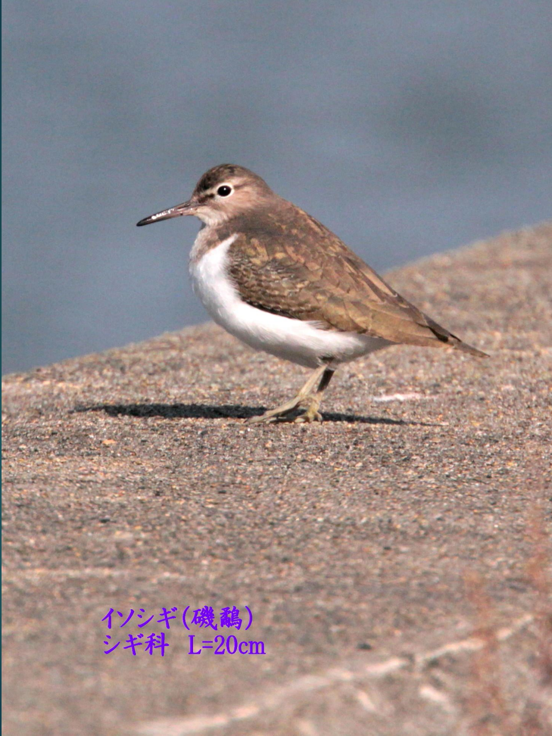
イソシギ(磯鶺) シギ科 L=20cm