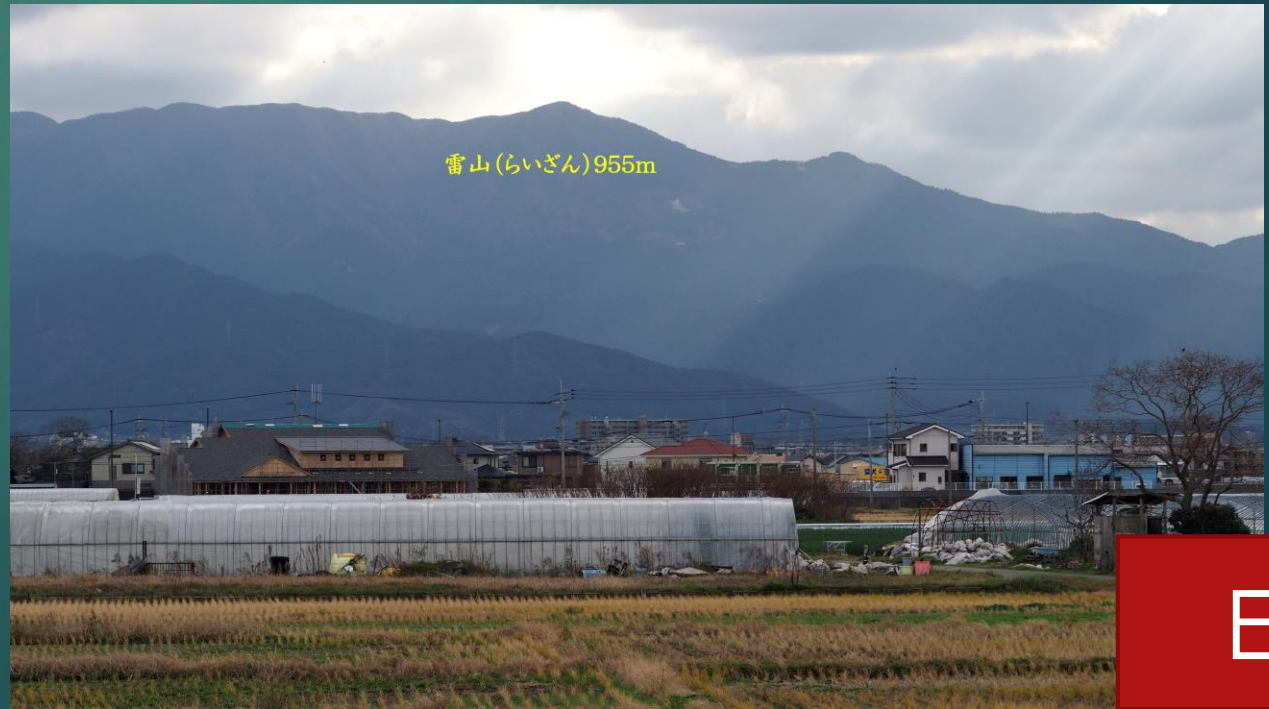
雷山 (らいざん) 955m