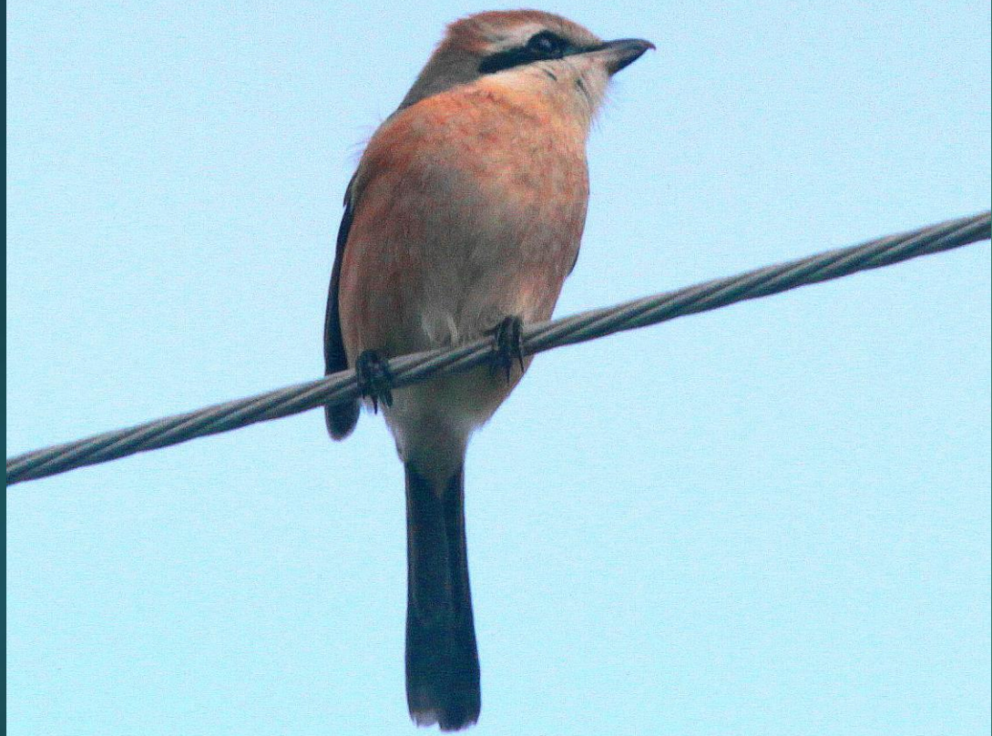
モズ(百舌)メス モズ科 L=18cm