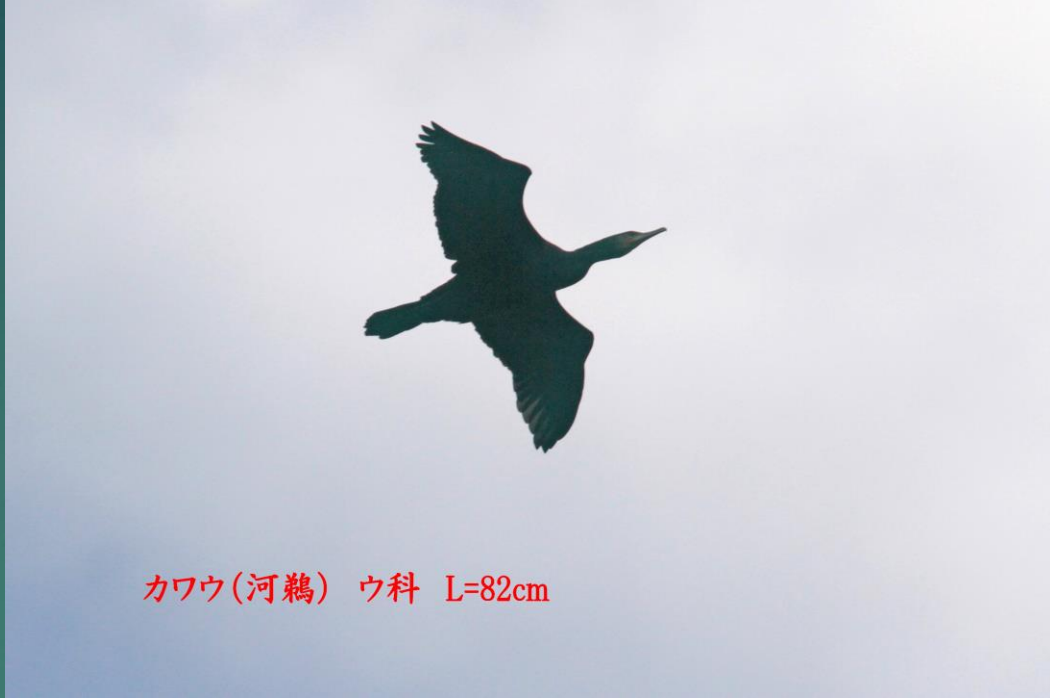
カワウ(河鵜) ウ科 L=82cm