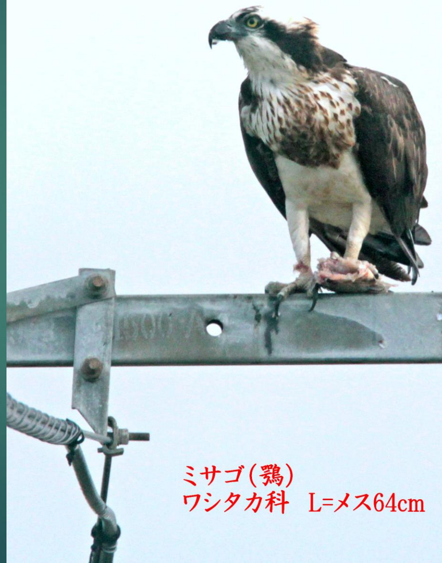
ミサゴ(鵟) ワシタカ科 L=メス64cm