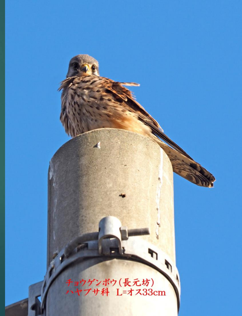
チョウゲンボウ(長元坊) ハヤブサ科 L=オス33cm