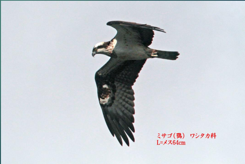
ミサゴ(鷲) ワシタカ科 L=メス64cm