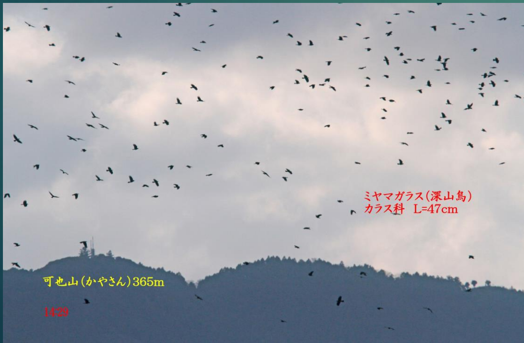
ミヤマガラス(深山鳥) カラス科 L=47cm