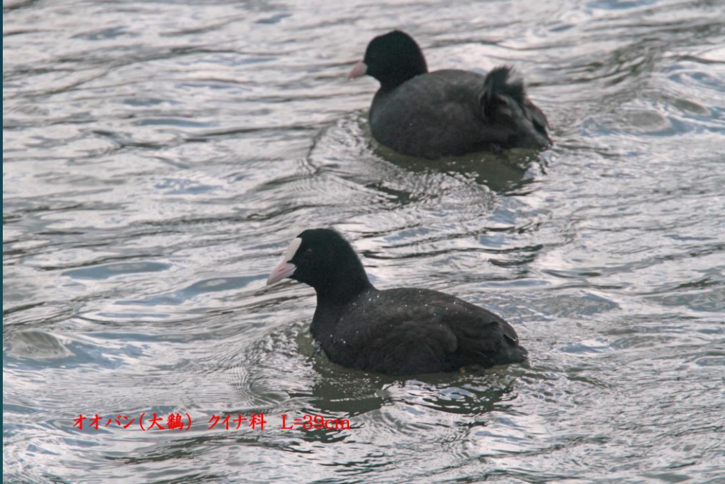
オオバン(大鵜) クイナ科 L=39cm