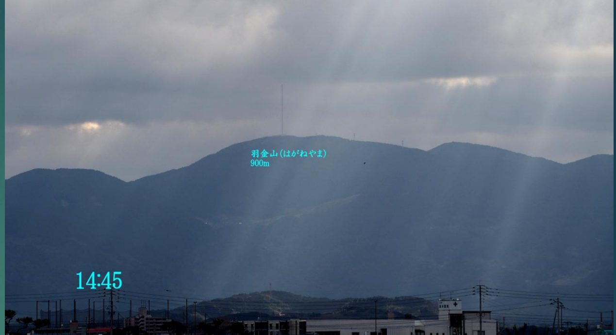
羽金山 (はがねやま) 900m