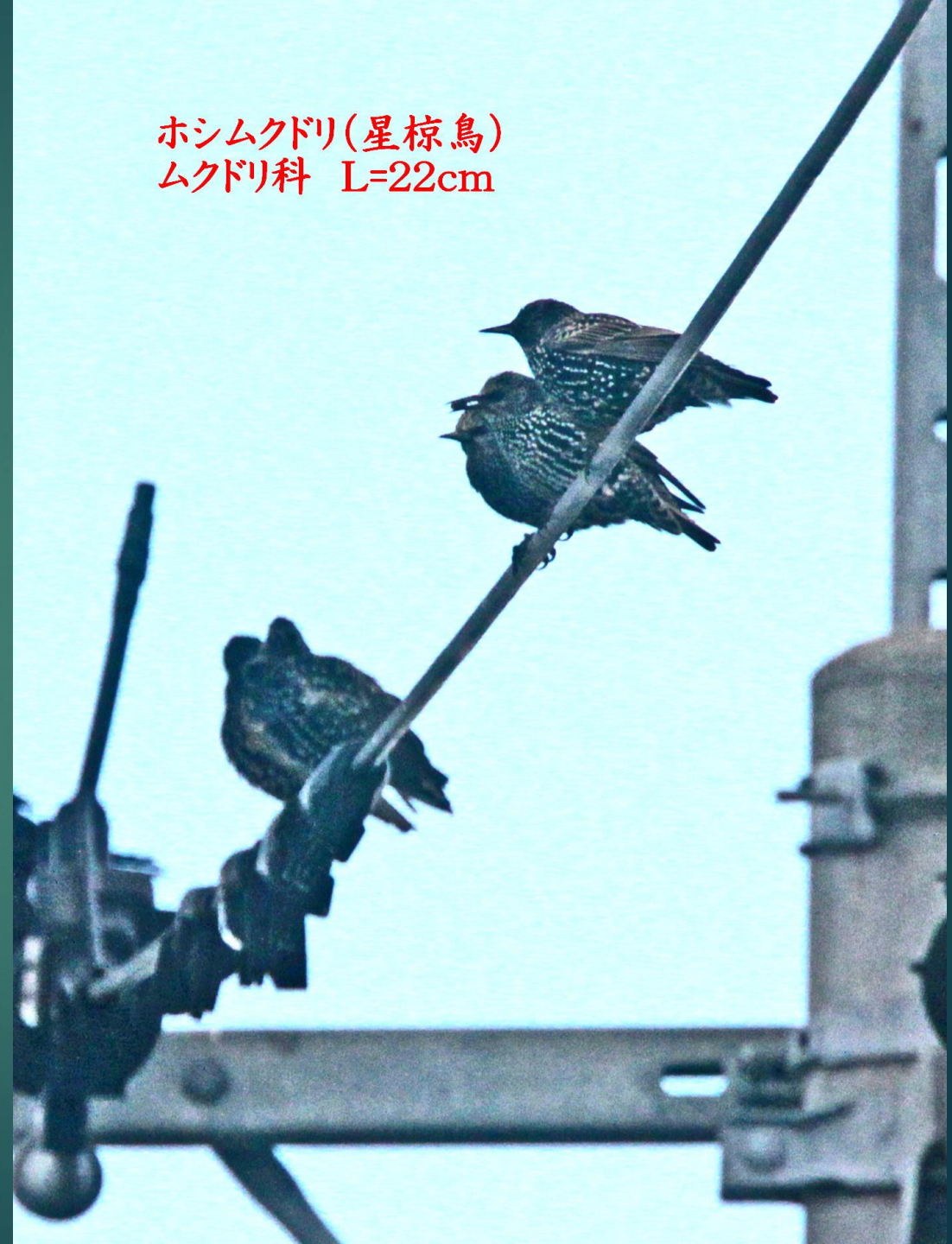
ホシムクドリ(星椋鳥) ムクドリ科 L=22cm