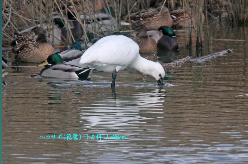
ヘラサギ(篋鷺) トキ科 L=86cm