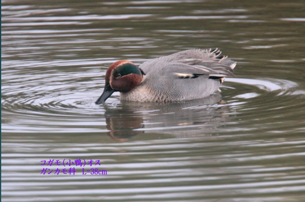
コガモ(小鴨)オス ガンカモ科 L=38cm