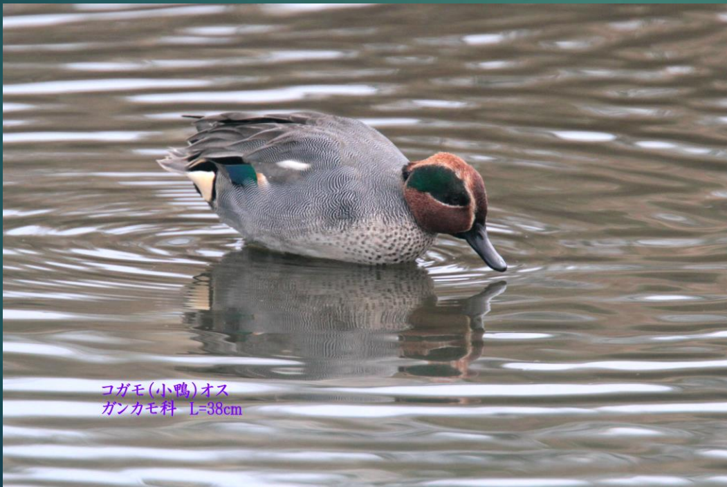
コガモ(小鴨)オス ガンカモ科 L=38cm