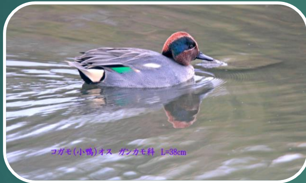
コガモ(小鴨)オス ガンカモ科 L=38cm

福岡市西区・今津干潟の コガモ、 クロツラヘラサギ、 ツクシガモ、 ハクセキレイ