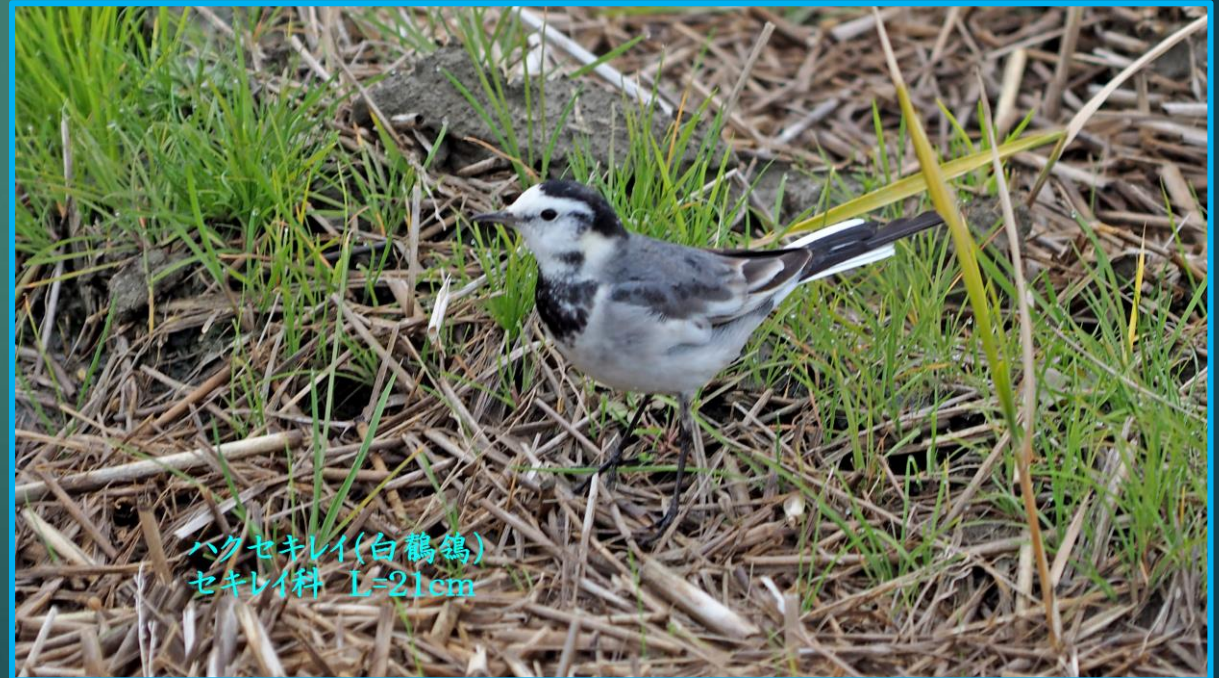
ハクセキレイ(白鶴鴉) セキレイ科 L=21cm