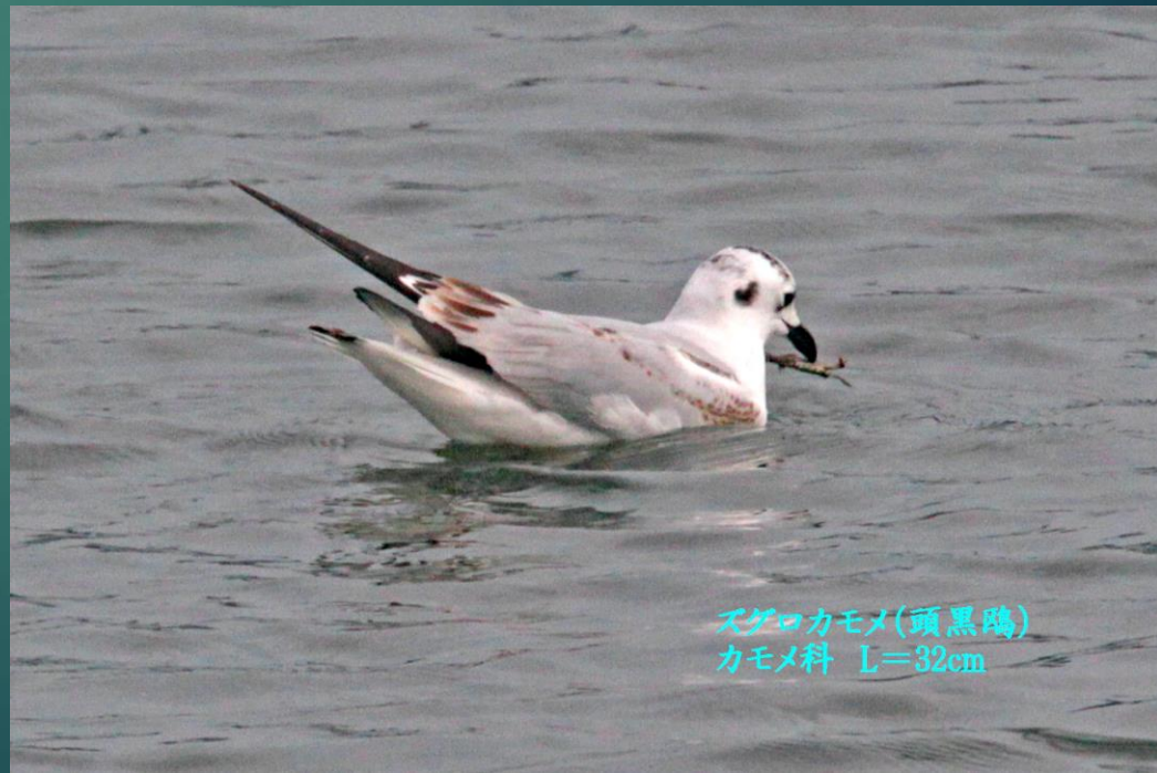
ズグロカモメ(頭黒鷗) カモメ科 L=32cm