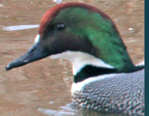
ヨシガモ(葦鴨)オス ガンカモ科 L=48cm