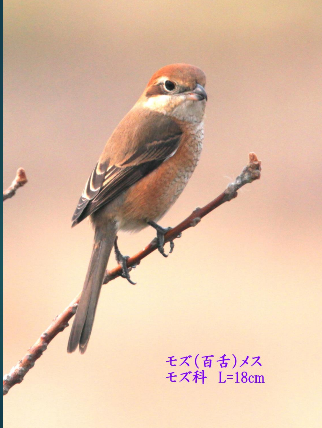
モズ(百舌)メス モズ科 L=18cm