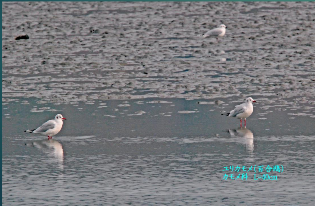
ユリカモメ(百合鷗) カモメ科 L=40cm