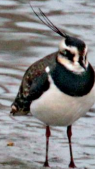
タゲリ(田鳧) チドリ科 L=32cm