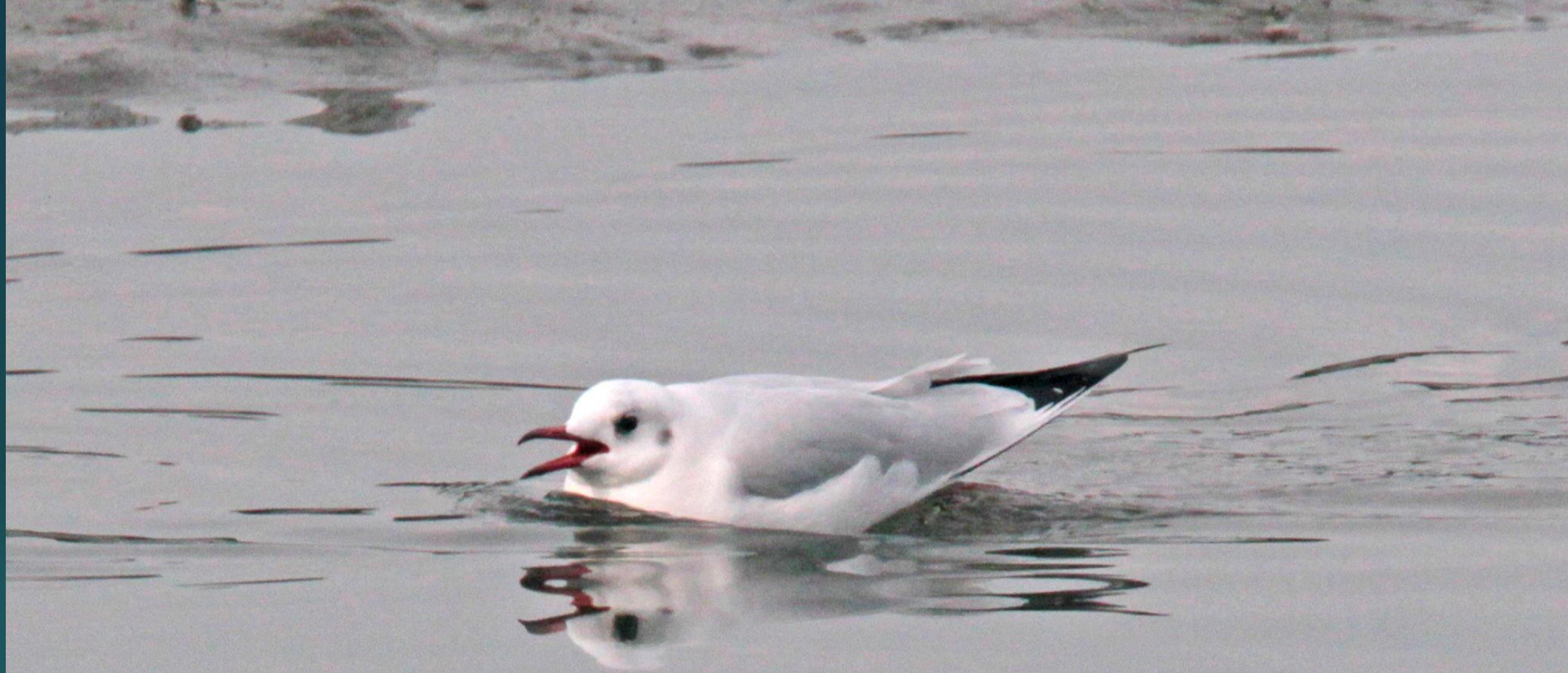
ユリカモメ(百合鷗) カモメ科 L=40cm