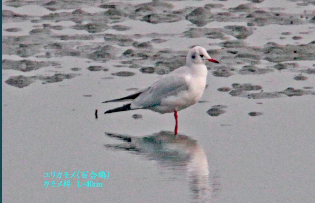
ユリカモメ(百合鷗) カモメ科 L=40cm