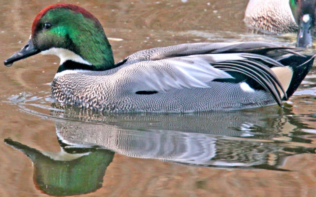
ヨシガモ(葦鴨)オス ガンカモ科 L=48cm