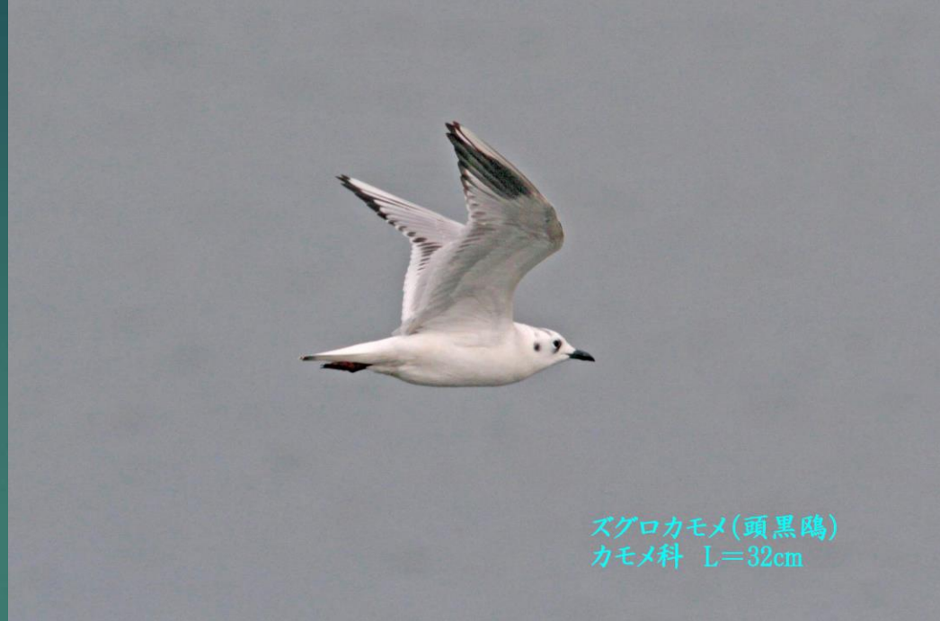
ズグロカモメ(頭黒鷗) カモメ科 L=32cm