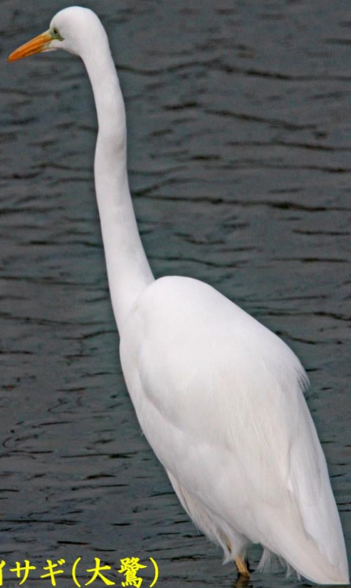
ダイサギ(大鷺) サギ科 L=90cm